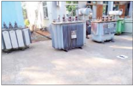
၂၀၂၂ ခုနှစ် ဇန်နဝါရီ ၆ ရက်တွင် သာကောမြို့နယ် ၁ ထူပါ ရုပ်ကွက် မြင်တော်သာလမ်းရှိ မြို့နယ်လှုပ်စစ်မန်နေဂျာရုံး၌ လက်လုပ်ပေးပေးပေးပေး မှတ်တမ်းဓာတ်ပုံ။