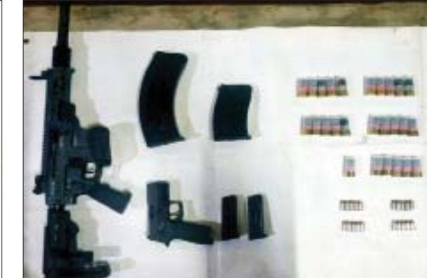
၂၀၂၂ ခုနှစ် ဇန်နဝါရီ ၁၉ ရက်တွင် ဒဂုံမြို့သစ်(တောင်ပိုင်း) မြို့နယ် ဒီဇင်ဘာသီရိဂေဟာ တိုက်(၁၄၂) အခန်း(၄၀၂)တွင် သိမ်းဆည်းရမိသည့် လက်နက်/ခဲယမ်းများ မှတ်တမ်းဓာတ်ပုံ။