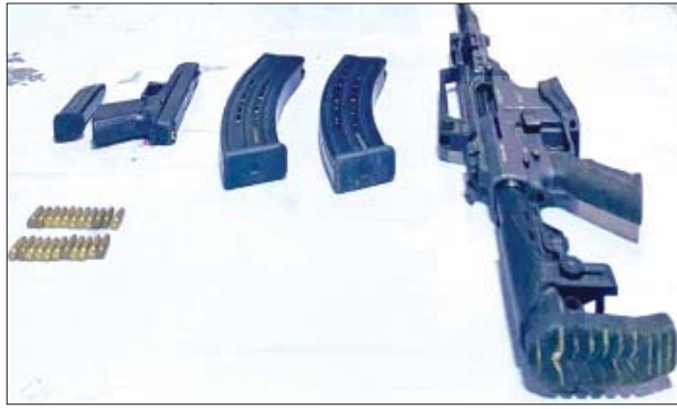
၂၀၂၂ ခုနှစ် ဇန်နဝါရီ ၈ ရက်တွင် သာကေတမြို့နယ် ဓမ္မသီရိ(၈) လမ်း (၆)ရပ်ကွက်၌ သိမ်းဆည်းရမိသည့် လက်နက်/ခဲယမ်းများ မှတ်တမ်းဓာတ်ပုံ။