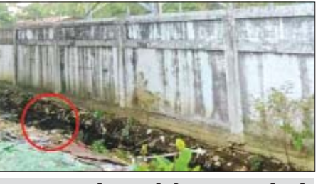
၂၀၂၂ ခုနှစ် အောက်တိုဘာ ၁၅ ရက်တွင် လှိုင်သာယာ(အရှေ့ပိုင်း)မြို့နယ် (၇)ရပ်ကွက် “စနေမ” အထည်ချုပ်စက်ရုံအနီး၌ လက်လုပ်ဖုံးပေါက်ကွဲမှု ဖြစ်ပွားသည့် မှတ်တမ်းဓာတ်ပုံ။