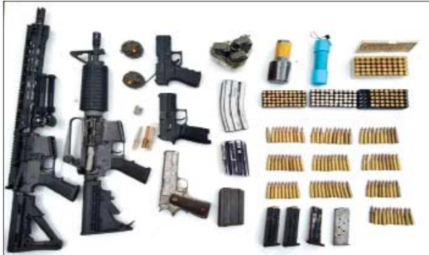
၂၀၂၂ ခုနှစ် ဇန်နဝါရီ ၁၂ ရက်တွင် မြောက်ဥက္ကလာပမြို့နယ် ဝေသာရီမြို့သစ် ကုန်းလမ်းပိုဆောင်ရေးယာဉ်ရပ်နားဝင်းအတွင်း၌ သိမ်းဆည်းရမိသည့် လက်နက်/ခဲယမ်းများ မှတ်တမ်းဓာတ်ပုံ။