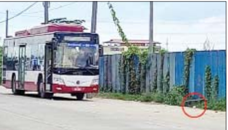
၂၀၂၂ ခုနှစ် စက်တင်ဘာ ၂၁ ရက်တွင် လှိုင်သာယာမြို့နယ် ရွှေလင်ပန်းစက်မှုဇုန်အနီး လက်လုပ်ဖုံးတွေ့ရှိခဲ့သည့် မှတ်တမ်းဓာတ်ပုံ။