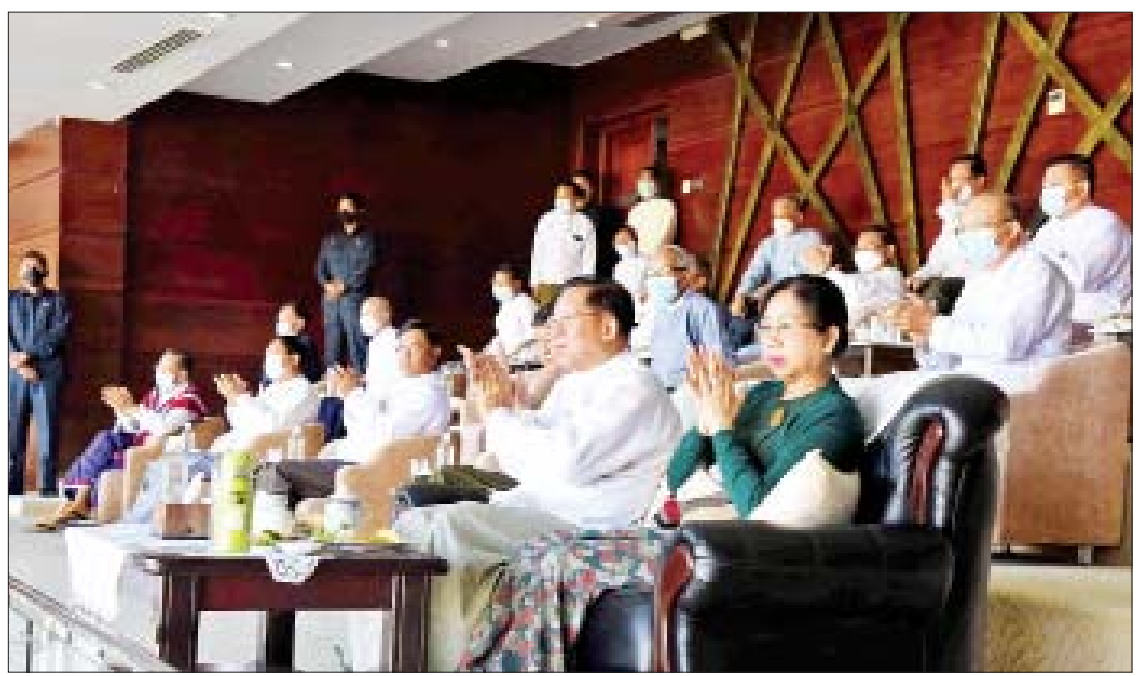
နိုင်ငံတော်စီမံအုပ်ချုပ်ရေးကောင်စီဥက္ကဋ္ဌ၊ ဗိုလ်ချုပ်မှူးကြီးမင်းအောင်လှိုင်နှင့် ဇနီး ဒေါ်ကြူကြူလှ၊ ကောင်စီအဖွဲ့ဝင်များနှင့် တက်ရောက်လာကြသူများ ရခိုင်ပြည်နယ်အသင်းနှင့် ရှမ်းပြည်နယ်အသင်းတို့၏ ဗိုလ်လုပွဲယှဉ်ပြိုင်နေမှုကို ကြည့်ရှုအားပေးကြစဉ်။

နိုင်ငံတော်ဝန်ကြီးချုပ် ဗိုလ်ချုပ်မှူးကြီးမင်းအောင်လှိုင်နှင့် ဇနီး ဒေါ်ကြူကြူလှတို့ တက်ရောက်ကြည့်ရှုအားပေးသည်။ ပြိုင်ပွဲအခမ်းအနားသို့ နိုင်ငံတော်စီမံအုပ်ချုပ်ရေးကောင်စီအဖွဲ့ဝင်များဖြစ်ကြသည့် ဗိုလ်ချုပ်ကြီး မြထွန်းဦး၊ ဗိုလ်ချုပ်ကြီး တင်အောင်စန်း၊ ဒုတိယဗိုလ်ချုပ်ကြီး မိုးမြင့်ထွန်း၊ မန်းငြိမ်းမောင်၊ ဒေါ်အေးနုစိန်၊ Jeng Phang နော်တောင်၊ ဦးမောင်ဟော၊ စောဒန်နီယယ်၊ ဦးရွှေကြိမ်းနှင့် ၎င်းတို့၏ ဇနီးများ၊ တွဲဖက်အတွင်းရေးမှူး စာမျက်နှာ ၃ ကော်လံ ၁ သို့ □