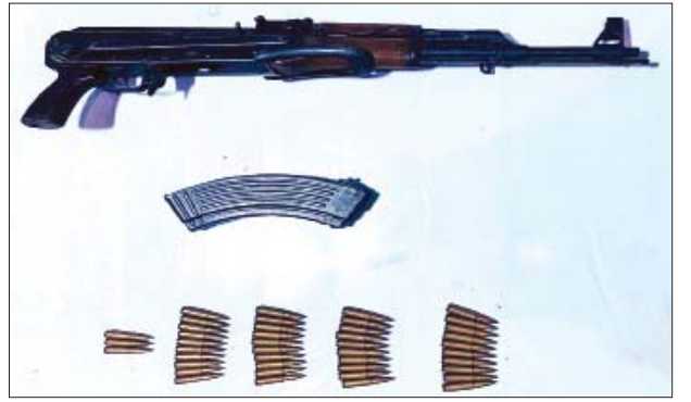
၂၀၂၂ ခုနှစ် ဇန်နဝါရီ ၁၁ ရက်တွင် ဒဂုံမြို့သစ်(တောင်ပိုင်း)မြို့နယ် (၂၂)ရပ်ကွက် အမှတ်(၉၁၈)၌ သိမ်းဆည်းရမိသည့် လက်နက်/ခဲယမ်းများ မှတ်တမ်းဓာတ်ပုံ။