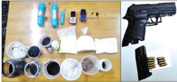
၂၀၂၂ ခုနှစ် ဇန်နဝါရီ ၁၂ ရက်တွင် ဒဂုံဆိပ်ကမ်းမြို့နယ် ယုဇန ဥယျာဉ်မြို့တော်၌ သိမ်းဆည်းရမိသည့် လက်နက်/ခဲယမ်းနှင့် ဖောက်ခွဲရေး ဆက်စပ်ပစ္စည်းများ မှတ်တမ်းဓာတ်ပုံ။