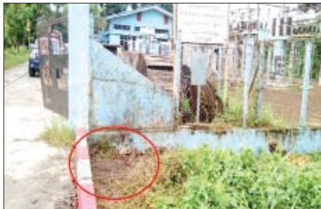
၂၀၂၂ ခုနှစ် ဇူလိုင် ၉ ရက်တွင် မင်္ဂလာဒုံမြို့နယ် ခရေပင် ရိပ်မွန် လှုပ်စစ်ဓာတ်အားခွဲရုံအနီး၌ လက်လုပ်ပေးပေးပေးပေး မှတ်တမ်းဓာတ်ပုံ။