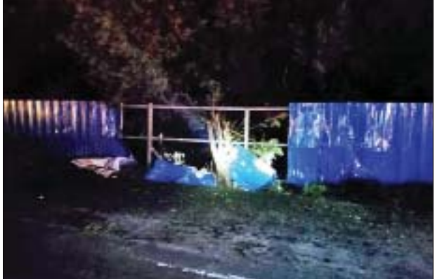
၂၀၂၂ ခုနှစ် အောက်တိုဘာ ၃ ရက်တွင် လှိုင်သာယာ(အနောက်ပိုင်း) မြို့နယ် “ဝါဝါဝင်း”အထည်ချုပ်စက်ရုံအနီး၌ ပေါက်ကွဲမှုဖြစ်ပွားသည့် မှတ်တမ်းဓာတ်ပုံ။