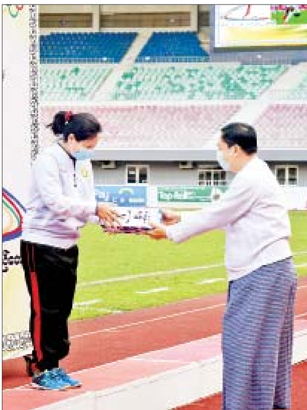
နိုင်ငံတော်စီမံအုပ်ချုပ်ရေးကောင်စီအဖွဲ့ဝင် ဒုတိယဗိုလ်ချုပ်ကြီး မိုးမြင့်ထွန်းက စတုတ္ထဆုရရှိသည့် ရန်ကုန်တိုင်းဒေသကြီးအသင်းအား ငွေသားဆု ပေးအပ်ချီးမြှင့်စဉ်။

ထို့နောက် ဆုချီးမြှင့်ပွဲ အခမ်းအနားကို ဆက်လက်ကျင်းပရာ ကောင်စီအဖွဲ့ဝင် ဦးရွှေကြိမ်းက အကောင်းဆုံးဂိုးသမားဆုရရှိသူ ရခိုင်ပြည်နယ်အသင်းမှ မတိုးရတနာစုကိုလည်းကောင်း၊ ကောင်စီအဖွဲ့ဝင် စောဒန်နီယယ်က အကောင်းဆုံး နောက်တန်းကစားသမားဆုရရှိသူ ရှမ်းပြည်နယ်အသင်းမှ စာမျက်နှာ ၄ သို့ »»