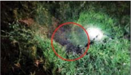
၂၀၂၂ ခုနှစ် ဩဂုတ် ၃၀ ရက်တွင် လှိုင်သာယာ (အရှေ့ပိုင်း)မြို့နယ် (၂)ရပ်ကွက် မြို့မရဲစခန်းအနီး၌ ပေါက်ကွဲမှုဖြစ်ပွားသည့် မှတ်တမ်းဓာတ်ပုံ။