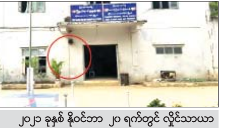
၂၀၂၂ ခုနှစ် နိုဝင်ဘာ ၂၀ ရက်တွင် လှိုင်သာယာ (အနောက်ပိုင်း)မြို့နယ် အနော်ရထာလမ်းရှိသောင်ကြီး နယ်မြေရဲစခန်းအား အကြမ်းဖက်သူများက M-79 ဖုံးပစ်လောင်ချာဖြင့် လာရောက်ပစ်ခတ်ခဲ့သည့် မှတ်တမ်းဓာတ်ပုံ။