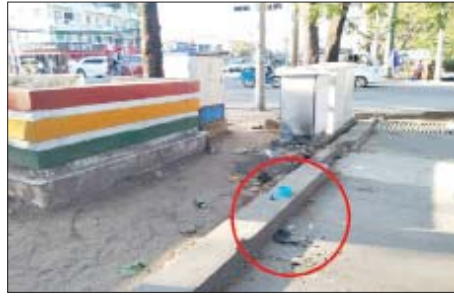
၂၀၂၂ ခုနှစ် ဒီဇင်ဘာ ၆ ရက်တွင် မြောက်ဥက္ကလာပမြို့နယ် (၄)ရပ်ကွက် ကန်သာယာမီးပိုင်အနီး ယာဉ်ထိန်းရုံး၌ လက်လုပ်ပေးပေးပေးပေး မှတ်တမ်းဓာတ်ပုံ။