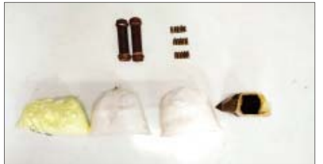
၂၀၂၂ ခုနှစ် ဇန်နဝါရီ ၁၆ ရက်တွင် သင်္ဃန်းကျွန်းမြို့နယ် အောင်ဇေယျ လမ်းမကြီး အမှတ်(၁၂)နေအိမ်၌ သိမ်းဆည်းရမိသည့် ဖောက်ခွဲရေးပစ္စည်းများ မှတ်တမ်းဓာတ်ပုံ။