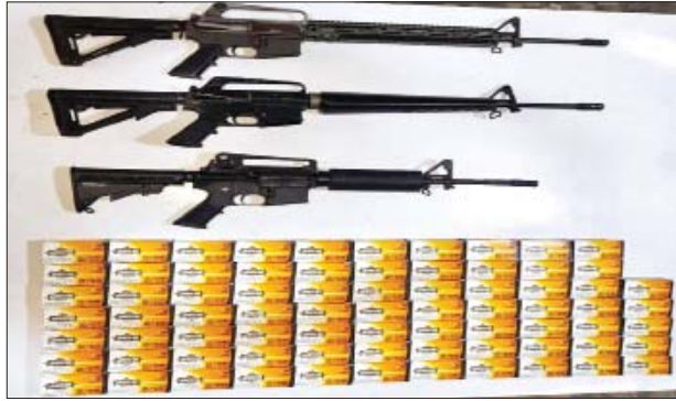
၂၀၂၂ ခုနှစ် ဇန်နဝါရီ ၁၆ ရက်တွင် တောင်ဥက္ကလာပမြို့နယ် (၆)ရပ်ကွက် အမှတ်(၁၁၉၉)နေအိမ်၌ သိမ်းဆည်းရမိသည့် လက်နက်/ခဲယမ်းများ မှတ်တမ်းဓာတ်ပုံ။