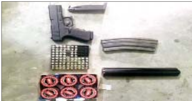
၂၀၂၂ ခုနှစ် ဇန်နဝါရီ ၁၆ ရက်တွင် သင်္ဃန်းကျွန်းမြို့နယ် လေးထောင့်ကန်လမ်း တိုက်(၃၃)၌ သိမ်းဆည်းရမိသည့် လက်နက်/ခဲယမ်းများ မှတ်တမ်းဓာတ်ပုံ။