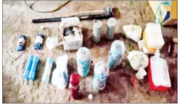
၂၀၂၂ ခုနှစ် ဇန်နဝါရီ ၁၆ ရက်တွင် ဒဂုံမြို့သစ်(မြောက်ပိုင်း)မြို့နယ် (၅၀)ရပ်ကွက် အမှတ်(၁၀၂)နေအိမ်၌ သိမ်းဆည်းရမိသည့် ဖောက်ခွဲရေး ပစ္စည်းများ မှတ်တမ်းဓာတ်ပုံ။