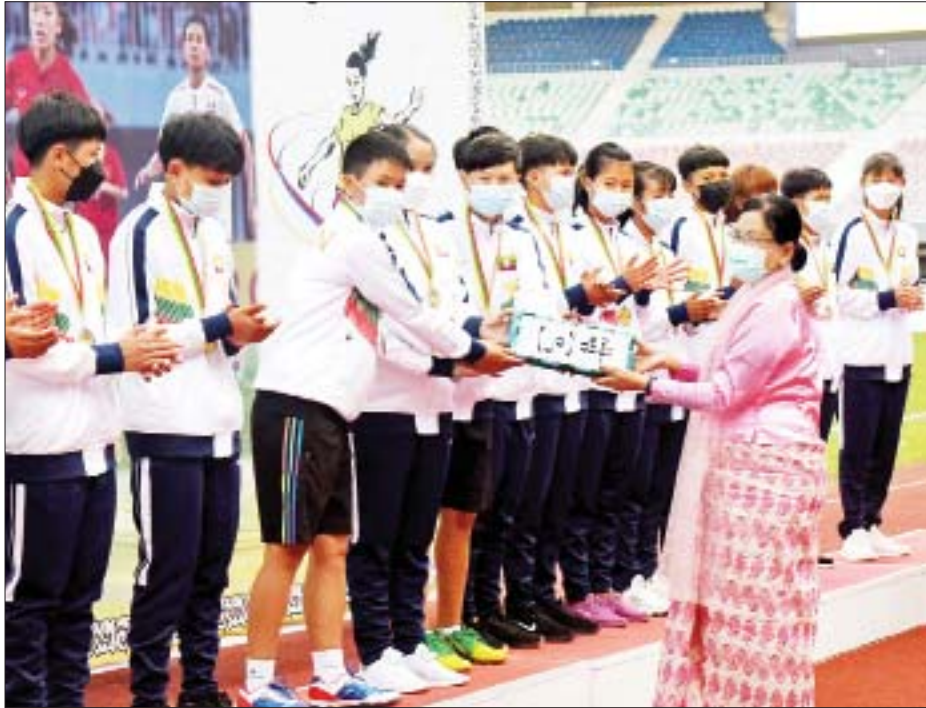
နိုင်ငံတော် စီမံအုပ်ချုပ်ရေး ကောင်စီအဖွဲ့ဝင် ဒေါ်အေးနုစိန်က ဒုတိယဆုရရှိသည့် ရှမ်းပြည်နယ် အသင်းအား တစ်ဦးချင်းဆုတံဆိပ် နှင့် ငွေသားဆု ပေးအပ်ချီးမြှင့်စဉ်။