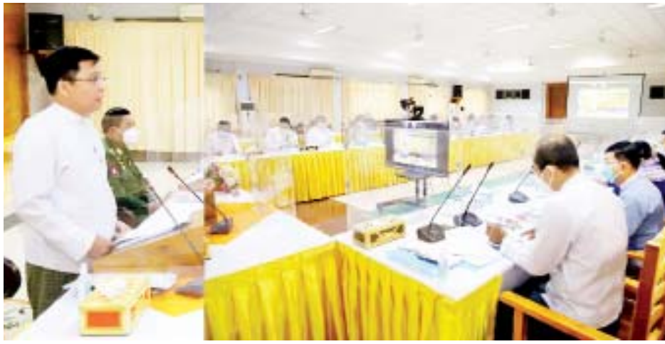
ပြည်ထောင်စုဝန်ကြီး ဦးမြင့်ကြိုင် ပြည်ပတွင်အလုပ်လုပ်ကိုင်မှု ကြီးကြပ်ရေးကော်မတီ၏ လုပ်ငန်းညှိနှိုင်းအစည်းအဝေး ၁/၂၀၂၂ တွင် အမှာစကားပြောကြားစဉ်။

အစည်းအဝေးတွင် ပြည်ထောင်စုဝန်ကြီးက ကော်မတီအစည်းအဝေးကို ကိုဗစ်-၁၉ ကမ္ဘာ့ကပ်ရောဂါကြောင့် ပုံမှန်ကျင်းပနိုင်ခြင်းမရှိသော်လည်း ပြည်ပတွင် အလုပ်လုပ်ကိုင်မှုကြီးကြပ်ရေးကော်မတီ၏အတည်ပြုချက်ဖြင့် ဆောင်ရွက်ရမည့်