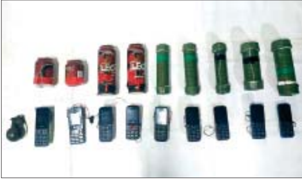
၂၀၂၂ ခုနှစ် ဇန်နဝါရီ ၁၇ ရက်တွင် မင်္ဂလာဒုံမြို့နယ် ချစ်တီးကုန်း ရပ်ကွက် အောင်မင်္ဂလာအဝေးပြေးယာဉ်ရပ်နားစခန်း ဆိုင်အမှတ် (၈၇/၆)၌ သိမ်းဆည်းရမိသည့် ဖောက်ခွဲရေးပစ္စည်းများ မှတ်တမ်းဓာတ်ပုံ။