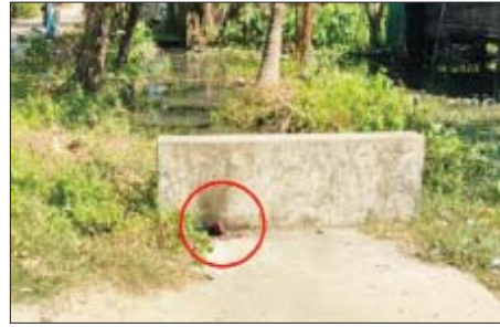
၂၀၂၂ ခုနှစ် ဒီဇင်ဘာ ၁၆ ရက်တွင် မြောက်ဥက္ကလာပမြို့နယ် ရွှေပေါက်မြို့သစ်ရပ်ကွက် အထက(၆)ကျောင်းအနီးတွင် လက်လုပ်ပေးပေးပေးပေး မှတ်တမ်းဓာတ်ပုံ။