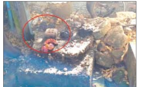
၂၀၂၂ ခုနှစ် ဇန်နဝါရီ ၆ ရက်တွင် သယ်န်းကျွန်းမြို့နယ် (၂၄)ရပ်ကွက်၌ လက်လုပ်ပေးပေးပေးပေး မှတ်တမ်းဓာတ်ပုံ။