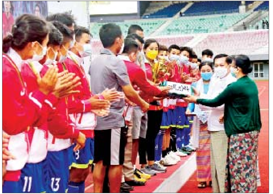
နိုင်ငံတော်စီမံအုပ်ချုပ်ရေးကောင်စီဥက္ကဋ္ဌ၊ နိုင်ငံတော်ဝန်ကြီးချုပ် ဗိုလ်ချုပ်မှူးကြီးမင်းအောင်လှိုင်နှင့် ဇနီး ဒေါ်ကြာကြာလှတို့က ပထမဆုရရှိသည့် ရခိုင်ပြည်နယ်အသင်းအား ငွေသားဆုနှင့် တံခွန်စိုက်ခိုင်းပေးအပ်ချီးမြှင့်စဉ်။