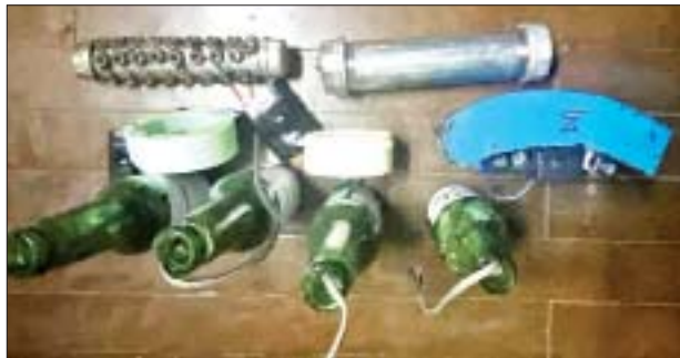
၂၀၂၂ ခုနှစ် ဇန်နဝါရီ ၁၆ ရက်တွင် သင်္ဃန်းကျွန်းမြို့နယ် ရန်ကုန်သစ် ရပ်ကွက် အောင်ဇေယျ(၇)လမ်း အမှတ်(၂၁)နေအိမ်၌ သိမ်းဆည်းရမိသည့် ဖောက်ခွဲရေးပစ္စည်းများ မှတ်တမ်းဓာတ်ပုံ။