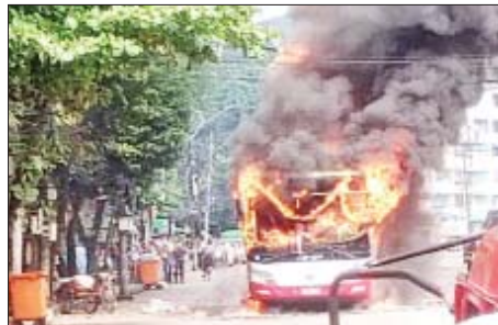
၂၀၂၂ ခုနှစ် အောက်တိုဘာ ၉ ရက်တွင် ဒဂုံမြို့သစ်တောင်ပိုင်း မြို့နယ် သရက်တောမုတ်တိုင်၌ YBS-56 ယာဉ် မီးလောင်မှုဖြစ်ပွားသည့် မှတ်တမ်းဓာတ်ပုံ။