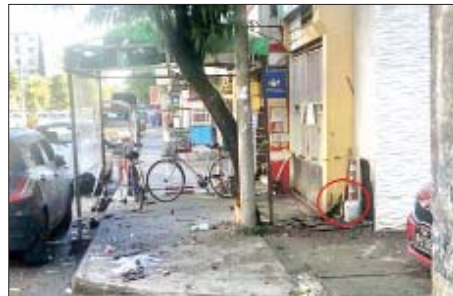
၂၀၂၂ ခုနှစ် ဒီဇင်ဘာ ၉ ရက်တွင် သယ်န်းကျွန်းမြို့နယ် ဝေဘူလရပ်ကွက် ရစဖရုံးအနီး၌ ပေါက်ကွဲမှုဖြစ်ပွားသည့် မှတ်တမ်းဓာတ်ပုံ။