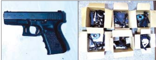
၂၀၂၂ ခုနှစ် ဇန်နဝါရီ ၁၁ ရက်တွင် သာကေတမြို့နယ် (၇/အရှေ့) ရပ်ကွက် အမှတ်(၄၅၇/က)၌ သိမ်းဆည်းရမိသည့် လက်နက်နှင့် 3D Printer စက်များ မှတ်တမ်းဓာတ်ပုံ။