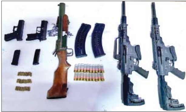
၂၀၂၂ ခုနှစ် ဇန်နဝါရီ ၆ ရက်တွင် ကြည့်မြင်တိုင်မြို့နယ် ပန်းလှိုင် အိမ်ရာ တိုက်အမှတ်(၃) အခန်း(၄၄)၌ သိမ်းဆည်းရမိသည့် လက်နက်/ခဲယမ်းများ မှတ်တမ်းဓာတ်ပုံ။