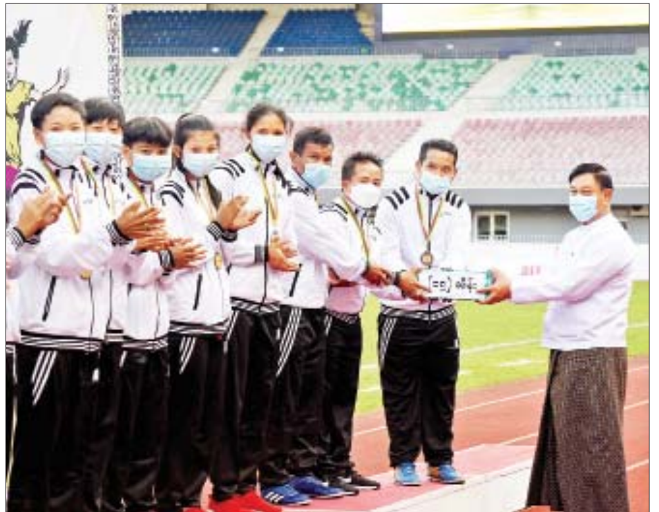
နိုင်ငံတော်စီမံအုပ်ချုပ်ရေးကောင်စီအဖွဲ့ဝင် ဗိုလ်ချုပ်ကြီးမြထွန်းဦးက ပထမဆုရရှိသည့် ရခိုင်ပြည်နယ်အသင်းအား တစ်ဦးချင်းဆုတံဆိပ်များ ပေးအပ်ချီးမြှင့်စဉ်။