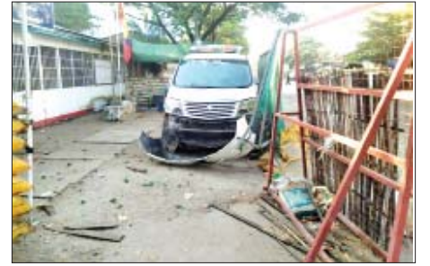
၂၀၂၂ ခုနှစ် ဇန်နဝါရီ ၅ ရက်တွင် မြောက်ဥက္ကလာပမြို့နယ် (၂)ရပ်ကွက် ရစဖရုံးအနီး၌ ပေါက်ကွဲမှုဖြစ်ပွားသည့် မှတ်တမ်းဓာတ်ပုံ။