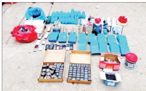
၂၀၂၂ ခုနှစ် ဇန်နဝါရီ ၁၂ ရက်တွင် မြောက်ဒဂုံမြို့နယ် (၃၃)ရပ်ကွက် ငါးမာန်အောင်ဘုရားလမ်းမဘေး ကနဦးဘုန်းကြီးကျောင်းအနီး၌ လက်နက်/ခဲယမ်းများနှင့် မိုင်းနှင့်ဆက်စပ်ပစ္စည်းများ ဖမ်းဆီးရမိသည့် မှတ်တမ်းဓာတ်ပုံ။