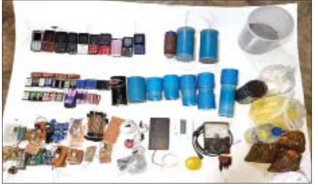
၂၀၂၂ ခုနှစ် ဇန်နဝါရီ ၁၇ ရက်တွင် ဒဂုံမြို့သစ်(မြောက်ပိုင်း)မြို့နယ် (၅၀)ရပ်ကွက် ငှက်လမ်း အမှတ်(၆၃၃)၌ သိမ်းဆည်းရမိသည့် ဖောက်ခွဲရေးဆက်စပ်ပစ္စည်းများ မှတ်တမ်းဓာတ်ပုံ။