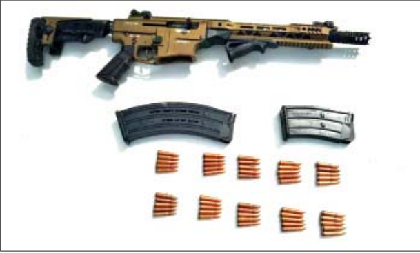
၂၀၂၂ ခုနှစ် ဇန်နဝါရီ ၁၂ ရက်တွင် မြောက်ဥက္ကလာပမြို့နယ် ဝေတာဂီမြို့သစ် ကုန်းလမ်းပို့ဆောင်ရေးယာဉ်ရပ်နားဝင်းအနီး၌ သိမ်းဆည်းရမိသည့် လက်နက်/ခဲယမ်းများ မှတ်တမ်းဓာတ်ပုံ။