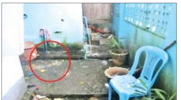
၂၀၂၂ ခုနှစ် နိုဝင်ဘာ ၂ ရက်တွင် တောင်ဥက္ကလာပမြို့နယ် အမှတ်(၄)ရပ်ကွက် သုမင်္ဂလာလမ်းနှင့် ပါရမီလမ်းထောင့်ရှိ မြို့နယ်လှုပ်စစ်မန်နေဂျာရုံးဘေး ရေနုတ်မြောင်း ၌ ပေါက်ကွဲမှုဖြစ်ပွားသည့် မှတ်တမ်းဓာတ်ပုံ။