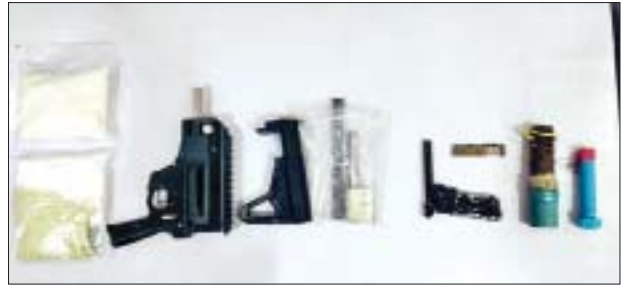
၂၀၂၂ ခုနှစ် ဇန်နဝါရီ ၁၆ ရက်တွင် ဒဂုံမြို့သစ်(တောင်ပိုင်း)မြို့နယ် (၂၅)ရပ်ကွက် အမှတ်(၄၄/က)၌ သိမ်းဆည်းရမိသည့် လက်နက်/ခဲယမ်းများ မှတ်တမ်းဓာတ်ပုံ။