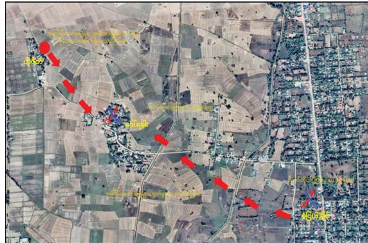
ကယားပြည်နယ် လွိုင်ကော်မြို့အနီး KNPP အဖွဲ့နှင့် PDF အမည်ခံ အကြမ်းဖက် အဖွဲ့များနှင့် ထိတွေ့တိုက်ပွဲဖြစ်ပွားခဲ့သည့်ဖြစ်စဉ်နေရာပြပုံ။

အနောက်မြောက်ဘက်ရှိ ဟိုဖိတ်ကျေးရွာ အတွင်း ခိုအောင်းရောက်ရှိလျက်ရှိသည့် အကြမ်းဖက်အဖွဲ့များက မော်တော် ယာဉ်များအသုံးပြု၍ ထပ်မံအင်အား ဖြည့်တင်းကာ တိုက်ခိုက်နိုင်ရေး လုပ်ဆောင်လာခဲ့သည်။ အကြမ်းဖက် အဖွဲ့များ၏ ဒေသခံပြည်သူလူထုအပေါ် ထိခိုက်ပျက်ပြားစေရန် ရည်ရွယ်၍ ထိုကဲ့သို့ အင်အားဖြည့်တင်းမှုကို လုပ်ဆောင်နိုင်မှုမရှိစေရေး လုံခြုံရေး တပ်ဖွဲ့ဝင်များက လက်နက်ကြီးနှင့် လေကြောင်းပစ်ကူများ အသုံးပြု၍ ပိုင်းဖြတ်ပစ်ခတ်တိုက်ခိုက်ခဲ့သည်။ ဆက်လက်ကျူးလွန်လျက်ရှိ KNPP အဖွဲ့နှင့် PDF အမည်ခံ အကြမ်းဖက်အဖွဲ့များ၏ အဆိုပါလုပ်ရပ် များသည် စစ်ရေးနှင့်သက်ဆိုင်သော ပစ်မှတ်များမဟုတ်ဘဲ ဘာသာရေးနှင့် သက်ဆိုင်သည့် အဆောက်အအုံ၊ ပညာ ရေးဆိုင်ရာ အဆောက်အအုံများနှင့်