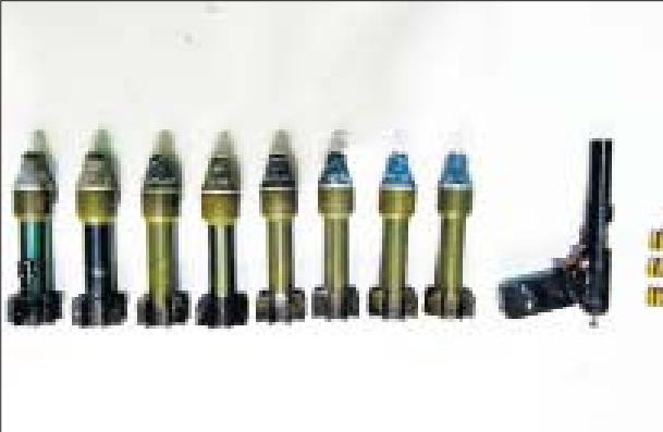
၂၀၂၂ ခုနှစ် ဇန်နဝါရီ ၁၇ ရက်တွင် ဒဂုံမြို့သစ်(မြောက်ပိုင်း)မြို့နယ် (၅၀)ရပ်ကွက် နံ့သာမြိုင်လမ်း သာသနာ့ရောင်ခြည်ဓမ္မာရုံ၌ သိမ်းဆည်းရမိသည့် လက်နက်/ခဲယမ်းများ မှတ်တမ်းဓာတ်ပုံ။