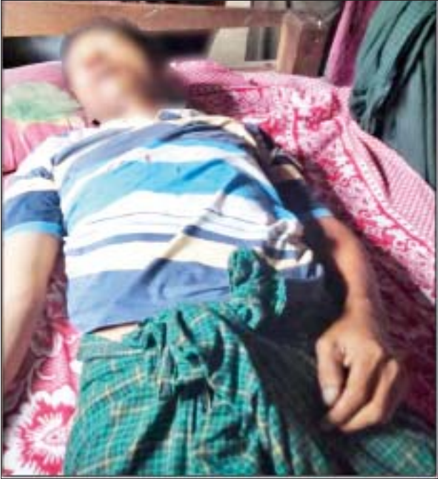
အောက်တိုဘာ ၂၅ ရက်တွင် ပုသိမ်ကြီးမြို့နယ် နတ်စု အနောက်ကျေးရွာ လက်ဖက်ရည်ဆိုင်၌ မြောက်တိုင်းရှည်ကျေးရွာ အုပ်စုနေ အပြစ်မဲ့ပြည်သူတစ်ဦး သေဆုံးခဲ့သည့် မှတ်တမ်းဓာတ်ပုံ။

အဆိုပါ ဖမ်းဆီးရမိတရားခံများအား ဥပဒေအရ ထိရောက်စွာ အရေးယူနိုင်ရေး ဆက်လက်ဆောင်ရွက်သွားမည်ဖြစ်ပြီး အကြမ်းဖက်မှုဆောင်ရွက်နေသူများကို ပြည်သူတစ်ရပ်လုံးက ဝိုင်းဝန်းကာကွယ်တိုက်ဖျက်ကြရန်နှင့် ဆက်စပ်တရားခံများအား အမြန်ဆုံးဖမ်းဆီး