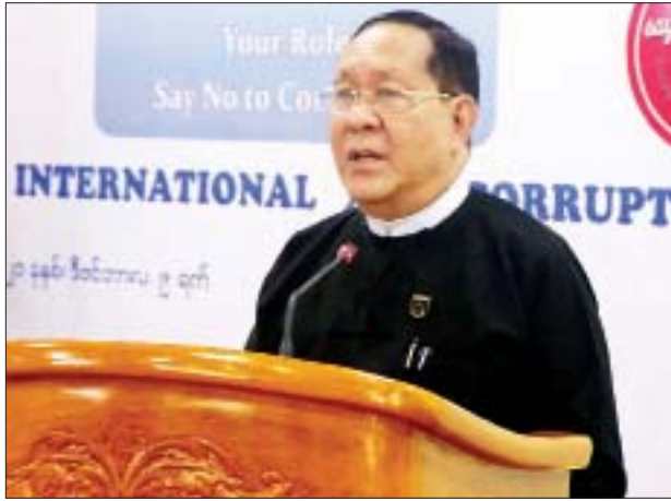
ပြည်ထောင်စုတရားသူကြီးချုပ် ဦးထွန်းထွန်းဦး Video Conferencing ဖြင့် ပြောကြားစဉ်။

ကော်မရှင်ဥက္ကဋ္ဌ၊ မြန်မာနိုင်ငံ တော်ဗဟိုဘဏ်ဥက္ကဋ္ဌ၊ ဒုတိယ ဝန်ကြီးများ၊ ဌာနဆိုင်ရာ အကြီးအကဲများနှင့် တာဝန်ရှိသူ များက Video Conferencing ဖြင့် တက်ရောက်ကြသည်။ အခမ်းအနားတွင် နိုင်ငံတော် စီမံ အုပ်ချုပ်ရေးကောင်စီ ဥက္ကဋ္ဌ၊ နိုင်ငံတော်ဝန်ကြီးချုပ် ဗိုလ်ချုပ်မှူးကြီး မင်းအောင်လှိုင် မိန့်ခွန်း Video Message ကို ဖွင့်လှစ်ပြသသည်။ (နိုင်ငံတော် စီမံအုပ်ချုပ်ရေးကောင်စီဥက္ကဋ္ဌ၊ နိုင်ငံတော် ဝန်ကြီးချုပ် ဗိုလ်ချုပ်မှူးကြီး မင်းအောင်လှိုင် ၏ မိန့်ခွန်းအပြည့်အစုံကို စာမျက်နှာ ၉ တွင် ဖော်ပြထား ပါသည်။) ထို့နောက် ပြည်ထောင်စု တရားသူကြီးချုပ် ဦးထွန်းထွန်းဦး က တရားစီရင်ရေးမဏ္ဍိုင် ဖြောင့်မတ် မှန်ကန်ရေးအတွက် အဂတိကင်းစင်သည့်၊ ဘက်လိုက် မှုကင်းသည့်၊ ဖြောင့်မတ် တည်ကြည်သည့်၊ သမာသမတ် ကျသည့် တရားစီရင်ရေးကို ဖော်ဆောင်ခြင်း၊ တရားရုံး