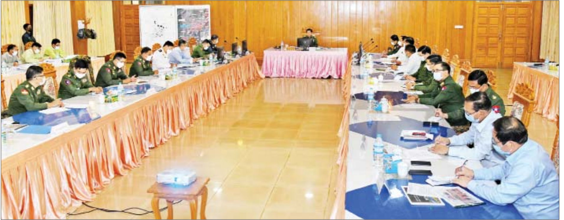
နိုင်ငံတော်စီမံအုပ်ချုပ်ရေးကောင်စီဥက္ကဋ္ဌ၊ နိုင်ငံတော်ဝန်ကြီးချုပ် ဗိုလ်ချုပ်မှူးကြီးမင်းအောင်လှိုင် မန္တလေးတိုင်းဒေသကြီး အစိုးရ အဖွဲ့ဝင်များနှင့် ပြင်ဦးလွင်ခရိုင်နှင့် မြို့နယ်အတွင်းရှိ ဌာနဆိုင်ရာဝန်ထမ်းများအား တွေ့ဆုံ၍ ပြင်ဦးလွင်မြို့ ဖွံ့ဖြိုးတိုးတက်ရေးဆိုင်ရာကိစ္စရပ်များကို ဆွေးနွေးမှာကြားစဉ်။

နေပြည်တော် ဒီဇင်ဘာ ၉ နိုင်ငံတော်စီမံအုပ်ချုပ်ရေးကောင်စီဥက္ကဋ္ဌ၊ နိုင်ငံတော်ဝန်ကြီးချုပ် ဗိုလ်ချုပ်မှူးကြီးမင်းအောင်လှိုင်သည် ယနေ့နံနက်ပိုင်းတွင် မန္တလေးတိုင်းဒေသကြီး အစိုးရ အဖွဲ့ဝင်များနှင့် ပြင်ဦးလွင်ခရိုင်နှင့် မြို့နယ်အတွင်းရှိ ဌာနဆိုင်ရာဝန်ထမ်းများအား ပြင်ဦးလွင်မြို့ တပ်မတော် ဧည့်ဂေဟာရှိ အစည်းအဝေးခန်းမ၌ တွေ့ဆုံ၍ ပြင်ဦးလွင်မြို့ ဖွံ့ဖြိုးတိုးတက်ရေးဆိုင်ရာကိစ္စရပ်များကို ဆွေးနွေးမှာကြားသည်။ တက်ရောက် အဆိုပါတွေ့ဆုံပွဲသို့ နိုင်ငံတော်စီမံအုပ်ချုပ်ရေးကောင်စီဥက္ကဋ္ဌ၊ နိုင်ငံတော်ဝန်ကြီးချုပ်နှင့်အတူ ကောင်စီဝင်များဖြစ်ကြသည့် ဗိုလ်ချုပ်ကြီးမောင်မောင်ကျော်၊ ဒုတိယဗိုလ်ချုပ်ကြီးမိုးမြင့်ထွန်း၊ ကောင်စီတွဲဖက်အတွင်းရေးမှူး ဒုတိယဗိုလ်ချုပ်ကြီးရဲဝင်းဦး၊ ပြည်ထောင်စုဝန်ကြီးများဖြစ်ကြသည့် ဦးလှမိုး၊ ဦးခင်မောင်ရီ၊ ဒေါက်တာမျိုးသိန်းကျော်၊ မန္တလေးတိုင်းဒေသကြီးဝန်ကြီးချုပ် ဦးမောင်ကို၊ ကာကွယ်ရေးဦးစီးချုပ် (ရေ) ဗိုလ်ချုပ်ကြီးမိုးအောင်၊ ကာကွယ်ရေးဦးစီးချုပ်ရုံးမှ တပ်မတော်အရာရှိကြီးများ၊ အလယ်ပိုင်းတိုင်းစစ်ဌာနချုပ် တိုင်းမှူး၊ ဗိုလ်ချုပ်ကိုကိုဦး၊ တိုင်းဒေသကြီး စည်ပင်သာယာရေးဝန်ကြီး၊ မြို့တော်ဝန် ဦးကျော်ဆန်း၊ ပြင်ဦးလွင်ခရိုင်မှ ဌာနဆိုင်ရာဝန်ထမ်းများ တက်ရောက်ကြသည်။