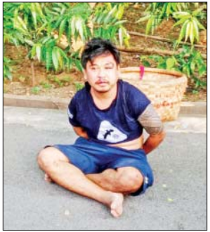
ဇူလိုင် ၂၉ ရက်က မဟာအောင်မြေမြို့နယ် မြတောင်ဘုန်းကြီးကျောင်းတိုက်အတွင်း ဖမ်းဆီးရမိသည့် အကြမ်းဖက်သမားတစ်ဦးနှင့် အကြမ်းဖက်ရာတွင် အသုံးပြုသည့် ပစ္စည်းများ မှတ်တမ်းဓာတ်ပုံ။