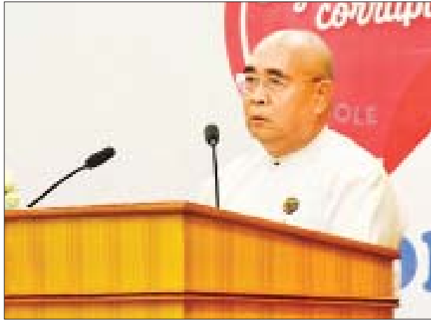
အဂတိလိုက်စားမှုတိုက်ဖျက်ရေးကော်မရှင်ဥက္ကဋ္ဌ ဦးတင်ဦး ရှင်းလင်းပြောကြားစဉ်။

စောင့်ထိန်းပြီး အဂတိတရား ကင်းစင်စွာဖြင့် တရားစီရင်ရေး တာဝန်များကို ထမ်းဆောင် ကြရမည်ဖြစ်ကြောင်း၊ တရား စီရင်ရေးကဏ္ဍနှင့် ဆက်စပ် သူများဖြစ်သည့် တရားစွဲ အဖွဲ့ အစည်းများ၊ ဥပဒေအရာရှိများ၊ ရှေ့နေရှေ့ရပ်များ၊ အမှုသည်များ အပါအဝင် သတင်းမီဒီယာများနှင့် ပြည်သူများကလည်း မိမိတို့၏ ကျင့်ဝတ် သိက္ခာများကို