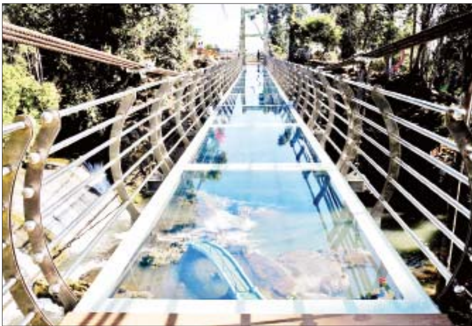
နိုင်ငံတော်စီမံအုပ်ချုပ်ရေးကောင်စီ နိုင်ငံတော်ဝန်ကြီးချုပ် ဗိုလ်ချုပ်မှူးကြီးမင်းအောင်လှိုင်နှင့် အဖွဲ့ဝင်များ ရှေးခေတ်က ပြင်ဦးလွင်ဒေသတွင်အသုံးပြုခဲ့သည့် မော်တော်ယာဉ်များကို ကြည့်ရှုစဉ်။

များကြောင့် သဘာဝပတ်ဝန်းကျင်နှင့် ဂေဟစနစ်ပျက်စီးယိုယွင်းမှုများ ဖြစ်ပေါ်လာခဲ့ကြောင်း၊ ထို့ကြောင့် နိုင်ငံတော်စီမံအုပ်ချုပ်ရေးကောင်စီ ဥက္ကဋ္ဌ၊ နိုင်ငံတော်ဝန်ကြီးချုပ် လာရောက်စစ်ဆေးစဉ် လမ်းညွှန်ချက်များအရ ယခုကဲ့သို့ အဆင့်မြှင့်တင်ပြုပြင်ထိန်းသိမ်း ဆောင်ရွက်ခဲ့ခြင်းဖြစ်ကြောင်း၊ ရေတံခွန်အတွင်း ရေသန့်စင်စေရေး သဘာဝရေသန့်စင်စနစ်ကို အသုံးပြုထားသဖြင့် ရေကစားလိုသူများ အနေဖြင့်လည်း သန့်ရှင်းပြီး ကျန်းမာရေးနှင့် ညီညွတ်စွာ ရေကစားမှု ပြုနိုင်မည်ဖြစ်ကြောင်း၊ အပန်းဖြေစခန်းအတွင်း ရေတံခွန်သုံးခုရှိပြီး မြန်မာနိုင်ငံတွင် ပထမဆုံး LED မှန်တံတားကိုလည်း ကမ္ဘာ့အဆင့်မီစွာဖြင့် ထည့်သွင်းဆောက်လုပ်ထားကာ မှန်တံတားအောက်ခြေရှင်းများကို ရင်ခုန်စိတ်လှုပ်ရှားစွာ ခံစားနိုင်မည်ဖြစ်ကြောင်း၊ ပန်းမြို့တော်၊ ခရီးသွားမြို့တော်ဖြစ်သည့်အညီ ပန်းမျိုး