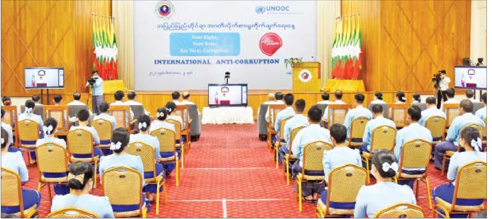
၂၀၂၁ ခုနှစ် အပြည်ပြည်ဆိုင်ရာအဂတိလိုက်စားမှုတိုက်ဖျက်ရေးနေ့ အထိမ်းအမှတ် အခမ်းအနားတွင် နိုင်ငံတော်စီမံအုပ်ချုပ်ရေးကောင်စီဥက္ကဋ္ဌ၊ နိုင်ငံတော်ဝန်ကြီးချုပ် ဗိုလ်ချုပ်မှူးကြီး မင်းအောင်လှိုင် Video Message ပေးပို့၍ မိန့်ခွန်းပြောကြားစဉ်။

နေပြည်တော် ဒီဇင်ဘာ ၉ ၂၀၂၁ ခုနှစ် အပြည်ပြည်ဆိုင်ရာ အဂတိလိုက်စားမှု တိုက်ဖျက် ရေးနေ့ အထိမ်းအမှတ် အခမ်း အနားကို ယနေ့နံနက် ၁၀ နာရီ တွင် နေပြည်တော်ရှိ အဂတိ လိုက်စားမှု တိုက်ဖျက်ရေး ကော်မရှင်ရုံး၌ ကျင်းပရာ နိုင်ငံတော်စီမံအုပ်ချုပ်ရေးကောင်စီ ဥက္ကဋ္ဌ၊ နိုင်ငံတော်ဝန်ကြီးချုပ် ဗိုလ်ချုပ်မှူးကြီး မင်းအောင်လှိုင်က Video Message ပေးပို့၍ မိန့်ခွန်း ပြောကြားသည်။