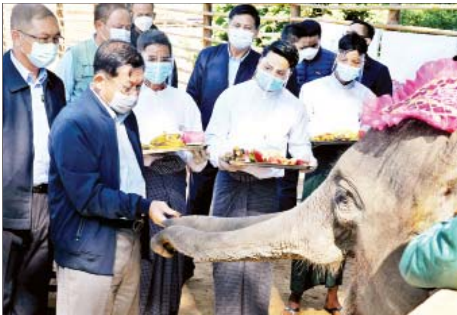
နိုင်ငံတော်စီမံအုပ်ချုပ်ရေးကောင်စီဥက္ကဋ္ဌ၊ နိုင်ငံတော်ဝန်ကြီးချုပ် ဗိုလ်ချုပ်မှူးကြီးမင်းအောင်လှိုင် ဆင်ကလေးများကို အစာကျွေးစဉ်။