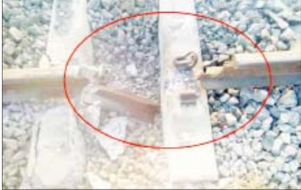
အကြမ်းဖက်လက်နက်ကိုင်အဖွဲ့များက ဖော်ထုတ်ဖမ်းဆီးရေးယူ နိုင်ရေး လုံခြုံရေးတပ်ဖွဲ့ဝင်များက ဆက်လက်ဆောင်ရွက်လျက် ရှိကြောင်း သိရသည်။

နေပြည်တော် ဒီဇင်ဘာ ၉ မန္တလေးတိုင်းဒေသကြီး ဝမ်းတွင်းမြို့နယ်၌ အကြမ်းဖက်လက်နက်ကိုင် အဖွဲ့များက လမ်းပန်းဆက်သွယ်မှုပြတ်တောက်စေရန် ရည်ရွယ်၍ ရထားသံလမ်းအား မိုင်းထောင်ဖောက်ခွဲဖျက်ဆီးခဲ့ကြောင်း သိရသည်။ ဖြစ်စဉ်မှာ ယနေ့နံနက်ပိုင်းတွင် မန္တလေးတိုင်းဒေသကြီး ဝမ်းတွင်းမြို့နယ် ထန်းပင်ကုန်းကျေးရွာအနီးရှိ ရန်ကုန်-မန္တလေး မီးရထားလမ်း တံတားအမှတ်(၆၉၁)အနီး သပြေတောင်းဘူတာနှင့် စမ့်ဘူတာကြား၌ ရထားလမ်းအား အကြမ်းဖက်လက်နက်ကိုင်အဖွဲ့ (စိစစ်ဆဲ)က မိုင်းထောင်၍ ဖောက်ခွဲဖျက်ဆီးခဲ့ကြောင်း သတင်းအရ လုံခြုံရေးတပ်ဖွဲ့ဝင်များက သွားရောက်စစ်ဆေးခဲ့ရာ မိုင်းပေါက်ကွဲမှု ကြောင့် အဆိုပါရထားသံလမ်း နှစ်ပေခန့် ပျက်စီးခဲ့ကာ ရထားသွားလာမှု ပြတ်တောက်လျက်ရှိပြီး သက်ဆိုင်ရာတာဝန်ရှိသူများက အမြန် ပြန်လည်ပြုပြင်နိုင်ရေး ဆောင်ရွက်လျက်ရှိကြောင်း သိရသည်။ အထက်ပါဖြစ်စဉ်မှ လမ်းပန်းဆက်သွယ်မှုပြတ်တောက်စေရန် ရည်ရွယ်၍ ရထားသံလမ်းအား မိုင်းထောင်ဖောက်ခွဲဖျက်ဆီးခဲ့သည့်