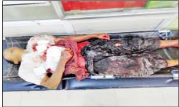
ဇွန် ၂၆ ရက်တွင် ပြည်ကြီးတံခွန်မြို့နယ် (စ)ရပ်ကွက် ၁၂၆ ဘုရင့်နောင်လမ်းတွင် အပြစ်မဲ့ပြည်သူတစ်ဦး ဓားဖြင့် ထိုးခံရသည့် မှတ်တမ်းဓာတ်ပုံ။

ဖမ်းဆီးရမိတရားခံများ၏ ထွက်ဆိုချက်အရ အပြစ်မဲ့ပြည်သူများကို လုပ်ကြံသတ်ဖြတ်မှု ငါးကြိမ်ကျူးလွန်ခဲ့ကြောင်း ဖော်ထုတ်သိရှိရပြီး ကျူးလွန်ခဲ့သော ပြစ်မှုများအနေဖြင့်-