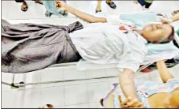
နိုဝင်ဘာ ၅ ရက်တွင် ချမ်းမြသာစည်မြို့နယ် အောင်သာယာ ရပ်ကွက်နေ အပြစ်မဲ့ပြည်သူတစ်ဦးအား သေနတ်ဖြင့်ပစ်ခတ်ခဲ့သည့် မှတ်တမ်းဓာတ်ပုံ။