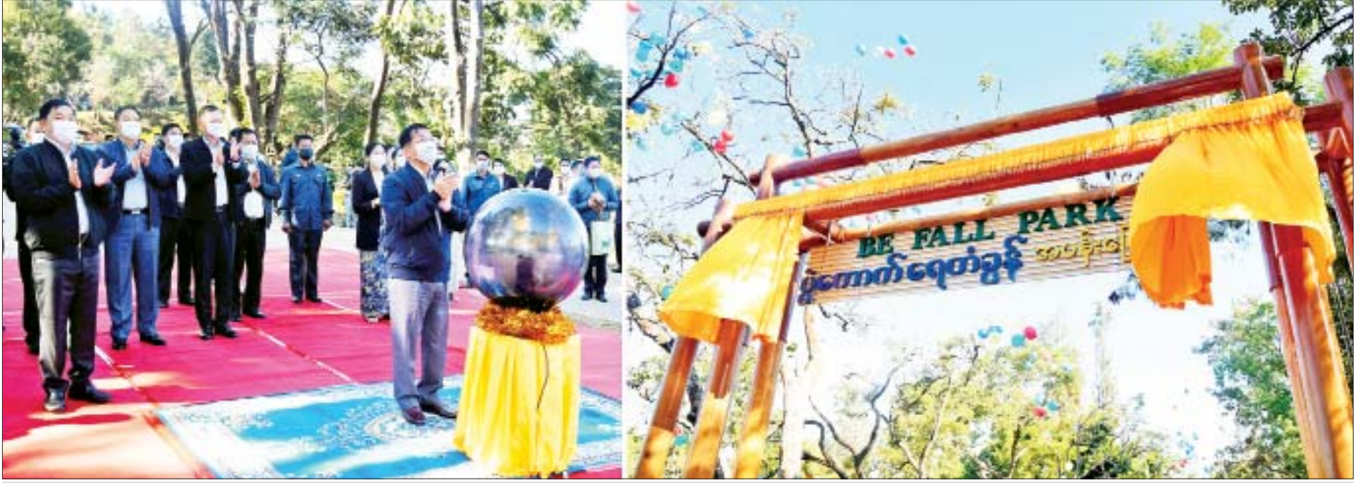
နိုင်ငံတော်စီမံအုပ်ချုပ်ရေးကောင်စီဥက္ကဋ္ဌ၊ နိုင်ငံတော်ဝန်ကြီးချုပ် ဗိုလ်ချုပ်မှူးကြီးမင်းအောင်လှိုင် ပွဲကောက်ရေတံခွန်အပန်းဖြေစခန်း မှခံဦးဆိုင်းဘုတ်ကို စက်ခလုတ်နှိပ်ဖွင့်လှစ်ပေးစဉ်။

နေပြည်တော် ဒီဇင်ဘာ ၉ နိုင်ငံတော်စီမံအုပ်ချုပ်ရေးကောင်စီဥက္ကဋ္ဌ၊ နိုင်ငံတော်ဝန်ကြီးချုပ် ဗိုလ်ချုပ်မှူးကြီးမင်းအောင်လှိုင်သည် ယနေ့နံနက်ပိုင်းတွင် ကျင်းပပြုလုပ်သည့် ပြင်ဦးလွင်မြို့၊ ပွဲကောက်ရေတံခွန်အပန်းဖြေစခန်း(B.E FALLS) အဆင့်မြှင့်တင်ဖွင့်လှစ်ခြင်းအခမ်းအနားသို့ တက်ရောက်ချီးမြှင့်သည်။ စာမျက်နှာ ၄ ကော်လံ ၁ သို့ ၀