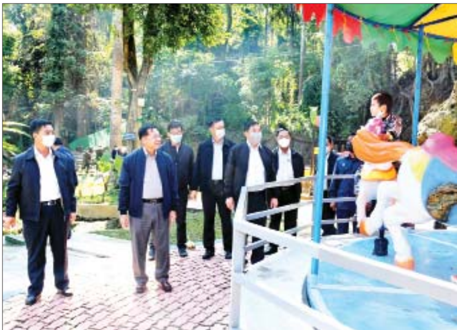
နိုင်ငံတော်စီမံအုပ်ချုပ်ရေးကောင်စီဥက္ကဋ္ဌ၊ နိုင်ငံတော်ဝန်ကြီးချုပ် ဗိုလ်ချုပ်မှူးကြီးမင်းအောင်လှိုင်နှင့် အဖွဲ့ဝင်များ အမိုးပါ ကလေးအားကစားကွင်းတွင် ကြည့်ရှုအားပေးစဉ်။