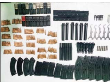
ပဲခူးမြို့ ဥဿာမြို့သစ် ရပ်ကွက်ကြီး(၈) ဓမ္မဒူတသီလရှင်ကျောင်းတွင် သိမ်းဆည်းရမိသည့် လက်နက်၊ ခဲယမ်းများ မှတ်တမ်းဓာတ်ပုံ။