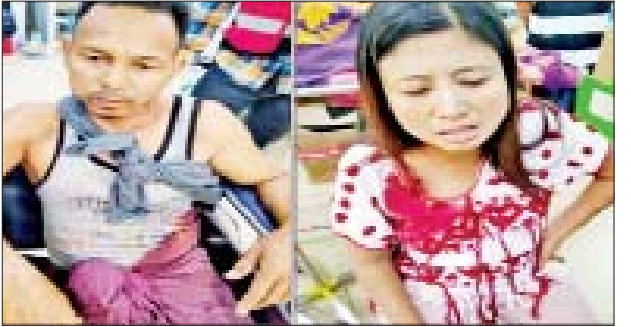
နိုဝင်ဘာ ၂၇ ရက်တွင် မဟာအောင်မြေမြို့နယ် သံလျက်မှော်အနောက်ရပ်ကွက်၌ လက်လုပ်ပုံးဖြင့် ပစ်ပေါက်ရာမှ ပေါက်ကွဲမှုဖြစ်ပွား၍ ဒဏ်ရာရရှိခဲ့သည့် မှတ်တမ်းဓာတ်ပုံ။