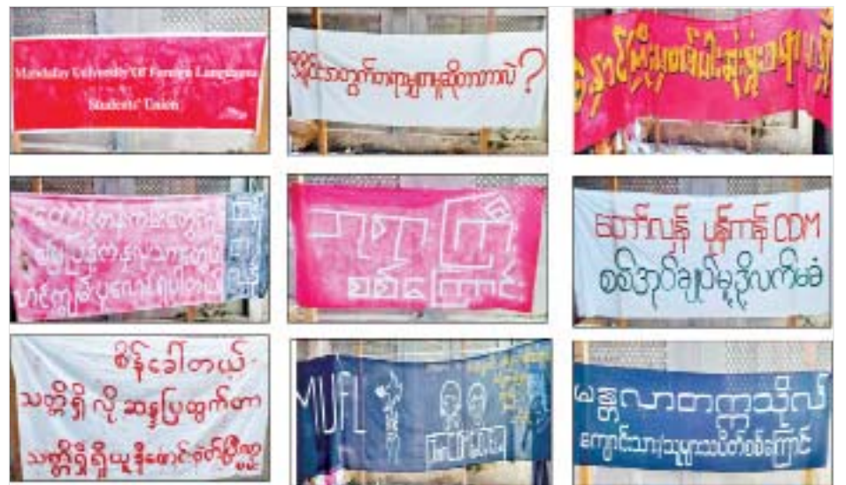
ချမ်းအေးသာစံမြို့နယ်အတွင်း Silence Strike Campaign ပြုလုပ်ရန် ပြင်ဆင်နေမှုအား ဖမ်းဆီးရမိသည့် မှတ်တမ်းဓာတ်ပုံ။

Campaign ပြုလုပ်ရန်နှင့် အဆိုပါ နေရပ်တွင် ပုံမှန်သွားလာလျက် ရှိသော အများပြည်သူများကို ပူးပေါင်းဆောင်ရွက်ခြင်း မရှိသူများအဖြစ်သတ်မှတ်ကာ ထိခိုက်ဒဏ်ရာရရှိစေရန်အတွက် အကြမ်းဖက်ဖောက်ခွဲရေး လုပ်ငန်းများ ဆောင်ရွက်ရန် စီစဉ်လျက်ရှိစဉ် ဖမ်းဆီး ခံရခြင်းဖြစ်ကြောင်း ဖော်ထုတ်သိရှိရသည်။ သို့ဖြစ်ပါ၍ အဆိုပါ ဖမ်းဆီးရမိတရားခံအား ဥပဒေအရ