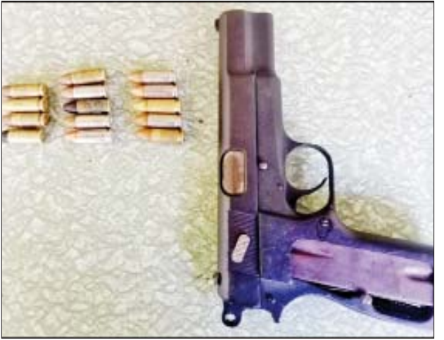
ဒီဇင်ဘာ ၈ ရက်တွင် မဟာအောင်မြေမြို့နယ် စိန်ပန်းရပ်ကွက် ၃၈ x ၉၀ လမ်းကြား၌ သိမ်းဆည်းရမိသည့် လက်နက်၊ ခဲယမ်း မှတ်တမ်းဓာတ်ပုံ။