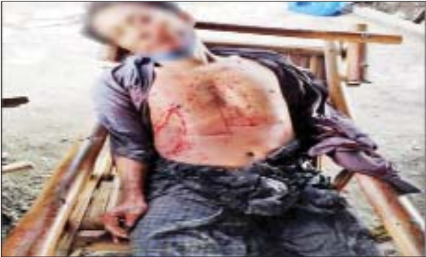
ဇူလိုင် ၃၁ တွင် ချမ်းမြသာစည်မြို့နယ် တမ္ပဝတီရပ်ကွက် မြို့ဟောင်းရပ်နေ အပြစ်မဲ့ပြည်သူတစ်ဦး ဓားဖြင့် ထိုးခံရသည့် မှတ်တမ်းဓာတ်ပုံ။