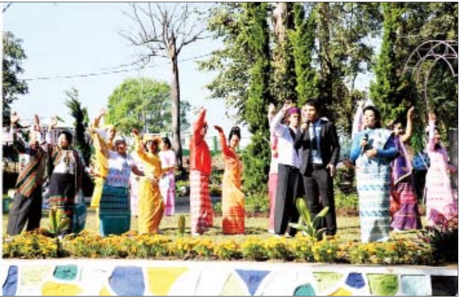
နိုင်ငံတော်စီမံအုပ်ချုပ်ရေးကောင်စီဥက္ကဋ္ဌ၊ နိုင်ငံတော်ဝန်ကြီးချုပ် ဗိုလ်ချုပ်မှူးကြီးမင်းအောင်လှိုင်နှင့် အဖွဲ့ဝင်များ မြဝတီတေးဂီတအဖွဲ့က တေးသံသာများဖြင့် ကပြဖျော်ဖြေမှုကို ကြည့်ရှုအားပေးစဉ်။

○ ရှေးဦးမှ အဆိုပါ အခမ်းအနားသို့ နိုင်ငံတော်စီမံအုပ်ချုပ်ရေးကောင်စီ ဥက္ကဋ္ဌ၊ နိုင်ငံတော်ဝန်ကြီးချုပ် နှင့်အတူ ဇနီး ဒေါ်ကြူကြူလှ၊ နိုင်ငံတော် စီမံအုပ်ချုပ်ရေး ကောင်စီအဖွဲ့ဝင်များ ဖြစ်ကြသည့် ဗိုလ်ချုပ်ကြီး မောင်မောင်ကျော် နှင့် ဇနီး၊ ဒုတိယဗိုလ်ချုပ်ကြီး မိုးမြင့်ထွန်း၊ ကောင်စီတွဲဖက် အတွင်းရေးမှူး ဒုတိယဗိုလ်ချုပ် ကြီး ရဲဝင်းဦးနှင့်ဇနီး၊ ပြည်ထောင်စု ဝန်ကြီးများ၊ မန္တလေးတိုင်းဒေသ ကြီး ဝန်ကြီးချုပ်၊ ကာကွယ်ရေး ဦးစီးချုပ်ရုံးမှ တပ်မတော်အရာရှိ ကြီးများ၊ အလယ်ပိုင်းတိုင်း စစ်ဌာနချုပ် တိုင်းမှူး၊ မန္တလေး မြို့တော်ဝန်နှင့် တာဝန်ရှိသူများ၊ ဒေသခံပြည်သူများ တက်ရောက် ကြသည်။