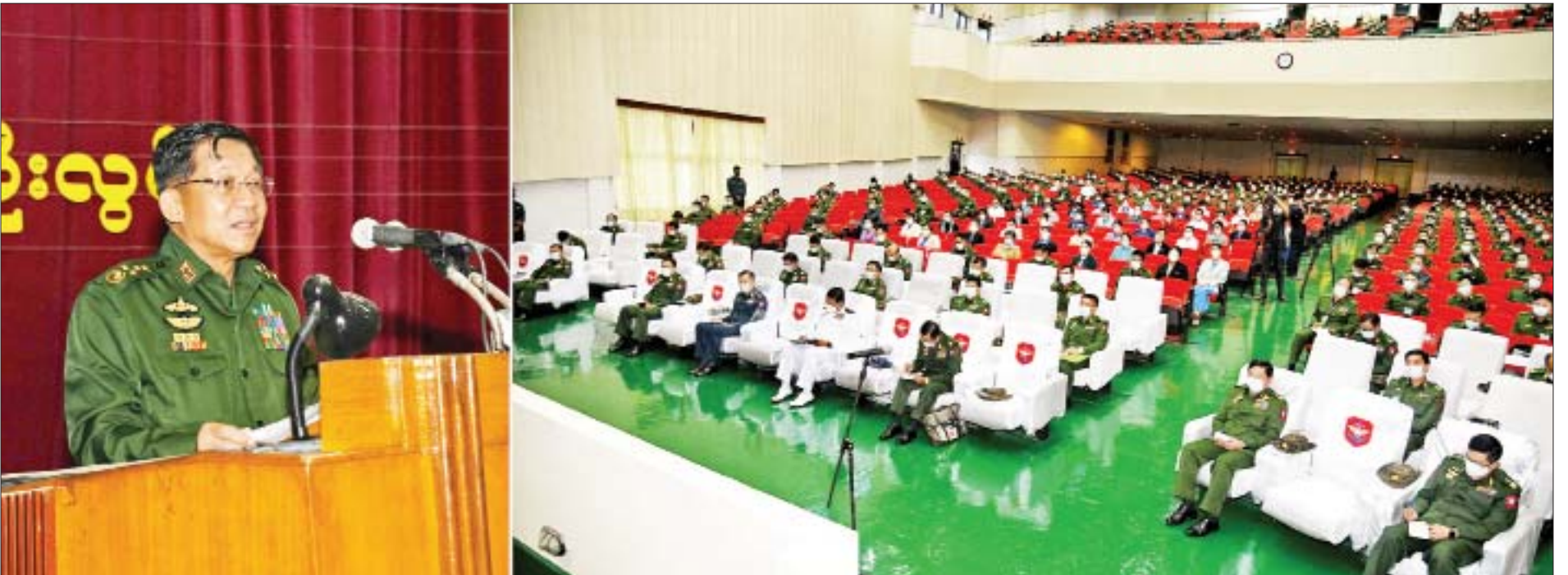
နိုင်ငံတော်စီမံအုပ်ချုပ်ရေးကောင်စီဥက္ကဋ္ဌ၊ တပ်မတော်ကာကွယ်ရေးဦးစီးချုပ် ဗိုလ်ချုပ်မှူးကြီးမင်းအောင်လှိုင် စစ်တက္ကသိုလ်နှင့် တပ်မတော်နည်းပညာတက္ကသိုလ်တို့မှ ကျောင်းအုပ်ကြီးများ၊ နည်းပြအရာရှိကြီးများ၊ ကထိကအရာရှိကြီးများ၊ ဆရာ၊ ဆရာမကြီးများ၊ သန္ဓေအရာရှိများအား တွေ့ဆုံအမှာစကားပြောကြားစဉ်။