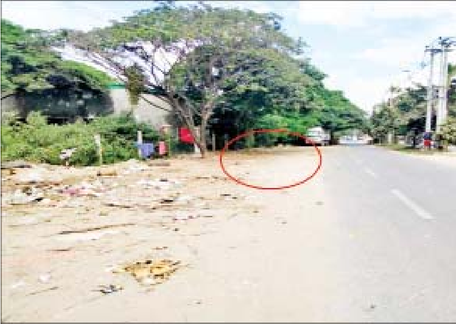
နိုဝင်ဘာ ၂၇ ရက်တွင် မဟာအောင်မြေမြို့နယ် သံလျက်မှော်အနောက်ရပ်ကွက်၌ လက်လုပ်ပုံးဖြင့် ပစ်ပေါက်ရာမှ ပေါက်ကွဲမှုဖြစ်ပွားခဲ့သည့် မှတ်တမ်းဓာတ်ပုံ။