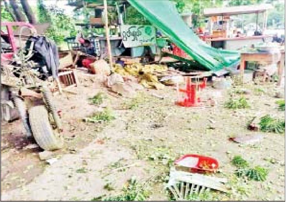
နိုဝင်ဘာ ၂၄ ရက်တွင် မဟာအောင်မြေမြို့နယ် သံလျက်မှော်အနောက်ရပ်ကွက် ကမ်းနားလမ်းဈေး၌ လက်လုပ်ပုံးပစ်ပေါက်ခဲ့သည့် မှတ်တမ်းဓာတ်ပုံ။