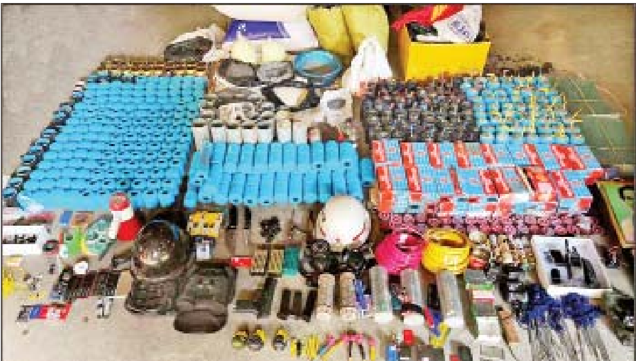
ဒီဇင်ဘာ ၈ ရက်တွင် ချမ်းမြသာစည်မြို့နယ် (ဆ-၂) ရပ်ကွက် အမှတ် (၇၆) တွင် သိမ်းဆည်းရမိသည့် လက်နက်/ခဲယမ်းများနှင့် ဖောက်ခွဲရေး ပစ္စည်းများ၏ မှတ်တမ်းဓာတ်ပုံ။