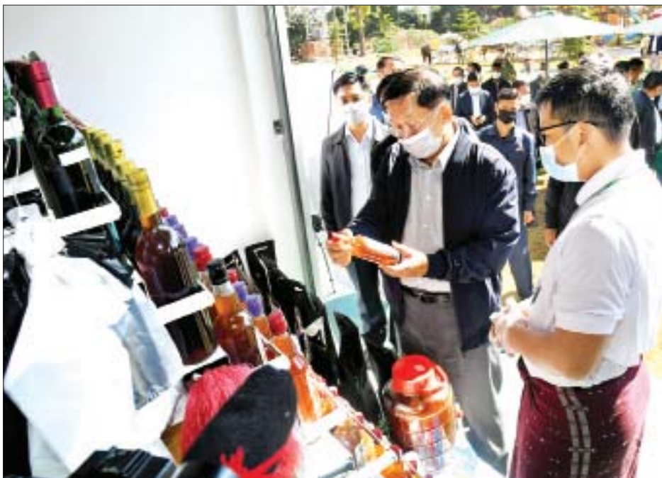
နိုင်ငံတော်စီမံအုပ်ချုပ်ရေးကောင်စီဥက္ကဋ္ဌ၊ နိုင်ငံတော်ဝန်ကြီးချုပ် ဗိုလ်ချုပ်မှူးကြီးမင်းအောင်လှိုင် ဒေသထွက်ပစ္စည်းအရောင်းဆိုင်များအား ကြည့်ရှုအားပေးစဉ်။