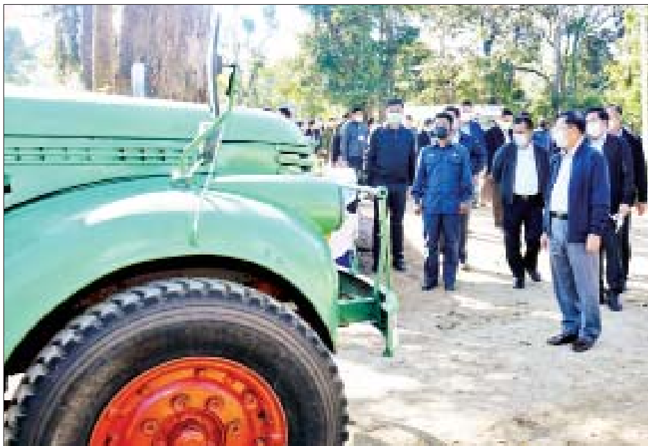
နိုင်ငံတော်စီမံအုပ်ချုပ်ရေးကောင်စီဥက္ကဋ္ဌ၊ နိုင်ငံတော်ဝန်ကြီးချုပ် ဗိုလ်ချုပ်မှူးကြီးမင်းအောင်လှိုင်နှင့် အဖွဲ့ဝင်များ ရှေးခေတ်က ပြင်ဦးလွင်ဒေသတွင်အသုံးပြုခဲ့သည့် မော်တော်ယာဉ်များကို ကြည့်ရှုစဉ်။

ဝ စာမျက်နှာ ၄ မှ တည်ဆောက်ထားရှိမှုကို လှည့်လည်ကြည့်ရှုပြီး ဆင်ကလေးများကို အစာကျွေးသည်။ ထို့နောက် ရေတံခွန် လာရောက်လည်ပတ်သူများ လှည့်လည်ကြည့်ရှုနိုင်ရန် ဖောက်လုပ်ထားသည့် တောတွင်း လျှောက်လမ်းအတိုင်း လှည့်လည်ကြည့်ရှုကြသည်။ ကြည့်ရှုအားပေး ယင်းနောက် နိုင်ငံတော်စီမံအုပ်ချုပ်ရေးကောင်စီ ဥက္ကဋ္ဌ၊ နိုင်ငံတော်ဝန်ကြီးချုပ်နှင့် အဖွဲ့ဝင်များသည် ပွဲကောက်ရေတံခွန်အပန်းဖြေစခန်းအတွင်း အမိုးပါ ကလေးအားကစားကွင်းတွင် နယ်လှည့် ပြည်သူ့ဆက်ဆံရေး တပ်ဖွဲ့မှ မျက်လှည့်ပြဿမှုပြကွက်များကို ကြည့်ရှုအားပေးပြီး ချီးမြှင့်ငွေများ ပေးအပ်ကာ ဒေသထွက် ပစ္စည်းအရောင်းဆိုင်များ၊ Smart P ရုပ်အင်္ကျီအရောင်းဆိုင်၊ နေရောင်ခြည်စွမ်းအင်သုံး စိုက်ပျိုးရေးရေသုံး ဆိုလာနည်းစနစ်နှင့် စိုက်ခင်းများ