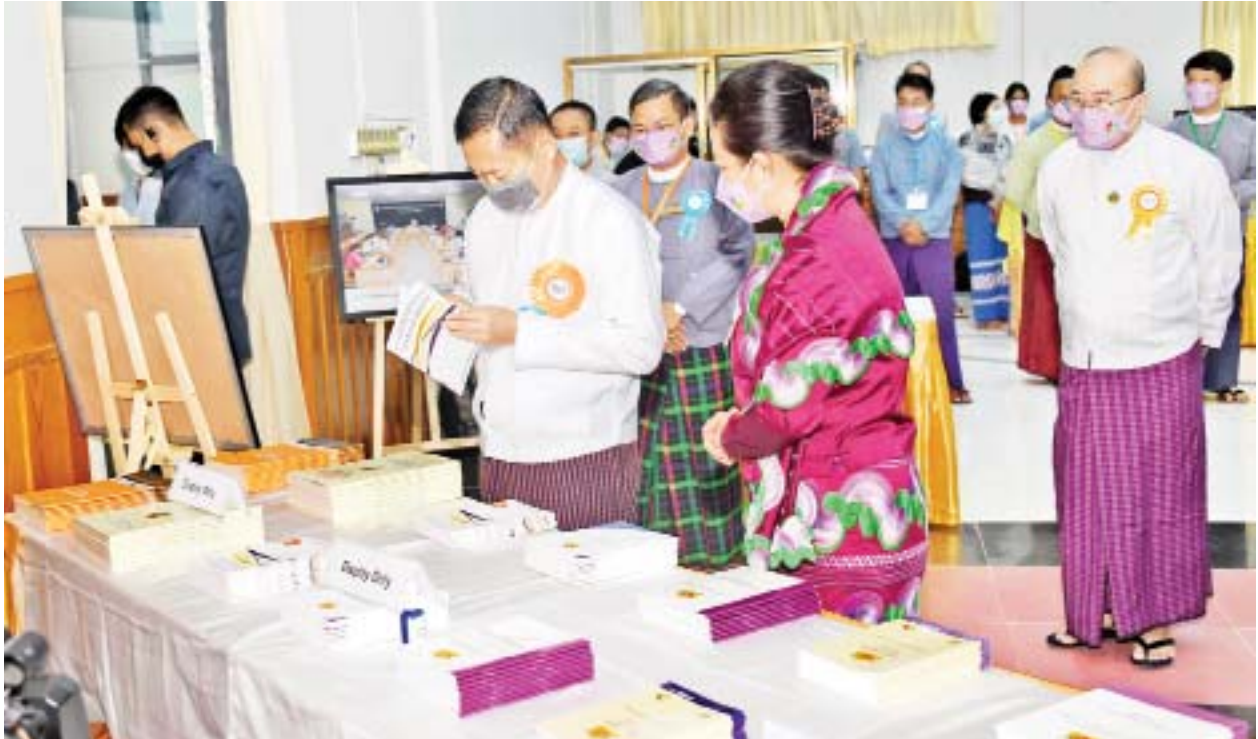
နိုင်ငံတော်စီမံအုပ်ချုပ်ရေးကောင်စီ ဒုတိယဥက္ကဋ္ဌ၊ ဒုတိယဝန်ကြီးချုပ် ဒုတိယဗိုလ်ချုပ်မှူးကြီး စိုးဝင်း ၂၀၂၁ ခုနှစ် အပြည်ပြည်ဆိုင်ရာ မသန်စွမ်းသူများနေ့ အထိမ်းအမှတ်အခမ်းအနားတွင် ခင်းကျင်းပြသထားသည့် မသန်စွမ်းသူများနှင့် သက်ဆိုင်သော စာအုပ်များကို ကြည့်ရှုစဉ်။

○ ကျောပိုးမှ တိုင်းဒေသကြီး၊ ပြည်နယ်များမှ လူမှုရေးဆိုင်ရာဝန်ကြီးများ၊ ဌာနဆိုင်ရာ တာဝန်ရှိသူများ၊ မြန်မာနိုင်ငံ အမျိုးသားလူ့အခွင့်အရေး ကော်မရှင်၊ မြန်မာနိုင်ငံ စစ်မှုထမ်းဟောင်း အဖွဲ့၊ မြန်မာနိုင်ငံကုန်သည်များနှင့် စက်မှုလက်မှုလုပ်ငန်းရှင်များအသင်း၊ မြန်မာနိုင်ငံအင်ဂျင်နီယာအသင်း၊ မြန်မာနိုင်ငံမသန်စွမ်းသူများအသင်းချုပ်၊ မြန်မာနိုင်ငံ မသန်စွမ်းသူများအားကစားအဖွဲ့ချုပ်၊ မြန်မာနိုင်ငံကြက်ခြေနီအသင်း၊ မြန်မာနိုင်ငံအမျိုးသမီးရေးရာအဖွဲ့ချုပ်၊ မြန်မာနိုင်ငံမိခင်နှင့် ကလေးစောင့်ရှောက်ရေးအသင်း၊ ရင်ခွင်မဲ့ကလေးများ လျှော့ချရေးနှင့် ကာကွယ်စောင့်ရှောက်ရေးအသင်း၊ မြန်မာအမျိုးသမီး စီးပွားရေးစွမ်းဆောင်ရင်များအသင်းနှင့် မြန်မာနိုင်ငံအမျိုးသမီးများနှင့် ကလေးသူငယ်များ ဘဝမြှင့်တင်ရေးအသင်းတို့မှ တာဝန်ရှိသူများ၊ ပြည်တွင်း၊ ပြည်ပ အစိုးရ မဟုတ်သော အဖွဲ့အစည်းများမှ ကိုယ်စားလှယ်များနှင့် ဖိတ်ကြားထားသူများက ဗီဒီယိုကွန်ဖရင့်စနစ်ဖြင့် တက်ရောက်ကြသည်။