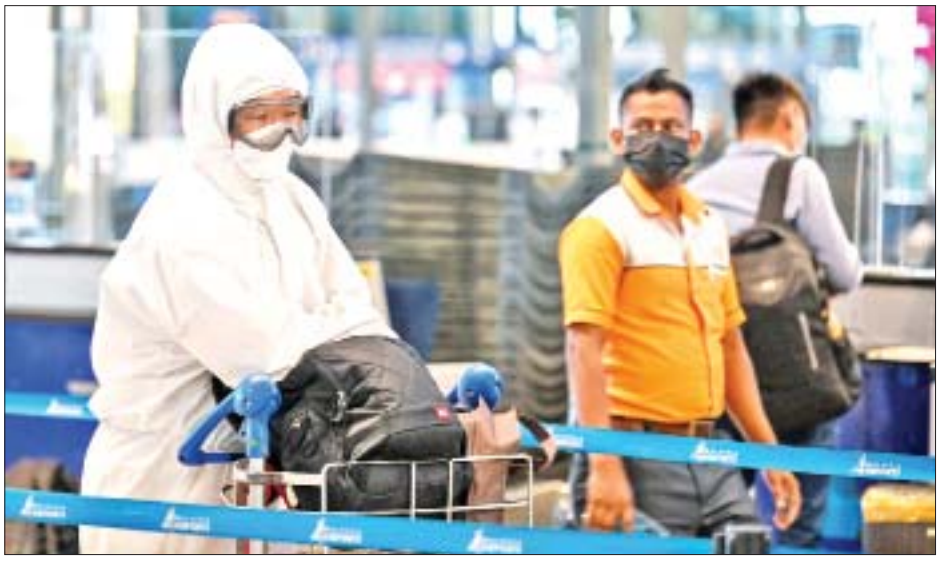
အဖွဲ့က လက်ခံရရှိခဲ့သည်။ ထို့ပြင် ဩစတြေးလျ၊ ကနေဒါ၊ အစ္စရေးနှင့် ဟောင်ကောင်ကိုယ်ပိုင်အုပ်ချုပ် ခွင့်ရဒေသတို့အပါအဝင် ဥရောပနိုင်ငံ အများအပြား တွင်လည်း လက်ရှိအချိန်တွင် အိုမီခရွန်ဗီဇပြောင်း ပိုင်းရပ်စ်ကူးစက်မှုများကို တွေ့ရှိရသည်။ ကိုးကား-ဆင်ပွာ၊ ဘာသာပြန်-စိုးသူရ

အား ကျန်းမာရေးစစ်ဆေးခဲ့ရာတွင် ကိုဗစ်-၁၉ ရောဂါကူးစက်ခံရမှုမရှိကြောင်း တွေ့ရှိရသည်။ မလေးရှားနိုင်ငံသည် လက်ရှိအချိန်တွင် အိုမီခရွန် ဗီဇပြောင်းပိုင်းရပ်စ် ကူးစက်မှုများပြားသော အာဖရိကနိုင်ငံ ရှစ်နိုင်ငံမှ ခရီးသည်များကို ပြည်ဝင် ခွင့်ပိတ်ပင်ထားသည်။ သို့ရာတွင် မလေးရှားနှင့် စင်ကာပူနိုင်ငံအကြား အကောင်အထည်ဖော် ဆောင်ရွက်နေသည့် နှစ်နိုင်ငံအကြား ကိုဗစ်-၁၉ ရောဂါကာကွယ်ဆေး ထိုးနှံပြီးစီးသူများအတွက် ခရီးသွားစင်္ကြံအစီအစဉ်ကို ဆက်လက်အကောင် အထည်ဖော်ဆောင်ရွက်သွားမည်ဖြစ်ကြောင်း ခိုင်ရီ က ပြောကြားသည်။ စတင်တွေ့ရှိ တောင်အာဖရိကနိုင်ငံတွင် ပြီးခဲ့သော သီတင်း ပတ်အတွင်းက အိုမီခရွန်ဗီဇပြောင်းပိုင်းရပ်စ် စတင် တွေ့ရှိကြောင်း သတိပေးချက်အား ကမ္ဘာ့ကျန်းမာရေး