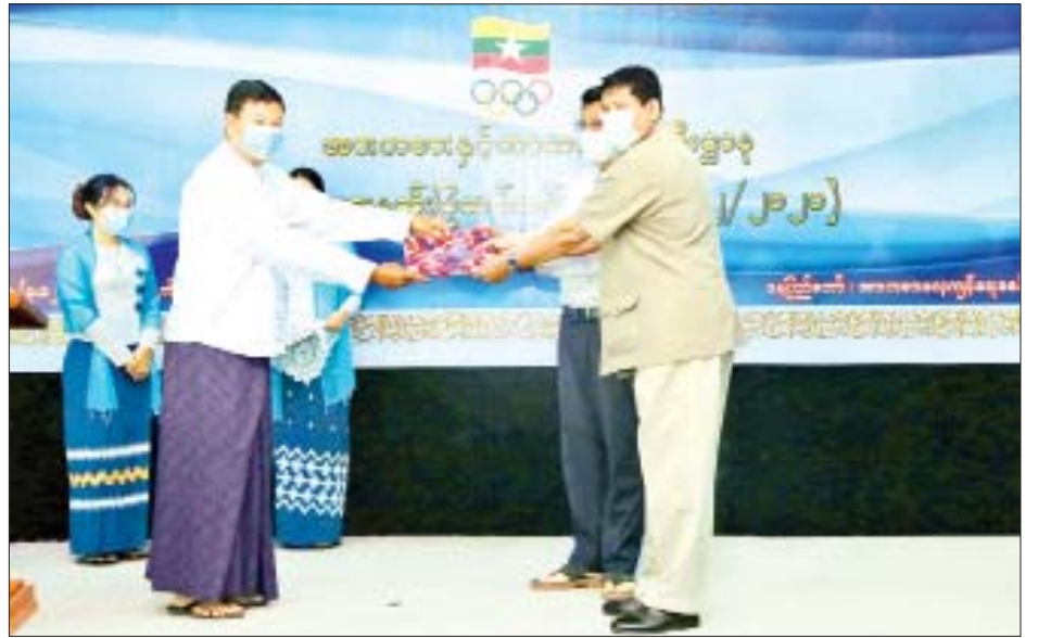
လေ့လာလိုစိတ်နှင့် ဝမ်းစာဖြည့်လို စိတ်များရှိရန် လိုအပ်ကြောင်း၊ အားကစား အဆင့်အတန်းဖြင့် နိုင်ငံ့ဂုဏ်ဆောင်နိုင်မည့် အရည် အချင်းပြည့်ဝသော မျိုးဆက် သစ် အားကစားသမားများအား မွေးထုတ်ပေးနိုင်ရန် အတွက် ဝိုင်းဝန်းကြိုးပမ်းဆောင်ရွက်ပေး ကြရန် လိုအပ်ကြောင်း ပြောကြားသည်။ ပေးအပ်ချီးမြှင့် ဆက်လက်၍ ပြည်ထောင်စု ဝန်ကြီးက သင်တန်းသားများ ကိုယ်စား သင်တန်းသား သင်တန်း သို့ရသည်။ နှစ်ဦးအား သင်တန်းဆင်း အောင်လက်မှတ် များ ပေးအပ်ချီးမြှင့်ပြီး သင်တန်း နည်းပြများကိုယ်စား သင်တန်း နည်းပြနှစ်ဦးကို ဂုဏ်ပြု ဝန်ကြီးက သင်တန်းသားများ လက်ဆောင်များပေးအပ်ခဲ့ကြောင်း သိရသည်။ သတင်းစဉ်

တိုးတက်နေသည့် ခေတ်မီ နည်းစနစ်များကို စဉ်ဆက်မပြတ် လေ့လာနေရန် လိုအပ်ကြောင်း။ ဝိုင်းဝန်းကြိုးပမ်းဆောင်ရွက် သင်တန်းမှ သင်ကြားပို့ချပေး ခဲ့သည့် ပညာရှင်များကို ဆက်လက် တိုးတက်ရန် လေ့လာဆောင်ရွက် ခြင်းဖြင့် နည်းပြဆရာကောင်းများ ဖြစ်ရန် ကြိုးစားနေထိုင်သွားကြ ရန်လိုအပ်ကြောင်း၊ နည်းပြများ အနေဖြင့် မိမိတို့သင်ကြားလေ့ကျင့် ပေးမည့် အားကစားသမားများ ထက် အားကစားဆိုင်ရာ ဘာသာ ရပ်တိုင်း၊ အားကစားနည်းတိုင်း တွင် ပိုမိုကျွမ်းကျင်ပြီး စနစ်တကျ သင်ကြား လေ့ကျင့်ပေးနိုင်ရန် အတွက် အဆက်မပြတ် လေ့လာ နေရန်လိုအပ်ကြောင်း၊ နည်းပြသင် တိုးတက်နေသည့် ခေတ်ကာလ ဖြစ်၍ လေ့လာလိုသည်များကို အလွယ်တကူ ရှာဖွေလေ့လာ အသုံးပြုနိုင်သည့်အတွက် မိမိ တို့ကိုယ်တိုင် လုပ်ချင်ကိုင်ချင်စိတ်၊