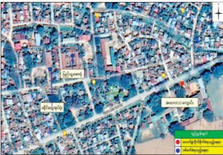
စစ်ကိုင်းတိုင်းဒေသကြီး ကောလင်းမြို့နယ်၌ အကြမ်းဖက်လက်နက်ကိုင်အဖွဲ့များက လာရောက်ပစ်ခတ်တိုက်ခိုက်မှု။

နေပြည်တော် ဒီဇင်ဘာ ၃ အကြမ်းဖက် သမားများသည် အေးချမ်းစွာနေထိုင်သော ပြည်သူ လူထုနှင့် တရားဥပဒေစိုးမိုးရေး အတွက် ဝိုင်းဝန်းဆောင်ရွက်နေသော အုပ်ချုပ်ရေးတာဝန်ရှိသူများအား ထိခိုက်ဒဏ်ရာရရှိစေရန် ရည်ရွယ်ချက်များဖြင့် အကြမ်းဖက်ဖောက်ခွဲရေး လုပ်ရပ်များအတွက် ငွေကြေးထောက်ပံ့ကာ နောက်ကွယ်မှ သွေးထိုးမြှောက်ပင့်လှုံ့ဆော်မှုများဖြင့် အများပြည်သူသွားလာနေသော လမ်းကြီးများ၊ လမ်းများနှင့် ဌာနဆိုင်ရာ ရုံးများအား လက်လုပ်ဗုံး၊ လက်လုပ်မိုင်းများဖြင့် ဖောက်ခွဲဖျက်ဆီးခြင်း၊ ပစ်ခတ်ခြင်းများ ပြုလုပ်ဆောင်ရွက်လျက်ရှိသည်။