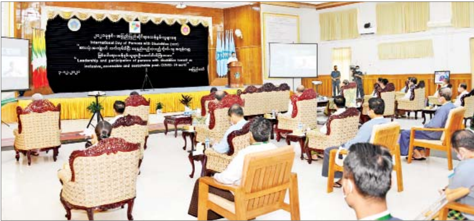
နိုင်ငံတော်စီမံအုပ်ချုပ်ရေးကောင်စီ ဒုတိယဥက္ကဋ္ဌ၊ ဒုတိယဝန်ကြီးချုပ် ဒုတိယဗိုလ်ချုပ်မှူးကြီး စိုးဝင်း ၂၀၂၁ ခုနှစ် အပြည်ပြည်ဆိုင်ရာမသန်စွမ်းသူများနေ့ အထိမ်းအမှတ် အခမ်းအနားတွင် အမှာစကားပြောကြားစဉ်။

နေပြည်တော် ဒီဇင်ဘာ ၃ ၂၀၂၁ ခုနှစ် အပြည်ပြည်ဆိုင်ရာ မသန်စွမ်းသူများနေ့ အထိမ်းအမှတ်အခမ်းအနားကို ယနေ့ နံနက် ၉ နာရီခွဲတွင် နေပြည်တော်ရှိ လူမှုဝန်ထမ်း၊ ကယ်ဆယ်ရေးနှင့် ပြန်လည်နေရာချထားရေးဝန်ကြီးဌာန အစည်းအဝေးခန်းမ၌ ကျင်းပရာ မသန်စွမ်းသူများ၏ အခွင့်အရေးများဆိုင်ရာ အမျိုးသားကော်မတီဥက္ကဋ္ဌ၊ နိုင်ငံတော်စီမံအုပ်ချုပ်ရေးကောင်စီ ဒုတိယဥက္ကဋ္ဌ၊ ဒုတိယဝန်ကြီးချုပ် ဒုတိယဗိုလ်ချုပ်မှူးကြီးစိုးဝင်း တက်ရောက် အမှာစကား ပြောကြားသည်။ အခမ်းအနားသို့ ပြည်ထောင်စုဝန်ကြီးများဖြစ်ကြသော ဦးကိုကိုလှိုင်နှင့် ဒေါက်တာသက်သက်ခိုင်၊ ဒုတိယဝန်ကြီးများနှင့် တာဝန်ရှိသူများ တက်ရောက်ကြပြီး စာမျက်နှာ ၅ ကော်လံ ၁ သို့ ၀