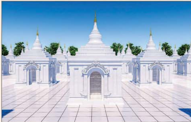
ကျောက်စာရုံစေတီ(၁၂ x ၁၂ x ၁၈)ပေ ၁ ဆူ တန်ဖိုး- ၂၇၉ သိန်း