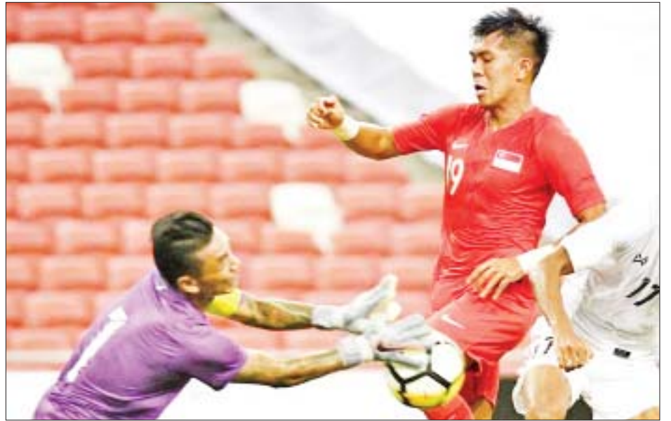
မြန်မာနှင့် စင်ကာပူအသင်း ၂၀၁၉ ခုနှစ်က စင်ကာပူနိုင်ငံ၌ ခြေစမ်းပွဲကစားစဉ်။

ရန်ကုန် ဒီဇင်ဘာ ၃ အာဆီယံဘောလုံးအဖွဲ့ချုပ်က စီစဉ်ကျင်းပသည့် ၂၀၂၀ အာဆီယံ ဆူဇူကီးဖလားပြိုင်ပွဲကို ဒီဇင်ဘာ ၅ ရက်တွင် စတင်ကျင်းပမည်ဖြစ်ပြီး မြန်မာအသင်းသည် အိမ်ရှင်စင်ကာပူအသင်းနှင့် စတင်ကစားရမည်ဖြစ်သည်။ စာမျက်နှာ ၂၃ ကော်လံ ၁ သို့ *