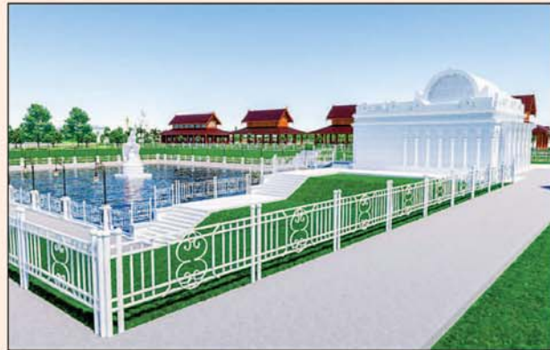
မုစလိန္နအိုင်

၁။ နိုင်ငံတော်စီမံအုပ်ချုပ်ရေးကောင်စီဥက္ကဋ္ဌ၊ တပ်မတော်ကာကွယ်ရေးဦးစီးချုပ် ဗိုလ်ချုပ်မှူးကြီးမင်းအောင်လှိုင် ဦးဆောင်သည့် (၇)ရက်သား၊ သမီး၊ ဘုရားဒါယကာ၊ ဒါယိကာမတို့က မာရဝိဇယပုဒ္ဒရုပ်ပွားတော်မြတ်ကြီးအား မြန်မာနိုင်ငံတွင် ထေရဝါဒပုဒ္ဓသာသနာတော်ထွန်းလင်းတောက်ပလျက်ရှိသည်ကို ကမ္ဘာကိုပြသရန်၊ တိုင်းပြည်အေးချမ်းသာယာမှုရှိစေရန်၊ ရုပ်ပွားတော်မြတ်ကြီးအား ပြည်တွင်း၊ ပြည်ပဘုရားဖူးများလာရောက်ခြင်းဖြင့် ဒေသတိုးတက်စည်ကားမှုကို အထောက်အကူဖြစ်စေရန်၊ နိုင်ငံတော်ဖွံ့ဖြိုးတိုးတက်မှုအား အထောက်အကူဖြစ်စေရန် ရည်သန်လျက် ပြည်ထောင်စုနယ်မြေ နေပြည်တော်၊ ဒက္ခိဏသီရိမြို့နယ်အတွင်း၌ သာသနာတော်ထုံး၊ ရုပ်ပွားဆင်းတုတော်ထုံး၊ မြန်မာ့ရိုးရာတည်ထုံးများနှင့်အညီ တည်ဆောက်ပူဇော်လျက် ရှိပါသည်။