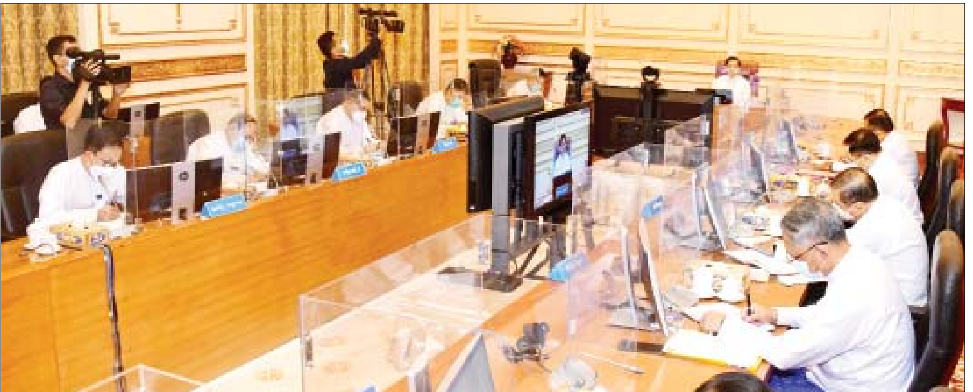
နိုင်ငံတော်စီမံအုပ်ချုပ်ရေးကောင်စီဥက္ကဋ္ဌ၊ နိုင်ငံတော်ဝန်ကြီးချုပ် ဗိုလ်ချုပ်မှူးကြီးမင်းအောင်လှိုင် ပြည်ထောင်စုသမ္မတမြန်မာနိုင်ငံတော် ပြည်ထောင်စုအစိုးရအဖွဲ့ အစည်းအဝေးအမှတ်စဉ် (၃/၂၀၂၁)တွင် အမှာစကားပြောကြားစဉ်။

ပြည်တွင်းမှထုတ်လုပ်သည့်ပစ္စည်းများကို ပြည်ပသွင်းကုန်များ၏ အရည်အသွေးနှင့်ယှဉ်နိုင်အောင် ထုတ်လုပ်နိုင်ရေး အားပေးဆောင်ရွက် လျှပ်စစ်အသုံးပြုသည့် မော်တော်ယာဉ်များ ပြည်တွင်း၌ထုတ်လုပ်၍ သုံးစွဲနိုင်မည်ဆိုပါက နိုင်ငံအတွက် များစွာအကျိုးရှိမည် မကြာမီအချိန်တွင် တက္ကသိုလ်များ ပြန်လည်ဖွင့်လှစ်နိုင်ရေး ရည်မှန်းချက်ထားဆောင်ရွက်လျက်ရှိ