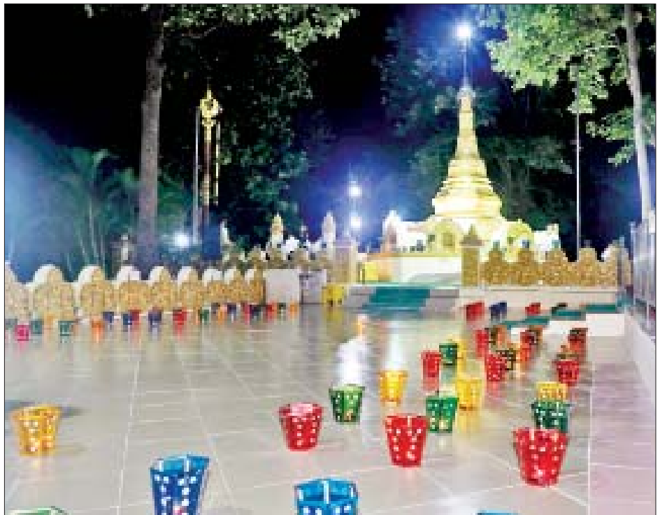
ရွှေဘုန်းပွင့်စေတီတော်ရင်ပြင်တွင် ဆီမီး ၁၀၀၀ ထွန်းညှိပူဇော်ထားသည်ကို တွေ့ရစဉ်။