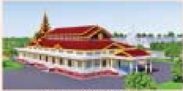
ကမ္ဘာ့ပေါ်ပေါက်မှု အခမ်းအနား ဝိမာန်