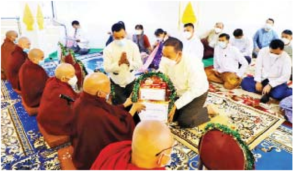
ရာပြည့်ကပ်ကျော်စေတီမြတ်ကြီး စိန်ဖူးတော်ပြန်လည်တင်လှူပူဇော်

ရောဂါ ဖြစ်ပွားမှုကြောင့် ယမန် နှစ်က ကျင်းပနိုင်ခြင်းမရှိဘဲ ယခုနှစ်တွင် ကိုဗစ်-၁၉ ရောဂါ ကူးစက်မှုနှုန်း ကျဆင်းလာသည့် အတွက်ကြောင့် ပြန်လည်ကျင်းပ ခြင်းဖြစ်ကြောင်း အတုလမာရဇိန် ပြည်လုံးချမ်းသာ ဘုရားကြီးဂေါပက အဖွဲ့မှ သိရသည်။ ယခုနှစ်တွင် စစ်တွေမြို့ မြို့ လုံးကျွတ် ဆွမ်းတော်ကြီး လောင်း လှပွဲကို ရခိုင်ပြည်နယ်အစိုးရ အဖွဲ့၏ ကူညီပံ့ပိုးမှုဖြင့် အတုလ မာရဇိန် ပြည်လုံးချမ်းသာဘုရား ကြီး ဂေါပကအဖွဲ့က ဦးဆောင် ကျင်းပခြင်းဖြစ်ကြောင်း သိရ သည်။ တင်ထွန်း(ပြန်/ဆက်)