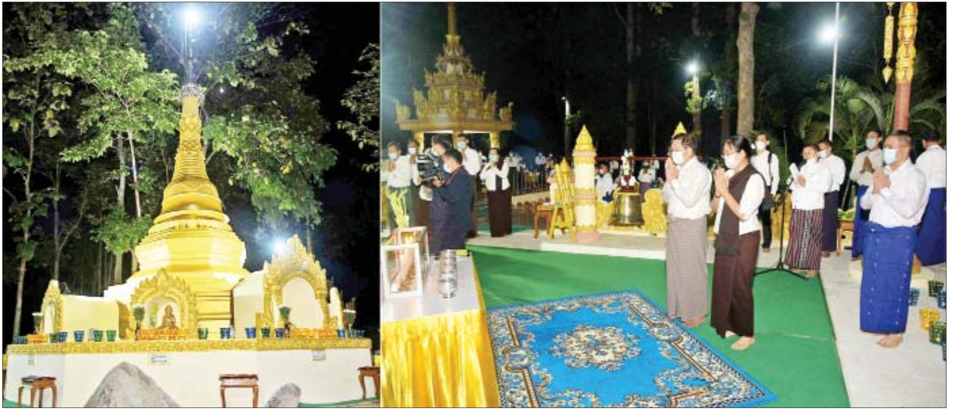
နိုင်ငံတော်စီမံအုပ်ချုပ်ရေးကောင်စီဥက္ကဋ္ဌ၊ နိုင်ငံတော်ဝန်ကြီးချုပ် ဗိုလ်ချုပ်မှူးကြီးမင်းအောင်လှိုင်နှင့်ဇနီး ဒေါ်ကြူကြူလှတို့ ရွှေဘုန်းပွင့်စေတီတော်မြတ်ကြီးတွင် ပန်း၊ ရေချမ်း၊ ဆီမီးများ ထွန်းညှိပူဇော်ကြစဉ်။