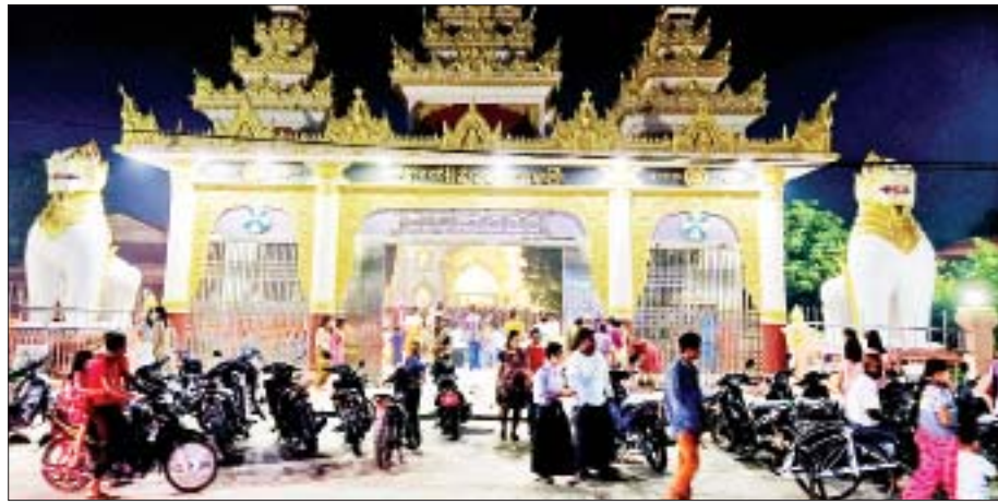
ဧရာဝတီတိုင်းဒေသကြီး ကျောင်းကုန်းမြို့နယ် မျက်ရှင်တော်ပြည်လုံးချမ်းသာ ဘုရားကြီး၌ ဘုရားဖူးလာ ပြည်သူများဖြင့် စည်ကားလျက်ရှိသည်ကို တွေ့ရစဉ်။