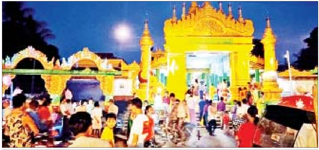
ဧရာဝတီတိုင်းဒေသကြီး အိမ်မဲမြို့နယ် ရှင်ပင်ချမ်းသာကြီးဘုရား၌ ဘုရားဖူးလာပြည်သူများဖြင့် စည်ကားလျက်ရှိသည်ကို တွေ့ရစဉ်။