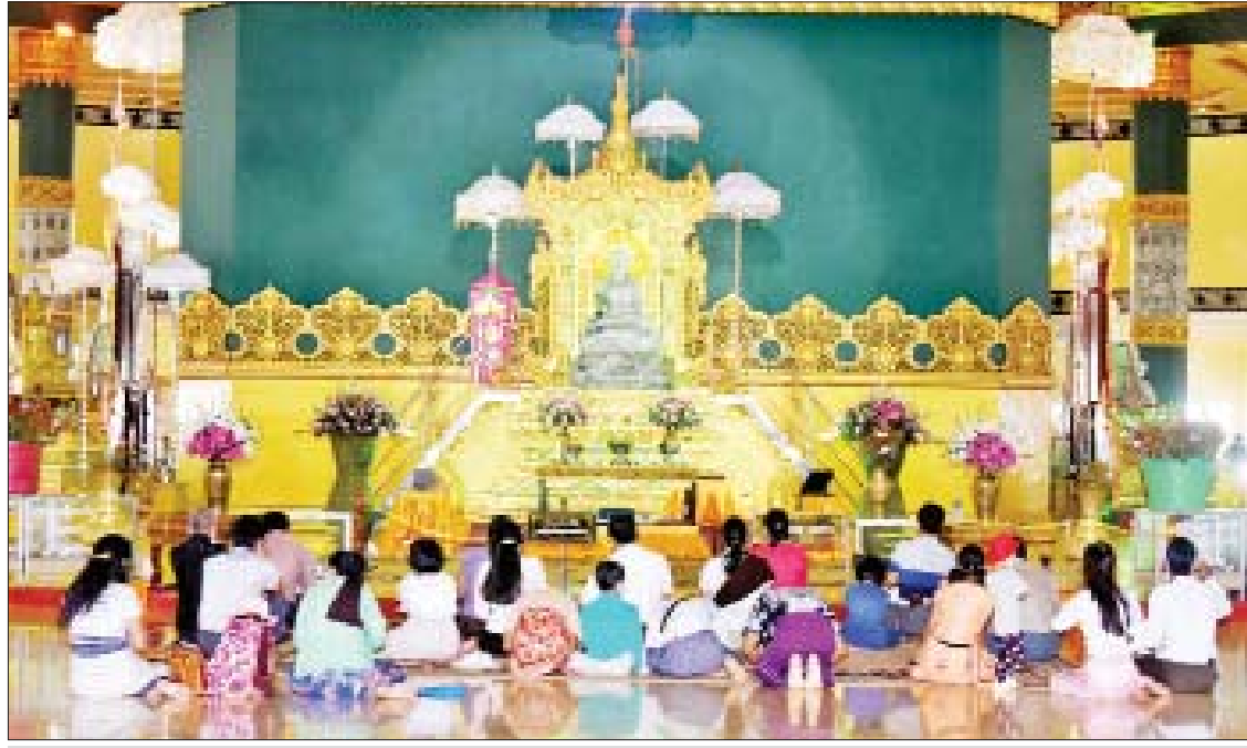
ဥပ္ပါတသန္တီစေတီတော်မြတ်ကြီး၌ ဘုရားဖူးပြည်သူများ လာရောက်ဖူးမြော်ကြည်ညိုကြစဉ်။