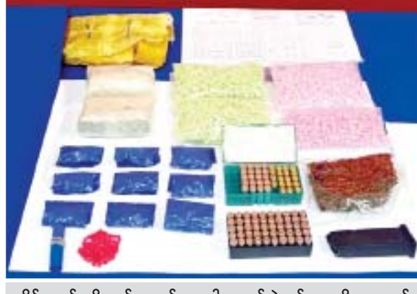
သိမ်းဆည်းရမိသည့် မူးယစ်ဆေးဝါးများနှင့် ခဲယမ်းများကို တွေ့ရစဉ်။

နေပြည်တော် နိုဝင်ဘာ ၁၈ မူးယစ်ဆေးဝါးတားဆီးနှိမ်နင်းရေး တပ်ဖွဲ့ဝင်များပါဝင်သော ပူးပေါင်းအဖွဲ့သည် နိုဝင်ဘာ ၁၇ ရက် မွန်းလွဲ ၂ နာရီတွင် စဉ်ကိုင်မြို့နယ် ပလိပ်ကျေးရွာအနီး ရန်ကုန်-မန္တလေးသွား ကားလမ်းဟောင်းတွင် အောင်အေးလှိုင်(ခ) ကျော့ မောင်းနှင်ပြီး ကျော်ကျော်(ခ) ကုလားလေး လိုက်ပါလာသည့် မော်တော်ဆိုင်ကယ်ကို ရပ်တန့်စစ်ဆေးရှာဖွေရာ စိတ်ကြွေးသွပ်ဆေးပြား ၂၀၀၀ ကို သိမ်းဆည်းရမိခဲ့သည်။ ထို့ပြင် နိုဝင်ဘာ ၁၆ ရက် နံနက် ၁၁ နာရီခွဲတွင် တောင်ကြီးနယ်မြေ ရဲစခန်းမှ တပ်ဖွဲ့ဝင်များပါဝင်သော ပူးပေါင်းအဖွဲ့သည် တောင်ကြီးမြို့ စစ်ထုန်းရပ်ကွက်တွင် စိုင်းသူတဆက် မောင်းနှင်လာသည့် မော်တော်ဆိုင်ကယ်ကို ရပ်တန့်စစ်ဆေးရှာဖွေရာ စိတ်ကြွေးသွပ်ဆေးပြား ၂၀၀၀ ကိုလည်းကောင်း၊ ထိုအတူ နိုဝင်ဘာ ၁၇ ရက် နံနက် ၁၁ နာရီတွင် မူးယစ်ဆေးဝါးတားဆီးနှိမ်နင်းရေး တပ်ဖွဲ့ဝင်များပါဝင်သော ပူးပေါင်းအဖွဲ့သည် ပင်လောင်းမြို့နယ် မှော်ဘီ - ကျောက်တလုံးကြီးသွား ကားလမ်းတွင် အမျိုးသားတစ်ဦး(စစ်စစ်ဆဲ) မောင်းနှင်လာသည့် မော်တော်ဆိုင်ကယ်ကို စစ်ဆေးရန်ရပ်တန့်ခိုင်းစဉ် မောင်းနှင်ထွက်ပြေးပြီး ဆိုင်ကယ်အား စစ်ဆေးရှာဖွေရာ စိတ်ကြွေးသွပ်ဆေးပြား ၅၅၉၀၀ ကိုလည်းကောင်း၊ အလားတူ ယင်းနေ့ညနေပိုင်းတွင် မူးယစ်ဆေးဝါးတားဆီးနှိမ်နင်းရေး တပ်ဖွဲ့ဝင်များပါဝင်သော ပူးပေါင်းအဖွဲ့သည် တာချီလိတ်မြို့ ဆေးခန်းရပ်ကွက်နေ မနန်းစစ်ဖောင်း၏နေအိမ်သို့