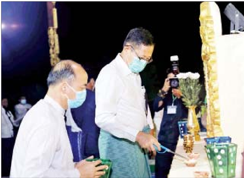
နိုင်ငံတော်စီမံအုပ်ချုပ်ရေးကောင်စီ ဒုတိယဥက္ကဋ္ဌ၊ ဒုတိယဝန်ကြီးချုပ် ဒုတိယဗိုလ်ချုပ်မှူးကြီး စိုးဝင်း ရွှေဘုန်းပွင့် စေတီတော်တွင် ဆီမီးများ ထွန်းညှိပူဇော်စဉ်။