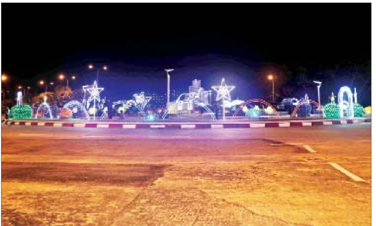
ကာကွယ်ရေးဦးစီးချုပ်ရုံး(ကြည်း)ဝန်းအတွင်း ရောင်စုံမီးအလှများဖြင့် အလှဆင်ထားသည်ကို တွေ့ရစဉ်။