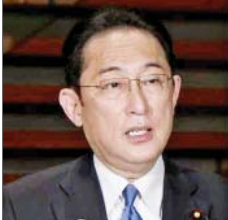
ဂျပန်ဝန်ကြီးချုပ်ကိုရိုဒါ

ထို့ပြင် ကိုရိုဒါအို အဖွဲ့ဝင် ဂျပန်ဝန်ကြီးချုပ်အဖြစ် တာဝန်ထမ်းဆောင်ခြင်းအပေါ် ဂုဏ်ယူဝမ်းမြောက်ကြောင်း သမ္မတဒူတာတေးက ပြောကြားခဲ့ပြီး ဂျပန်နိုင်ငံသည် ဖိလစ်ပိုင်နိုင်ငံ၏ အရင်းနှီးဆုံး မိတ်ဆွေနိုင်ငံဖြစ်ကြောင်း ဖြည့်စွက်ပြောကြားသည်။ ထို့ပြင် လွတ်လပ်ပွင့်လင်းသော အင်ဒို-ပစိဖိတ်ဒေသ ဖြစ်ပေါ်လာစေရေး နှစ်နိုင်ငံလက်တွဲကြိုးပမ်းသွားရန်နှင့် နှစ်နိုင်ငံအကြား မဟာဗျူဟာမြောက် ပူးပေါင်းဆောင်ရွက်မှုကို မြှင့်တင်သွားရန် ခေါင်းဆောင်နှစ်ဦးအကြား သဘောတူညီချက် ရရှိခဲ့သည်။ ကိုးကား-အင်အိတ်ချီကော ဘာသာပြန်-စိုးသူရ