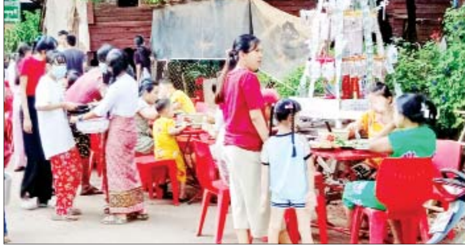
ကော့ကရိတ်မြို့ရှိ ဘုရားစေတီပုထိုးများနှင့် စတုဒိသာ ကျွေးမွေးလှူဒါန်းသည့် နေရာများတွင် လာရောက် ကြည့်ရှုသူများဖြင့် စည်ကားလျက်ရှိသည်ကို တွေ့ရစဉ်။