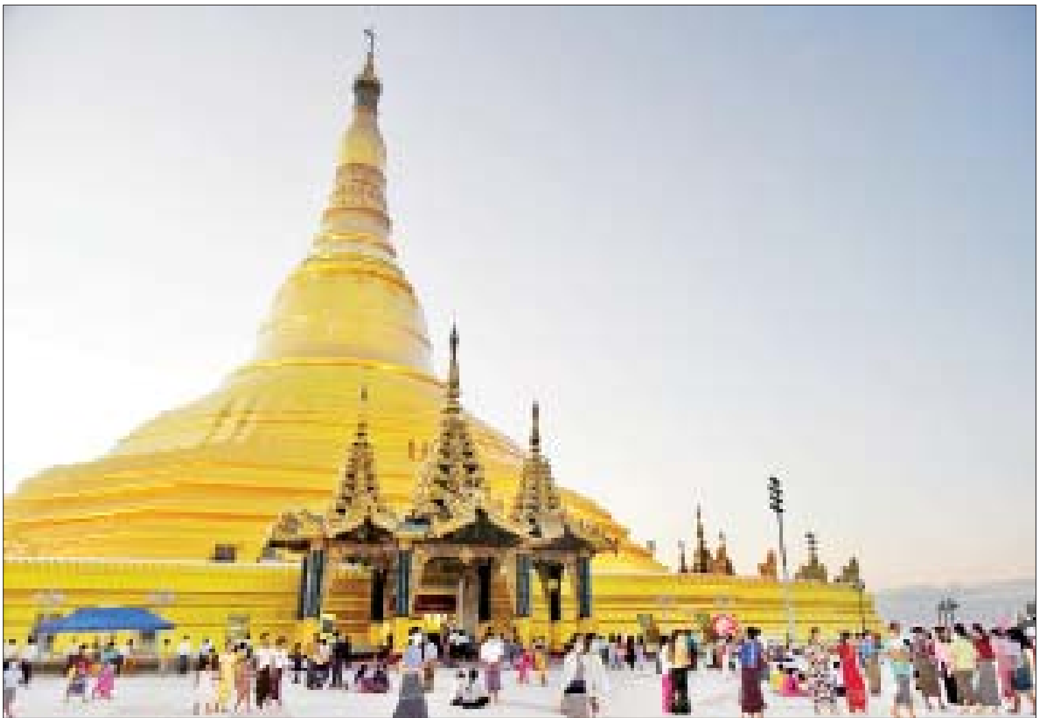
ဥပ္ပါတသန္တီစေတီတော်မြတ်ကြီး၌ ဘုရားဖူးပြည်သူများ လာရောက်ဖူးမြော်ကြည်ညိုကြစဉ်။

ဥက္ကဋ္ဌ၊ နေပြည်တော်တိုင်းစစ်ဌာနချုပ် တိုင်းမှူး၊ ဒုတိယဝန်ကြီးများနှင့် ၎င်းတို့ ၏ဇနီးများက ဘဒ္ဒန္တဇနိန္ဒ အမျိုးပြုသော ဆရာတော်၊ သံဃာတော်များအား လှူဖွယ်ဝတ္ထုပစ္စည်းများ ဆက်ကပ် လှူဒါန်းကြပြီး အနုမောဒနာတရားနာယူ ကြ၍ လှူဒါန်းမှုအစုစုအတွက် ရေစက် သွန်းလောင်း အမျှပေးဝေကြသည်။