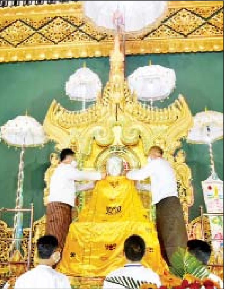
ဥပ္ပါတသန္တီစေတီတော်မြတ်ကြီး၌ (၁၃)ကြိမ်မြောက် တန်ဆောင်တိုင် ရွှေကြာ သင်္ကန်းကပ်လှူပူဇော်စဉ်။