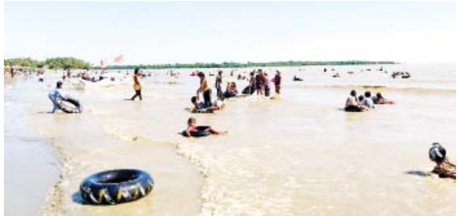
ရုံးပိတ်ရက်ကာလဖြစ်သော တန်ဆောင်မုန်းလပြည့်ညနေပိုင်းတွင် ဆယ်အိမ်တန်းကမ်းခြေ၌လာရောက် အပန်းဖြေအနားယူကြသူများဖြင့် စည်ကားနေသည်ကို တွေ့ရစဉ်။

ကွမ်းခြံကုန်း နိုဝင်ဘာ ၁၈ ရန်ကုန်တိုင်းဒေသကြီး ကွမ်းခြံကုန်းမြို့နယ် ကညင်ကုန်းကျေးရွာအုပ်စုအတွင်းရှိ ဆယ်အိမ်တန်း ကမ်းခြေ၌ ပြီးခဲ့သည့် အောက်တိုဘာလမှစတင်၍ လာရောက်အပန်းဖြေအနားယူကြသူများဖြင့် ပြန်လည် စည်ကားစပြုလာပြီဖြစ်ရာ တန်ဆောင်မုန်းလပြည့် နေ့ဖြစ်သည့် ယနေ့နံနက်ပိုင်းမှ ညနေပိုင်းအထိ လာရောက်အပန်းဖြေ အနားယူကြသူများဖြင့် စည်ကားခဲ့ကြောင်း သိရသည်။ “ကမ်းခြေမှာ အပျော်စီးစပ်ဘုတ်စီးကြတဲ့သူတွေ များပြီး စပ်ဘုတ်စီးနင်းခက တစ်ဦးကို ငွေကျပ် ၁၅၀၀ ဖြစ်ပါတယ်။ ကမ်းခြေကို ပတ်မောင်းပေးတာ ပါ။ မနေ့က ပိတ်ရက်မှာ လူစည်ကားတယ်ဆိုပေမယ့် ဒီနေ့က ရေကူးဆော့ကစားကြတဲ့ ကလေးလူကြီး များစွာနဲ့ ပိုစည်ကားပါတယ်။ ဟိုတယ်နှင့်ခရီး သွားလာရေးဝန်ကြီးဌာနအပါအဝင် အခြားဌာန ဆိုင်ရာတို့ပေါင်းပြီး ကမ်းခြေမှာ လာရောက်လည်ပတ် ကြတဲ့ ဧည့်သည် တွေနဲ့ ဆက်ဆံရာမှာ ကိုဗစ်-၁၉ ရောဂါ စည်းကမ်းနဲ့အညီ ဆက်ဆံနည်း၊ အစား အသောက်တွေ ရောင်းချနည်းအပါအဝင် ဧည့်သည် တွေလိုက်နာရမယ့် စည်းကမ်းတွေကို အသိပေးနိုင် ဖို့အတွက် စားသောက်ဆိုင်ဖွင့်လှစ်ထားသူတွေကို သင်တန်းဖွင့်လှစ်ပို့ချပေးမယ်လို့ သိရပါတယ်။ သင်တန်းပို့ချပြီးရင်လည်း သင်တန်းဆင်း အောင်လက်မှတ်ရရှိမှာဆိုတော့ အားလုံးအတွက် ပိုမိုကောင်းမွန်ပါတယ်” ဟု ဆယ်အိမ်တန်းကမ်းခြေ၌ စားသောက်ဆိုင်ဖွင့်လှစ်ထားသော ကွမ်းခြံကုန်းမြို့မှ ဒေသခံတစ်ဦးက ပြောသည်။ ရုံးပိတ်ရက်များအတွင်း အနယ်နယ်အရပ်ရပ်မှ လာရောက်အပန်းဖြေကြသော ပြည်သူများဖြင့် စည်ကားတတ်သော ဆယ်အိမ်တန်းကမ်းခြေ၌ စားသောက်ဆိုင်ခန်းပေါင်း ၅၀ ကျော် ဖွင့်လှစ်ထား