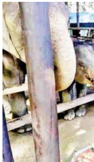
ညောင်ဦး နိုဝင်ဘာ ၁၈ မန္တလေးတိုင်းဒေသကြီး

မြို့နယ် အနောက်ပလင်းကျေးရွာအနီး ဧရာဝတီမြစ်ကမ်းဘေးတွင် ဖွင့်လှစ်ထား