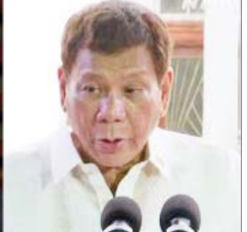
ဖိလစ်ပိုင်သမ္မတဒူတာတေး