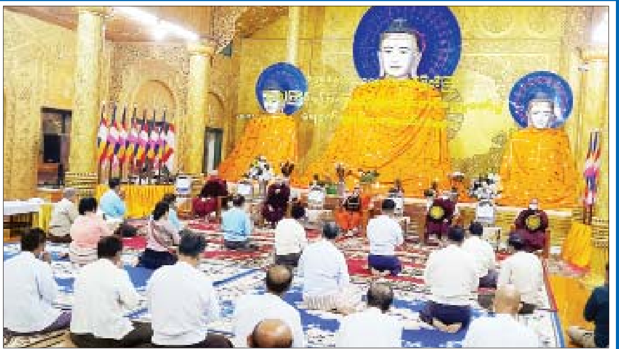
ဧရာဝတီတိုင်းဒေသကြီး ပုသိမ်မြို့ သမိုင်းဝင်ရွှေမုဋ္ဌာ မဟာစေတီတော် မြတ်ကြီး၌ မသိုးသင်္ကန်းရက်လုပ်ပူဇော်ပွဲ ရေစက်ချအခမ်းအနား ကျင်းပစဉ်။