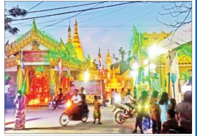
မန္တလေးတိုင်းဒေသကြီး ရမည်းသင်းမြို့နယ် ရန်အောင်မြင်မြင်စွာဘုရားကြီး၌ ဘုရားဖူးလာပြည်သူများဖြင့် စည်ကားလျက်ရှိသည်ကို တွေ့ရစဉ်။