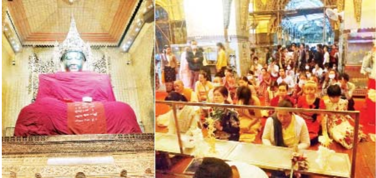
မဟာမုနိရုပ်ရှင်တော်မြတ်အား ဘုရားဖူးပြည်သူများ လာရောက်ဖူးမြော်ကြည်ညိုကြစဉ်။