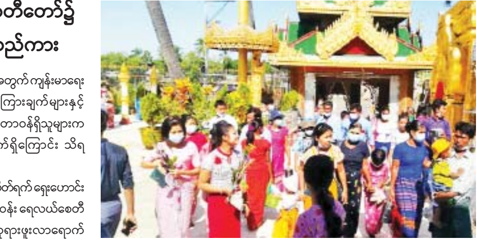
၄ နာရီအထိသာ ခွင့်ပြုထားသော်လည်း ညနေ ၄ နာရီခွဲအထိ ခွင့်ပြုထားကြောင်း နေ့ထူးနေ့မြတ်များတွင် နံနက် ၇ နာရီမှ သိရသည်။

ရောဂါကာကွယ်ရေးအတွက် ကျန်းမာရေး ဝန်ကြီးဌာန၏ ညွှန်ကြားချက်များနှင့် အညီ ဘုရားဂေါပက တာဝန်ရှိသူများက ဆောင်ရွက်ပေးလျက်ရှိကြောင်း သိရ သည်။ တန်ဆောင်တိုင်ရုံးပိတ်ရက် ရှေးဟောင်း သမိုင်းဝင် ကျိုက်မှော်ဝန်း ရေလယ်စေတီ တော်မြတ်ကြီးသို့ ဘုရားဖူးလာရောက် သူ များပြားလျက်ရှိပြီး ဘုရားဖူးချိန်ကို ပုံမှန်ရက်များတွင် နံနက် ၇ နာရီမှ ညနေ