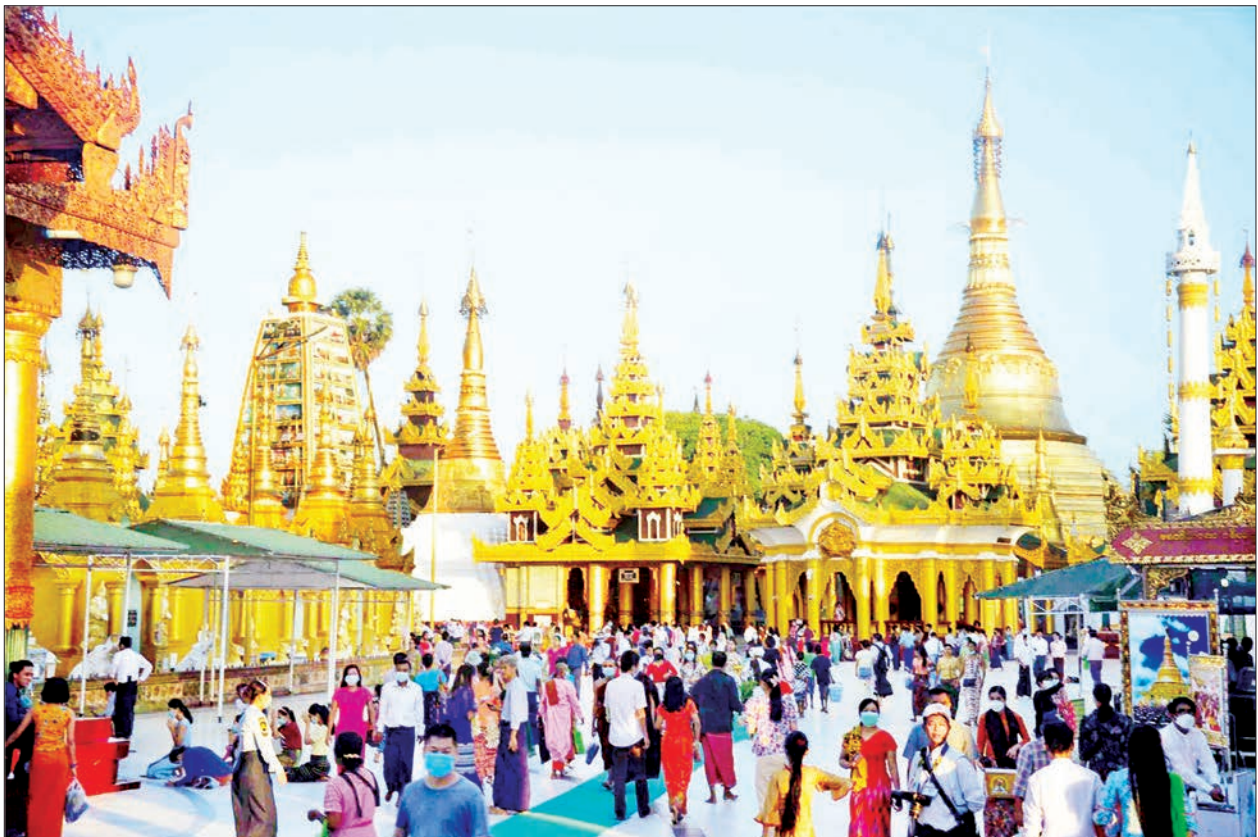
တန်ဆောင်မုန်းလပြည့်နေ့တွင် ရွှေတိဂုံစေတီတော်မြတ်ကြီး၌ ဘုရားဖူးလာပြည်သူများဖြင့် စည်ကားလျက်ရှိသည်ကို တွေ့ရစဉ်။

ထို့နောက် ကြွရောက်တော်မူလာကြသည့် ဆရာတော်သံဃာတော်များက အန္တရာယ်ကင်းပရိတ်တရားတော်များ ရွတ်ပွားချီးမြှင့်တော်မူကြသည်။