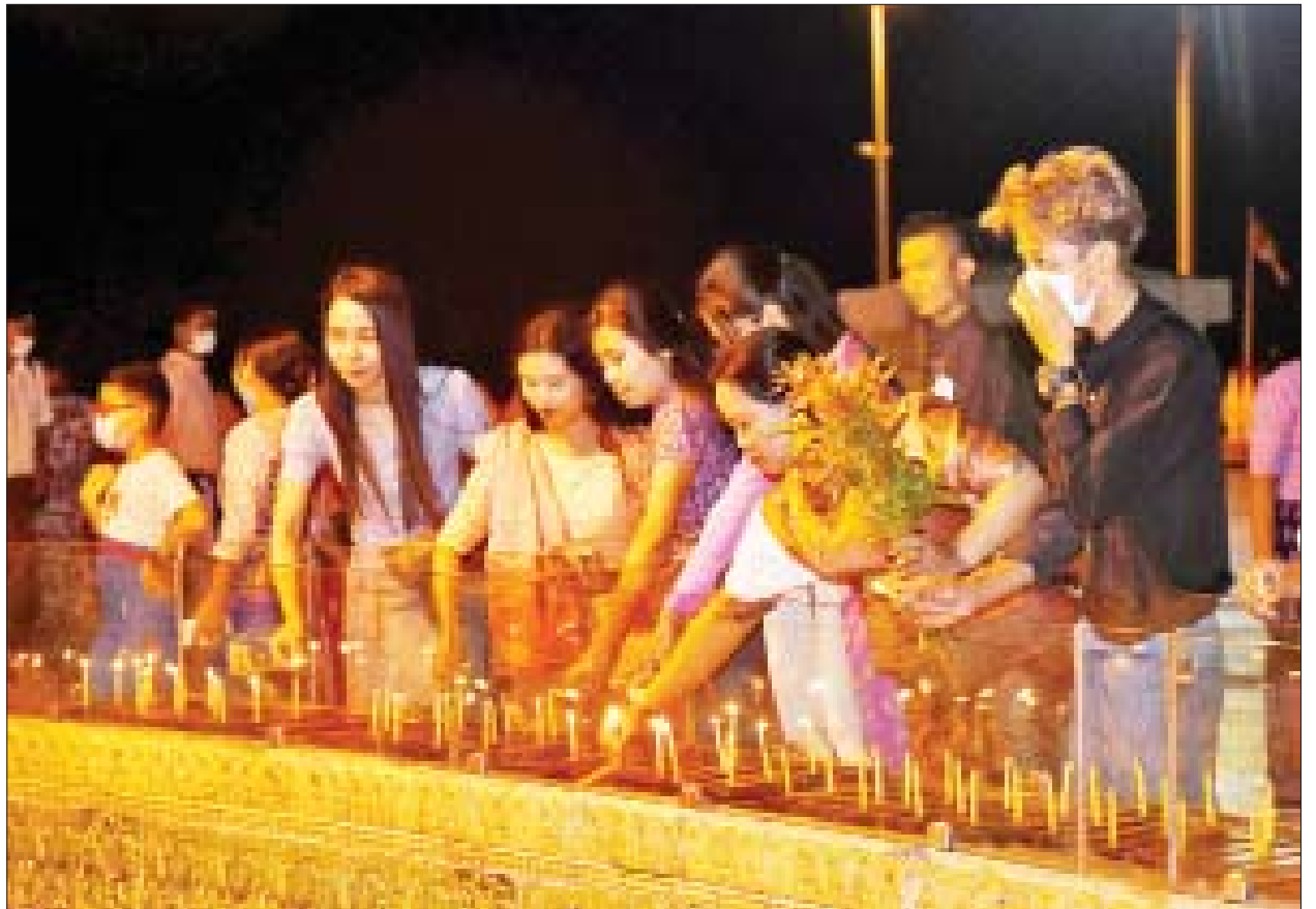
ဥပျာတသန္တိစေတီတော်မြတ်ကြီး၌ ဆီမီးထွန်းညှိပူဇော်သူများဖြင့် စည်ကားလျက်ရှိသည်ကို တွေ့ရစဉ်။