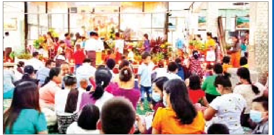
ရခိုင်ပြည်နယ် ကျောက်ဖြူမြို့နယ်ရှိ ပေါ်တော်မူကံ့ကော်တောဘုရား၌ ဘုရားဖူးလာပြည်သူများဖြင့် စည်ကားလျက်ရှိသည်ကို တွေ့ရစဉ်။