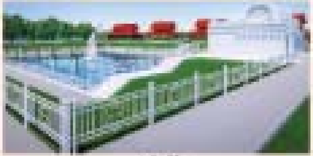
ကန်စင်တာ

၂၀၂၀ ခုနှစ် နိုဝင်ဘာလ ၁၅ ရက်နေ့တွင် ဟေရိယပုဗ္ဗဝှင်ပွားတော်မြတ်ကြီး၏ ဝိမာန်အား တည်ဆောက်ပေးခြင်းနှင့် ရုပ်ငန်းများတွင် အကျင့်စွဲထည့်ဝင်ကုသနိုင်ရေးဆောင်ရွက်ခြင်းတို့ကို အကျဉ်းချုပ်ဖော်ပြပါသည်။