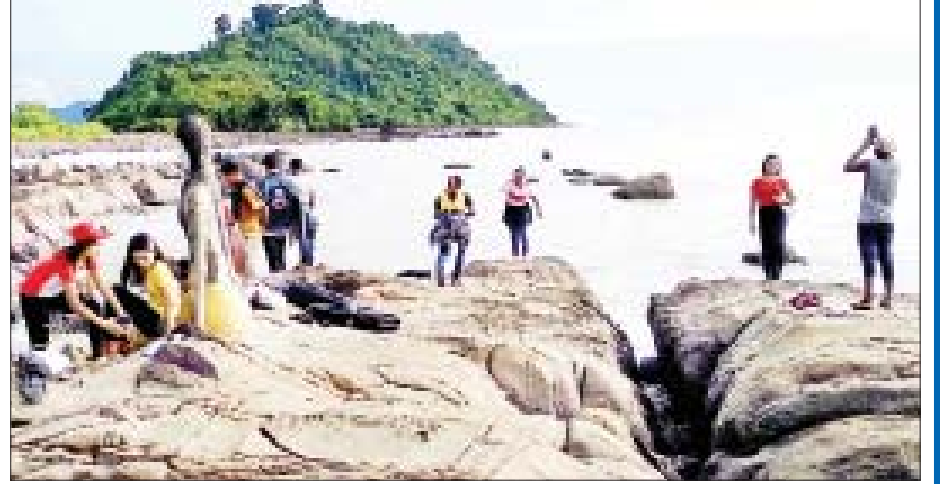
ရခိုင်ပြည်နယ် မြေပုံမြို့နယ်ရှိ အငူကမ်းခြေ၌ တန်ဆောင်တိုင်ရုံးပိတ်ရက်တွင် အပန်းဖြေလာရောက် လည်ပတ်သူများဖြင့် စည်ကားလျက်ရှိသည်ကို တွေ့ရစဉ်။