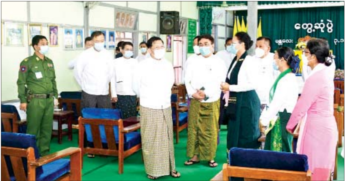
နိုင်ငံတော်စီမံအုပ်ချုပ်ရေးကောင်စီဥက္ကဋ္ဌ၊ နိုင်ငံတော်ဝန်ကြီးချုပ် ဗိုလ်ချုပ်မှူးကြီးမင်းအောင်လှိုင် မန္တလေးမြို့ရှိ လေ့ကျင့်ရေးအလယ်တန်းကျောင်း ကျောင်းအုပ်ဆရာမကြီးနှင့် ဆရာ ဆရာမများအား ရင်းရင်းနှီးနှီး နှုတ်ဆက်စဉ်။

ယင်းနောက် နိုင်ငံတော်စီမံအုပ်ချုပ်ရေးကောင်စီဥက္ကဋ္ဌ၊ နိုင်ငံတော်ဝန်ကြီးချုပ်နှင့်အဖွဲ့ဝင်များသည် အောင်မြေသာစံမြို့နယ်ရှိ အောင်မြေမန္တလာဘောလုံးကွင်းနှင့် ချမ်းအေးသာစံမြို့နယ်ရှိ ဗထူး