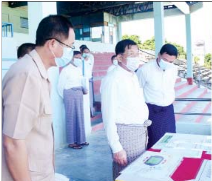
နိုင်ငံတော်စီမံအုပ်ချုပ်ရေးကောင်စီဥက္ကဋ္ဌ၊ နိုင်ငံတော်ဝန်ကြီးချုပ် ဗိုလ်ချုပ်မှူးကြီးမင်းအောင်လှိုင် အောင်မြေသာစံမြို့နယ်ရှိ အောင်မြေမန္တလာဘောလုံးကွင်းအဆင့်မြင့်တင်ဆောင်ရွက်နေမှုအခြေအနေများကို ကြည့်ရှုစဉ်။