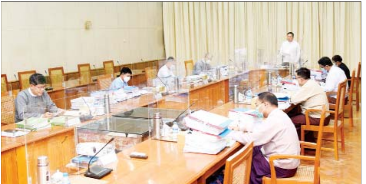
၂၀၂၁ ခုနှစ် စက်တင်ဘာလကုန်အထိ မြန်မာနိုင်ငံတွင် ရင်းနှီးမြှုပ်နှံထားသည့် နိုင်ငံ/ဒေသပေါင်း ၅၁ ခု အနက် ရင်းနှီးမြှုပ်နှံမှုအများဆုံး ပြုလုပ်သော နိုင်ငံများမှာ စင်ကာပူနိုင်ငံ၊ တရုတ်နိုင်ငံနှင့် ထိုင်းနိုင်ငံတို့ဖြစ်ပြီး စီးပွားရေးကဏ္ဍ ၂၂ခုအနက် အများဆုံး ရင်းနှီးမြှုပ်နှံထားသည့်ကဏ္ဍများမှာ လျှပ်စစ်ကဏ္ဍတွင် စုစုပေါင်း ရင်းနှီးမြှုပ်နှံမှု၏ ၂၈ ရာခိုင်နှုန်းဖြင့်လည်းကောင်း၊ ရေနံနှင့် သဘာဝဓာတ်ငွေ့ကဏ္ဍတွင် စုစုပေါင်းရင်းနှီးမြှုပ်နှံမှု၏ ၂၅ ဒသမ ၁၈ ရာခိုင်နှုန်းဖြင့်လည်းကောင်း၊ ကုန်ထုတ်လုပ်မှုကဏ္ဍတွင် စုစုပေါင်းရင်းနှီးမြှုပ်နှံမှု၏ ၁၄ ဒသမ ၂၆ ရာခိုင်နှုန်းဖြင့်လည်းကောင်း ရင်းနှီးမြှုပ်နှံထားကြောင်း သိရသည်။

ယခင် ၂၀၂၀-၂၀၂၁ ဘဏ္ဍာနှစ်အတွက် နိုင်ငံခြားရင်းနှီးမြှုပ်နှံမှုရည်မှန်းချက်သည် မြန်မာနိုင်ငံ ရင်းနှီးမြှုပ်နှံမှုမြှင့်တင်ရေးစီမံကိန်းအရ အမေရိကန်ဒေါ်လာ ၅ ဒသမ ၈ ဘီလီယံဖြစ်ပြီး ကိုဗစ်-၁၉ ရိုက်ခတ်မှုကြောင့် ကမ္ဘာတစ်ဝန်း စီးပွားရေးလုပ်ငန်းများ ထိခိုက်မှုများရှိနေချိန်တွင် မြန်မာနိုင်ငံသို့ ရင်းနှီးမြှုပ်နှံမှု ပမာဏ ၃ ဒသမ ၈ ဘီလီယံနီးပါး အထိဝင်ရောက်ခဲ့ပြီး လျာထားချက်၏ ၆၅ ရာခိုင်နှုန်း ကျော်ရရှိခဲ့သည်။