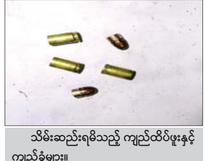
သိမ်းဆည်းရရှိသည့် ကျည်ထိပ်ဖူးနှင့် ကျည်ခွံများ။

နေပြည်တော် နိုဝင်ဘာ ၃ မန္တလေးတိုင်းဒေသကြီး ကျောက်ဆည်မြို့နယ် ၌ ကိုဗစ်-၁၉ ရောဂါ ကူးစက်ပြန့်ပွားမှု ကာကွယ် ထိန်းချုပ်ရေးလုပ်ငန်းများ ဆောင်ရွက်ရန်အတွက် အသံချဲ့စက်ဖြင့် ပညာပေးနှိုးဆော်ခြင်းများ ဆောင်ရွက် နေသည့် သင်ပျိုကျေးရွာ ကျေးရွာအုပ်ချုပ် ရေးမှူးကို နိုင်ငံတော်တည်ငြိမ်အေးချမ်းမှုကို မလိုလားသည့် အကြမ်းဖက်သမားများက နိုဝင်ဘာ ၁ ရက် ညနေပိုင်းတွင် လက်နက်ငယ်