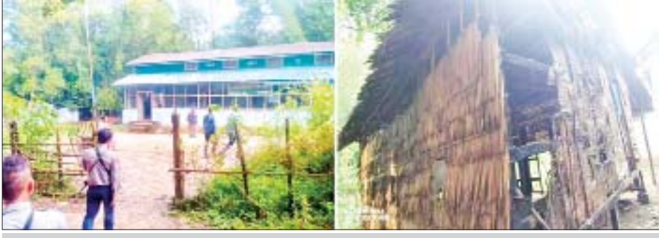
မြောင်းမြမြို့နယ် ဖိုးကြာကုန်းကျေးရွာရှိ မူလွန်စာသင်ကျောင်း မီးလောင်ပျက်စီးခဲ့သည့် မှတ်တမ်း ဓာတ်ပုံ။

နေပြည်တော် နိုဝင်ဘာ ၃ အကြမ်းဖက် အဖွဲ့အစည်းများ ဖြစ်သည့် CRPH၊ NUG နှင့် PDF အကြမ်းဖက်သမား များသည် တိုင်းပြည် တည်ငြိမ်အေးချမ်းမှု နှင့် တရားဥပဒေစိုးမိုးမှုကို ပျက်ပြားစေရန် ရည်ရွယ်ချက်ဖြင့် အချို့ဒေသများတွင် လက်နက်ကိုင် တိုက်ခိုက်မှုများ၊ လမ်း၊ တံတား ဖောက်ခွဲ ဖျက်ဆီးမှုများအပြင် အများပြည်သူ နေထိုင်လျက် ရှိသော နေအိမ်များ၊ နိုင်ငံတော်နှင့် ပုဂ္ဂလိကပိုင် စက်ရုံ၊ အလုပ်ရုံ များအား မီးရှို့ဖျက်ဆီး ဖောက်ခွဲ တိုက်ခိုက်ခြင်းများ လုပ်ဆောင် လျက်ရှိရာ ယခုအခါ အခြေခံ ပညာကျောင်းများ ပြန်လည် ဖွင့်လှစ်၍ ကျောင်းသား ကျောင်းသူ များ စိတ်အေးချမ်းသာစွာ ပညာ သင်ကြားနေမှုများအပေါ် ယုတ်မာ ပက်စက် သိမ်းဖျင်းသေးနုတ်သော အကြံဖြင့် ကျောင်းသား ကျောင်းသူ များနှင့် မိဘပြည်သူများ အထိတ် တလန့်ဖြစ်စေရန် ရည်ရွယ်၍