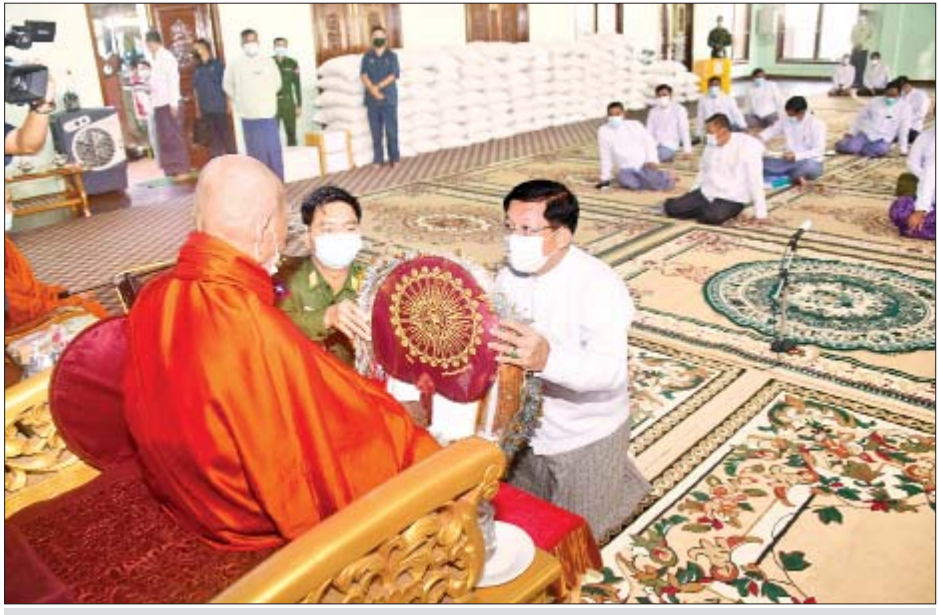
နိုင်ငံတော်စီမံအုပ်ချုပ်ရေးကောင်စီဥက္ကဋ္ဌ၊ နိုင်ငံတော်ဝန်ကြီးချုပ် ဗိုလ်ချုပ်မှူးကြီး မင်းအောင်လှိုင် နိုင်ငံတော်သံဃမဟာနာယကအဖွဲ့ဥက္ကဋ္ဌ၊ ဗန်းမော်ကျောင်းတိုက်ဆရာတော် အဘိဓဇမဟာရဋ္ဌဂုရု အဘိဓဇ အဂ္ဂမဟာ သဒ္ဓမ္မဇောတိက ဒေါက်တာဘဒ္ဒန္တကုမာရာဘိဝံသထံ လှူဖွယ်ပစ္စည်းများ ဆက်ကပ်လှူဒါန်းစဉ်။

ဆွမ်းဆန်တော် အိတ် ၂၀၊ ပဲ ၅ အိတ်၊ ဆီ ပိဿာ ၅၀၊ အာဟာရဖြည့် စားသောက်ဖွယ်ရာများနှင့် ဆေးပစ္စည်းများကို ဆက်ကပ်လှူဒါန်းပြီး ဆရာတော်ကြီး၏ ကျန်းမာရေးအခြေအနေများကို မေးမြန်းလျှောက်ထားကာ လိုအပ်သည်များ စီစဉ်ဆောင်ရွက်ပေးနိုင်ရေး တာဝန်ရှိသူများကို မှာကြားသည်။ ဖူးမြော်ကြည့်ညို့ ထို့နောက် နိုင်ငံတော်စီမံအုပ်ချုပ်ရေးကောင်စီဥက္ကဋ္ဌ၊ နိုင်ငံတော်ဝန်ကြီးချုပ်နှင့် အဖွဲ့ဝင်များသည် ပဉ္စမသင်္ဂါယနာတင် မဟာလောကမာရဇိန်စေတီ ကုသိုလ်တော်မြတ်စွာဘုရားသို့ ရောက်ရှိကြရာ ဂေါပကအဖွဲ့ဥက္ကဋ္ဌ ဦးကျော်ဝင်းနှင့် အဖွဲ့ဝင်များက ကြိုဆိုနှုတ်ဆက်ကြသည်။ ယင်းနောက် စေတီတော် မြတ်ကြီးအတွင်းရှိ ဗုဒ္ဓရုပ်ပွားတော်မြတ်အား ဖူးမြော်ကြည့်ညို့ကာ ပန်း၊ ရေချမ်း၊ ဆီမီးကပ်လှူပူဇော်သည်။ ထို့နောက် ဘုရားကြီးပြုပြင်မွမ်းမံထိန်းသိမ်းနိုင်ရေးအတွက် ဘက်စုံအလှူငွေများ ပေးအပ်လှူဒါန်းရာ ဂေါပကအဖွဲ့ဥက္ကဋ္ဌက လက်ခံရယူပြီး ဓမ္မလက်ဆောင်များ ပြန်လည်ပေးအပ်သည်။ ထို့နောက် နိုင်ငံတော်စီမံအုပ်ချုပ်ရေးကောင်စီဥက္ကဋ္ဌ၊ နိုင်ငံတော်ဝန်ကြီးချုပ်သည် ဘုရားကြီးစဉ်သည်တော်မှတ်တမ်းစာအုပ်တွင် လက်မှတ်ရေးထိုးပူဇော်သည်။ ဆက်လက်ပြီး နိုင်ငံတော်စီမံအုပ်ချုပ်ရေးကောင်စီဥက္ကဋ္ဌ၊ နိုင်ငံတော်ဝန်ကြီးချုပ်နှင့် အဖွဲ့ဝင်