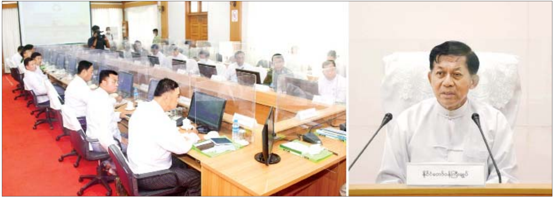
နိုင်ငံတော်စီမံအုပ်ချုပ်ရေးကောင်စီဥက္ကဋ္ဌ၊ နိုင်ငံတော်ဝန်ကြီးချုပ် ဗိုလ်ချုပ်မှူးကြီး မင်းအောင်လှိုင် မန္တလေးတိုင်းဒေသကြီး အစိုးရအဖွဲ့နှင့်တွေ့ဆုံပွဲတွင် အမှာစကားပြောကြားစဉ်။

နေပြည်တော် နိုဝင်ဘာ ၃ နိုင်ငံတော်စီမံအုပ်ချုပ်ရေးကောင်စီဥက္ကဋ္ဌ၊ နိုင်ငံတော်ဝန်ကြီးချုပ် ဗိုလ်ချုပ်မှူးကြီး မင်းအောင်လှိုင်သည် မန္တလေးတိုင်းဒေသကြီးအစိုးရ အဖွဲ့အား ယနေ့မနက်လွဲပိုင်းတွင် အောင်မြင်သောစံမြို့နယ်ရှိ တိုင်းဒေသကြီးအစိုးရအဖွဲ့ရုံး အစည်းအဝေးခန်းမ၌ တွေ့ဆုံသည်။