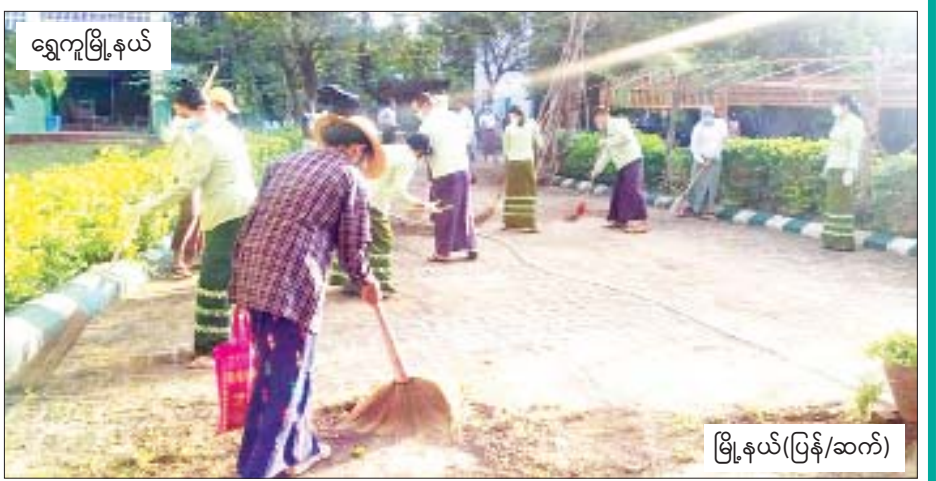
ရွှေကူမြို့နယ်