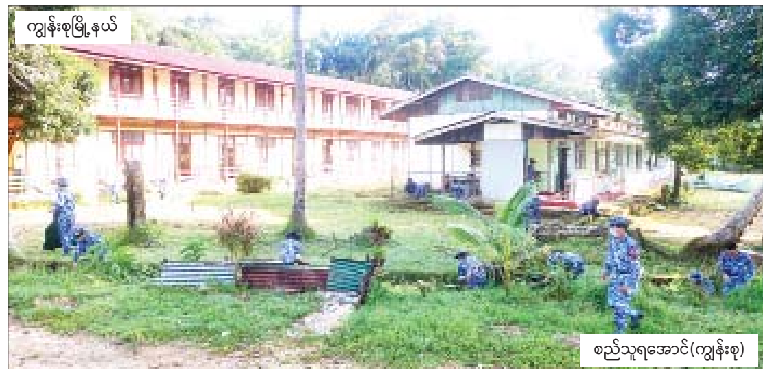
ကျွန်းစုမြို့နယ်