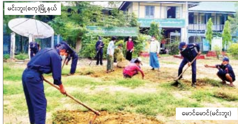
မင်းဘူး(စကျ)မြို့နယ်

နိုင်ငံဘာ ၁ ရက်မှစတင်ကာ နိုင်ငံတစ်ဝန်းရှိ အခြေခံပညာကျောင်းများ ပြန်လည်ဖွင့်လှစ်တော့မည်ဖြစ်သဖြင့် ဆရာ ဆရာမများနှင့် ကျောင်းသား ကျောင်းသူများ စိတ်အေးချမ်းသာစွာ ပညာသင်ကြား၊ သင်ယူနိုင်ရေးအတွက် ကျောင်းဝင်းအတွင်း ချို့နယ်မြက်ပင်များ ရှင်းလင်းခြင်း၊ အမှိုက်ကောက်ခြင်း၊ ရေနုတ်မြောင်းများ တူးဖော်ခြင်း၊ စာသင်ခန်းများအတွင်း သန့်ရှင်းရေးပြုလုပ်ခြင်းတို့ကို မြန်မာနိုင်ငံရဲတပ်ဖွဲ့၊ မီးသတ်တပ်ဖွဲ့၊ ကြက်ခြေနီနှင့် ပရဟိတအသင်းအဖွဲ့များ၊ ရပ်/ကျေး အုပ်ချုပ်ရေးမှူးများ၊ ကျောင်းအကျိုးတော်ဆောင်များ၊ ဆရာ ဆရာမများနှင့် နယ်မြေခံတပ်နယ်မှ တပ်မတော်သားများနှင့် မိသားစုဝင်များက စုပေါင်းဆောင်ရွက်ပေးလျက်ရှိသည်။