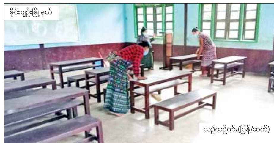
မိုင်းပျဉ်းမြို့နယ်