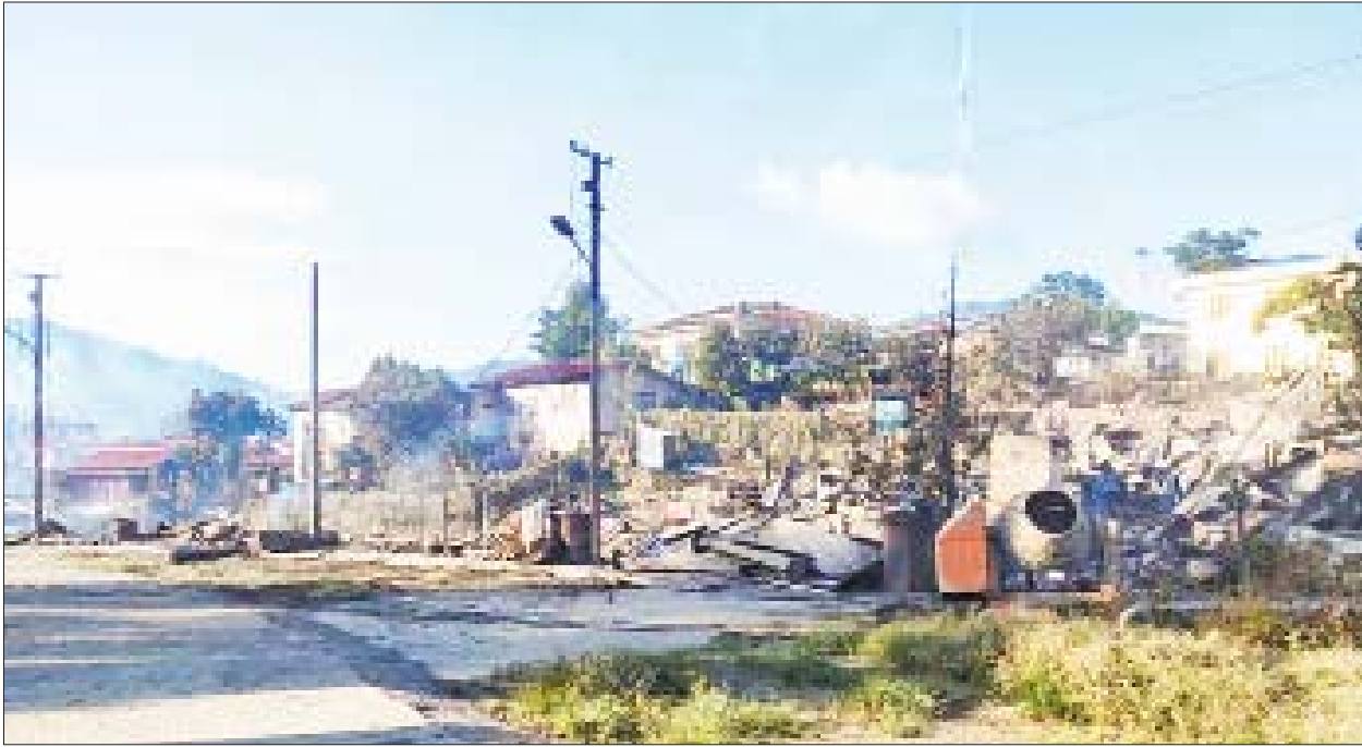
ထန်တလန်မြို့ အမှတ်(၂)ရပ်ကွက် ခရစ်ယာန်ဘုရားကျောင်း မီးလောင်မှုဖြစ်ပွားခဲ့သည့် မှတ်တမ်းဓာတ်ပုံ။