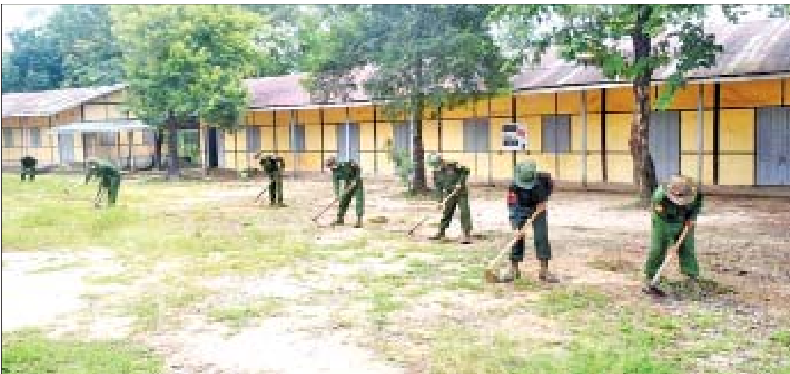
ဧရာဝတီတိုင်းဒေသကြီး ပုသိမ်မြို့ အမှတ်(၇)အခြေခံပညာအထက်တန်းကျောင်း၌ နယ်မြေခံတပ်မတော်သားများ စုပေါင်းသန့်ရှင်းရေးဆောင်ရွက်စဉ်။

ပြည်ထောင်စုသမ္မတမြန်မာနိုင်ငံတော်အစိုးရ ပညာရေးဝန်ကြီးဌာန အဆင့်မြင့်ပညာဦးစီးဌာန ကြေညာချက် ပညာရေးဝန်ကြီးဌာန၊ အဆင့်မြင့်ပညာဦးစီးဌာနရှိ တက္ကသိုလ်အသီးသီး၏ အဝေးသင်ဌာနခွဲများတွင် ဝိဇ္ဇာ၊ သိပ္ပံ အထူးပြုဘာသာရပ်များဖြင့် ၂၀၂၀ ပညာသင်နှစ်အတွက် ကျောင်းအပ်နှံရန်ကျန်ရှိသည့် အဝေးသင် ကျောင်းသား၊ ကျောင်းသူများသည် အောက်ပါအတိုင်း ကျောင်းအပ်မှတ်ပုံတင်ရန် ကြေညာအပ်ပါသည်- ပညာသင်နှစ် - ၂၀၂၀ ပညာသင်နှစ် မှတ်ပုံတင်လက်ခံမည့်နေ့ရက် - (၁-၁၁-၂၀၂၁) ရက်နေ့မှ (၉-၁၁-၂၀၂၁) ရက်နေ့အထိ (စနေ၊ တနင်္ဂနွေ ရုံးပိတ်ရက်များအပါအဝင်) စာမျက်နှာ ၉ ကော်လံ ၁ သို့ *