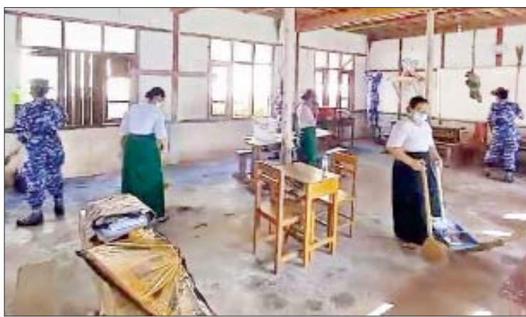
တနင်္သာရီတိုင်းဒေသကြီး ကျွန်းစုမြို့ အခြေခံပညာအထက်တန်းကျောင်း၌ တနင်္သာရီ ရဲတပ်စခန်းဌာနချုပ်မှ တပ်မတော်သားများနှင့် ဆရာမများ စုပေါင်းသန့်ရှင်းရေး ဆောင်ရွက်စဉ်။

○ တိုင်းဒေသကြီးမှ အုတ်ဖိုမြို့နှင့် ပေါင်းတည်မြို့တို့ရှိ အခြေခံပညာကျောင်းများနှင့် ပြည်သူ့ဆေးရုံများ၏ သန့်ရှင်းရေးအတွက် ယနေ့တွင် သက်ဆိုင်ရာတိုင်းစစ်ဌာနချုပ်များမှ နယ်မြေခံတပ်မတော်သားများ၊ မြန်မာနိုင်ငံရဲတပ်ဖွဲ့ဝင်များ၊ မီးသတ်တပ်ဖွဲ့ဝင်များ၊ ဌာနဆိုင်ရာဝန်ထမ်းများနှင့် ဆရာ ဆရာမများက ကျောင်းများနှင့် ဆေးရုံများရှိ ချို့နယ်ပေါင်းမြက်များ ခုတ်ထွင်ရှင်းလင်းခြင်း၊ အမှိုက်များ ရှင်းလင်းခြင်း၊ ရေစီးရေလာကောင်းမွန်စေရေး ရေနုတ်မြောင်းများ တူးဖော်ပေးခြင်းနှင့် ခြင်္သေ့အောင်းနိုင်သောနေရာများ၌ ခြင်ဆေးဖျန်းခြင်းများကို စုပေါင်းဆောင်ရွက်ပေးကြသည်။ ထိုသို့ ဆောင်ရွက်ပေးနေမှုများကို သက်ဆိုင်ရာ တိုင်းစစ်ဌာနချုပ်အသီးသီးမှ တိုင်းမှူးများနှင့် တာဝန်ရှိသူများက သည်များ ညှိနှိုင်းဆောင်ရွက်ပေးခဲ့သွားရောက်ကြည့်ရှုအားပေးပြီး လိုအပ်ကြောင်း သိရသည်။