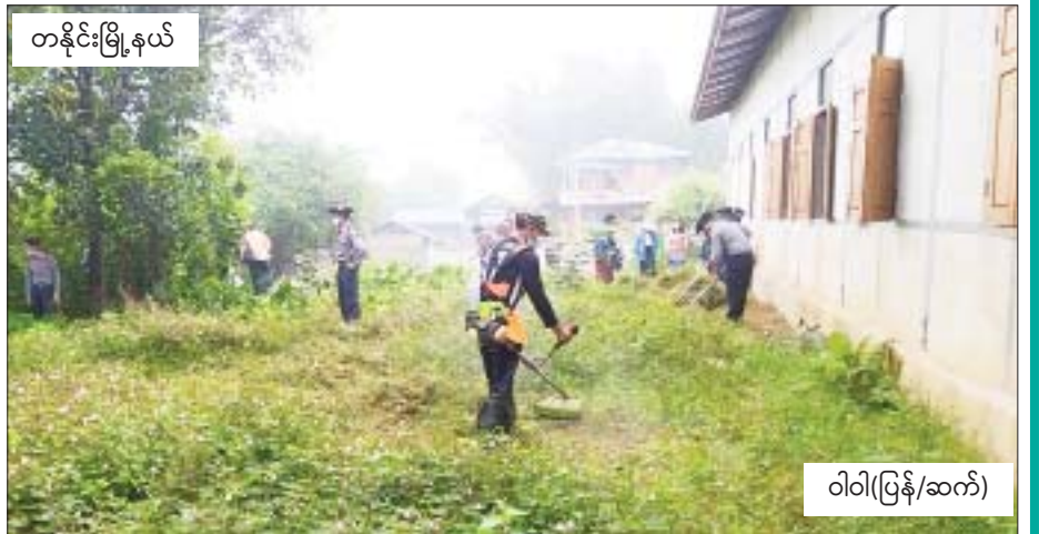
တနိုင်းမြို့နယ်