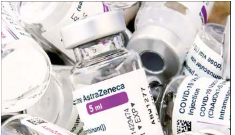
Janssen ကိုဗစ်-၁၉ ရောဂါကာကွယ်ဆေး အလုံးရေသန်း ၂၀ တို့ကို ကုလသမဂ္ဂအဖွဲ့ ၏ ကာကွယ်ဆေးဖြန့်ဖြူးရေးအစီအစဉ် COVAX သို့ လှူဒါန်းသွားမည်ဖြစ်သည်။ ကိုးကား - စီအင်န်အေ ဘာသာပြန် - အောင်ကျော်ကျော်

ထည့်ဝင်လှူဒါန်းပြီးဖြစ် ဗြိတိန်နိုင်ငံက ၂၀၂၁ ခုနှစ်အတွင်း AstraZeneca ကိုဗစ်-၁၉ ရောဂါကာကွယ် ဆေးအလုံးရေ ၃၀ ဒသမ ၆ သန်းအား ကုလသမဂ္ဂအဖွဲ့၏ ကာကွယ်ဆေးဖြန့်ဖြူး ရေးအစီအစဉ် COVAX သို့ ထည့်ဝင် လှူဒါန်းပြီးဖြစ်သည်။ ထို့ပြင် ၂၀၂၂ ခုနှစ်အတွင်း ဗြိတိန်နိုင်ငံ က AstraZeneca ကိုဗစ်-၁၉ ရောဂါ ကာကွယ်ဆေးအလုံးရေ သန်း ၂၀ နှင့်