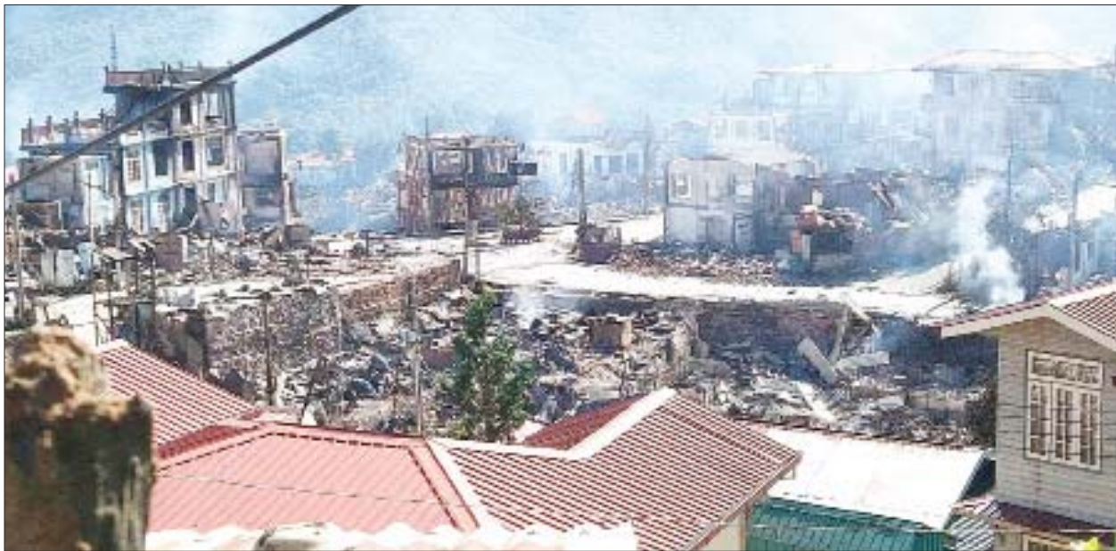
ထန်တလန်မြို့ အမှတ်(၁)ရပ်ကွက်ရှိ လူနေအဆောက်အဦများ မီးလောင်မှုဖြစ်ပွားခဲ့သည့် မှတ်တမ်းဓာတ်ပုံ။