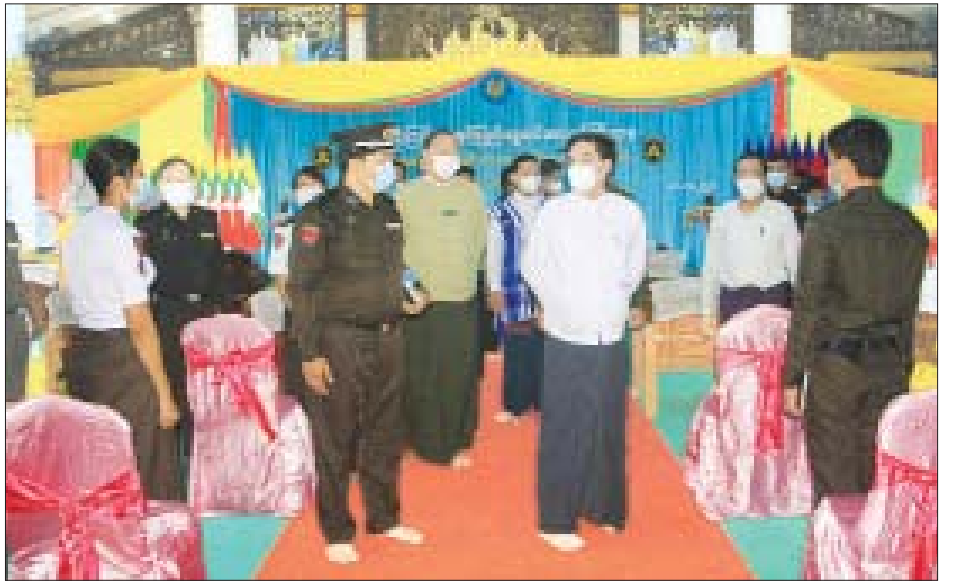
အခြေခံသင်တန်းအမှတ်စဉ်(၁/၂၀၂၁)သည် ဌာနနှင့် မျိုးဆက်သစ်များအတွက် ရည်ရွယ်၍ ဖွင့်လှစ်ခြင်း ပတ်သက်သည့် ဘာသာရပ်ဆိုင်ရာလုပ်ငန်း ဖြစ်ပြီး သင်တန်းသား သင်တန်းသူ ၁၆၄ ဦး တက် ကျွမ်းကျင်မှုရှိစေရန်အတွက် ပဲခူးတိုင်းဒေသကြီး အတွင်း ခရိုင်နှင့် မြို့နယ်များရှိ အသစ်ခန့်ဝန်ထမ်း ရောက်လျက်ရှိကြောင်းသိရသည်။ တင်စိုး(ပဲခူး)

ကတ်တစ်မျိုးမျိုးထုတ်ပေးရေးအတွက် ပန်းခင်း စီမံချက်အောင်မြင်စွာ ဆောင်ရွက်နိုင်ရေးအတွက် တိုင်းဒေသကြီး၊ ခရိုင်၊ မြို့နယ် လူဝင်မှုကြီးကြပ်ရေးနှင့် ပြည်သူ့အင်အားဝန်ကြီးဌာနမှ ဝန်ထမ်းများ ကြိုးပမ်း ဆောင်ရွက်နေကြသလို တိုင်းဒေသကြီးအတွင်းရှိ ဌာနဆိုင်ရာများမှလည်း ပိုင်းဝန်းပူးပေါင်း ဆောင်ရွက် လျက်ရှိကြောင်း၊ သင်တန်းသား သင်တန်းသူများ အနေဖြင့် သင်တန်းစည်းမျဉ်း/ စည်းကမ်းများ နှင့်အညီ လိုက်နာဆောင်ရွက်ပြီး ထမ်းဆောင်ရမည့် တာဝန်များကို ကျွမ်းကျင်ပိုင်နိုင်စွာ ဆောင်ရွက် နိုင်သည့် အခြေအနေရောက်ရှိရန် သင်တန်းမှ ဆွေးနွေးပို့ချသည့် ဘာသာရပ်များသာမက အင်္ဂလိပ်စာနှင့် ကွန်ပျူတာဘာသာရပ်များကိုလည်း စဉ်ဆက်မပြတ် ဆက်လက်လေ့လာသင်ယူသွားကြ ရန်လိုအပ်ကြောင်း ပြောကြားသည်။ လူဝင်မှုကြီးကြပ်ရေးနှင့် ပြည်သူ့အင်အားဝန်ကြီး ဌာန ပဲခူးတိုင်းဒေသကြီး ဦးစီးမှူးရုံးမှဖွင့်လှစ်သည့် အမှုထမ်းအဆင့် လုပ်ငန်းခွင်ဘာသာရပ်ဆိုင်ရာ