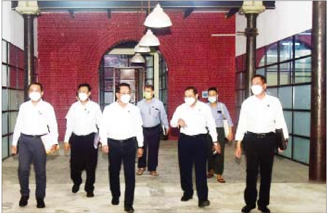
ပြည်ထောင်စုဝန်ကြီး ဦးမောင်မောင်အုန်း၊ စာဆိုဗိမာန်ဖွင့်လှစ်ဆောင်ရွက်ရန်လျာထားသည့် ရန်ကုန်မြို့ ဗိုလ်အောင်ကျော်လမ်းရှိ ပုံနှိပ်ရေးနှင့်ထုတ်ဝေရေးဦးစီးဌာနပိုင် သုံးထပ်အဆောက်အအုံ၌ ကြည့်ရှုစစ်ဆေးစဉ်။

ရန်ကုန် အောက်တိုဘာ ၃၀ ပြန်ကြားရေးဝန်ကြီးဌာန ပြည်ထောင်စုဝန်ကြီး ဦးမောင်မောင်အုန်းနှင့် ရင်းနှီးမြှုပ်နှံမှုနှင့် နိုင်ငံခြားစီးပွားဆက်သွယ်ရေးဝန်ကြီးဌာန ပြည်ထောင်စုဝန်ကြီး ဦးအောင်နိုင်ဦးတို့သည် ယမန်နေ့ညပိုင်းက ရန်ကုန်မြို့၊ မြန်မာ့အသံနှင့် ရုပ်မြင်သံကြားတွင် ပြုလုပ်သည့် အနုပညာရှင်များ တေးဂီတဖျော်ဖြေမှု ရိုက်ကူးထုတ်လွှင့်ခြင်းကို ကြည့်ရှုအားပေးပြီး အနုပညာရှင်များအား ရင်းရင်းနှီးနှီးတွေ့ဆုံနှုတ်ဆက်သည်။ ရှေးဦးစွာ ပြည်ထောင်စုဝန်ကြီးများသည် “မြူးကြွလှပ-ရောင်စုံည” ဖျော်ဖြေရေးအစီအစဉ်တွင် ပါဝင်သီဆိုကြမည့် ရုပ်ရှင်သရုပ်ဆောင်များနှင့် အဆိုတော်များ၊ တက်ရောက်အားပေးကြည့်ရှုကြမည့် လူရွှင်တော်အသင်းနှင့် ကိုလူချောအဖွဲ့၊ လူငယ်မျိုးဆက်သစ်အနုပညာရှင်များအား ရင်းရင်းနှီးနှီးတွေ့ဆုံနှုတ်ဆက်စကားပြောကြားပြီး အမှတ်တရလက်ဆောင်များ ပေးအပ်သည်။