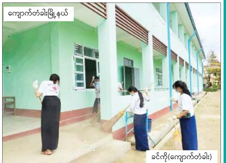
ကျောက်တံခါးမြို့နယ်