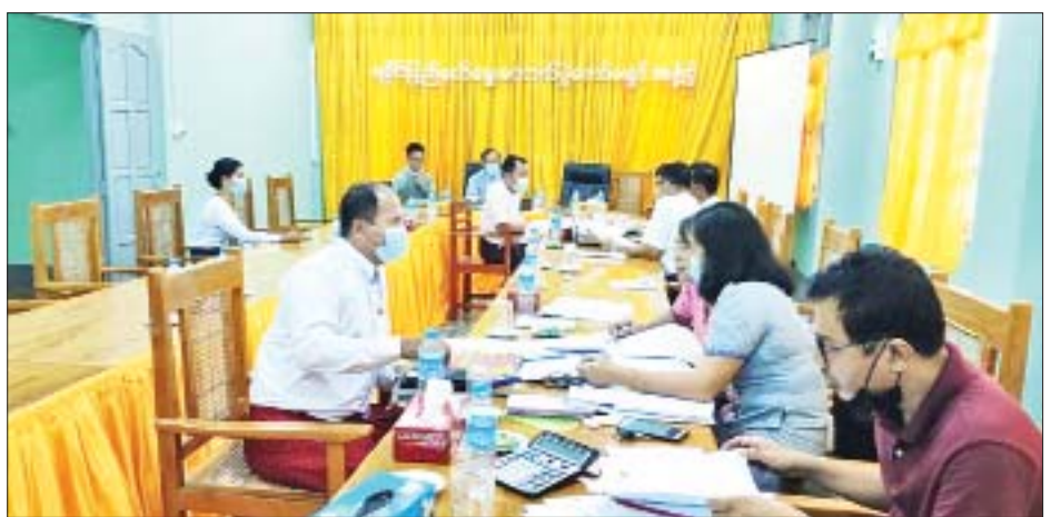
ရခိုင်အမျိုးသားပါတီအား သွားရောက်စစ်ဆေးမှု မှတ်တမ်းဓာတ်ပုံ။

ဦးစီးဌာနနှင့် အထူးစုံစမ်းစစ်ဆေးရေးဦးစီးဌာနတို့မှ ဌာနဆိုင်ရာကိုယ်စားလှယ်များ ပါဝင်သည့် စစ်ဆေးရေးအဖွဲ့ ဖြစ်ကြသော လီဆူအမျိုးသားဖွံ့ဖြိုးတိုးတက်ရေးပါတီ (ဒူးလေးပါတီ) [Lisu National Development Party ( L.N.P.D )] နှင့် ဒီမိုကရေစီပါတီသစ်(ကချင်) [New Democracy Party (Kachin)] [N.D.P (Kachin)] တို့ကို အောက်တိုဘာ ၁၁ ရက်မှ ၁၅ ရက်အထိ လည်းကောင်း၊ ပြည်ထောင်စုရွေးကောက်ပွဲကော်မရှင်အဖွဲ့ဝင် ဦးမြင့်သိန်း ဦးဆောင်ပြီး စာရင်းစစ်ချုပ်ရုံး၊ ပြည်တွင်းအခွန်များဦးစီးဌာနနှင့် အထူးစုံစမ်းစစ်ဆေးရေးဦးစီးဌာနတို့မှ ဌာနဆိုင်ရာကိုယ်စားလှယ်များပါဝင်သည့် စစ်ဆေးရေးအဖွဲ့သည် ရခိုင်ပြည်နယ်အခြေစိုက်ဖြစ်သော ရခိုင်ဦးဆောင်ပါတီ [Arakan Front Party(AFP)] ကို