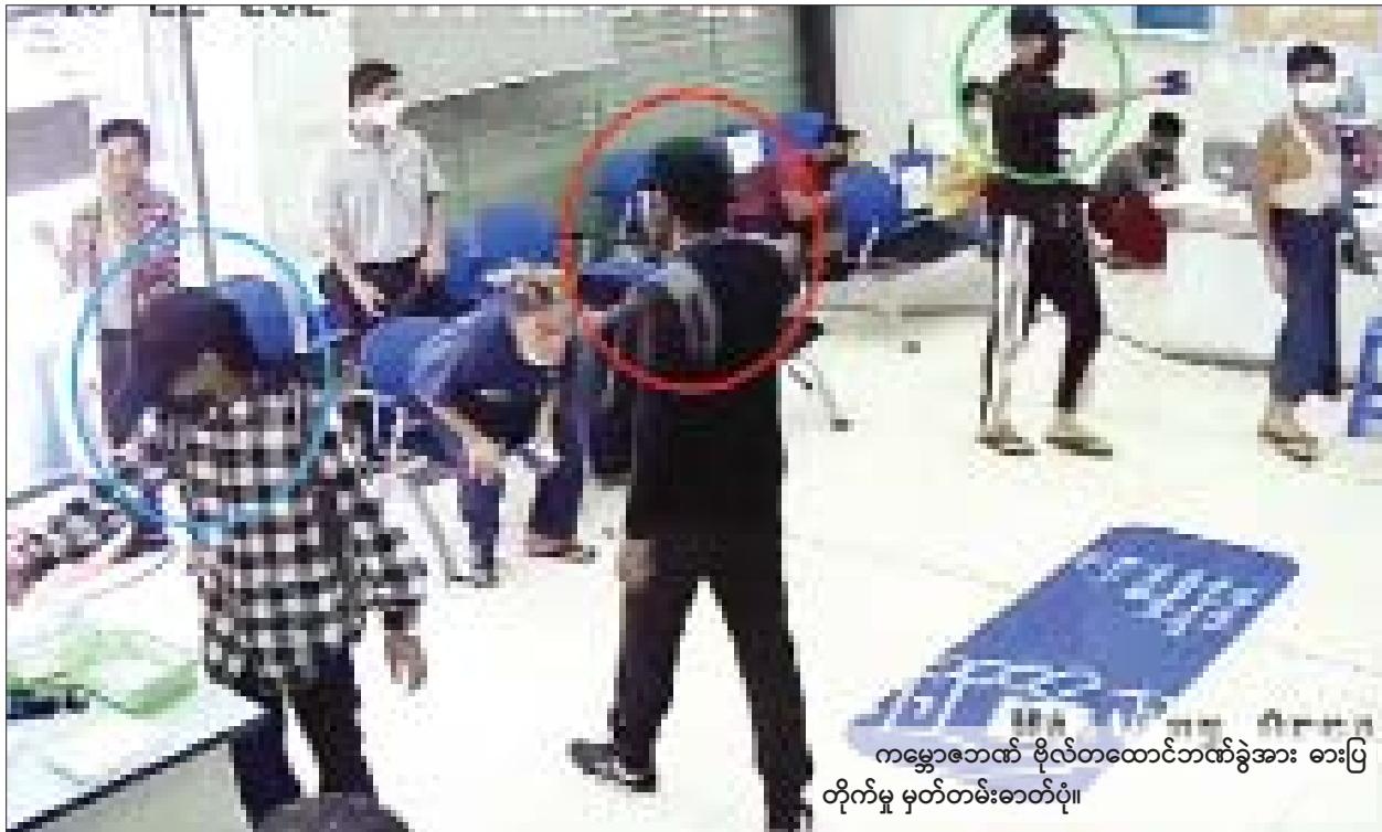
ကမ္ဘောဇဘေဏ် ဗိုလ်တထောင်ဘဏ်ခွဲအား ဓားပြ တိုက်မှု မှတ်တမ်းဓာတ်ပုံ။