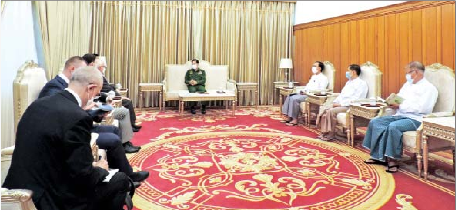
နိုင်ငံတော်စီမံအုပ်ချုပ်ရေးကောင်စီဥက္ကဋ္ဌ၊ နိုင်ငံတော်ဝန်ကြီးချုပ် ဗိုလ်ချုပ်မှူးကြီး မင်းအောင်လှိုင် ရုရှား-မြန်မာ ချစ်ကြည်ရေးနှင့် ပူးပေါင်းဆောင်ရွက်ရေးအသင်း ကိုယ်စားလှယ်အဖွဲ့အား လက်ခံတွေ့ဆုံစဉ်။

နှစ်နိုင်ငံချစ်ကြည်ရင်းနှီးမှု တိုးမြှင့်ရေးဆိုင်ရာ ကိစ္စရပ်များ၊ ပြည်တွင်း၌ လောင်စာဆီနှင့် သဘာဝဓာတ်ငွေ့များ၊ ဘီလပ်မြေနှင့် သံမဏိထုတ်လုပ်ရေး၊ ဓာတ်မြေဩဇာများ လုံလောက်စွာ ထုတ်လုပ်နိုင်ရေးအတွက် နည်းပညာနှင့်ရင်းနှီးမြှုပ်နှံမှုဆိုင်ရာများတွင် ပူးပေါင်းဆောင်ရွက်ရေး အမြင်ချင်းဖလှယ် ဆွေးနွေး