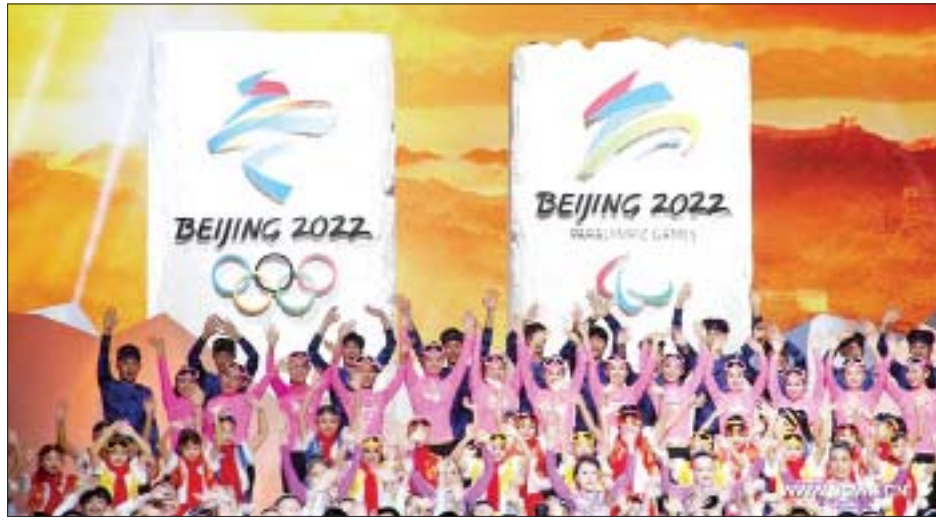
ပြိုင်ပွဲတွင်ပါဝင်မည့် အားကစားအမျိုးအစားများ၏ ယုံကြည်မှုကို ရရှိပြီးဖြစ်ကြောင်း ၎င်းက ဆိုသည်။ ထို့ပြင် ကိုဗစ်-၁၉ ရောဂါကူးစက်ပျံ့နှံ့မှုသည်

ပေကျင်း အောက်တိုဘာ ၂၇ ပေကျင်းအိုလံပစ်အားကစားပြိုင်ပွဲ ကျင်းပရေး ကော်မတီက ဆောင်းရာသီအားကစားပြိုင်ပွဲကို ကိုဗစ်-၁၉ ရောဂါစည်းမျဉ်းများနှင့်အညီ အောင်မြင်စွာကျင်းပသွားမည်ဖြစ်ကြောင်း ယနေ့ပြောကြားသည်။