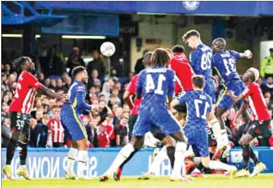
ချယ်လ်ဆီးအသင်းနှင့် ဆောက်သစ်တန်အသင်းတို့ ယှဉ်ပြိုင်ကစားကြစဉ်။

ချယ်လ်ဆီးအသင်းနဲ့ အာဆင်နယ် အသင်းတို့ဟာ အောက်တိုဘာ ၂၆ ရက်ညပိုင်းက ကာရာဘောင် ဖလား ပြိုင်ပွဲရဲ့ ၁၆ သင်းအဆင့် ပွဲစဉ်အဖြစ် ယှဉ်ပြိုင်ကစားခဲ့ရာ မှာ ပြိုင်ဘက်အသင်းအသီးသီးကို အနိုင်ရရှိခဲ့ပြီး ကာရာဘောင် ဖလားပြိုင်ပွဲရဲ့ ကွစားဖိုင်နယ် အဆင့်ကို တက်လှမ်းခွင့်ရရှိခဲ့ပြီ ဖြစ်ပါတယ်။