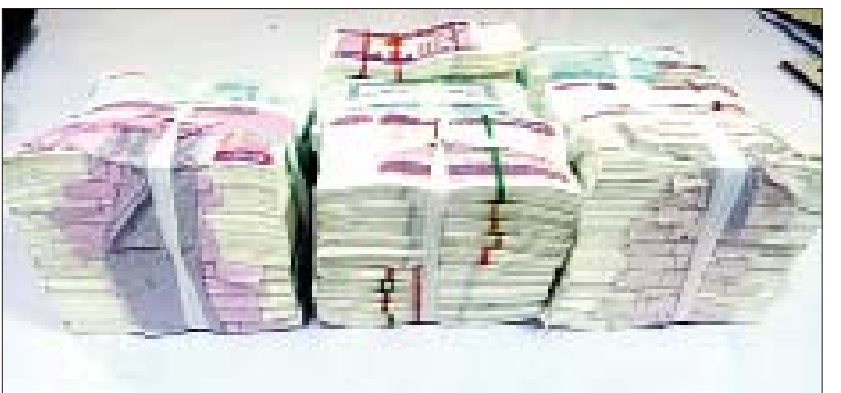
ဓာတ်လှေကားမျက်နှာကြက်မှ ပြန်လည်သိမ်းဆည်းရမိသည့် သိန်း ၄၀၀ ငွေစက္ကူများ မှတ်တမ်းဓာတ်ပုံ