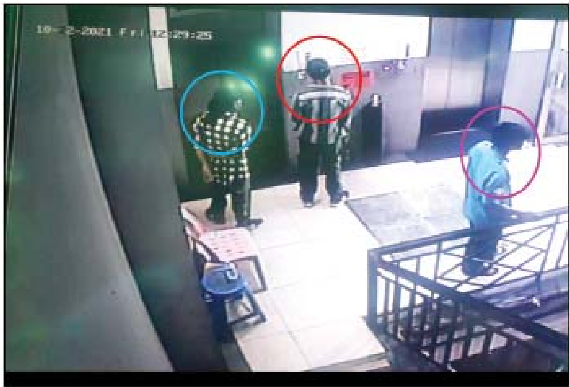
ကမ္ဘောဇဘဏ် ဗိုလ်တထောင်ဘဏ်ခွဲအား ခားပြတိုက်မီ Ocean Center ၌ စတင်စုဝေးသည့် မှတ်တမ်းဓာတ်ပုံ