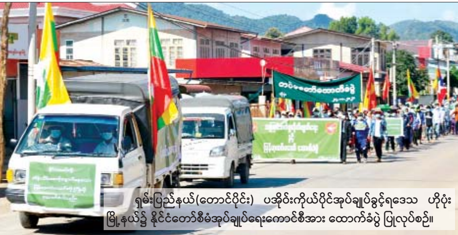
ရှမ်းပြည်နယ်(တောင်ပိုင်း) ပအိုဝ်းကိုယ်ပိုင်အုပ်ချုပ်ခွင့်ရဒေသ ဟိုပုံး မြို့နယ်၌ နိုင်ငံတော်စီမံအုပ်ချုပ်ရေးကောင်စီအား ထောက်ခံပွဲ ပြုလုပ်စဉ်။

ကမ္ဘာ့အပူချိန် လျော့ချဖို့ အိုဇုန်းလွှာ ကာကွယ်မှုနဲ့အတူ ဆက်လက်ဆောင်ရွက်စို့