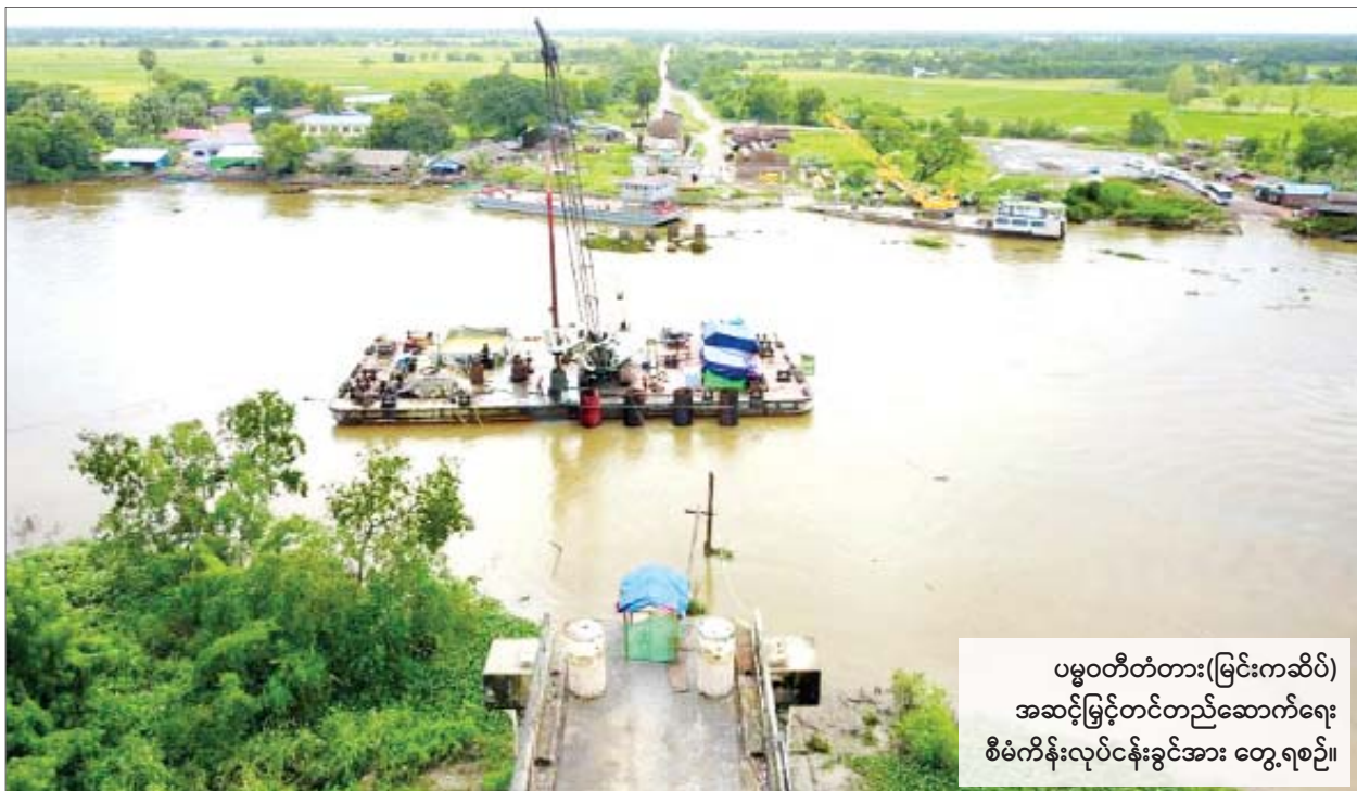
ပမ္မဝတီတံတား(မြင်းကဆိပ်) အဆင့်မြှင့်တင်တည်ဆောက်ရေး စီမံကိန်းလုပ်ငန်းခွင်အား တွေ့ရစဉ်။

အဖွဲ့ဝင် နိုင်ငံအားလုံး၏ လွတ်လပ်မှု၊ အချုပ်အခြာအာဏာပိုင်ဆိုင်မှု၊ တန်းတူရည်တူရှိမှု၊ နယ်မြေတည်တံ့ခိုင်မြဲမှုနှင့် အမျိုးသားရေး လက္ခဏာများကို လေးစားလိုက်နာရန်” နှင့် အပိုဒ်-၅ တွင်ပါရှိသည့် “အဖွဲ့ဝင်နိုင်ငံများသည် တူညီသည့်အခွင့်အရေးနှင့် တာဝန်များရှိရမည်” ဆိုသည့် ပြဋ္ဌာန်းချက်များနှင့် ကိုက်ညီမှုမရှိပါ။ စာမျက်နှာ ၃ ကော်လံ ၁ သို့ ❖