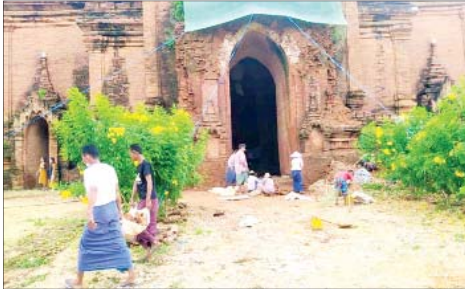
“သက်ဆိုင်ရာဝန်ကြီးဌာနကို တင်ပြပြီး ထိခိုက်ပျက်စီးသွားတဲ့ ပုဂံကဘုရား၊ စေတီတွေကို ရှေးမူပျက်ပြန်လည်ပြုပြင်နေပါတယ်။ မိုးများတဲ့

ညောင်ဦး အောက်တိုဘာ ၂၆ အောက်တိုဘာလတတိယပတ်က နှစ်ရက်ဆက်တိုက် ရွာသွန်းခဲ့သောမိုးကြောင့် ပုဂံယဉ်ကျေးမှုနယ်မြေရှိ စေတီပုထိုး ၂၀ ခန့် ပျက်စီးခဲ့ရာ အဆိုပါ ပျက်စီးမှုများကို ရှေးမူပျက် အချိန်မီပြုပြင်နေကြောင်း ပုဂံ ရှေးဟောင်းသုတေသနနှင့် အမျိုးသားပြတိုက်ဦးစီးဌာနမှ သိရသည်။