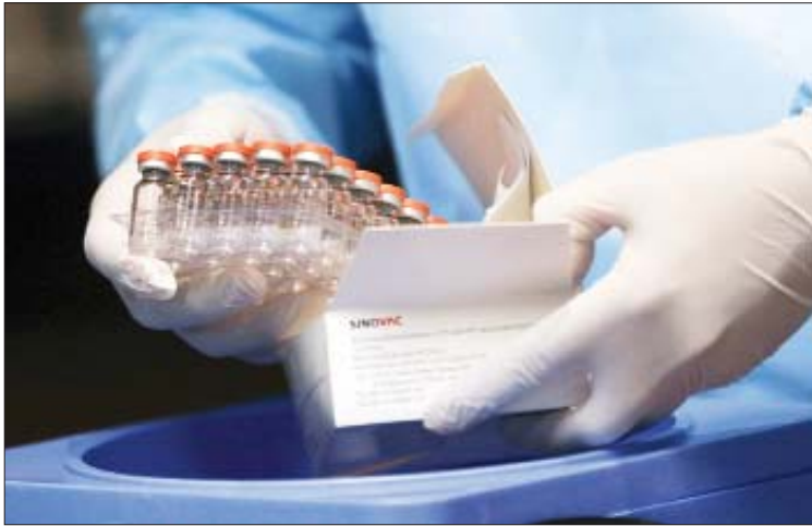
အလုံးရေ ၄၅၈၇၉၆၀၇ လုံးအထိ အသုံးပြု သေဆုံးသူစုစုပေါင်း ၁၂၇၀၆၇ ဦးရှိ ပြီးဖြစ်ကြောင်းလည်း သိရသည်။ ကမ္ဘာ့ဒီးယားနိုင်ငံ၌ ကိုဗစ်-၁၉ ရောဂါ ကူးစက်ခံရသူစုစုပေါင်း ၄၉၉၁၀၅၀ ရှိကြောင်းနှင့် ကိုဗစ်-၁၉ ရောဂါကြောင့် သေဆုံးသူစုစုပေါင်း ၁၂၇၀၆၇ ဦးရှိ ကြောင်း သိရသည်။ ကိုးကား - ဆင်ဟွာ ဘာသာပြန် - အလင်းသစ်

ဖနောင်ပင် အောက်တိုဘာ ၂၆ ကမ္ဘာ့ဒီးယားနိုင်ငံသည် တရုတ်နိုင်ငံ Sinovac Biotech ဆေးဝါးကုမ္ပဏီက ထုတ်လုပ်သည့် Sinovac ကိုဗစ်-၁၉ ရောဂါ ကာကွယ်ဆေးများကို ထပ်မံလက်ခံရရှိခဲ့ကြောင်း ကမ္ဘာ့ဒီးယားနိုင်ငံ၏ ကျန်းမာရေးနှင့် လူမှုကာကွယ်ရေးဝန်ကြီးဌာနက ယမန်နေ့တွင် ကြေညာသည်။ အဆိုပါ ကိုဗစ်-၁၉ ရောဂါ ကာကွယ်ဆေးများသည် ကမ္ဘာ့ကျန်းမာရေးအဖွဲ့က ဦးဆောင်သည့် ကိုဗစ်-၁၉ ရောဂါ ကာကွယ်ဆေး ဖြန့်ဖြူးရေးအစီအစဉ် COVAX ထံမှတစ်ဆင့် လက်ခံရရှိခဲ့ခြင်း ဖြစ်ကြောင်း ကမ္ဘာ့ဒီးယားနိုင်ငံ၏ ကျန်းမာရေးနှင့် လူမှုကာကွယ်ရေးဝန်ကြီးဌာနက ပြောကြားသည်။ လက်ရှိတွင် ကမ္ဘာ့ဒီးယားနိုင်ငံသည် ကိုဗစ်-၁၉ ရောဂါ ကာကွယ်ဆေး