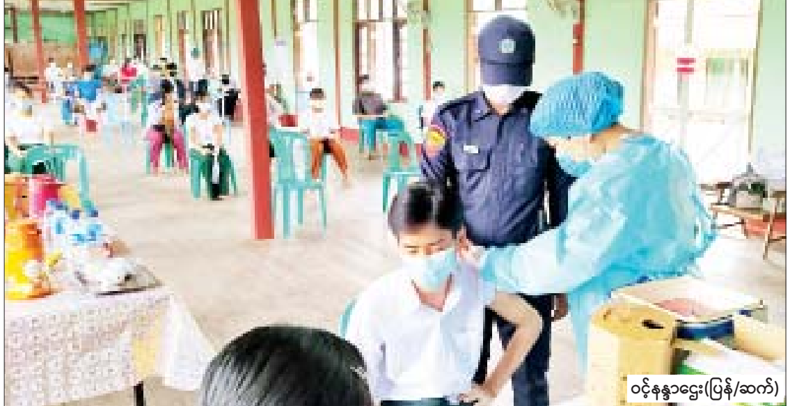
ဝင့်နန္ဒာဌေး(ပြန်/ဆက်)

ကျောင်းသူတွေကို ဦးစားပေးထိုးနှံပေးမှာ ဖြစ်ပါတယ်။