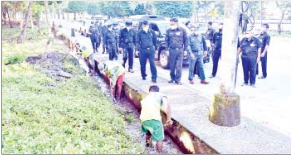
မှာကြားသည်။ အစားထိုးအသုံးပြု ပန်းဥယျာဉ်နှင့် အားကစားကွင်းများဌာနသည်

ရန်ကုန် အောက်တိုဘာ ၂၆ ရန်ကုန်တိုင်းဒေသကြီး စည်ပင်သာယာရေးဝန်ကြီး၊ ရန်ကုန်မြို့တော် စည်ပင်သာယာရေးကော်မတီ ဥက္ကဋ္ဌ (မြို့တော်ဝန်) ဦးစိုလ်ဌေးသည် ဒုတိယမြို့တော်ဝန်၊ ကော်မတီဝင်များ၊ တာဝန်ရှိသူများနှင့်အတူ ယနေ့နံနက်ပိုင်းတွင် မရမ်းကုန်းမြို့နယ် (၅) ရပ်ကွက် စွယ်တော်မြတ်စေတီလမ်းသို့သွားရောက်၍ လမ်းဘေးဝဲ/ယာ အုပ်စိုးကိုင်များ ခုတ်ထွင် ရှင်းလင်းနေမှု မြက်ပင်ချုံနှယ်များ ရှင်းလင်းဆောင်ရွက်နေမှု၊ လမ်းဘေးရေမြောင်းများ ရေစီးရေလာကောင်းမွန်စေရန် အမှိုက်များ မြောင်းချေးများ ဆယ်ယူရှင်းလင်းဆောင်ရွက်နေမှု ကိုလည်းကောင်း၊ ဒဂုံမြို့နယ် ပြည်သူ့ရင်ပြင်နှင့် ပြည်သူ့ဥယျာဉ်ရှိ ပန်းဥယျာဉ်နှင့် အားကစားကွင်းများဌာနက ဆောင်ရွက်နေသော EM Bokashi မြေဩဇာထုတ်လုပ်ခြင်းကို လည်းကောင်း ကြည့်ရှုစစ်ဆေးပြီး လိုအပ်သည်များ