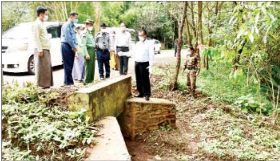
ရေလာ ကောင်းမွန်ရေးအတွက် ဆောင်ရွက်နေသော ရေဝင်မြောင်းများ ပြုပြင်ဆောင်ရွက်နေမှု၊ ပိတ်ဆို့ နေသော ရေမြောင်းများအား မီးသတ်ရေယာဉ်များ အသုံးပြု၍ ရေအားဖြင့် မြေသားနှင့် အမှိုက်များ

မန္တလေး အောက်တိုဘာ ၂၆ မန္တလေးတိုင်းဒေသကြီး ဝန်ကြီးချုပ် ဦးမောင်ကိုသည် တိုင်းဒေသကြီး ဝန်ကြီးများနှင့်အတူ ယမန်နေ့ နံနက်ပိုင်းတွင် ပြင်ဦးလွင်မြို့နယ် မြန်မာနိုင်ငံ သစ်တောသစ်တန်းကျောင်း ကျွန်းရတနာခန်းမ၌ ပြင်ဦးလွင်မြို့နယ်အတွင်းရှိ ကော်ဖီခြံများ ကွင်းဆင်းစစ်ဆေးရေးကော်မတီမှ တာဝန်ရှိသူများ နှင့်တွေ့ဆုံရာ တာဝန်ရှိသူများက ကော်ဖီလုပ်ကွက် ချထားပေးခြင်းများအပေါ် ကွင်းဆင်းစစ်ဆေးတွေ့ ရှိချက်များ၊ လုပ်ငန်းဆောင်ရွက်နေမှုများ၊ ကော်ဖီပင် များနှင့် အရိပ်ရပင်များ စိုက်ပျိုးပြီးစီးမှုနှင့် မျိုးကောင်း မျိုးသန့်ရရှိရေး ဆောင်ရွက်ပေးနိုင်မည့် အစီအစဉ် များနှင့်ပတ်သက်၍ ရှင်းလင်းတင်ပြကြရာ တိုင်းဒေသကြီး ဝန်ကြီးချုပ်က လိုအပ်သည်များ ညှိနှိုင်းဆောင်ရွက်ပေးခဲ့သည်။