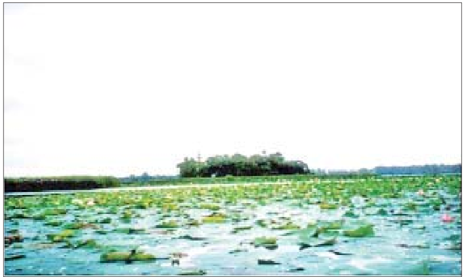
ဝက်သည်းကန် ဘေးမဲ့တော (ဓာတ်ပုံ-၂၀၀၂)

အချုပ်အားဖြင့်ဆိုသော် အချို့သယံဇာတပစ္စည်းများ လေ၊ ရေ၊ အစားအစာ စသည်တို့သည် အစားထိုးအသစ်တစ်ဖန် ပြန်လည်ရရှိနိုင်သော်လည်း ကျောက်မီးသွေး၊ ရေနံ၊ သဘာဝဓာတ်ငွေ့နှင့် လောင်စာဆီ စသည့်သယံဇာတပစ္စည်းများမှာ ပြန်လည်ဖြစ်ပေါ်နိုင်စွမ်းမရှိကြပေ။ စာမျက်နှာ ၇ သို့ ☆