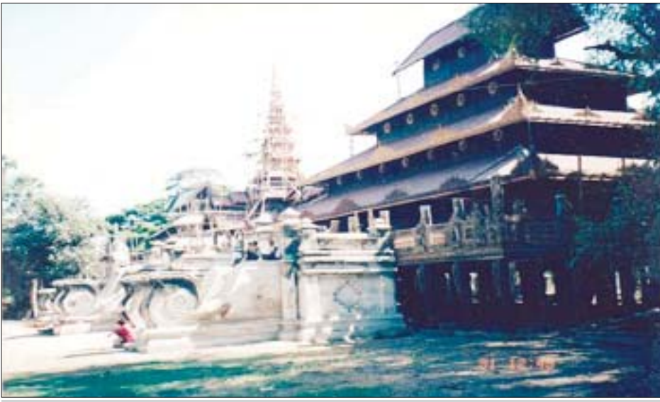
ရုပ်စုံကျောင်း (ဓာတ်ပုံ- ၂၀၀၄)

သဘာဝအရင်းအမြစ်များ (natural resources) များအား ထိန်းသိမ်းကာကွယ်ခြင်းသည် မြန်မာနိုင်ငံတွင် အစိုးရမူဝါဒ၏လုပ်ငန်းတစ်ခုအဖြစ် ရှိနေသည်မှာ ရာစုနှစ်တစ်ခုနီးပါးဖြစ်ပါသည်။ မြန်မာနိုင်ငံတွင် ပထမဦးဆုံးသော သဘာဝနယ်မြေကို ၁၉၂၀ ပြည့်နှစ်တွင် တည်ထောင်ခဲ့ပါသည်။ စနစ်သစ် ထိန်းသိမ်းကာကွယ်ခြင်းသည် ၁၉၈၀ ပြည့်နှစ်များ အစောပိုင်းကာလတွင် အစပြုခဲ့ပါသည်။ တည်ထောင်ပြီးသဘာဝနယ်မြေ ၃၉ ခုအနက် ခုနစ်ခုသည် အာဆီယံအမွေအနှစ်ဥယျာဉ် (ASEAN Heritage Parks - AHPs) များအဖြစ် သတ်မှတ်ခံထားရပါသည်။ အာဆီယံအမွေအနှစ်ဥယျာဉ်များသည် အာဆီယံနိုင်ငံများတွင် ဇီဝမျိုးစုံမျိုးကွဲတန်ဖိုး သို့မဟုတ် ထူးခြားမှုအရ အသိအမှတ်ပြုခံရခြင်းဖြစ်ပြီး ခါကာဘိုရာဇီအမျိုးသားဥယျာဉ်၊ အင်းတော်ကြီးကန် တောရိုင်းတိရစ္ဆာန်ဘေးမဲ့တော၊ အလောင်းတော်ကသပ အမျိုးသားဥယျာဉ်၊ အင်းလေးကန်