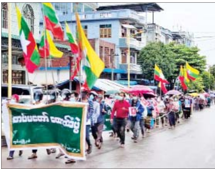
ကွမ်းလုံမြို့၌ တပ်မတော်ထောက်ခံပွဲ ပြုလုပ်စဉ်။

နေပြည်တော် အောက်တိုဘာ ၂၆ ၂၀၀၈ ခုနှစ် ဖွဲ့စည်းပုံအခြေခံဥပဒေနှင့် အညီ ဆောင်ရွက်လျက်ရှိသည့် နိုင်ငံတော် စီမံအုပ်ချုပ်ရေးကောင်စီအား ထောက်ခံပွဲ ကို ယနေ့တွင် ရှမ်းပြည်နယ် (မြောက်ပိုင်း) ကွမ်းလုံမြို့၊ လောက်ကိုင်မြို့နှင့် မိုင်းရယ် မြို့တို့၌လည်းကောင်း၊ ရှမ်းပြည်နယ် (တောင်ပိုင်း) ရပ်စောက်မြို့နယ်နှင့် လွိုင်လင်မြို့တို့၌ လည်းကောင်း၊ ရှမ်းပြည်နယ်(အရှေ့ပိုင်း) မိုင်းတုံမြို့၌ လည်းကောင်း၊ တနင်္သာရီတိုင်းဒေသကြီး ထားဝယ်မြို့နှင့် မြိတ်မြို့တို့၌လည်းကောင်း၊ ဧရာဝတီတိုင်းဒေသကြီး ပုသိမ်မြို့၌ လည်းကောင်း၊ ရခိုင်ပြည်နယ် တောင်ကုတ် မြို့၊ ကျောက်ဖြူမြို့နှင့် ဝှံမြို့တို့၌ လည်းကောင်း၊ စစ်ကိုင်းတိုင်းဒေသကြီး မော်လိုက်မြို့၌လည်းကောင်း၊ ပဲခူးတိုင်း ဒေသကြီး ရေတာရှည်မြို့၊ အုတ်တွင်းမြို့၊ ပေါက်ခေါင်းမြို့တို့၌ လည်းကောင်း ပြုလုပ်ကြပြီး ဆန္ဒဖော်ထုတ်ခဲ့ကြ သည်။