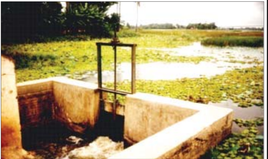
ဝက်သည်းကန်ဘေးမဲ့တော ရေသွင်း/ ရေထုတ်ပေါက် (ဓာတ်ပုံ- ၂၀၀၂)