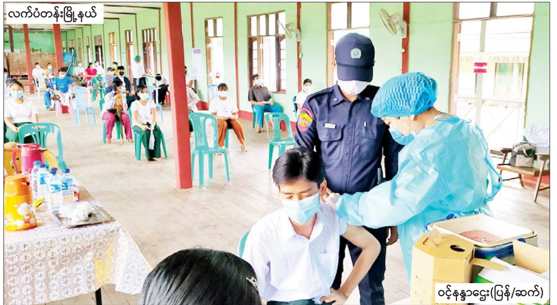
လက်ပံတန်းမြို့နယ်