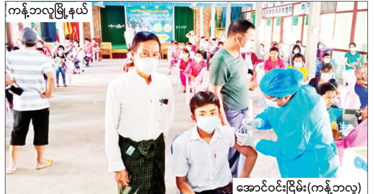
ကန်ဘလူမြို့နယ်