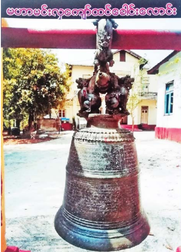
မဟာမင်းလှကျော်ထင်ခေါင်းလောင်း

မြန်မာတို့သည် ခေါင်းလောင်းထိုး၍ အမျှဝေလေ့ရှိသည်။ ခေါင်းလောင်းသွန်းလုပ်ခြင်းကို လွန်ခဲ့သောနှစ်ပေါင်းလေးထောင်လောက်က တရုတ်နိုင်ငံတွင် စတင်သည်ဆို၏။ မြန်မာနိုင်ငံတွင်မူ မှတ်တမ်းများအရ ကွမ်းခြံကုန်းမြို့နယ် လက်ခိုက်ကျေးရွာရှိ မြန်မာသက္ကရာဇ် ၈၀၀ ပြည့်နှစ်ထိုးခေါင်းလောင်းက အစောဆုံးဖြစ်မည်ထင်သည်။ ဒုတိယအစောဆုံးမှာ မော်လမြိုင်မြို့ မြသိန်းတန်စေတီရှိ သက္ကရာဇ် ၈၉၉ ခုနှစ်ထိုးခေါင်းလောင်းဖြစ်ပြီး ဘုရင့်နောင်ခေါင်းလောင်းသည် တတိယအစောဆုံးဖြစ်ကြောင်း ပညာရှင်များက ဆိုပါသည်။ ကမ္ဘာ့သိရှေးဟောင်းအနီး ပြိုင်းထောင်ကျေးရွာမှ တွေ့ရှိရသည့် အမြင့်ပေ ၁၁ ဒသမ ၈ စင်တီမီတာရှိသော ကြေးခေါင်းလောင်းဟု ဆိုပါသည်။ ခေါင်းလောင်းစာကို လေ့လာရခြင်းအားဖြင့် ထိုခေတ်ကာလက မြန်မာအက္ခရာအရေးအသား (မူရင်းအရေးအသား) နှင့် ကြေးသွန်းအတတ်ပညာ (ပန်းတည်းမြန်မာမှုအနုပညာ) အဆင့်အတန်းကို ဂုဏ်ယူဖွယ်တွေ့မြင်နိုင်ပါသည်။