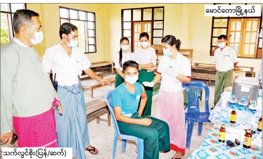
မောင်တောမြို့နယ်