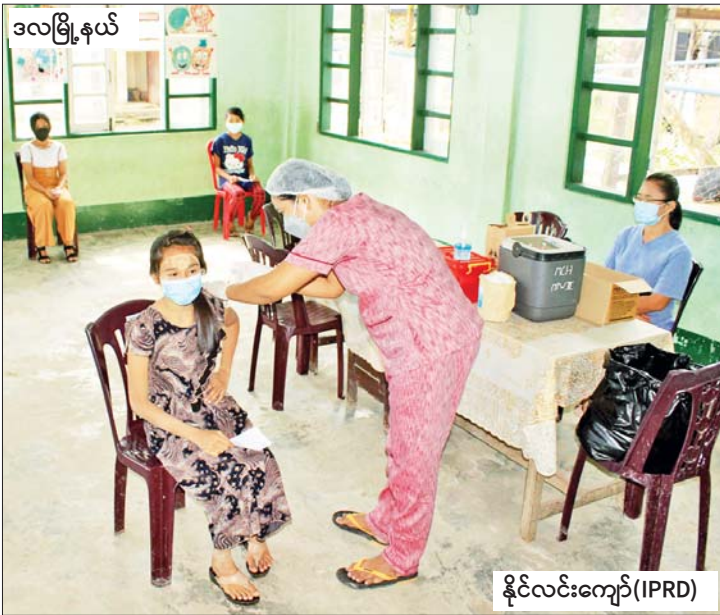
ဒလမြို့နယ်