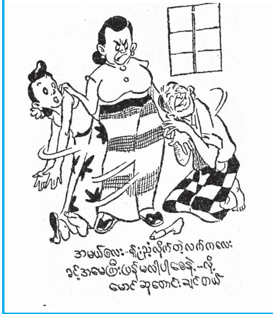
အမယ်စေး-နို့ညှပ်လိုက်တဲ့လက်ကလေး ခင်အမေကြီးဖြင့်မလျှီပါစေနဲ့-လို့ မောင်ဆုစောင်ချင်တယ်

ဆရာကြီး ကာတွန်းမောင်စိန်၏ ကာတွန်းလက်ရာများကို မူရင်းအတိုင်း ဖော်ပြပါသည်။ စာတည်း