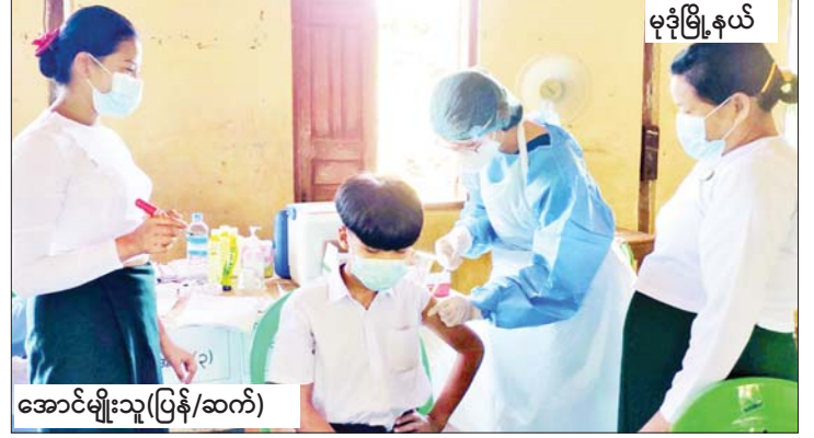
မုဒုံမြို့နယ်