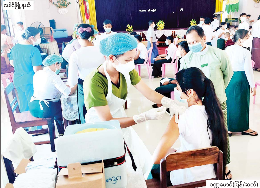
ပေါင်မြို့နယ်