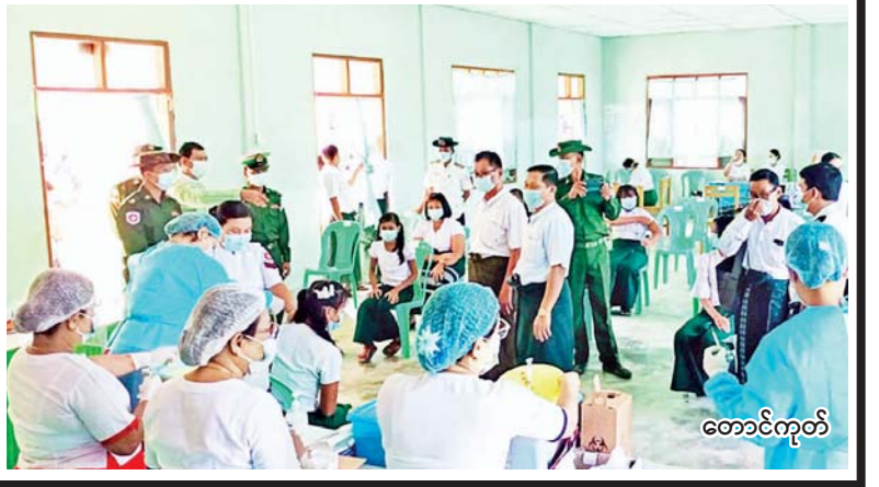
တောင်ကုတ်

တောင်ကုတ် ရခိုင်ပြည်နယ် တောင်ကုတ်မြို့ အခြေခံပညာကျောင်းများ၌ ကိုဗစ်-၁၉ ရောဂါကာကွယ် ထိန်းချုပ်နိုင်ရေးအတွက် ကိုဗစ်-၁၉ ရောဂါကာကွယ်ဆေးကို အသက် ၁၂ နှစ်နှင့် အထက် ကျောင်းသား ကျောင်းသူများအား အောက်တိုဘာ ၂၃ ရက် နံနက် ၈ နာရီခွဲမှစ၍ ကံပိုင်ရပ်ကွက် အထက(၃) ကျောင်းခန်းမ၌ ဆက်လက်ထိုးနှံပေးလျက်ရှိပါသည်။ ထိုသို့ အခြေခံပညာကျောင်းများ၌ စတင်ထိုးနှံပေးလျက်ရှိရာ အထက(၃) ၂၉၇ ဦး၊ အထက (မအီ) ၁၀၀၂ ဦး၊ အထက (ခွဲ) သက္ကယ်ကျွန်း ၃၉၃ ဦး၊ အလယ်တန်းအဆင့်မှ အထက်တန်းအဆင့်ထိ စုစုပေါင်း ၁၆၀၄ ဦးအား ကိုဗစ်-၁၉ ရောဂါကာကွယ်ဆေး ပထမ အကြိမ်ထိုးနှံပေးလျက်ရှိကြောင်း သိရသည်။