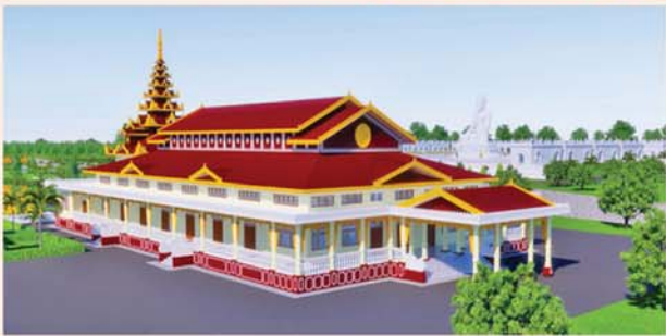
ဓမ္မာရုံ(၂၀၃x၉၀)ပေ ၁ လုံး-၈၇၃၀ သိန်း