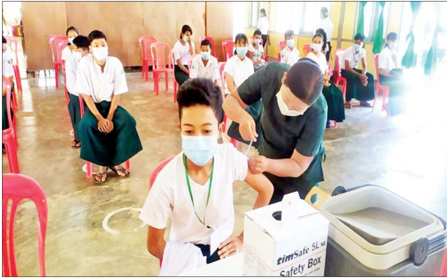
ပုသိမ်မြို့၌ ကျောင်းသား ကျောင်းသူများအား ကိုဗစ်-၁၉ ရောဂါကာကွယ်ဆေး ထိုးနှံပေးနေစဉ်။

အစောဆုံးထိုးနှံပေးတဲ့ နိုင်ငံတွေအထဲမှာ တရုတ်နိုင်ငံနဲ့ ကျူးဘားနိုင်ငံပါပါတယ်။ ကျူးဘား နိုင်ငံဆိုရင် ဩဂုတ်လအတွင်းမှာ Soberana-02 ဆိုတဲ့ဆေးကို ကလေးအသက် နှစ်နှစ်လောက် အထိကို စပြီးထိုးနှံပေးပါတယ်။ ဒီဆေးကို ကျူးဘား နိုင်ငံအနေနဲ့ အသုံးပြုဖို့ အသိအမှတ်ပြုထားပြီး သူ့နိုင်ငံမှာပဲ စတင်ထိုးနှံပေးတာ ဖြစ်ပါတယ်။ 'ဒယ်လီတာ' ဗိုင်းရပ်စ် မျိုးကွဲကြောင့် ကျူးဘား နိုင်ငံရှိ ကလေးတွေကြားမှာ ရောဂါဖြစ်ပွားမှုတွေ မြင့်တက်လာတဲ့အတွက် ဖြစ်တယ်လို့ သိရပါတယ်။ ဒီလိုပဲ ချီလီနိုင်ငံ၊ တရုတ်ပြည်သူ့သမ္မတနိုင်ငံ၊ အယ်လ်ဆာဘေးရီးနိုင်ငံ၊ ယူအေအီးနိုင်ငံတွေမှာ ကလေးတွေကို စတင်ပြီး ကာကွယ်ဆေးထိုးနှံပေး နေပြီလို့ သိရှိရပါတယ်။ ချီလီနိုင်ငံမှာဆိုရင် အသက် ခြောက်နှစ်အထက် ကလေးတွေကို Sinovac