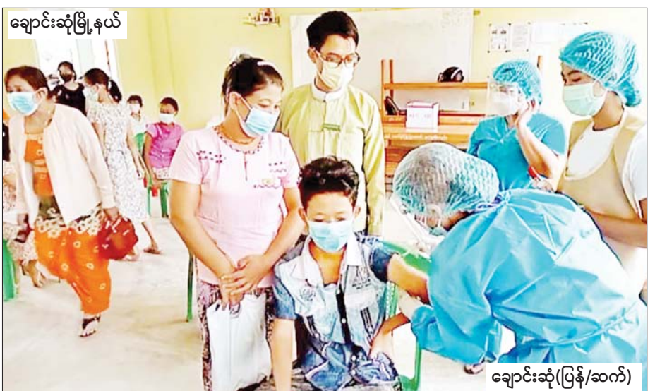
ချောင်းဆုံမြို့နယ်