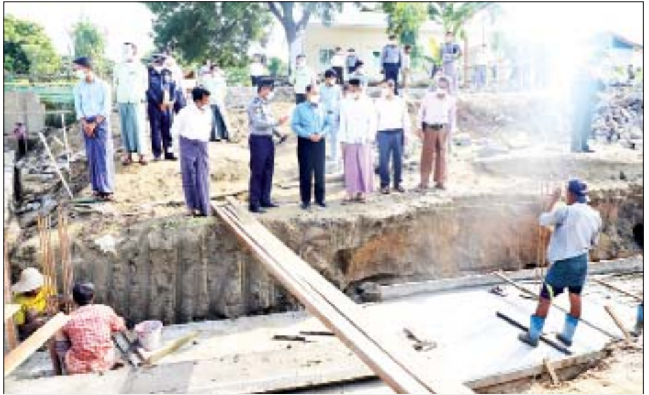
အနီးရှိ ဦးမွေးမြူရေးဇုန်အဝင်လမ်း အရှည်ပေ ၅၀၀၊ အကျယ် ၁၆ ပေ၊ ဒုကိုးလက်မ ကွန်ကရစ်လမ်း ခင်းကျင်းနေမှုတို့ကိုလည်းကောင်း ကြည့်ရှုစစ်ဆေး ကာ လိုအပ်သည်များကို ဖြည့်ဆည်းဆောင်ရွက်ပေး ခဲ့ကြောင်း သိရသည်။ တိုင်းဒေသကြီး (ပြန်/ဆက်)

ဆက်လက်၍ တိုင်းဒေသကြီး ဝန်ကြီးချုပ်နှင့် တာဝန်ရှိသူများသည် ရေကြောင်းရဲတပ်ဖွဲ့ခွဲ (မုံရွာ) ရုံးအနီး၌ ဆောင်ရွက်လျက်ရှိသည့် ချင်းတွင်းမြစ် ကမ်းပြိုကာကွယ်ရေးလုပ်ငန်း ရေထိန်းတာပေါင် တည်ဆောက်နေမှုနှင့် တည်ဆောက်ရေးပစ္စည်းများ အရည်အသွေးပြည့်မီ စေရေးတို့ကိုလည်းကောင်း မုံရွာမြို့ ကျောက်စစ်ပုံ ကျေးရွာအနီးရှိ အလျားပေ ၅၀၊ အနံပေ ၃၀ ဥစားကြက်မွေးမြူရေးဇုန် ရှင်းလင်းဆောင် ပြုပြင်နေမှုတို့ကိုလည်းကောင်း၊ ဥစားကြက် မွေးမြူရေးဇုန် အဝင်လမ်းအရှည် ပေ ၁၀၀၀ အား အကျယ် ၁၆ ပေ၊ ဒုကိုးလက်မ ကွန်ကရစ်လမ်း ခင်းကျင်းနေမှုတို့ကိုလည်းကောင်း၊ ရှားပြေးကျေးရွာ