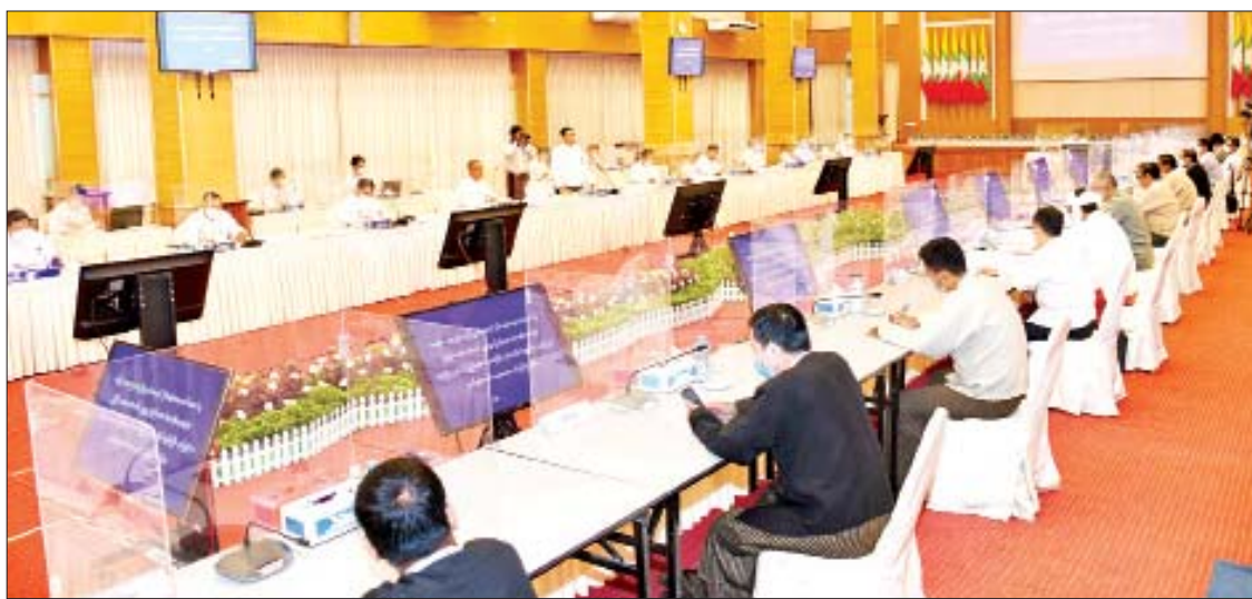
ညီညွတ်ရေးနှင့် ငြိမ်းချမ်းရေးဖော်ဆောင် မှု ညှိနှိုင်းရေးကော်မတီဥက္ကဋ္ဌ ပြည်ထောင်စု ဝန်ကြီး ဒုတိယဗိုလ်ချုပ်ကြီးရာပြည့်နှင့် နိုင်ငံရေးပါတီများကိုယ်စား မြန်မာ အမှာစကား ပြောကြားကြသည်။ အမျိုးသားကွန်ဂရက်ပါတီ ဥက္ကဋ္ဌ ထိုနောက် ညှိနှိုင်းရေးကော်မတီ ဦးကောင်းမြင့်ထွဋ်တို့က နှုတ်ခွန်းဆက် အတွင်းရေးမှူး ဒုတိယဗိုလ်ချုပ်ကြီး

နေပြည်တော် အောက်တိုဘာ ၂၃ အမျိုးသား စည်းလုံးညီညွတ်ရေးနှင့် ငြိမ်းချမ်းရေးဖော်ဆောင်မှု ညှိနှိုင်းရေး ကော်မတီ (NSPC) နှင့် နိုင်ငံရေးပါတီများ တွေ့ဆုံဆွေးနွေးပွဲကို ယနေ့နံနက်ပိုင်းက နေပြည်တော်ရှိ အမျိုးသားစည်းလုံးညီညွတ် ရေးနှင့် ငြိမ်းချမ်းရေးဖော်ဆောင်မှု ဗဟို ဌာန အစည်းအဝေးခန်းမ၌ ကျင်းပသည်။ အစည်းအဝေးသို့ အမျိုးသားစည်းလုံး ညီညွတ်ရေးနှင့် ငြိမ်းချမ်းရေးဖော်ဆောင် မှု ညှိနှိုင်းရေးကော်မတီဥက္ကဋ္ဌ ပြည်ထောင်စု အစိုးရအဖွဲ့ရုံးဝန်ကြီးဌာန(၁) ပြည်ထောင်စု ဝန်ကြီး ဒုတိယဗိုလ်ချုပ်ကြီးရာပြည့်နှင့် ကော်မတီဝင်များ၊ နိုင်ငံရေးပါတီ ၁၄ ပါတီ မှ ဥက္ကဋ္ဌများ၊ ဒုတိယဥက္ကဋ္ဌများနှင့် တာဝန် ရှိသူများ တက်ရောက်ကြသည်။ တွေ့ဆုံပွဲတွင် အမျိုးသားစည်းလုံး