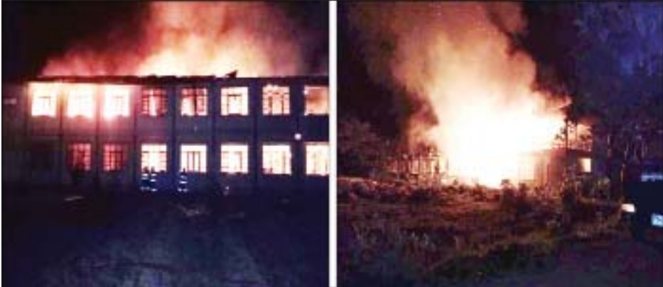
ရေစကြို၊ မီးတောက်ကျေးရွာရှိ အခြေခံပညာ အလယ်တန်း ကျောင်း မီးလောင်ပျက်စီးမှု မှတ်တမ်းဓာတ်ပုံ။