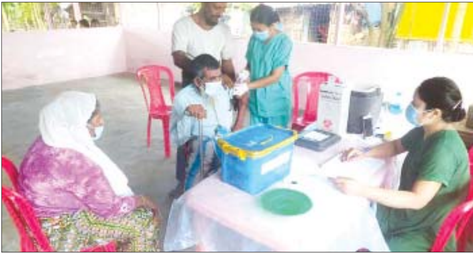
IDPs စခန်း၌ ခိုလှုံနေသူများအား ကိုဗစ်-၁၉ ရောဂါကာကွယ်ဆေး ထိုးနှံပေးစဉ်။