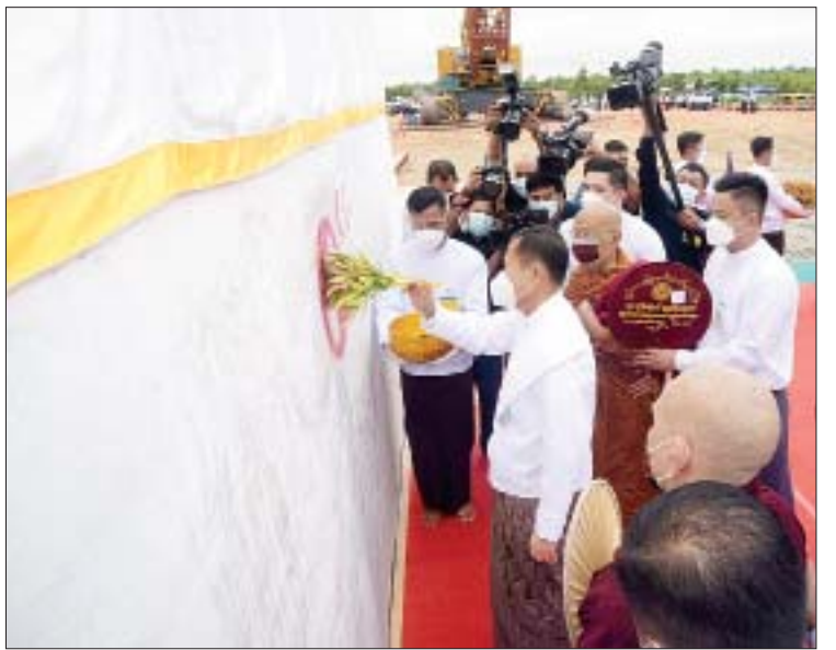
နိုင်ငံတော်စီမံအုပ်ချုပ်ရေးကောင်စီဒုတိယဥက္ကဋ္ဌ၊ ဒုတိယဝန်ကြီးချုပ် ဒုတိယ ဗိုလ်ချုပ်မှူးကြီး စိုးဝင်း “မာရဝိဇယ” ဗုဒ္ဓရုပ်ပွားတော်မြတ်ကြီး ရတနာပလ္လင်တော် အပိုင်း(၁)အား ပရိတ်နံ့သာရည်ဖြင့် ပက်ဖျန်းပူဇော်စဉ်။

စုစုပေါင်း ၈၁ ပေအမြင့်ရှိမည်ဖြစ်ကြောင်း၊ ယခုတည်ထားကိုးကွယ်မည့် “မာရဝိဇယ ဗုဒ္ဓရုပ်ပွားတော်မြတ်ကြီး” တည်ထား ကိုးကွယ်ပြီးစီးပါက မြန်မာတွင်သာမက ကမ္ဘာ့နိုင်ငံများတွင်ပါ စကျင်ကျောက် တော်ကြီးဖြင့် ထုဆစ်သည့် ဆင်းတုတော် ကြီးများအနက် အကြီးဆုံးနှင့် ဉာဏ်တော် အမြင့်မားဆုံး ဆင်းတုတော်ကြီးဖြစ်လာ မည်ဖြစ်ကြောင်း၊ ရုပ်ပွားတော်မြတ်ကြီး၏ ပလ္လင်တော်ကို စကျင်ကျောက်တော်ကြီး