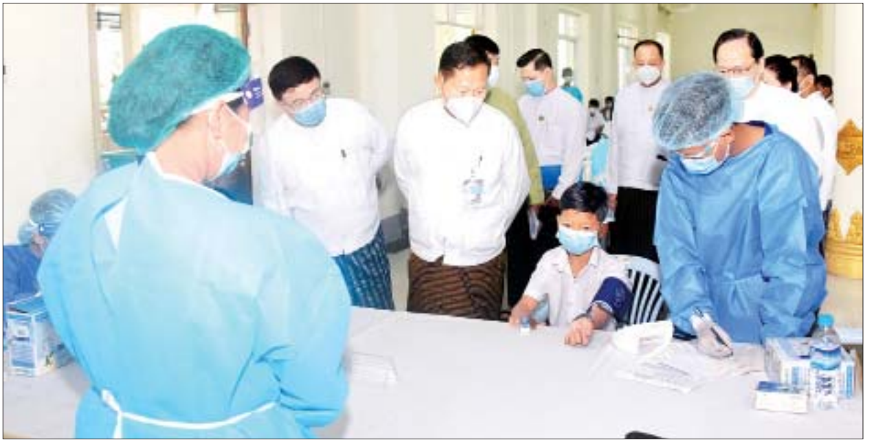
နိုင်ငံတော်စီမံအုပ်ချုပ်ရေးကောင်စီ ဒုတိယဥက္ကဋ္ဌ ဒုတိယဝန်ကြီးချုပ် ဒုတိယဗိုလ်ချုပ်မှူးကြီး စိုးဝင်း ကိုဗစ်-၁၉ ရောဂါကာကွယ်ဆေးထိုးနှံမှု ခံယူမည့် အသက် ၁၂ နှစ်နှင့်အထက် ကျောင်းသားတစ်ဦးအား ကြည့်ရှုအားပေးစဉ်။

အဆိုပါမင်္ဂလာဗျူဟာခန်းမတွင် အသက် ၁၂ နှစ်နှင့်အထက် အခြေခံပညာ ကျောင်းသား ကျောင်းသူများကို အောက်တိုဘာ ၁၂ ရက်မှစ၍ ကိုဗစ်-၁၉ ရောဂါ ကာကွယ်ဆေး စတင်ထိုးနှံပေးလျက်ရှိပြီး စုစုပေါင်းကျောင်းသား ကျောင်းသူ ၁၁၅၅၆ ဦးကို ကာကွယ်ဆေးထိုးနှံပေးသွားမည်ဖြစ်ရာ ယနေ့အထိ ၃၈၁၄ ဦး ထိုးနှံပြီးစီးခဲ့ကြောင်းနှင့် ကျန်ရှိသော ကျောင်းသား ကျောင်းသူများကို ဆက်လက်ထိုးနှံပေးသွား မည်ဖြစ်ကြောင်း သိရသည်။ သတင်းစဉ်