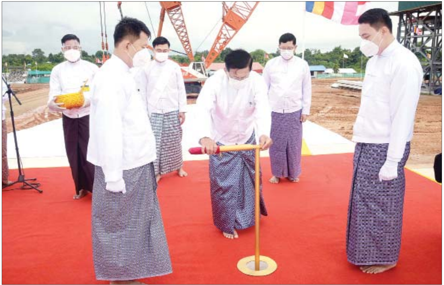
နိုင်ငံတော် စီမံအုပ်ချုပ်ရေးကောင်စီဥက္ကဋ္ဌ၊ နိုင်ငံတော်ဝန်ကြီးချုပ် ဗိုလ်ချုပ်မှူးကြီး မင်းအောင်လှိုင် မာရဝိဇယ ဗုဒ္ဓရုပ်ပွားတော်မြတ်ကြီး၏ ရတနာပလ္လင်တော်အပိုင်း(၁)အား ရတနာရွှေမူလီ တပ်ဆင်ပူဇော်စဉ်။

နေပြည်တော် အောက်တိုဘာ ၂၃ ပြည်ထောင်စုနယ်မြေ နေပြည်တော် ဒက္ခိဏသီရိမြို့နယ်ရှိ ဗုဒ္ဓဥယျာဉ်တော်တွင် တည်ထားပူဇော်မည့် “မာရဝိဇယ” ဗုဒ္ဓရုပ်ပွားတော်မြတ်ကြီး၏ ရတနာပလ္လင်တော်အပိုင်း(၁) တည်ထားပူဇော်ခြင်း မဟာမင်္ဂလာအခမ်းအနားကို ယနေ့နံနက်ပိုင်းတွင် အဆိုပါ ဗုဒ္ဓဥယျာဉ်တော်အတွင်းရှိ မဟာမင်္ဂလာမဏ္ဍပ်တော်၌ ကျင်းပပြုလုပ်သည်။ အခမ်းအနားသို့ ဥပ္ပါတသန္တိစေတီတော်ဂေါပကအဖွဲ့ ဩဝါဒါစရိယ ဆရာတော်၊ နေပြည်တော် လယ်ဝေးမြို့ပေါက်မြိုင်ကျောင်းတိုက် ပဓာနနာယက အဘိဓမ္မမဟာ ရဋ္ဌဂုရု ဘဒ္ဒန္တဇနိန္ဒ အမှူးပြုသည့် ဆရာတော်၊ သံဃာတော်များ စာမျက်နှာ ၃ ကော်လံ ၁ သို့ ○