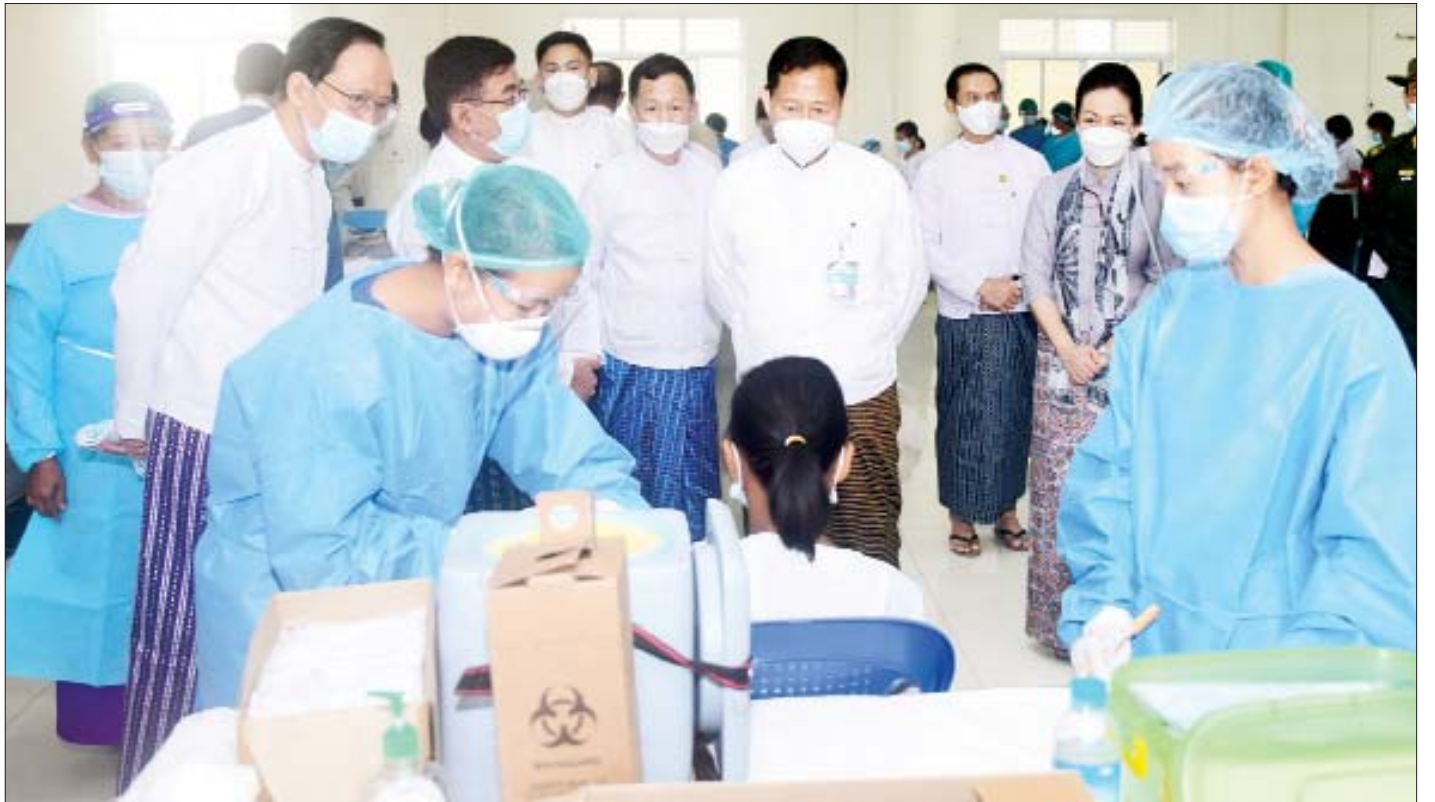
နိုင်ငံတော်စီမံအုပ်ချုပ်ရေးကောင်စီ ဒုတိယဥက္ကဋ္ဌ၊ ဒုတိယဝန်ကြီးချုပ် ဒုတိယဗိုလ်ချုပ်မှူးကြီး စိုးဝင်း အသက် ၁၂ နှစ်နှင့်အထက် အခြေခံပညာ ကျောင်းသား ကျောင်းသူများအား ကိုဗစ်-၁၉ ရောဂါ ကာကွယ်ဆေးထိုးနှံနေမှုကို ကြည့်ရှုအားပေးစဉ်။

ထိုသို့ ကျောင်းသား ကျောင်းသူများကို ကာကွယ်ဆေးထိုးနှံပေးလျက်ရှိရာ နေပြည်တော်ရှိ မင်္ဂလာဗျူဟာသာသနာဗိမာန်ခန်းမ၌ အသက် ၁၂ နှစ်နှင့်အထက် အခြေခံပညာ ကျောင်းသား ကျောင်းသူများအား ကိုဗစ်-၁၉ ရောဂါ ကာကွယ်ဆေး ထိုးနှံနေမှု အခြေအနေများကို ကိုဗစ်-၁၉ ရောဂါ ထိန်းချုပ်ရေးနှင့် အရေးပေါ်တုံ့ပြန်ရေးကော်မတီ ဥက္ကဋ္ဌ စာမျက်နှာ ၅ ကော်လံ ၁ သို့ ၀