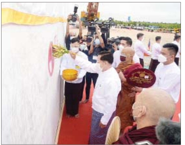
နိုင်ငံတော်စီမံအုပ်ချုပ်ရေးကောင်စီဥက္ကဋ္ဌ၊ နိုင်ငံတော်ဝန်ကြီးချုပ် ဗိုလ်ချုပ်မှူးကြီး မင်းအောင်လှိုင် “မာရဝိဇယ” ဗုဒ္ဓရုပ်ပွားတော်မြတ်ကြီး ရတနာ ပလ္လင်တော် အပိုင်း(၁)အား ပရိတ်နံ့သာရည်ဖြင့် ပက်ဖျန်းပူဇော်စဉ်။

ဘာသာတို့ဖြင့် ရေးထိုးပူဇော်နိုင်မည့် အခြေအနေများနှင့်ပတ်သက်၍ ရှင်းလင်း တင်ပြရာ နိုင်ငံတော်စီမံအုပ်ချုပ်ရေး ကောင်စီဥက္ကဋ္ဌ၊ နိုင်ငံတော်ဝန်ကြီးချုပ်က လိုအပ်သည်များ ဆွေးနွေးမှာကြားသည်။ အဆိုပါ “မာရဝိဇယ ဗုဒ္ဓရုပ်ပွားတော် မြတ်ကြီး”ဟူသည့် အမည်နာမသည် “မာရ်နတ်မင်း၏ အနှောင့်အယှက်ရန်စွယ် အန္တရာယ်အပေါင်းကို အထူးအောင်မြင် တော်မူသော မြတ်စွာဘုရား”ဟု အဓိပ္ပာယ် ဖော်ဆောင်ကြောင်း၊ “မာရဝိဇယ” ဗုဒ္ဓ ရုပ်ပွားတော်မြတ်ကြီးကို မြန်မာနိုင်ငံတွင် ထေရဝါဒဗုဒ္ဓ သာသနာတော်ကြီး ခိုင်မာ စွာ ထွန်းလင်းတောက်ပလျက်ရှိမှုအား ကမ္ဘာကိုပြသရန်၊ တိုင်းပြည်အေးချမ်း သာယာမှုရှိစေရန်၊ ရုပ်ပွားတော်မြတ်ကြီး သို့ ပြည်တွင်း ပြည်ပ ဘုရားဖူးများ လာရောက်ခြင်းဖြင့် ဒေသတိုးတက် စည်ကားမှုဖြစ်စေရန်၊ နိုင်ငံတော်ဖွံ့ဖြိုး တိုးတက်မှု အထောက်အကူဖြစ်စေရန် စသည့် ရည်ရွယ်ချက် ငှ ရပ်ဖြင့် တည်ထား ကိုးကွယ်ရန် လုပ်ဆောင်ခဲ့ခြင်း ဖြစ်ကြောင်း၊ ရုပ်ပွားတော်မြတ်ကြီးကို မြတ်စွာဘုရားရှင်၏ သုံးဆယ့်နှစ်ပါးသော လက္ခဏာတော်ကြီး၊ ရှစ်ဆယ်သော လက္ခဏာတော်ငယ်တို့နှင့် သင့်လျော် ညီညွတ်သည့် ဘူမိဖဿမုဒြာဟန်ဖြင့် ထုဆစ်ပူဇော်သွားမည်ဖြစ်ပြီး ပလ္လင်တော် အမြင့် ၁၈ ပေ၊ ဉာဏ်တော်အမြင့် ၆၃ ပေ၊