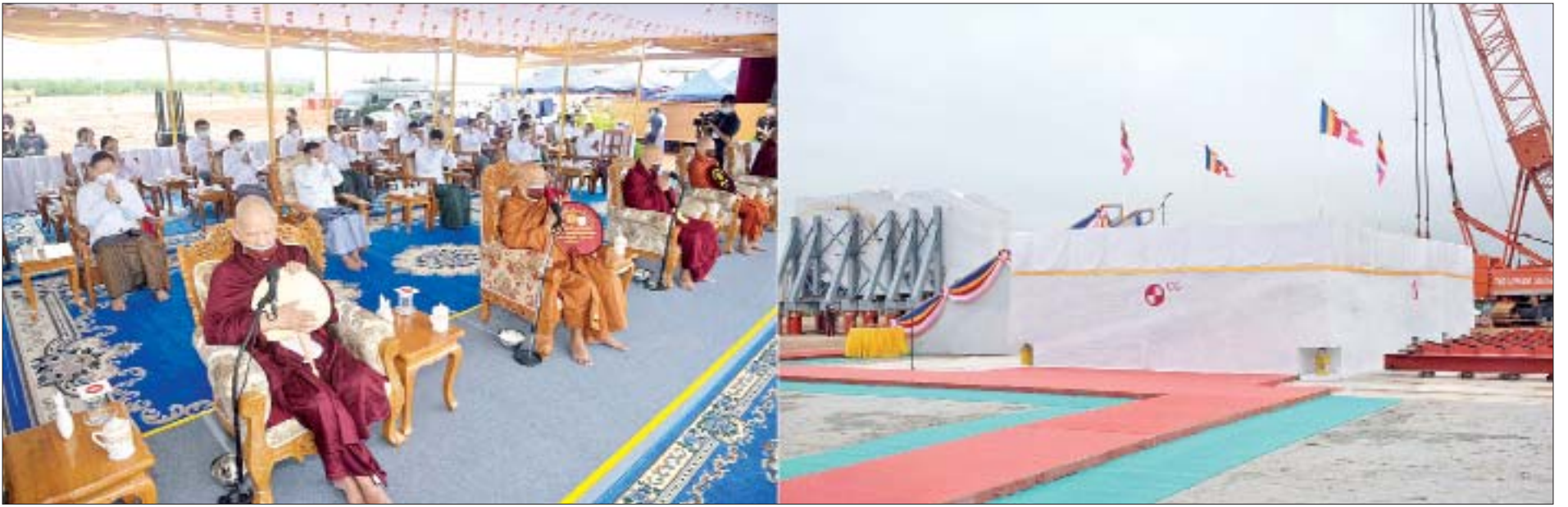
“မာရဝိဇယ”ဗုဒ္ဓရုပ်ပွားတော်မြတ်ကြီး ရတနာပလ္လင်တော် အပိုင်း(၁) တည်ထားပူဇော်ခြင်း မဟာမင်္ဂလာအခမ်းအနားတွင် ဆရာတော်ကြီးများက မေတ္တာပို့ဂါထာတော်များကို ရွတ်ပွားသရဇ္ဈာယ်တော်မူကြစဉ်။