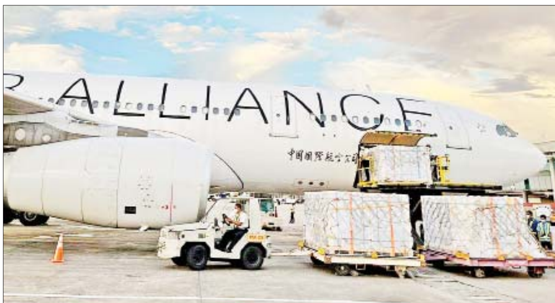
တရုတ်ပြည်သူ့သမ္မတနိုင်ငံမှ ဝယ်ယူသော Sinopharm ကိုဗစ်-၁၉ ရောဂါကာကွယ်ဆေး လေးသန်း ပဉ္စမအသုတ် ရန်ကုန် အပြည်ပြည်ဆိုင်ရာလေဆိပ်သို့ ရောက်ရှိစဉ်။

နေပြည်တော် အောက်တိုဘာ ၂၂ တရုတ်ပြည်သူ့သမ္မတနိုင်ငံ ပေကျင်းမြို့ Sinopharm ကုမ္ပဏီမှ ဝယ်ယူသော Sinopharm (BIBP) ကိုဗစ်-၁၉ ရောဂါ ကာကွယ်ဆေး လေးသန်း (5 doses per Vial ထုပ်ပိုးမှုပုံစံ) ဆေးအလုံးရေ ရှစ်သိန်းတင်ဆောင်လာသော Air China လေကြောင်းလိုင်း A 332 အမျိုးအစား လေကြောင်းပျံသန်းအမှတ် CA 589 လေယာဉ်သည် တရုတ်နိုင်ငံ ပေကျင်းမြို့ မှ ယနေ့ညနေပိုင်းတွင် ရန်ကုန်အပြည်ပြည်ဆိုင်ရာလေဆိပ်သို့ ပဉ္စမအသုတ် အဖြစ် ရောက်ရှိလာကြောင်း သိရသည်။ အဆိုပါ တရုတ်လေကြောင်းလိုင်း Air China လေယာဉ်ဖြင့် ရောက်ရှိလာသော Sinopharm ကိုဗစ်-၁၉ ရောဂါကာကွယ်ဆေးများအား ကျန်းမာရေးဝန်ကြီးဌာန၊ စာမျက်နှာ ၅ ကော်လံ ၁ သို့ ။