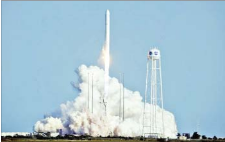
အဆိုပါစမ်းသပ်မှုတွင် လက်တွေ့ကျသည့် ပတ်ဝန်းကျင်တစ်ခု၌ အသံထက်မြန်သည့် အဆင့်မြင့်နည်းပညာ၊ တိုက်ခိုက်ရေးစွမ်းရည်များနှင့် ရှေ့ပြေးပစ်ခတ်မှုများကို ပြသခဲ့သည်ဟု ပင်တဂွန် စစ်ဌာနချုပ်က ပြောသည်။ ၂၀၂၀ ပြည့်နှစ်မှ ၂၀၂၅ ခုနှစ်တွင်း အသံထက်

အမေရိကန်ရေတပ်ဖွဲ့နှင့် ကြည်းတပ်ဖွဲ့တို့က ယမန်နေ့တွင် ဗာဂျီးနီးယားမြို့ရှိ နာဆာအာကာသ စခန်းတစ်ခုမှ ဒုံးကျည်များပစ်လွှတ်ကာ အသံထက် မြန်သည့် အမျိုးအစားများပါဝင်သော ကာကွယ်ရေး လက်နက်များကို စမ်းသပ်ခဲ့ကြောင်း ပင်တဂွန် စစ်ဌာနချုပ်က ဆိုသည်။