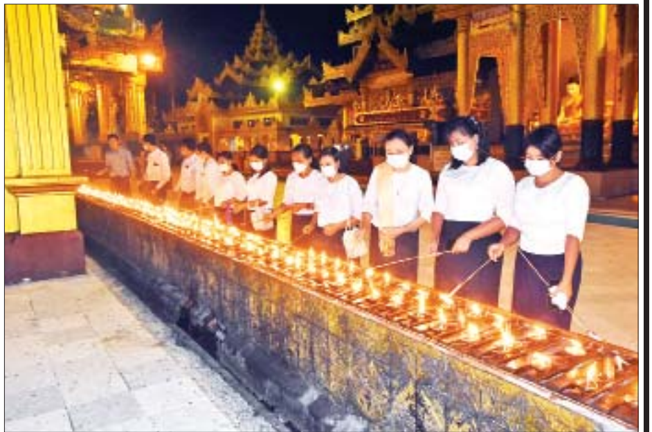
ရွှေတိဂုံစေတီတော်မြတ်ကြီး၌ ဆီမီး ၁၁၀၀၀ ထွန်းညှိပူဇော်မှုပုံရိပ်များကို တွေ့ရစဉ်။ (သတင်း- ရှေ့ဖိုး)