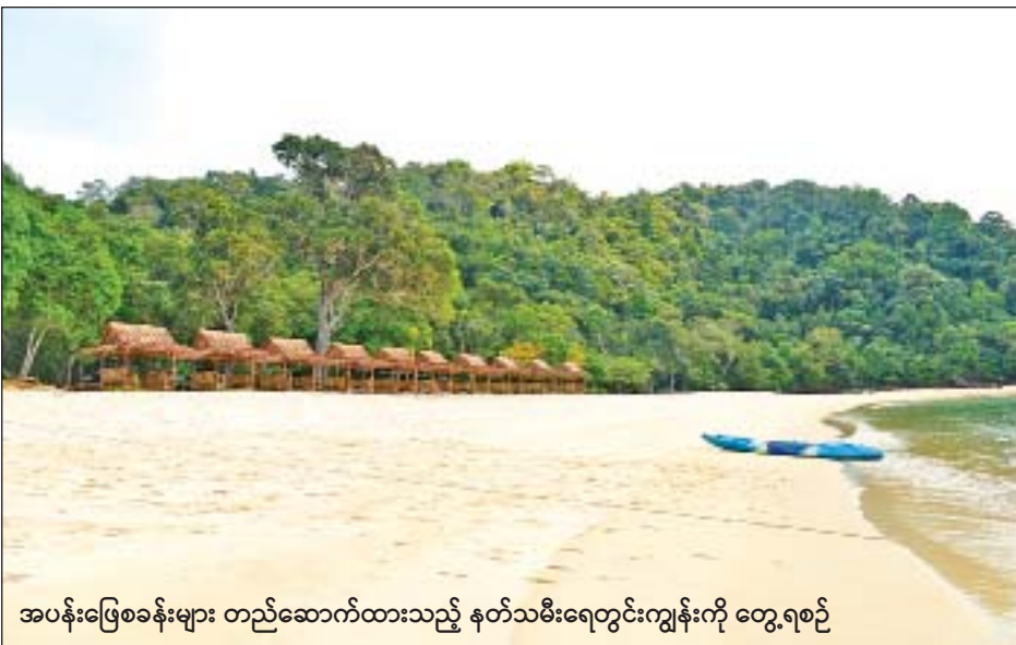
အပန်းဖြေစခန်းများ တည်ဆောက်ထားသည့် နတ်သမီးရေတွင်းကျွန်းကို တွေ့ရစဉ်

၂၀၁၀ ပြည့်နှစ်တွင် ငပလီကမ်းခြေသို့ ရောက်ရှိခဲ့ရာ မည်သည့်အတွက်ကြောင့် ကမ္ဘာ့အကောင်းဆုံး