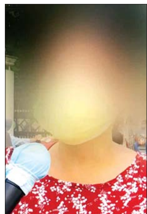
တတိယ အမျိုးသမီး

၁၀ တန်းပါ။ ကျောင်းဆက်ထားပေးမယ်။ ပြီးသွားရင် သူ့ဖြစ်ချင်တဲ့ဆန္ဒအတိုင်း လုပ်ပေးမယ်။ ဒါပေမယ့် သူ့ကိုအနာဂတ်ကောင်းအောင် ကျွန်တော်တို့က သွန်သင်ဆုံးမရမှာပေါ့။ နောက်တစ်ခါ ဒါမျိုးလမ်းမှား မရောက်အောင် သွန်သင်ပေးမယ်။ သူ့အနာဂတ် အတွက် လှပအောင် ကျွန်တော်ကြိုးစားပေးမယ်။ အခုလိုလွှတ်ပေးတဲ့အတွက် နိုင်ငံတော်အကြီးအကဲ နှင့်တကွ သက်ဆိုင်ရာ တာဝန်ရှိပုဂ္ဂိုလ်များကိုလည်း အထူးကျေးဇူးတင်ပါတယ်။