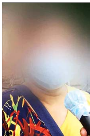
ပထမ အမျိုးသမီး

ကျွန်တော့်ညီလေး ဆန္ဒပြပွဲမှာအဖမ်းခံလိုက်ရ လို့ပါ။ အလွန်စိတ်ပူတယ်။ ဒီနေ့ပြန်လွတ်မယ် သတင်းကြားလို့ လာကြိုတာ၊ အိမ်ကမိသားစုက တော်တော်လေးပျော်နေတာပေါ့။ အမေကလည်း သူ့ကို မျှော်နေတာ၊ ဒယ်ဒီကတော့ တော်တော်ကို ပျော်နေတာ၊ ကျွန်တော့်လိုပဲ အခြားမိသားစုတွေ လည်း ပျော်နေမယ်လို့ ထင်ပါတယ်။ ညီလေးက