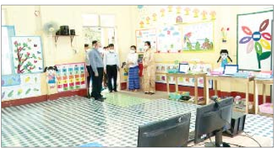
ကြည့်ရှုစစ်ဆေးသည်။ ယင်းနောက် ပြည်ထောင်စုဝန်ကြီးနှင့်အဖွဲ့သည် ပုသိမ်မြို့ အမှတ်(၂) ရပ်ကွက် ကုန်သည်လမ်းနှင့် GEC လမ်းထောင့်ရှိ မူလတန်းကြိုကျောင်းကို ကြည့်ရှုစစ်ဆေးခဲ့ကြောင်း သိရသည်။ (အပေါ်ပုံ) သတင်းစဉ်

အဘိဓဇ မဟာရဋ္ဌဂုရု ဘဒ္ဒန္တ ဝိသုတ အမျိုးပြုသော ဆရာတော်၊ သံဃာတော်များအား ဖူးမြော်ကြည့်ညှိကာ သင်္ကန်းနှင့် လှူဖွယ်ပစ္စည်းများ ဆက်ကပ်လှူဒါန်းကြသည်။ ယင်းနောက် ဘေးအန္တရာယ်ဆိုင်ရာ စီမံခန့်ခွဲမှု ဦးစီးဌာန တိုင်းဒေသကြီးဦးစီးမှူးရုံး၌ ဝန်ထမ်းများနှင့် တွေ့ဆုံရာ ပြည်ထောင်စုဝန်ကြီးက မွန်မြတ်သော စိတ်စေတနာဖြင့် ကျရာကဏ္ဍမှ တာဝန်ကျေပွန်အောင် ဆောင်ရွက်ကြရန် ဆွေးနွေးမှာကြားသည်။ ကြည့်ရှုစစ်ဆေး ဆက်လက်၍ ဘေးအန္တရာယ်ဆိုင်ရာစီမံခန့်ခွဲမှု ဦးစီးဌာန တိုင်းဒေသကြီး ဦးစီးမှူးရုံး (သိုလှောင်ရုံ) ၌ ကယ်ဆယ်ရေးပစ္စည်းများ၊ ဒေသဖွံ့ဖြိုးရေးသုံး ပစ္စည်းများ၊ အလှူပစ္စည်းများကို သိုလှောင်ထိန်းသိမ်းနည်း လက်စွဲအတိုင်း သိုလှောင်ထိန်းသိမ်းထားရှိမှု၊ သိုလှောင်ရုံမှတ်တမ်း ထိန်းသိမ်းထားရှိမှုတို့ကို