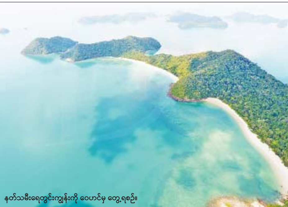
နတ်သမီးရေတွင်းကျွန်းကို ဝေဟင်မှ တွေ့ရစဉ်။

နတ်သမီးရေတွင်းကျွန်းသည် မြိတ်မြို့၏ အနောက်တောင်ဘက် ရေမိုင် ၄၅ မိုင်ခန့်အကွာ အဝေးတွင်ရှိပြီး အရှေ့လောင်ကျကျ ၉၈ ဒီဂရီ ၀၁ မိနစ်နှင့် မြောက်လတ္တီကျု ၁၂ ဒီဂရီ ၀၅ မိနစ် အကြားတွင် တည်ရှိပါသည်။ ဒုံးညောင်မိုင်းဆလုံ ကျေးရွာနှင့် ရေမိုင် ၁၀ မိုင်ခန့်ကွာဝေးပြီး Speed Boat ဖြင့် သွားရောက်ပါက ၂၅ မိနစ်ခန့်ကြာမြင့် ပါသည်။ မြိတ်မြို့မှ သွားရောက်မည်ဆိုပါက တစ် နာရီနှင့်လေးဆယ့်ငါးမိနစ်ခန့် ကြာမြင့်ပါသည်။ ကျွန်း၏မြောက်ဘက်တွင် ဒုံးကျွန်း၊ အနောက် တောင်ဘက်တွင် မီးသွေးကျွန်း၊ တောင်ဘက်တွင် ကြက်ပေါင်ကျွန်းနှင့် မီးစိမ်းကျွန်းတို့ ဝန်းရံလျက်ရှိ ပါသည်။ ကျွန်းတစ်ကျွန်းလုံး ၅၀၀ ဒဿမ ၁၆ ဧက ကျယ်ဝန်းပြီး ကျွန်း၏အရှေ့ဘက်ခြမ်းတွင် ပေ ၈၅၀၊ မြောက် ဘက်ခြမ်းတွင် ပေ ၆၈၀ ကျော်နှင့် ပေ ၅၅၀ခန့်ရှည်လျားသော သဲသောင်အော်နှစ်ခုရှိပါ သည်။ တောင်ဘက်ခြမ်းတွင် ပေ ၁၂၀၀ ကျော်၊ ပေ ၄၅၀ နီးပါးနှင့် ပေ ၂၅၀ နီးပါးရှည်လျားသည့် သဲသောင်အော်သုံးခု စုစုပေါင်းအော် ခြောက်ခုရှိပါ သည်။ နေ့ချင်းပြန် ခရီးစဉ်များစတင်သည့် ၂၀၁၅ ခုနှစ် ပွင့်လင်းရာသီမှ ၂၀၁၆ ခုနှစ် ဒီဇင်ဘာလကုန် အထိ နတ်သမီးရေတွင်းကျွန်းသို့ ခရီးစဉ်ခေါက်ရေ ၉၅ ကြိမ်၊ ပြည်တွင်းခရီးသည် ၅၁၆ ဦး၊ ပြည်ပခရီး သည် ၄၆၅ ဦး စုစုပေါင်း ၉၈၁ ဦး လည်ပတ်ခဲ့ပြီး ၂၀၁၇ ခုနှစ်တွင် ခရီးစဉ်ခေါက်ရေ ၇၆ ကြိမ်၊ ပြည်တွင်းခရီးသည် ၇၁၇ ဦး၊ ပြည်ပခရီးသည် ၉၃ ဦး စုစုပေါင်း ၈၁၀ လည်ပတ်ခဲ့သည်ကို သိရှိရပါသည်။