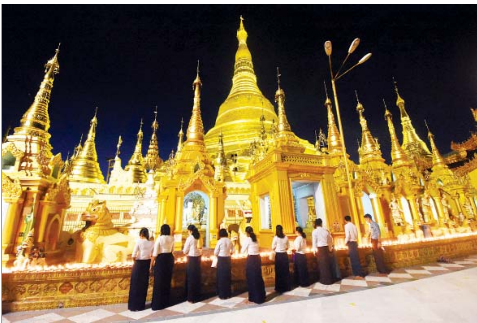
ရွှေတိဂုံစေတီတော် ရင်ပြင်၌ ဆီမီး ၁၁၀၀၀ ထွန်းညှိပူဇော်ကြ စဉ်။