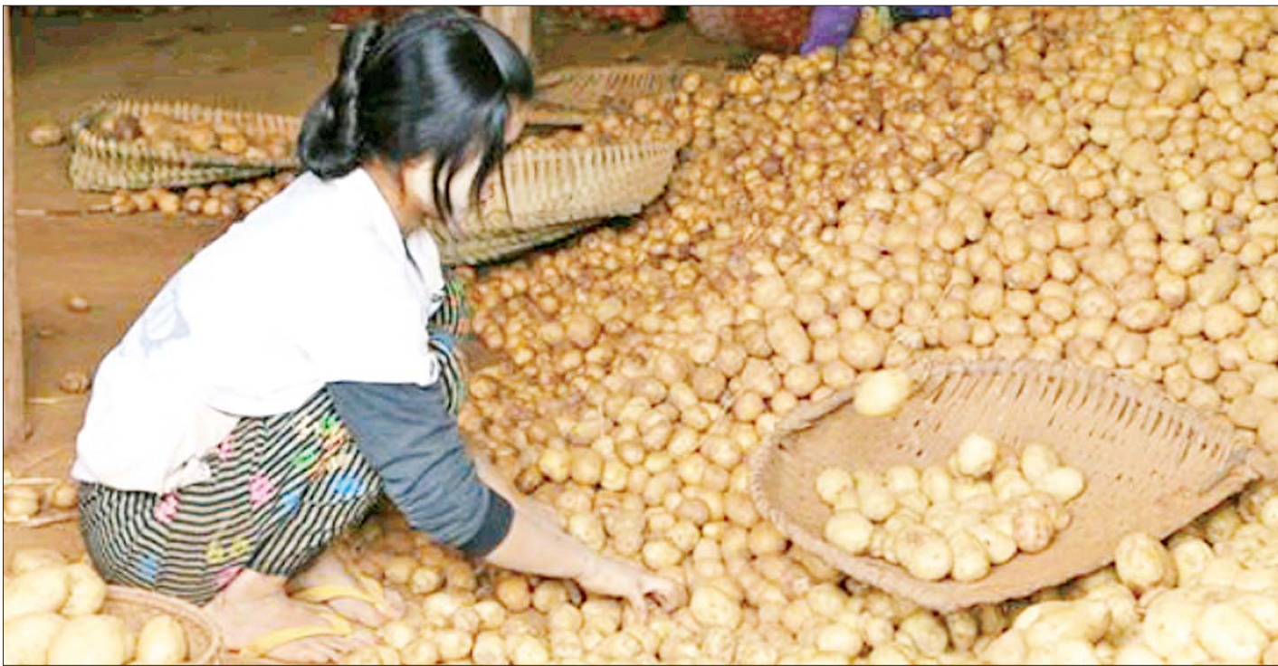
မန္တလေး အောက်တိုဘာ ၁၉ ယခုရက်အတွင်း မန္တလေးမြို့ သီရိမာလာကုန်စိမ်းလက်ကားဈေးအတွင်းသို့ ရှမ်းပြည်နယ်တောင်ပိုင်း အောင်ပန်းဒေသမှထွက်ရှိသော အာလူးများ ဝင်ရောက်လာကာ ယခင်ရက်များထက် ဈေးပိုမိုရရှိနေကြောင်း အဆိုပါဈေးအတွင်းရှိ အာလူးပွဲရုံများထံမှ သိရသည်။