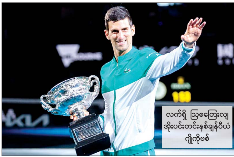
လက်ရှိ ဩစတြေးလျ အိုးပင်းတင်းနစ်ချန်ပီယံ ဂျိုကိုဗစ်

အားကစားသမားတွေကို ကိုဗစ်- ၁၉ ရောဂါကာကွယ်ဆေးမဖြစ်မနေ ထိုးနှံရန် ဆောင်ရွက်ခဲ့ပြီး အောက်တိုဘာ ၁၉ ရက်မှာတော့ ပြည်ပနိုင်ငံတွေကနေ လာရောက် ယှဉ်ပြိုင်ကစားမယ့် တင်းနစ် ကစားသမားတွေကို ဖိအားပေးလာ ခဲ့တာဖြစ်ပါတယ်။ ကိုဗစ်-၁၉ ရောဂါကာကွယ်ဆေး မထိုးနှံရသေးတဲ့ ဘယ်တင်းနစ် ကစားသမားမဆို ဩစတြေးလျ နိုင်ငံအတွင်းကို ဝင်လာခွင့်ရဖို့ စာမျက်နှာ ၂၄ ကော်လံ ၁ သို့ ၀