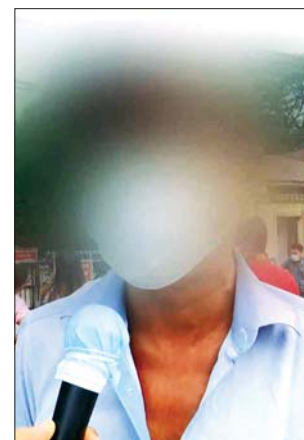
ဒုတိယ အမျိုးသား