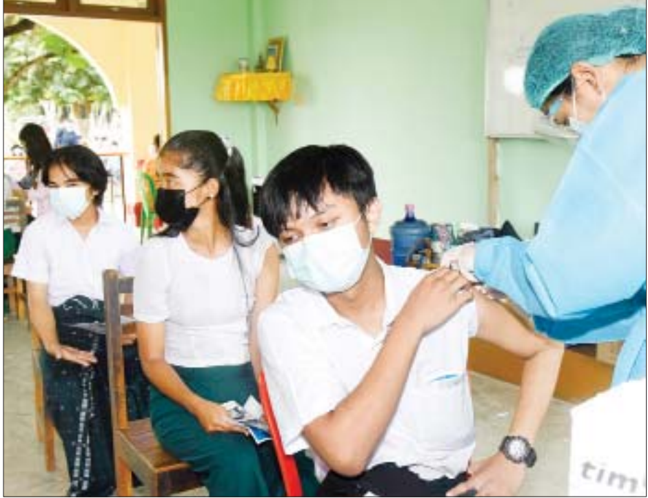
ပုဗ္ဗသီရိမြို့နယ် အထက(၂၀)တွင် ကျောင်းသား ကျောင်းသူများအား ကိုဗစ်-၁၉ ကာကွယ်ဆေး ထိုးနှံပေးစဉ်။

နေပြည်တော်ကောင်စီနယ်မြေအတွင်း မြို့နယ်များအလိုက် ဆေးထိုးရန် သတ်မှတ်ထားသည့် စုရပ်နေရာများ၌ အသက် ၁၂ နှစ်နှင့်အထက် ကျောင်းသား ကျောင်းသူများအား နေ့ရက်အလိုက် သတ်မှတ်ထားသည့် လူဦးရေစာရင်းအပြင် အကြောင်းအမျိုးမျိုးကြောင့် ကာကွယ်ဆေးထိုးရန် ကျန်ရှိနေသည့် ပြည်သူများ၊ ဌာနဆိုင်ရာ ဝန်ထမ်းများနှင့် ၎င်းတို့၏မိခင်မိသားစုဝင်များကိုလည်း ကျန်းမာရေး ဝန်ထမ်းများက ကိုဗစ်-၁၉ ကာကွယ်ဆေး နည်းလမ်းများနှင့်အညီ ကာကွယ်ဆေးထိုးနှံပေးလျက်ရှိသည်။