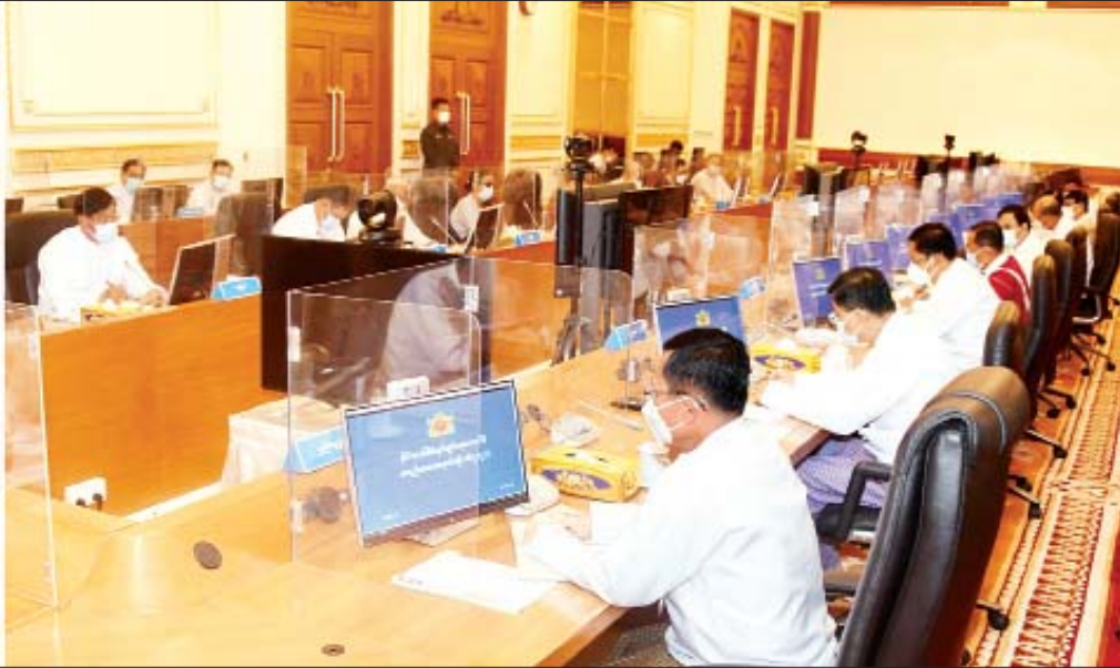
နိုင်ငံတော်စီမံအုပ်ချုပ်ရေးကောင်စီဥက္ကဋ္ဌ၊ နိုင်ငံတော်ဝန်ကြီးချုပ် ဗိုလ်ချုပ်မှူးကြီး မင်းအောင်လှိုင် နိုင်ငံတော်စီမံအုပ်ချုပ်ရေးကောင်စီ အစည်းအဝေး (၁၆/၂၀၂၁) တွင် အမှာစကားပြောကြားစဉ်။

နေပြည်တော် အောက်တိုဘာ ၁၅ နိုင်ငံတော်စီမံအုပ်ချုပ်ရေးကောင်စီ အစည်းအဝေး (၁၆/၂၀၂၁) ကို ယနေ့ မွန်းလွဲပိုင်းတွင် နေပြည်တော်ရှိ နိုင်ငံတော်စီမံအုပ်ချုပ်ရေးကောင်စီဥက္ကဋ္ဌရုံး အစည်းအဝေးခန်းမ၌ ကျင်းပရာ နိုင်ငံတော်စီမံအုပ်ချုပ်ရေးကောင်စီဥက္ကဋ္ဌ၊ နိုင်ငံတော်ဝန်ကြီးချုပ် ဗိုလ်ချုပ်မှူးကြီး မင်းအောင်လှိုင် တက်ရောက်အမှာစကားပြောကြားသည်။ အစည်းအဝေးသို့ နိုင်ငံတော်စီမံအုပ်ချုပ်ရေးကောင်စီဒုတိယဥက္ကဋ္ဌ ဒုတိယဝန်ကြီးချုပ် ဒုတိယဗိုလ်ချုပ်မှူးကြီး စိုးဝင်း၊ ကောင်စီအဖွဲ့ဝင်များ ဖြစ်ကြသည့် ဗိုလ်ချုပ်ကြီး မြထွန်းဦး၊ ဗိုလ်ချုပ်ကြီး တင်အောင်စန်း၊ ဗိုလ်ချုပ်ကြီး မောင်မောင်ကျော်၊ ဒုတိယဗိုလ်ချုပ်ကြီး မိုးမြင့်ထွန်း၊ မန်းငြိမ်းမောင်၊ ဦးသိန်းညွန့်၊ စာမျက်နှာ ၆ ကော်လံ ၁ သို့ ✨