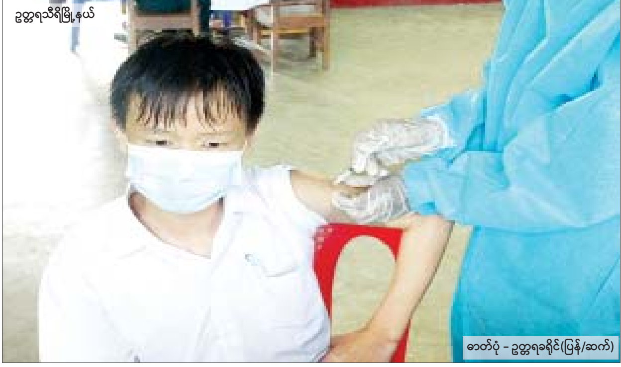
ဥက္ကဋ္ဌရသီရိမြို့နယ်

တစ်ဖက်မှလည်း ကိုဗစ်-၁၉ ကာကွယ်ဆေး ကျောင်းထဲရောက်