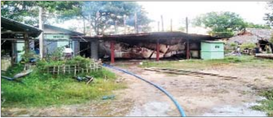
မဒေါင်းလှကျေးရွာမှ နေအိမ်များအား PDF အကြမ်းဖက်သူများက မီးရှို့ဖျက်ဆီးခဲ့မှု မှတ်တမ်းဓာတ်ပုံ

နေပြည်တော် အောက်တိုဘာ ၁၅ အကြမ်းဖက် အဖွဲ့များဖြစ်သော CRPH၊ NUG တို့သည် အလုံးစုံ ပျက်သုဉ်းရေး ဦးတည်ချက်များဖြင့် PDF အမည်ခံ အကြမ်းဖက် အဖွဲ့ကို ဖွဲ့စည်း၍ အချို့သော ဒေသများတွင် အပြစ်မဲ့ပြည်သူများအား ဒလန်ဟုစွပ်စွဲသတ်ဖြတ်ခြင်း၊ မိုင်းထောင်ဖောက်ခွဲတိုက်ခိုက်ခြင်း စသည်တို့ကို လုပ်ဆောင်လျက်ရှိသည်။ ၎င်းအပြင် NLD အစွန်းရောက်အများစုပါဝင်သော PDF အဖွဲ့များအနေဖြင့် ၎င်းတို့နှင့် နိုင်ငံရေးခံယူချက်အရ ကွဲပြားပြီး အေးချမ်းစွာ နေထိုင်လိုသည့် ကျေးရွာများကိုလည်း နည်းမျိုးစုံဖြင့် ခြိမ်းခြောက် ဖိအားပေးခြင်း၊ ၎င်းတို့ကို ထောက်ခံအားပေးမှုမရှိသည့် ကျေးရွာများကို အင်အားသုံး၍ ဝင်ရောက်စီးနင်းကာ အပြစ်မဲ့ပြည်သူများအား ရက်ရက်စက်စက်ညှဉ်းပန်းသတ်ဖြတ်ခြင်း၊ နေအိမ်များအား မီးရှို့ဖျက်ဆီးခြင်း၊ ပစ္စည်းများအား လုယက်ခြင်းတို့ကို လုံခြုံရေးတပ်ဖွဲ့ဝင်များ၏ အလစ်အပိုက် လုပ်ဆောင်လျက်ရှိသည်။ ထိုသို့ လုပ်ဆောင်လျက်