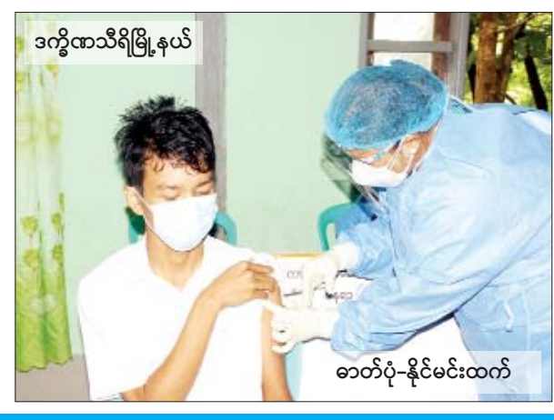
ဥက္ကရသီရိမြို့နယ်