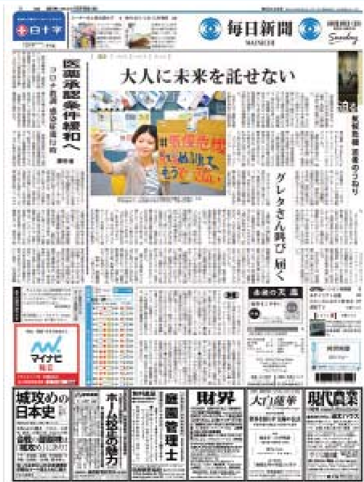
သွားမှာပါလဲ။

ရေရှည်အနေနဲ့ ခေတ်မီစိုက်ပျိုး မွေးမြူရေးအတွက် လူ့စွမ်းအားအရင်း အမြစ်များရရှိရေး စိုက်ပျိုးမွေးမြူရေး ကျောင်း၊ သိပ္ပံ၊ ကောလိပ်တွေ ဒေသ အလိုက် တိုးချဲ့ဖွင့်လှစ်ဆောင်ရွက်လျက် ရှိပါတယ်။ အစိုးရအနေနဲ့ မြန်မာနိုင်ငံကို ကမ္ဘာ့အခြေခံ စားရေးရိက္ခာဖြည့်တင်းပေး နိုင်သောနိုင်ငံအဖြစ် ရေရှည်စီမံချက်ထား ဆောင်ရွက်သွားမှာဖြစ်ပါတယ်။ လက်ရှိ အစိုးရအနေနဲ့ ယခင်အစိုးရအဆက်ဆက် ချုပ်ဆိုခဲ့တဲ့ စီးပွားရေးသဘောတူညီချက် စာချုပ်တွေကို ပယ်ဖျက်ခြင်းမပြုဘဲ ဆက်လက်ဆောင်ရွက်လျက်ရှိပါတယ်။ ကျွန်တော်တို့အနေနဲ့ မြန်မာနိုင်ငံနဲ့ လက်တွဲဆောင်ရွက်မယ့် နိုင်ငံတကာ ရင်းနှီးမြှုပ်နှံမှု စီးပွားရေးလုပ်ငန်းတွေကို ကျယ်ကျယ်ပြန့်ပြန့် ဖိတ်ခေါ်ထားပါ တယ်။ ဂျပန်နိုင်ငံက စီးပွားရေးလုပ်ငန်းရှင် ခေါင်းဆောင်၊ ကိုယ်စားလှယ်အချို့လည်း