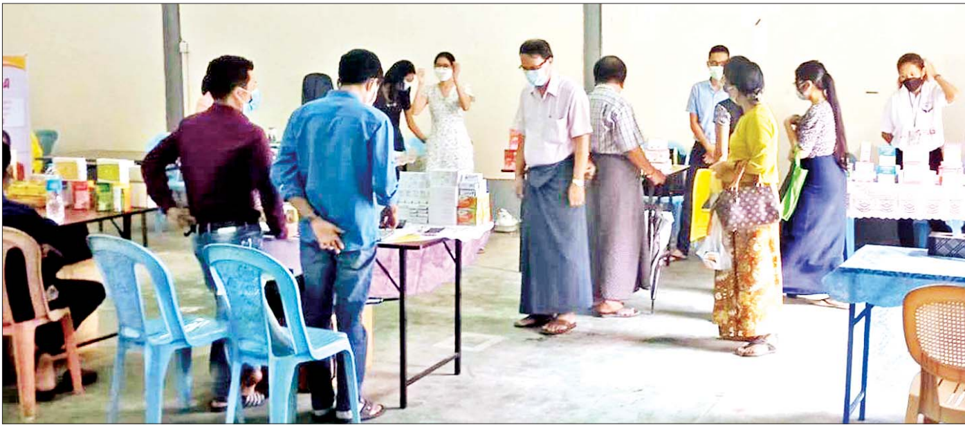
ရန်ကုန်တိုင်းဒေသကြီးအတွင်း ဆေးနှင့်ဆေးပစ္စည်းများ လက်လီလက်ကားရောင်းချပေးနေသည်ကို စက်တင်ဘာ ၁၃ ရက်က တွေ့ရစဉ်။

တရားမဝင်အကြမ်းဖက်အဖွဲ့အစည်းများနှင့် ၎င်းတို့၏ကိုယ်စားလှယ်များကို ထိတွေ့ဆောင်ရွက်ခြင်းနှင့် အားပေးအားမြှောက်ခြင်းမှ ရှောင်ကြဉ်ရန် နိုင်ငံတကာအသိုက်အဝန်းကို တောင်းဆိုသည့် သတင်းထုတ်ပြန်ချက်အား နိုင်ငံခြားရေးဝန်ကြီးဌာနက စက်တင်ဘာ ၂၃ ရက်တွင် ထုတ်ပြန်ခဲ့သည်။ ထို့အတူ စက်တင်ဘာ ၂၅ ရက် ရက်စွဲဖြင့် သတင်းထုတ်ပြန်ရာတွင် ဂျီနီဗာမြို့တွင် ကျင်းပလျက်ရှိသည့် ကုလသမဂ္ဂလူ့အခွင့်အရေးကောင်စီ၏(၄၈)ကြိမ်မြောက် ပုံမှန်အစည်းအဝေးကာလအတွင်း မြန်မာနိုင်ငံအပေါ် ဆန့်ကျင်သည့် ဆွေးနွေးမှုသုံးခုကို မြန်မာနိုင်ငံမပါဝင်ဘဲ ကျင်းပခဲ့ခြင်း၊ နိုင်ငံရေးရည်ရွယ်ချက်ဖြင့် ချမှတ်ထားသည့် ဆုံးဖြတ်ချက်များနှင့် မမျှတသောလုပ်ပိုင်ခွင့်များ၊ ယင်းယန္တရား