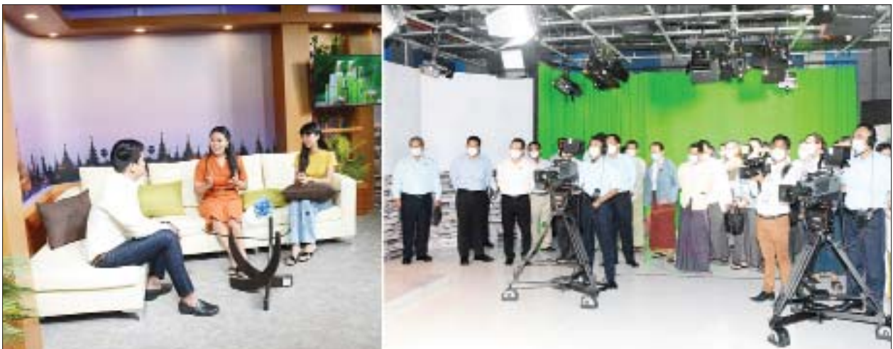
ပြည်ထောင်စုဝန်ကြီး ဦးမောင်မောင်အုန်းနှင့် စာပေ၊ ရုပ်ရှင်၊ သဘင်၊ ဂီတ အနုပညာရှင်များ မြဝတီ မီဒီယာစင်တာအတွင်း ကြည့်ရှုလေ့လာကြစဉ်။

ရန်ကုန် အောက်တိုဘာ ၁၂ ပြန်ကြားရေးဝန်ကြီးဌာန ပြည်ထောင်စုဝန်ကြီး ဦးမောင်မောင်အုန်းသည် မြန်မာနိုင်ငံ သတင်းမီဒီယာကောင်စီ၊ မြန်မာနိုင်ငံရုပ်ရှင်အစည်းအရုံး၊ မြန်မာနိုင်ငံ ဂီတအစည်းအရုံးတို့မှ တာဝန်ရှိသူများ၊ ရုပ်ရှင်၊ သဘင်၊ ဂီတနယ်ပယ်မှ အနုပညာရှင်များ၊ TV, FM Broadcaster များနှင့်အတူ ယနေ့မွန်းလွဲပိုင်းက ရန်ကင်းမြို့နယ် အမှတ်(၁၅) မိုးကောင်းလမ်းရှိ မြန်မာစီးပွားရေးကော်ပိုရေးရှင်း၊ သတင်းနှင့် မီဒီယာ လုပ်ငန်း (မြဝတီ) (MWD Media Centre) တွင် ကိုဗစ်-၁၉ ကပ်ရောဂါ ကာကွယ်ရေး စည်းမျဉ်းစည်းကမ်းများနှင့် အညီ ရိုက်ကူးထုတ်လုပ်ရေး လုပ်ငန်းများ ဆောင်ရွက်နေမှုကို သွားရောက်ကြည့်ရှုလေ့လာကြသည်။