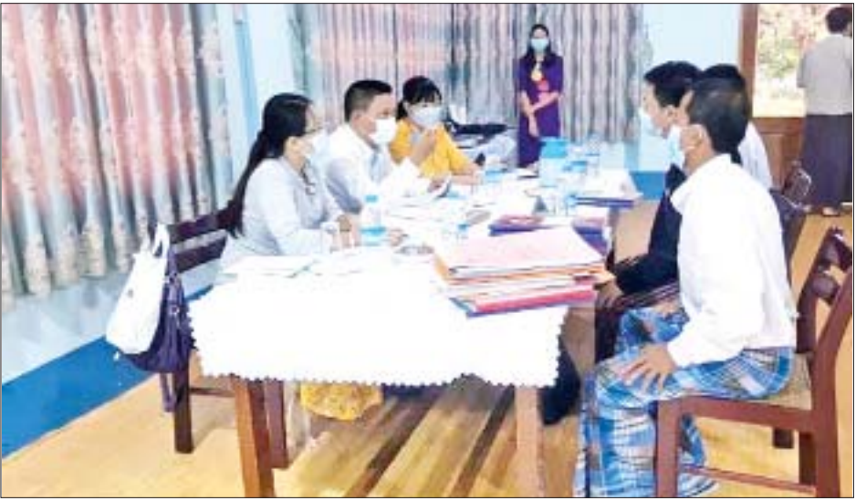
လမ်းပြကြယ်ပါတီအား စစ်ဆေးမှု မှတ်တမ်းဓာတ်ပုံ

ပါတီနှင့်မြန်မာနိုင်ငံ အလုပ်သမား လယ်သမား မဟာမိတ်ပါတီ [Alliance of Myanmar's Worker and Farmer Party (A.M.W.F.P)] တို့ကို အောက်တိုဘာ ၄ ရက်မှ ၈ ရက်အထိလည်းကောင်း၊ ရန်ကုန်တိုင်း ဒေသကြီး အခြေစိုက်ဖြစ်ကြသော အမျိုးသား ညီညွတ်ရေးကွန်ဂရက်ပါတီ ၊ ဒီမိုကရေစီနှင့် လူ့အခွင့်အရေးပါတီ၊ ညီညွတ်သော တိုင်းရင်းသား လူမျိုးများဒီမိုကရေစီပါတီတို့ကို အောက်တိုဘာ ၄ ရက်မှ ၈ ရက်အထိလည်းကောင်း၊ ရှမ်းပြည်နယ် အခြေစိုက်ဖြစ်သော ရှမ်းတိုင်းရင်းသားများ ဒီမိုကရက်တစ်ပါတီကို အောက်တိုဘာ ၄ ရက် မှ ၈ ရက်အထိလည်းကောင်း၊ ဧရာဝတီတိုင်းဒေသကြီး အခြေစိုက်ဖြစ်သော မြန်မာနိုင်ငံ တောင်သူလယ်သမား အလုပ်သမား ပြည်သူ့ပါတီကို အောက်တိုဘာ ၄ ရက် မှ ၆ ရက်အထိလည်းကောင်း၊ ကရင်ပြည်နယ် အခြေစိုက်ဖြစ်ကြသော ဖလှံ - စပေါ်ဒီမိုကရက်တစ် ပါတီနှင့် ကရင်အမျိုးသားဒီမိုကရက်တစ်ပါတီ ( Karen National Democratic Party ) တို့ကို အောက်တိုဘာ ၅ ရက်မှ ၈ ရက်အထိလည်းကောင်း စစ်ဆေးဆောင်ရွက်ခဲ့သည်။