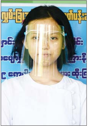
မယွန်းနဒီ