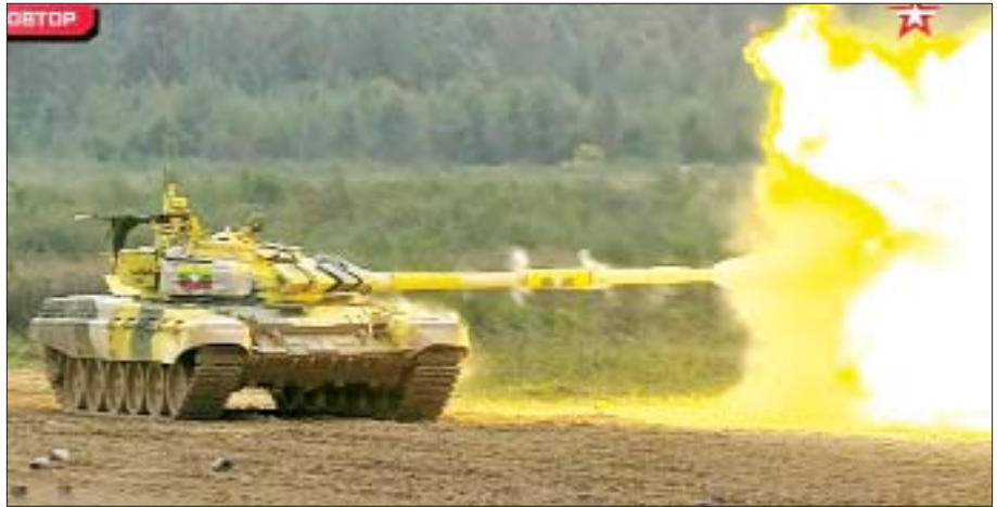
ရုရှားဖက်ဒရေးရှင်းနိုင်ငံ၌ ၃-၉-၂၀၂၁ ရက်ကကျင်းပသည့် International Army Games-2021 ပြိုင်ပွဲတွင် မြန်မာ့တပ်မတော်တင့်တပ်ဖွဲ့ တင့်ကားမောင်းနှင်ပစ်ခတ်ခြင်းပြိုင်ပွဲ Tank Biathlon(Division-2) ပါဝင်ယှဉ်ပြိုင်စဉ်။

(ယမန်နေ့မှအဆက်) နိုင်ငံတော်စီမံအုပ်ချုပ်ရေးကောင်စီဒုတိယဥက္ကဋ္ဌ၊ ဒုတိယတပ်မတော် ကာကွယ်ရေးဦးစီးချုပ်၊ ကာကွယ်ရေးဦးစီးချုပ် (ကြည်း) ဒုတိယဗိုလ်ချုပ်မှူးကြီးစိုးဝင်းသည် စက်တင်ဘာ ၁ ရက်မှ ၇ ရက်အတွင်း ရုရှားဖက်ဒရေးရှင်းနိုင်ငံသို့ သွားရောက်ခဲ့သည်။ ခရီးစဉ်အတွင်း International Army Games-2021 ပိတ်ပွဲအခမ်းအနား တက်ရောက်ခြင်း၊ ရုရှားဖက်ဒရေးရှင်းနိုင်ငံမှ စစ်ဘက်၊ အရပ်ဘက်တာဝန်ရှိသူများနှင့်တွေ့ဆုံခြင်းနှင့် အထင်ကရနေရာများသို့ သွားရောက်လေ့လာခြင်းတို့ ပြုလုပ်ခဲ့ပြီး နှစ်နိုင်ငံအစိုးရနှင့် တပ်မတော်နှစ်ရပ်တို့အကြား ချစ်ကြည်ရင်းနှီးမှုနှင့် စစ်ဘက်နည်းပညာ၊ သိပ္ပံနည်းနည်းပညာ၊ သုတေသနနှင့် လူ့စွမ်းအားအရင်းအမြစ်တိုးတက်ရေး၊ ယဉ်ကျေးမှုကဏ္ဍစသည်တို့တွင် ပိုမိုတိုးတက်ခိုင်မာအောင် ဆောင်ရွက်နိုင်ခဲ့သည်ကို မြင်တွေ့ရသည်။