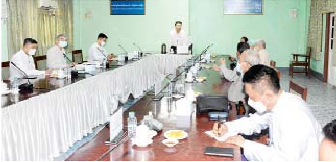
ပြည်ထောင်စုဝန်ကြီး ဦးမောင်မောင်အုန်း မြန်မာနိုင်ငံရုပ်ရှင်အစည်းအရုံးမှ နာယကများ၊ အလုပ်အမှုဆောင်အဖွဲ့ဝင်များနှင့် တွေ့ဆုံဆွေးနွေးစဉ်။

ရန်ကုန် အောက်တိုဘာ ၁၂ ပြန်ကြားရေးဝန်ကြီးဌာန ပြည်ထောင်စုဝန်ကြီး ဦးမောင်မောင်အုန်းသည် မြန်မာနိုင်ငံဂီတအစည်းအရုံး(ဗဟို) ယာယီအမှုဆောင်အဖွဲ့ဝင်များနှင့် ယနေ့နံနက်ပိုင်းတွင် ရန်ကုန်မြို့ပြည်လမ်းရှိ မြန်မာ့အသံနှင့် ရုပ်မြင်သံကြား၌ တွေ့ဆုံပြီး ဂီတလောက ဖွံ့ဖြိုးတိုးတက်ရေးအတွက် ဆွေးနွေးသည်။