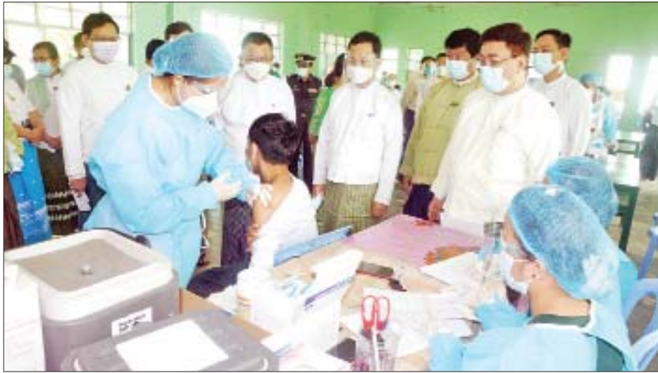
နေပြည်တော်ကောင်စီဥက္ကဋ္ဌနှင့် အဖွဲ့သည် အထက် အခြေခံပညာအထက်တန်းနှင့် အလယ် တန်းအဆင့် ကျောင်းသား ကျောင်းသူများအား ကိုဗစ်-၁၉ ရောဂါ ကာကွယ်ဆေး ထိုးနှံပေးနေမှုကို

နေပြည်တော် အောက်တိုဘာ ၁၂ နေပြည်တော်ကောင်စီဥက္ကဋ္ဌ ဒေါက်တာမောင်မောင်နိုင် သည် နေပြည်တော်ကောင်စီအဖွဲ့ဝင်များ ဖြစ်ကြ သည့် ဗိုလ်မှူးကြီးမင်းနောင်၊ ရဲမှူးကြီးကိုကိုလွင်၊ ဦးကျော်သိန်းဆိုင်တို့နှင့်အတူ ယနေ့နံနက်ပိုင်းတွင် ပြည်ထောင်စုနယ်မြေ နေပြည်တော်အတွင်းရှိ ပျဉ်းမနားမြို့နယ် မင်္ဂလာဗျူဟာသာသနာ့ဗိမာန် တော်ကြီး ဆေးထိုးစုရပ်၊ ဧမ္မာသီရိမြို့နယ် အမှတ်(၇) အခြေခံပညာအထက်တန်းကျောင်း ဆေးထိုးစုရပ် ဒက္ခိဏသီရိမြို့နယ် အမှတ်(၁၈) အခြေခံပညာ အထက်တန်းကျောင်း ဆေးထိုးစုရပ်နှင့် လယ်ဝေး မြို့နယ် အမှတ်(၁)အခြေခံပညာ အထက်တန်း ကျောင်း ဆေးထိုးစုရပ်တို့တွင် အသက် ၁၂ နှစ်နှင့် အထက် အခြေခံပညာအထက်တန်းနှင့် အလယ်တန်း အဆင့် ကျောင်းသား ကျောင်းသူများအား ကိုဗစ်-၁၉ ရောဂါ ကာကွယ်ဆေး ထိုးနှံပေးနေမှုကို လည့်လည် ကြည့်ရှုအားပေးသည်။