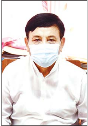
ဦးအောင်လွင်