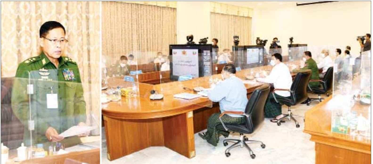
(၇၄)နှစ်မြောက် လွတ်လပ်ရေးနေ့ ကျင်းပရေးဗဟိုကော်မတီဥက္ကဋ္ဌ၊ နိုင်ငံတော်စီမံအုပ်ချုပ်ရေးကောင်စီ ဒုတိယဥက္ကဋ္ဌ ဒုတိယဝန်ကြီးချုပ် ဒုတိယဗိုလ်ချုပ်မှူးကြီး စိုးဝင်း (၇၄)နှစ်မြောက် လွတ်လပ်ရေးနေ့ ကျင်းပရေးဗဟိုကော်မတီ ပထမအကြိမ် ညှိနှိုင်းအစည်းအဝေးတွင် အမှာစကားပြောကြားစဉ်။

အစည်းအဝေးသို့ ပြည်ထောင်စု ဝန်ကြီးများ ဖြစ်ကြသည့် ဦးဝဏ္ဏမောင်လွင်၊ ဒုတိယ ဗိုလ်ချုပ်ကြီး ရာပြည့်၊ ဦးမင်းသိန်း၊ နေပြည်တော် ကောင်စီဥက္ကဋ္ဌ ဒေါက်တာ မောင်မောင်နိုင်၊ နေပြည်တော် တိုင်းစစ်ဌာနချုပ် တိုင်းမှူး ဗိုလ်ချုပ်ဇော်ဟိန်းနှင့် တာဝန်ရှိ ဖိတ်ကြားထားသူများ က ဝီဒီယိုကွန်ဖရင့်စနစ်ဖြင့် တက်ရောက်ကြသည်။ ဦးစွာ နိုင်ငံတော်စီမံအုပ်ချုပ်ရေး ကောင်စီဒုတိယဥက္ကဋ္ဌ၊ ဒုတိယ ဝန်ကြီးချုပ် ဒုတိယဗိုလ်ချုပ်မှူးကြီး စိုးဝင်းက အဖွင့်အမှာစကား ပြောကြားရာတွင် မြန်မာနိုင်ငံ လွတ်လပ်ရေးရခဲ့သည်မှာ ယခု ၂၀၂၂ ခုနှစ် ဇန်နဝါရီလ ၄ ရက် ဆိုလျှင် (၇၄)နှစ်ပြည့်မြောက်ပြီ ဖြစ်ကြောင်း၊ မိမိတို့နိုင်ငံ၏ စာမျက်နှာ ၃ ကော်လံ ၁ သို့ ။