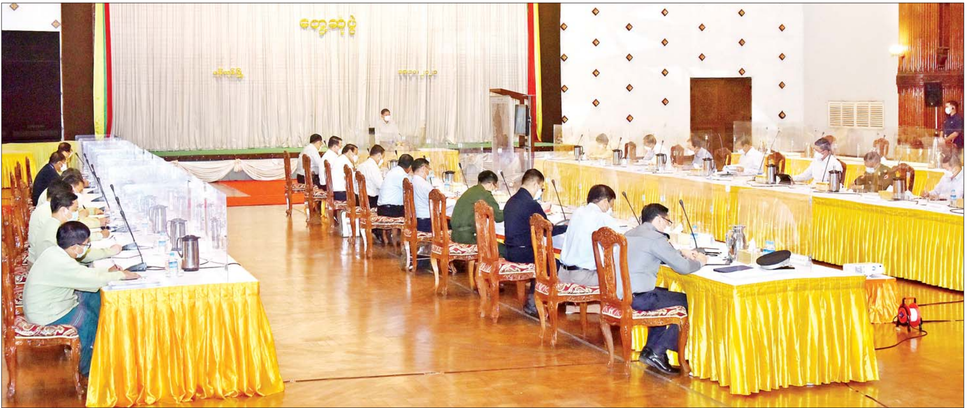
နိုင်ငံတော်စီမံအုပ်ချုပ်ရေးကောင်စီဥက္ကဋ္ဌ၊ နိုင်ငံတော်ဝန်ကြီးချုပ် ဗိုလ်ချုပ်မှူးကြီး မင်းအောင်လှိုင် ရန်ကုန်တိုင်းဒေသကြီးအစိုးရအဖွဲ့ဝန်ကြီးများနှင့် တာဝန်ရှိသူများအား တွေ့ဆုံအမှာစကားပြောကြားစဉ်။

နေပြည်တော် အောက်တိုဘာ ၁၀ နိုင်ငံတော်စီမံအုပ်ချုပ်ရေးကောင်စီဥက္ကဋ္ဌ၊ နိုင်ငံတော်ဝန်ကြီးချုပ် ဗိုလ်ချုပ်မှူးကြီး မင်းအောင်လှိုင်သည် ယနေ့မွန်းလွဲပိုင်းတွင် ရန်ကုန် တိုင်းဒေသကြီးအစိုးရအဖွဲ့ဝန်ကြီးများနှင့် တာဝန်ရှိသူများအား တိုင်းဒေသကြီးအစိုးရအဖွဲ့ရုံး၌ တွေ့ဆုံအမှာစကား ပြောကြားသည်။ အဆိုပါတွေ့ဆုံပွဲသို့ နိုင်ငံတော်စီမံအုပ်ချုပ်ရေးကောင်စီဝင် ဒုတိယ ဗိုလ်ချုပ်ကြီး မိုးမြင့်ထွန်း၊ ကောင်စီတွဲဖက်အတွင်းရေးမှူး ဒုတိယ ဗိုလ်ချုပ်ကြီး ရဝင်းဦး၊ ပြည်ထောင်စုဝန်ကြီးများ ဖြစ်ကြသည့် ဦးမောင်မောင်အုန်း၊ ဦးတင်ထွဋ်ဦး၊ ဦးလှမိုး၊ ဒေါက်တာသက်ခိုင်ဝင်း၊ ဦးခင်ရီ၊ ဦးမင်းသိန်းဇံ၊ ရန်ကုန်တိုင်းဒေသကြီး ဝန်ကြီးချုပ် ဦးလှစိုး၊ ကာကွယ်ရေးဦးစီးချုပ်ရုံးမှ တပ်မတော်အရာရှိကြီးများ၊ ရန်ကုန်တိုင်း စစ်ဌာနချုပ် တိုင်းမှူး၊ မြို့တော်ဝန်၊ တိုင်းဒေသကြီးအစိုးရအဖွဲ့ဝန်ကြီး များနှင့် တာဝန်ရှိသူများ တက်ရောက်ကြသည်။ ဦးစွာ နိုင်ငံတော်စီမံအုပ်ချုပ်ရေးကောင်စီဥက္ကဋ္ဌ၊ နိုင်ငံတော်ဝန်ကြီး ချုပ်က အဖွင့်အမှာစကားပြောကြားရာတွင် ရန်ကုန်မြို့လုံခြုံရေး၊ တရား ဥပဒေစိုးမိုးရေးနှင့်ပတ်သက်၍ ဖေဖော်ဝါရီ ၁ ရက် နောက်ပိုင်း ဆူပူ ဆန္ဒပြဖြစ်စဉ်များ ဖြစ်ပေါ်ခဲ့ချိန်၌ ရန်ကုန်မြို့တွင်လည်း ဖြစ်စဉ်များ ရှိခဲ့ကြောင်း၊ မိမိတို့အနေဖြင့် စာမျက်နှာ ၃ ကော်လံ ၁ သို့ ❖