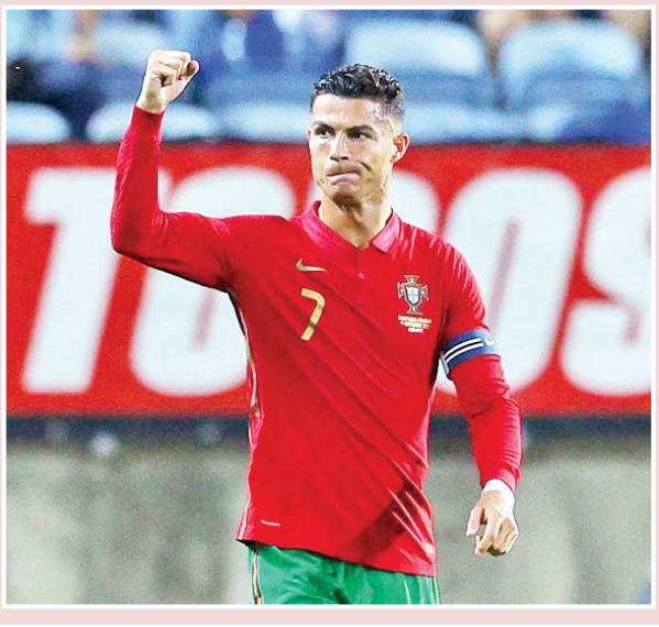
စာမျက်နှာ ၂၃ ကော်လံ ၁ သို့ ၀

တိုက်စစ်မှူး စီရိုနယ်လ်ဒိုဟာ အောက်တိုဘာ ၉ ရက်ညပိုင်းက ပေါ်တူဂီအသင်းနဲ့ ကာတာအသင်းတို့ ယှဉ်ပြိုင်ကစားခဲ့တဲ့ နိုင်ငံတကာ ချစ်ကြည်ရေးခြေစမ်းပွဲစဉ်မှာ သွင်းဂိုးတစ်ဂိုးသွင်းယူနိုင်ခဲ့တာကြောင့် ပေါ်တူဂီအသင်းနဲ့အတူ နိုင်ငံတကာသွင်းဂိုး ၁၁၂ ဂိုးအထိ စံချိန်တင် သွင်းယူနိုင်ခဲ့ပြီဖြစ်ပါတယ်။ လက်ရှိမှာ တိုက်စစ်မှူး စီရိုနယ်လ်ဒိုဟာ အမျိုးသားဘောလုံး လောကမှာ နိုင်ငံတကာသွင်းဂိုးအများဆုံးသွင်းယူနိုင်ခဲ့တဲ့ မှတ်တမ်း ကောင်းကို ရရှိထားပြီဖြစ်တဲ့အပြင် နိုင်ငံတကာသွင်းဂိုးစုစုပေါင်း ၁၀၉ ဂိုးအထိ စံချိန်တင်သွင်းယူနိုင်ခဲ့တဲ့ အသက် ၃၆ နှစ်အရွယ် အီရန် တိုက်စစ်မှူး အလီဒါအီရဲ့ စံချိန်ကို ပြီးခဲ့တဲ့လက ကျော်ဖြတ်နိုင်ခဲ့ တာဖြစ်ပါတယ်။