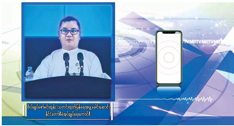
ဗိုလ်ချုပ်ဇော်မင်းထွန်း (သတင်းထုတ်ပြန်ရေးအဖွဲ့ခေါင်းဆောင်) နိုင်ငံတော်စီမံအုပ်ချုပ်ရေးကောင်စီ