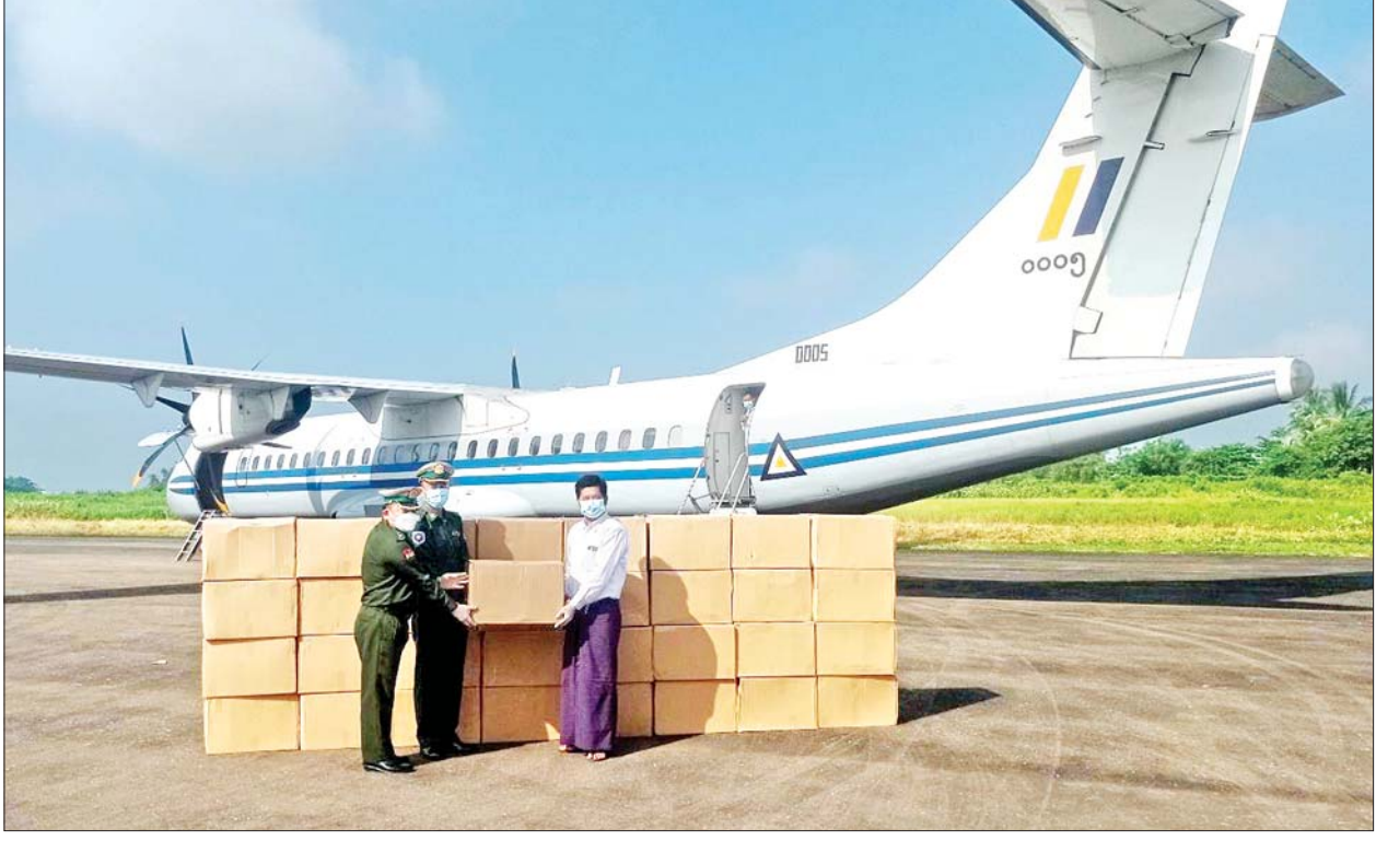
ကိုဗစ်-၁၉ ရောဂါ ကာကွယ်ဆေးများ စစ်တွေလေဆိပ်သို့ ရောက်ရှိစဉ်။