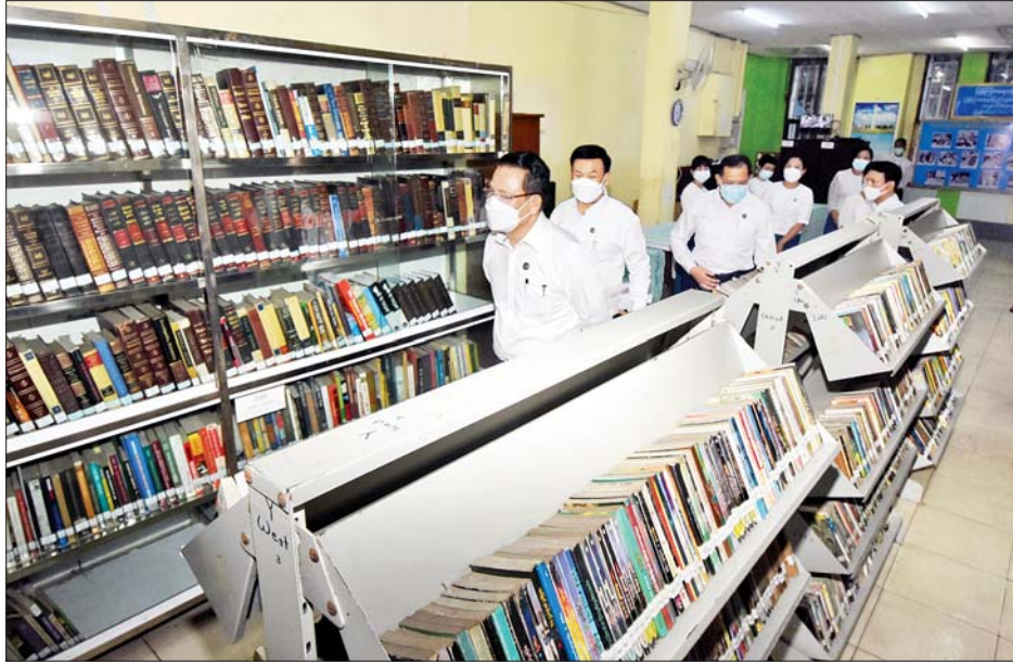
ပြည်ထောင်စုဝန်ကြီး ဦးမောင်မောင်အုန်း ရန်ကုန်မြို့ ပန်းဆိုးတန်းလမ်းရှိ ပညာအလင်းခေတ်မီ စာကြည့်တိုက်၏ စာကြည့်တိုက် ဝန်ဆောင်မှုလုပ်ငန်းများကို ကြည့်ရှုစစ်ဆေးစဉ်။

ရန်ကုန် အောက်တိုဘာ ၁၀ ပြန်ကြားရေးဝန်ကြီးဌာန ပြည်ထောင်စုဝန်ကြီး ဦးမောင်မောင်အုန်းသည် ယနေ့ ညနေပိုင်းတွင် ရန်ကုန်မြို့ ဗဟန်းမြို့နယ် ဝက်ပါလမ်းရှိ မူပိုင်ခွင့်နှင့် မှတ်ပုံတင်ဌာနခွဲနှင့် ကျောက်တံတားမြို့နယ် ပန်းဆိုးတန်းလမ်းရှိ ပညာအလင်းခေတ်မီစာကြည့်တိုက်များကို သွားရောက်စစ်ဆေး၍ သတင်းမီဒီယာ လုပ်ငန်းများ ဖွံ့ဖြိုးတိုးတက်ရေးနှင့် ပြည်သူများ သတင်းအချက်အလက် မှန်ကန်စွာရရှိရေးအတွက် နည်းလမ်းပေါင်းစုံဖြင့် ကြိုးပမ်းဆောင်ရွက်ကြရန် ဆွေးနွေးမှာကြားသည်။