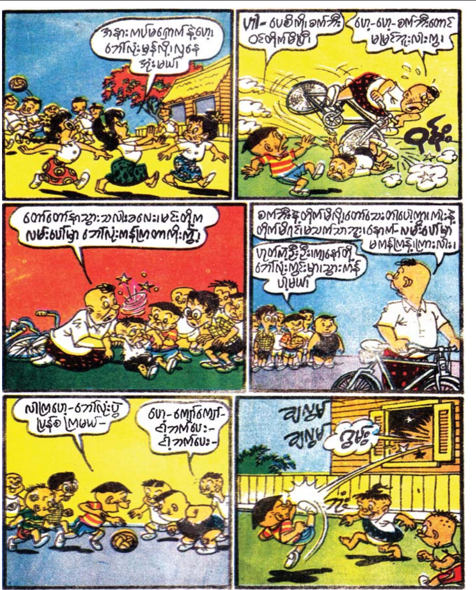
ရွှေသွေးရာနယ် အတွဲ(၁)၊ အမှတ်(၇)၊ (၁၅-၂-၆၉)