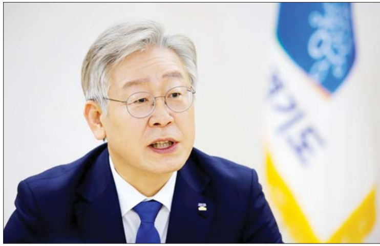
သမ္မတ မွန်ဂျေအင်း ပြီးနောက် တောင်ကိုရီးယားသမ္မတအသစ် နေရာ အတွက် လီဂျေမြောင်သည် အသင့်

နေရာ ၁၁ နေရာတွင် ကျင်းပပြုလုပ်သည်။ လီဂျေမြောင်သည် ထောက်ခံမဲ အများဆုံးရရှိကြောင်း ဒီမိုကရက်တစ် ပါတီက ယနေ့ကြေညာသည်။ လီဂျေမြောင်၏ မူဝါဒဆိုင်ရာ အချက် အလက်များသည် လွယ်ကူနားလည်နိုင် သည့်အတွက် ပါတီဝင်ဆန္ဒမဲပေးသူများ အကြား ရေပန်းစားလျက်ရှိသည်။ နိုင်ငံသားတိုင်း၏ စီးပွားရေး သာယာဝပြောမှုအတွက် အာမခံချက် ပေးနိုင်သည့် အခြေခံလုပ်ခလစာပေးချေမှု အစီအစဉ်တစ်ရပ်ကို ချမှတ်အကောင် အထည်ဖော်ဆောင်ရွက်ခြင်းဖြင့် နိုင်ငံ၏ ချမ်းသာကြွယ်ဝမှု ကွာဟခြင်းပြဿနာကို ဖြေရှင်းနိုင်ကြောင်း လီဂျေမြောင်က ဆိုသည်။