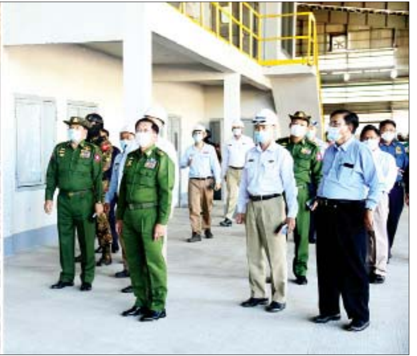
နိုင်ငံတော်စီမံအုပ်ချုပ်ရေးကောင်စီဥက္ကဋ္ဌ၊ နိုင်ငံတော်ဝန်ကြီးချုပ် ဗိုလ်ချုပ်မှူးကြီးမင်းအောင်လှိုင် အမှတ်(၃) သံမဏိစက်ရုံ(ရွာမ)အတွင်း ကြည့်ရှုစစ်ဆေးစဉ်။