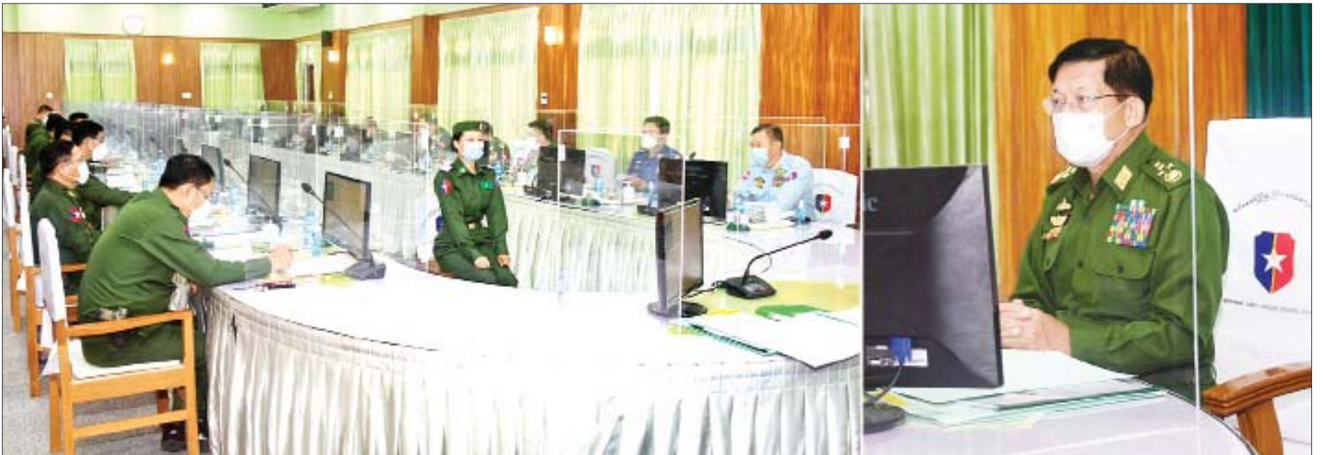
နိုင်ငံတော်စီမံအုပ်ချုပ်ရေးကောင်စီဥက္ကဋ္ဌ၊ တပ်မတော်ကာကွယ်ရေးဦးစီးချုပ် ဗိုလ်ချုပ်မှူးကြီး မင်းအောင်လှိုင် တပ်မတော်(ကြည်း) ဗိုလ်သင်တန်းကျောင်း(မှော်ဘီ) ဘွဲ့ရအမျိုးသမီးဗိုလ်လောင်းသင်တန်း အမှတ်စဉ်(၈) စစ်လက်ရုံးရွေးချယ်ပွဲသို့ တက်ရောက်စိစစ်ရွေးချယ်စဉ်။