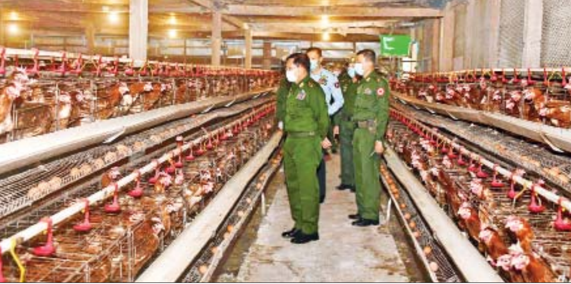
နိုင်ငံတော်စီမံအုပ်ချုပ်ရေးကောင်စီဥက္ကဋ္ဌ၊ တပ်မတော်ကာကွယ်ရေးဦးစီးချုပ် ဗိုလ်ချုပ်မှူးကြီး မင်းအောင်လှိုင် ရန်ကုန်တိုင်း စစ်ဌာနချုပ် ဘက်စုံစိုက်ပျိုးမွေးမြူရေးစခန်း(တညင်းကုန်း)တွင် ဥစားကြက်များ မွေးမြူထားမှုကို ကြည့်ရှုစစ်ဆေးစဉ်။

အွန်လိုင်း မီဒီယာများမှလည်း တိုးတက်နေသည့် စိုက်ပျိုးမွေးမြူရေး နည်းစနစ်များကို မျက်ခြည်မပြတ် လေ့လာ၍ သုတေသနပြုဆောင်ရွက်သွား ရန်လိုကြောင်း၊ စိုက်ပျိုးမွေးမြူရေးလုပ်ငန်း များကို အောင်မြင်အောင် ဆောင်ရွက်ပြီး တပ်မတော်သားများ၊ မိသားစုဝင်များ၏ သက်သာချောင်ချိရေးကို ဖြည့်ဆည်းပေး နိုင်ရမည်ဖြစ်ကြောင်း၊ ထို့ပြင် မိမိတို့ တပ်မတော်သားများ၏ စားသောက် နေထိုင်မှုမှအစ လူနေမှုအဆင့်အတန်းကို မြှင့်တင်ဆောင်ရွက်ပေးနိုင်ရမည်ဖြစ်ပြီး ရသင့်ရထိုက်သည့် ရပိုင်ခွင့်များအပြင် အခြားလိုအပ်ချက်များကို တတ်စွမ်း သရွေ့ ဖြည့်ဆည်းဆောင်ရွက်ပေးရန် လိုအပ်မည်ဖြစ်ကြောင်း။