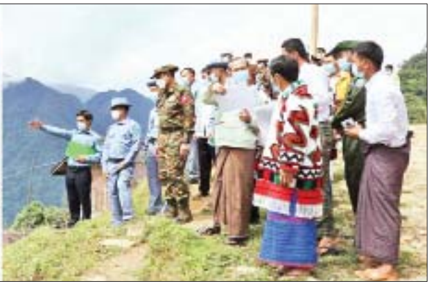
ပြည်ထောင်စုဝန်ကြီး ဒုတိယဗိုလ်ချုပ်ကြီး ထွန်းထွန်းနောင် ခေါင်လန်ဖူးမြို့၊ ဖွံ့ဖြိုးတိုးတက်ရေးနှင့် မြို့ကွက်သစ်တိုးချဲ့ရေးအတွက် ဆောင်ရွက်ရမည့်ကိစ္စရပ်များအား လိုက်လံကြည့်ရှုစစ်ဆေးစဉ်။

လျက်ရှိသော မလိခမြစ်ကူး ရီဒမ်းတံတား ပေ ၆၈၀ သို့ ရောက်ရှိ လေ့လာကြည့်ရှုသည်။ ယင်းနောက် ရီဒမ်းတံတားနှင့် ခေါင်လန်ဖူးမြို့ (၆၅/၄) မိုင်အကြား လမ်းပိုင်းတွင် ဆောင်ရွက်လျက်ရှိသည့် လမ်းတာချဲ့ ခြင်းလုပ်ငန်းများ၊ တံတားများ၊ Box Culvert များကို ကြည့်ရှုစစ်ဆေးပြီး လိုအပ်သည်များကို မှာကြား၍ လမ်းဖောက်လုပ်ရေးအဖွဲ့များကို တွေ့ဆုံ အားပေးစကား ပြောကြားသည်။