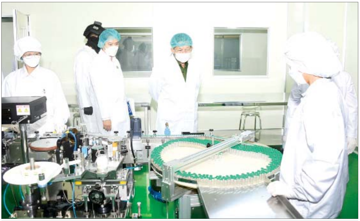
နိုင်ငံတော်စီမံအုပ်ချုပ်ရေးကောင်စီဥက္ကဋ္ဌ၊ နိုင်ငံတော်ဝန်ကြီးချုပ် ဗိုလ်ချုပ်မှူးကြီးမင်းအောင်လှိုင် ဆေးဝါးစက်ရုံ(အင်းစိန်)၊ ဆေးဝါးစက်ရုံခွဲ(ရွာသာကြီး)၊ အသည်းရောင် အသားဝါ(ဘီ)ကာကွယ်ဆေးစက်ရုံအတွင်း ဆေးဝါးထုတ်လုပ်မှုအဆင့်ဆင့်ကို လှည့်လည်ကြည့်ရှုစဉ်။

နေပြည်တော် အောက်တိုဘာ ၈ နိုင်ငံတော်စီမံအုပ်ချုပ်ရေးကောင်စီဥက္ကဋ္ဌ၊ နိုင်ငံတော်ဝန်ကြီးချုပ် ဗိုလ်ချုပ်မှူးကြီး မင်းအောင်လှိုင်သည် နိုင်ငံတော်စီမံ အုပ်ချုပ်ရေးကောင်စီဝင်များ ဖြစ်ကြသည့် ဗိုလ်ချုပ်ကြီး မောင်မောင်ကျော်၊ ဒုတိယ ဗိုလ်ချုပ်ကြီး မိုးမြင့်ထွန်း၊ ကောင်စီတွဲဖက် အတွင်းရေးမှူး ဒုတိယဗိုလ်ချုပ်ကြီး ရဲဝင်းဦး၊ စက်မှုဝန်ကြီးဌာန ပြည်ထောင်စု ဝန်ကြီး ဒေါက်တာချာလီသန်း၊ ကျန်းမာရေး ဝန်ကြီးဌာန ပြည်ထောင်စုဝန်ကြီး ဒေါက်တာသက်ခိုင်ဝင်း၊ ရန်ကုန် တိုင်းဒေသကြီးဝန်ကြီးချုပ် ဦးလှစိုး၊ ကာကွယ်ရေးဦးစီးချုပ်(ရေ) ဗိုလ်ချုပ်ကြီး မိုးအောင်၊ ကာကွယ်ရေးဦးစီးချုပ်ရုံးမှ တပ်မတော်အရာရှိကြီးများ၊ ရန်ကုန်တိုင်း စစ်ဌာနချုပ်တိုင်းမှူး၊ ရန်ကုန်မြို့တော်ဝန် နှင့် တာဝန်ရှိသူများလိုက်ပါ၍ ယနေ့ မွန်းလွဲပိုင်းတွင် ရန်ကုန်တိုင်းဒေသကြီး အင်းစိန်မြို့နယ်ရှိ မြန်မာစီးပွားရေး ကော်ပိုရေးရှင်း၊ အမှတ်(၃) သံမဏိစက်ရုံ (ရွာမ)နှင့် ဆေးဝါးစက်ရုံ(အင်းစိန်)၊ ဆေးဝါးစက်ရုံခွဲ(ရွာသာကြီး)၊ အသည်းရောင်အသားဝါ(ဘီ) ကာကွယ်ဆေးစက်ရုံ တို့သို့ သွားရောက်ကြည့်ရှုစစ်ဆေးသည်။ စာမျက်နှာ ၃ ကော်လံ ၁ သို့ ၀