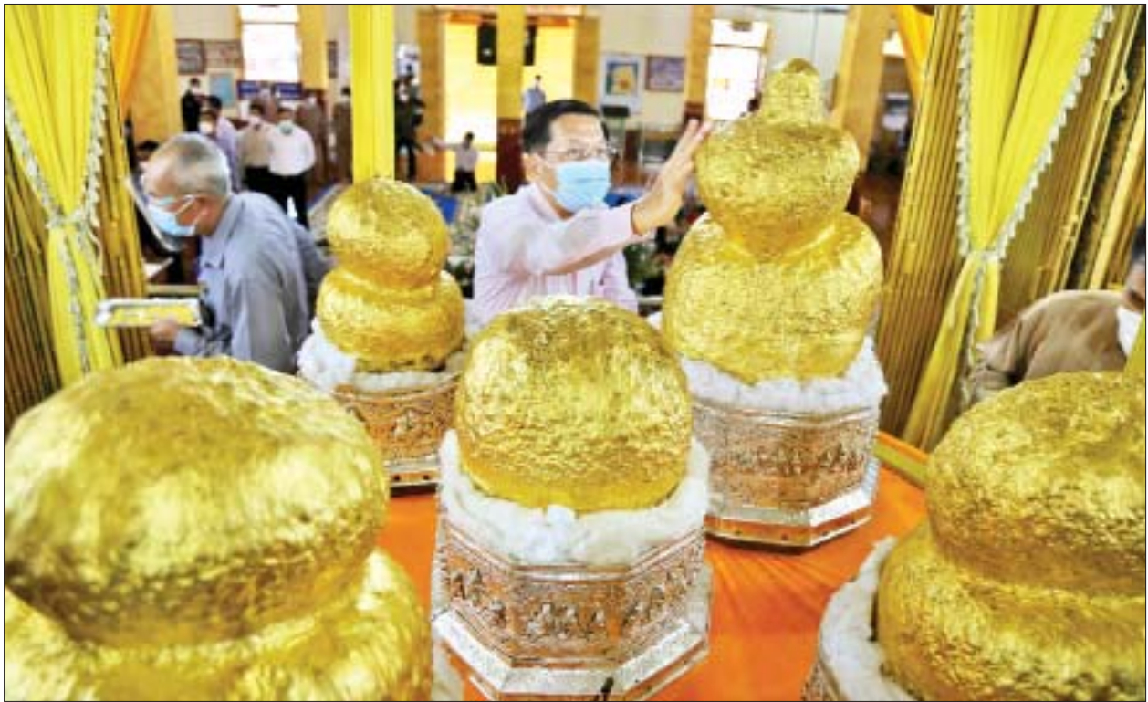
နိုင်ငံတော်စီမံအုပ်ချုပ်ရေးကောင်စီဥက္ကဋ္ဌ၊ နိုင်ငံတော်ဝန်ကြီးချုပ် ဗိုလ်ချုပ်မှူးကြီး မင်းအောင်လှိုင် အင်းလေးဖောင်တော်ဦး စေတီတော် မြတ်ကြီးအတွင်းရှိ ဗုဒ္ဓရုပ်ပွားတော်မြတ်များကို ရွှေသင်္ကန်း ကပ်လှူပူဇော်စဉ်။

၎င်းနောက် စေတီတော်မြတ်ကြီးအား လက်ယာရစ် လှည့်လည် ပူဇော်ပြီး စိန်နှင့် မြကျောင်းတိုက်အတွင်း၌ ဖောင်တော်ဦးစေတီတော် မြတ်ကြီး ဆရာတော် ဘဒ္ဒန္တဝိဇယနှင့် သံဃာတော်များအား ဖူးမြော် ကြည့်ညိပြီး လှူဖွယ်ပစ္စည်းများနှင့် နဝကမ္မအလှူငွေများ ဆက်ကပ် လှူဒါန်းသည်။ ထို့နောက် ဆရာတော်ကြီး၏ ကျန်းမာရေးဆိုင်ရာများနှင့်