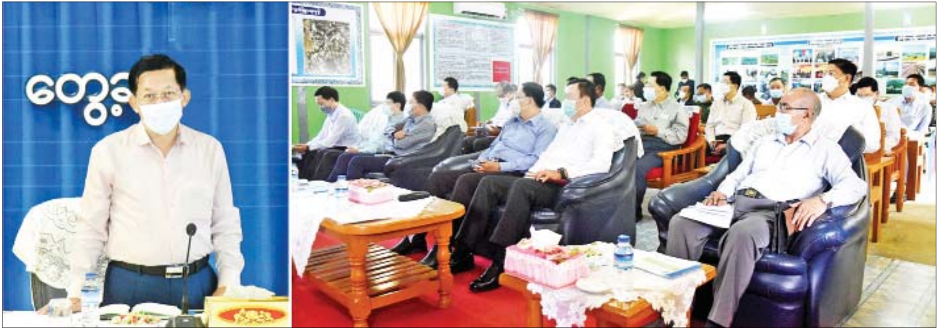
နိုင်ငံတော်စီမံအုပ်ချုပ်ရေးကောင်စီဥက္ကဋ္ဌ၊ နိုင်ငံတော်ဝန်ကြီးချုပ် ဗိုလ်ချုပ်မှူးကြီး မင်းအောင်လှိုင် ရှမ်းရိုးမမွေးမြူရေးဇုန်ရှင်းလင်းဆောင်ရွက်ရာတွင် တာဝန်ရှိသူများအား တွေ့ဆုံမှာကြားစဉ်။

နေပြည်တော် အောက်တိုဘာ ၂ နိုင်ငံတော်စီမံအုပ်ချုပ်ရေးကောင်စီ ဥက္ကဋ္ဌ၊ နိုင်ငံတော်ဝန်ကြီးချုပ် ဗိုလ်ချုပ်မှူးကြီးမင်းအောင်လှိုင်သည် နိုင်ငံတော်စီမံအုပ်ချုပ်ရေး ကောင်စီအဖွဲ့ဝင်များ၊ ပြည်ထောင်စုဝန်ကြီးများ၊ ရှမ်းပြည်နယ်ဝန်ကြီးချုပ်၊ ကာကွယ်ရေးဦးစီးချုပ်မှူးမှ တပ်မတော်အရာရှိကြီးများ၊ အရှေ့ပိုင်း တိုင်းစစ်ဌာနချုပ်တိုင်းမှူးနှင့် တာဝန်ရှိသူများလိုက်ပါ၍ ယနေ့ နံနက်ပိုင်းတွင် တောင်ကြီးမြို့ အေးသာယာစက်မှုဇုန်အတွင်းရှိ ရှမ်းရိုးမ မွေးမြူရေးဇုန်၌ ဥစားကြက်မွေးမြူထားရှိမှုနှင့် မျိုးဖောက်ဝက်မွေးမြူ ထားရှိမှုတို့ကို သွားရောက်ကြည့်ရှုအားပေးသည်။