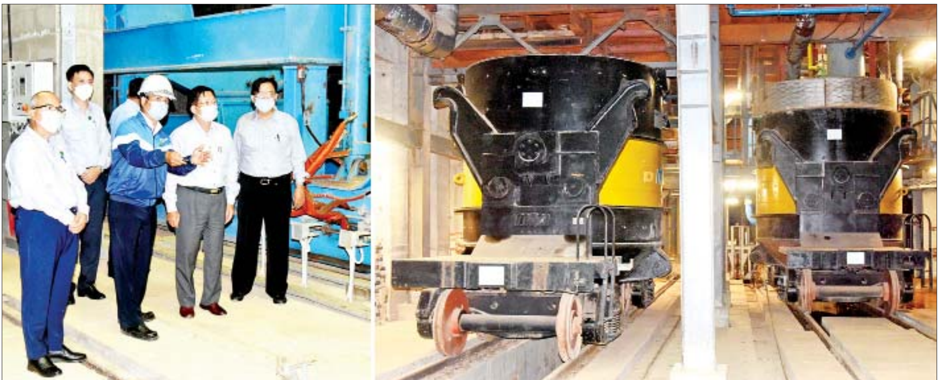
နိုင်ငံတော်စီမံအုပ်ချုပ်ရေးကောင်စီဥက္ကဋ္ဌ၊ နိုင်ငံတော်ဝန်ကြီးချုပ် ဗိုလ်ချုပ်မှူးကြီး မင်းအောင်လှိုင် အမှတ်(၂) သံမဏိစက်ရုံ (ပင်းပက်)အတွင်း ကြည့်ရှုစစ်ဆေးစဉ်။

အမှတ်(၂)သံမဏိစက်ရုံ(ပင်းပက်)စီမံကိန်းသည် မြန်မာနိုင်ငံတွင် ပထမဦးဆုံး စတင်အကောင်အထည်ဖော်ခဲ့သည့် သံနှင့် သံမဏိစက်ရုံ စီမံကိန်းကြီးတစ်ခုဖြစ် သံ၊ သံမဏိ ထုတ်ကုန်များကို ပြည်ပသွင်းကုန်အဖြစ် တင်သွင်းရန်မလိုဘဲ ပြည်တွင်းလိုအပ်ချက်ကို ဖြည့်ဆည်းပေးနိုင်မည်