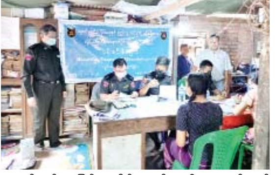
ဆောင်ရွက်ပေးခြင်း၊ အိမ်ထောင်စုလူဦးရေစာရင်းတွင် ကလေးမွေးတိုးစာရင်း ဖြည့်စွက်ရေးသွင်းပေးခြင်း၊ အသေစာရင်းပယ်ဖျက်ပေးခြင်းများကို နေ့ချင်းပြီး အခမဲ့ဆောင်ရွက်ပေးခဲ့ကြောင်း သိရသည်။ ဝေဝေ(ပြန်ဆက်)

ရန်ကုန် အောက်တိုဘာ ၂ လူဝင်မှုကြီးကြပ်ရေးနှင့် ပြည်သူ့အင်အားဝန်ကြီးဌာန ရန်ကုန်တိုင်းဒေသကြီး လှိုင်သာယာ(အနောက်ပိုင်း)မြို့နယ် လူဝင်မှုကြီးကြပ်ရေးနှင့် ပြည်သူ့အင်အားဦးစီးဌာနမှ ပန်းခင်းစီမံချက်ဖြင့် နိုင်ငံသားစိစစ်ရေးကတ်ပြားနှင့် အိမ်ထောင်စုလူဦးရေစာရင်းကွင်းဆင်းဆောင်ရွက်ပေးခြင်းကို ယနေ့ နံနက် ၉ နာရီခွဲက လှိုင်သာယာ(အနောက်ပိုင်း)မြို့နယ် အမှတ်(၁၆)ရပ်ကွက်သို့ သွားရောက်ပြီး နိုင်ငံသားစိစစ်ရေးကတ်ပြားနှင့် အိမ်ထောင်စုလူဦးရေစာရင်း ပြုလုပ်လိုသူများကို နေ့ချင်းပြီး အခမဲ့ကွင်းဆင်းဆောင်ရွက်ပေးခဲ့ကြောင်း သိရသည်။