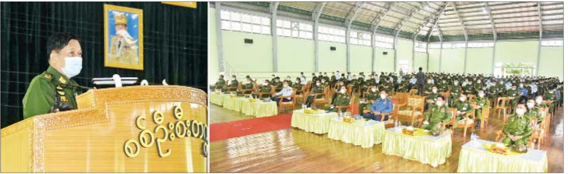
နိုင်ငံတော်စီမံအုပ်ချုပ်ရေးကောင်စီဥက္ကဋ္ဌ၊ တပ်မတော်ကာကွယ်ရေးဦးစီးချုပ် ဗိုလ်ချုပ်မှူးကြီးမင်းအောင်လှိုင် ကလောမြို့ရှိ စစ်ဦးစီးတက္ကသိုလ်မှ နည်းပြအရာရှိကြီးများနှင့် သင်တန်းသားအရာရှိကြီးများအား တွေ့ဆုံအမှာစကားပြောကြားစဉ်။