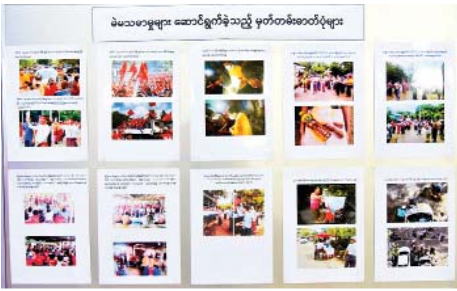
မဲမာမာမှုများ ဆောင်ရွက်ခဲ့သည့် မှတ်တမ်းဓာတ်ပုံများကို တွေ့ရစဉ်။

အဓိကထားဆောင်ရွက်လျက်ရှိ ဗိုလ်ချုပ် ဇော်မင်းထွန်းက ရွှေဈေး၊ ဒေါ်လာ ဈေးနှင့်ပတ်သက်ပြီး ရွှေဈေး၊ ဒေါ်လာဈေးထက် သာယာဝပြောရေးနှင့်ဖူလုံရေးကို အဓိကထား ဆောင်ရွက်နေလျက်ရှိကြောင်း၊ ပထမဆုံးအနေဖြင့် ပြည်တွင်းစီးပွားရေးလုပ်ငန်းများ ပြန်လည် လည်ပတ်ရန်၊ ကျဆင်းနေသည့်စီးပွားရေး အဆင် ပြေစွာ စီးဆင်းလည်ပတ်စေရန်အတွက် နိုင်ငံတော် အစိုးရအနေဖြင့် ဆောင်ရွက်လျက်ရှိကြောင်း၊ ဒေါ်လာဈေးမြင့်တက်လာမှုနှင့်ပတ်သက်ပြီး မြန်မာ နိုင်ငံတော်ဗဟိုဘဏ်က နိုင်ငံခြားငွေရောင်းချပေး ခြင်း၊ ပြည်ပပို့ကုန်ရငွေများ အချိန်မီ ပြန်လည်ရရှိ အောင် ဆောင်ရွက်ပေးခြင်း၊ ပို့ကုန်ရငွေများ လက်ဝယ်ကိုင်ဆောင်မှုများကို အချိန်ကာလ