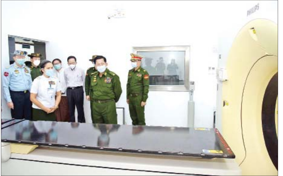
နိုင်ငံတော်စီမံအုပ်ချုပ်ရေးကောင်စီဥက္ကဋ္ဌ၊ တပ်မတော်ကာကွယ်ရေးဦးစီးချုပ် ဗိုလ်ချုပ်မှူးကြီး မင်းအောင်လှိုင် ဓာတ်ရောင်ခြည်ကုသဆောင်နှင့် ကင်ဆာရောဂါ ခွဲစိတ်ကုသဆောင်အတွင်း စက်ပစ္စည်းများ တပ်ဆင်ထားမှုကို လိုက်လံ ကြည့်ရှုစဉ်။

ဦးစွာ နိုင်ငံတော်စီမံအုပ်ချုပ်ရေး ကောင်စီဥက္ကဋ္ဌ၊ တပ်မတော်ကာကွယ်ရေး ဦးစီးချုပ်က ဓာတ်ရောင်ခြည်ကုသဆောင် နှင့် ကင်ဆာရောဂါ ခွဲစိတ်ကုသဆောင် အား စက်ခလုတ်နှိပ်ဖွင့်လှစ်ပေးပြီး နိုင်ငံတော်စီမံအုပ်ချုပ်ရေးကောင်စီဥက္ကဋ္ဌ၊ တပ်မတော်ကာကွယ်ရေးဦးစီးချုပ်နှင့် အခမ်းအနား တက်ရောက် လာကြသူများက ဓာတ်ရောင်ခြည် ကုသဆောင်နှင့် ကင်ဆာရောဂါ ခွဲစိတ် ကုသဆောင်အတွင်း စက်ပစ္စည်းများ တပ်ဆင်ထားမှု အခြေအနေများအား လိုက်လံကြည့်ရှုရာ တာဝန်ရှိသူများက ရှင်းလင်းတင်ပြကြသည်။ ယင်းနောက်နိုင်ငံတော်စီမံအုပ်ချုပ်ရေး ကောင်စီဥက္ကဋ္ဌ၊ တပ်မတော်ကာကွယ်ရေး ဦးစီးချုပ်နှင့် အဖွဲ့ဝင်များသည် ဆေးရုံ