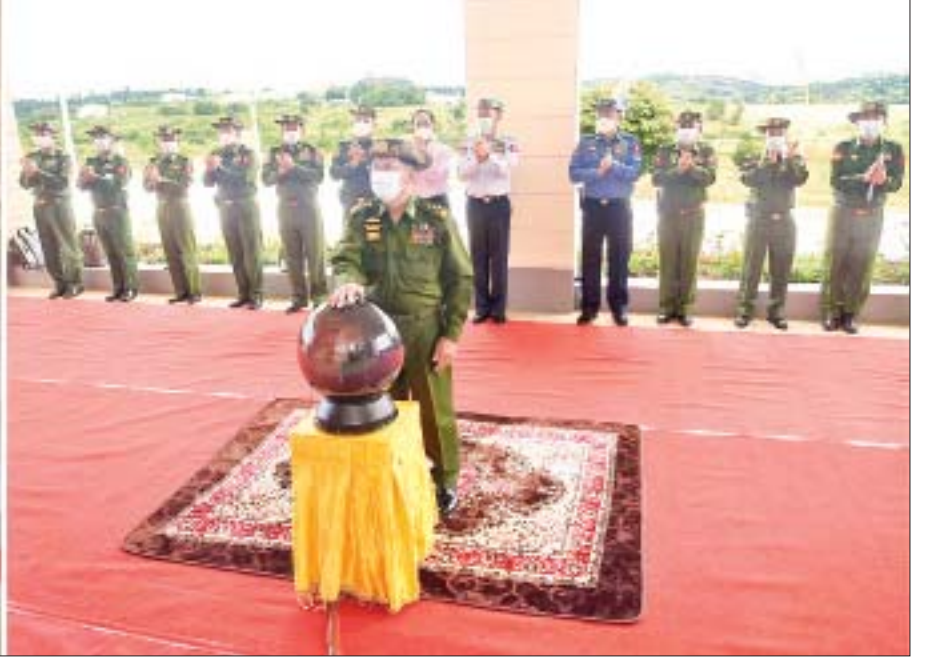
နိုင်ငံတော်စီမံအုပ်ချုပ်ရေးကောင်စီဥက္ကဋ္ဌ၊ တပ်မတော်ကာကွယ်ရေးဦးစီးချုပ် ဗိုလ်ချုပ်မှူးကြီး မင်းအောင်လှိုင် ဓာတ်ရောင်ခြည်ကုသဆောင်အား စက်ခလုတ်နှိပ် ဖွင့်လှစ်ပေးစဉ်။

နေပြည်တော် အောက်တိုဘာ ၂ ရှမ်းပြည်နယ်တောင်ပိုင်း အောင်ပန်းမြို့ရှိ တပ်မတော်ဆေးရုံ ဓာတ်ရောင်ခြည် ကုသဆောင်နှင့် ကင်ဆာရောဂါ ခွဲစိတ် ကုသဆောင် ဖွင့်လှစ်ပွဲအခမ်းအနားကို ယနေ့မွန်းလွဲပိုင်းတွင် ကျင်းပပြုလုပ်ရာ နိုင်ငံတော် စီမံအုပ်ချုပ်ရေးကောင်စီ ဥက္ကဋ္ဌ၊ တပ်မတော်ကာကွယ်ရေးဦးစီးချုပ် ဗိုလ်ချုပ်မှူးကြီး မင်းအောင်လှိုင် တက်ရောက်ဖွင့်လှစ်သည်။ တက်ရောက် အခမ်းအနားသို့ ကောင်စီဝင်များ ဖြစ်ကြသည့် ဗိုလ်ချုပ်ကြီး မောင်မောင် ကျော်၊ ဒုတိယဗိုလ်ချုပ်ကြီး မိုးမြင့်ထွန်း၊ ကောင်စီတွဲဖက်အတွင်းရေးမှူး ဒုတိယ ဗိုလ်ချုပ်ကြီး ရဲဝင်းဦး၊ ကျန်းမာရေး ဝန်ကြီးဌာန ပြည်ထောင်စုဝန်ကြီး ဒေါက်တာသက်ခိုင်ဝင်း၊ ကာကွယ်ရေး ဦးစီးချုပ်(ရေ) ဗိုလ်ချုပ်ကြီး မိုးအောင်၊ ကာကွယ်ရေးဦးစီးချုပ်ရုံးမှ တပ်မတော် အရာရှိကြီးများ၊ အရှေ့ပိုင်းတိုင်းစစ်ဌာန ချုပ် တိုင်းမှူးဗိုလ်မှူးချုပ် နီလင်းအောင်၊ ဆေးရုံတပ်မှူး ဗိုလ်မှူးချုပ် စောရန်နိုင်၊ တပ်မတော်ပါရဂူများနှင့် ဆေးမှူးများ တက်ရောက်ကြသည်။