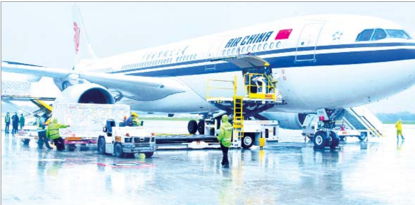
တရုတ်ပြည်သူ့သမ္မတနိုင်ငံမှ ဝယ်ယူသည့် Sinopharm အမှတ်တံဆိပ် ကိုဗစ်-၁၉ ရောဂါ ကာကွယ်ဆေး အကြိမ်ရေ လေးသန်း ရန်ကုန်အပြည်ပြည်ဆိုင်ရာ လေဆိပ်သို့ ရောက်ရှိစဉ်။

အောက်တိုဘာ ၁ ရက်အထိ မြန်မာနိုင်ငံတွင် ကိုဗစ်-၁၉ ရောဂါကာကွယ်ဆေး အကြိမ်ရေ စုစုပေါင်း ၁၂၁၂၇၅၀၁ ကြိမ် ထိုးနှံပြီးဖြစ်