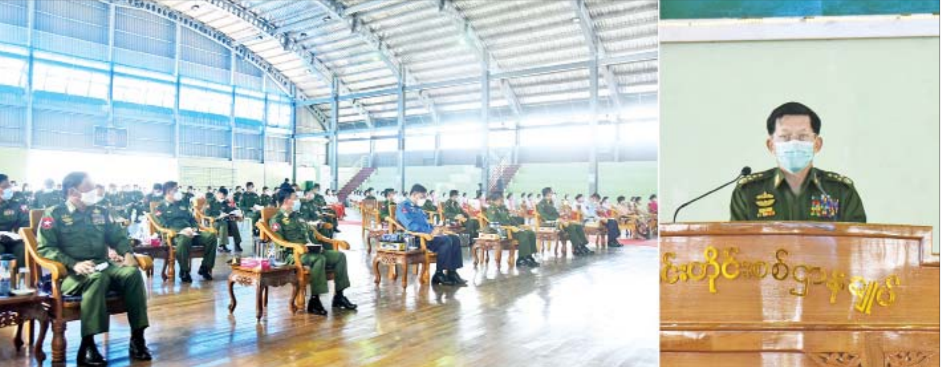
နိုင်ငံတော်စီမံအုပ်ချုပ်ရေးကောင်စီဥက္ကဋ္ဌ၊ တပ်မတော်ကာကွယ်ရေးဦးစီးချုပ် ဗိုလ်ချုပ်မှူးကြီး မင်းအောင်လှိုင် အရှေ့ပိုင်းတိုင်းစစ်ဌာနချုပ်၊ တောင်ကြီးတပ်နယ်ရှိ အရာရှိ၊ စစ်သည်၊ မိသားစုများအား တိုင်းစစ်ဌာနချုပ်ခန်းမ၌ တွေ့ဆုံအမှာစကားပြောကြားစဉ်။

နေပြည်တော် အောက်တိုဘာ ၁ တပ်မတော်သားတိုင်းအနေဖြင့် တစ်ဦးချင်းအဆင့် လိုက်နာစဉ်လုပ်ဆောင်ရမည့် လုပ်ငန်းတာဝန်များကို မှန်မှန်ကန်ကန်ဖြင့် ကျေပွန်အောင် လုပ်ဆောင်နေခြင်းသည် စစ်စည်းကမ်းကောင်းမွန်မှုနှင့် အမိန့်နာခံမှုကို ဖော်ပြနေခြင်းပင်ဖြစ်ကြောင်း၊ ဆံပင်ပုံစံမှစ၍ ဖိနပ်ကြိုးစည်းသည်အဆုံး နေထိုင်သွားလာမှု၊ ဝတ်စားဆင်ယင်မှု၊ စားသောက်မှုပုံစံများအားလုံး စည်းကမ်းစနစ်တကျရှိနေခြင်းသည် စစ်သားကောင်းတစ်ယောက်၏ အလေ့အကျင့်ကောင်းများပင်ဖြစ်သည့်အတွက် တစ်ဦးချင်း စည်းကမ်းစနစ်တကျရှိအောင် နေထိုင်ကြရန်နှင့် အစဉ်အလာကောင်းများကို ဆက်လက်ထိန်းသိမ်းဆောင်ရွက်သွားကြရမည်ဖြစ်ကြောင်းဖြင့် နိုင်ငံတော်စီမံအုပ်ချုပ်ရေးကောင်စီဥက္ကဋ္ဌ၊ တပ်မတော်ကာကွယ်ရေးဦးစီးချုပ် ဗိုလ်ချုပ်မှူးကြီး မင်းအောင်လှိုင်က ယနေ့မွန်းလွဲပိုင်းတွင် အရှေ့ပိုင်းတိုင်းစစ်ဌာနချုပ်၊ တောင်ကြီးတပ်နယ်ရှိ အရာရှိ၊ စစ်သည်၊ မိသားစုများအား တိုင်းစစ်ဌာနချုပ်ခန်းမ၌ တွေ့ဆုံအမှာစကားပြောကြားစဉ် ထည့်သွင်းပြောကြားသည်။