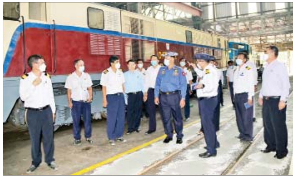
ပေါင်အလုပ်ရုံ(မလ္လကုန်း) လုပ်ငန်းခွင်အတွင်း လှည့်လည်ကြည့်ရှုစစ်ဆေးသည်။ ယင်းနောက် မြန်မာ့မီးရထားပြတိုက်ဆောက်လုပ်မည့်လျာထားမြေနေရာ သုံးခုကို ကြည့်ရှုစစ်ဆေး၍ လိုအပ်သည်များ မှာကြားသည်။

နေပြည်တော် အောက်တိုဘာ ၁ ပို့ဆောင်ရေးနှင့် ဆက်သွယ်ရေးဝန်ကြီးဌာန ပြည်ထောင်စုဝန်ကြီး ဗိုလ်ချုပ်ကြီးတင်အောင်စန်းသည် ယနေ့နံနက်ပိုင်းတွင် ရန်ကုန်တိုင်းဒေသကြီးရှိ မြန်မာ့မီးရထား တံတားပေါင်အလုပ်ရုံ (မလ္လကုန်း)၊ မလ္လကုန်းဘူတာယာဒ်ဝင်း၊ ဒီဇယ်စက်ခေါင်း စက်ရုံ (အင်းစိန်)၊ မြန်မာ့မီးရထားဆေးရုံ(အင်းစိန်)နှင့် မြန်မာ့သင်္ဘောကျင်းလုပ်ငန်းတို့ကို သွားရောက်ကြည့်ရှုစစ်ဆေးသည်။