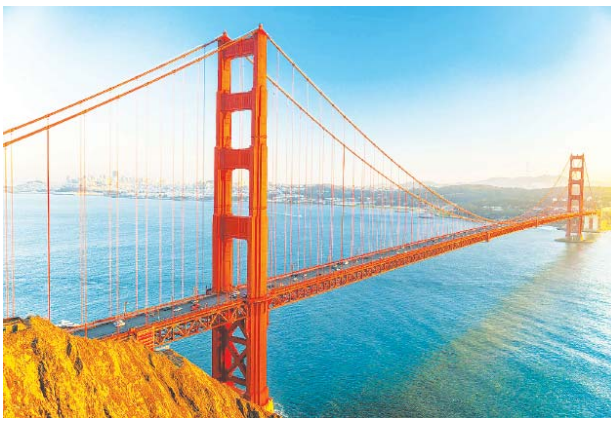
the longest until 1964). The bridge is 90 feet wide, and its span is 220 feet above the water. The towers supporting the huge cables rise 746 feet above the waters of the Golden Gate Strait, making them 191 feet taller than the Washington Monument. Each steel cable is 7,650 feet long and has a diameter of 36 inches. About 40 million automobiles cross the bridge every year.

ယခုစာမျက်နှာတွင် စာဖတ်စွမ်းရည်မြှင့်တင်ရေးကဏ္ဍအတွက် THE GOLDEN GATE BRIDGE အကြောင်းကို ဖော်ပြထားပါသည်။ စာပိုဒ်ဖတ်ပြီး ပါက နားလည်နိုင်စွမ်း မည်မျှရှိသလဲဆိုသည်ကို သိရှိနိုင်ရန် လေ့ကျင့်ခန်းများကို ဖြေဆိုနိုင်ပါသည်။