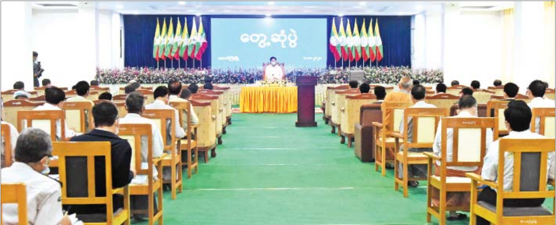
နိုင်ငံတော်စီမံအုပ်ချုပ်ရေးကောင်စီဥက္ကဋ္ဌ၊ နိုင်ငံတော်ဝန်ကြီးချုပ် ဗိုလ်ချုပ်မှူးကြီးမင်းအောင်လှိုင် ရှမ်းပြည်နယ်အစိုးရအဖွဲ့ဝင်များ၊ ကိုယ်ပိုင်အုပ်ချုပ်ခွင့်ရဒေသများမှ တာဝန်ရှိသူများ၊ ဌာနဆိုင်ရာဝန်ထမ်းများ၊ ခရိုင်၊ မြို့နယ်စီမံအုပ်ချုပ်ရေးအဖွဲ့ဝင်များနှင့် မြို့မိမြို့ဖများအား တွေ့ဆုံအမှာစကားပြောကြားစဉ်။

နေပြည်တော် အောက်တိုဘာ ၁ နိုင်ငံတော်စီမံအုပ်ချုပ်ရေးကောင်စီဥက္ကဋ္ဌ၊ နိုင်ငံတော်ဝန်ကြီးချုပ် ဗိုလ်ချုပ်မှူးကြီး မင်းအောင်လှိုင်သည် ယနေ့နံနက်ပိုင်းတွင် ရှမ်းပြည်နယ်အစိုးရအဖွဲ့ဝင်များ၊ ကိုယ်ပိုင် အုပ်ချုပ်ခွင့်ရဒေသများမှ တာဝန်ရှိသူများ၊ ဌာနဆိုင်ရာဝန်ထမ်းများ၊ ခရိုင်၊ မြို့နယ် စီမံအုပ်ချုပ်ရေးအဖွဲ့ဝင်များနှင့် မြို့မိမြို့ဖများအား တောင်ကြီးမြို့ရှိ ရှမ်းပြည်နယ်အစိုးရ အဖွဲ့ရုံး အစည်းအဝေးခန်းမ၌ တွေ့ဆုံအမှာစကားပြောကြားသည်။ အဆိုပါတွေ့ဆုံပွဲသို့ နိုင်ငံတော်စီမံအုပ်ချုပ်ရေးကောင်စီဥက္ကဋ္ဌ၊ နိုင်ငံတော် ဝန်ကြီးချုပ်နှင့်အတူ ကောင်စီဝင်များဖြစ်ကြသည့် ဗိုလ်ချုပ်ကြီးမောင်မောင်ကျော်၊ ဒုတိယဗိုလ်ချုပ်ကြီးမိုးမြင့်ထွန်း၊ စာမျက်နှာ ၃ ကော်လံ ၁ သို့ ။