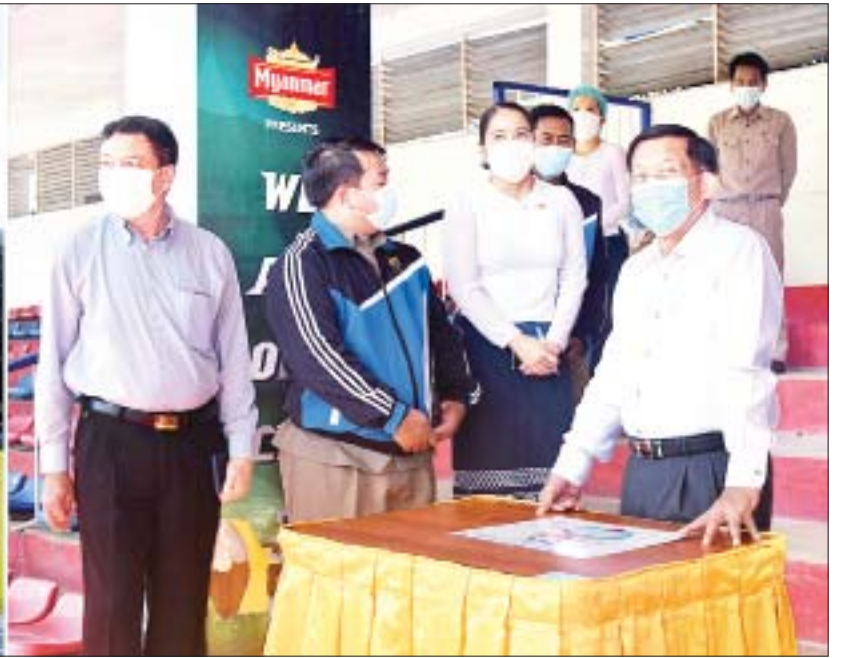
နိုင်ငံတော်စီမံအုပ်ချုပ်ရေးကောင်စီဥက္ကဋ္ဌ၊ နိုင်ငံတော်ဝန်ကြီးချုပ် ဗိုလ်ချုပ်မှူးကြီးမင်းအောင်လှိုင် တောင်ကြီးမြို့ရှိ ပြည်နယ်အားကစားကွင်းအား ကြည့်ရှုစစ်ဆေးစဉ်။

★ ရှေးဦးမှ ဦးစိုင်းလုံးဆိုငါ၊ စောဒန်နီယယ်၊ ဦးရွှေကြိမ်း၊ ကောင်စီ တွဲဖက်အတွင်းရေးမှူး ဒုတိယဗိုလ်ချုပ်ကြီးရဲဝင်းဦး၊ ပြည်ထောင်စုဝန်ကြီးများဖြစ်ကြသည့် ဦးတင်ထွဋ်ဦး၊ ဦးလှမိုး၊ ဦးခင်မောင်ရီ၊ ဒေါက်တာသက်ခိုင်ဝင်း၊ ဦးမင်းသိန်းဇံ၊ ဦးစောထွန်းအောင်မြင့်၊ ရှမ်းပြည်နယ် ဝန်ကြီးချုပ် ဒေါက်တာကျော်ထွန်း၊ ကာကွယ်ရေး ဦးစီးချုပ်(ရေ)ဗိုလ်ချုပ်ကြီးမိုးအောင်၊ ကာကွယ်ရေး ဦးစီးချုပ်မှူးမှူး တပ်မတော်အရာရှိကြီးများ၊ အရှေ့ပိုင်း တိုင်းစစ်ဌာနချုပ် တိုင်းမှူး ဗိုလ်မှူးချုပ် နီလင်းအောင်၊ ရှမ်းပြည်နယ်အစိုးရအဖွဲ့ဝင်များ၊ ကိုယ်ပိုင်အုပ်ချုပ် ခွင့်ရဒေသများမှ တာဝန်ရှိသူများ၊ ဌာနဆိုင်ရာဝန်ထမ်း များ၊ ခရိုင်၊ မြို့နယ်စီမံအုပ်ချုပ်ရေးအဖွဲ့ဝင်များနှင့် မြို့မိ မြို့ဖများ တက်ရောက်ကြသည်။