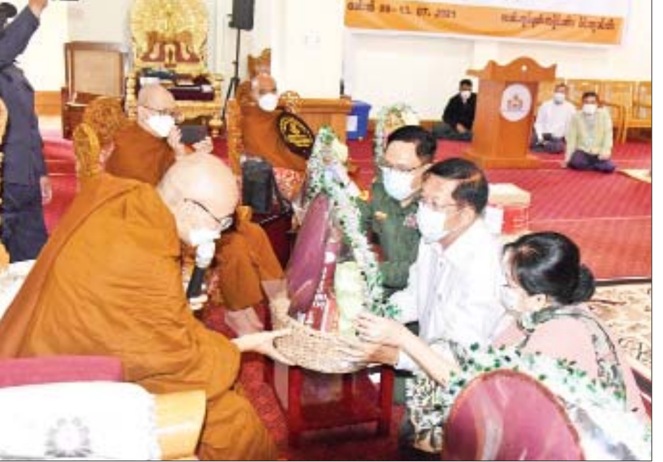
နိုင်ငံတော်စီမံအုပ်ချုပ်ရေးကောင်စီဥက္ကဋ္ဌ၊ နိုင်ငံတော်ဝန်ကြီးချုပ် ဗိုလ်ချုပ်မှူးကြီး မင်းအောင်လှိုင်နှင့် ဇနီး ဒေါ်ကြူကြူလှ ကမ္ဘာ့ဗုဒ္ဓသာသနာပြု အောက်စဖို့ဒ်ဆရာတော် ဒေါက်တာဘဒ္ဒန္တ ဓမ္မသာမိထံ လှူဖွယ် ပစ္စည်းများ ဆက်ကပ်လှူဒါန်းစဉ်။

ဆက်လက်ပြီး နိုင်ငံတော်စီမံအုပ်ချုပ်ရေး ကောင်စီဥက္ကဋ္ဌ၊ နိုင်ငံတော်ဝန်ကြီးချုပ်၊ ဇနီးနှင့် အဖွဲ့ဝင်များသည် ဗုဒ္ဓတက္ကသိုလ်ရှိ ပိဋကတ် စာကြည့်တိုက်ရှေ့တွင် ထိုင်ဝမ်ဗာဒံပင်အား အမှတ်တရစုပေါင်းစိုက်ပျိုးပေးရာ သံဃာတော်များ က မေတ္တာပို့ တရားတော်များ ရွတ်ဖတ်သရဇ္ဈယ် ပေးကြသည်။ ထို့နောက် စာကြည့်တိုက်အတွင်း ခင်းကျင်းပြသထားသည့် အင်္ဂလိပ်ဘာသာ၊ ကိုရီးယား ဘာသာ၊ သီရိလင်္ကာဘာသာ အပါအဝင် ဘာသာ စာပေ ၁၂ မျိုးဖြင့် ပြန်ဆိုထားရှိသည့် ပိဋကတ် သုံးပုံ တရားတော် စာအုပ်စာပေများ၊ မြန်မာဘာသာ၊