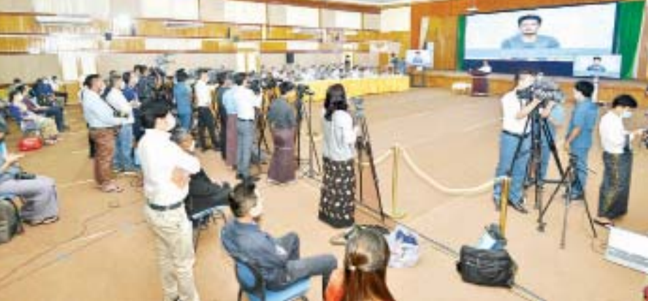
နိုင်ငံတော်စီမံအုပ်ချုပ်ရေးကောင်စီ သတင်းထုတ်ပြန်ရေးအဖွဲ့၏ (၉/၂၀၂၁) ကြိမ်မြောက် သတင်းစာ ရှင်းလင်းပွဲ ကျင်းပစဉ်။