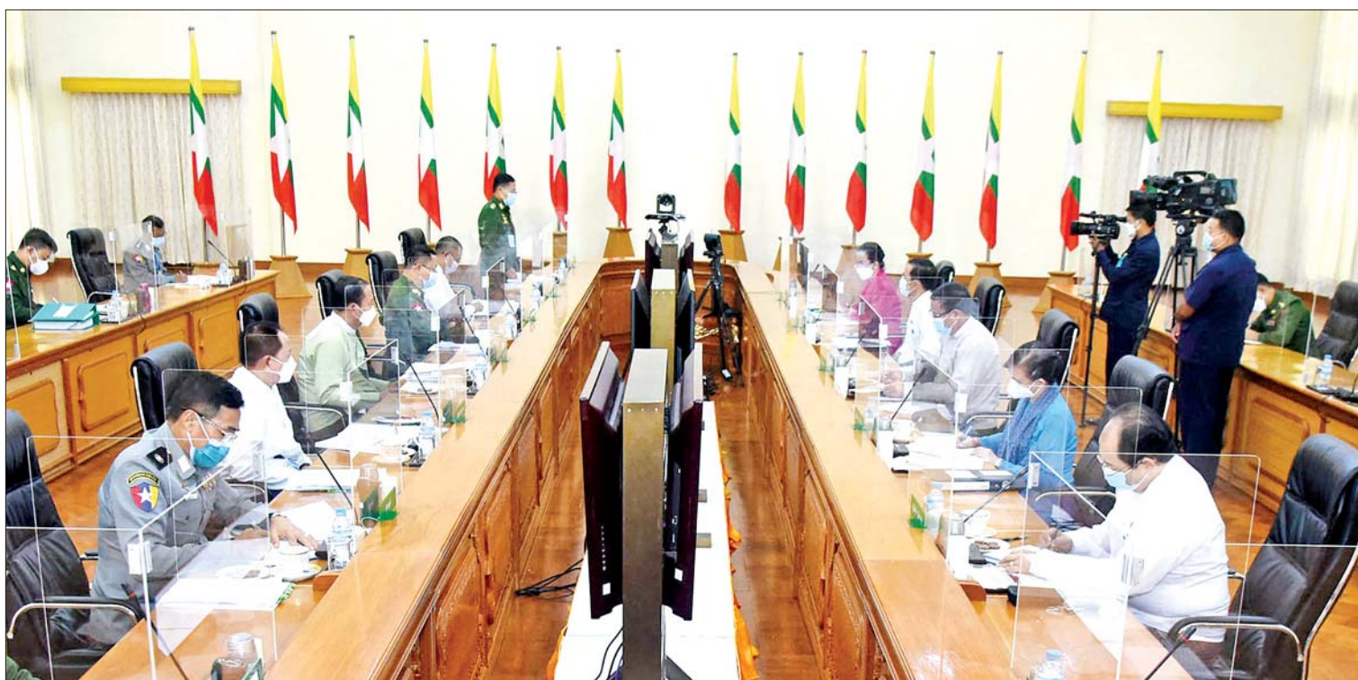
နိုင်ငံတော်စီမံအုပ်ချုပ်ရေးကောင်စီ ဒုတိယဥက္ကဋ္ဌ၊ ဒုတိယဝန်ကြီးချုပ် ဒုတိယဗိုလ်ချုပ်မှူးကြီး စိုးဝင်း ပညာရေးဝန်ကြီးဌာန၊ အခြေခံပညာဦးစီးဌာန၊ အလယ်တန်း၊ အထက်တန်း အသက်(၁၂)နှစ်နှင့်အထက် ကျောင်းသား၊ ကျောင်းသူများအား ကိုဗစ်-၁၉ ကူးစက်မြန်ရောဂါ ကာကွယ်ဆေးထိုးနှံပေးနိုင်ရေး လုပ်ငန်းညှိနှိုင်းအစည်းအဝေးတွင် အမှာစကားပြောကြားစဉ်။

နေပြည်တော် စက်တင်ဘာ ၃၀ ပညာရေးဝန်ကြီးဌာန၊ အခြေခံပညာဦးစီးဌာန၊ အလယ်တန်း၊ အထက်တန်း အသက်(၁၂)နှစ်နှင့်အထက် ကျောင်းသား၊ ကျောင်းသူများအား ကိုဗစ်-၁၉ ကူးစက် မြန်ရောဂါကာကွယ်ဆေးထိုးနှံပေးနိုင်ရေး လုပ်ငန်းညှိနှိုင်းအစည်းအဝေးကို ယနေ့ မွန်းလွဲပိုင်းတွင် နေပြည်တော်ရှိ ဘုရင့်နောင် ရိပ်သာအစည်းအဝေးခန်းမ၌ ကျင်းပရာ နိုင်ငံတော်စီမံအုပ်ချုပ်ရေးကောင်စီ ဒုတိယ ဥက္ကဋ္ဌ၊ ဒုတိယဝန်ကြီးချုပ် ဒုတိယ ဗိုလ်ချုပ်မှူးကြီး စိုးဝင်း တက်ရောက် အမှာစကားပြောကြားသည်။ အစည်းအဝေးသို့ လူမှုဝန်ထမ်း၊ ကယ်ဆယ်ရေးနှင့် ပြန်လည်နေရာချထား ရေးဝန်ကြီးဌာန ပြည်ထောင်စုဝန်ကြီး ဒေါ်သက်သက်ခိုင်၊ ဒုတိယဝန်ကြီးများ၊ ကာကွယ်ရေးဦးစီးချုပ်ရုံး (ကြည်း) မှ တပ်မတော်အရာရှိကြီးများနှင့် ဌာန ဆိုင်ရာတာဝန်ရှိသူများ တက်ရောက်ကြ ပြီး တိုင်းဒေသကြီးနှင့် ပြည်နယ်အစိုးရ အဖွဲ့ဝန်ကြီးချုပ်များ၊ တာဝန်ရှိသူများက Video Conferencing ဖြင့် တက်ရောက်ကြ သည်။ စာမျက်နှာ ၃ ကော်လံ ၁ သို့ ◆