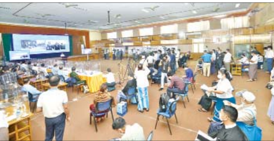
နိုင်ငံတော်စီမံအုပ်ချုပ်ရေးကောင်စီ သတင်းထုတ်ပြန်ရေးအဖွဲ့၏ (၉/၂၀၂၁) ကြိမ်မြောက် သတင်းစာရှင်းလင်းပွဲ ကျင်းပစဉ်။

ဦးစွာ သတင်းထုတ်ပြန်ရေးအဖွဲ့ခေါင်းဆောင် ဗိုလ်ချုပ်ဇော်မင်းထွန်းက ယနေ့ သတင်းစာရှင်းလင်းပွဲတွင် (၁) ၂၀၂၂ ခုနှစ် ဖေဖော်ဝါရီလ ၁၂ ရက်နေ့တွင် ကျရောက်မည့် (၅၅)နှစ်ပြည့်စိန်ရတု ပြည်ထောင်စုနေ့၊ (၂) ဒို့တာဝန်အရေးသုံးပါး သဖွယ် ဆက်လက်အလေးထားလုပ်ဆောင်သွားမည့် တိုင်းပြည်သာယာဝပြောရေး၊ စားရေရိက္ခာ ဖူလုံရေးနှင့် စစ်မှန်စည်းကမ်းပြည့်ဝသော ဒီမိုကရေစီပြည်ထောင်စု ခိုင်မာစေရေး၊ (၃) နိုင်ငံတော်တည်ငြိမ်အေးချမ်းရေး ဆောင်ရွက်ချက်များနှင့် အကြမ်းဖက်မှုတိုက်ဖျက်ရေး၊ (၄) ရွေးကောက်ပွဲကော်မရှင်က ဆက်လက်လုပ်ဆောင်နေသည့် လုပ်ငန်းများပြောကြားမည်ဖြစ်ကြောင်း၊ ပထမ ၃ ချက်ကို မိမိက ပြောမည်ဖြစ်ပြီး စတုတ္ထအချက်ကို ပြည်ထောင်စုရွေးကောက်ပွဲကော်မရှင်အဖွဲ့ဝင် ဦးခင်မောင်ဦးက ပြောကြားမည်ဖြစ်ကြောင်း၊ ရှင်းလင်းပြောကြားမှုများပြီးပါက မေး၊ ဖြေကဏ္ဍဖြစ်ကြောင်း၊ အချိန်ကန့်သတ်ချက်အရ မီဒီယာတစ်ခုကို မေးခွန်းတစ်ခုသာ မေးမြန်းရန် ကြိုတင်မေတ္တာရပ်ခံလိုကြောင်း ပြောကြားသည်။