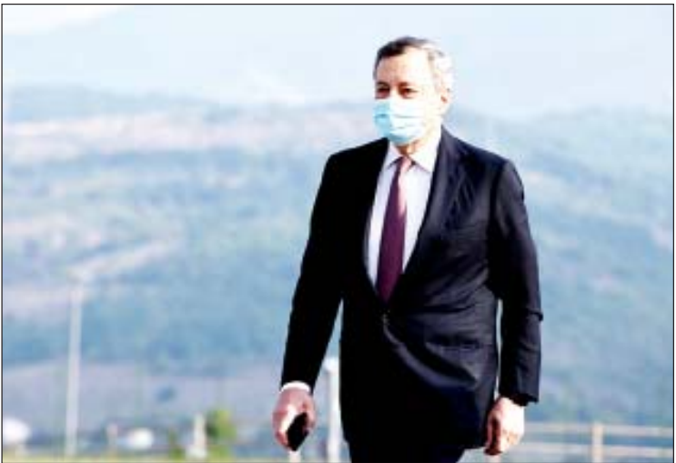
အီတလီဝန်ကြီးချုပ် မာရီယို ဒရာဟီ

တိုက်တွန်းပြောကြားလျက်ရှိသည်။ သို့သော် အာဖဂန်နစ္စတန်အစိုးရ၏ နိုင်ငံရပ်ခြားပိုင်ဆိုင်မှုများကို တာလီဘန်အဖွဲ့အား သုံးစွဲခွင့်ပြုခြင်းနှင့်ပတ်သက်ပြီး ကမ္ဘာ့နိုင်ငံများအကြားသဘောထားကွဲလွဲမှုများ ရှိနေဆဲဖြစ်သည်။ လူသားချင်းစာနာထောက်ထားသည့် ကူညီထောက်ပံ့မှုများ ပေးခြင်းသည် ကမ္ဘာ့စက်မှုထိပ်သီးနိုင်ငံများ၏ တာဝန်ဖြစ်ကြောင်း အီတလီဝန်ကြီးချုပ် မာရီယို ဒရာဟီက မီဒီယာများကို ရှင်းလင်းပြောကြားသည်။ အာဖဂန်နစ္စတန်နိုင်ငံအား အရေးပေါ်ကူညီထောက်ပံ့မှု ပေးခြင်းဆိုင်ရာ သဘောတူညီမှုများနှင့်ပတ်သက်ပြီး ဂျီ ၂၀ ခေါင်းဆောင်များက မည်သို့ဆုံးဖြတ်ချက်ချမှတ်မည်ဆိုသည်ကို ဆက်လက်စောင့်ကြည့်ရမည်ဖြစ်ကြောင်း နိုင်ငံရေးလေ့လာသူများက ဆိုသည်။ ကိုးကား- အင်န်အိတ်ချ်ကော့ဘာသာပြန်- အောင်ကျော်ကျော်