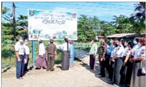
အောင်ခိုင်၊ အောင်မြင့်မြတ် (မအူပင်)

မအူပင် စက်တင်ဘာ ၃၀ ဧရာဝတီတိုင်းဒေသကြီး မအူပင်မြို့နယ် တလုပ်လပ် အနောက်ကျေးရွာအုပ်စု မြို့ရှောင်လမ်းရှိ မြို့နယ်လဝက ရုံးရှေ့၌ လူဝင်မှုကြီးကြပ်ရေးနှင့်ပြည်သူ့အင်အား ဝန်ကြီးဌာနမှ ဆောင်ရွက်လျက်ရှိသော ပန်းခင်းစီမံချက် အား အများပြည်သူများသိရှိစေရန် ဆိုင်းဘုတ်စိုက်ထူခြင်း အခမ်းအနားကို ယနေ့နံနက် ၁၀ နာရီက ကျင်းပ ကြောင်း သိရသည်။