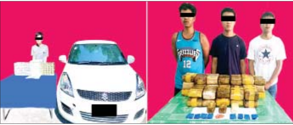
အိုက်ခမ်း(ခ)အိုက်ကျင်၊ အိုက်စိုင်း(ခ)စိုင်းပေါင်း၊ စိုင်းစိုင်းနှင့် အားဝေတို့ကို တာချီလိတ်မြို့နယ်တွင် သိမ်းဆည်းရမိသည့် စိတ်ကြွေးသွပ်ဆေးပြားများ၊ ခဲယမ်းများနှင့်အတူ တွေ့ရစဉ်။

နေပြည်တော် စက်တင်ဘာ ၃၀ ရှမ်းပြည်နယ် တာချီလိတ်မြို့နယ်နှင့် ရွာငံမြို့နယ်တို့တွင် ငွေကျပ်သိန်း ၆,၀၀၀ ကျော်တန်ဖိုးရှိ စိတ်ကြွေးသွပ်ဆေးပြားများနှင့် ခဲယမ်းများ သိမ်းဆည်းရမိခဲ့ကြောင်း မြန်မာနိုင်ငံရဲတပ်ဖွဲ့မှ သိရသည်။