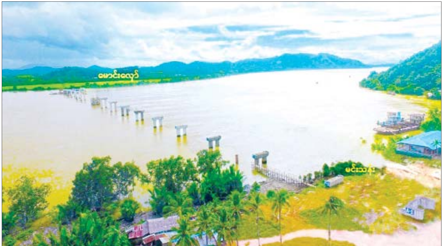
ကျွန်းစုမြို့နယ်နှင့် မြိတ်မြို့နယ်ကို ဆက်သွယ်ပေးမည့် မင်းသန်း-မောင်းလျော်ကျေးလက်တံတားစီမံကိန်းလုပ်ငန်းခွင်အား တွေ့ရစဉ်။

ရည်မှန်းချက်များ တကယ်လိုသလား စာမျက်နှာ » ၁၆