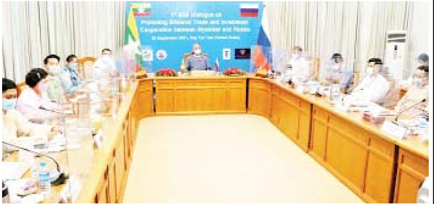
ပထမအကြိမ် မြန်မာ-ရုရှား B2B Dialogue ကို စက်တင်ဘာလ ၂၈ ရက်က ကျင်းပစဉ်။

ရုရှား-မြန်မာ နှစ်နိုင်ငံ ဆက်ဆံရေးကို ပြန်ကြည့်မယ်ဆိုရင် လွတ်လပ်ရေးရပြီး မကြာခင် ၁၉၄၈ ခုနှစ် ဖေဖော်ဝါရီလကတည်းက နှစ်နိုင်ငံ