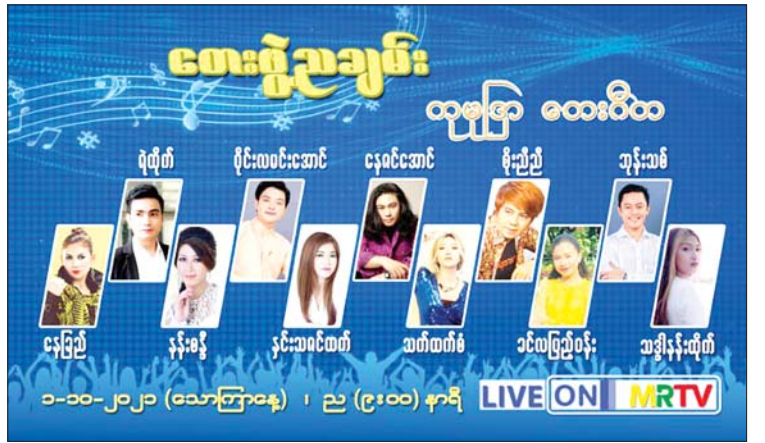
ထိုသို့ တင်ဆက်မှုကို အောက်တိုဘာ ၁ ရက် (တနင်္ဂနွေနေ့) နံနက် ၁၀ နာရီခွဲ တွင် ဒုတိယအကြိမ် ထပ်မံထုတ်လွှင့်ပြသ မည်ဖြစ်ကြောင်း သိရသည်။ သတင်းစဉ်