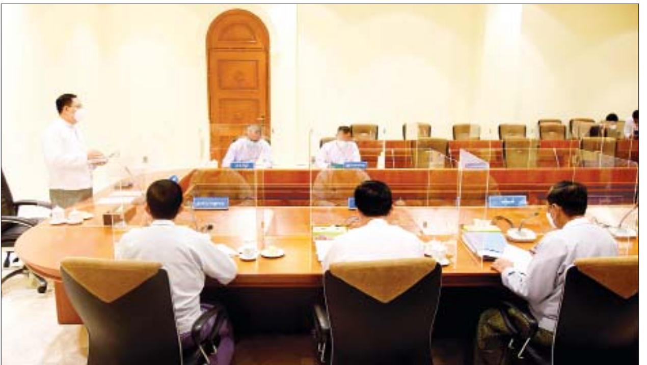
ပြည်ပပို့ကုန်ဖြင့်တင်ရေး နည်းလမ်းများနှင့် နိုင်ငံခြားသုံးငွေ ငွေလဲလှယ်နှုန်း လက်ရှိအချိန်တွင် မြင့်တက်လျက်ရှိပြီး ဈေးနှုန်းအမျိုးမျိုးဖြစ်ပေါ်နေမှုကို ဖြေရှင်းနိုင်ရန်နှင့် ငွေကြေးတည်ငြိမ်မှုရှိစေရေးအတွက် နိုင်ငံတော်အစိုးရက ထိရောက်စွာ ကူညီဖြည့်တင်းဖြေရှင်းဆောင်ရွက်ပေးမည့်နည်းလမ်းများကို ဆွေးနွေးခဲ့ကြကြောင်း သတင်းရရှိသည်။ သတင်းစဉ်

အစည်းအဝေးတွင် ပြည်ပကုန်သွယ်မှုလုပ်ငန်းဆိုင်ရာ အခြေအနေများ၊ ဈေးကွက်အတွင်း နိုင်ငံခြားသုံးငွေအဆင်ပြေစွာ စီးဆင်းလည်ပတ်နိုင်ရေးအတွက် မြန်မာနိုင်ငံတော်ဗဟိုဘဏ်မှ ဘဏ်များသို့ နိုင်ငံခြားသုံးငွေ ရောင်းချပေးမှုအခြေအနေများ၊ ပြည်ပပို့ကုန် ရငွေများ အချိန်မီ ပြန်လည်ဝင်ရောက်ရန် ဆောင်ရွက်ထားရှိမှုကိစ္စများ၊ ပြည်ပပို့ကုန်ရငွေများ လက်ဝယ်ကိုင်ဆောင်နိုင်မှု အချိန်ကာလသတ်မှတ်ချက်များ၊