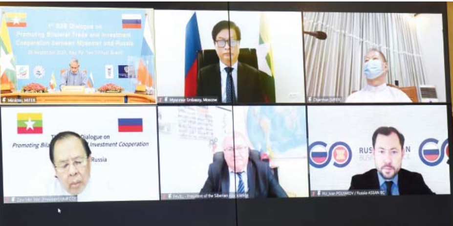
မြန်မာ-ရုရှား စီးပွားရေးလုပ်ငန်းရှင်များဆွေးနွေးပွဲကို စက်တင်ဘာ ၂၈ရက်က Virtual စနစ်ဖြင့် ကျင်းပစဉ်။

အခုဆိုရင် မြန်မာနိုင်ငံဟာ လွတ်လပ်တဲ့ ကုန်သွယ်မှုဒေသ (FTA) လို့ လူတိုင်းသိနေတဲ့ ဒေသတွင်း စီးပွားရေးပူးပေါင်းဆောင်ရွက်မှု ခုနစ်ခု ကို လက်မှတ်ရေးထိုးပြီး လိုက်ပါအကောင်အထည် ဖော်နေတဲ့နိုင်ငံပါ။ ဒါက ဘာကိုပြသလဲဆိုရင် နိုင်ငံ