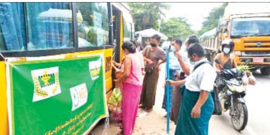
ယနေ့တွင် ဆက်လက်ဆောင်ရွက်ခဲ့ရာ ဆေးနှင့် ကိုးခုမှ အိမ်သုံးဆေးဝါး ၁၁၂ မျိုး ရောင်းချပေးခဲ့ဆေးပစ္စည်း ဖြန့်ဖြူးရောင်းချသောကုမ္ပဏီ သည်။

နေပြည်တော် စက်တင်ဘာ ၂၉ ကိုဗစ်-၁၉ ရောဂါ တတိယလှိုင်းဖြစ်ပွားနေသည့် ကာလအတွင်း ရန်ကုန်တိုင်းဒေသကြီးအတွင်းရှိ ပြည်သူများ၏ ဆေးဝါးလိုအပ်ချက်အား ဖြည့်ဆည်းပေးနိုင်ရေး၊ ဆေးဝါးများ လွယ်လင့်တကူဝယ်ယူနိုင်ရေး၊ အရည်အသွေးနှင့် ဈေးနှုန်းမှန်ကန်စွာရရှိစေရေးအတွက် ရန်ကုန်တိုင်းဒေသကြီးအစိုးရအဖွဲ့၏ ညွှန်ကြားချက်အရ မြန်မာနိုင်ငံ ဆေးနှင့် ဆေးပစ္စည်းလုပ်ငန်းရှင်များအသင်း၏ စီစဉ်မှုဖြင့် ဒုတိယနေရာအဖြစ် ပန်းဘဲတန်းမြို့နယ်၊ ကုန်သည်လမ်းနှင့် ဗိုလ်ချုပ်ကလေးလမ်းထောင့်ရှိ မြန်မာအပြည်ပြည်ဆိုင်ရာ ကုန်သွယ်မှုဗဟိုဌာန အဆောက်အအုံ၌ အိမ်သုံးဆေးဝါးများ လက်လီလက်ကား ဖြန့်ဖြူးရောင်းချခြင်းအစီအစဉ်ကို