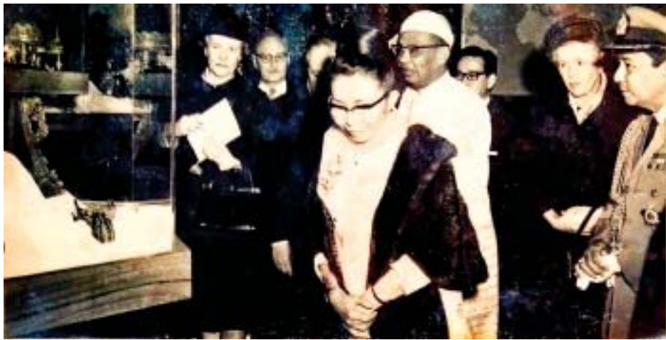
ကုန်သွယ်ရေးဝန်ကြီး ဗိုလ်မှူးချုပ်စည်သူတင်ဖေနှင့်အဖွဲ့ ကမ္ဘာ့ကုန်စည်ပြပွဲရှိ မြန်မာနိုင်ငံကိုယ်စားပြုပြခန်းဆောင်၌ ကြည့်ရှုစဉ်။

“စက်မှုနိုင်ငံတော် ထူထောင်နိုင်ပြီး နည်းပညာ ရှေ့သို့ရောက်နေခြင်းက ကနေဒါနိုင်ငံကို ကမ္ဘာ့ဖွံ့ဖြိုးပြီးနိုင်ငံများ၏ ရှေ့တန်းတွင် နေရာရစေခဲ့သည်။ မြန်မာနိုင်ငံအစိုးရနှင့် ပြည်သူများကလည်း ကနေဒါနိုင်ငံနှင့် အပြန်အလှန် ချစ်ကြည်ရင်းနှီးလျက်ရှိကြပါသည်။ ကနေဒါနိုင်ငံ၏