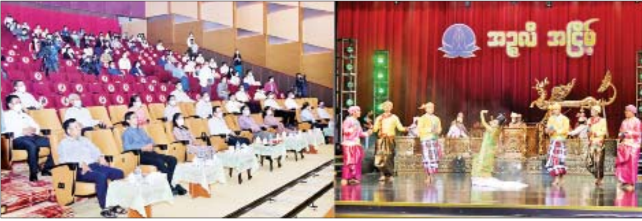
ပြည်ထောင်စုဝန်ကြီး ဦးမောင်မောင်အုန်း အဇူလီအငြိမ့် ရိုက်ကူးရေးဆောင်ရွက်နေမှုအား ကြည့်ရှုအားပေးစဉ်။

နေပြည်တော် စက်တင်ဘာ ၂၇ ပြန်ကြားရေး ဝန်ကြီးဌာန ပြည်ထောင်စု ဝန်ကြီး ဦးမောင်မောင်အုန်းသည် ဒုတိယ ဝန်ကြီး ဦးရဲတင့်နှင့်အတူ ယနေ့ ညနေပိုင်းက နေပြည်တော်- တပ်ကုန်းရှိ မြန်မာ့အသံနှင့်ရုပ်မြင် သံကြားရှိ MRTV စိန်ရတုပြတိုက် တည်ဆောက်ရေး လုပ်ငန်းအား ကြည့်ရှုစစ်ဆေးပြီး MRTV ဝန်ထမ်း များက တင်ဆက်ပြသမည့် အဇူလီ အငြိမ့် ရိုက်ကူးရေးဆောင်ရွက် နေမှုအား ကြည့်ရှုအားပေးသည်။ ရှင်းလင်းတင်ပြ ပြည်ထောင်စုဝန်ကြီးနှင့် အဖွဲ့ သည် MRTV စိန်ရတုပြတိုက် တည်ဆောက်ရေး လုပ်ငန်းခွင်သို့ ရောက်ရှိရာ မြန်မာ့အသံနှင့် ရုပ်မြင်သံကြား ညွှန်ကြားရေးမှူး ချုပ် ဦးရဲနိုင်နှင့် တာဝန်ရှိသူ များက ပြတိုက်အဆောက်အအုံ ဆောက်လုပ်ပြီးစီးမှု အခြေအနေ အားလည်းကောင်း၊ ပြတိုက်တွင် ခင်းကျင်းပြသရန် လျာထားမှုအား လည်းကောင်း ရှင်းလင်းတင်ပြရာ ပြည်ထောင်စုဝန်ကြီးက မြန်မာ့