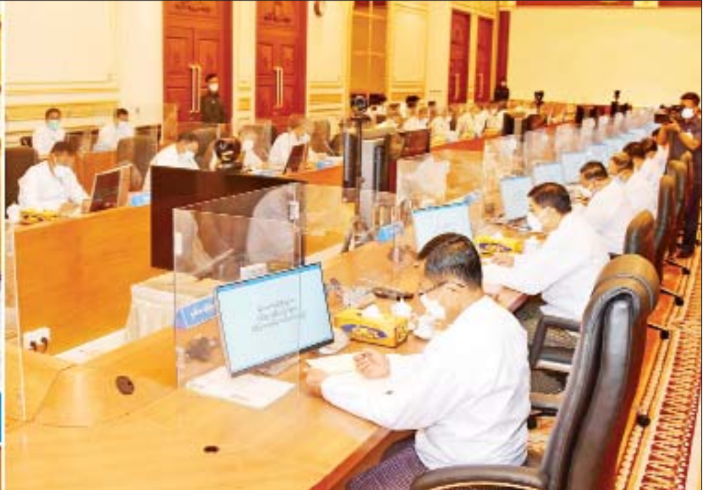
နိုင်ငံတော်စီမံအုပ်ချုပ်ရေးကောင်စီဥက္ကဋ္ဌ၊ နိုင်ငံတော်ဝန်ကြီးချုပ် ဗိုလ်ချုပ်မှူးကြီးမင်းအောင်လှိုင် ပြည်ထောင်စုသမ္မတမြန်မာနိုင်ငံတော် ပြည်ထောင်စုအစိုးရအဖွဲ့ အစည်းအဝေးအမှတ်စဉ်(၁/၂၀၂၁)တွင် အမှာစကားပြောကြားစဉ်။