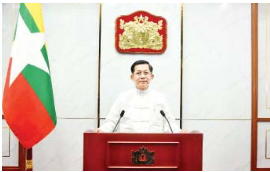
ပြည်ထောင်စုသမ္မတမြန်မာနိုင်ငံတော်အစိုးရ နိုင်ငံတော်စီမံအုပ်ချုပ်ရေးကောင်စီဥက္ကဋ္ဌ၊ နိုင်ငံတော်ဝန်ကြီးချုပ် ဗိုလ်ချုပ်မှူးကြီး မင်းအောင်လှိုင် အမှာစကားပြောကြားစဉ်။

ခရီးသွားလုပ်ငန်းဟာ ၎င်းနဲ့တိုက်ရိုက်ပတ်သက် တဲ့အလုပ်အကိုင်များဖြစ်တဲ့ ဟိုတယ်များ၊ ခရီးသွားလုပ်ငန်းအေဂျင်စီများ၊ ခရီးလှည့်လည်ရေးလုပ်ငန်းလုပ်ကိုင်တဲ့ကုမ္ပဏီများ၊ လေကြောင်းလိုင်းများနဲ့ သယ်ယူပို့ဆောင်ရေးလုပ်ငန်းများအပြင်ဆောက်လုပ်ရေးလုပ်ငန်းများ၊ အင်ဂျင်နီယာလုပ်ငန်းများ၊ ကုန်စည်ထုတ်လုပ်ရေးလုပ်ငန်းများ၊ စိုက်ပျိုးရေးလုပ်ငန်းများ၊ အစားအသောက်နဲ့ သစ်သီးဝလံ စိုက်ပျိုးရေးလုပ်ငန်းများကိုလည်း အကျိုးအမြတ်များရရှိခံစားစေတာကို သတိပြုမိဖို့လိုအပ်ပါတယ်။ နိုင်ငံတစ်နိုင်ငံ အလုံးစုံဖွံ့ဖြိုးတိုးတက်စေဖို့အတွက် အထောက်အကူပြုတဲ့နေရာမှာ ခရီးသွားလုပ်ငန်းဟာ အရေးပါတဲ့အခန်းကဏ္ဍမှာပါဝင်ပြီး အလုပ်အကိုင်နဲ့အခွင့်အလမ်းများကို ဖန်တီးပေးခြင်းဖြင့် စီးပွားရေးဆိုင်ရာ မညီမျှမှုများကို လျော့နည်းစေနိုင် တယ်လို့လည်း ပြောနိုင်ပါတယ်။ ယခုနှစ် ကမ္ဘာ့ခရီးသွားလုပ်ငန်းနေ့အခမ်းအနားကို “ကဏ္ဍစုံဖွံ့ဖြိုး