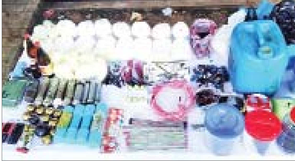
လသာမြို့နယ် တိုက်အမှတ်(၃၆)၌ သိမ်းဆည်းရမိသည့် ဖောက်ခွဲရေးပစ္စည်းများ မှတ်တမ်းဓာတ်ပုံ။

တာဝန်ထမ်းဆောင်ခြင်း မပြုနိုင်စေရန် ရည်ရွယ်ကာ စက်ရုံ၊ အလုပ်ရုံများကို မီးရှို့ဖောက်ခွဲဖျက်ဆီးခြင်းနှင့် အုပ်ချုပ်ရေးမှူးများကို အဓိက ပစ်မှတ်ထား၍ သတ်ဖြတ်ခြင်းများ ပြုလုပ်လျက် ရှိကြောင်း၊ ထို့ပြင် တိုင်းရင်းသား လက်နက်ကိုင်အဖွဲ့အချို့နှင့် ချိတ်ဆက်၍ ဖောက်ခွဲဖျက်ဆီးရေးသင်တန်းများ တက်ရောက်ခြင်း၊ လက်နက်/ခဲယမ်းများ စုဆောင်းခြင်း၊ အဖျက်လုပ်ငန်းများ လုပ်ဆောင်ရန် လူစုဆောင်းခြင်းများကိုပါ ပြုလုပ်လာသောကြောင့် အကြမ်းဖက်သူများ ခိုအောင်းနေထိုင်လှုပ်ရှားမှုမရှိစေရေးအတွက် လုံခြုံရေးလုပ်ငန်းများကို တိုးမြှင့်ဆောင်ရွက်လျက် ရှိသည်။