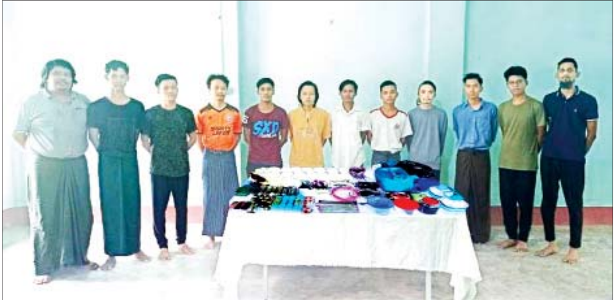
စက်တင်ဘာ ၁၅ ရက်နှင့် ၁၆ ရက်တွင် ရန်ကုန်မြို့အတွင်း ဖောက်ခွဲဖျက်ဆီးရေးလုပ်ဆောင်နေသည့် တရားခံများနှင့် ဖောက်ခွဲရေးပစ္စည်းများကို တွေ့ရစဉ်။