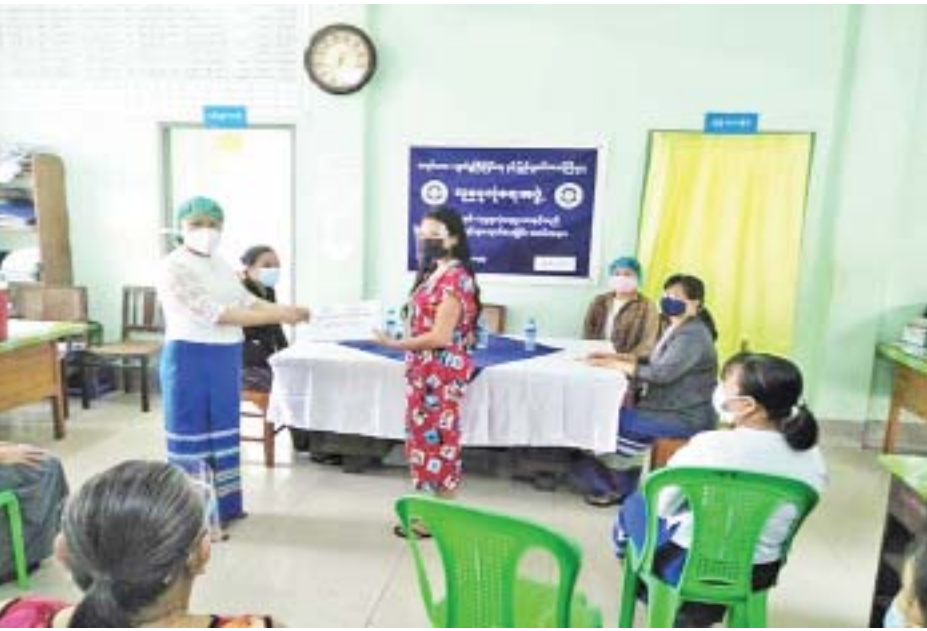
မန္တလေးတိုင်းဒေသကြီးတွင် လူမှုဖူလုံရေးအဖွဲ့နှင့်အကျိုးဝင်မှတ်ပုံတင်ထားသည့် အာမခံအလုပ်သမား များအား အကျိုးခံစားခွင့် ခွင့်ပြုထုတ်ပေးစဉ်။

၂၀၂၁ ခုနှစ် လူမှုဖူလုံရေးဥပဒေပါ လူမှုဖူလုံရေး အာမခံစနစ် ခြောက်မျိုးအနက် မြန်မာနိုင်ငံ၏ လူမှု စီးပွား ဖွံ့ဖြိုးတိုးတက်မှုအခြေအနေအရ အာမခံစနစ် နှစ်မျိုးဖြစ်သည့် ကျန်းမာရေးနှင့် လူမှုရေးစောင့်ရှောက်မှုအာမခံစနစ်နှင့် အလုပ်တွင်ထိခိုက်မှု အကျိုးခံစားခွင့် အာမခံစနစ်တို့ကို အကောင်အထည် ဖော်ဆောင်ရွက်လျက်ရှိပါသည်။ ယင်းအာမခံစနစ် နှစ်မျိုးအရ အလုပ်သမားလုပ်ခလစာ၏ သုံးရာခိုင်နှုန်းကို အလုပ်ရှင်မှလည်းကောင်း၊ နှစ်ရာခိုင်နှုန်းကို အလုပ်သမားမှလည်းကောင်း ရန်ပုံငွေသို့ ထည့်ဝင်၍ အာမခံအလုပ်သမားတို့၏ လူမှုစီးပွားအခက်အခဲ ဖြစ်ချိန်၌ ငွေကြေးထောက်ပံ့မှုပေးခြင်းနှင့် ကျန်းမာရေးစောင့်ရှောက်မှုများကို ဆောင်ရွက်ပေး လျက်ရှိပါသည်။