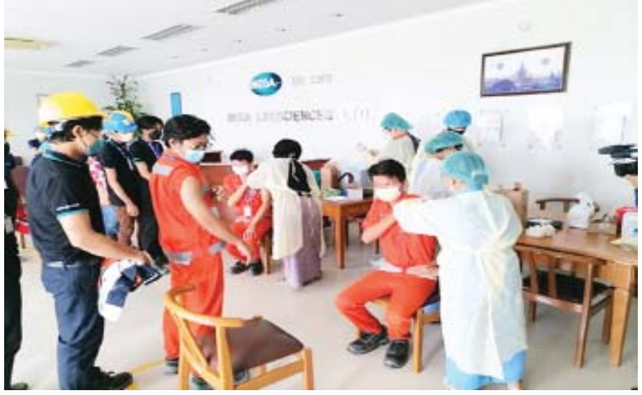
ရန်ကုန်တိုင်းဒေသကြီးနှင့် မန္တလေးတိုင်းဒေသကြီးတို့တွင် လူမှုဖူလုံရေးအဖွဲ့နှင့် အကျိုးဝင် မှတ်ပုံတင်ထားသည့် စက်ရုံ၊ အလုပ်ရုံ၊ လုပ်ငန်းဌာနများရှိ အာမခံအလုပ်သမားများအား ကိုဗစ်-၁၉ ကာကွယ်ဆေး ထိုးနှံပေးစဉ်။

ကိုဗစ်-၁၉ ရောဂါကြောင့် ပိတ်သိမ်းသွား သည့်အလုပ်ငွာများမှ အလုပ်လက်မဲ့ဖြစ် သွားသော အာမခံအလုပ်သမားများအား ထည့်ဝင်ကြေးကာလကို သက်ဆိုင်ရာလ ကုန်ဆုံးပြီး လဆန်း ၁၅ ရက်အတွင်း ပေးသွင်းရန် သတ်မှတ်ချက်အား သုံးလ အထိ နောက်ဆုတ်၍ ပေးသွင်းခွင့်ပြုခဲ့ပြီး ယခုအခါတွင် ခြောက်လအထိ နောက် ဆုတ်၍ ပေးသွင်းခွင့်ပြုခြင်း၊ အလုပ် လက်မဲ့ကာလအတွင်း ဆေးကုသမှုကို တစ်နှစ်အထိ တိုးမြှင့်ခံစားခွင့်ပြုခြင်း၊ အလုပ်လက်မဲ့ဖြစ်သည့်နေ့မှစ၍ ဆေးဖိုး နှင့် ခရီးစရိတ်များကို တစ်နှစ်အထိ တိုးမြှင့်ခံစားခွင့်ပြုခြင်းတို့ကို ဖြေလျှော့ ဆောင်ရွက်