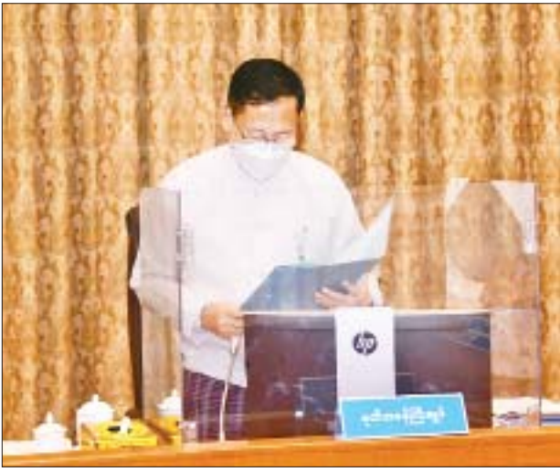
ဘဏ္ဍာရေးဆိုင်ရာကော်မရှင် ဒုတိယဥက္ကဋ္ဌ၊ နိုင်ငံတော်စီမံအုပ်ချုပ်ရေးကောင်စီ ဒုတိယဥက္ကဋ္ဌ၊ ဒုတိယဝန်ကြီးချုပ် ဒုတိယဗိုလ်ချုပ်မှူးကြီးစိုးဝင်း ဆွေးနွေးပြောကြားစဉ်။

ထို့ကြောင့် မိမိတို့ချမှတ်ထားသည့် မူဝါဒများကို အကောင်အထည် ဖော်ဆောင်ရွက်နိုင်ရန် ရငွေများတိုးတက်ရရှိရေးအတွက် ကြိုးပမ်းကြ ရမည်ဖြစ်ပြီး အသုံးစရိတ်များကိုလည်း ပြည်ထောင်စုနှင့် တိုင်းဒေသကြီး၊ ပြည်နယ်များသို့ စနစ်တကျခွဲဝေသုံးစွဲသွားကြရန် လိုအပ်ကြောင်း၊ ထိုသို့ ဆောင်ရွက်နိုင်ရန် ၂၀၀၈ ခုနှစ်၊ ဖွဲ့စည်းပုံအခြေခံဥပဒေပုဒ်မ ၁၀၀၊ ပုဒ်မခွဲ (၁) ပါ နိုင်ငံတော်၏ အမျိုးသားစီမံကိန်း၊ နှစ်စဉ်အရ အသုံး ခန့်မှန်းခြေငွေစာရင်းနှင့် အခွန်အကောက်ဆိုင်ရာဥပဒေကြမ်း များကို နိုင်ငံတော်စီမံအုပ်ချုပ်ရေးကောင်စီက တည်ဆဲဥပဒေ၊ လုပ်ထုံး