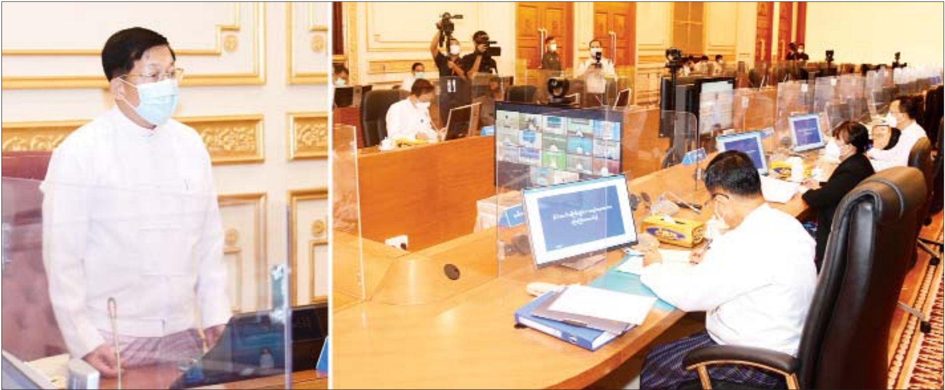
ဘဏ္ဍာရေးဆိုင်ရာကော်မရှင်ဥက္ကဋ္ဌ၊ နိုင်ငံတော်စီမံအုပ်ချုပ်ရေးကောင်စီဥက္ကဋ္ဌ၊ နိုင်ငံတော်ဝန်ကြီးချုပ် ဗိုလ်ချုပ်မှူးကြီး မင်းအောင်လှိုင် ဘဏ္ဍာရေးဆိုင်ရာ ကော်မရှင်အစည်းအဝေးအမှတ်စဉ် (၁/၂၀၂၁)တွင် အမှာစကားပြောကြားစဉ်။