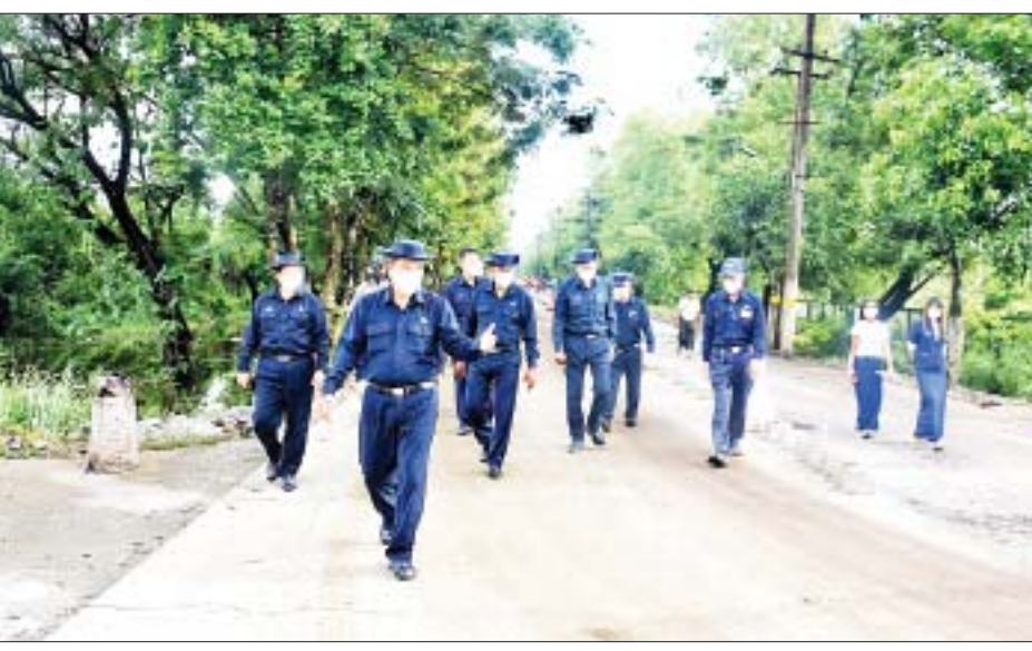
ကေတွင် အကောင်အထည်ဖော် ဆောင်ရွက်နေသည့် လှိုင်သာယာ (အနောက်ပိုင်း) မြို့နယ် စုပေါင်းရုံးနှင့် ဝန်ထမ်းအိမ်ရာ စီမံကိန်းလုပ်ငန်းခွင်၌ မြေပြင်ခြင်း နှင့် သဲဖို့ခြင်းလုပ်ငန်း ဆောင်ရွက်နေမှု ရန်ကုန်- ပုသိမ်လမ်း ရေစုကန်ရေမြောင်း ပြုပြင်တူးဖော် ရန်ဆောင်ရွက်နေမှု လုပ်ငန်းများကိုလည်းကောင်း၊ ပန်းဥယျာဉ်နှင့် အားကစားကွင်းများဌာနမှ ဆောင်ရွက်နေသော လှိုင်သာယာ(အရှေ့ပိုင်း)

မြို့နယ် ရန်ကုန်-ပုသိမ်လမ်းမကြီးပေါ်ရှိ ဘုရင့်နောင် ပန်းခြံသို့ သွားရောက်၍ အရှည် ၁၃၄၆ ပေ၊ အကျယ် ရှစ်ပေရှိ ပန်းခြံပတ် Interlock လမ်းနှင့် အရှည်ပေ ၄၁ ၊ အကျယ် ၂၄ ပေရှိ ပန်းခြံအတွင်း ဗိုလ်ချုပ် အောင်ဆန်းရုပ်တုရှေ့ လျှောက်လမ်းကွန်ကရစ် ခင်းကျင်းနေမှု၊ မြက်စိုက်ပျိုး၍ မြေယာရှင်း ပြုပြင် ဆောင်ရွက်နေမှု၊ မီးတိုင်စင်နှင့် ရေငုတ်တိုင်များ ပြုလုပ်ဆောင်ရွက်နေမှုနှင့် ပန်းခြံထောင့် လမ်းဆုံ နေရာ အများသုံးသန့်စင်ခန်း တည်ဆောက်ထားမှု တို့ကိုလည်းကောင်း၊ လှိုင်မြို့နယ် ဘုရင့်နောင် လမ်းမကြီးပေါ်ရှိ အုတ်ကျင်းဂုန်နီစက်ရုံမှ သီရိမင်္ဂလာ ပိတောက်ချောင်းအထိ အရှည် ၂၆၇၅ ပေ၊ အကျယ် ရှစ်ပေ၊ ထုခြောက်လက်မရှိ ကွန်ကရစ် လူသွားစင်္ကြံ၊ စက်ဘီးလမ်း၊ ယာဉ်ရပ်နားရန်နေရာများ ပြုလုပ်နေမှု နှင့် စင်္ကြံနှင့် ဘုရင့်နောင်လမ်းမကြီးအကြား အကျယ် ၁၆ ပေရှိ မြေဧရိယာ၌ ပန်းပင်နှင့် မြက်ပင်များ စိုက်ပျိုး၍ မြေယာရှင်း ပြုပြင်နေမှုတို့ကိုလည်းကောင်း ကြည့်ရှုစစ်ဆေးပြီး လိုအပ်သည်များ မှာကြား သတင်းစဉ်