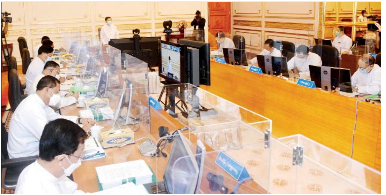
အမျိုးသားစီမံကိန်းကော်မရှင်ဥက္ကဋ္ဌ၊ နိုင်ငံတော်စီမံအုပ်ချုပ်ရေးကောင်စီဥက္ကဋ္ဌ၊ နိုင်ငံတော်ဝန်ကြီးချုပ် ဗိုလ်ချုပ်မှူးကြီးမင်းအောင်လှိုင် အမျိုးသားစီမံကိန်းကော်မရှင် အစည်းအဝေးအမှတ်စဉ် (၁/၂၀၂၁)တွင် အမှာစကားပြောကြားစဉ်။

ယခင်ကဘဏ္ဍာရေးနှစ်ကိုအောက်တိုဘာလမှ စက်တင်ဘာလထိ သတ်မှတ်ဆောင်ရွက်ခဲ့သော်လည်း ၂၀၂၂-၂၀၂၃ ဘဏ္ဍာရေးနှစ်ကို ဧပြီလမှ မတ်လအထိ ပြောင်းလဲသတ်မှတ် ဆောင်ရွက်မည် ဖြစ်သည့်အတွက် ၂၀၂၁ ခုနှစ် အောက်တို