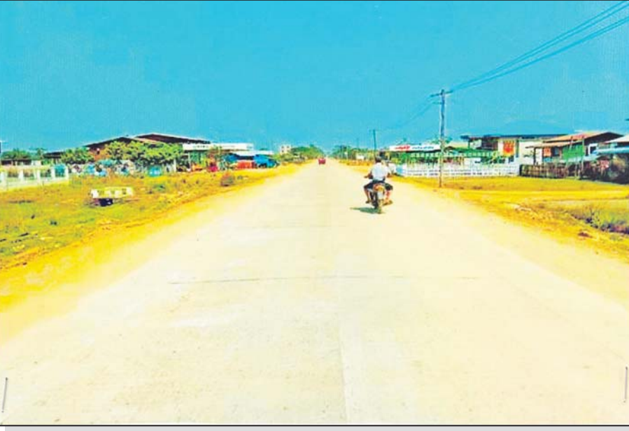
သတ္တဝယ်ကျင်း-ဖောင်းပြင်-ဟုမ္မလင်းလမ်းကို တွေ့ရစဉ်။

နှစ်စဉ်ရန်ပုံငွေ ခွင့်ပြုရရှိမှုအခြေအနေအရ လက်ရှိလုပ်ကိုင်နေသည့်လုပ်ငန်းမှာ မူလ ၁၂ ပေ အကျယ် ကတ္တရာလမ်းကို ၁၈ ပေအကျယ် ကတ္တရာလမ်းအဖြစ် လမ်းချဲ့ခြင်းလုပ်ငန်းကို ဆောင်ရွက်လျက်ရှိပြီး လမ်းလုပ်ငန်းအနေဖြင့် မူလ ၂၄ ပေအကျယ် ကတ္တရာလမ်းမှ ၂၄ ပေ အကျယ် ကွန်ကရစ်လမ်းအဖြစ် နှစ်မိုင် သုံးဖာလုံ၊ မူလ ၁၈ ပေအကျယ်မှ ၂၄ ပေနှင့်အထက်အကျယ် ကွန်ကရစ်လမ်းအဖြစ် သုံးမိုင် ၇ ဒသမ ၅ ဖာလုံ၊ မူလ ၁၂ ပေအကျယ်မှ ၁၈ ပေအကျယ် ကတ္တရာလမ်းအဖြစ် ၃၁ မိုင် ၀ ဒသမ ၉၄ ဖာလုံ၊ တံတားလုပ်ငန်းအနေဖြင့် ကွန်ကရစ်တံတား ပေ ၁၈၀ အောက် ငါးစင်း တိုးတက်ဆောင်ရွက်နိုင်ခဲ့ပြီးဖြစ်ပါသဖြင့် ချင်းပြည်နယ်နှင့် မကွေးတိုင်းဒေသကြီးတို့မှ မြန်မာနိုင်ငံအနှံ့အပြားသို့ ဆက်သွယ်သွားလာနိုင်မည်ဖြစ်သည်။