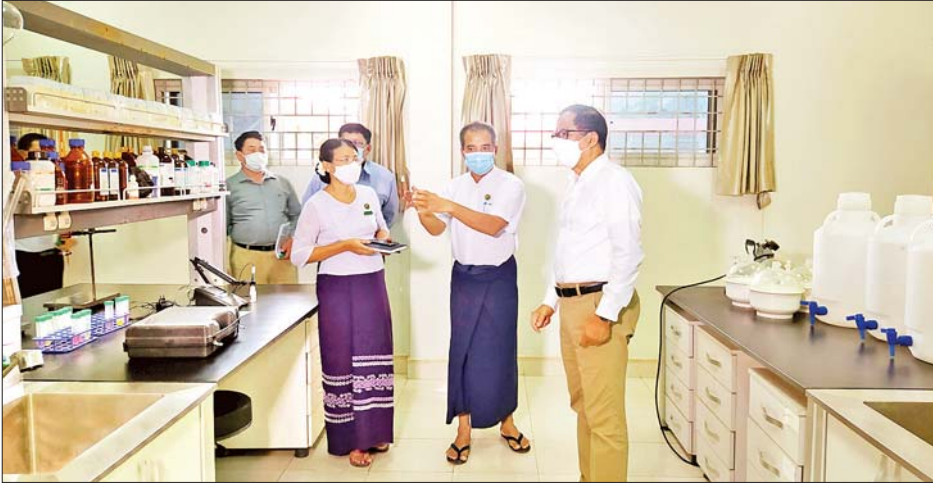
နို့ထွက်ပစ္စည်းနှင့် ငါးလုပ်ငန်းတွင် ၃၀ ရာခိုင်နှုန်း၊ ဟင်းသီးဟင်းရွက်နှင့် သစ်သီးဝလံတွင် ၄၀ ရာခိုင်နှုန်း အထိ အစားအစာဆုံးရှုံးမှုနှင့် အလေအလွင့် ဖြစ်ပေါ်နေသဖြင့် မိမိတို့နိုင်ငံ၏ စိုက်ပျိုးရေးထွက်ကုန်များ တွင် အစားအစာဆုံးရှုံးမှုနှင့် အလေအလွင့်လျော့ချနိုင်ရေးအတွက် သက်ဆိုင်ရာဌာနများ၊ တောင်သူများနှင့် ပုဂ္ဂလိကများပူးပေါင်း၍ ရိတ်သိမ်းချိန်လွန် နည်းပညာ ပြန့်ပွားရေးနှင့် လက်တွေ့အသုံးချရေးလုပ်ငန်းများ ကို တိုးမြှင့်ဆောင်ရွက်ရန်လိုအပ်ကြောင်း ဆက်လက် ပြောကြားသည်။

နေပြည်တော် စက်တင်ဘာ ၁၃ ပြည်သူများ စားနပ်ရိက္ခာဖူလုံရေးနှင့် အာဟာရဓာတ် ပြည့်ဝစွာစားသုံးနိုင်ရေးအတွက် နိုင်ငံတော်အစိုးရက မူဝါဒများ ချမှတ်ဆောင်ရွက်လျက်ရှိရာ စိုက်ပျိုးရေး ဧရိယာတိုးချဲ့ခြင်း၊ တစ်ဧကအထွက်နှုန်းတိုးမြှင့် ဆောင်ရွက်ခြင်းလုပ်ငန်းများအပြင် ရိတ်သိမ်းပြီး နောက်ပိုင်းကာလ လုပ်ငန်းစဉ်များ၌ ဖြစ်ပေါ်လျက် ရှိသည့် လေလွင့်ဆုံးရှုံးမှုများ လျော့ချရေးလုပ်ငန်း ကိုလည်း အလေးထားဆောင်ရွက်ရန်လိုအပ်ကြောင်း စိုက်ပျိုးရေး၊ မွေးမြူရေးနှင့် ဆည်မြောင်းဝန်ကြီးဌာန ပြည်ထောင်စုဝန်ကြီး ဦးတင်ထွဋ်ဦးက ယနေ့ နံနက်ပိုင်းတွင် မန္တလေးတိုင်းဒေသကြီး ထုံးဘိုရှိ စိုက်ပျိုးရေးဦးစီးဌာန ရိတ်သိမ်းချိန်လွန် နည်းပညာ သင်တန်းကျောင်းခန်းမ၌ တာဝန်ရှိသူများနှင့် တွေ့ဆုံစဉ် ပြောကြားသည်။ ထို့ပြင် ပြည်ထောင်စုဝန်ကြီးက ကုလသမဂ္ဂ စားနပ်ရိက္ခာနှင့် စိုက်ပျိုးရေးအဖွဲ့ (FAO)၏ ခန့်မှန်းချက် အရ တစ်ကမ္ဘာလုံး၌ နှစ်စားသီးနှံတွင် ၂၀ ရာခိုင်နှုန်းခန့်