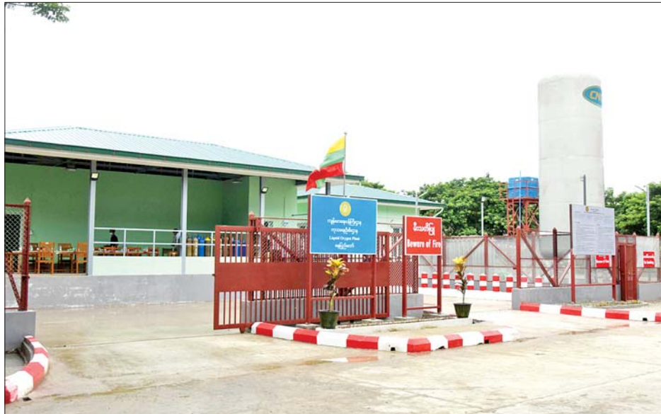
နေပြည်တော်ပြည်သူ့ဆေးရုံကြီး ခုတင်-၃၀၀ ရှိ အောက်ဆီဂျင်ထုတ်လုပ်သည့်စက်ရုံ (Liquid Oxygen Plant) (နေပြည်တော်)ကို တွေ့ရစဉ်။

ပြည်တွင်းပုဂ္ဂလိကစက်ရုံ၊ အလုပ်ရုံတွေကို မရပ်နားဘဲ အလုပ်ရှင်၊ အလုပ်သမားတွေ ထိခိုက်နစ်နာမှုမရှိစေဖို့ ကိုဗစ်စည်းကမ်းချက်တွေနဲ့အညီ စနစ်တကျစစ်ဆေးပြီးမှ ဖွင့်လှစ်ခွင့်ပေးခဲ့သလို အလုပ်သမားထုကြီးရဲ့အခက်အခဲတွေကို ဖြေရှင်းဖို့ အတွက်အစိုးရအလုပ်ရှင်၊ အလုပ်သမားသုံးပွင့်ဆိုင် ညှိနှိုင်းဆွေးနွေးပွဲကိုလည်း ဩဂုတ်လ ၃ ရက်က ကျင်းပခဲ့ပြီး အလုပ်သမားတွေရဲ့အခွင့်အရေးနဲ့ အခက်အခဲတွေကို ညှိနှိုင်းပေးခဲ့ပါတယ်။ ထို့အတူ လူမှုဖူလုံရေးအဖွဲ့ကို ထည့်ဝင်ကြေးတွေ ပေးသွင်းရာမှာလည်း အလုပ်ရှင်၊ အလုပ်သမားအခက်အခဲတွေကို ဖြေလျော့ပေးတဲ့အစီအစဉ်အဖြစ် ခြောက်လ နောက်ဆုတ်ပေးသွင်းခွင့်နဲ့ အိမ်ကလေးတွေမှာ ပျက်ကွက်ကြေးကိုလည်း ကင်းလွတ်ခွင့်ကို ဩဂုတ်လ ၆ ရက်က ထုတ်ပြန်ကြေညာခဲ့ပါတယ်။ အာမခံအလုပ်သမားတွေအတွက် လူမှုဖူလုံရေး-ကဲဝဲလ်အထွေထွေရောဂါကုဆေးခန်းကို ဒဂုံမြို့သစ် (ဆိပ်ကမ်း)မြို့နယ်မှာ ဩဂုတ်လ ၂၇ ရက်က ဖွင့်လှစ်ပေးနိုင်ခဲ့တဲ့အပြင် စက်မှုဇုန်တွေက အာမခံအလုပ်သမားတွေအပါအဝင် ယခုလအတွင်းမှာ လူမှုဖူလုံရေးအကျိုးဝင် အာမခံအလုပ်သမား ၈၉၃၇၂ ဦးကို ကိုဗစ်-၁၉ ကာကွယ်ဆေးတွေ ထိုးနှံပေးနိုင်ခဲ့ပြီဖြစ်ပါတယ်။