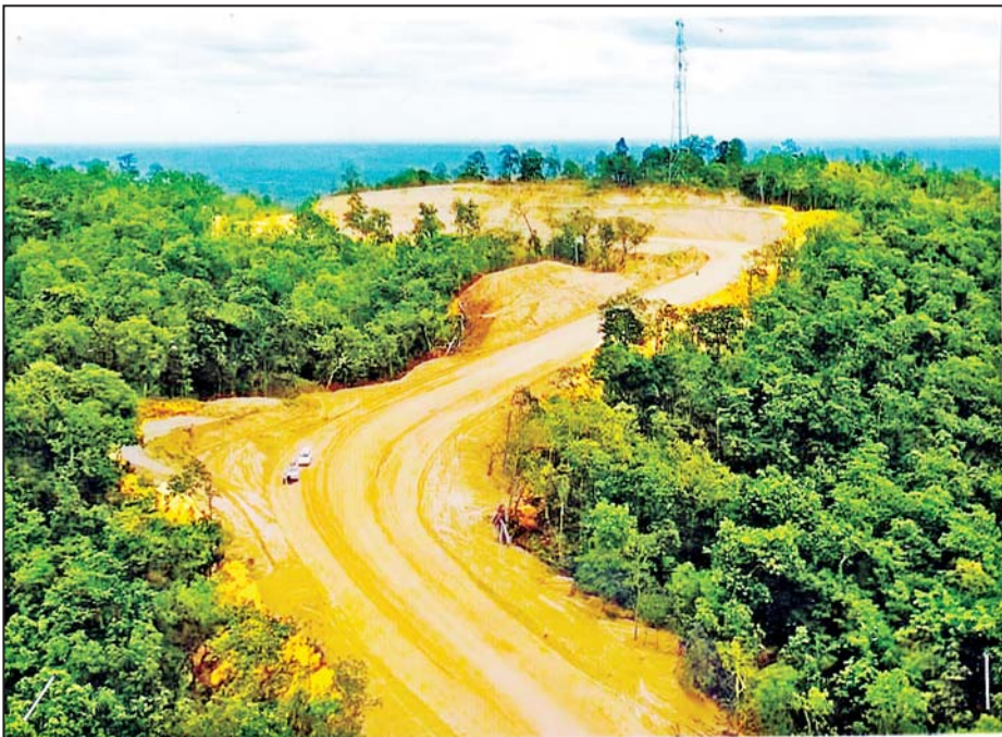
ရေဦး-ကလေးဝကားလမ်းကို အဆင့်မြှင့်တင်ဆောင်ရွက်ထားစဉ်။

မုံရွာ-ပုလဲ-ဂန့်ဂေါလမ်း၊ မိုင် ၀/၀ မှ ၆၅/၀ အထိ (၆၅ မိုင် ၀ ဖာလုံ) သည် နိုင်ငံတကာဆက်သွယ်သည့်လမ်း အာရှလမ်းမကြီးများ၊ အာဆီယံလမ်းမကြီးများစာရင်းတွင်ပါဝင်ပြီး တမူး-မန္တလေး-မိတ္ထီလာ-ရန်ကုန်-ပဲခူး(ဘုရားကြီး)-သထုံ-မြဝတီ (AH1) အပိုင်းတွင်ပါဝင်သောလမ်းဖြစ်ခြင်းကြောင့် ပိုဆောင်ရေးနှင့် ဆက်သွယ်ရေးဝန်ကြီးဌာနမှ ရေးဆွဲထားသော National Transport Master Plan နှင့် KIOCA အဖွဲ့အကူအညီဖြင့် ရေးဆွဲထားသည့် Master Plan For Arterial Road Network Development in Myanmar တို့ကိုအခြေခံ၍ လမ်းဦးစီးဌာနက ရေးဆွဲထားသော နှစ်ရည်စီမံကိန်း (Master Plan) အရ ခုနစ်မီတာ အကျယ် ကတ္တရာကွန်ကရစ်လမ်း (AC) အဆင့် ရောက်ရှိအောင် ဆောင်ရွက်ရန် ရည်မှန်းထားသည်။