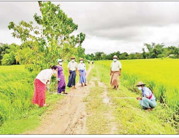
ကျောက်တံခါးမြို့နယ် ကျေးလက်ဒေသဖွံ့ဖြိုးတိုးတက်ရေး ဦးစီးဌာနမှ မြို့နယ်ဦးစီးမှူးနှင့် အဖွဲ့က ကျေးလက်ကုန်ထုတ်လမ်း တံတားလုပ်ငန်း လျာထားဆောင်ရွက်နိုင်ရန်အတွက် ဆယ့်လေးရွာ ကျေးရွာအုပ်စု ဆယ့်လေးရွာကျေးရွာသို့ စက်တင်ဘာ ၁၃ ရက်တွင် အကြိုကွင်းဆင်းခြင်းလုပ်ငန်းများ ဆောင်ရွက်ကြစဉ်။

နေပြည်တော် စက်တင်ဘာ ၁၃ ရှမ်းပြည်နယ်(တောင်ပိုင်း) ဓနုကိုယ်ပိုင်အုပ်ချုပ်ခွင့်ရဒေသ ပင်းတယ မြို့နယ်နှင့် ရွှင်မြို့နယ်အတွင်း ၂၀၂၀-၂၀၂၁ ဘဏ္ဍာနှစ် နယ်စပ် ဒေသဖွံ့ဖြိုးရေး ပြည်ထောင်စုရန်ပုံငွေကျပ် ၂၈၆ ဒသမ ၆၁ သန်းဖြင့် မြေလမ်း ၁၃ မိုင်၊ ကျောက်လမ်း ၁၂ မိုင် ၆ ဖာလုံ၊ ကတ္တရာထပ်ပိုးလွှာ ခင်းခြင်း ငါးမိုင်၊ ကတ္တရာခင်းခြင်း တစ်မိုင်နှင့် ကျောက်စီရေမြောင်း ပေ ၄၀၀ တို့အား အကောင်အထည်ဖော် ဆောင်ရွက်ပေးခဲ့ရာ ယခုအခါ လုပ်ငန်းအားလုံး ရာနှုန်းပြည့်ဆောင်ရွက်ပြီးစီးပြီဖြစ်ကြောင်း နယ်စပ် ဒေသနှင့် တိုင်းရင်းသားလူမျိုးများ ဖွံ့ဖြိုးတိုးတက်ရေးဦးစီးဌာနမှ သိရ သည်။