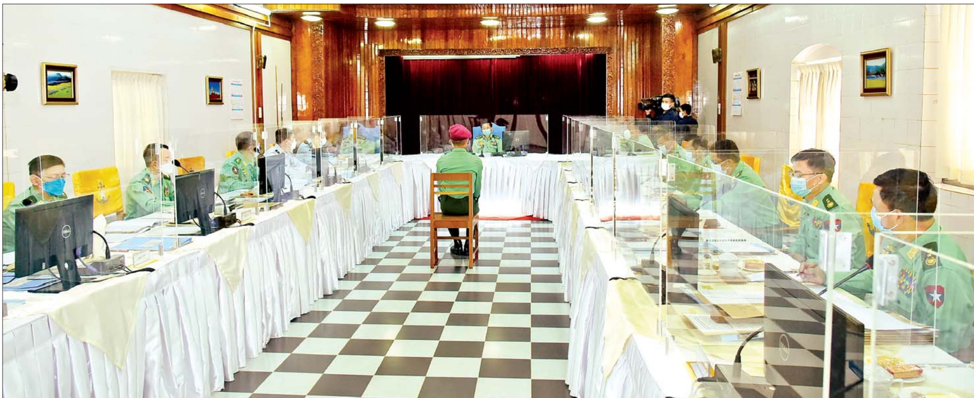
နိုင်ငံတော်စီမံအုပ်ချုပ်ရေးကောင်စီဥက္ကဋ္ဌ၊ တပ်မတော်ကာကွယ်ရေးဦးစီးချုပ် ဗိုလ်ချုပ်မှူးကြီးမင်းအောင်လှိုင် စစ်တက္ကသိုလ် ဗိုလ်လောင်းသင်တန်းအမှတ်စဉ်(၆၄) စစ်လက်ရုံးရွေးချယ်ပွဲတွင် ဗိုလ်လောင်းများအား တပ်မတော်(ကြည်း၊ ရေ၊ လေ)စစ်လက်ရုံးအသီးသီးအတွက် စိစစ်ရွေးချယ်ပေးစဉ်။