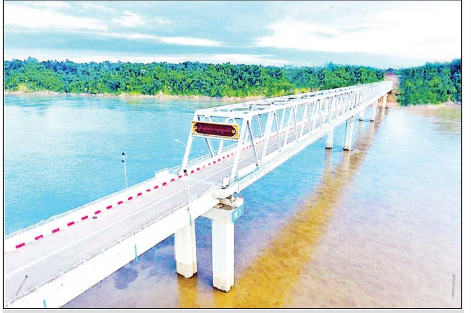
ချင်းတွင်းတံတား (ဟုမ္မလင်း) ကို တွေ့ရစဉ်။