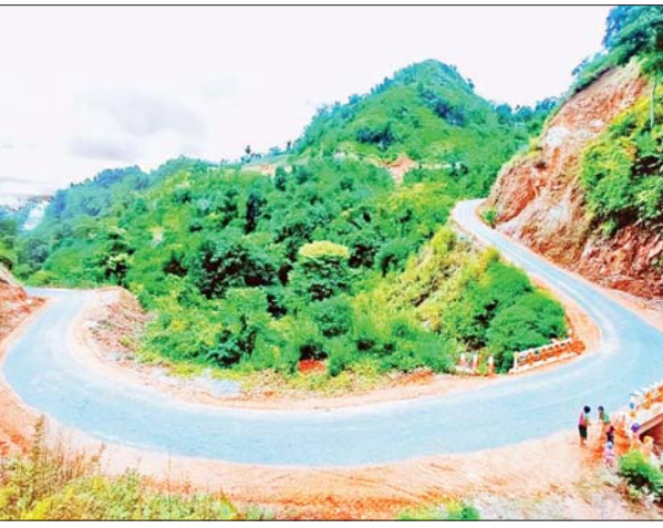
ရရှိခံစားနိုင်ကြပြီဖြစ်ကြောင်း သိရသည်။

အဆိုပါလုပ်ငန်းများ ဆောင်ရွက်ပေးခဲ့မှုကြောင့် ဓနုကိုယ်ပိုင် အုပ်ချုပ်ခွင့်ရဒေသအတွင်း လမ်းပန်းဆက်သွယ်မှု ပိုမိုကောင်းမွန်လာပြီး လူမှုစီးပွားဘဝများ ပိုမိုဖွံ့ဖြိုးတိုးတက်ရေးအတွက် အခွင့်အလမ်းများ