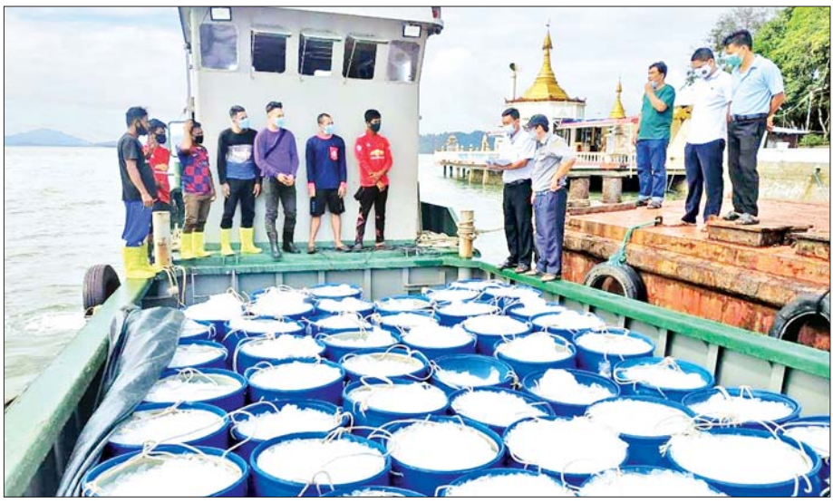
ရုံးပိတ်ရက်ရှည်ကာလအတွင်း ကမ်းဝေးငါးဖမ်းလုပ်ငန်းနှင့် ရေထွက်ပစ္စည်း ပြည်ပတင်ပို့မှု အရှိန်အဟုန်မပြတ် ဆောင်ရွက်နေစဉ်။

ကိုဗစ်-၁၉ ကြောင့် ဖြစ်ပေါ်လာတဲ့ စီးပွားရေးသက်ရောက်မှုတွေ အပေါ် ကုစားရေးလုပ်ငန်းကော်မတီက ဦးဆောင်ရေးဆွဲတဲ့ မြန်မာနိုင်ငံစီးပွားရေး ပြန်လည်ဦးမော့လာစေရေးစီမံချက်ကို ဩဂုတ်လ ၂၅ ရက်က အပြီးသတ်ဆွေးနွေးညှိနှိုင်းခဲ့ပါတယ်။ စီမံချက်အတွင်း လုပ်ငန်းအစီအစဉ် ၁၀ ခု၊ မျှော်မှန်းချက် ၂၇ ခု၊ လုပ်ငန်းစဉ် ၄၀၇ ခုတို့ ပါဝင်ကြောင်း သိရှိရပါတယ်။ ကော်မတီဝင်တွေက စီမံချက်မူကြမ်းအပေါ် ဝိုင်းဝန်းဖြည့်စွက် ဆွေးနွေးခဲ့ကြပြီးဖြစ်တာကြောင့် အတည်ပြုနိုင်ရေးဆောင်ရွက် နေပြီဖြစ်