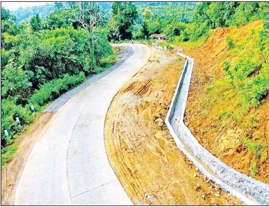
ရွှေဘို-မြစ်ကြီးနားသွားကားလမ်းကို တွေ့ရစဉ်။

တံတားများကဏ္ဍတွင် ချင်းတွင်းတံတား (ဟုမ္မလင်း) သည် စစ်ကိုင်းတိုင်းဒေသကြီး ခန္တီးခရိုင် ဟုမ္မလင်းမြို့နယ် ချင်းတွင်းမြစ်ပေါ်ရှိ တံတား