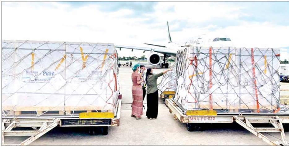
ဩဂုတ် ၂၈ ရက်က တရုတ်ပြည်သူ့သမ္မတနိုင်ငံမှ ဝယ်ယူသည့် Sinopharm အမှတ်တံဆိပ် ကိုဗစ်-၁၉ ရောဂါ ကာကွယ်ဆေးအကြိမ်ရေ နှစ်သန်း ရန်ကုန်အပြည်ပြည်ဆိုင်ရာလေဆိပ်သို့ ရောက်ရှိစဉ်။

ယခုလအတွင်းမှာ အခြေခံစားကုန်နဲ့ အိမ်သုံး ဆေးဝါးတွေကို ရွှေ့လျားဈေးကားစနစ်နဲ့ ဈေးနှုန်း ချိုသာစွာ လှည့်လည်ရောင်းချပေးနိုင်ခဲ့တဲ့အတွက် ကိုဗစ်ကြောင့် ဆေးလိုအပ်ချက်နဲ့ စားနပ်ရိက္ခာ လိုအပ်ချက်ကို ဖြည့်ဆည်းပေးနိုင်ခဲ့တာကြောင့် ပြည်သူတွေအတွက် အဆင်ပြေလွယ်ကူခဲ့ပါတယ်။