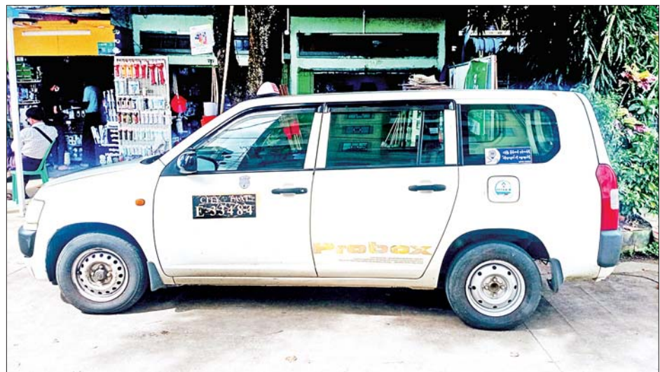
စီးတီးတက္ကစီ မှတ်ပုံတင်ထားသည့် အငှားယာဉ်တစ်စီးကို တွေ့ရစဉ်။