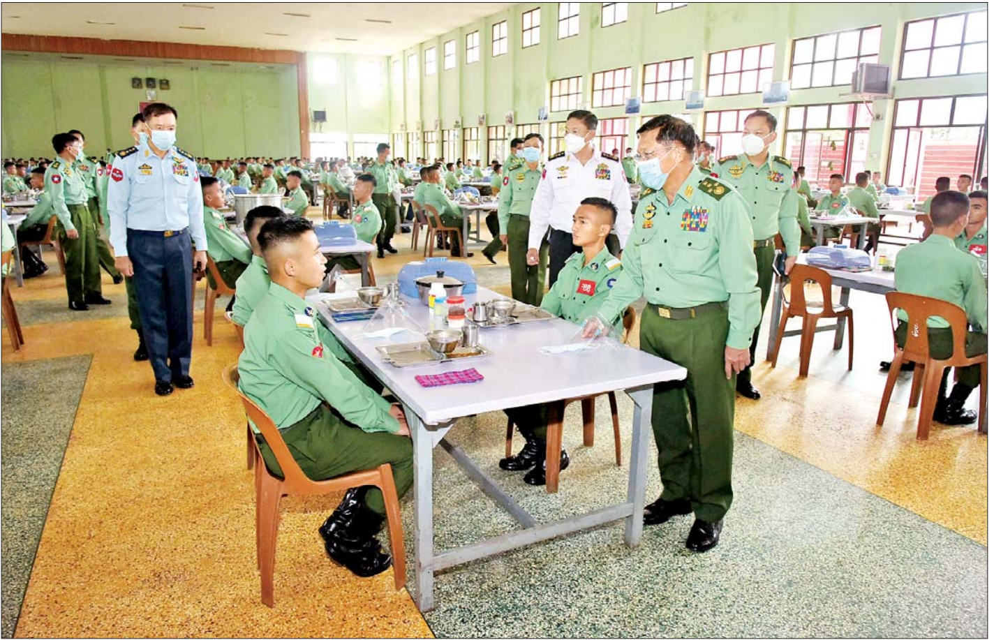
နိုင်ငံတော်စီမံအုပ်ချုပ်ရေးကောင်စီဥက္ကဋ္ဌ၊ တပ်မတော်ကာကွယ်ရေးဦးစီးချုပ် ဗိုလ်ချုပ်မှူးကြီး မင်းအောင်လှိုင် ဘုရင့်နောင်တပ်ရင်း ဗိုလ်လောင်း စားရိပ်သာ၌ ဗိုလ်လောင်းများအား ရင်းရင်းနှီးနှီး လိုက်လံနှုတ်ဆက်၍ အားပေးစကားပြောကြား စဉ်။

* ရှေ့ဖိုးမှ တာဝန်ရှိသူများ တက်ရောက်ကြပြီး ဗိုလ်လောင်းများ အား စာပေပညာ၊ စစ်ပညာ ဘာသာရပ်အလိုက် ထူးချွန်ထက်မြက်မှု၊ ဝါသနာနှင့် ကြိုးစားအားထုတ်မှု များအပေါ်မူတည်၍ သင့်လျော်သည့် တပ်မတော် (ကြည်း၊ ရေ၊ လေ) စစ်လက်ရုံး အသီးသီးအတွက် စီစစ်ရွေးချယ်ပေးခဲ့ကြသည်။ ထို့နောက် နိုင်ငံတော်စီမံအုပ်ချုပ်ရေးကောင်စီ ဥက္ကဋ္ဌ၊ တပ်မတော်ကာကွယ်ရေးဦးစီးချုပ်နှင့် အဖွဲ့ဝင် များသည် ဘုရင့်နောင်တပ်ရင်း ဗိုလ်လောင်း စားရိပ်သာ၌သင်တန်းသား ဗိုလ်လောင်းများနှင့်အတူ နေ့လယ်စာ အတူတကွသုံးဆောင်ကြပြီး ဗိုလ်လောင်း များအား ရင်းရင်းနှီးနှီးလိုက်လံနှုတ်ဆက်၍ အားပေးစကားပြောကြားခဲ့သည်။ ယင်းနောက် မွန်းလွဲပိုင်းတွင် စစ်လက်ရုံးရွေးချယ်မှုအား ဆက်လက်ပြုလုပ်ခဲ့ကြောင်း သတင်းရရှိသည်။ သတင်းစဉ်