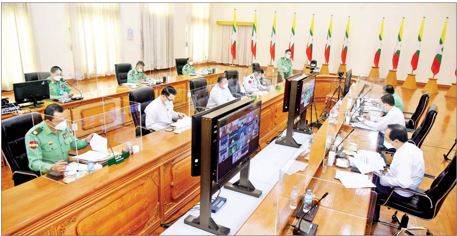
နိုင်ငံတော်စီမံအုပ်ချုပ်ရေးကောင်စီ ဒုတိယဥက္ကဋ္ဌ၊ ဒုတိယဝန်ကြီးချုပ် ဒုတိယဗိုလ်ချုပ်မှူးကြီးစိုးဝင်း ကိုဗစ်-၁၉ ရောဂါ ကာကွယ်၊ ထိန်းချုပ်၊ ကုသရေးဆိုင်ရာ (၁၂)ကြိမ်မြောက် ညှိနှိုင်းအစည်းအဝေးတွင် အမှာစကားပြောကြားစဉ်။

နေပြည်တော် စက်တင်ဘာ ၁၃ ကိုဗစ် - ၁၉ ရောဂါ ကာကွယ်၊ ထိန်းချုပ်၊ ကုသရေးဆိုင်ရာ (၁၂)ကြိမ်မြောက် ညှိနှိုင်းအစည်းအဝေးကို ယနေ့နံနက်ပိုင်း တွင် နေပြည်တော်ရှိ ဘုရင့်နောင်ရိပ်သာ အစည်းအဝေးခန်းမ၌ ကျင်းပရာ နိုင်ငံတော်စီမံအုပ်ချုပ်ရေးကောင်စီ ဒုတိယဥက္ကဋ္ဌ၊ ပြည်ထောင်စုသမ္မတမြန်မာနိုင်ငံတော်အစိုးရအဖွဲ့၊ ဒုတိယဝန်ကြီးချုပ် ဒုတိယဗိုလ်ချုပ်မှူးကြီးစိုးဝင်း တက်ရောက် အမှာစကား ပြောကြားသည်။