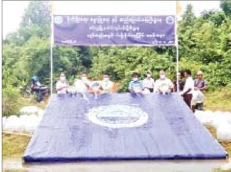
ချရေးစီမံခန့်ခွဲမှုဦးစီးဌာနမှ ဝန်ထမ်းများ၊ စခန်း၏ ၂၀၂၀-၂၀၂၁ ခုနှစ် ငါးမျိုးစိုက်အုတ်ဖိုငါးလုပ်ငန်းစခန်း တာဝန်ခံနှင့် လျာထားချက်အတွက် ပြည့်ဝစွာ ဝန်ထမ်းများ၊ ဒေသခံပြည်သူများ ပါဝင် ဆောင်ရွက်ပြီးစီးကြောင်း သိရသည်။ အုတ်ဖိုငါးလုပ်ငန်း သတင်းစဉ်