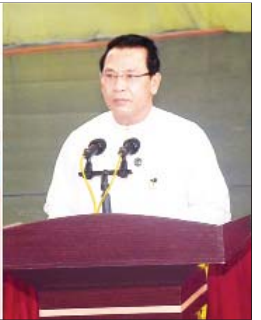
ပြည်ထောင်စုဝန်ကြီး ဦးမောင်မောင်အုန်း မြန်မာနိုင်ငံ၏ ဖြစ်ပေါ်တိုးတက်မှုအခြေအနေများကို မြန်မာနိုင်ငံအခြေစိုက် သံတမန်များနှင့် ကုလသမဂ္ဂ ကိုယ်စားလှယ်များအား တွေ့ဆုံရှင်းလင်းပြောကြားစဉ်။