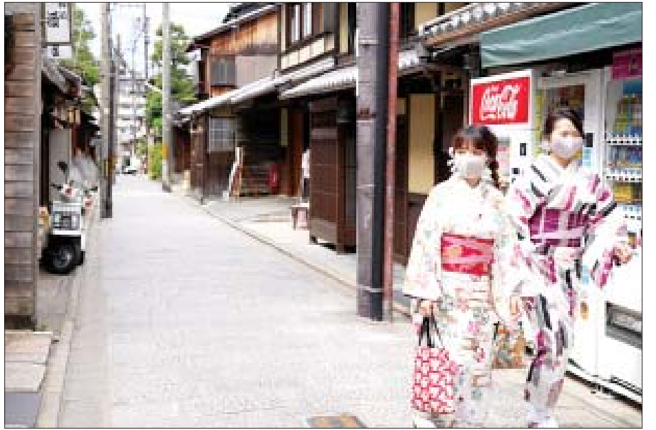
ဈေးဝယ်စင်တာများအား လာရောက်ဝယ်ယူသူ ညွှန်ကြားထားသည်။ အရေးအတွက်ကန့်သတ် ထားရန်တာဝန်ရှိသူများက ကိုးကား-အင်န်အိတ်ချီကော၊ ဘာသာပြန်-စိုးသူရ

စောင့်ရှောက်မှုစနစ်ကိုလည်း အင်အား ပြန်လည် ဖြည့်တင်းသွားမည်ဖြစ်ကြောင်း ၎င်းက ပြောကြား သည်။ နိုင်ငံအတွင်း ကိုဗစ်-၁၉ ရောဂါ ကာကွယ်ဆေး ထိုးနှံမှုခံယူရန်ဆန္ဒရှိသော နိုင်ငံသား များအား အောက်တိုဘာ (သို့မဟုတ်) နိုဝင်ဘာလ တွင် အပြီးထိုးနှံပေးမည်ဖြစ်ကြောင်း သိရသည်။ နိုင်ငံတစ်ဝန်း၌ ကိုဗစ်-၁၉ ရောဂါ ပြင်းထန်စွာ ခံစားနေရသူ ၂၂၀၀ ခန့်ရှိကြောင်း သိရသည်။ အစိုးရအနေဖြင့် နိုင်ငံသားများအား ကိုဗစ်-၁၉ ရောဂါ ကာကွယ်ဆေး ထိုးနှံပေးခြင်းဖြင့် လက်မှတ် များ စစ်ဆေးခြင်းနှင့် ကိုဗစ်-၁၉ ရောဂါ ရှိ မရှိ စစ်ဆေးထားသော ဆေးလက်မှတ်များ စစ်ဆေးခြင်း တို့ကို ဆောင်ရွက်သွားမည်ဖြစ်ကြောင်း သိရ သည်။ နိုင်ငံသားများအား လူထုထပ်သောနေရာ များကို ရှောင်ရှားရန်နှင့် မိမိတို့၏ နေအိမ်များမှသာ အလုပ်လုပ်ကိုင်ရန် အစိုးရက ညွှန်ကြားသည်။ နိုင်ငံ အတွင်းရှိ ဘားဆိုင်များနှင့်စားသောက်ဆိုင်များ၌ ယမကာရောင်းချခြင်းမပြုရန်နှင့် ဆိုင်များကို အချိန် စောစီးစွာပိတ်ရန် ညွှန်ကြားထားပြီး စတိုးဆိုင်များနှင့်