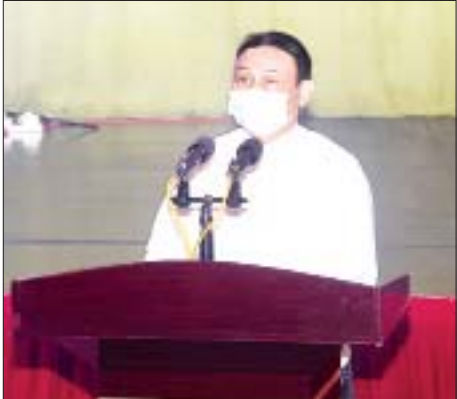
ပြည်ထဲရေးဝန်ကြီးဌာန ဒုတိယဝန်ကြီး ဗိုလ်ချုပ်စိုးတင်နိုင် ရှင်းလင်းပြောကြားစဉ်။

ပြည်ထောင်စုရွေးကောက်ပွဲကော်မရှင်ဟာ နိုင်ငံတော်စီမံအုပ်ချုပ်ရေးကောင်စီရဲ့ ရှေ့လုပ်ငန်းစဉ် (၁)နဲ့အညီ ရွေးကောက်ပွဲကျင်းပခဲ့တဲ့ မြို့နယ် ၃၁၅ မြို့နယ်ရဲ့ မဲစာရင်းတွေကို အသေးစိတ်စိစစ်ခဲ့ပါ ကြောင်း၊ စိစစ်တွေ့ရှိချက်စာရင်းချုပ်အရ စိစစ်ခဲ့ တဲ့ မြို့နယ်ပေါင်း ၃၁၅ မြို့နယ်၊ မဲရုံပေါင်း ၃၉၉၆၃ ရုံရဲ့ ယခင် ရွေးကောက်ပွဲကော်မရှင်က ထုတ်ပြန်ခဲ့တဲ့ မဲဆန္ဒရှင်စာရင်းက ၃၈၂၇၁၄၄၇ (သုံးဆယ့်ရှစ်သိန်း နှစ်သိန်း ခုနစ်သောင်း တစ်ထောင် လေးရာ လေးဆယ့် ခုနစ်) ဦးဖြစ်ပေမယ့် လူဝင်မှုကြီးကြပ်ရေးနှင့် ပြည်သူ့ အင်အားဝန်ကြီးဌာနရဲ့ စာရင်းအရ အသက် ၁၈ နှစ် ပြည့်ပြီး ဆန္ဒမဲပေးပိုင်ခွင့်ရှိသူ ၃၁၇၇၅၃၃၀ (သုံးဆယ့် တစ်သိန်း ခုနစ်သိန်း ခုနစ်သောင်း ငါးထောင် သုံးရာ သုံးဆယ်)ဦးဖြစ်လို့ ၆၄၉၆၁၁၇ (ခြောက်သိန်း လေးသိန်း ကိုးသောင်း ခြောက်ထောင် တစ်ရာ တစ်ဆယ့် ခုနစ်)ဦး ကွာခြားမှုရှိပါကြောင်း။