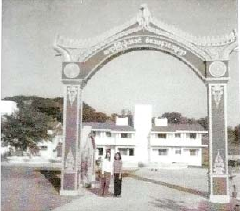
ဆရာကြီး ဦးဘခင် ဝိပဿနာကျေးရွာမုခ်ဦးကို တွေ့ရစဉ်။

- ပရိယတ္တိအခြေခံနှင့် ပဋိပတ္တိအဖြေမုခ် (၁၉၅၂) တရားရှာသူ ဦးဘခင်