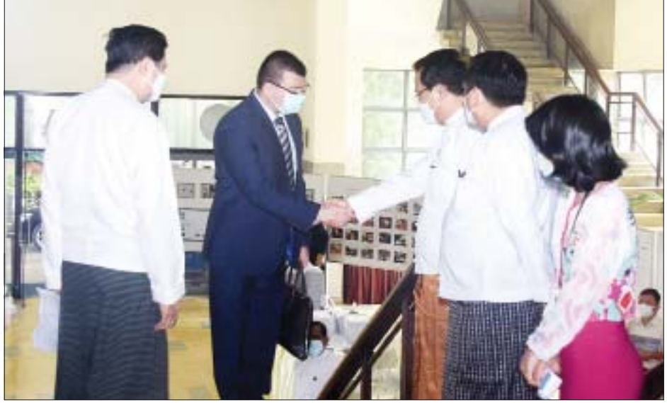
ပြည်ထောင်စုဝန်ကြီး ဦးမောင်မောင်အုန်း မြန်မာနိုင်ငံအခြေစိုက် နိုင်ငံခြားသံရုံးများမှ သံအမတ်ကြီးများနှင့် သံတမန်များအား ရင်းရင်းနှီးနှီး ကြိုဆိုနှုတ်ဆက်စဉ်။

၏ တစ်ဦးချင်းစီနှင့် အဖွဲ့အစည်းများက စေတနာသဒ္ဓါတရား ထက်သန်စွာဖြင့် ထည့်ဝင်လှူဒါန်းမှု၊ လိုအပ်သည့် လုပ်ငန်းစဉ်အသီးသီးတွင် စေတနာ့ဝန်ထမ်းများအဖြစ် အားကြီးမာန်တက် ပါဝင်ဆောင်ရွက်မှု၊ ပြည်သူပြည်သားများ၏ တစ်ဦးချင်းစီ စည်းကမ်းလိုက်နာမှုများသည် ကိုဗစ်ရောဂါ ကာကွယ်ရေးကို ထိရောက်စွာ အထောက်အကူပြုခဲ့ကြောင်း တွေ့ရမှာဖြစ်ပါကြောင်း။