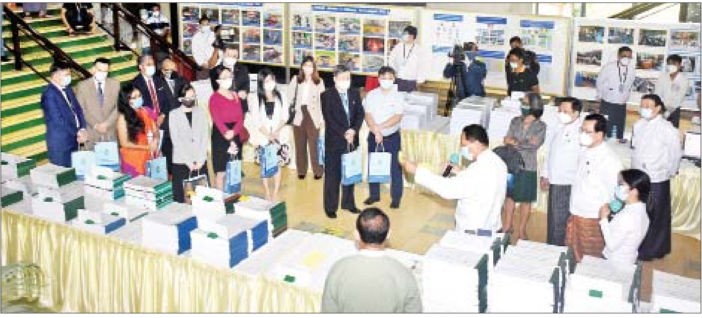
ပြည်ထောင်စုဝန်ကြီး ဦးမောင်မောင်အုန်းနှင့် တာဝန်ရှိသူများက တွေ့ဆုံရင်းလင်းပွဲသို့တက်ရောက်လာကြသော သံတမန်များနှင့် ကုလသမဂ္ဂအဖွဲ့အစည်း များမှ ကိုယ်စားလှယ်များအား ခင်းကျင်းပြသထားသည့်များကို လိုက်လံရှင်းလင်းပြသစဉ်။

၂၀၂၀ ပြည့်နှစ် အထွေထွေရွေးကောက်ပွဲမှာ ဖြစ်ပွားခဲ့သော ရွေးကောက်ပွဲဆိုင်ရာ ဖြစ်မှုများနှင့် ပတ်သက်ပြီး ပြည်ထဲရေးဝန်ကြီးဌာနက ရရှိသော စာရင်းဇယားများအရ ၃၁-၇-၂၀၂၀ ရက်နေ့အထိ သက်ဆိုင်ရာရဲစခန်းများသို့ အမှုဖွင့်တိုင်ကြားထားတဲ့ အမှုပေါင်း ၅၄၆ မှု ရှိပြီး တရားစွဲတင် ၃၃၆ မှု၊ ပိတ်သိမ်း ၁၉၂ မှု နဲ့ လက်ကျန် ၁၈ မှုဖြစ်သဖြင့် ယခင် ရွေးကောက်ပွဲများထက် လွန်စွာများပြားတာကို စိစစ် တွေ့ရှိရပါကြောင်း။