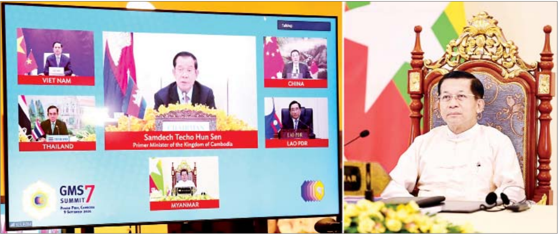
နိုင်ငံတော်စီမံအုပ်ချုပ်ရေးကောင်စီဥက္ကဋ္ဌ၊ နိုင်ငံတော်ဝန်ကြီးချုပ် ဗိုလ်ချုပ်မှူးကြီး မင်းအောင်လှိုင် သတ္တမအကြိမ် မဟာမဲခေါင်ဒေသခွဲထိပ်သီးအစည်းအဝေး (7th Greater Mekong Subregion Summit) တွင် မိန့်ခွန်းပြောကြားစဉ်။

နေပြည်တော် စက်တင်ဘာ ၉ သတ္တမအကြိမ် မဟာမဲခေါင်ဒေသခွဲ ထိပ်သီးအစည်းအဝေး (7th Greater Mekong Subregion Summit) ကို ယနေ့နံနက်ပိုင်းတွင် Video Conference စနစ်ဖြင့် ကျင်းပရာ နိုင်ငံတော်စီမံအုပ်ချုပ်ရေးကောင်စီဥက္ကဋ္ဌ၊ ပြည်ထောင်စုသမ္မတမြန်မာနိုင်ငံတော် အိမ်စောင့်အစိုးရအဖွဲ့၊