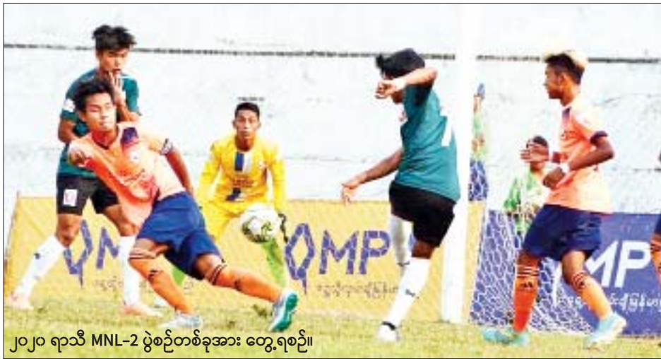
၂၀၂၀ ရာသီ MNL-2 ပွဲစဉ်တစ်ခုအား တွေ့ရစဉ်။