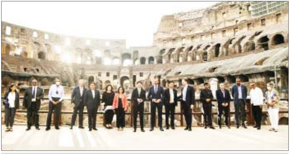
အီတလီနိုင်ငံ ရောမမြို့၌ ကျင်းပခဲ့သော ဂျီ-၂၀ ကျန်းမာရေးဝန်ကြီးများ အစည်းအဝေးသို့ တက်ရောက်လာသော ကျန်းမာရေးဝန်ကြီးများ။