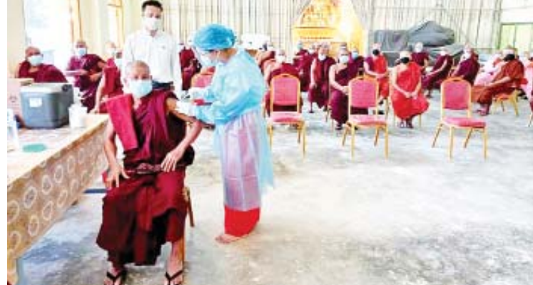
ဉာဏ်ဟိန်း

ထိုသို့ ကိုဗစ်-၁၉ ရောဂါ ကာကွယ်ဆေးထိုးနှံရာတွင် မြို့နယ် အထွေထွေအုပ်ချုပ်ရေးဦးစီးဌာနမှ ဝန်ထမ်းများ၊ မင်္ဂလာဒုံ ခုတင် (၅၀၀) အရိုးကုဆေးရုံကြီးမှ ကျန်းမာရေးဝန်ထမ်းများက ပူးပေါင်းပါဝင်ဆောင်ရွက်ခဲ့ကြကြောင်း သိရသည်။