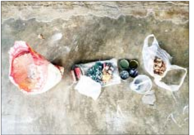
တရားခံ ဇော်လင်းထက်ထံမှ သိမ်းဆည်းရမိသည့် ပစ္စည်းများ မှတ်တမ်းဓာတ်ပုံ။

လျက်ရှိကြောင်း သိရသည်။ လက်လုပ်ပုံးပေါက်ကွဲမှုကြောင့် ကိုဗစ်-၁၉ ရောဂါကာကွယ်ဆေး ထိုးနှံနေသည့် နေရာရှိ လူနှင့် အဆောက်အအုံ တစ်စုံတစ်ရာထိခိုက်မှု မရှိကြောင်းနှင့် NUG၊ CRPH နှင့် PDF အကြမ်းဖက်အုပ်စုများသည် ပြည်သူလူထု ကိုဗစ်-၁၉ ရောဂါကာကွယ်ဆေးထိုးနှံနေစဉ် နှောင့်ယှက် တိုက်ခိုက်ခြင်း၊ မိုင်းထောင်ပုံးခွဲခြင်း စုစုပေါင်း ၁၉ ကြိမ်အထိ လူမဆန် စွာ ကျူးလွန်ခဲ့ပြီးဖြစ်သည်။ အဆိုပါပြည်သူလူထု၏ အသက်အိုးအိမ်နှင့် ကာကွယ်ဆေးထိုး လုပ်ငန်းဆောင်ရွက်နေမှုကို ပစ်မှတ်ထား၍ အကြမ်းဖက်ပုံးဖောက်ခွဲ သူအား ဖမ်းဆီးရမိရေး လုံခြုံရေးတပ်ဖွဲ့ဝင်များက အပူတပြင်း ရှာဖွေ ဖော်ထုတ်လျက်ရှိကြောင်းနှင့် ပြည်သူများအနေဖြင့်လည်း မသင်္ကာဖွယ် အကြမ်းဖက်သမား၏ သတင်းရရှိပါက အချိန်နှင့်တစ်ပြေးညီ သက်ဆိုင်ရာ သို့ သတင်းပေးပို့ကူညီကြပါရန် မေတ္တာရပ်ခံနှိုးဆော်ထားကြောင်း သိရ သည်။