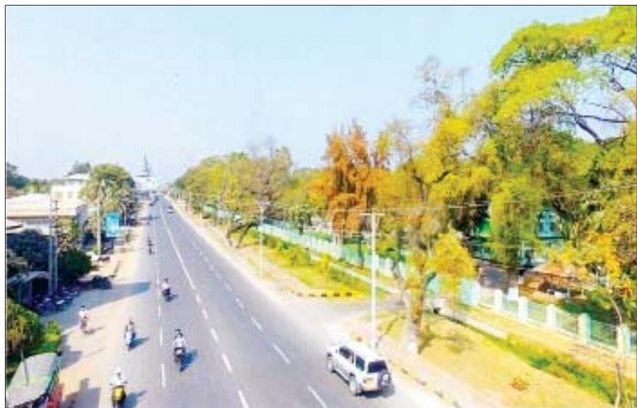
ရွှေဘို- မြစ်ကြီးနားလမ်းကို တွေ့ရစဉ်။

နှစ်စဉ်ရန်ပုံငွေ ခွင့်ပြုရရှိမှုအခြေအနေအရ လက်ရှိလုပ်ကိုင်နေသည့် လုပ်ငန်းများမှာ လမ်းလုပ်ငန်းအနေဖြင့် မူလ ၁၈ ပေအကျယ်မှ ၂၄ ပေ အထက်အကျယ်ကတ္တရာလမ်းအဖြစ် ငါးမိုင် ၁ ဒသမ ၅ ဖာလုံ၊ မူလ ၁၂ ပေအကျယ်မှ ၁၈ ပေအထက်အကျယ်ကတ္တရာလမ်းအဖြစ် ၁၁၄ မိုင် ၁ ဒသမ ၂၅ ဖာလုံ၊ ၁၈ ပေအကျယ် ကွန်ကရစ်လမ်း ၅ မိုင် ၆ ဒသမ ၇၅ ဖာလုံ၊ တံတားလုပ်ငန်းအနေဖြင့် ကွန်ကရစ်တံတားပေ ၁၈၀ အောက် အစင်း ၁၅၀ တို့ကို ဆောင်ရွက်နိုင်ခဲ့ပြီးဖြစ်သဖြင့် မော်တော်ယာဉ်များ ယာဉ်ကြောပိတ်ဆို့မှု၊ မတော်တဆထိခိုက်မှုတို့ နည်းပါးလာပြီး အချိန်တိုအတွင်း အဆင်ပြေချောမွေ့စွာ သွားလာနိုင်ပြီဖြစ်