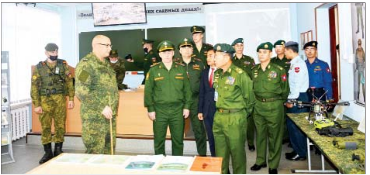
နိုင်ငံတော်စီမံအုပ်ချုပ်ရေးကောင်စီ ဒုတိယဥက္ကဋ္ဌ၊ ဒုတိယတပ်မတော်ကာကွယ်ရေးဦးစီးချုပ် ကာကွယ်ရေးဦးစီးချုပ်(ကြည်း) ဒုတိယဗိုလ်ချုပ်မှူးကြီးစိုးဝင်း ဦးဆောင်သည့်ကိုယ်စားလှယ်အဖွဲ့ Higher Military Command School သို့ သွားရောက်လေ့လာကြည့်ရှုကြစဉ်။

နေပြည်တော် စက်တင်ဘာ ၇ ရုရှားဖက်ဒရေးရှင်းနိုင်ငံ Novosibirsk မြို့၌ ရောက်ရှိနေသည့် နိုင်ငံတော်စီမံအုပ်ချုပ်ရေးကောင်စီ ဒုတိယဥက္ကဋ္ဌ၊ ဒုတိယတပ်မတော် ကာကွယ်ရေးဦးစီးချုပ် ကာကွယ်ရေးဦးစီးချုပ်(ကြည်း) ဒုတိယဗိုလ်ချုပ်မှူးကြီးစိုးဝင်း ဦးဆောင်သည့်ကိုယ်စားလှယ်အဖွဲ့သည် စစ်သံမှူး ဗိုလ်မှူးချုပ်ကျော်စိုးမိုးနှင့် တာဝန်ရှိသူများလိုက်ပါ၍ ယနေ့ ဒေသစံတော်ချိန် နံနက်ပိုင်းတွင် Higher Military Command School သို့ သွားရောက်လေ့လာကြည့်ရှုကြရာ ကျောင်းအုပ်ကြီး Colonel Segey Markovchin နှင့် တာဝန်ရှိသူများက ကြိုဆိုနှုတ်ဆက်ကြသည်။