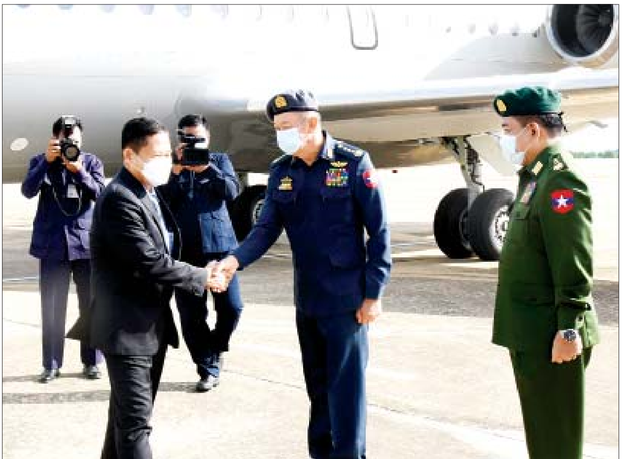
နိုင်ငံတော်စီမံအုပ်ချုပ်ရေးကောင်စီဒုတိယဥက္ကဋ္ဌ၊ ဒုတိယတပ်မတော်ကာကွယ်ရေးဦးစီးချုပ် ကာကွယ်ရေးဦးစီးချုပ်(ကြည်း) ဒုတိယဗိုလ်ချုပ်မှူးကြီးစိုးဝင်း ဦးဆောင်သည့် ကိုယ်စားလှယ်အဖွဲ့အား နိုင်ငံတော်စီမံအုပ်ချုပ်ရေးကောင်စီဝင်၊ ကာကွယ်ရေးဦးစီးချုပ်(လေ) ဗိုလ်ချုပ်ကြီးမောင်မောင်ကျော်၊ ညှိနှိုင်းကွပ်ကဲရေးမှူး(ကြည်း၊ ရေ၊ လေ) ဗိုလ်ချုပ်ကြီးမောင်မောင်အေးနှင့် တာဝန်ရှိသူများက နေပြည်တော်တပ်မတော်လေဆိပ်တွင် ကြိုဆိုနှုတ်ဆက်ကြစဉ်။