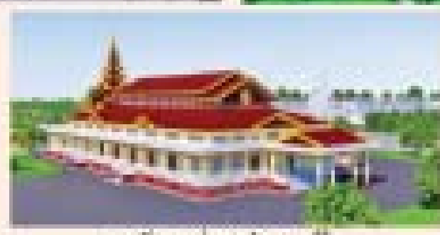
ကျွန်းပူဇော်ရာ (၁) - ပုသိမ်