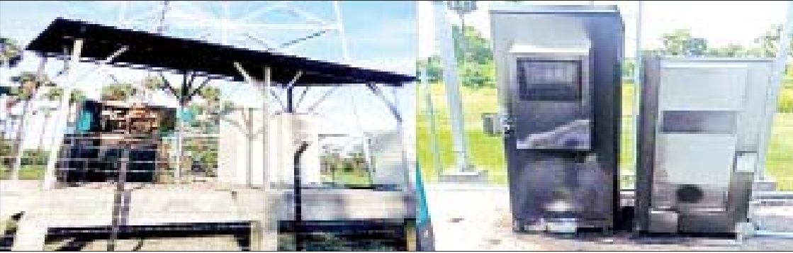
ဝမ်းတွင်းမြို့နယ်၌ ဖုန်းတာဝါတိုင် ဖျက်ဆီးခံရမှု မှတ်တမ်းဓာတ်ပုံ။

နေပြည်တော် စက်တင်ဘာ ၇ နိုင်ငံတော်အတွင်း နေထိုင်ကြသော ပြည်သူလူထုများ၏ လူမှုဘဝဖွံ့ဖြိုးတိုး တက်စေရေးအတွက် တစ်စိတ်တစ်ပိုင်း အဖြစ် အထောက်အကူပြုသည့် ဆက်သွယ်ရေးကွန်ရက် နိုင်ငံတစ်ဝန်းလုံး ဖြန့်ကြက်နိုင်စေရန် နိုင်ငံတော်အစိုးရ၏ လမ်းညွှန်စီစဉ် ညွှန်ကြားမှုများဖြင့် ဆက်သွယ်ရေး တာဝါတိုင်များအား အမြို့မြို့၊ အနယ်နယ်တိုင်း၌ တွန်းအား ပေး စိုက်ထူဆောင်ရွက်ပေးထားခဲ့သည် ကို အေးချမ်းစွာ နေထိုင်လိုခြင်းမရှိဘဲ နိုင်ငံရေး အစွန်းရောက်အကြမ်းဖက်သူ များက အဆိုပါဆက်သွယ်ရေး တာဝါတိုင် များအနက် အချို့အား မီးရှို့ဖျက်ဆီးခြင်း၊ မိုင်းထောင် ဖောက်ခွဲဖျက်ဆီးခြင်းများဖြင့် အကြမ်းဖက်မှုလုပ်ရပ်များ လုပ်ဆောင် လျက်ရှိသည်။ ထိုသို့ ဖျက်ဆီးခြင်းများ ဆောင်ရွက်