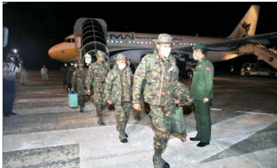
တင့်တပ်ဖွဲ့ဝင်များသည် တင့်ကားမောင်းနှင်ပစ်ခတ် ခြင်းပြိုင်ပွဲ Tank Biathlon (Division-2) ၌ စံချိန် ၂ နာရီ ၂၈ မိနစ် ၀၅ စက္ကန့်ဖြင့် တတိယနေရာ၌

ဖျော်ဖြေတင်ဆက်မှုတွင် ဒုတိယဆု၊ နိုင်ငံ့ရိုးရာ ယဉ်ကျေးမှုကို ပေါ်လွင်ထင်ဟပ်အောင် ဖျော်ဖြေ တင်ဆက်ပြသမှုတွင် ဒုတိယဆုတို့ကို ဆွတ်ခူးရရှိ ခဲ့သည့်အပြင် အွန်လိုင်းမှတစ်ဆင့် ပရိသတ်များ၏ မဲပေးရွေးချယ်မှုတွင်လည်း တတိယဆုကို ရရှိအောင် အသီးသီးစွမ်းဆောင်နိုင်ခဲ့သည်။ ထို့ပြင် ဆေးတပ်ဖွဲ့ ဝင်များအနေဖြင့် ပြိုင်ပွဲဝင်အသင်း ၉ သင်းအနက် အဆင့် (၆) နေရာတွင်လည်းကောင်း၊ လေကြောင်းချီ တပ်ဖွဲ့အနေဖြင့် ပြိုင်ပွဲဝင်အသင်း ၁၈ သင်းအနက် အဆင့် (၇) နေရာတွင်လည်းကောင်း အသီးသီး ရပ်တည်နိုင်ခဲ့အောင် စွမ်းဆောင်နိုင်ခဲ့ကြသည်။ မြန်မာ့တပ်မတော် တပ်ဖွဲ့ဝင်များအနေဖြင့် အဆိုပါ International Army Games ပြိုင်ပွဲများတွင် နိုင်ငံတကာစစ်ဘက်အဖွဲ့အစည်းများ၏ ပြိုင်ပွဲ ယှဉ်ပြိုင်မှု အတွေ့အကြုံများ၊ နည်းပညာပိုင်းဆိုင်ရာ အတွေ့အကြုံများနှင့် ချစ်ကြည်ရင်းနှီးမှုများ ရရှိအောင် စွမ်းဆောင်နိုင်ခဲ့ကြောင်းနှင့် လာမည့်နှစ် များတွင်လည်း ဆက်လက်ပါဝင်ယှဉ်ပြိုင်သွားမည် ဖြစ်ကြောင်း သတင်းစဉ်