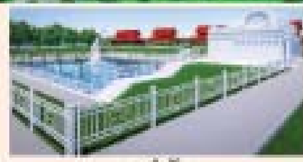
ကျွန်းပူဇော်ရာ

၁။ နိုင်ငံပေါ်ရှိ ထိုင်းတော်ပူဇော်ရာများသည် အင်အားစွမ်းအားရှိသည့် နိုင်ငံပေါ်ရှိ ဤအစားအစာများဖြင့် ဤအစားအစာများဖြင့် အရပ်အဖွဲ့အစည်းများတွင် တည်ဆောက်ပေးခြင်းအတွက် အရပ်အဖွဲ့အစည်းများနှင့် အပြန်အလှန်ဆောင်ရွက်ခြင်းအတွက် အရပ်အဖွဲ့အစည်းများနှင့် အပြန်အလှန်ဆောင်ရွက်ခြင်း