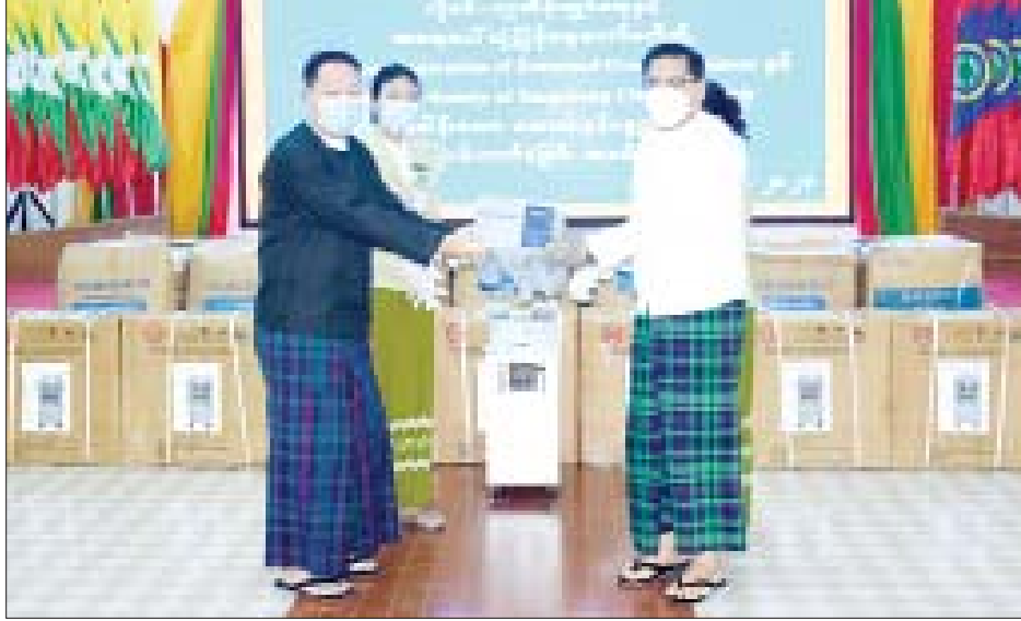
အတွင်းရှိ ထိန်းချုပ် ပေါင်စန်းပြည်နယ်ခွဲများသည် လည်း အိမ်နီးချင်းကောင်းပီသစွာ အတူတကွလက်တွဲ စီးပွားရေး၊ ယဉ်ကျေးမှုများ ထိစပ်လှည့်နေသကဲ့သို့ ပြီး ကိုဗစ်-၁၉ ရောဂါတိုက်ဖျက်ရေးကို စဉ်ဆက်မပြတ် ယခုလို ကိုဗစ်-၁၉ ကပ်ရောဂါကာလအတွင်းမှာ ပံ့ပိုးကူညီမှုများ ဆောင်ရွက်ပေးနေသည့်အတွက်

မြစ်ကြီးနား စက်တင်ဘာ ၇ ကာချင်ပြည်နယ် ကိုဗစ်-၁၉ ရောဂါ ထိန်းချုပ်ရေးနှင့် အရေးပေါ် တုံ့ပြန်ရေးကော်မတီသို့ တရုတ်ပြည်သူ့ သမ္မတနိုင်ငံ ထိန်းချုပ်ပြည်နယ်ခွဲမှ အဖွဲ့အစည်းများနှင့် မန္တလေးမြို့အခြေစိုက် တရုတ်ပြည်သူ့သမ္မတနိုင်ငံ ကောင်စစ်ဝန်ချုပ်ရုံးတို့က Oxygen Concentrator များနှင့် ကာကွယ်ရေးသုံးပစ္စည်းများ လှူဒါန်းမှုကို ယနေ့ နံနက် ၁၀ နာရီတွင် ပြည်နယ်အစိုးရအဖွဲ့ရုံး ဆဲးဆဲးခေါင်းဆောင်ခန်းမ၌ ပြုလုပ်သည်။