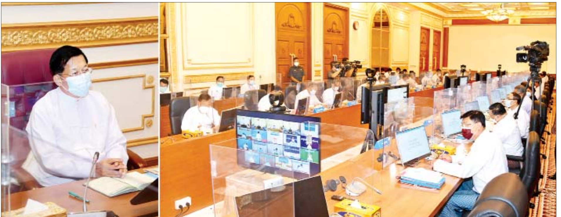
နိုင်ငံတော်စီမံအုပ်ချုပ်ရေးကောင်စီဥက္ကဋ္ဌ၊ နိုင်ငံတော်ဝန်ကြီးချုပ် ဗိုလ်ချုပ်မှူးကြီး မင်းအောင်လှိုင် ပြည်ထောင်စုသမ္မတမြန်မာနိုင်ငံတော် အိမ်စောင့်အစိုးရအဖွဲ့ အစည်းအဝေးအမှတ်စဉ် (၂/၂၀၂၁)တွင် အမှာစကားပြောကြားစဉ်။

နေပြည်တော် စက်တင်ဘာ ၇ ပြည်ထောင်စုသမ္မတမြန်မာနိုင်ငံတော် အိမ်စောင့်အစိုးရအဖွဲ့ အစည်းအဝေး အမှတ်စဉ် (၂/၂၀၂၁)ကို ယနေ့ မွန်းလွဲပိုင်းတွင် နေပြည်တော်ရှိ နိုင်ငံတော်စီမံအုပ်ချုပ်ရေးကောင်စီဥက္ကဋ္ဌ၊ အစည်းအဝေးခန်းမ၌ ကျင်းပရာ နိုင်ငံတော်စီမံအုပ်ချုပ်ရေးကောင်စီဥက္ကဋ္ဌ၊ ပြည်ထောင်စုသမ္မတမြန်မာနိုင်ငံတော် အိမ်စောင့်အစိုးရအဖွဲ့၊ နိုင်ငံတော် ဝန်ကြီးချုပ် ဗိုလ်ချုပ်မှူးကြီး မင်းအောင်လှိုင် တက်ရောက်အမှာစကား ပြောကြားသည်။