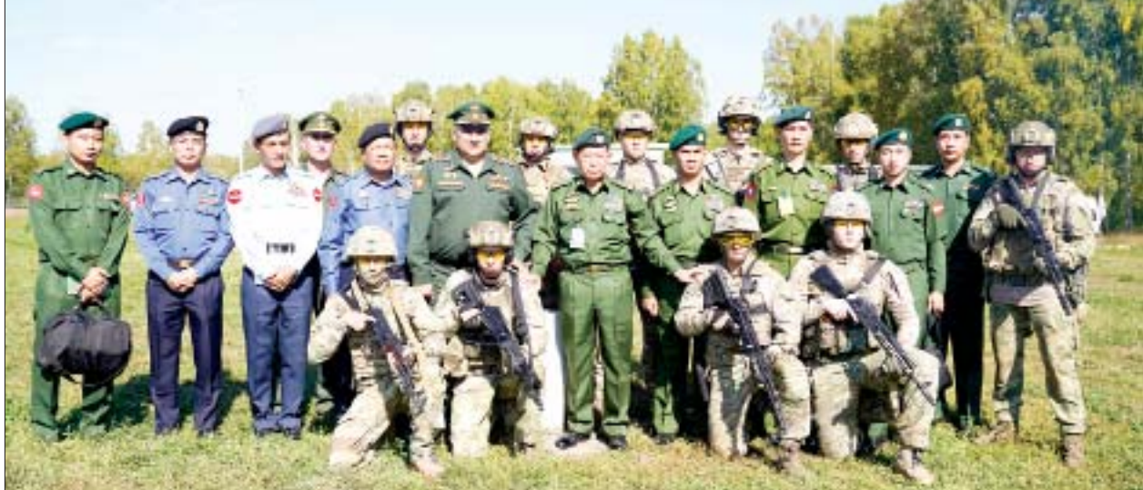
နိုင်ငံတော်စီမံအုပ်ချုပ်ရေးကောင်စီ ဒုတိယဥက္ကဋ္ဌ၊ ဒုတိယတပ်မတော်ကာကွယ်ရေးဦးစီးချုပ် ကာကွယ်ရေးဦးစီးချုပ်(ကြည်း) ဒုတိယဗိုလ်ချုပ်မှူးကြီးစိုးဝင်း ဦးဆောင်သည့်ကိုယ်စားလှယ်အဖွဲ့ Higher Military Command School မှ တာဝန်ရှိသူများ၊ သင်တန်းသားများနှင့်အတူ စုပေါင်းမှတ်တမ်းတင်ဓာတ်ပုံရိုက်စဉ်။

☐ ကျောပုံးမှ ထို့နောက် နိုင်ငံတော်စီမံအုပ်ချုပ်ရေးကောင်စီ ဒုတိယဥက္ကဋ္ဌ၊ ဒုတိယတပ်မတော် ကာကွယ်ရေး ဦးစီးချုပ် ကာကွယ်ရေးဦးစီးချုပ်(ကြည်း) ဦးဆောင်