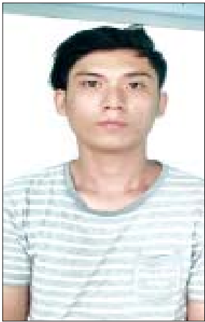
တရားခံ မျိုးမင်းထက်

လျက်ရှိကြောင်း သိရသည်။ လက်လုပ်ပုံးပေါက်ကွဲမှုကြောင့် ကိုဗစ်-၁၉ ရောဂါကာကွယ်ဆေး ထိုးနှံနေသည့် နေရာရှိ လူနှင့် အဆောက်အအုံ တစ်စုံတစ်ရာထိခိုက်မှု မရှိကြောင်းနှင့် NUG၊ CRPH နှင့် PDF အကြမ်းဖက်အုပ်စုများသည် ပြည်သူလူထု ကိုဗစ်-၁၉ ရောဂါကာကွယ်ဆေးထိုးနှံနေစဉ် နှောင့်ယှက် တိုက်ခိုက်ခြင်း၊ မိုင်းထောင်ပုံးခွဲခြင်း စုစုပေါင်း ၁၉ ကြိမ်အထိ လူမဆန် စွာ ကျူးလွန်ခဲ့ပြီးဖြစ်သည်။ အဆိုပါပြည်သူလူထု၏ အသက်အိုးအိမ်နှင့် ကာကွယ်ဆေးထိုး လုပ်ငန်းဆောင်ရွက်နေမှုကို ပစ်မှတ်ထား၍ အကြမ်းဖက်ပုံးဖောက်ခွဲ သူအား ဖမ်းဆီးရမိရေး လုံခြုံရေးတပ်ဖွဲ့ဝင်များက အပူတပြင်း ရှာဖွေ ဖော်ထုတ်လျက်ရှိကြောင်းနှင့် ပြည်သူများအနေဖြင့်လည်း မသင်္ကာဖွယ် အကြမ်းဖက်သမား၏ သတင်းရရှိပါက အချိန်နှင့်တစ်ပြေးညီ သက်ဆိုင်ရာ သို့ သတင်းပေးပို့ကူညီကြပါရန် မေတ္တာရပ်ခံနှိုးဆော်ထားကြောင်း သိရ သည်။