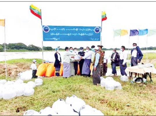
ဒေသခံပြည်သူများ တက်ရောက်၍ ငါးမျိုးစိုက်ထည့်ပေးကြ ကြောင်း သိရသည်။

သာယာဝတီ စက်တင်ဘာ ၇ ပဲခူးတိုင်းဒေသကြီး ငါးလုပ်ငန်းဦးစီးဌာန၏ လမ်းညွှန်မှုဖြင့် စက်တင်ဘာ ၆ ရက်ကသာယာဝတီမြို့နယ် စံရွေးကျေးရွာအနီးရှိ မြစ်မခ သဘာဝရေပြင်အတွင်းသို့ နှစ်လက်မအရွယ် ငါးမြစ်ချင်း ကောင်ရေ ငါးသောင်း၊ ငါးခိုးမကြီးကောင်ရေ ငါးသောင်း၊ ရွှေဝါငါးကြင်းကောင်ရေ ငါးသောင်း စုစုပေါင်း ငါးကောင်ရေ တစ်သိန်းငါးသောင်း မျိုးစိုက်ထည့်ပေးခဲ့သည်။