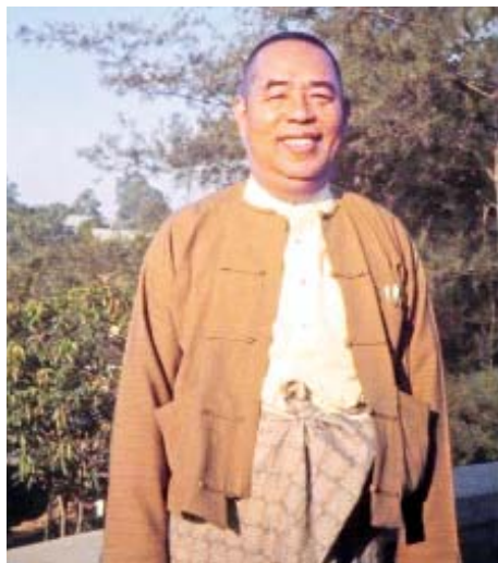
သရေစည်သူ ဆရာကြီးဦးဘခင် (၁၈၉၉-၁၉၇၁)

ဗြိတိသျှအာဏာပိုင်များအနေဖြင့် ဂျပန်တို့ စစ်ဦးကာလကတည်းက တိမ်းရှောင်သွားကြပြီ