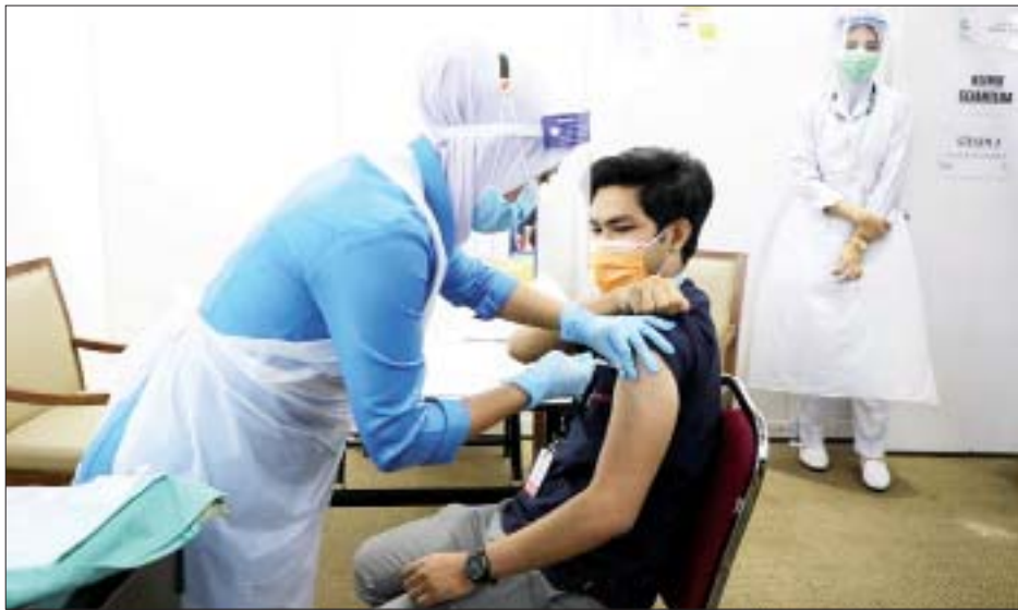
အနက် ၁၈၅၂၉ ဦးသည် ပြည်တွင်း၌ ကူးစက်ခံရသူ များဖြစ်ကြောင်းနှင့် ၁၈ ဦးသည် ပြည်ပမှပြန်လည် ရောက်ရှိလာသူများအနက်မှ ကူးစက်ခံရသူများ ဖြစ်ကြောင်း သိရသည်။

ကာလာလမ်ပူ စက်တင်ဘာ ၇ မလေးရှားနိုင်ငံ၏ လူဦးရေ ၆၃ ဒသမ ၃ ရာခိုင်နှုန်းခန့်သည် ကိုဗစ်-၁၉ ရောဂါကာကွယ်ဆေး အနည်းဆုံး တစ်ကြိမ်ထိုးနှံပြီးဖြစ်ကြောင်းနှင့် နိုင်ငံ၏လူဦးရေ ၄၉ ဒသမ ၃ ရာခိုင်နှုန်းသည် ကိုဗစ်-၁၉ ရောဂါ ကာကွယ်ဆေးနှစ်ကြိမ်ထိုးနှံပြီး ဖြစ်ကြောင်း ယနေ့သတင်းများအရ သိရသည်။