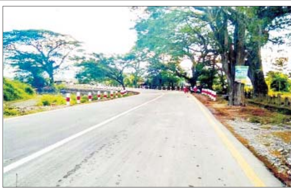
ဂန့်ဂေါ-ကလေးသွားကားလမ်းကို တွေ့ရစဉ်။

■ စာမျက်နှာ ၁၆ မှ မြန်မာနိုင်ငံအနှံ့အပြားသို့ သွားလာနိုင်မည် နှစ်စဉ်ရန်ပုံငွေခွင့်ပြုရရှိမှု အခြေအနေအရ လက်ရှိလုပ်ကိုင်နေသည့် လုပ်ငန်းများမှာ လက်ရှိ မြေပြင်တွင်ရှိသည့် လမ်းကြောင်းအခြေအနေများ အရ အတက်အဆင်း မတ်စောက်သောနေရာများ အား Grade နှိမ့်ချခြင်း၊ သတ်မှတ်လမ်းတာပေါင် အကျယ်/ အမြင့် ရရှိအောင်ဆောင်ရွက်ခြင်း၊ အမာခံလမ်းကို ကွန်ကရစ်လမ်းအဖြစ် အဆင့် မြှင့်တင်ခြင်း၊ လိုအပ်သောနေရာများတွင် မြေထိန်း နံရံ/ မြေကာနံရံများ တည်ဆောက်ပေးခြင်းနှင့် လက်ရှိသစ်သား/ ဘေလီတံတားများကို ကွန်ကရစ် တံတားအဖြစ် အဆင့်မြှင့်တင်ခြင်းလုပ်ငန်းများ ကို ဆောင်ရွက်လျက်ရှိပြီး လမ်းလုပ်ငန်းအနေဖြင့် မူလအမာခံလမ်း ၁၈ပေအကျယ် ကွန်ကရစ်လမ်း အဖြစ် ၃၄ မိုင် ၇ ဒဿမ ၇၅ ဖာလုံ၊ မူလမြေလမ်းမှ အမာခံလမ်းအဖြစ် ၄၉ မိုင် ၇ ဒဿမ ၂၅ ဖာလုံ၊ တံတားလုပ်ငန်းအနေဖြင့် ကွန်ကရစ်တံတား ပေ ၁၈၀ နှင့်အထက် ၁၄ စင်း၊ ကွန်ကရစ်တံတား ပေ ၁၈၀ နှင့်အောက် အစင်း ၄၄၀ စုစုပေါင်း ၄၅၄ စင်း တိုးတက်ဆောင်ရွက်နိုင်ခဲ့ပြီး ဖြစ်သဖြင့် စစ်ကိုင်းတိုင်းဒေသကြီးအထက်ပိုင်းနှင့် နာဂဒေသ တွင်းမှ သက္ကယ်ကျင်း-ရေဦး-မုံရွာ တို့မှတစ်ဆင့် မြန်မာနိုင်ငံအနှံ့အပြားသို့ သွားလာနိုင်မည်ဖြစ်သည်။ လက်ရှိလမ်းအခြေအနေမှာ ၂၄ ပေနှင့် အထက် ကတ္တရာကွန်ကရစ်လမ်း သုည မိုင် ၄ ငါး ဖာလုံ၊ ၁၈ပေ ကွန်ကရစ်လမ်း ၃၈ မိုင် ၁ ဒဿမ ၅ ဖာလုံ၊ ၁၂ ပေ ကွန်ကရစ်လမ်း ၁ မိုင် ၃ ဒဿမ ၅ ဖာလုံ၊ ၁၂ ပေ ကတ္တရာလမ်း ၁ မိုင် ၇ ဖာလုံ၊