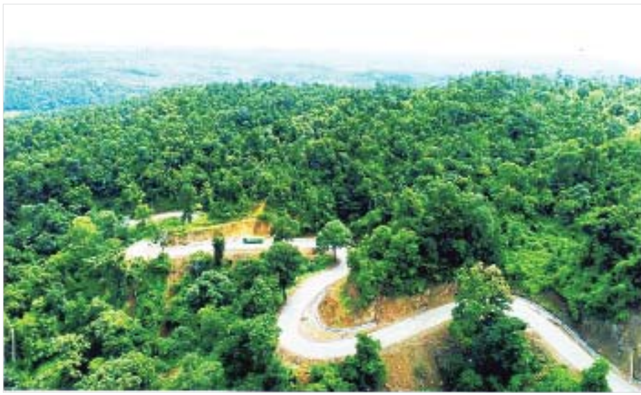
မုံရွာ-ပုလဲ- ဂန့်ဂေါကားလမ်းကို တွေ့ရစဉ်။

စစ်ကိုင်းတိုင်းဒေသကြီးသည် မြစ်ချောင်းများ ပေါများသည့် ဒေသတစ်ခုဖြစ်ပြီး ထင်ရှားသော မြစ်မှာ ဧရာဝတီမြစ်ဖြစ်သည်။ ကလေးခရိုင်အတွင်းရှိ မြစ်သာမြစ်မှာ ထူးခြားစွာ တောင်မှ မြောက်သို့ စီးဆင်း၍ ချင်းတွင်းမြစ်ထဲသို့ စီးဝင်သွားသည်။ တိုင်းဒေသကြီးအတွင်းရှိ ရေအရင်းအမြစ်အများစုမှာ ရေချိုဖြစ်၍ စိုက်ပျိုးရေး သောက်သုံးရေတို့အဖြစ် အသုံးပြုနိုင်သည်။