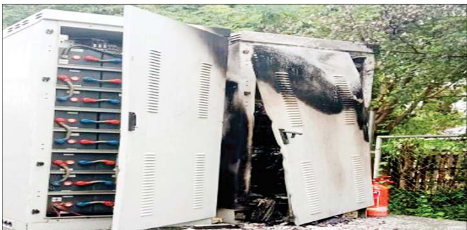
စဉ့်ကူးမြို့နယ် ကျည်တောက်ပေါက်ကျေးရွာ၌ စိုက်ထူထားသည့် Ooredoo ဆက်သွယ်ရေးတာဝါတိုင်၏ အထိုင်စက်ပုံးအား မီးရှို့ခံရသဖြင့် ပျက်စီးခဲ့မှုကို တွေ့ရစဉ်။

နေပြည်တော် စက်တင်ဘာ ၆ နိုင်ငံတော်အတွင်း နေထိုင်ကြသော ပြည်သူလူထုများ၏ လူမှုဘဝဖွံ့ဖြိုးတိုးတက်စေရေးအတွက် တစ်စိတ်တစ်ပိုင်းအဖြစ် အထောက်အကူပြုသည့် ဆက်သွယ်ရေးကွန်ရက်များအား နိုင်ငံတစ်ဝန်းလုံး ဖြန့်ကြက်နိုင်စေရန် နိုင်ငံတော်အစိုးရ၏ လမ်းညွှန်စီစဉ်ညွှန်ကြားမှုများဖြင့် ဆက်သွယ်ရေးတာဝါတိုင်များအား အမြို့မြို့ အနယ်နယ်တိုင်း၌ တွန်းအားပေးစိုက်ထူဆောင်ရွက်ပေးထားရှိခဲ့သည်ကို အေးချမ်းစွာ နေထိုင်လိုခြင်းမရှိဘဲ နိုင်ငံရေးအစွန်းရောက်အကြမ်းဖက်သူများက အဆိုပါဆက်သွယ်ရေးတာဝါတိုင်များအနက် အချို့အား မီးရှို့ဖျက်ဆီးခြင်း၊ မိုင်းထောင်ဖောက်ခွဲဖျက်ဆီးခြင်းများဖြင့် အကြမ်းဖက်မှုလုပ်ရပ်များ လုပ်ဆောင်လာကြသည်ကို တွေ့ရသည်။