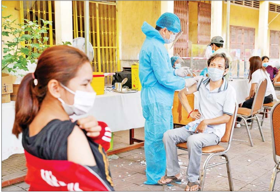
အတွက် နှာခေါင်းစည်းများကို ဆက်လက်ဝတ်ဆင် ကြရန်၊ လက်များကို မကြာခဏဆေးကြောကြရန်၊ တစ်ဦးနှင့် တစ်ဦးအကြား ခပ်ကွာကွာနေကြရန်၊ လူစည်းကားသည့်နေရာများကို ရှောင်ကြဉ်ရန်နှင့်

တစ်ချိန်တည်းမှာပင် ကမ္ဘောဒီးယားကျန်းမာရေး ဝန်ကြီး မမ်ဘွန်ဟင်က ဒယ်လ်တာဗီဇပြောင်း ကိုရိုနာဗိုင်းရပ်စ်သည် ယခင်မျိုးကွဲ ကိုရိုနာဗိုင်းရပ်စ် ထက် ကူးစက်မှုနှုန်း ပို၍လျင်မြန်သည့်အတွက် သတိရှိကြရန်ပြည်သူများအား တိုက်တွန်းထားသည်။ ကိုဗစ်-၁၉ ရောဂါ ကာကွယ်ထိန်းချုပ်ရန်