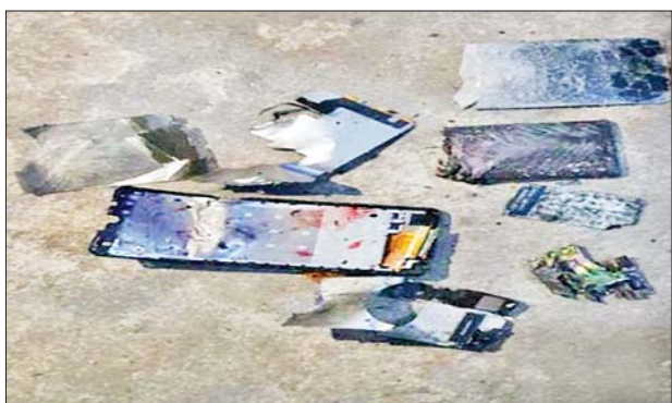
မရမ်းကုန်းမြို့နယ် ဘောဂသိဒ္ဓိအိမ်ရာဝင်းရှိ ကားပါကင်၌ အကြမ်းဖက်သမားတစ်ဦးက လက်လုပ်မိုင်းထောင်စဉ် ပေါက်ကွဲမှုဖြစ်ပွားမှုကို တွေ့ရစဉ်။