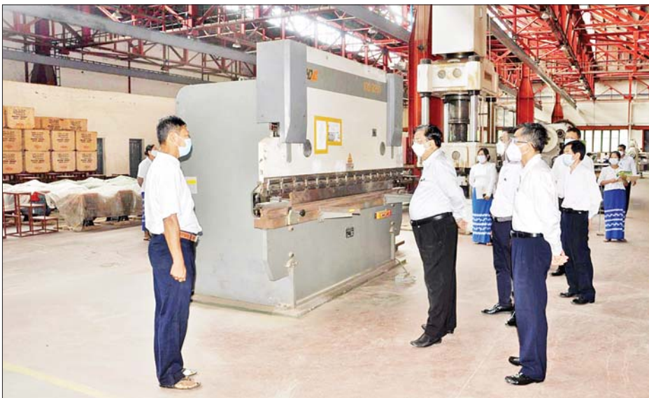
ရင်းရင်းနှီးနှီးတွေ့ဆုံခဲ့သည်။ အလားတူ ပြည်ထောင်စုဝန်ကြီးသည် စက်တင်ဘာ ၅ ရက်တွင် မကွေးတိုင်းဒေသကြီး မင်းလှ မြို့ရှိ အမှတ်(၁၇) အကြီးစားစက်ရုံ(မလွန်)သို့ ရောက်ရှိပြီး စက်ရုံရှိကုန်ကြမ်း၊ ကုန်ချောစက် ပစ္စည်း စသည့် ပုံသေပိုင်ပစ္စည်းများ ပျက်စီးဆုံးရှုံးမှု မရှိစေရေး ပြုပြင်ထိန်းသိမ်းထားရန်နှင့် စာရင်းဇယား များ စနစ်တကျ ပြုစုထားရှိမှုကို ကြည့်ရှုစစ်ဆေးပြီး စက်ရုံအတွင်း လှည့်လည်ကြည့်ရှုစစ်ဆေးသည်။ ထို့နောက် မွန်းလွဲပိုင်းတွင် ပြည်ထောင်စုဝန်ကြီး သည် မကွေးမြို့ရှိ ဆပ်ပြာစက်ရုံသို့ ရောက်ရှိရာ ရွှေဝါဆပ်ပြာများ ထုတ်လုပ်မှုအခြေအနေများကို

ပြန်လည်ဆန်းစစ်သည့် အစီရင်ခံစာ (Self Assessment Report) ပြုစုတင်ပြရန် တာဝန်ရှိသူများ အား မှာကြားခဲ့သည်။ မှာကြား ထို့နောက် ပြည်ထောင်စုဝန်ကြီးသည် အမှတ် (၁၆)အကြီးစားစက်ရုံ (ဆင်တံ)သို့ ရောက်ရှိပြီး စက်ရုံ အတွင်း လှည့်လည်ကြည့်ရှုစစ်ဆေး၍ တာဝန်ရှိသူ များအား နိုင်ငံပိုင်စက်ရုံ/ အလုပ်ရုံများကို အကျိုး ရှိအောင် ပြန်လည် လည်ပတ်နိုင်ရေးအတွက် ကြို စားဆောင်ရွက်ရမည်ဖြစ်ကြောင်း၊ အမှတ်(၁၆) အကြီးစား စက်ရုံ(ဆင်တံ)သည်အစဉ်အလာ ကြီးမား သည့် စက်ရုံဖြစ်သည့်အလျောက် ဝန်ထမ်းများ အနေဖြင့် နိုင်ငံတော်နှင့်ပြည်သူများအတွက် ပေးအပ် လာသည့် တာဝန်များကိုကျရာ အခန်းကဏ္ဍမှ ကျေပြန်အောင် ထမ်းဆောင်ရန် တာဝန်ရှိသူများအား မှာကြားခဲ့သည်။ ပြည်ထောင်စုဝန်ကြီးသည် စက်တင်ဘာ ၄ ရက် တွင် အမှတ်(၂၃)အကြီးစားစက်ရုံ (ညောင်ခြေ ထောက်)သို့ ရောက်ရှိ၍ နိုင်ငံပိုင်စက်ရုံ၊ အလုပ်ရုံများ အား နိုင်ငံတော်အတွက် အကျိုးရှိအောင် လည်ပတ်ရ မည်ဖြစ်ကြောင်း တာဝန်ရှိသူများအား မှာကြားပြီး စက်ရုံများအား လှည့်လည်ကြည့်ရှု၍ ဝန်ထမ်းများနှင့်