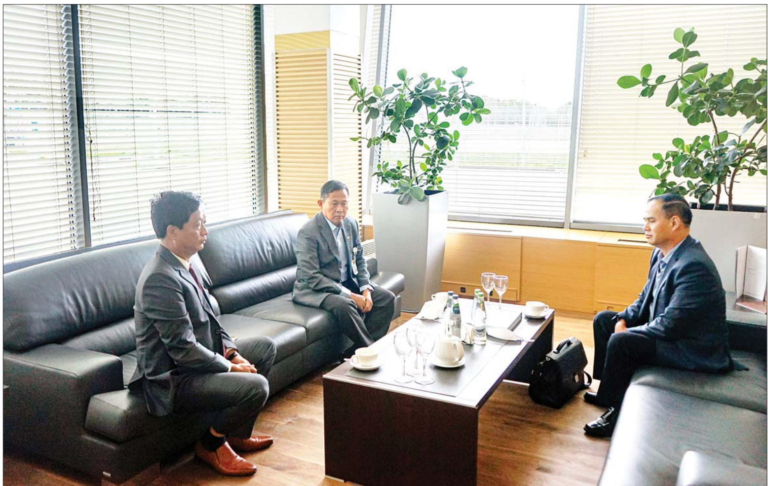
နိုင်ငံတော်စီမံအုပ်ချုပ်ရေးကောင်စီဒုတိယဥက္ကဋ္ဌ၊ ဒုတိယတပ်မတော်ကာကွယ်ရေးဦးစီးချုပ် ကာကွယ်ရေးဦးစီးချုပ်(ကြည်း) ဒုတိယဗိုလ်ချုပ်မှူးကြီး စိုးဝင်း မော်စကိုမြို့ Sheremetyevo အပြည်ပြည်ဆိုင်ရာလေဆိပ်မှ Novosibirsk မြို့သို့ ထွက်ခွာရာ ရုရှားနိုင်ငံဆိုင်ရာ မြန်မာသံအမတ်ကြီး ဦးလွင်ဦးနှင့် ရုရှားကာကွယ်ရေးဝန်ကြီးဌာနမှ တာဝန်ရှိသူများက လေဆိပ်တွင် ပို့ဆောင်နှုတ်ဆက်စဉ်။

ကြိုဆိုနှုတ်ဆက် ထို့နောက် နိုင်ငံတော်စီမံအုပ်ချုပ်ရေး ကောင်စီ ဒုတိယဥက္ကဋ္ဌ၊ ဒုတိယ တပ်မတော် ကာကွယ်ရေးဦးစီးချုပ် ကာကွယ်ရေးဦးစီးချုပ်(ကြည်း) နှင့် အဖွဲ့ဝင်များသည် Novosibirsk မြို့ Tolmachevo လေဆိပ်သို့ ရောက်ရှိကြရာ အမှတ်(၄၁)တပ်မ ထောက်လှမ်းရေးဌာန အကြီးအကဲ Colonel Dimity V. Men chov နှင့် တာဝန်ရှိသူများက ကြိုဆို နှုတ်ဆက်ခဲ့ကြကြောင်း သတင်းရရှိသည်။ သတင်းစဉ်