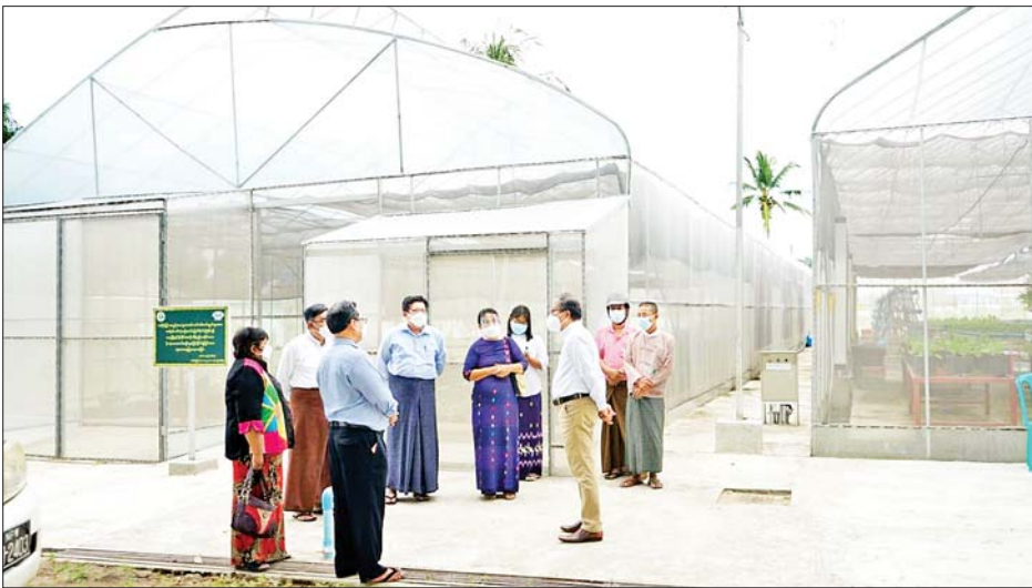
သူများသည် စက်မှုလယ်ယာသုတေသနအတွက်ဌာန မြေသီးခြားရွေးချယ်ရန် မြေနေရာကိုလည်းကောင်း၊ ဟင်းသီးဟင်းရွက်နှင့် ပန်းမန် သုတေသနဆောင်ရွက်

နေပြည်တော် စက်တင်ဘာ ၆ မြန်မာနိုင်ငံ၏ သစ်သီးဝလံသွင်းကုန်များအပေါ် စိစစ်ချက်အရ သုံးနှစ်အတွင်း သစ်သီးဝလံတင်သွင်းမှု အတွက် အမေရိကန်ဒေါ်လာသန်း ၅၀ ခန့် နှစ်စဉ် အသုံးပြုလျက်ရှိပြီး လိမ္မော်သီးတင်သွင်းမှုမှာ ၅၀ ရာခိုင်နှုန်းခန့်ဖြစ်ကြောင်း ရေမြေ ရာသီဥတု စုံလင် သည့် မိမိတို့နိုင်ငံတွင် သွင်းကုန်အစားထိုး အရည် အသွေးကောင်း သစ်သီးဝလံများ တိုးချဲ့စိုက်ပျိုး ထုတ်လုပ်နိုင်ရေးအတွက် လိုအပ်သော သုတေသန နှင့် ဖွံ့ဖြိုးရေးလုပ်ငန်းများ၊ ဆွေးနွေးပွဲများ၊ ပြပွဲ ပြိုင်ပွဲ များ ဆောင်ရွက်သွားမည်ဖြစ်ကြောင်း ယနေ့ နံနက်ပိုင်းတွင် နေပြည်တော် ရေဆင်းရှိ စိုက်ပျိုးရေး သုတေသန ဦးစီးဌာန၌ ကျင်းပသည့် ဥယျာဉ်ခြံ သုတေသနနှင့် ဖွံ့ဖြိုးရေးလုပ်ငန်းများကို အဆင့်မြှင့် တိုးချဲ့ဆောင်ရွက်ရေး ဆွေးနွေးပွဲတွင် ပြည်ထောင်စု ဝန်ကြီးဦးတင်ထွဋ်ဦးက ပြောကြားသည်။ ထို့နောက် ပြည်ထောင်စုဝန်ကြီးနှင့် တာဝန်ရှိ