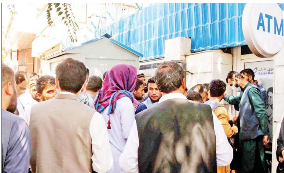
သည့်။ တာလီဘန်တို့ကမူ ဘဏ် များကို ပြန်လည်ဖွင့်လှစ်ရန် ညွှန်ကြားခြင်းအားဖြင့် အာဖဂန် နစ္စတန်နိုင်ငံ၏ စီးပွားရေးကို တည်ငြိမ်လာရန် ကြိုးစားနေ ကြောင်းလည်း သိရသည်။ ယခုအချိန်အထိ အာဖဂန် နစ္စတန်နိုင်ငံ၌ ဘဏ်အနည်းငယ် သာ ညွှန်ကြားချက်ကို လိုက်နာပြီး လူအများအပြားကလည်း ပြန်လည် ဖွင့်လှစ်ထားသည့် ဘဏ်များ၌ တန်းစီစောင့်ဆိုင်းခဲ့ကြကြောင်း သိရသည်။ ထို့ပြင် လူအများစု သည် ၎င်းတို့လိုအပ်နေသည့် ငွေများကို ထုတ်ယူနိုင်ခြင်းမရှိ သေးကြောင်း သိရသည်။ ကုန်ဈေးနှုန်းများ မြင့်တက်လျက် ရှိခြင်းကြောင့် မြို့တော်ကဘူးလ်

ကဘူးလ် စက်တင်ဘာ ၆ အာဖဂန်နစ္စတန်နိုင်ငံ၌ စီးပွားရေး လုပ်ငန်းများ ပြန်လည်စတင်ရန် နိုင်ငံ၏ ဘဏ္ဍာရေးအဖွဲ့အစည်း များကို တာလီဘန်တို့က တိုက်ရိုက် ညွှန်ကြားခဲ့သော်လည်း အာဖဂန် နစ္စတန်နိုင်ငံတွင် စီးပွားရေး ရှုပ်ထွေးမှုများ ဆက်လက်ဖြစ်ပေါ် လျက်ရှိကြောင်း ယနေ့သတင်း များအရ သိရသည်။