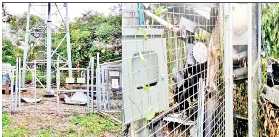
ပြင်ဦးလွင်မြို့နယ် အနီးစခန်းနှင့် ဆင်လမ်းဆည်သို့ ဆက်သွယ်ထားသည့် လမ်းဘေးတွင် စိုက်ထူထားသည့် ဆက်သွယ်ရေးတာဝါတိုင်အား မိုင်းထောင်ဖောက်ခွဲခဲ့၍ ပျက်စီးခဲ့မှုကို တွေ့ရစဉ်။