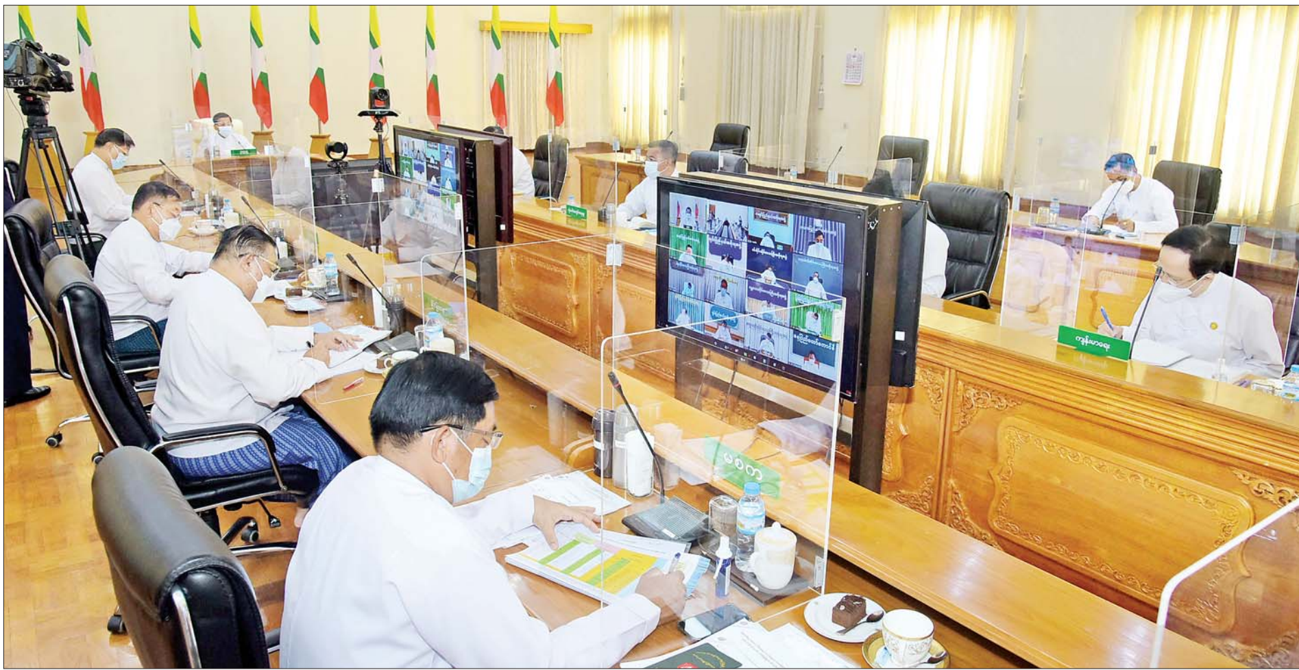
နိုင်ငံတော်စီမံအုပ်ချုပ်ရေးကောင်စီဥက္ကဋ္ဌ၊ နိုင်ငံတော်ဝန်ကြီးချုပ် ဗိုလ်ချုပ်မှူးကြီးမင်းအောင်လှိုင် ကိုဗစ်-၁၉ ရောဂါ ကာကွယ်၊ ထိန်းချုပ်၊ ကုသရေးဆိုင်ရာ (၁၁)ကြိမ်မြောက် ညှိနှိုင်းအစည်းအဝေးတွင် အမှာစကားပြောကြားစဉ်။