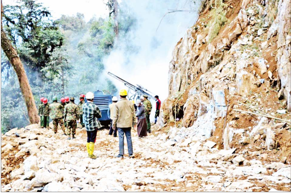
ကချင်ပြည်နယ် ပူတာအိုခရိုင် မဂ္ဂေ-ခေါင်လန်ဖူးလမ်း ၆၅ မိုင် ၄ ဖာလုံမှ အပိုင်း(၂) တွင် ဆန်းလွတ်ချက်ကျောက်တောင်အား မိုင်းခွဲရန် ဆောင်ရွက်နေစဉ်။

မဂ္ဂေမှ ငါးလုံးဒမ်းအထိ ၂၅ မိုင် ၄ ဖာလုံကို အပိုင်း(၁)အဖြစ် အကောင်အထည်ဖော် ဆောင်ရွက်ခဲ့ရာ ကျောက်လမ်း ၂၅ မိုင် ၄ ဖာလုံ၊ တံတားကြီး/ငယ် အစင်း ၂၀၊ Box Culvert ၇၅ စင်း၊ ကျောက်စီရေမြောင်း ပေ ၅၅၀၀ နှင့် အခြားလိုအပ်သည့် မြေထိန်းနံရံများ၊ ရေကျော်များကို ရာနှုန်းပြည့် အကောင်အထည်ဖော် ဆောင်ရွက်ခဲ့ပြီး