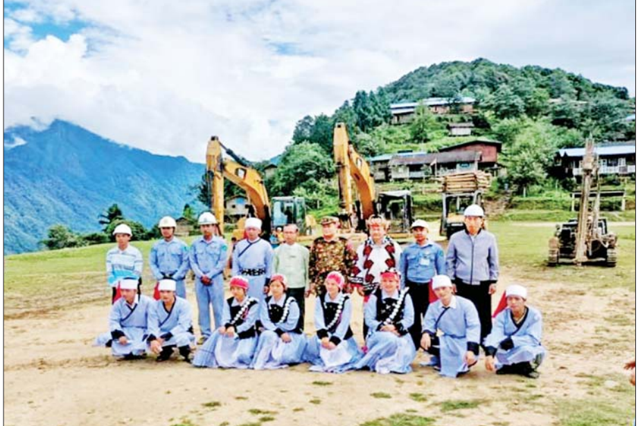
ခေါင်လန်ဖူးမြို့သို့ တစ်ကြောင်းထိုးလမ်း ပေါက်ရောက်ချိန် လမ်းဖောက်လုပ်ရေးအဖွဲ့၊ ဒေသခံပြည်သူများနှင့် ယန္တရားများအား တွေ့မြင်ရစဉ်။

လုံးတိုလိတ်မှ ဆီဆုံအထိ ၁၀ မိုင် ၄ ဖာလုံကို အပိုင်း(၃)အဖြစ် အကောင်အထည်ဖော် ဆောင်ရွက်ခဲ့ရာတွင် သဘာဝအတားအဆီးဖြစ်သည့် ရေစီးကြမ်းတမ်းသော မေခမြစ်ကို လမ်းဖောက်လုပ်ရေးစီမံကိန်းတွင် အသုံးပြုသည့် ယာဉ်/ယန္တရားများ၊ ကျောက်ဖောက်စက်များ၊ စက်ဆီ/ချောဆီများ၊ ယမ်းနှင့် ဆက်စပ်ပစ္စည်းများ ဖြတ်ကျော်နိုင်ရန် ကူးတိုဖောင်များ၊ သီးသန့်ပြုလုပ်ဆောင်ရွက်ပြီး ခက်ခက်ခဲခဲ ဖြတ်သန်းပို့ဆောင်ပေးခဲ့ကြရကြောင်း သိရသည်။ အဆိုပါ လမ်းပိုင်းတွင် မြေလမ်း ၁၀ မိုင် ၄ ဖာလုံအနက် ကျောက်လမ်း ၈ မိုင် ၄ ဖာလုံခင်းပြီးဖြစ်၍ တံတားကြီး/ငယ် စုစုပေါင်း ခုနစ်စင်း၊ စာမျက်နှာ ၁၀ သို့