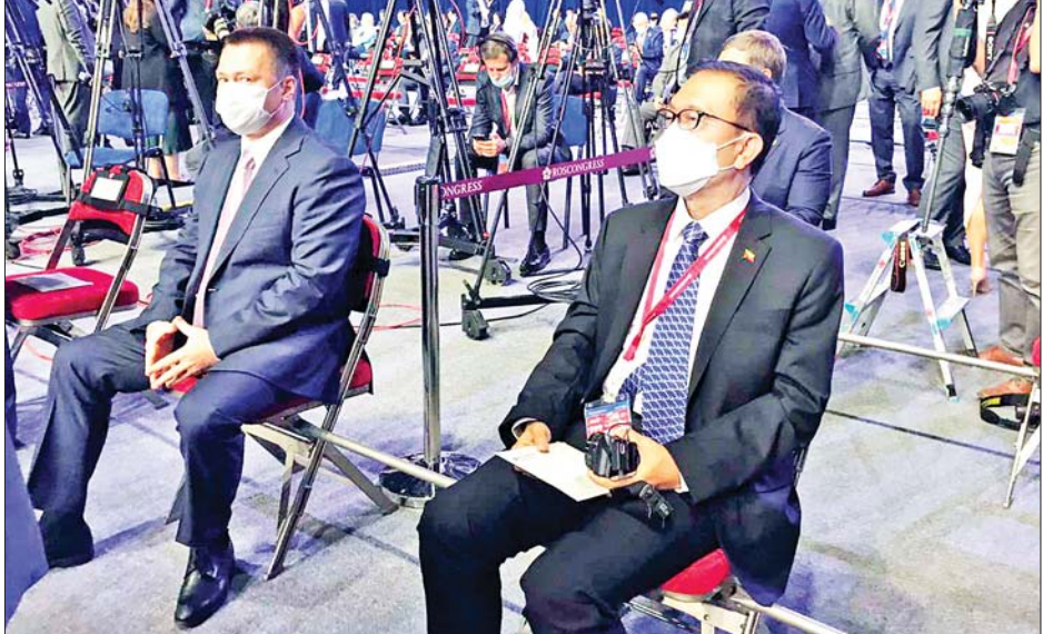
ပြည်ထောင်စုဝန်ကြီး ဦးဝင်းရှိန် (၆) ကြိမ်မြောက် အရှေ့ပူရားစီးပွားရေးဖိုရမ် မျက်နှာစုံညီ အစည်းအဝေးသို့ တက်ရောက်စဉ်။