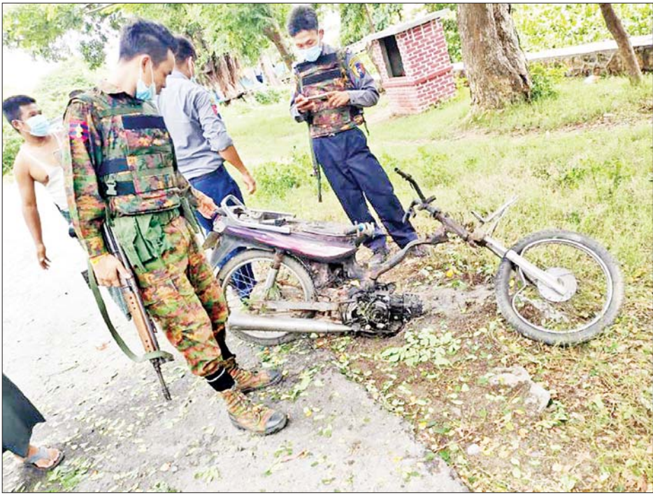
ပေါက်ကွဲမှုဖြစ်ပွားခဲ့သည့် Dream 110 အမျိုးအစား အနက်ရောင်ဆိုင်ကယ်ကို တွေ့ရစဉ်။