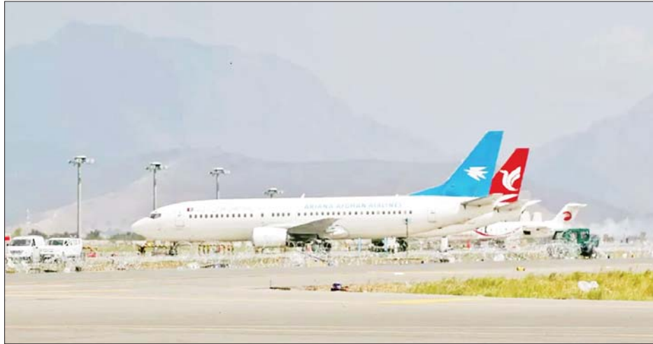
အာဖဂန်နစ္စတန်နိုင်ငံ Ariana အမျိုးသားလေကြောင်းလိုင်း ပြည်တွင်းလေကြောင်း ခရီးစဉ်များ ပြေးဆွဲမှုကို တွေ့ရစဉ်။

ကဘူးလ် စက်တင်ဘာ ၅ အာဖဂန်နစ္စတန်နိုင်ငံ၏ Ariana အမျိုးသားလေကြောင်းလိုင်းသည် ပြည်တွင်းလေကြောင်းခရီးစဉ်များ ပြေးဆွဲမှုကို ယနေ့ ပြန်လည်စတင်ခဲ့ကြောင်း ဒေသတွင်းရုပ်သံချန်နယ်တစ်ခုက ယနေ့တွင် သတင်းဖော်ပြခဲ့သည်။