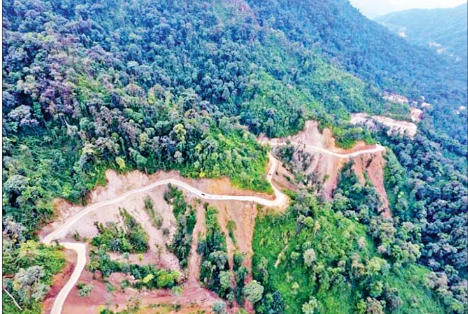
ကချင်ပြည်နယ် ပူတာအိုခရိုင် မဂ္ဂေ-ခေါင်လန်ဖူးလမ်း ၆၅ မိုင် ၄ ဖာလုံမှ အပိုင်း(၂) ဖောက်လုပ်ပြီးစီးမှုအား ဝေဟင်မှ မြင်တွေ့ရစဉ်။