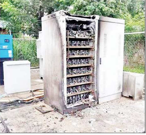
သပိတ်ကျင်းမြို့နယ်ရှိ Ooredoo ဆက်သွယ်ရေးတာဝါတိုင်အောက်ခြေရှိ စက်ပုံးအား အကြမ်းဖက်သူများက ဖျက်ဆီးထားမှုကို တွေ့ရစဉ်။