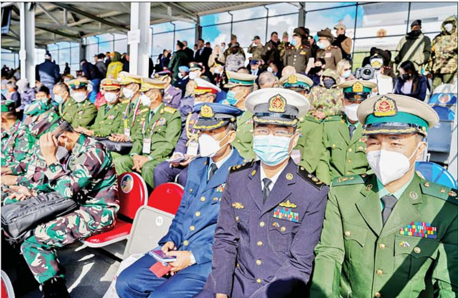
အခမ်းအနားတက်ရောက်လာကြသူများက တင့်ကားမောင်းနှင်ပစ်ခတ်ခြင်းပြိုင်ပွဲ Tank Biathlon (Division-1) နောက်ဆုံးဗိုလ်လုပွဲစဉ်ကို ကြည့်ရှုအားပေးစဉ်။