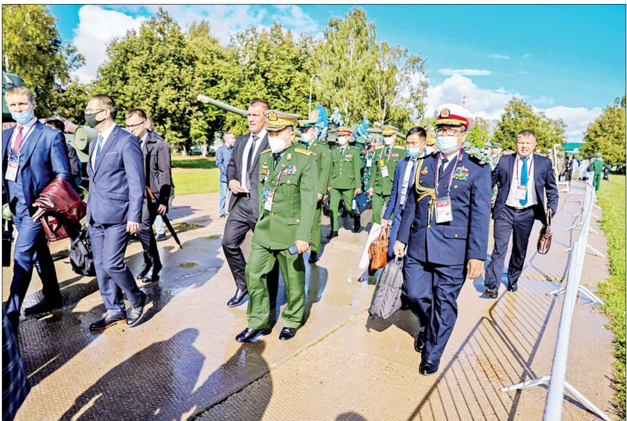
နိုင်ငံတော်စီမံအုပ်ချုပ်ရေးကောင်စီဒုတိယဥက္ကဋ္ဌ၊ ဒုတိယတပ်မတော်ကာကွယ်ရေးဦးစီးချုပ် ကာကွယ်ရေးဦးစီးချုပ် (ကြည်း) ဒုတိယဗိုလ်ချုပ်မှူးကြီး စိုးဝင်း တင့်ကားမောင်းနှင်ပစ်ခတ်ခြင်းပြိုင်ပွဲ Tank Biathlon (Division-1) နောက်ဆုံးဗိုလ်လုပွဲစဉ်ကို သွားရောက် ကြည့်ရှုစဉ်။

အဆိုပါ International Army Games-2021 ကို နိုင်ငံပေါင်း ၄၃ နိုင်ငံမှ ပါဝင်ယှဉ်ပြိုင်ခဲ့ကြပြီး စစ်မြေပြင်စွမ်းရည်ပြိုင်ပွဲ ၃၄ မျိုး ပါဝင်ကာ ရုရှားနိုင်ငံအပါအဝင် ၁၂ နိုင်ငံ၌ ပြိုင်ပွဲများ ပြုလုပ်ခဲ့ခြင်း