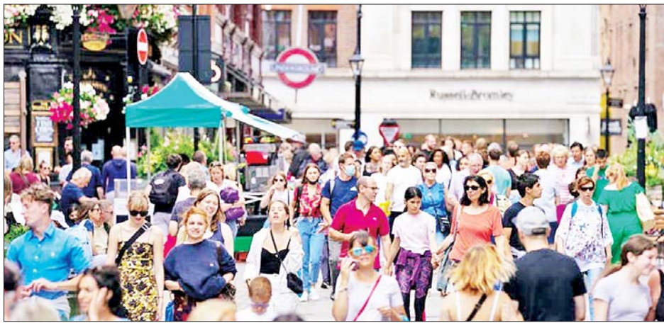
အတွင်း ပြည်သူများအား ကာကွယ်ဆေးထိုးနှံပေးရန် ထောက်ခံခြင်းမပြုကြောင်း ကြေညာချက် ထွက်ပေါ်လာပြီးနောက် အဆိုပါဗိုင်းရပ်စ်ကူးစက်မှုနှင့် သေဆုံးမှုအရေအတွက်များ မြင့်တက်လာခြင်းဖြစ်သည်။

လန်ဒန် စက်တင်ဘာ ၅ ဗြိတိန်နိုင်ငံ၌ လွန်ခဲ့သော ၂၄ နာရီအတွင်း ကိုဗစ်-၁၉ ရောဂါကူးစက်ခံရသူ ၃၇၅၇၈ ဦးစံချိန်တင်တွေ့ရှိခဲ့ရာ နိုင်ငံအတွင်း၌ ဗိုင်းရပ်စ်ကူးစက်ခံရသူပေါင်း ၆၉၄၁၆၁ ဦးရှိလာကြောင်း ကျန်းမာရေးဝန်ကြီးဌာန၏ တရားဝင်ကိန်းဂဏန်းများအရ သိရသည်။ အလားတူ လွန်ခဲ့သော ၂၄ နာရီအတွင်း ၁၂၀ သေဆုံးခဲ့ရာ အဆိုပါရောဂါကြောင့် သေဆုံးသူပေါင်း ၁၃၃၁၆၁ ဦးရှိလာသည်။