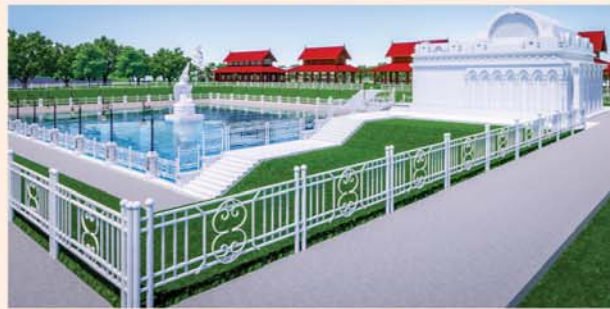
မုစလိန္နအိုင်

၁။ နိုင်ငံတော်စီမံအုပ်ချုပ်ရေးကောင်စီဥက္ကဋ္ဌ၊ တပ်မတော်ကာကွယ်ရေးဦးစီးချုပ် ဗိုလ်ချုပ်မှူးကြီးမင်းအောင်လှိုင် ဦးဆောင်သည့် (၇)ရက်သား၊ သမီး၊ ဘုရားဒါယကာ၊ ဒါယိကာမတို့က မာရဝိဇယပုဒ္ဒရုပ်ပွားတော်မြတ်ကြီးအား မြန်မာနိုင်ငံတွင် ထေရဝါဒပုဒ္ဒသာသနာတော်ထွန်းလင်းတောက်ပလျက်ရှိသည်ကို ကမ္ဘာကိုပြသရန်၊ တိုင်းပြည်အေးချမ်းသာယာမှုရှိစေရန်၊ ရုပ်ပွားတော်မြတ်ကြီးအား ပြည်တွင်း၊ ပြည်ပဘုရားဖူးများလာရောက်ခြင်းဖြင့် ဒေသတိုးတက်စည်ကားမှုကို အထောက်အကူဖြစ်စေရန်၊ နိုင်ငံတော်ဖွံ့ဖြိုးတိုးတက်မှုအား အထောက်အကူ ဖြစ်စေရန်ရည်သန်လျက် ပြည်ထောင်စုနယ်မြေ နေပြည်တော်၊ ဒက္ခိဏသီရိမြို့နယ်အတွင်း၌ သာသနာတော်ထုံး၊ ရုပ်ပွားဆင်းတုတော်ထုံး၊ မြန်မာ့ရိုးရာတည်ထုံးများနှင့်အညီ တည်ဆောက် ပူဇော်လျက်ရှိပါသည်။