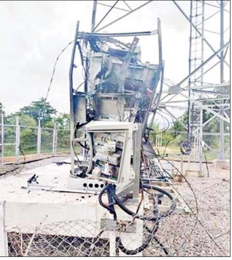
မတ္တရာမြို့နယ်ရှိ Ooredoo ဆက်သွယ်ရေးတာဝါတိုင်အောက်ခြေရှိ စက်ပုံးအား အကြမ်းဖက်သူများက ဖျက်ဆီးထားမှုကို တွေ့ရစဉ်။