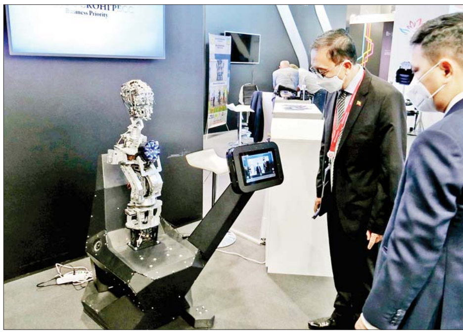
ပြည်ထောင်စုဝန်ကြီး ဦးဝင်းရှိန် (၆) ကြိမ်မြောက် အရှေ့ပူရားစီးပွားရေးဖိုရမ်တွင် ခင်းကျင်းပြသထားသည့် ပြခန်းများအား လေ့လာကြည့်ရှုစဉ်။

ထို့နောက် မွန်ဂိုလီးယားသမ္မတမစ္စတာ ဥခိုင်ဂင်ခရာဆွတ်နှင့် ကာဇက်စတန် သမ္မတ မစ္စတာ ဂျီမတ်တော့ ခရစ်တို့က online ဖြင့်လည်းကောင်း၊ တရုတ်ပြည်သူ့သမ္မတနိုင်ငံ သမ္မတ မစ္စတာ ရှီကျင့်ဖျင်၊ အိန္ဒိယနိုင်ငံဝန်ကြီးချုပ် မစ္စတာ နာရန်ဒရာမိုဒီနှင့် ထိုင်းနိုင်ငံဝန်ကြီးချုပ် မစ္စတာ ပရာယုချန်အိုချာတို့က ဗီဒီယိုမက်ဆေ့ဖြင့်လည်းကောင်း နှုတ်ခွန်းဆက်စကားများ ပြောကြားခဲ့ကြပြီး အရှေ့ပူရားဒေသ၏ ဖွံ့ဖြိုးတိုးတက်မှုနှင့် အာရှ-ပစိဖိတ်ဒေသနိုင်ငံများ၏