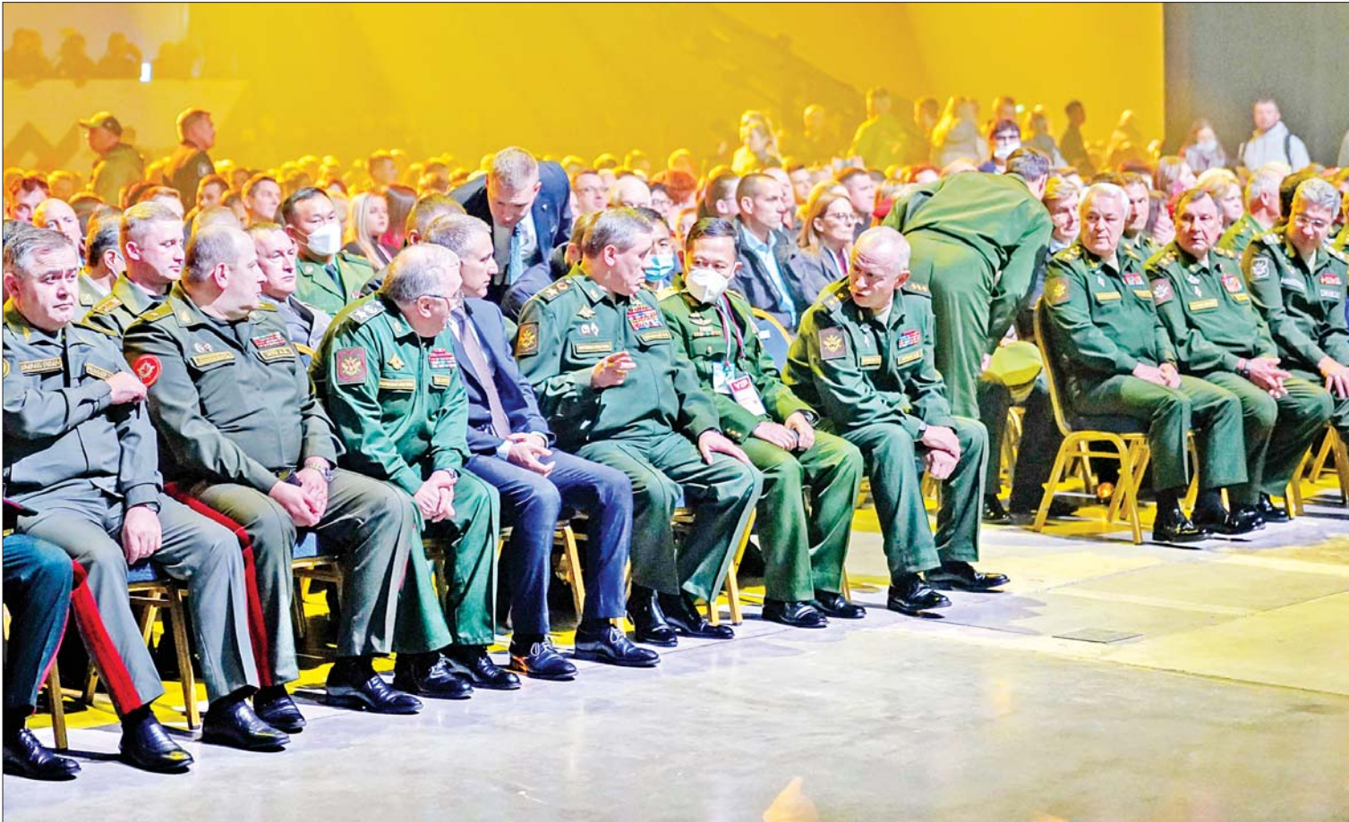
နိုင်ငံတော်စီမံအုပ်ချုပ်ရေးကောင်စီဒုတိယဥက္ကဋ္ဌ၊ ဒုတိယတပ်မတော်ကာကွယ်ရေးဦးစီးချုပ် ကာကွယ်ရေးဦးစီးချုပ်(ကြည်း) ဒုတိယဗိုလ်ချုပ်မှူးကြီး စိုးဝင်း ရုရှားဖက်ဒရေးရှင်းနိုင်ငံတွင် ကျင်းပပြုလုပ်သည့် International Army Games -2021 ပိတ်ပွဲအခမ်းအနားသို့ တက်ရောက်စဉ်။

နေပြည်တော် စက်တင်ဘာ ၅ နိုင်ငံတော်စီမံအုပ်ချုပ်ရေးကောင်စီ ဒုတိယ ဥက္ကဋ္ဌ၊ ဒုတိယတပ်မတော်ကာကွယ်ရေး ဦးစီးချုပ် ကာကွယ်ရေးဦးစီးချုပ်(ကြည်း) ဒုတိယဗိုလ်ချုပ်မှူးကြီး စိုးဝင်း ဦးဆောင် သည့် ကိုယ်စားလှယ်အဖွဲ့သည် စက်တင်ဘာ ၄ ရက် ဒေသစံတော်ချိန် မွန်းလွဲပိုင်းတွင် ရုရှားဖက်ဒရေးရှင်းနိုင်ငံ မော်စကိုမြို့ မျိုးချစ်ပန်းခြံရှိ Congress စင်တာ၌ ကျင်းပပြုလုပ်သည့် International Army Games-2021 ပိတ်ပွဲ အခမ်းအနားသို့ တက်ရောက်ကြသည်။ ကြည့်ရှုအားပေး ဦးစွာ နိုင်ငံတော်စီမံအုပ်ချုပ်ရေး ကောင်စီ ဒုတိယဥက္ကဋ္ဌ၊ ဒုတိယတပ်မတော် ကာကွယ်ရေးဦးစီးချုပ် ကာကွယ်ရေး ဦးစီးချုပ်(ကြည်း)နှင့် အဖွဲ့ဝင်များသည် တက်ရောက်လာကြသူများနှင့် အတူ တင့်ကားမောင်းနှင်ပစ်ခတ်ခြင်း ပြိုင်ပွဲ Tank Biathlon (Division-1) နောက်ဆုံး ဗိုလ်လုပွဲစဉ်အဖြစ် ရုရှားဖက်ဒရေးရှင်း နိုင်ငံ၊ တရုတ်နိုင်ငံ၊ ကာဇက်စတန်နိုင်ငံ နှင့် အဇာဘိုင်ဂျန်နိုင်ငံတို့မှ တင့်တပ်ဖွဲ့ ဝင်များ၏ ယှဉ်ပြိုင်နေမှုများကို ကြည့်ရှု အားပေးခဲ့ကြသည်။ အဆိုပါပြိုင်ပွဲတွင် ရုရှားဖက်ဒရေးရှင်းနိုင်ငံ အသင်းက စာမျက်နှာ ၃ ကော်လံ ၁ သို့ ✨