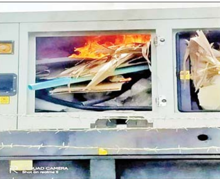
ယင်းမာပင်မြို့နယ်ရှိ MYTEL ဆက်သွယ်ရေးတာဝါတိုင်အောက်ခြေရှိ စက်ပုံးအား အကြမ်းဖက်သူများက မီးရှို့ဖျက်ဆီးထားမှုကို တွေ့ရစဉ်။

(၅၀)နှစ်၏ နေအိမ်ခြံဝင်းအတွင်း စိုက်ထူ၍ ထုတ်လွှင့်လျက်ရှိသော Ooredoo ဆက်သွယ်ရေးတာဝါတိုင် အနီးသို့ ကျေးရွာ၏အရှေ့ဘက်မှ မောင်းနှင်လာသည့် အကြမ်းဖက်သူ သုံးဦး(စိစစ်ဆဲ) စီးနင်းလာသည့် ဆိုင်ကယ်နှစ်စီးရောက်ရှိလာပြီး ၎င်းတို့ သုံးဦးအနက် အကြမ်းဖက်သူတစ်ဦးက တာဝါတိုင်ဝင်းအတွင်း ဝင်ရောက်ကာ တာဝါတိုင်အောက်ခြေရှိ တာဝါတိုင် ထိန်းချုပ် ထုတ်လွှင့်ရေးစက်များထည့်ထားသည့် စက်ပုံးအား အသင့်ယူဆောင်လာသော ဓာတ်ဆီပုံးဖြင့်လောင်းကာ မီးရှို့၍ ရွာလယ်လမ်းအတိုင်း စဉ်ကူးမြို့နယ်ဘက်သို့ မောင်းနှင်ထွက်ပြေးသွားခဲ့သဖြင့် အဆိုပါစက်ပုံးမီးလောင်မှုဖြစ်ပေါ်ခဲ့ပြီး အနီးအနားရှိ ကျေးရွာသားများက ဝိုင်းဝန်းငြိမ်းသတ်ခဲ့ရာ ၁၅ မိနစ်ခန့်အကြာတွင် မီးငြိမ်းသွားခဲ့သည်။ မီးလောင်မှုကြောင့် တာဝါတိုင်အောက်ခြေရှိစက်ပုံးအတွင်းရှိစက်များနှင့် ကေဘယ်လ်ကြိုးများ မီးလောင်ဆုံးရှုံးခဲ့သည်။