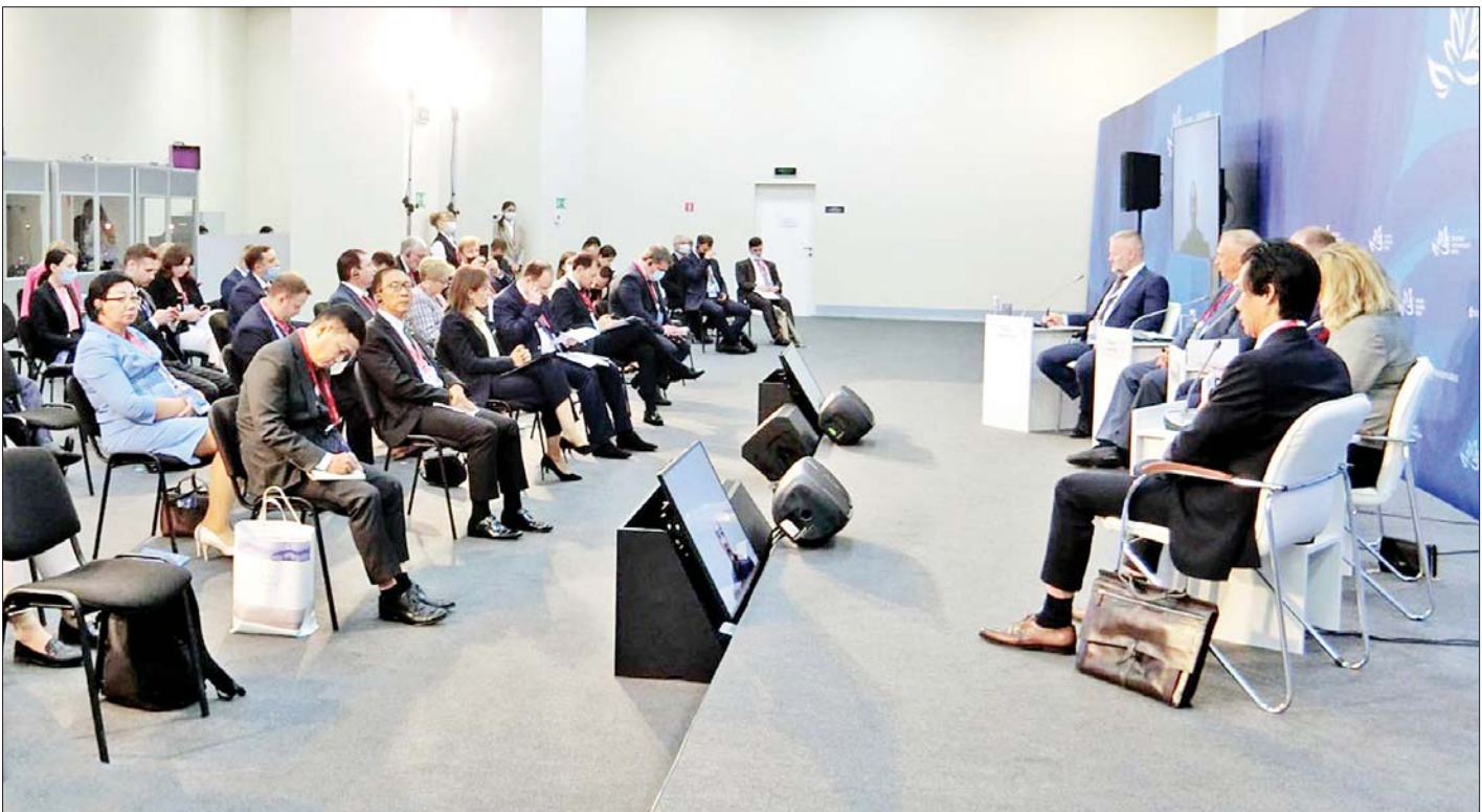
ပြည်ထောင်စုဝန်ကြီး ဦးဝင်းရှိန်နှင့်အဖွဲ့ (၆) ကြိမ်မြောက် အရှေ့ဖျားစီးပွားရေးဖိုရမ်၏ ပထမနေ့၊ Russia-ASEAN Business Dialogue သို့ တက်ရောက်စဉ်။

နေပြည်တော် စက်တင်ဘာ ၅ စီမံကိန်းနှင့် ဘဏ္ဍာရေးဝန်ကြီးဌာန ပြည်ထောင်စု ဝန်ကြီး ဦးဝင်းရှိန် ဦးဆောင်သော မြန်မာကိုယ်စား လှယ်အဖွဲ့သည် ရုရှားဖက်ဒရေးရှင်းနိုင်ငံ၏ ဒုတိယ ဝန်ကြီးချုပ်နှင့် သမ္မတ၏ အထူးအာဏာကုန် လွှဲအပ်ခြင်းခံရသော ရုရှားအရှေ့ဖျားဒေသဆိုင်ရာ ကိုယ်စားလှယ်ဖြစ်သူ မစ္စတာ ယူရီထရနစ်၏ ဖိတ်ကြား ချက်အရ ရုရှားဖက်ဒရေးရှင်းနိုင်ငံ ဗလာဒီဗော့ စတော့မြို့၌ စက်တင်ဘာ ၂ ရက်မှ ၄ ရက်အထိ ကျင်းပသည့် (၆) ကြိမ်မြောက် အရှေ့ဖျားစီးပွားရေး ဖိုရမ် (The 6 th Eastern Economic Forum) သို့ တက်ရောက်ခဲ့သည်။