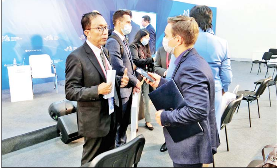
ပြည်ထောင်စုဝန်ကြီး ဦးဝင်းရှိန် (၆) ကြိမ်မြောက် အရှေ့ပူရားစီးပွားရေးဖိုရမ်၏ Russia-ASEAN Business Dialogue သို့ တက်ရောက်လာကြသည့် စီးပွားရေးလုပ်ငန်းရှင်များနှင့် တွေ့ဆုံဆွေးနွေးစဉ်။

ဖိုရမ်သို့ ဂျပန်၊ ပြင်သစ်၊ တရုတ်၊ တောင်ကိုရီးယား၊ အမေရိကန်၊ အိန္ဒိယ စသည့် နိုင်ငံများ အပါအဝင် နိုင်ငံပေါင်း (၆၁) နိုင်ငံမှ ကိုယ်စားလှယ်များ၊ သံအရာရှိများ၊ စီးပွားရေးလုပ်ငန်းရှင်ကြီးများနှင့် မီဒီယာများ စုစုပေါင်း ၃၅၀၀ ခန့် တက်ရောက်ခဲ့ကြကြောင်း သတင်းရရှိသည်။ သတင်းစဉ်