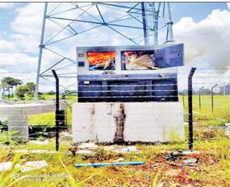
ယင်းမာပင်မြို့နယ်ရှိ MYTEL ဆက်သွယ်ရေးတာဝါတိုင်အောက်ခြေရှိ စက်ပုံးအား အကြမ်းဖက်သူများက မီးရှို့ဖျက်ဆီးထားမှုကို တွေ့ရစဉ်။

နေပြည်တော် စက်တင်ဘာ ၅ နိုင်ငံတော်အတွင်း နေထိုင်ကြသော ပြည်သူလူထုများ၏ လူမှုဘဝဖွံ့ဖြိုးတိုးတက်စေရေးအတွက် တစ်စိတ်တစ်ပိုင်းအဖြစ် အထောက်အကူပြုသည့် ဆက်သွယ်ရေးကွန်ရက်များအား နိုင်ငံတစ်ဝန်းလုံး ဖြန့်ကြက်နိုင်စေရန် နိုင်ငံတော်အစိုးရ၏ လမ်းညွှန်စီစဉ်ညွှန်ကြားမှုများဖြင့် ဆက်သွယ်ရေးတာဝါတိုင်များအား အမြို့မြို့၊ အနယ်နယ်တိုင်း၌ တွန်းအားပေးစိုက်ထူဆောင်ရွက်ပေးထားရှိခဲ့သည်ကို အေးချမ်းစွာ နေထိုင်လိုခြင်းမရှိဘဲ နိုင်ငံရေးအစွန်းရောက် အကြမ်းဖက်သူများက အဆိုပါဆက်သွယ်ရေး တာဝါတိုင်များအနက် အချို့အား မီးရှို့ဖျက်ဆီးခြင်း၊ မိုင်းထောင် ဖောက်ခွဲဖျက်ဆီးခြင်းများ ပြုလုပ်လာကြသည်ကို တွေ့ရှိရသည်။