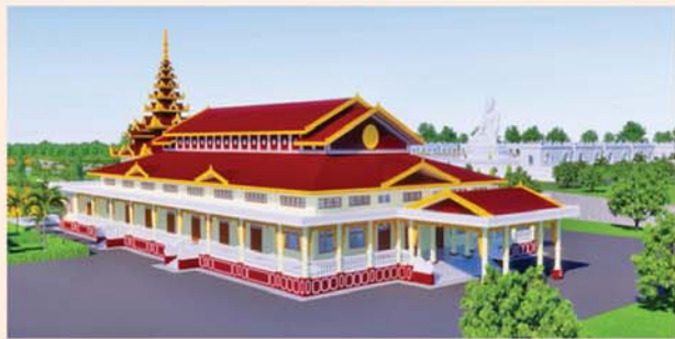
ဓမ္မာရုံ(၂၁၃x၉၀)ပေ ၁ လုံး-၈၇၃၀ သိန်း