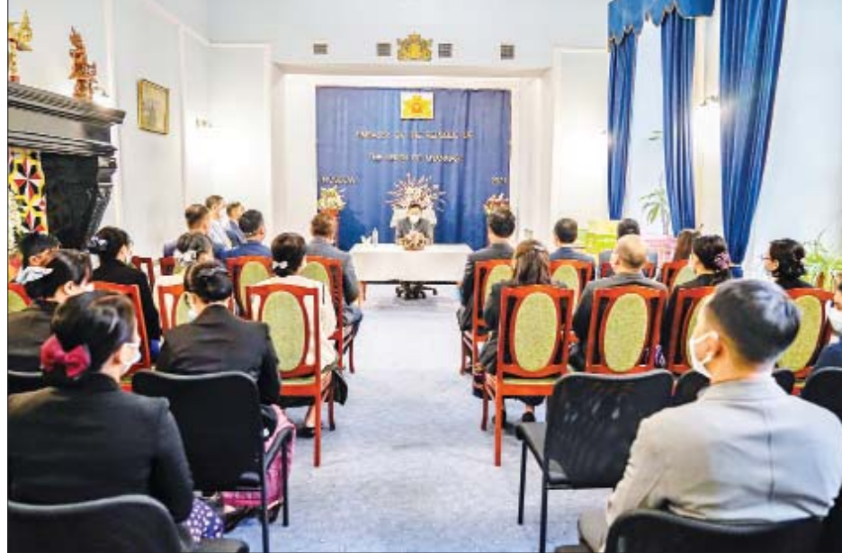
နိုင်ငံတော်စီမံအုပ်ချုပ်ရေးကောင်စီ ဒုတိယဥက္ကဋ္ဌ၊ ဒုတိယတပ်မတော်ကာကွယ်ရေးဦးစီးချုပ် ကာကွယ်ရေးဦးစီးချုပ် (ကြည်း) ဒုတိယဗိုလ်ချုပ်မှူးကြီး စိုးဝင်း မြန်မာသံရုံးနှင့် မြန်မာစစ်သံ (ကြည်း၊ ရေ၊ လေ)ရုံးတို့မှ မိသားစုများအား ရင်းရင်းနှီးနှီးတွေ့ဆုံစဉ်။