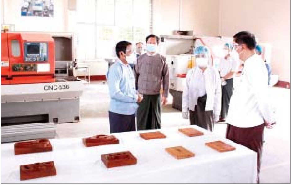
မှကြားသည်။ စက်တင်ဘာ ၃ ရက်တွင် ပြည်ထောင်စုဝန်ကြီး သည် သုတေသနဌာနများ၊ နည်းပညာတက္ကသိုလ် (ကျောက်ဆည်)၊ အစိုးရစက်မှုလက်မှုသိပ္ပံ (ကျောက်ဆည်)နှင့် အစိုးရနည်းပညာအထက်တန်း ကျောင်း (ကျောက်ဆည်)သို့ သွားရောက်ပြီး သုတေသနဆောင်ရွက်နေမှု အခြေအနေများ၊ သင်ကြားသင်ယူမှုနှင့် အုပ်ချုပ်မှုဆိုင်ရာကိစ္စရပ်များ ကို ပေါင်းစပ်ညှိနှိုင်းပေးခဲ့ကြောင်း သိရသည်။ သတင်းစဉ်

ဆက်လက်၍ သင်တန်းခန်းမ၌ ကျောင်းအုပ် ကြီးနှင့် ပါမောက္ခဆရာ ဆရာမများ၊ ဝန်ထမ်းများနှင့် တွေ့ဆုံရာ ပြည်ထောင်စုဝန်ကြီးက ကုန်ထုတ်လုပ်မှု လုပ်ငန်းများနှင့် ဝန်ဆောင်မှုလုပ်ငန်းများ ဖွံ့ဖြိုး တိုးတက်ရန် သက်ဆိုင်ရာ နယ်ပယ်အလိုက် အရည် အသွေးပြည့်ဝသည့် လုပ်သားများရှိရန် လိုကြောင်း၊ သင်တန်းသားများကို ပြုစုပျိုးထောင်ပေးမည့် ဆရာ ဆရာမများ၏ စွမ်းဆောင်ရည်မြှင့်တင်မှု သင်တန်း များ စဉ်ဆက်မပြတ် ဆောင်ရွက်သွားရမည် ဖြစ်ကြောင်း၊ သင်ကြားသင်ယူမှု ပတ်ဝန်းကျင်ကောင်း ဖြစ်အောင် ဝိုင်းဝန်းကြိုးပမ်း အကောင်အထည်ဖော် ဆောင်ရွက်ရမည်ဖြစ်ကြောင်း၊ e-Learning Online စနစ် သင်ကြားသင်ယူမှုများကို စဉ်ဆက်မပြတ် ဆက်လက်ဆောင်ရွက်နေရမည် ဖြစ်ကြောင်း ပြောကြားပြီး လိုအပ်သည်များကို