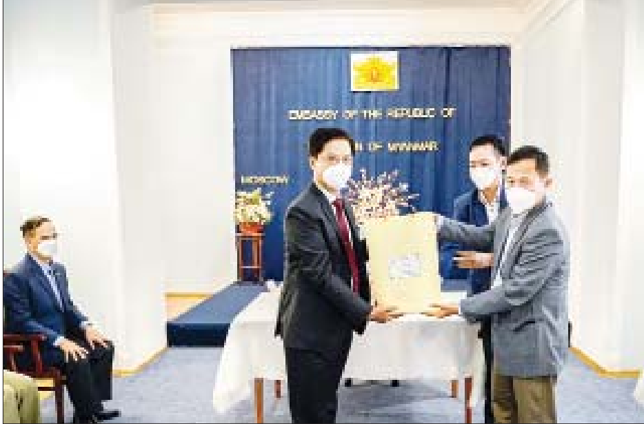
နိုင်ငံတော်စီမံအုပ်ချုပ်ရေးကောင်စီ ဒုတိယဥက္ကဋ္ဌ၊ ဒုတိယတပ်မတော်ကာကွယ်ရေးဦးစီးချုပ် ကာကွယ်ရေးဦးစီးချုပ် (ကြည်း) ဒုတိယဗိုလ်ချုပ်မှူးကြီး စိုးဝင်း သံအမတ်ကြီး ဦးလွင်ဦးအား သံရုံးမိသားစုများအတွက် လက်ဆောင်ပစ္စည်းနှင့် ချီးမြှင့်ငွေများ ပေးအပ်စဉ်။