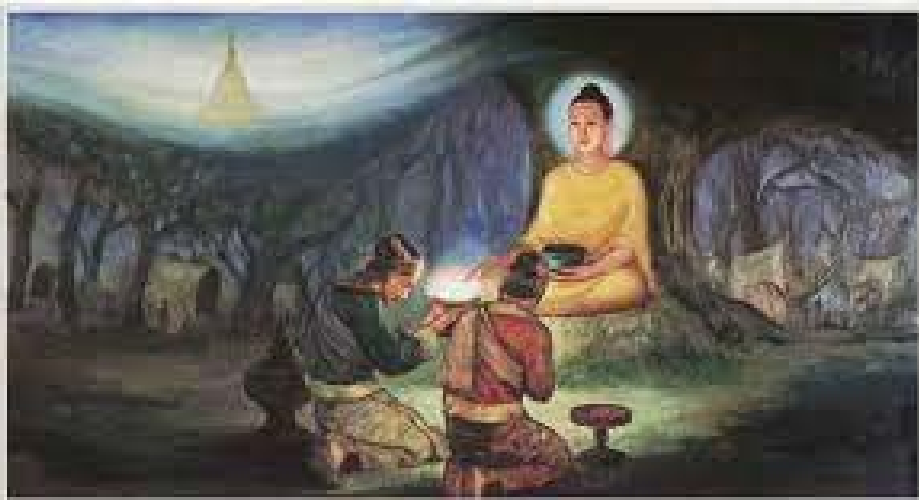
ကုန်သည်ညီနောင် တဖုဿနှင့်ဘလ္လိကတို့ မြတ်စွာဘုရားအား ဖူးမြော်ကြစဉ်။

မာရ်နတ်သမီးသုံးဦးတို့ ဖြားယောင်းလာခြင်း ဘုရားရှင်ကိုယ်တော်မြတ်သည် သတ္တသတ္တာဟ ဌာန ငါးခုမြောက် “အပေါလ သတ္တာဟ” အရောက် တွင် မာရ်နတ်သမီးသုံးဦး တဏှာ၊ ရတီ၊ ရာဂါ မည်သော အမျိုးသမီးတို့သည် သူတို့ဖခင်၏ဆန္ဒကို ဖြည့်ဆည်းရန်အတွက် ဘုရားထံသို့ လာကြပါ သည်။ ဖြားယောင်းသွေးဆောင်ရန် လာခြင်းဖြစ် သည်။ ၎င်းတို့သုံးဦးသည် ၎င်းတို့ဖခင် မာရ်နတ်မင်း နှလုံးမသာမယာ ဖြစ်နေသည်ကို မြင်၍ ဖခင်၏ ဆန္ဒကို ဆောင်ရွက်ခြင်း ဖြစ်ပါသည်။ မာရ်နတ်မင်း သည် တစ်ဆယ့်ခြောက်ပါးသော အရေးအကြောင်း တို့ ရေးခြစ်၍ကာ နေပါသည်။ ဘုရားရှင်သည် ဖြစ် လေရာဘဝတို့၌ ဒါနပါရမီကို ထူးခြားလွန်ကျူးစွာ ပြုလုပ်ခဲ့သောကြောင့် ဤရွှေပလ္လင်ကိုရခြင်းဖြစ် သည်။ သူကား ဤကဲ့သို့မလုပ်ဆောင်မိသော ကြောင့် ရွှေပလ္လင်ကိုမရခြင်းဟူ၍ သူ့ကိုယ်သူ ဝေဖန်သုံးသပ်မိသည်။