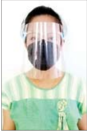
မမြသီတာကျော်