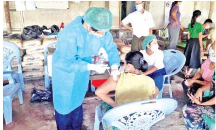
အသိပညာပေး ဟောပြောခြင်းများ ကာကွယ်ဆေးများ ပထမအကြိမ် ထိုးနှံ ဆောင်ရွက်လျက်ရှိကြောင်း သိရသည်။ ယနေ့တွင် နေပူခံတိုက်ပွဲရှောင်စခန်းရှိ ပြည်သူ ၆၇၈ ဦးအား တရုတ်နိုင်ငံထုတ် (Sinopharm) ကိုဗစ်-၁၉ ရောဂါ

၁၉ ရောဂါဆိုင်ရာလမ်းညွှန်ချက်များနှင့် အညီ အဆိုပါတိုက်ပွဲရှောင်စခန်းရှိ ကိုဗစ်-၁၉ ရောဂါ ကာကွယ်ဆေး လာရောက်ထိုးနှံသူများအား ကာကွယ် ဆေးထိုးနှံခြင်းမပြုမီ ကျန်းမာရေး ဝန်ထမ်းများက ကိုယ်အပူချိန်တိုင်းတာ ပေးခြင်း၊ သွေးတွင်းအောက်ဆီဂျင်ပါဝင်မှု ပမာဏများ တိုင်းတာပေးခြင်းတို့ကို ဆောင်ရွက်ပေးကာ ပုံမှန်အနေအထား ရောက်ရှိမှသာ ကာကွယ်ဆေးထိုးနှံပေး ခြင်းဖြစ်ပြီး ဆေးထိုးနှံပေးပြီးနောက် မိနစ် ၃၀ ခန့် စောင့်ကြည့်ပြီးမှ ဆေး လာရောက်ထိုးနှံသူများအား ကျန်းမာရေး