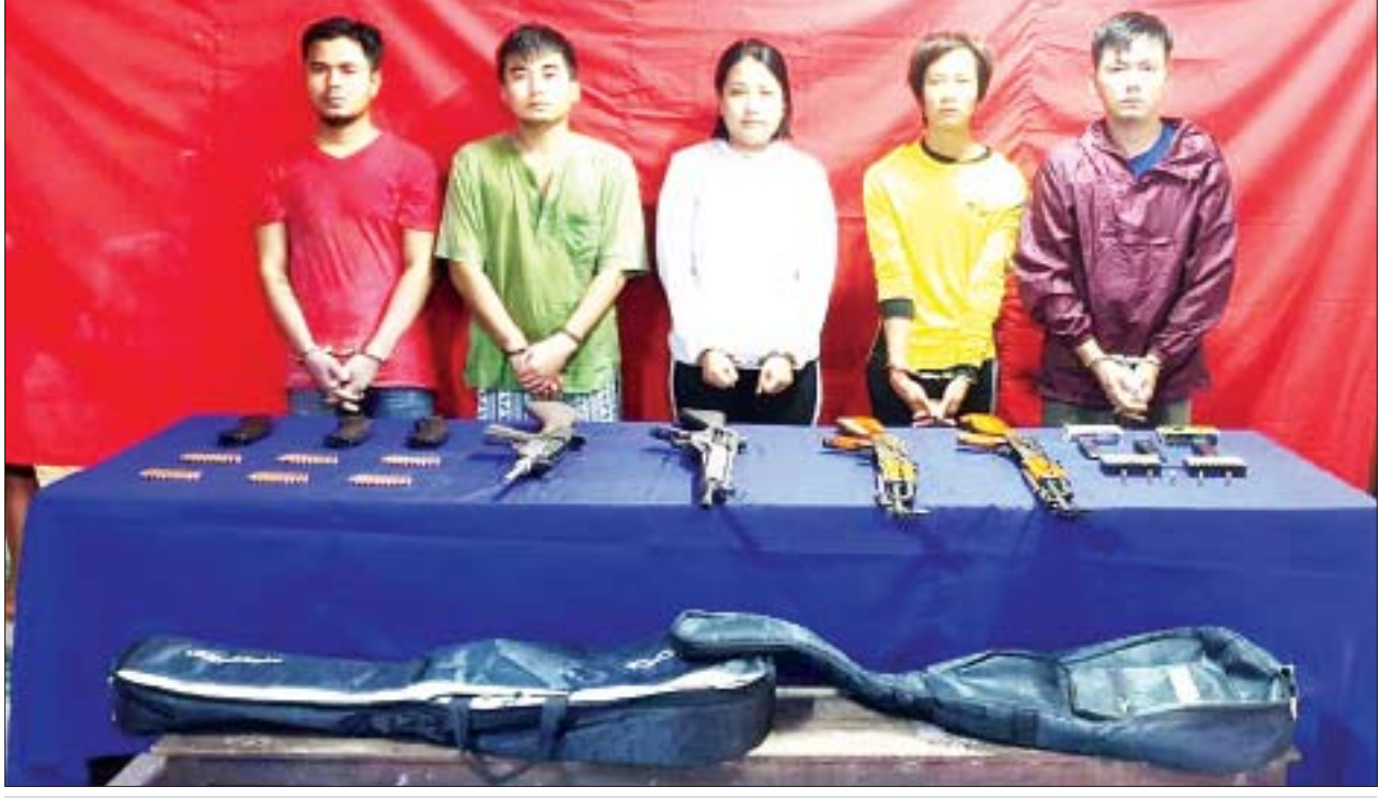
အလုံမြို့နယ် မြို့ပတ်ရထားပေါ်၌ ရထားရဲတပ်ဖွဲ့ဝင်များထံမှ ပါဆိုးသွားသည့် လက်နက်၊ ခဲယမ်းများ ပြန်လည်ရရှိမှုမှ တရားခံများ၏ မှတ်တမ်းဓာတ်ပုံကို တွေ့ရစဉ်။