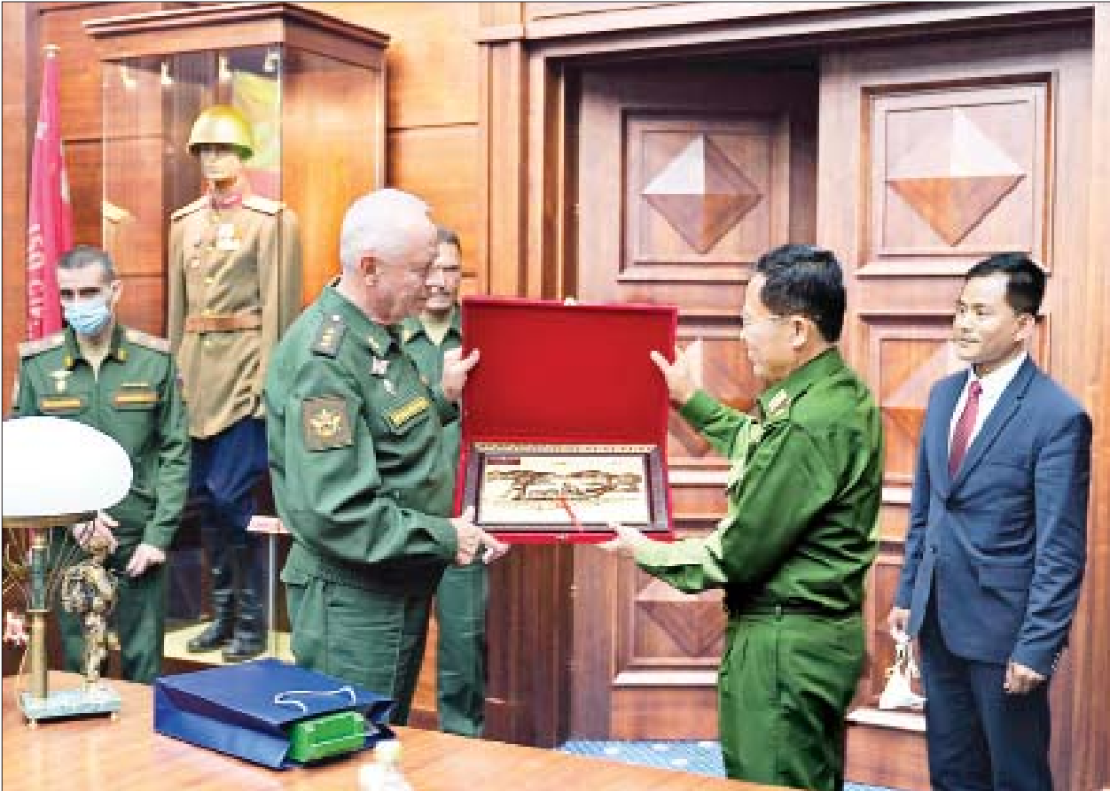
နိုင်ငံတော်စီမံအုပ်ချုပ်ရေးကောင်စီ ဒုတိယဥက္ကဋ္ဌ၊ ဒုတိယတပ်မတော်ကာကွယ်ရေးဦးစီးချုပ် ကာကွယ်ရေးဦးစီးချုပ် (ကြည်း) ဒုတိယဗိုလ်ချုပ်မှူးကြီး စိုးဝင်း ရုရှားဖက်ဒရေးရှင်းနိုင်ငံ ဒုတိယကာကွယ်ရေးဝန်ကြီး Colonel General Alexander Vasilyevich Fomin ထံ အမှတ်တရလက်ဆောင်ပစ္စည်း ပေးအပ်စဉ်။

ထို့နောက် သံရုံး၊ စစ်သံရုံး မိသားစုများအတွက် လက်ဆောင်ပစ္စည်းနှင့် ချီးမြှင့်ငွေများကိုပေးအပ်ရာ သံအမတ်ကြီး ဦးလွင်ဦးနှင့် စစ်သံမှူး ဗိုလ်မှူးချုပ် ကျော်စိုးမိုးတို့က လက်ခံရယူခဲ့ကြကြောင်း သတင်းရရှိသည်။ သတင်းစဉ်