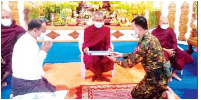
အပါး ၂၀ အတွက် လှူဒါန်းငွေကျပ် ၆၆၉၆၀၀၊ ဆန် ၁၅ အိတ်၊ ဆီ ၁၅ ပိဿာ၊ ဆား ၁၅ ပိဿာ၊ ကြက်သွန်နီ ၁၅ ပိဿာ နှာခေါင်းစည်း ၁၅ ဘူးနှင့် လက်သန့်ဆေးရည် ၁၅ ဘူးဖြစ်ကြောင်း သိရသည်။ ဇော်ဖြိုး (ဇေလပ်မြေ)

မြို့နယ် စီမံအုပ်ချုပ်ရေးအဖွဲ့တို့က ဆက်ကပ်လှူဒါန်းခဲ့ကြသည်။ ဆက်လက်၍ ခရစ်ယာန်ဘာသာရေးကျောင်းများရှိ သင်းအုပ်ဆရာတော် အပါး ၂၀ အတွက် တစ်ပါးလျှင် ငွေကျပ် ၁၈၀၀ နှုန်းဖြင့် ချင်းပြည်နယ် အစိုးရအဖွဲ့ ကိုယ်စား စစ်နယ်မြေမှူး ဗိုလ်မှူးကြီး အောင်မြတ်ထွန်းနှင့် ခရိုင်/မြို့နယ် စီမံအုပ်ချုပ်ရေးအဖွဲ့တို့က သွားရောက် ဆက်ကပ် လှူဒါန်းပေးခဲ့ကြသည်။ ချင်းပြည်နယ်အစိုးရအဖွဲ့မှ မင်းတပ်မြို့နယ်တွင် သံဃာတော် ၁၄၅ ပါးနှင့် သီလရှင် ခုနစ်ပါး၊ ဘာသာရေးသင်းအုပ် ဆရာ