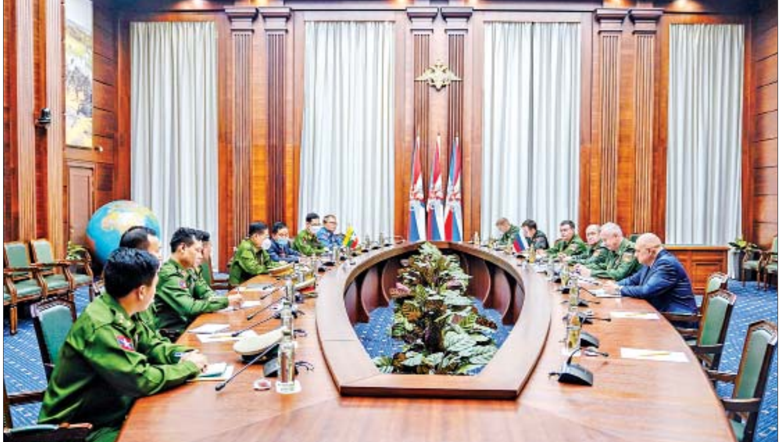
နိုင်ငံတော်စီမံအုပ်ချုပ်ရေးကောင်စီဒုတိယဥက္ကဋ္ဌ၊ ဒုတိယတပ်မတော်ကာကွယ်ရေးဦးစီးချုပ် ကာကွယ်ရေးဦးစီးချုပ် (ကြည်း) ဒုတိယဗိုလ်ချုပ်မှူးကြီး စိုးဝင်း ရုရှားဖက်ဒရေးရှင်းနိုင်ငံ ဒုတိယကာကွယ်ရေးဝန်ကြီး Colonel General Alexander Vasilyevich Fomin နှင့် တွေ့ဆုံဆွေးနွေးစဉ်။