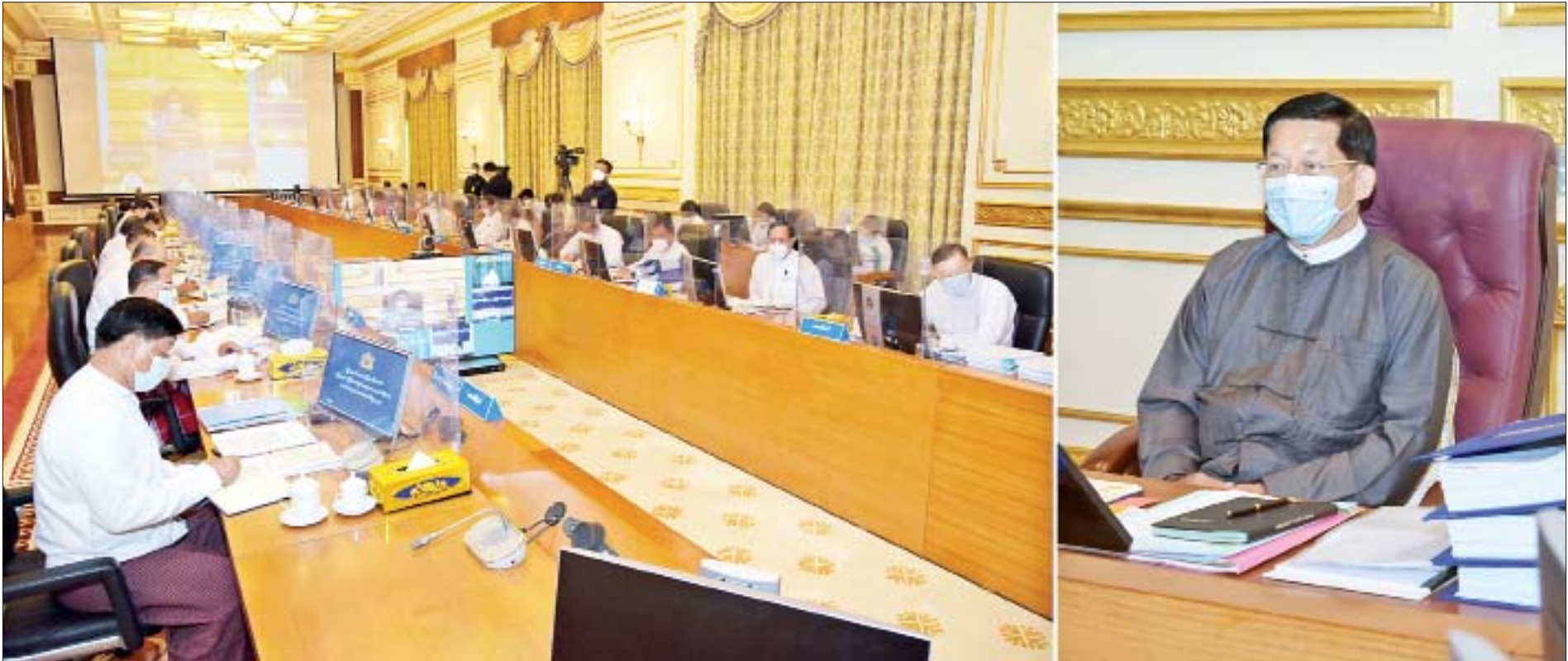
လုံခြုံရေး၊ တည်ငြိမ်အေးချမ်းရေးနှင့် တရားဥပဒေစိုးမိုးရေးကော်မတီဥက္ကဋ္ဌ၊ နိုင်ငံတော်စီမံအုပ်ချုပ်ရေးကောင်စီဥက္ကဋ္ဌ၊ နိုင်ငံတော်ဝန်ကြီးချုပ် ဗိုလ်ချုပ်မှူးကြီး မင်းအောင်လှိုင် ပြည်ထောင်စုသမ္မတ မြန်မာနိုင်ငံတော်လုံခြုံရေး၊ တည်ငြိမ်အေးချမ်းရေးနှင့် တရားဥပဒေစိုးမိုးရေးကော်မတီ အစည်းအဝေး အမှတ်စဉ်(၄/၂၀၂၁)တွင် အမှာစကားပြောကြားစဉ်။

နေပြည်တော် ဩဂုတ် ၃၁ ပြည်ထောင်စုသမ္မတမြန်မာနိုင်ငံတော် လုံခြုံရေး၊ တည်ငြိမ်အေးချမ်းရေးနှင့် တရားဥပဒေစိုးမိုးရေးကော်မတီ အစည်းအဝေးအမှတ်စဉ်(၄/၂၀၂၁)အား ယနေ့မွန်းလွဲပိုင်းတွင် နေပြည်တော်ရှိ နိုင်ငံတော်စီမံအုပ်ချုပ်ရေး ကောင်စီဥက္ကဋ္ဌရုံး အစည်းအဝေးခန်းမ၌ကျင်းပရာ လုံခြုံရေး၊ တည်ငြိမ်အေးချမ်းရေးနှင့် တရားဥပဒေစိုးမိုးရေးကော်မတီဥက္ကဋ္ဌ၊ နိုင်ငံတော်စီမံအုပ်ချုပ်ရေးကောင်စီဥက္ကဋ္ဌ၊ ပြည်ထောင်စုသမ္မတ မြန်မာနိုင်ငံတော် အိမ်စောင့်အစိုးရအဖွဲ့၊ နိုင်ငံတော်ဝန်ကြီးချုပ် ဗိုလ်ချုပ်မှူးကြီး မင်းအောင်လှိုင် တက်ရောက်အမှာစကား ပြောကြားသည်။ စာမျက်နှာ ၃ ကော်လံ ၁ သို့ ။