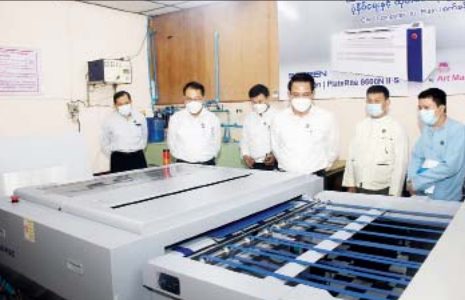
ပြည်ထောင်စုဝန်ကြီး ဦးမောင်မောင်အုန်း ဖိုတိုလစ်သိုပုံနှိပ်စက်ရုံရှိ CTP ခန်းတွင် ကြည့်ရှုစစ်ဆေးစဉ်။

ရန်ကုန် ဩဂုတ် ၃၁ ပြန်ကြားရေးဝန်ကြီးဌာန ပြည်ထောင်စုဝန်ကြီး ဦးမောင်မောင်အုန်းသည် ယနေ့ နံနက်ပိုင်းတွင် ရန်ကုန်မြို့ ဗဟန်းမြို့နယ် ငါးထပ်ကြီးဘုရားလမ်းရှိ ဖိုတိုလစ်သိုပုံနှိပ်စက်ရုံသို့ ရောက်ရှိပြီး လုပ်ငန်း ဆောင်ရွက်နေမှုအခြေအနေများကို လှည့်လည် ကြည့်ရှုစစ်ဆေးသည်။