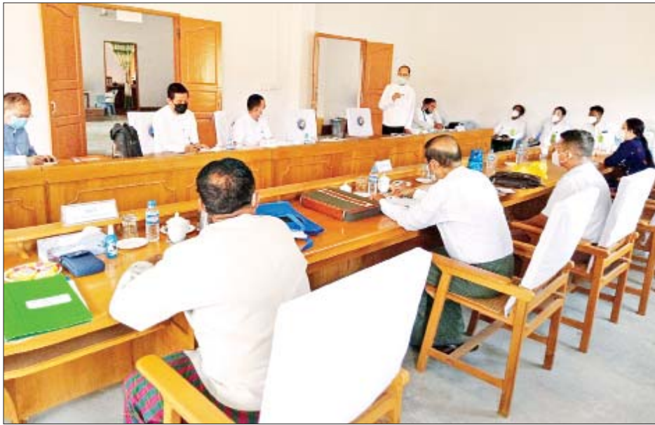
ပြည်ထောင်စုကြံ့ခိုင်ရေးနှင့် ဖွံ့ဖြိုးရေးပါတီကို စစ်ဆေးစဉ်။