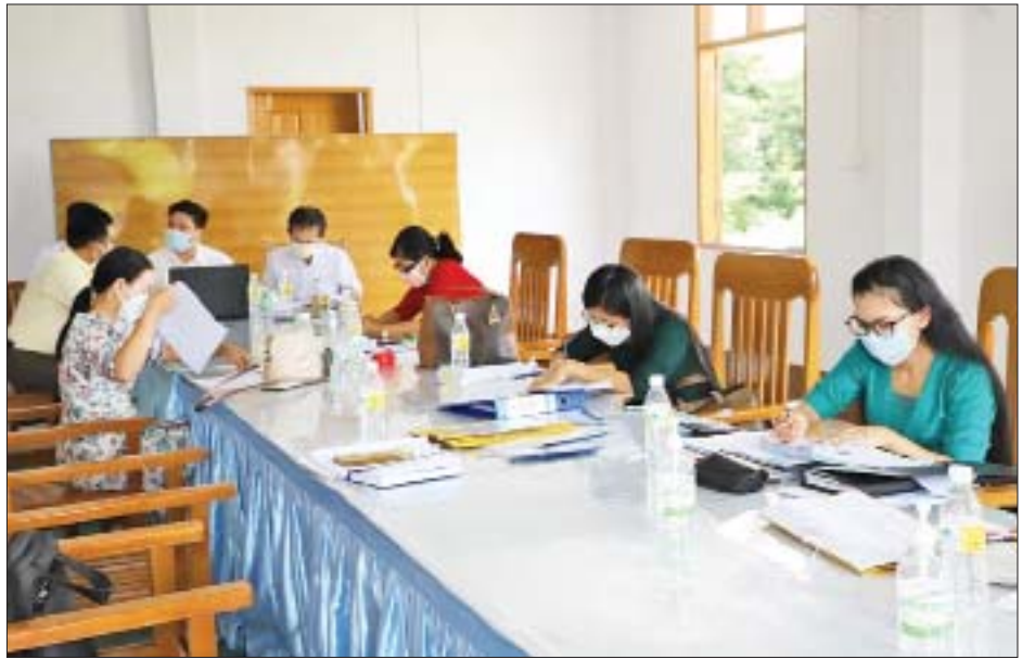
ပြည်ထောင်စုကောင်းကျိုးဆောင်ပါတီကို စစ်ဆေးစဉ်။