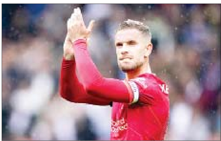
စာမျက်နှာ ၁၄ ကော်လံ ၁ သို့ *

လီဗာပူးအသင်းခေါင်းဆောင် ဂျော်ဒန် ဟန်ဒါဆန်ဟာ အန်ဖီးလ်မှာ ၂၀၂၅ ခုနှစ် အထိ ဆက်ရှိနေမယ့် စာချုပ်သစ်တစ်ရပ် ကို ထပ်တိုးချုပ်ဆိုလိုက်ပြီဖြစ်ပါတယ်။ အသက် ၃၁ နှစ်အရွယ်ရှိ အင်္ဂလန် ကွင်းလယ်ကစားသမား ဂျော်ဒန်ဟန်ဒါ ဆန်ဟာ လီဗာပူးအသင်းနဲ့အတူ ပွဲစဉ် စုစုပေါင်း ၃၉၄ ပွဲ ပါဝင်ကစားပေးထားပြီး ယခင်ရှိပြီးသား စာချုပ်သက်တမ်းဟာ လည်း နှစ်နှစ်ကျန်ရှိနေသေးတာဖြစ်ပါတယ်။