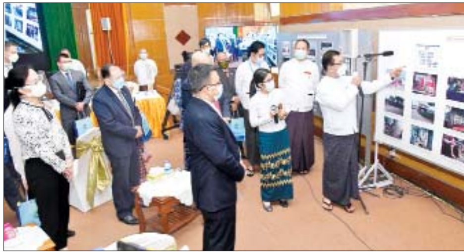
နိုင်ငံတော်စီမံအုပ်ချုပ်ရေးကောင်စီ၊ သတင်းထုတ်ပြန်ရေးအဖွဲ့ ခေါင်းဆောင် ဗိုလ်ချုပ်ဇော်မင်းထွန်း သတင်းစာရှင်းလင်းပွဲသို့ တက်ရောက်လာကြသည့် နိုင်ငံခြားသံရုံးများမှ ကိုယ်စားလှယ်များအား အကြမ်းဖက်မှုများတွင် ပါဝင်ပတ်သက်ခဲ့ပြီး ဖမ်းဆီးရစ်သူများနှင့် ဆက်သွယ်သူများ၏ အချက်အလက်များကို ရှင်းလင်းပြသစဉ်။

အမှုအမျိုးအစားပေါင်း ၁၁ မျိုးတွင် ပါဝင်သူများက လွတ်ခွင့်ရမည် ဗိုလ်ချုပ် ဇော်မင်းထွန်းက ထိုကိစ္စနှင့် ပတ်သက်၍ ကြားနာစစ်ဆေးဆဲ ပြစ်မှုဆိုင်ရာအမှုများ ပိတ်သိမ်းခြင်းဟူ၍ ဇူလိုင် ၂၀ ရက်တွင် ကြေညာပြီး ဖြစ်ပါကြောင်း၊ အပိုဒ် ၁ တွင် ကိုဗစ်-၁၉ ရောဂါ ကြောင့် နှောင့်နှေးကြန့်ကြာနေခြင်းများ ရှိပါကြောင်း၊