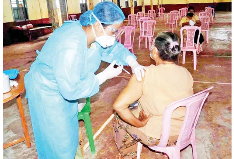
မျိုးမြတ်(ဆီဆိုင်)

ကာကွယ်ဆေးလာရောက်ထိုးနှံကြသည့် မိဘပြည်သူများအား ကျန်းမာရေးစစ်ဆေးခြင်းများပြုလုပ်ပေးပြီး စနစ်တကျထိုးနှံ ပေးသည်။ ဆီဆိုင်မြို့နယ်အတွင်း ဆေးထိုးအုပ်စုနေရာများအဖြစ် ဆီဆိုင်မြို့နယ်ခန်းမဆောင်၊ ပါလောပါကယ်ကျေးရွာအုပ်စု ဆိုင်ခေါင်စံပြကျေးရွာရှိ အုပ်စုအုပ်ချုပ်ရေးမှူးရုံးနှင့် ဇေတဝန် ကျောင်းတိုက်၊ ဘန်းယဉ်ကျေးရွာအုပ်စု ဘန်းယဉ်ကျေးရွာရှိ ဘုရားကိုးဆူဓမ္မာရုံ စသည့်နေရာများတွင် စက်တင်ဘာ ၄ ရက် အထိ ဆက်လက်ထိုးနှံပေးသွားမည်ဖြစ်ကြောင်း သိရသည်။