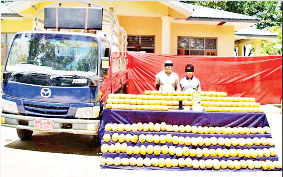
သိမ်းဆည်းရမိသည့် မူးယစ်ဆေးဝါးများကို တွေ့ရစဉ်။

နေပြည်တော် ဩဂုတ် ၃၀ ရှမ်းပြည်နယ် (မြောက်ပိုင်း) နောင်ချိုမြို့နယ်၌ ငွေကျပ် ၄ ဒသမ ၅ ဘီလီယံကျော် တန်ဖိုးရှိ မူးယစ်ဆေးဝါးများ သိမ်းဆည်းရမိခဲ့ကြောင်း မြန်မာနိုင်ငံ ရဲတပ်ဖွဲ့မှ သိရသည်။