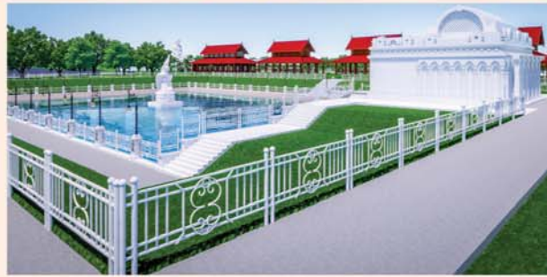
မုစလိန္နအိုင်

၁။ နိုင်ငံတော်စီမံအုပ်ချုပ်ရေးကောင်စီဥက္ကဋ္ဌ၊ တပ်မတော်ကာကွယ်ရေးဦးစီးချုပ် ဗိုလ်ချုပ်မှူးကြီးမင်းအောင်လှိုင် ဦးဆောင်သည့် (၇)ရက်သား၊ သမီး၊ ဘုရားဒါယကာ၊ ဒါယိကာမတို့က မာရဝိဇယပုဒ္ဒရုပ်ပွားတော်မြတ်ကြီးအား မြန်မာနိုင်ငံတွင် ထေရဝါဒပုဒ္ဒသာသနာတော်ထွန်းလင်းတောက်ပလျက်ရှိသည်ကို ကမ္ဘာကိုပြသရန်၊ တိုင်းပြည်အေးချမ်းသာယာမှုရှိစေရန်၊ ရုပ်ပွားတော်မြတ်ကြီးအား ပြည်တွင်း၊ ပြည်ပဘုရားဖူးများလာရောက်ခြင်းဖြင့် ဒေသတိုးတက်စည်ကားမှုကို အထောက်အကူဖြစ်စေရန်၊ နိုင်ငံတော်ဖွံ့ဖြိုးတိုးတက်မှုအား အထောက်အကူ ဖြစ်စေရန်ရည်သန်လျက် ပြည်ထောင်စုနယ်မြေ နေပြည်တော်၊ ဒက္ခိဏသီရိမြို့နယ်အတွင်း၌ သာသနာတော်ထုံး၊ ရုပ်ပွားဆင်းတုတော်ထုံး၊ မြန်မာ့ရိုးရာတည်ထုံးများနှင့်အညီ တည်ဆောက် ပူဇော်လျက်ရှိပါသည်။