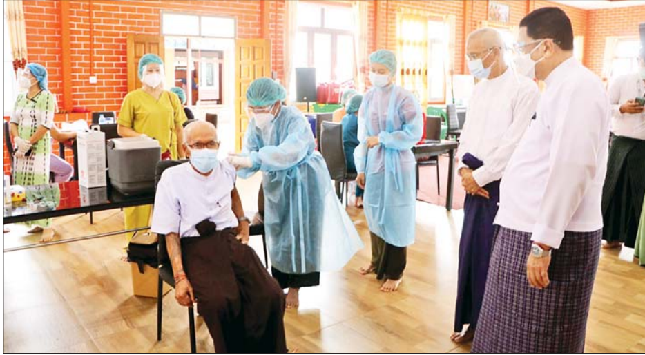
မော်လမြိုင်မြို့၊ မြဆည်းဆာ ဘိုးဘွားရိပ်သာတွင် သက်ကြီးဘိုးဘွားများအား ဩဂုတ် ၂၆ ရက်က ဒုတိယအကြိမ် ကိုဗစ်-၁၉ ရောဂါ ကာကွယ်ဆေးထိုးနှံပေးစဉ်။

ကိုဗစ် - ၁၉ တတိယလှိုင်းမှာ ကာကွယ်ထိန်းချုပ်ရေးလုပ်ငန်းတွေကို ဘယ်လိုဆောင်ရွက်ခဲ့တယ်ဆိုတာနဲ့ပတ်သက်ပြီး ဆွေးနွေးလိုပါတယ်။ ပြည်ပနိုင်ငံတွေကနေ ဝင်ရောက်ကူးစက်မှု မရှိစေရေး သေချာစောင့်ကြပ်ကြည့်ရှုပါတယ်။ ကူးစက်မှုများတဲ့ အိန္ဒိယ၊ ဘင်္ဂလားဒေ့ရှ်နဲ့ ယူကရိန်နိုင်ငံတွေက ပြန်လာသူတွေကို ကွာရန်တင်း ၁၄ ရက် ထားပါတယ်။ ရောက်ပြီး သုံးရက်နဲ့ ၁၁ ရက်မှာ ဓာတ်ခွဲနမူနာစစ်ဆေးပါတယ်။ ကျန်တဲ့နိုင်ငံတွေက ဝင်ရောက်လာသူတွေကို ကွာရန်တင်း ၁၀ ရက် ထားပါတယ်။ သုံးရက်နဲ့ ခုနစ်ရက်မှာ စစ်ဆေးပါတယ်။ PCR နဲ့ စစ်ဆေးတာဖြစ်ပါတယ်။