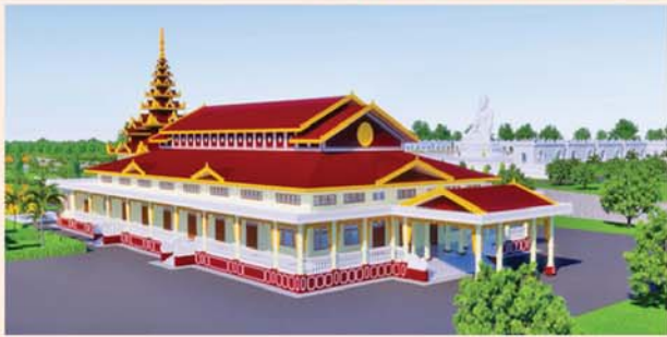
ဓမ္မာရုံ(၂၁၃x၉၀)ပေ ၁ လုံး-၈၇၃၀ သိန်း