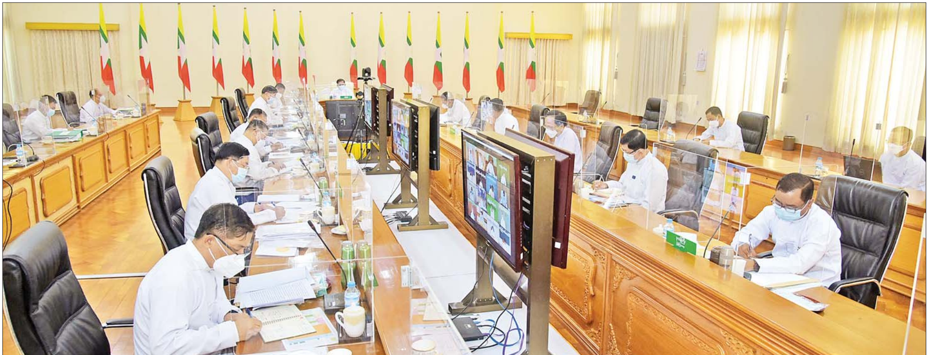
နိုင်ငံတော်စီမံအုပ်ချုပ်ရေးကောင်စီဥက္ကဋ္ဌ၊ နိုင်ငံတော်ဝန်ကြီးချုပ် ဗိုလ်ချုပ်မှူးကြီး မင်းအောင်လှိုင် ကိုဗစ်-၁၉ ရောဂါ ကာကွယ်၊ ထိန်းချုပ်၊ ကုသရေးဆိုင်ရာ (၁၀)ကြိမ်မြောက် ညှိနှိုင်းအစည်းအဝေးတွင် အမှာစကားပြောကြားစဉ်။

ကူးစက်မှုနှုန်းများ ကျဆင်းရခြင်းသည် ပြည်သူများ၏ ပူးပေါင်းလိုက်နာဆောင်ရွက်မှုနှင့် စီမံခန့်ခွဲမှုများ ဆောင်ရွက်လျက်ရှိသည့် အဖွဲ့အစည်းများ၏ ညီညီညာညာဖြင့် တက်ညီလက်ညီ ဆောင်ရွက်ပေးမှုများကြောင့်ဖြစ်