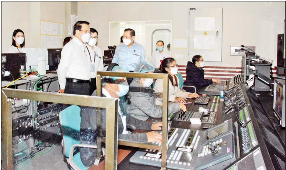
ပြည်ထောင်စုဝန်ကြီး ဦးမောင်မောင်အုန်း မြန်မာ့အသံနှင့် ရုပ်မြင်သံကြား(ရန်ကုန်)ရုံး ရုပ်မြင်ဆောင်ရို စတူဒီယိုအတွင်း လှည့်လည်ကြည့်ရှုစစ်ဆေးနေသည်။

ရန်ကုန် ဩဂုတ် ၃၀ ပြန်ကြားရေးဝန်ကြီးဌာန ပြည်ထောင်စုဝန်ကြီး ဦးမောင်မောင်အုန်းသည် ယနေ့နံနက်ပိုင်းတွင် ရန်ကုန်မြို့ ပြည်လမ်းရှိ မြန်မာ့အသံနှင့် ရုပ်မြင်သံကြား ဂိုဏ်းထုတ်လွှင့်ရေးလုပ်ငန်း များ၊ စတူဒီယိုခန်းမများ၊ သတင်းခန်းများ၊ နိုင်ငံတော်ဆိုင်ခိုင်းနှင့် သံစုံတီးဝိုင်းတို့ကို လှည့်လည်ကြည့်ရှုစစ်ဆေးပြီး လိုအပ်သည်များ ဆွေးနွေးမှာကြားသည်။