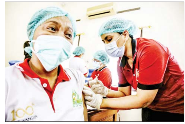
AstraZeneca ကိုဗစ်-၁၉ ရောဂါ ကာကွယ်ဆေး၊ Pfizer ကိုဗစ်-၁၉ ရောဂါကာကွယ်ဆေး၊ Moderna ကိုဗစ်-၁၉ ရောဂါ ကာကွယ်ဆေးနှင့် Novavax ကိုဗစ်-၁၉ ရောဂါ ကာကွယ်ဆေးများကို အသုံးပြုခဲ့ကြောင်း သိရသည်။ ကိုးကား- ဆင်ဟွာ၊ ဘာသာပြန်- အလင်းသစ်

လက်ရှိတွင် အင်ဒိုနီးရှားနိုင်ငံသည် ကိုဗစ်-၁၉ ရောဂါ ကာကွယ် ဆေးထုတ်လုပ်သည့်နိုင်ငံအသီးသီးမှ ကိုဗစ်-၁၉ ရောဂါကာကွယ် ဆေး ၂၁၇ သန်းကျော်လက်ခံရရှိပြီးဖြစ်ကြောင်းနှင့် လူဦးရေ ၂၀၈ သန်း ခန့်အား ကိုဗစ်-၁၉ ရောဂါ ကာကွယ်ဆေးထိုးနှံပေးနိုင်ရန် ရည်ရွယ် လျက်ရှိကြောင်း သိရသည်။ အင်ဒိုနီးရှားနိုင်ငံ၌ ယနေ့အထိ ကိုဗစ်-၁၉ ရောဂါ ကာကွယ်ဆေး အနည်းဆုံးတစ်ကြိမ်ထိုးနှံပြီးသူ ၆၂ ဒသမ ၂၉ သန်းရှိကြောင်းနှင့် ကိုဗစ်-၁၉ ရောဂါကာကွယ်ဆေးနှစ်ကြိမ်စလုံး ထိုးနှံပြီးသူ ၃၅ ဒသမ ၃၁ သန်းရှိကြောင်း အင်ဒိုနီးရှားကျန်းမာရေးဝန်ကြီးဌာနက ပြောကြား သည်။ အင်ဒိုနီးရှားနိုင်ငံသည် နိုင်ငံတစ်ဝန်း ကိုဗစ်-၁၉ ရောဂါ ကာကွယ် ဆေးထိုးနှံမှုအစီအစဉ်တွင် Sinovac ကိုဗစ်-၁၉ ရောဂါ ကာကွယ်ဆေး၊