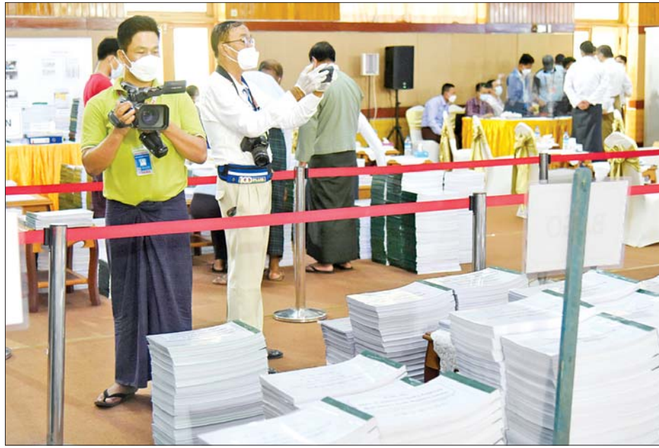
ပြည်တွင်းသတင်းထောက်များ သတင်းစာရှင်းလင်းပွဲတွင် ခင်းကျင်းပြသထားသော ရွေးကောက်ပွဲ နှင့်သက်ဆိုင်သည့် စာရွက်စာတမ်းများကို မှတ်တမ်းရယူနေစဉ်။

ကြောင်း။ (ည) ယခင်ပြည်ထောင်စုရွေးကောက်ပွဲကော်မရှင် အနေဖြင့်လည်း တရားဝင် အပ်နှင်းထား သည့်လုပ်ပိုင်ခွင့်ကို အလွဲသုံးစားပြု၍ ဥပဒေ၊ နည်းဥပဒေများကို ကျော်လွန် ဖောက်ဖျက်ဆောင်ရွက်ခဲ့သည်ကို တွေ့ရှိရ ကြောင်း။ စစ်ဆေးတွေ့ရှိချက် သို့ဖြစ်၍ ၂၀၂၀ ပြည့်နှစ် နိုဝင်ဘာ ၈ ရက်တွင် ကျင်းပခဲ့သည့် ပါတီစုံဒီမိုကရေစီအထွေထွေ ရွေးကောက်ပွဲသည် ပြည်ထောင်စုသမ္မတမြန်မာ နိုင်ငံတော်ဖွဲ့စည်းပုံအခြေခံဥပဒေ၊ ပြည်ထောင်စု ရွေးကောက်ပွဲကော်မရှင်ဥပဒေ၊ သက်ဆိုင်ရာ လွှတ်တော်ရွေးကောက်ပွဲဥပဒေ၊ နည်းဥပဒေများနှင့် ညီညွတ်မှုမရှိသည့်အပြင် လွတ်လပ်၍တရားမျှတမှု