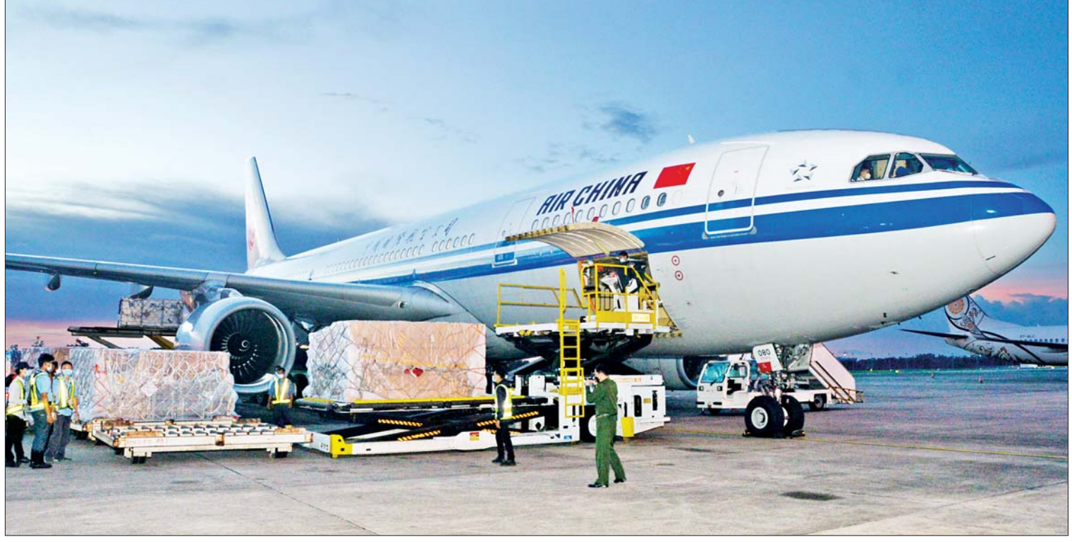
တရုတ်ပြည်သူ့လွတ်မြောက်ရေးတပ်မတော်နှင့် ပေကျင်းမြို့ရှိ မြန်မာသံရုံး၊ စစ်သံရုံးတို့က လှူဒါန်းသည့် ကိုဗစ်-၁၉ ရောဂါ ကာကွယ်ဆေးများနှင့် ဆေးဘက်ဆိုင်ရာ အထောက်အကူပြုပစ္စည်းများ ရန်ကုန်အပြည်ပြည်ဆိုင်ရာလေဆိပ်သို့ ရောက်ရှိစဉ်။