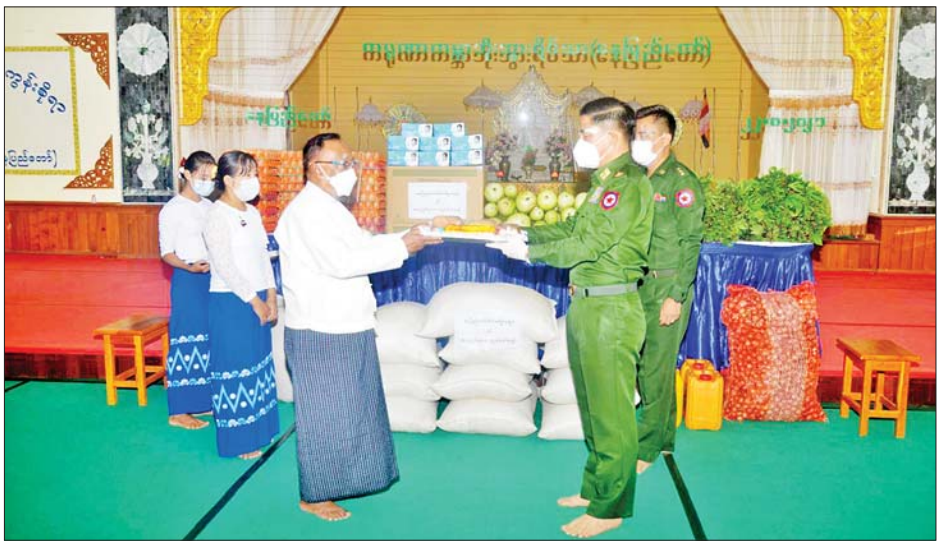
နေပြည်တော်တိုင်းစစ်ဌာနချုပ် တိုင်းမှူး ကရုဏာကမ္ဘာ့ဘိုးဘွားရိပ်သာသို့ စားသောက်ဖွယ်ရာနှင့် နှာခေါင်းစည်းများ လှူဒါန်းစဉ်။

အဖြစ် မွန်ပြည်နယ် ဗုဒ္ဓဘာသာကလျာဏယုဝ အသင်း(YMBA)က မော်လမြိုင်မြို့ရှိ နယ်မြေခံ တပ်မတော်ဆေးရုံ၊ နယ်မြေခံဆေးတပ်ရင်း၊ အထွေထွေရောဂါကုဆေးရုံကြီးနှင့် ကျိုက်မရောမြို့ ပြည်သူ့ဆေးရုံသို့အလှူငွေအာဟာရဖြည့်စားသောက် ဖွယ်ရာများနှင့် သောက်ရေသန့်ဘူးများကိုလည်း ကောင်း၊ မန္တလေးတိုင်းဒေသကြီး ပျော်ဘွယ်မြို့နယ် အတွင်းရှိ စေတနာ့ဝန်ထမ်းများအတွက် ဆန်၊ ဆီ၊ စားသောက်ဖွယ်ရာများနှင့်တစ်ကိုယ်ရေသုံးကာကွယ် ရေးဝတ်စုံများကိုလည်းကောင်း သက်ဆိုင်ရာ တိုင်းဒေသကြီးနှင့် ပြည်နယ်ဝန်ကြီးချုပ်များ၊ တိုင်း စစ်ဌာနချုပ်အသီးသီးမှ တိုင်းမှူးများနှင့် တာဝန်ရှိ သူများက အသီးသီးသွားရောက်လှူဒါန်းကြရာ တာဝန်ရှိသူများက လက်ခံရယူခဲ့ကြကြောင်း သိရ သည်။ သတင်းစဉ်