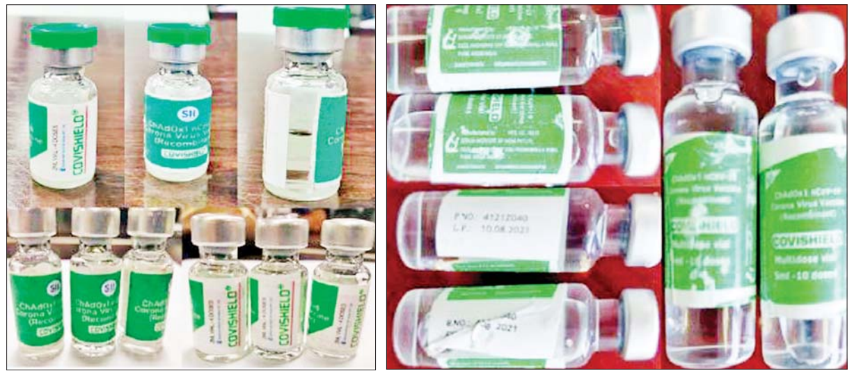
COVISHIELD အမှတ်တံဆိပ်ဖြင့် ထုတ်လုပ်ထားသည့် ကာကွယ်ဆေးအတုအမများ

ဆေးများ ဝယ်ယူခြင်း၊ လျှို့ဝှက်မှုများမှရှောင်ကာ ကာကွယ်ဆေးများ အား ဦးစားပေးအစဉ်အလိုက် ထိုးနှံပေးလျက်ရှိသည့်နည်းတူ ပုဂ္ဂလိကဆေးဝါးလုပ်ငန်းရှင်များ၊ လူမှုရေးအသင်းအဖွဲ့များ၊ ပုဂ္ဂလိက လုပ်ငန်းရှင်များ၊ ကုမ္ပဏီများအနေဖြင့် နိုင်ငံတကာနှင့် အာရှဒေသတွင် ထိုးနှံဆောင်ရွက်နေသော အရည်အသွေးအာနိသင်ရှိပြီး ဘေးအန္တရာယ် ကင်းရှင်းသည့် ကိုဗစ်-၁၉ ရောဂါကာကွယ်ဆေးများကို မိမိတို့အစီ အစဉ်ဖြင့် တင်သွင်းဖြန့်ဖြူးခြင်း၊ ကာကွယ်ဆေးထိုးနှံပေးခြင်း ဆောင်ရွက်လိုပါက လိုက်နာရမည့်အချက်များအားလည်းကောင်း၊ ကိုဗစ်-၁၉ ရောဂါ စာမျက်နှာ ၁၈ ကော်လံ ၁ သို့ ၀