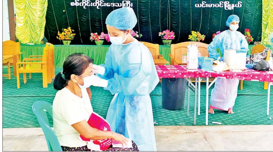
ဧမ္မာရုံ၊ ဖိုလ်ဝင်တောင်ကျောင်းဧမ္မာရုံ စုစုပေါင်း ၁၁၇၅ ဦး၊ ဩဂုတ် ၁၉ ရက်တွင် ၁၁၇၅ ဦး၊ ဩဂုတ် ၂၀ ရက်တွင် ၁၀၂ ဦး၊ ဩဂုတ် ၂၁

ယင်းမာပင် ဩဂုတ် ၂၂ စစ်ကိုင်းတိုင်းဒေသကြီး ယင်းမာပင်ခရိုင် ယင်းမာပင်မြို့နယ်တွင် ကိုဗစ်-၁၉ ရောဂါ ကာကွယ်ဆေးမထိုးနိုင်သေးသူများအား ယနေ့ ပဉ္စမနေ့အဖြစ် နံနက် ၉ နာရီမှ ညနေ ၄ နာရီအထိ ဆက်လက်ထိုးနှံပေးလျက်ရှိကြောင်း သိရသည်။ ထိုးနှံပေးလျက်ရှိ ယင်းမာပင်မြို့နယ်အတွင်း ကိုဗစ်-၁၉ ရောဂါ ကာကွယ်ဆေးထိုးနှံခြင်းကို ဩဂုတ် ၃၊ ၄၊ ၅၊ ၆၊ ၇၊ ၈၊ ၉၊ ၁၀ ရက်နှင့် ၁၅ ရက်တို့တွင် လူဦးရေ ၄၇၀၀ ထိုးနှံပေးနိုင်ခဲ့သည်။ ယခုထပ်မံရောက်ရှိလာသော တရုတ်ပြည်သူ့သမ္မတနိုင်ငံမှ ထုတ်လုပ်သော (Sinopharm) ဆေးအမျိုးအစား ကိုဗစ်-၁၉ ရောဂါ ကာကွယ်ဆေးအလုံးစုံ ၂၀၀၀ အား လူဦးရေ ၂၀၀၀ ကို ဩဂုတ် ၁၈ ရက်မှ စတင်၍ ယင်းမာပင်မြို့ အထက်ကျောင်း၊ ရွှေတောင်ဦးဘုန်းကြီးကျောင်း