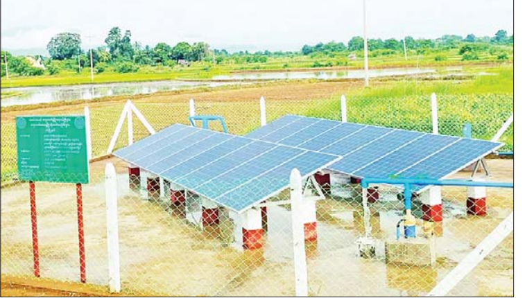
ခရမ်းလွန်ရောင်ခြည်အန္တရာယ် ကာကွယ်ရေး အိုင်ဇန်းလွှာကို ထိန်းသိမ်းပေး

ငမဲ ဩဂုတ် ၂၂ မကွေးတိုင်းဒေသကြီး ငမဲမြို့နယ် ချင်းစုကျေးရွာ၌ တိုင်းဒေသကြီးအစိုးရအဖွဲ့၏ ဒေသဖွံ့ဖြိုးရေးရန်ပုံငွေကျပ် ၃၆ ဒသမ ၁၃၁ သန်းဖြင့် ဆိုလာစနစ် စိုက်ပျိုးရေး ရရှိရေးလုပ်ငန်းကို ၂၀၂၁ ခုနှစ် ဇူလိုင်လမှ စတင်အကောင်အထည်ဖော်ဆောင်ရွက် ခဲ့ရာ ယခုရာနှုန်းပြည့် ဆောင်ရွက်ပြီးစီး၍ ကျေးရွာရှိ တောင်သူ ၁၇ ဦးတို့၏ လယ်မြေ ၈၈၀ ဧကကျော်ကို ရာသီမရွေး စိုက်ပျိုးရေးများ ပေးဝေနိုင်မည်ဖြစ်ကြောင်း ငမဲမြို့နယ် ကျေးလက်ဒေသ ဖွံ့ဖြိုးတိုးတက်ရေးဦးစီးဌာနမှ သိရသည်။ စိုက်ပျိုးရေးများ ပေးဝေ ချင်းစုကျေးရွာ စိုက်ပျိုးရေးရရှိရေးအတွက် အနက်ပေ ၄၀ ရှိ အကျယ်လေးလက်မ စက်ရေတွင်း လေးတွင်းတူးဖော်ခြင်း၊ ရေမြှုပ်ပန်များတပ်ဆင်ခြင်း၊ ဆိုလာ ၁၀ ဒသမ ၈၈၀ ကီလိုဝပ် တပ်ဆင်ခြင်း၊ ခြံစည်းရိုးကာရံခြင်းနှင့် ကြမ်းခင်းခြင်းလုပ်ငန်းတို့ကို Pro Engineering ကုမ္ပဏီမှ တာဝန်ယူဆောင်ရွက်၍ ယခုလုပ်ငန်းအားလုံး ပြီးစီးနေပြီဖြစ်ကာ စိုက်ပျိုးရေးများ ပေးဝေနေပြီဖြစ်ကြောင်း သိရသည်။ ကြေးမုံ