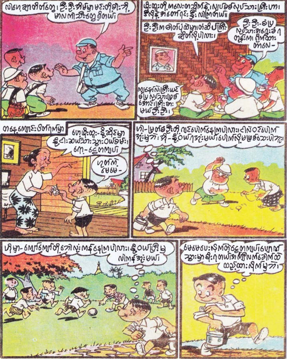
ဓမ္မသွေးဂုဏ်နယ် အတွဲ(၃)၊ အမှတ်(၃)၊ (၀၆-၁-၇၁)