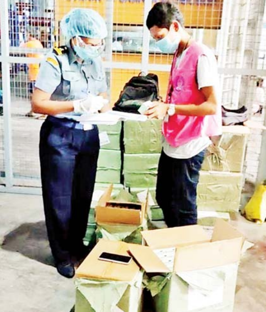
Oxygen Liquid Distributor တစ်ခု၊ Trolley ၃၀၊ Ultraviolet Disinfection Mobile Cart ငါးခု၊ Cleaning Liquid ၁၉၅၀ ကီလိုဂရမ်၊ Cannula ၁၀၀၀၊ Face Shield ၁၀၅၀၀၀ ကီလိုဂရမ် တို့ကို ထုတ်ပေးခဲ့ကြောင်း သတင်းရရှိသည်။ သတင်းစဉ်

နေပြည်တော် ဩဂုတ် ၂၂ အကောက်ခွန်ဦးစီးဌာနအနေဖြင့် ကိုဗစ်-၁၉ ရောဂါ ကာကွယ်၊ ထိန်းချုပ်၊ ကုသရေးပစ္စည်းများအား လေကြောင်း၊ ဆိပ်ကမ်း၊ နယ်စပ်ဂိတ် အသီးသီးမှ ရုံးပိတ်ရက်ရှည်ကာလအတွင်း နေ့စဉ် ရုံးပိတ်ရက်မရှိ လွယ်ကူချောမွေ့စွာ စစ်ဆေးထုတ်ပေးလျက်ရှိရာ ဩဂုတ် ၂၂ ရက်၌ ရန်ကုန်အပြည်ပြည်ဆိုင်ရာလေဆိပ်တွင် ကုမ္ပဏီ ၁၂ ခုမှ Amnavir-400 Tablet ၉၉၉၀၊ Azinam-250 Tablet ၁၉၂၄၃ ခု၊ Emboxin-40 Injection ၄၀၀၀၀၊ Emboxin-60 Injection ၄၀၀၀၀၊ Enoxaparin Sodium Injection ၄၀၀၀၊ Immunospeme Capsule ၁၅၁၂၀၊ Nova-C Tablet ၁၀၀၀၀၊ နှာခေါင်းစည်း ၁၂၀၊ Nasal Cannula ၁၂၀၊ Oximeter ၅၁၀၀၊ အိမ်သုံးအောက်ဆီဂျင်စက် ၄၅၀၊ Oxygen Concentrator Spaer Part ၆၈ ခု၊ Spirometer ၂၀၀၊ နယ်စပ် (ချင်းရွှေဟော်၊ မူဆယ်၊ မြဝတီ)တွင် ကုမ္ပဏီ ၂၂ ခုမှ Oxygen Cylinder ၃၀၃၄ ခု၊ Oxygen Concentrator ၈၃ ခု၊ နှာခေါင်းစည်း ၅၁၅၀၊ Liquid Oxygen ၂၉၃၃၁ ကုဗမီတာ၊ Liquid Oxygen ၁၉ ဒသမ ၀၆ တန်၊ Flow Meter ၄၉၈၀၊ တစ်ကိုယ်ရေသုံးကာကွယ်ရေးဝတ်စုံ ၁၇၀၀၀၊ အောက်ဆီဂျင် ထုတ်သည့်စက် သုံးခု၊ Blood Pressure Monitor ၅၀၀၊ Thermometer ၁၅၀၊ Spary Gun ၁၅၀၊ Oxygen Storage Container တစ်ခု၊ Oxygen Mask ၂၆၂၀၊ Oximeter ၁၅၀။