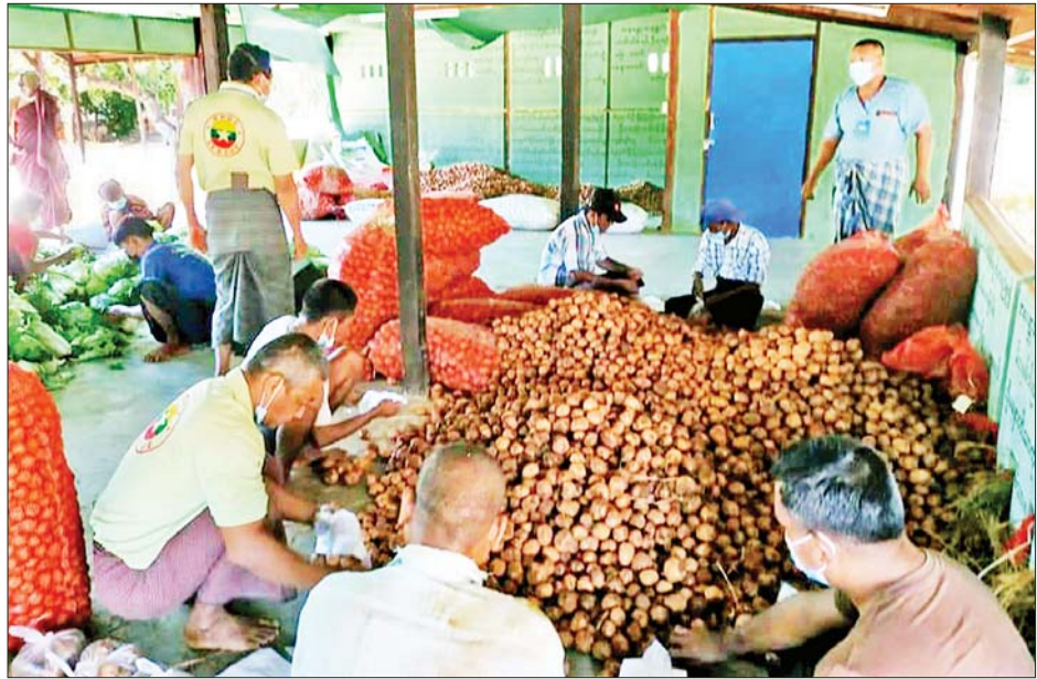
ကိုဗစ်-၁၉ ရောဂါ ကာကွယ်ဖို့ မိမိကစ၍ စည်းကမ်းများကိုလိုက်နာစို့

ဝက်ကြီးအင်းရပ်ကွက်နှင့် မြင်းကပါကျေးရွာတို့ရှိ အိမ်ထောင်စု ၂၀၀၀ အတွက် မီးဖိုချောင်သုံး ဟင်းချက်စရာ ဟင်းသီးဟင်းရွက်များ ဖြန့်ဝေပေးခဲ့ကြောင်း၊ အဆိုပါ ဟင်းသီးဟင်းရွက်များအား ရှမ်းပြည်နယ် အောင်ပန်းမြို့သို့ ယမန်နေ့က ၁၀ ဘီးကားတစ်စီးဖြင့် ညောင်ဦးခရိုင် ပြည်သူ့ဆေးရုံကြီး အောက်ဆီဂျင်အထောက်အကူပြုအဖွဲ့က ဦးဆောင်ကာ သွားရောက်ဝယ်ယူခဲ့ပြီး ညောင်ဦးမြို့ အခြေခံအိမ်ထောင်စု ၂၀၀၀ အား ယနေ့ နံနက် ၉ နာရီမှ စတင်ဖြန့်ဝေခဲ့ရာ ညနေ ၄ နာရီခွဲတွင် ဖြန့်ဝေပြီးစီးခဲ့ကြောင်း ညောင်ဦးခရိုင်ပြည်သူ့ဆေးရုံကြီး အောက်ဆီဂျင်အထောက်အကူပြုအဖွဲ့ထံမှ သိရသည်။ ကိုထိန်