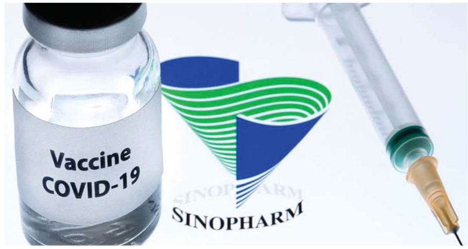
ကိုဗစ် - ၁၉ ရောဂါကာကွယ်ဆေး Sinopharm

အချုပ်အနေနဲ့ ဗိုင်းရပ်စ်ဟာ အမြဲတမ်းပြောင်း လဲနေပါတယ်။ RNA ဗိုင်းရပ်စ်ဟာ DNA ဗိုင်းရပ်စ် ထက် ပြောင်းလဲမှုတွေက ပိုပြီးမြန်ဆန်ပါတယ်။ RNA