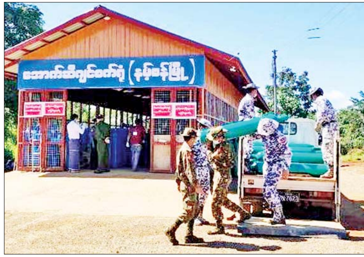
နမ့်စန်မြို့ အောက်ဆီဂျင်စက်ရုံအတွက် အရှေ့အလယ်ပိုင်းတိုင်းစစ်ဌာနချုပ်မှ လှူဒါန်းသည့် အောက်ဆီဂျင်အိုးများကို နမ့်စန်တပ်နယ်မှ တပ်မတော်သားများက သယ်ယူနေစဉ်။

အသင်းများသို့ အောက်ဆီဂျင်အိုး ၄၇ လုံးကို လည်းကောင်း၊ စစ်ကိုင်းတိုင်းဒေသကြီး မုံရွာမြို့ အထွေထွေရောဂါကုပြည်သူ့ဆေးရုံကြီးသို့ မိဘဂုဏ်အောက်ဆီဂျင်စက်ရုံမှ ထုတ်လုပ်သည့် အောက်ဆီဂျင်အိုး ၁၀၅ လုံးကို လည်းကောင်း တိုင်းစစ်ဌာနချုပ်အသီးသီးမှ နယ်မြေခံတပ်မတော်သား၊ ဌာနဆိုင်ရာဝန်ထမ်းများနှင့် လူမှုကူညီရေးအဖွဲ့အစည်းများက အသီးသီးသွားရောက်လှူဒါန်းကြရာ တာဝန်ရှိသူများက လက်ခံရယူခဲ့ကြသည်။ ထို့ပြင် စစ်ကိုင်းတိုင်းဒေသကြီး ခန္တီးမြို့ ခရိုင်ပြည်သူ့ဆေးရုံရှိ အောက်ဆီဂျင်စက်ရုံ စတင်ဖွင့်လှစ်ထုတ်လုပ်နေမှုကို အနောက်မြောက်တိုင်းစစ်ဌာနချုပ်မှ တာဝန်ရှိသူများနှင့် ဌာနဆိုင်ရာတာဝန်ရှိသူများက သွားရောက်ကြည့်ရှု၍ လိုအပ်သည်များ ညှိနှိုင်းဆောင်ရွက်ပေးသည်။ အဆိုပါစက်ရုံမှ ထုတ်လုပ်သည့်ပိုလျှံသော အောက်ဆီဂျင်အိုးများကို ဝေလံခေါင်များဒေသဖြစ်သည့် နာဂတောင်တန်းရှိ ဒေသခံ တိုင်းရင်းသားပြည်သူများထံသို့ ဆက်လက် ဖြန့်ဖြူးပေးသွားမည်ဖြစ်ကြောင်း သိရသည်။ သတင်းစဉ်