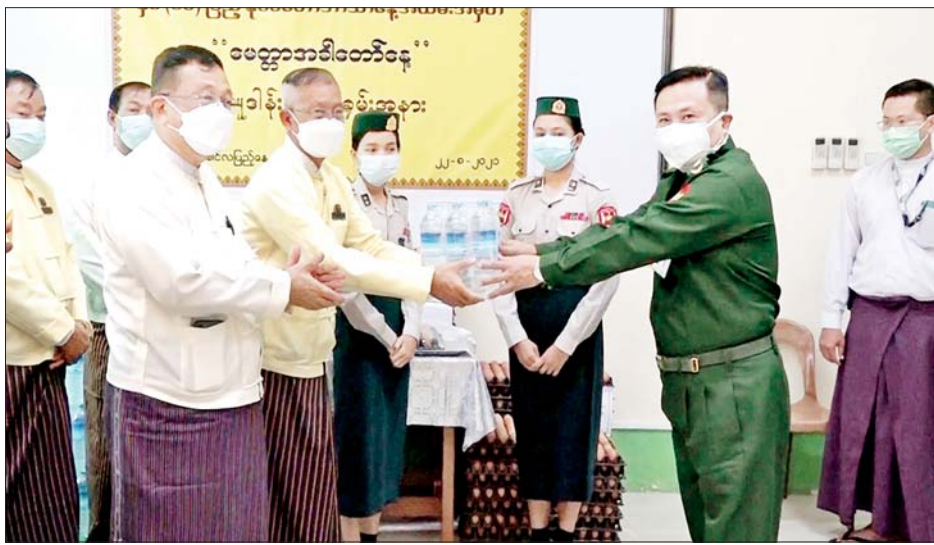
ထောက်ပံ့ဖြည့်ဆည်းပေးလျက်ရှိ သကဲ့သို့ စေတနာရှင်အလှူရှင်များ နှင့် ပရဟိတလူမှုအဖွဲ့အစည်းများ မှ အခြားလိုအပ်သည်များ ပူးပေါင်း ကူညီဆောင်ရွက်ပေးကြောင်း၊ မွန်ပြည်နယ် ဗုဒ္ဓဘာသာကလျာ ဏယုဝ YMBMA အသင်းမှလည်း ကိုဗစ်-၁၉ ရောဂါ ကာလအတွင်း တပ်မတော်ဆေးရုံပြည်သူ့ဆေးရုံ များသို့ အလှူငွေများ၊ ကြက်ဥ၊ သောက်ရေသန့်များ ပေးအပ် လှူဒါန်းမှုအပေါ် ကျေးဇူးအထူး တင်ရှိကြောင်း ပြောကြားသည်။ ထို့နောက် ပြည်နယ်ဝန်ကြီးချုပ် နှင့်အဖွဲ့သည် မော်လမြိုင်မြို့ ရွှေ့နတ်တောင် ရေသန့်စင်စက်ရုံ ဝင်းအတွင်း ၁ နာရီလျှင် အောက်ဆီ ဂျင် လီတာ ၄၀ အိုး အလုံး ၅၀ ထုတ်ပေးနိုင်မည့် တန် ၂၀ ဆုံ အောက်ဆီဂျင်(အရည်) စက်ရုံ တည်ဆောက်ပြီးစီးနေမှုကို ကြည့်ရှု စစ်ဆေး၍ တာဝန်ရှိသူများအား ခရိုင်(ပြန်/ဆက်)

မော်လမြိုင် ဩဂုတ် ၂၂ မွန်ပြည်နယ် ဗုဒ္ဓဘာသာ ကလျာဏယုဝ YMBMA အသင်း ဥက္ကဋ္ဌ မွန်ပြည်နယ်ဝန်ကြီးချုပ် ဦးဇော်လင်းထွန်းသည် ယနေ့ နံနက်ပိုင်းက မော်လမြိုင်မြို့ အမှတ် (၅) တပ်မတော်ဆေးရုံ (ခုတင်- ၃၀၀) တွင် နှစ်(၆၀)ပြည့် နိုင်ငံတော်ဘာသာရေး အထိမ်း အမှတ် မေတ္တာအခါတော်နေ့၊ YMBMA အသင်းအမှုဆောင်အဖွဲ့ဝင် များနှင့် အလှူရှင်များမှ စုပေါင်း၍ မော်လမြိုင်မြို့ အမှတ် (၅) တပ်မတော်ဆေးရုံ၊ ပြည်နယ် အထွေထွေရောဂါကုဆေးရုံကြီး၊ ကျိုက်မရောမြို့နယ် ပြည်သူ့ ဆေးရုံများသို့ အလှူငွေများ၊ ကြက်ဥနှင့် သောက်ရေသန့်များ ပေးအပ်လှူဒါန်းသည်။