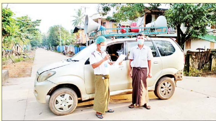
ခြင်းကို ပြန်ကြားရေးနှင့် ပြည်သူ့ဆက်ဆံ ဝန်ထမ်းလူငယ်များက ပူးပေါင်း ရေးဦးစီးဌာန၊ အမှတ်(၂)ရပ်ကွက် ဆောင်ရွက်ခဲ့ကြကြောင်း သိရသည်။ ရာအိမ်မှူးနှင့် ရပ်ကွက်စေတနာ့ လင်းသန့်(ပြန်/ဆက်)

ကမမောင်း ဩဂုတ် ၂၂ ကရင်ပြည်နယ် ကမမောင်းမြို့၌ ကိုဗစ်- ၁၉ ရောဂါ ကူးစက်မှုများနှင့် လူသေဆုံးမှု များရှိလာသဖြင့် ကိုဗစ်-၁၉ ရောဂါ ကာကွယ်ထိန်းချုပ်နိုင်ရန်အတွက် အသိ ပညာပေးနှိုးဆော်မှုများကို အသံချဲ့စက် ဖြင့် ကျယ်ကျယ်ပြန့်ပြန့် လိုက်လံ ဆောင်ရွက်လျက်ရှိရာ ယနေ့ညနေ ၅ နာရီက မြို့အတွင်းရှိ ရပ်ကွက်များ၌ လှည့်လည်နှိုးဆော်ခဲ့ကြောင်း သိရ သည်။ ပူးပေါင်းဆောင်ရွက် ထိုသို့ ကိုဗစ်-၁၉ ရောဂါ ကာကွယ် ရေး အသိပညာပေးလှည့်လည်နှိုးဆော်