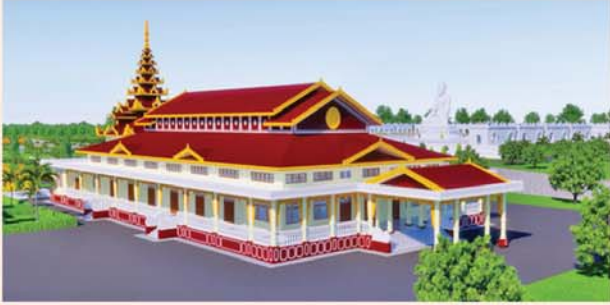
ဓမ္မာရုံ(၂၀၃x၉၀)ပေ ၁ လုံး-၈၇၃၀ သိန်း