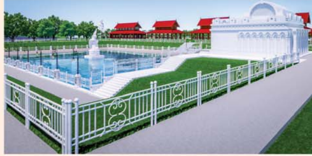
မုစလိန္နအိုင်

၁။ နိုင်ငံတော်စီမံအုပ်ချုပ်ရေးကောင်စီဥက္ကဋ္ဌ၊ တပ်မတော်ကာကွယ်ရေးဦးစီးချုပ် ဗိုလ်ချုပ်မှူးကြီးမင်းအောင်လှိုင် ဦးဆောင်သည့် (၇)ရက်သား၊ သမီး၊ ဘုရားဒါယကာ၊ ဒါယိကာမတို့က မာရဝိဇယပုဒ္ဒရုပ်ပွားတော်မြတ်ကြီးအား မြန်မာနိုင်ငံတွင် ထေရဝါဒပုဒ္ဓသာသနာတော်ထွန်းလင်းတောက်ပလျက်ရှိသည်ကို ကမ္ဘာကိုပြသရန်၊ တိုင်းပြည်အေးချမ်းသာယာမှုရှိစေရန်၊ ရုပ်ပွားတော်မြတ်ကြီးအား ပြည်တွင်း၊ ပြည်ပဘုရားဖူးများလာရောက်ခြင်းဖြင့် ဒေသတိုးတက်စည်ကားမှုကို အထောက်အကူဖြစ်စေရန်၊ နိုင်ငံတော်ဖွံ့ဖြိုးတိုးတက်မှုအား အထောက်အကူ ဖြစ်စေရန်ရည်သန်လျက် ပြည်ထောင်စုနယ်မြေ နေပြည်တော်၊ ဒက္ခိဏသီရိမြို့နယ်အတွင်း၌ သာသနာတော်ထုံး၊ ရုပ်ပွားဆင်းတုတော်ထုံး၊ မြန်မာ့ရိုးရာတည်ထုံးများနှင့်အညီ တည်ဆောက် ပူဇော်လျက်ရှိပါသည်။