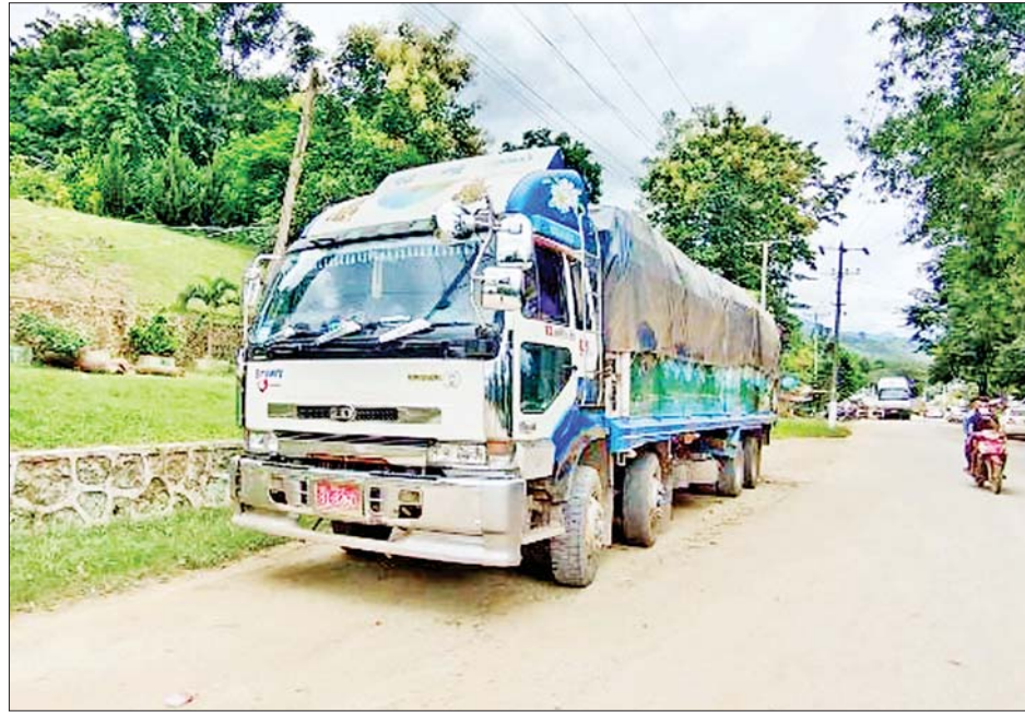
ချင်းရွှေဟော် နယ်စပ်ကုန်သွယ်ရေးစခန်းမှ ကိုဗစ်-၁၉ ရောဂါ ကာကွယ်ရေး အထောက်အကူပြု ပစ္စည်းများ တင်သွင်းလာသည့်ယာဉ်များကို တွေ့ရစဉ်။

တာဝန်ရှိသူများနှင့် ညှိနှိုင်းထား သည့် SOP များနှင့်အညီ လွယ်ကူ မြန်ဆန်နိုင်ရေးအတွက် ပူးပေါင်း ဆောင်ရွက်ပေးလျက်ရှိသည်။ တင်သွင်း ယနေ့တွင် ရန်ကုန်အပြည်ပြည် ဆိုင်ရာလေဆိပ်နှင့် မူဆယ်၊ ချင်းရွှေဟော်၊ မြဝတီ၊ ထီးခီး