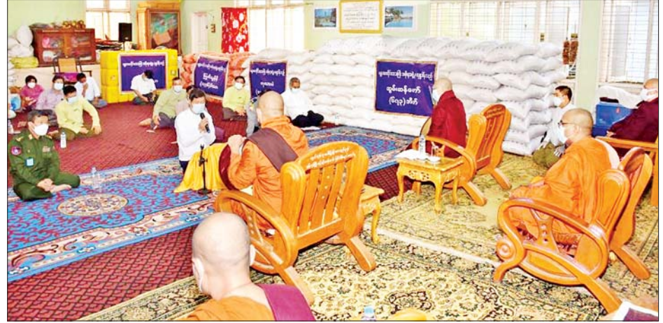
အမရပူရမြို့နယ် ဆင်ဖြူမယ်ကျောင်းတိုက်ဓမ္မာရုံ၌ ဆွမ်းဆန်တော်၊ ဆီ၊ ကုလားပဲနှင့် ကြက်သွန်များ ဆက်ကပ်လှူဒါန်းစဉ်။

ကျပ် တန်ဖိုးရှိ ဆန် ၁၀၂၃ အိတ်၊ ဆီ ၂၀၄၇ ပိဿာ၊ ကုလားပဲ ၂၀၄၇ ပိဿာနှင့် ကြက်သွန် ၂၀၄၇ ပိဿာကို ဦးပွားဘုရား သိမ်တော်ကြီး၌လည်းကောင်း၊ အမရပူရမြို့နယ်အတွင်းရှိ ဘုန်းတော်ကြီးကျောင်းများမှ ရဟန်း၊ သာမဏေ ၂၅၀၃ ပါးအတွက် ငွေကျပ် ၂၅၆၁၄၃၈၀ တန်ဖိုးရှိ ဆန် ၆၇၃ အိတ်၊ ဆီ ၁၃၄၆ ပိဿာ၊ ကုလားပဲ ၁၃၄၆ ပိဿာနှင့် ကြက်သွန် ၁၃၄၆ ပိဿာကို ဆင်ဖြူမယ်ကျောင်းတိုက် ဓမ္မာရုံ၌လည်းကောင်း လှူဒါန်းကြသည်။ ယင်းနောက် တက်ရောက်လာသူများက မြို့နယ် သံဃနာယကအဖွဲ့ဥက္ကဋ္ဌ ဆရာတော်များထံမှ ငါးပါး သီလခံယူပြီး လှူဒါန်းမှုအစုစုအတွက် ရေစက်သွန်းချအမျှပေးဝေခဲ့ကြကြောင်း သိရသည်။ သတင်းစဉ်