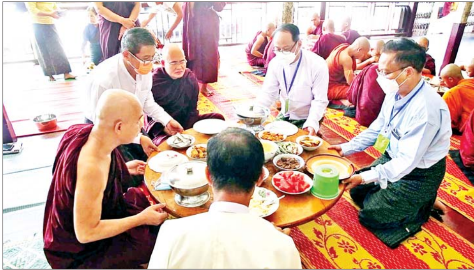
ထို့နောက် ပြည်နယ်ဝန်ကြီးချုပ်နှင့် တာဝန် ရှိသူများက အလှူတော်ငွေကျပ် သိန်း ၃၀ နှင့် လှူဖွယ်ဝတ္ထုပစ္စည်းများ၊ သက်န်းနှင့် နဝကမ္မ အလှူတော်ငွေများနှင့် ဝါတွင်းကာလ ဆရာတော် သံဃာတော်များ ဆွမ်းကိစ္စခက်ခဲကြောင့်ကြမ္မမရှိ စေရေး ဆွမ်းဆန်တော်နှင့် အာဟာရဖြည့်စွက်စာ ကြက်ဥများကို ဆက်ကပ်လှူဒါန်းခဲ့ကြသည်။ ဆက်လက်၍ ပြည်နယ်ဝန်ကြီးချုပ်နှင့်တာဝန်

ရှေးဦးစွာ နမောတဿ သုံးကြိမ်ရွတ်ဆို ဘုရား ကန်တော့၍ အခမ်းအနားကို ဖွင့်လှစ်ပြီး ကရင် ပြည်နယ်ဝန်ကြီးချုပ် ဦးစောမြင့်ဦးနှင့် ဧည့်ပရိသတ် အပေါင်းတို့မှ လမ်းကျောင်းတိုက် ဆရာတော် ဘဒ္ဒန္တကေသရီန္ဒထံမှ ကိုးပါးသီလံယူဆောက်တည် ကြကာ ဆရာတော် သံဃာတော်များ ရွတ်ပွားချီးမြှင့် တော်မူသည့် မေတ္တာသုတ်ပရိတ်တရားတော်များကို နာယူကြည်ညိုကြသည်။