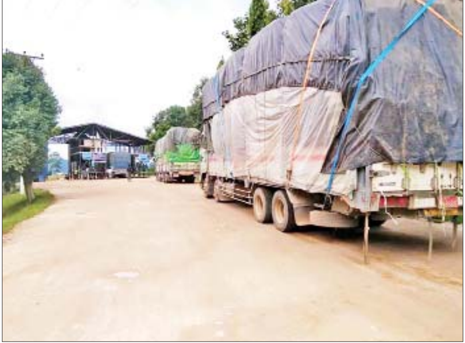
ချင်းရွှေဟော် နယ်စပ်ကုန်သွယ်ရေးစခန်းမှ ကိုဗစ်-၁၉ ရောဂါ ကာကွယ်ရေး အထောက်အကူပြု ပစ္စည်းများ တင်သွင်းလာသည့်ယာဉ်များအား တွေ့ရစဉ်။