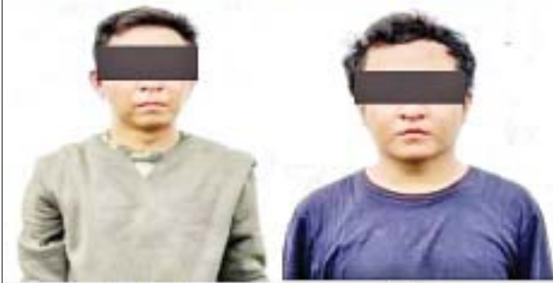
ထက်ပိုင်ကျော်၊ ရဲရင့်သူ