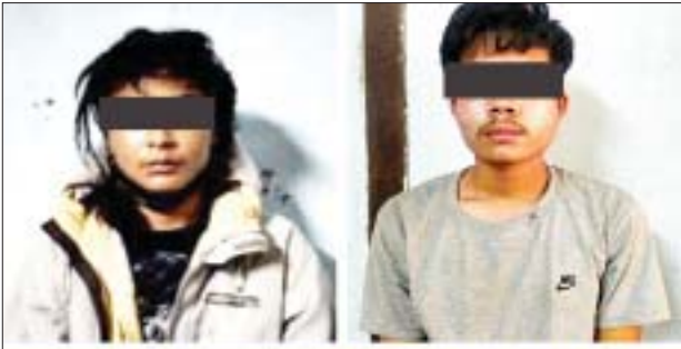
ပိုင်ဝဏ္ဏ၊ ပိုင်းပိုင်းလင်းထက် (ခ) ပိုင်းပိုင်း