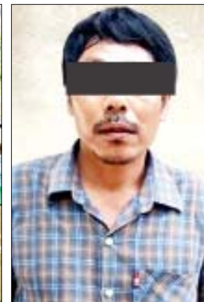
တရားခံ ကျော်နိုင်

နေပြည်တော် ဩဂုတ် ၂၁ မကွေးတိုင်းဒေသကြီး ရေစကြိုမြို့နယ်နှင့် စစ်ကိုင်း တိုင်းဒေသကြီး မြောင်မြို့နယ်အစပ်ရှိ ကျေးရွာအချို့ တို့တွင် အကြမ်းဖက်သင်တန်းများပို့ချခြင်း၊ လက်လုပ် သေနတ်များ ပြုလုပ်ခြင်းတို့ကို လုပ်ဆောင်နေ ကြောင်း သတင်းအရ လုံခြုံရေးတပ်ဖွဲ့ဝင်များသည် လိုအပ်သည့် စုံစမ်းဖော်ထုတ်မှုများကို ဆောင်ရွက် ခဲ့ရာ ရေစကြိုမြို့နယ် ရွှေလှုံကျေးရွာ ကမ္ဘာအေး ဘုန်းတော်ကြီးကျောင်းဝင်းအတွင်းမှ လက်နက် ခဲယမ်းများကို ယနေ့မွန်းလှိုင်းတွင် ဖော်ထုတ် သိမ်းဆည်းရရှိခဲ့ကြောင်း သိရသည်။