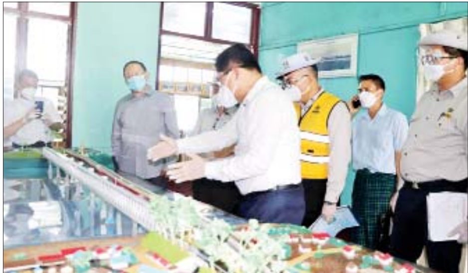
ဆောင်ရွက်သွားရေးနှင့် လိုအပ်သည်များကို ပေါင်းစပ် ညှိနှိုင်း ဆောင်ရွက်ပေးသည်။ အဆိုပါတံတားသစ်စီမံကိန်းကို ဘဏ္ဍာနှစ် သုံးနှစ်အတွင်း တည်ဆောက်သွားမည်ဖြစ်ပြီး တံတား ၏ခွင့်ပြုအလေးချိန်မှာ ယာဉ်တစ်စီးချင်း ၇၅ တန် ဖြတ်သန်းသွားလာနိုင်မည်ဖြစ်ကာ တံတားသစ်ပြီးစီး ပါက တံတားအဟောင်းနှင့် အသွားလမ်း/အပြန်လမ်း လေးလမ်းသွားအဖြစ် အသုံးပြုသွားမည်ဖြစ်ကြောင်း နှင့် လက်ရှိအသုံးပြုနေသော ဗလမင်းထင်တံတား သည် နှစ်ပေါင်း ၂၅ နှစ်ခန့်ရှိနေပြီဖြစ်ကြောင်း တံတား ဦးစီးဌာန တံတားအထူးအဖွဲ့(၁)မှ သိရသည်။ ပြည်နယ်(ပြန်/ဆက်)

စစ်ဆေးပြီး အဆိုပါ တံတားတည်ဆောက်နေမှု လုပ်ငန်းများနှင့် စပ်လျဉ်း၍ ပြည်နယ်လမ်းဦးစီးဌာန နှင့် တံတားအထူးအဖွဲ့(၁)မှ တာဝန်ရှိသူများက လက်ရှိအသုံးပြုလျက်ရှိသည့် တံတားအဟောင်း၏ အောက်ဘက်မီတာ ၄၀ အကွာတွင် တံတားအရည် ၃၂၂ ပေ ၉၇၉ မီတာနှင့် အကျယ်ယာဉ်သွား လမ်း ၂၄ ပေ၊ လူသွားလမ်းတစ်ဖက်လျှင် သုံးပေစီ ရှိသော သံကူကွန်ကရစ် ရေလယ်တိုင်နှင့် ကမ်းကပ်ခုံ၊ Steel Truss ၊ Steel Box Girder and RCC Slab အမျိုးအစား တံတားတည်ဆောက်သွားရန်ဆောင်ရွက် နေမှုအခြေအနေ၊ ကနဦးအကြို အင်ဂျင်နီယာလုပ်ငန်း များဆောင်ရွက်နေမှု အခြေအနေများအား ပါဝါပိုင် နှင့်တကွ ရှင်းလင်းတင်ပြကြသည်။ ပြည်နယ်ဝန်ကြီးချုပ်က တံတားသစ်စီမံကိန်း လုပ်ငန်းများကို သတ်မှတ်ချက်များအတိုင်း အရည် အသွေးပြည့်မီအောင် တည်ဆောက်သွားရေး၊ တံတား အဟောင်းကိုလည်း ကြံ့ခိုင်မှုရှိစေရန် ထိန်းသိမ်း