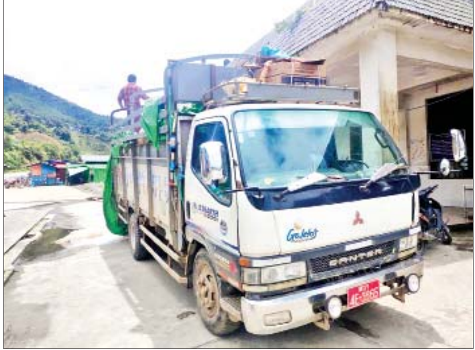
ကန်ပိုက်တီ နယ်စပ်ကုန်သွယ်ရေးစခန်းမှ ကိုဗစ်-၁၉ ရောဂါ ကာကွယ်ရေး အထောက်အကူပြု ပစ္စည်းများ တင်သွင်းလာသည့်ယာဉ်အား တွေ့ရစဉ်။