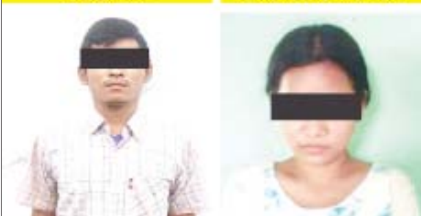
အောင်မင်းထက်၊ ဇူးဇူး(ခ)ဆုစန္ဒီဇော်