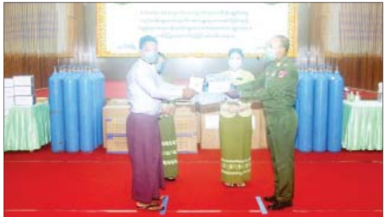
ကြီးနှင့် ပြည်နယ် အသီးသီးတို့မှ ဝန်ကြီးချုပ်များ၊ တိုင်းစစ်ဌာနချုပ်အသီးသီးမှ တိုင်းမှူးများနှင့် တာဝန်ရှိသူများက သွားရောက် ထောက်ပံ့လှူဒါန်းကြရာ တာဝန်ရှိသူများက လက်ခံရယူခဲ့ကြကြောင်း သတင်းရရှိသည်။

အတွင်းရှိ ကျန်းမာရေးဝန်ထမ်းများနှင့် ကန့်သတ်စောင့်ကြည့်ရေးစခန်း၊ ကုသရေးစင်တာနှင့် ကုသရေးဆေးရုံများတွင် တာဝန် ထမ်းဆောင်လျက်ရှိသည့် စေတနာ့ဝန်ထမ်းများအတွက် ထောက်ပံ့ငွေကျပ်သိန်း ၂၁၇၀ တန်ဖိုးရှိ ကိုဗစ်-၁၉ ရောဂါ ကာကွယ်ရေးအထောက်အကူပြု ပစ္စည်းများကိုလည်းကောင်း၊ မန္တလေးတိုင်းဒေသကြီး ချောက်မြို့နယ် ပြည်သူ့ဆေးရုံရှိ ဆေးရုံတက်လူနာများအတွက် အာဟာရဖြည့်စားသောက်ဖွယ်ရာများကို လည်းကောင်း သက်ဆိုင်ရာ တိုင်းဒေသ