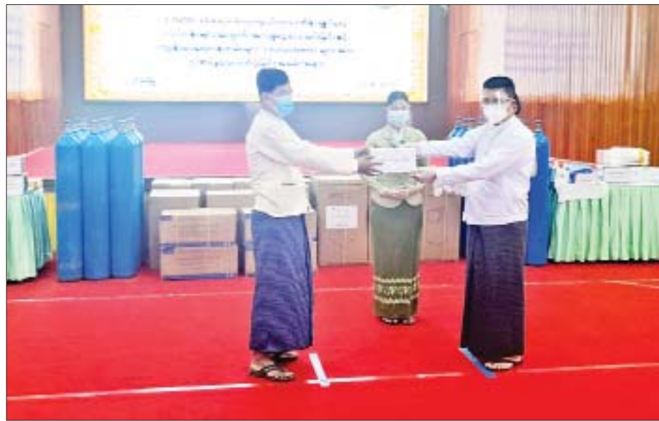
က လည်းကောင်း၊ တိုင်းဒေသကြီးအတွင်းရှိ Quarantine Center ၊ ကုသရေးစင်တာ၊ ကုသရေး ဆေးရုံများ၌ တာဝန်ထမ်းဆောင်လျက်ရှိသည့် စေတနာ့ဝန်ထမ်းများအား စားစရိတ်နှင့် စက်သုံးဆီ အတွက် ထောက်ပံ့ငွေကျပ် ၂၁၅၅ သိန်းကို ပေးအပ်ရာ စေတနာ့ဝန်ထမ်းများကိုယ်စား ဦးဝေယံက လည်းကောင်း၊ အနောက်တောင်တိုင်း စစ်ဌာနချုပ် တိုင်းမှူးဗိုလ်ချုပ်အောင်အောင်က တိုင်းဒေသကြီး

ပုသိမ် ဩဂုတ် ၂၁ ဧရာဝတီတိုင်းဒေသကြီးအတွင်း ကိုဗစ်-၁၉ ရောဂါ ကာကွယ်၊ ထိန်းချုပ်၊ ကုသရေးလုပ်ငန်းများအတွက် အလှူငွေပေးအပ်ခြင်းနှင့် ကျန်းမာရေးဝန်ထမ်းများ၊ စေတနာ့ဝန်ထမ်းများအား ဂုဏ်ပြုထောက်ပံ့ခြင်း အခမ်းအနားကို ယနေ့နံနက် ၉ နာရီက ပုသိမ်မြို့ ဧရာရွှေဝါခန်းမ၌ ကျင်းပသည်။ ပေးအပ်လှူဒါန်း ရှေးဦးစွာ ဧရာဝတီတိုင်းဒေသကြီး ဝန်ကြီးချုပ် ဦးတင်မောင်ဝင်းက အဖွင့်အမှာစကားပြောကြားပြီး တိုင်းဒေသကြီး ကိုဗစ်-၁၉ ရောဂါ ကာကွယ်၊ ထိန်းချုပ်၊ ကုသရေးလုပ်ငန်းများအတွက် အလှူရှင် ၃၆ ဦးမှ ငွေကျပ် ၇၇၆၅၅၀၀၀ တန်ဖိုးရှိ အလှူငွေနှင့် ရောဂါကာကွယ်ကုသရေးသုံးပစ္စည်းများ ပေးအပ် လှူဒါန်းမှုကို လက်ခံရယူကာ အလှူရှင်များအား ဂုဏ်ပြုမှတ်တမ်းလွှာများ ပြန်လည်ပေးအပ်သည်။ ဆက်လက်၍ ကျန်းမာရေးဝန်ထမ်းများနှင့် ဆေးရုံများအတွက် ထောက်ပံ့ငွေကျပ် ၁၀၂၅ သိန်း အားပေးအပ်ရာ တိုင်းဒေသကြီး ပြည်သူ့ကျန်းမာရေး နှင့် ကုသရေးဦးစီးဌာနမှူး ဒေါက်တာဇော်မင်းထွန်း