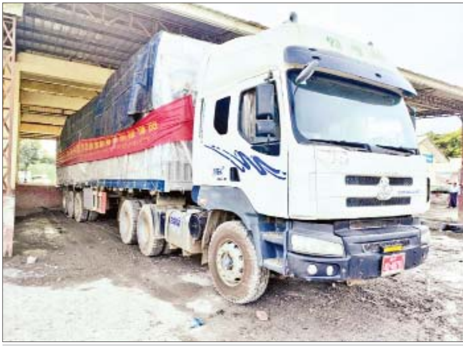
မူဆယ် နယ်စပ်ကုန်သွယ်ရေးစခန်းမှ ကိုဗစ်-၁၉ ရောဂါ ကာကွယ်ရေး အထောက်အကူပြုပစ္စည်းများ တင်သွင်းလာသည့်ယာဉ်အား တွေ့ရစဉ်။

နေပြည်တော် ဩဂုတ် ၂၁ စီးပွားရေးနှင့် ကူးသန်းရောင်းဝယ်ရေးဝန်ကြီးဌာန အနေဖြင့် ကိုဗစ်-၁၉ ရောဂါ ကာကွယ်၊ ထိန်းချုပ်၊ ကုသရေးဆိုင်ရာပစ္စည်းများကို ပြည်ပမှ တင်သွင်းရာ တွင် နှောင့်နှေးကြန့်ကြာမှုမရှိစေရေးအတွက် အများ ပြည်သူ့ရုံးပိတ်ရက်များတွင်လည်း ပိတ်ရက်မရှိ စီစဉ်ဆောင်ရွက်ပေးလျက်ရှိရာ ယနေ့တွင် ရန်ကုန် အပြည်ပြည်ဆိုင်ရာလေဆိပ်မှ အိမ်သုံးအောက်ဆီဂျင် စက် ၆၀၆ ခု၊ တစ်ကိုယ်ရည်သုံး ကာကွယ်ရေးဝတ်စုံ ၅၀၀ နှင့် ဆိပ်ကမ်းများမှ အောက်ဆီဂျင်(အရည်) အိုး ၁၂ တန်၊ အောက်ဆီဂျင်(အိုးခွဲ) ၁၄၄၀၊ Oxygen (အရည်) Storage Container/Tank တစ်ခု၊ လုပ်ငန်းသုံးအောက်ဆီဂျင်စက် တစ်လုံးအပါအဝင် မူဆယ်၊ ချင်းရွှေဟော်၊ မြဝတီ၊ ထီးခီး၊ ကန်ပိုက်တီ ကုန်သွယ်ရေးစခန်းများမှ အောက်ဆီဂျင်(အရည်) Bowser ယာဉ် နှစ်စီးဖြင့် ၃၉ တန်၊ အောက်ဆီဂျင် (အရည်) အိုးဖြင့် ၃၆ တန်၊ Oxygen(အရည်) Storage Container/Tank တစ်ခု၊ အောက်ဆီဂျင်(အိုးခွဲ) ၆၉၀၃ ခု၊ အောက်ဆီဂျင် Plant ခုနှစ်ခု၊ လုပ်ငန်းသုံး အောက်ဆီဂျင်စက် ခြောက်ခု၊ အိမ်သုံးအောက်ဆီဂျင် စက် ၁၁၁၃ ခု၊ Test Kit ၂၄၀၀၀၊ တစ်ကိုယ်ရည်သုံး ကာကွယ်ရေး ဝတ်စုံ ၁၁၂၅၀၀၊ လက်အိတ် ၁၃ တန် နှင့် နှာခေါင်းစည်း ၆၇ တန် တင်သွင်းနိုင်ခဲ့သည်။ အထက်ပါပစ္စည်းများအား ကုမ္ပဏီ ၂၉ ခုမှ ယာဉ်စီးရေ ၅၄ စီးဖြင့် တင်သွင်းခဲ့ခြင်းဖြစ်သည်။