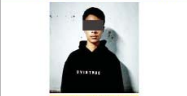
ထွန်စစ်မှူးလွင် (ခ) ထွန်စစ်