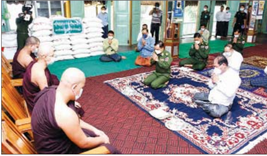
စစ်တွေ ဩဂုတ် ၂၁

ရခိုင်ပြည်နယ်ဝန်ကြီးချုပ် ဒေါက်တာ အောင်ကျော် မင်းသည် အနောက်ပိုင်းတိုင်းစစ်ဌာနချုပ် တိုင်းမှူး ဗိုလ်ချုပ်ထင်လတ်ဦးနှင့် တာဝန်ရှိသူများလိုက်ပါ လျက် ယနေ့နံနက်ပိုင်းက စစ်တွေမြို့ပေါ်ရှိ ဘုန်းတော်ကြီးကျောင်းများသို့ သွားရောက်၍ ဆွမ်းဆန်တော်၊ ဆီနှင့် လှူဖွယ်ဝတ္ထုပစ္စည်းများ ဆက်ကပ်လှူဒါန်းကြသည်။