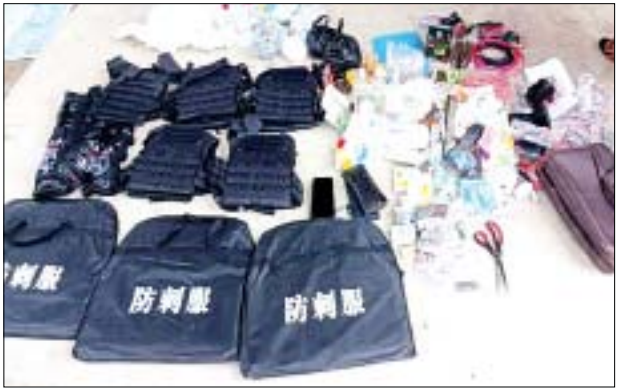
ချမ်းမြသာစည်မြို့နယ် ထွန်းတုံးရပ်ကွက်ရှိ နေအိမ်တွင် သိမ်းဆည်းရမိသည့် လက်လုပ်မိုင်းနှင့် ဆက်စပ်ပစ္စည်းများ မှတ်တမ်းဓာတ်ပုံ။

အဖွဲ့နှင့် ချိတ်ဆက်၍ လက်လုပ်မိုင်း အလုံး ၈၀ ကို မှာယူပြီး ဖောက်ခွဲရေး ဆောင်ရွက်ရန်အတွက် ပြန်လည်ဖြန့်ခွဲပေးခြင်းတို့ကို ပြုလုပ်ရာတွင် ပါဝင်ခဲ့ကြောင်း၊ ဝါဝါထက်သည် တိမ်းရှောင်လျက်ရှိသည့် နွယ်နီလှိုင်နှင့် အတူ ဧပြီလတတိယပတ်အတွင်း အောင်မြေသာစံမြို့နယ် ကညန ရုံးရှေ့ ဗုံးပေါက်ကွဲမှုဖြစ်စဉ်၌ ၎င်းတို့ကိုယ်တိုင် ဗုံးဖောက်ခွဲရန် ပြုလုပ် စဉ် ပေါက်ကွဲခဲ့ပြီး ဒဏ်ရာရရှိခဲ့ခြင်းဖြစ်ကြောင်း ဖော်ထုတ်သိရှိရသည်။