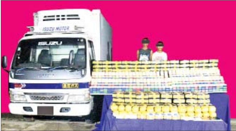
ဝေမင်းဟန်နှင့် ငြိမ်းချမ်းတို့ကို သိမ်းဆည်းရမိသည့် မူးယစ်ဆေးဝါးများနှင့်အတူ တွေ့ရစဉ်။

နေပြည်တော် ဩဂုတ် ၂၁ ရှမ်းပြည်နယ်(မြောက်ပိုင်း) နောင်ချိုမြို့နယ် တွင် ငွေကျပ် သိန်း ၂၉၀၀ ကျော် တန်ဖိုးရှိ မူးယစ်ဆေးဝါးများ သိမ်းဆည်းရမိခဲ့ကြောင်း သိရသည်။