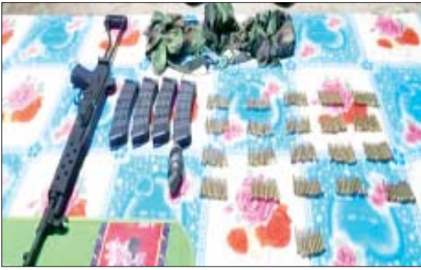
မဟာအောင်မြေမြို့နယ်သာသနာပိုင်ကျောင်းတိုက်အေးချမ်းသာ ကျောင်းတွင် လက်နက်/ခဲယမ်းများ သိမ်းဆည်းရမိသည့် မှတ်တမ်း ဓာတ်ပုံ။