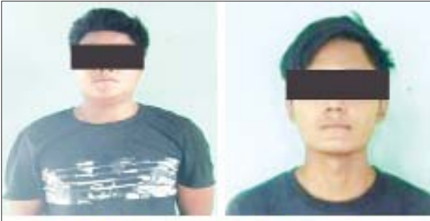
စိုးပြည့်အောင်၊ စိုလ်စိုလ်မြင့်သူ(ခ) စိုလ်စိုလ်