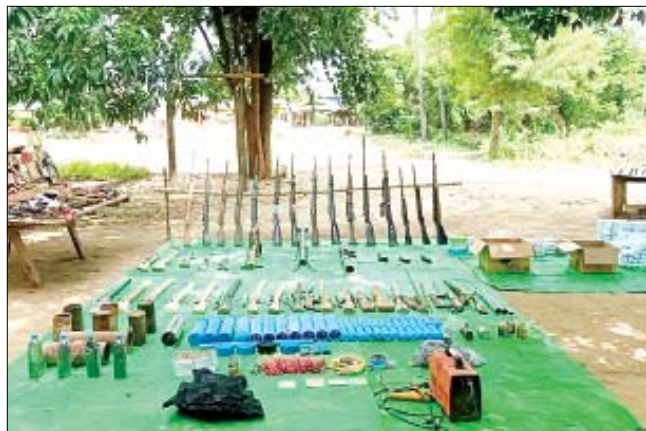
သိမ်းဆည်းရမိသည့် လက်လုပ်သေနတ်များ၊ လက်လုပ်မိုင်းများနှင့် ဆက်စပ်ပစ္စည်းများ၏ မှတ်တမ်းဓာတ်ပုံ။