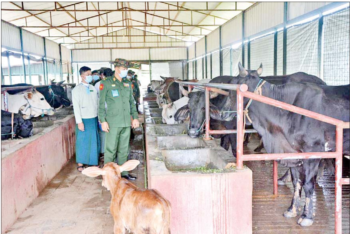
အရှေ့မြောက်တိုင်းစစ်ဌာနချုပ် တိုင်းမှူး ဗိုလ်ချုပ်နိုင်နိုင်ဦးနှင့် တာဝန်ရှိသူများ လားရှိုးမြို့ ကုန်းမြင့်(၁) စိုက်ပျိုးရေးနှင့် မွေးမြူရေးစံပြစခန်းအတွင်း ကြည့်ရှုစစ်ဆေးစဉ်။

ကိုဗစ်-၁၉ ရောဂါ တတိယလှိုင်းဖြစ်ပွားမှု ကြောင့် ရောဂါကာကွယ်၊ ထိန်းချုပ်၊ ကုသရေးလုပ်ငန်းများ ဆောင်ရွက်နေချိန် တွင် ဒေသတွင်းစားနပ်ရိက္ခာဖူလုံရေး နှင့် ပြည်သူများ၏ စားသောက်ရေးကို အထောက်အကူ ဖြစ်စေရန်အတွက် တိုင်းစစ်ဌာနချုပ် နယ်မြေအသီးသီးရှိ အစိုးရ၊ တပ်မတော်နှင့် ပုဂ္ဂလိကပိုင် စိုက်ပျိုးမွေးမြူရေးနှင့် အခြားလူသုံးကုန် လုပ်ငန်းများ ကုန်ထုတ်လုပ်မှု ရာနှုန်းပြည့် ထုတ်လုပ်နိုင်ရေး ဆောင်ရွက်လျက်ရှိရာ တိုင်းဒေသကြီးနှင့် ပြည်နယ်အသီးသီးမှ ဝန်ကြီးချုပ်များ၊ တိုင်းမှူးများနှင့် တာဝန်ရှိသူများက အဆိုပါနေရာများသို့ သွားရောက်ကြည့်ရှုကြပြီး လိုအပ်သည် များ ဖြည့်ဆည်းဆောင်ရွက်ပေးလျက် ရှိသည်။