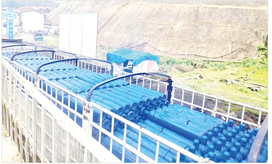
ကန်ပိုက်တီးကုန်သွယ်ရေးစခန်းမှ အောက်ဆီဂျင်အိုးများ တင်သွင်းလာမှုကို တွေ့ရစဉ်။

နေပြည်တော် ဩဂုတ် ၁၀ လတ်တလော နိုင်ငံတစ်ဝန်း၌ ကိုဗစ်-၁၉ ရောဂါ တတ်ယလှိုင်း ကူးစက်ဖြစ်ပွားမှုများဖြစ်ပေါ်လျက် ရှိရာ ကိုဗစ်-၁၉ ရောဂါ ကာကွယ်၊ ထိန်းချုပ်၊ ကုသ ရေးလုပ်ငန်းများအတွက် အောက်ဆီဂျင်၊ ဆေးဝါးနှင့် ဆက်စပ်ပစ္စည်းများ အရေးပေါ်လိုအပ်မှုမှာလည်း မြင့်တက်လျက်ရှိပြီး စီးပွားရေးနှင့် ကူးသန်းရောင်း ဝယ်ရေးဝန်ကြီးဌာနအနေဖြင့် အဆိုပါပစ္စည်းများကို အပြည်ပြည်ဆိုင်ရာလေဆိပ်၊ ပင်လယ်ရေကြောင်း ဆိပ်ကမ်းများနှင့် နယ်စပ်ကုန်သွယ်ရေးစခန်းများမှ နှောင့်နှေးကြန့်ကြာမှုမရှိ လွယ်ကူလျင်မြန်စွာ တင်သွင်းနိုင်ရေးအတွက် ဆက်စပ်ဝန်ကြီးဌာနများ နှင့် ထိထိရောက်ရောက် ပေါင်းစပ်ညှိနှိုင်းဆောင်ရွက် ပေးလျက်ရှိပြီး သက်ဆိုင်ရာဌာနများမှ ထုတ်ပြန်ထား သည့် အသိပေးကြေညာချက်များ၊ တာဝန်ရှိသူများ ညှိနှိုင်းထားသည့် SOP များနှင့်အညီ လွယ်ကူမြန်ဆန် နိုင်ရေးအတွက် ပူးပေါင်းဆောင်ရွက်ပေးလျက်ရှိသည်။