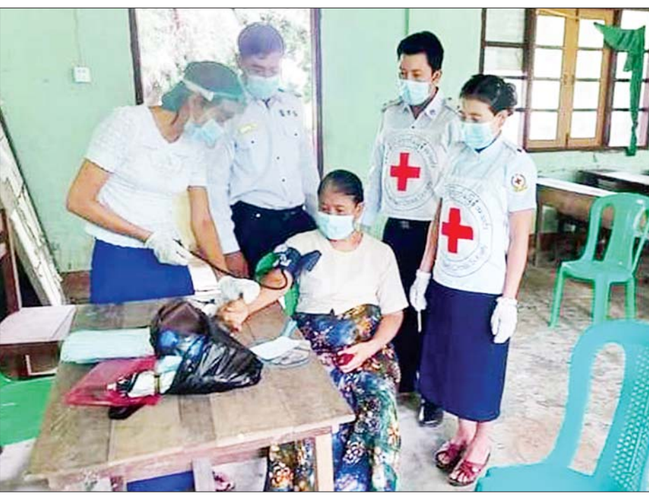
ကျောက်တော်မြို့နယ်၌ ကိုဗစ်-၁၉ ရောဂါ ကာကွယ်ဆေး လာရောက်ထိုးနှံသူတစ်ဦးကို သွေးပေါင်ချိန် တိုင်းပေးစဉ်။

၂၁ ရာစု နေထိုင်မှုပုံစံကို ရောက်ရှိလာတဲ့အခါ လူတွေက မြို့ပြကြီးတွေမှာ စုစည်းနေထိုင် ရတယ်။ အစားအသောက်ဆိုရင်လည်း အရသာ ရှိအောင် သကြားတွေ၊ ဆီတွေ၊ ဆားတွေ၊ ဟင်းချို မှုန့်တွေ အများကြီးပါဝင်တဲ့ အသင့်စား အစား အသောက်တွေကို စားသောက်ရတယ်။ ကိုယ် လက် လှုပ်ရှားမှုတွေလည်း နည်းပါးသွားပါတယ်။ ဒီလိုအခြေအနေမျိုးတွေကြောင့် တစ်ဖက်က မကူး