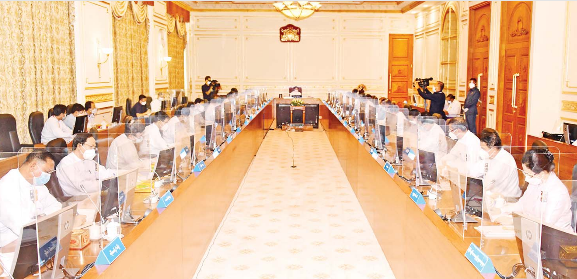
နိုင်ငံတော်စီမံအုပ်ချုပ်ရေးကောင်စီဥက္ကဋ္ဌ၊ နိုင်ငံတော်ဝန်ကြီးချုပ် ဗိုလ်ချုပ်မှူးကြီး မင်းအောင်လှိုင် ပြည်ထောင်စုသမ္မတမြန်မာနိုင်ငံတော် အိမ်စောင့်အစိုးရအဖွဲ့ အစည်းအဝေးအမှတ်စဉ် (၁/၂၀၂၁) တွင် အမှာစကားပြောကြားစဉ်။

နေပြည်တော်၊ ဩဂုတ် ၁၀ ပြည်ထောင်စုသမ္မတမြန်မာနိုင်ငံတော် အိမ်စောင့်အစိုးရအဖွဲ့ အစည်း အဝေး အမှတ်စဉ်(၁/၂၀၂၁)ကို ယနေ့မွန်းလွဲပိုင်းတွင် နေပြည်တော်ရှိ နိုင်ငံတော်စီမံအုပ်ချုပ်ရေးကောင်စီဥက္ကဋ္ဌရုံး အစည်းအဝေးခန်းမ၌ ကျင်းပရာ နိုင်ငံတော်စီမံအုပ်ချုပ်ရေးကောင်စီဥက္ကဋ္ဌ၊ ပြည်ထောင်စု သမ္မတ မြန်မာနိုင်ငံတော် အိမ်စောင့်အစိုးရ နိုင်ငံတော်ဝန်ကြီးချုပ် ဗိုလ်ချုပ်မှူးကြီး မင်းအောင်လှိုင် တက်ရောက်အမှာစကားပြောကြား သည်။ အစည်းအဝေးသို့ နိုင်ငံတော်စီမံအုပ်ချုပ်ရေးကောင်စီဒုတိယဥက္ကဋ္ဌ၊ ဒုတိယ ဝန်ကြီးချုပ် ဒုတိယဗိုလ်ချုပ်မှူးကြီးစိုးဝင်း၊ ပြည်ထောင်စုဝန်ကြီး များဖြစ်ကြသည့် ဗိုလ်ချုပ်ကြီးမြထွန်းဦး၊ ဒုတိယဗိုလ်ချုပ်ကြီးစိုးထွန်း၊ ဦးဝဏ္ဏမောင်လွင်၊ စာမျက်နှာ ၃ ကော်လံ ၁ သို့ ၀