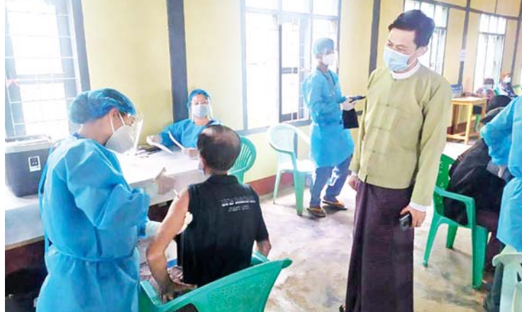
ကောပီအရ်

၈ ရက်မှ ၁၀ ရက်အထိ ထိုးနှံပေးခဲ့ကြခြင်းဖြစ်ပြီး အသက် ၆၅ နှစ်နှင့်အထက်များ၊ အစိုးရကျန်းမာရေးဝန်ထမ်းများ၊ ပရဟိတအဖွဲ့ဝင်များ၊ သံဃာတော်/ သီလရှင်/ သာသနာ့ ဝန်ထမ်းများ၊ နိုင်ငံ့ဝန်ထမ်းများ၊ ဟိုတယ်/မိုတယ်/တည်းခိုရေး နှင့်အစားအသောက်ဝန်ဆောင်မှုလုပ်ငန်းဆောင်ရွက်သူများ၊ အကျဉ်း/အချုပ်သားများနှင့် ဈေးဝယ်စင်တာများမှ အရောင်း ဝန်ထမ်းများအား ထိုးနှံပေးခဲ့ကြောင်း သိရသည်။