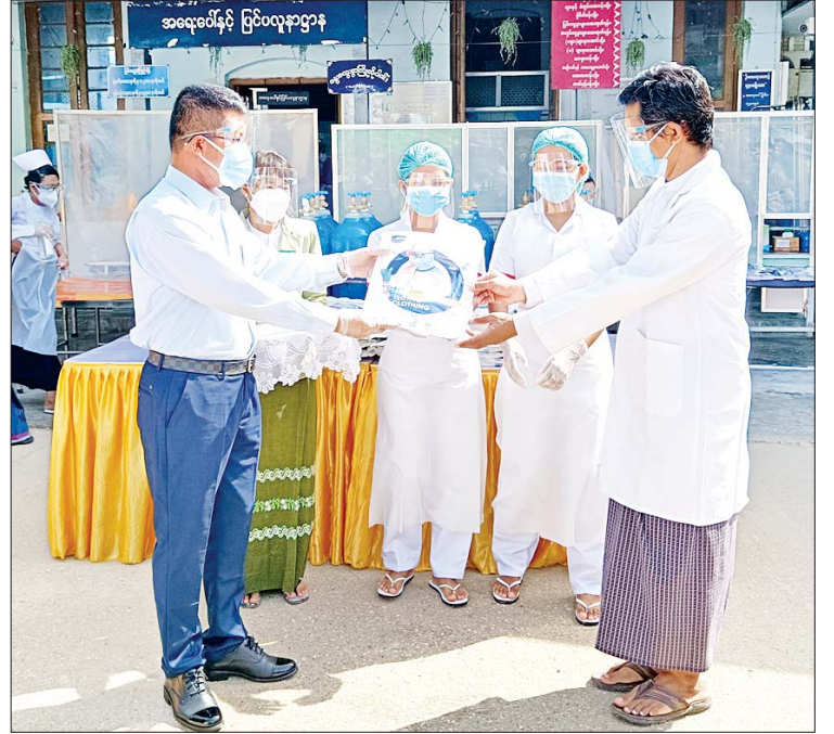
၁၉ ရောဂါကာကွယ်ဆေးထိုးလုပ်ငန်းသို့ ပြောကြားကြောင်း သိရသည်။ သွားရောက်ကြည့်ရှုခဲ့ပြီး ကာကွယ်ဆေးလာရောက်ထိုးနှံသူများကိုအားပေးစကား

ထို့နောက် အမှတ်(၁)အခြေခံပညာ အထက်တန်းကျောင်းရှိ စုရပ်(၁) ကိုဗစ်-