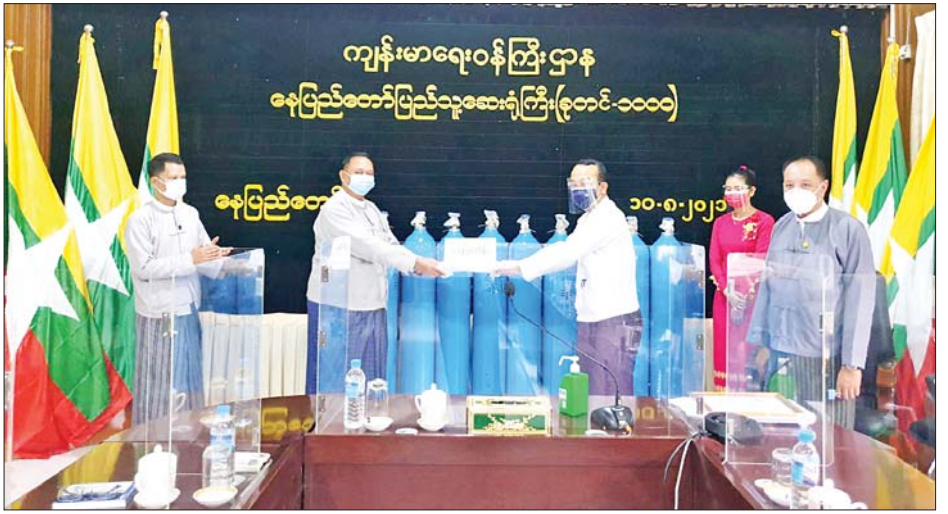
အလှူငွေကျပ် ၁၂၅ သိန်း ပေးအပ်လှူဒါန်းရာ ရယူပြီး ဂုဏ်ပြုမှတ်တမ်းလွှာ ပြန်လည်ပေးအပ် ကြောင်း သိရသည်။ သတင်းစဉ်

တက်ရောက် အဆိုပါအခမ်းအနားသို့ ဆောက်လုပ်ရေးဝန်ကြီး ဌာန ပြည်ထောင်စုဝန်ကြီး ဦးရွှေလေးနှင့် တာဝန်ရှိသူ များ၊ ကျန်းမာရေးဝန်ကြီးဌာန ကုသရေးဦးစီးဌာန ညွှန်ကြားရေးမှူးချုပ်၊ နေပြည်တော် ပြည်သူ့ဆေးရုံ ကြီး(ခုတင်-၁၀၀၀) ဆေးရုံအုပ်ကြီးနှင့် တာဝန်ရှိသူ များ တက်ရောက်ခဲ့ကြသည်။ ဂုဏ်ပြုမှတ်တမ်းလွှာ ပေးအပ် အခမ်းအနားတွင် ဆောက်လုပ်ရေးဝန်ကြီးဌာန ပြည်ထောင်စုဝန်ကြီးက အဖွင့်အမှာစကားပြောကြား ပြီး Oxygen Cylinder (40 Liter ) အိုး ၆၀ နှင့်