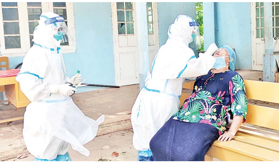
ကျောက်မဲမြို့နယ်၌ ကိုဗစ်-၁၉ ရောဂါပိုး ရှိ/မရှိ RDT Test Kit ဖြင့် စစ်ဆေးပေးနေစဉ်။ မိုင်းထွန်း(ပြန်/ဆက်)

အခုဖြစ်ပွားနေတဲ့ ကိုဗစ်-၁၉ မိုင်းရပ်စ်ရဲ့ ဗီဇပြောင်းပွားမှုကဲ့သို့ အသစ် ဒယ်လီတာ (Delta) မျိုးကွဲဟာ ယခင်မိုင်းရပ်စ်မျိုးကွဲတွေဖြစ်တဲ့ အယ်လ်ဖာ/ဘီတာ (Alpha/Beta) တို့ထက် ကူးစက်မှု ပြင်းထန်မှု၊ သေဆုံးမှုတွေ ပိုမြင့်နေတယ်လို့ လေ့လာချက်တွေအရ သိရှိရပါတယ်။ ၎င်းမျိုးကွဲဟာဆိုရင် ပုံတူမျိုးပွားနိုင်စွမ်း အလွန်မြန်တယ်။ ခန္ဓာကိုယ်ခုခံစွမ်းအားကို ကျော်လွှားသွားနိုင်တယ်။ ကမ္ဘာ့ကျန်းမာရေးအဖွဲ့ကြီးကတော့ ဒယ်လီတာမျိုးကွဲကို အလျင်မြန်ဆုံးနဲ့ အကြံခိုင်ဆုံးမျိုးကွဲ “fastest and fittest” variant လို့ဆိုပါတယ်။ ကိုဗစ်-၁၉ ရောဂါပြန့်ပွားမှုကို အကောင်းဆုံးထိန်းချုပ်နိုင်ဖို့ကတော့ နှာခေါင်းစည်းတပ်ဆင်တာအပါအဝင် ကျန်းမာရေးဝန်ကြီးဌာနက ထုတ်ပြန်ထားတဲ့ ကိုဗစ်-၁၉ ရောဂါပြန့်ပွားမှုထိန်းချုပ်ရေးဆိုင်ရာ လမ်းညွှန်ချက်တွေကို လိုက်နာကြဖို့ လိုအပ်ပါတယ်။ ဒါ့အပြင် မိမိမှာ ရောဂါပိုး ရှိ/မရှိ စောစောစစ်ဆေးဖို့လည်း လိုအပ်သလို အဲဒီလိုစောစောစစ်ဆေးမှုသာလျှင်လည်း စောစောဆေးကုသမှုခံယူနိုင်မှာဖြစ်ပြီး ရောဂါပြင်းထန်စွာခံစားရတာ၊ အသက်ဆုံးရှုံးရတာတွေကနေ ကာကွယ်နိုင်မှာဖြစ်ပါတယ်။