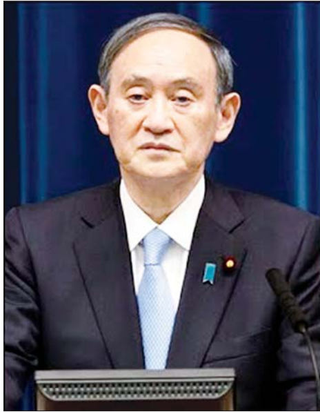
ဂျပန်ဝန်ကြီးချုပ် ဆူဂါ

ကိုးကား- အင်န်အိတ်ချ်ကော့ဘာသာပြန်- အလင်းသစ်