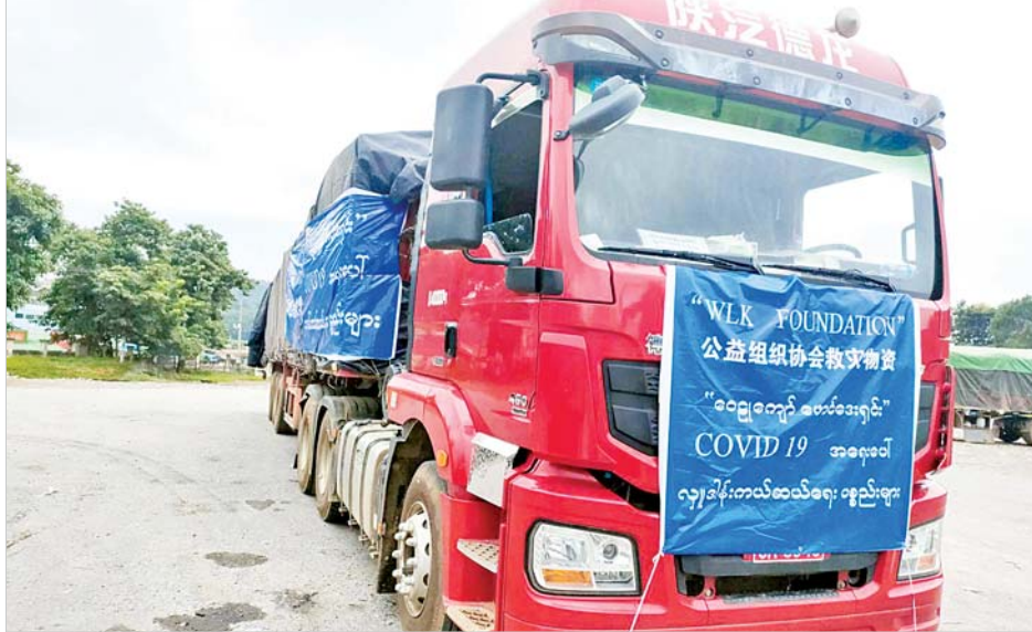
မူဆယ်နယ်စပ်ကုန်သွယ်ရေးစခန်းမှ ကိုဗစ်-၁၉ ရောဂါ ကာကွယ်၊ ထိန်းချုပ်၊ ကုသရေးဆိုင်ရာပစ္စည်းများ တင်သွင်းလာသည့်ယာဉ်ကို တွေ့ရစဉ်။