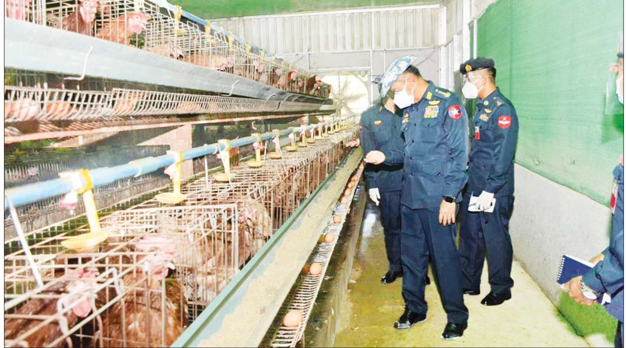
ခြံ၊ ဆိတ်မွေးမြူရေးခြံ၊ DYL ဝက်မွေးမြူရေးခြံ၊ Green House စိုက်ပျိုးမွေးမြူရေးခြံများကို လိုက်လံကြည့်ရှုရာ တာဝန်ခံအသီးသီးက ရှင်းလင်းဖြေကြားပြီး ကာကွယ်ရေးဦးစီးချုပ်(လေ)က လိုအပ်သည်များ ဖြည့်စွက်မှာကြားခဲ့ကြောင်း သတင်းရရှိသည်။ သတင်းစဉ်

နေပြည်တော် ဩဂုတ် ၁၀ နိုင်ငံတော်စီမံအုပ်ချုပ်ရေးကောင်စီဝင်၊ ကာကွယ်ရေးဦးစီးချုပ်(လေ) ဗိုလ်ချုပ်ကြီးမောင်မောင်ကျော်သည် ယနေ့ မွန်းလွဲပိုင်းတွင် မကွေးလေတပ်စခန်းဌာနချုပ်ရှိ အရာရှိ၊ စစ်သည်၊ မိသားစုဝင်များကို မကွေးလေတပ်စခန်းဌာနချုပ်၌ တွေ့ဆုံအားပေးစကားပြောကြားရာ မကွေးလေတပ်စခန်းဌာနချုပ် ဌာနချုပ်မှူး၊ အရာရှိ၊ စစ်သည်၊ မိသားစုဝင်များနှင့် တာဝန်ရှိသူများ တက်ရောက်ကြသည်။ ရှင်းလင်းပြောကြား ဦးစွာ ကာကွယ်ရေးဦးစီးချုပ်(လေ)က လက်ရှိနိုင်ငံတွင် ဖြစ်ပေါ်လျက်ရှိသည့် ကိုဗစ်-၁၉ ရောဂါအခြေအနေများ၊ ကိုဗစ်-၁၉ ရောဂါ ကာကွယ်ရေးဆိုင်ရာ ထုတ်ပြန်ထားသည့် စည်းကမ်းများ၊ လမ်းညွှန်ချက်များ၊ နိုင်ငံရေးကိစ္စရပ်များ၊ လုံခြုံရေးကိစ္စရပ်များ၊ သဘာဝဘေးအန္တရာယ်ဆိုင်ရာကိစ္စများနှင့်ပတ်သက်၍ ရှင်းလင်းပြောကြားပြီး မိသားစုဝင်များကို အားပေးစကားပြောကြားနှုတ်ဆက်သည်။ လိုက်လံစစ်ဆေး ထို့နောက် ကာကွယ်ရေးဦးစီးချုပ်(လေ)နှင့် တာဝန်ရှိသူများသည် မကွေးလေတပ်စခန်းဌာနချုပ်ရှိ တပ်မတော်လေယာဉ်နှင့် လေယာဉ်ရုံများကို လိုက်လံစစ်ဆေးသည်။ ဖြည့်စွက်မှာကြား ဆက်လက်၍ မိသားစုဝင်များအား ထောက်ပံ့နိုင်ရေးအတွက် စိုက်ပျိုးမွေးမြူထားသည့် ဥစားကြက်ခြံ၊ အသားတိုးကြက်ခြံ၊ နို့စားနွား