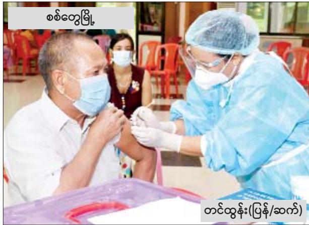
စစ်တွေမြို့