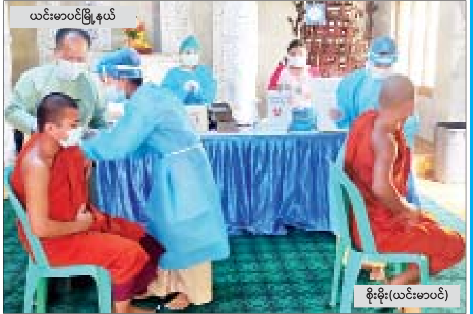
ယင်းမာပင်မြို့နယ်