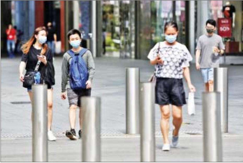
ကြောင်း သိရသည်။ ထို့အပြင် စင်ကာပူအစိုးရသည် ဒယ်လ်တာ ဗီဇပြောင်းကိုရိုနာဗိုင်းရပ်စ်ကြောင့် နိုင်ငံအတွင်း

စင်ကာပူ ဩဂုတ် ၇ စင်ကာပူအစိုးရက ကိုဗစ်-၁၉ ရောဂါကာကွယ်ဆေး နှစ်ကြိမ် အပြည့်အဝထိုးနှံမှု ခံယူခဲ့ပြီးသူများအား စားသောက်ဆိုင်များ၌ ဆိုင်ထိုင်စားသောက်ခွင့်ဆိုင်ရာ ကန့်သတ်ချက်များကို ဩဂုတ် ၁၀ ရက်မှစ၍ ဖြေလျှော့ပေးမည်ဖြစ်ကြောင်း ပြောကြားသည်။