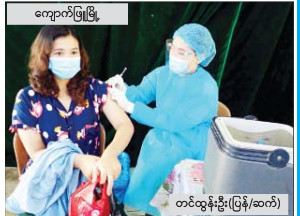
ကျောက်ဖြူမြို့