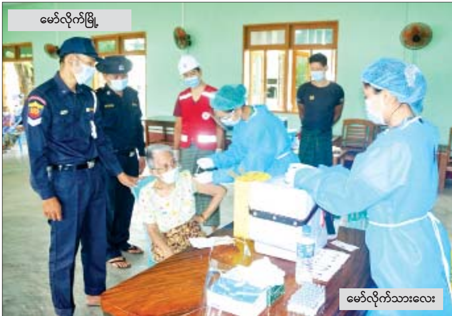
မော်လိုက်မြို့