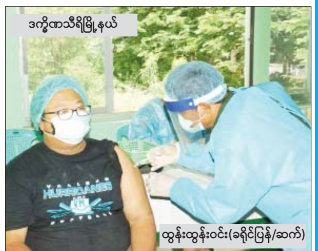
ဒက္ခိဏသီရိမြို့နယ်