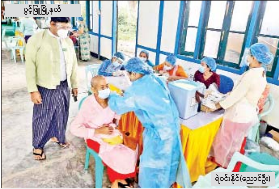
ပွင့်ဖြူမြို့နယ်