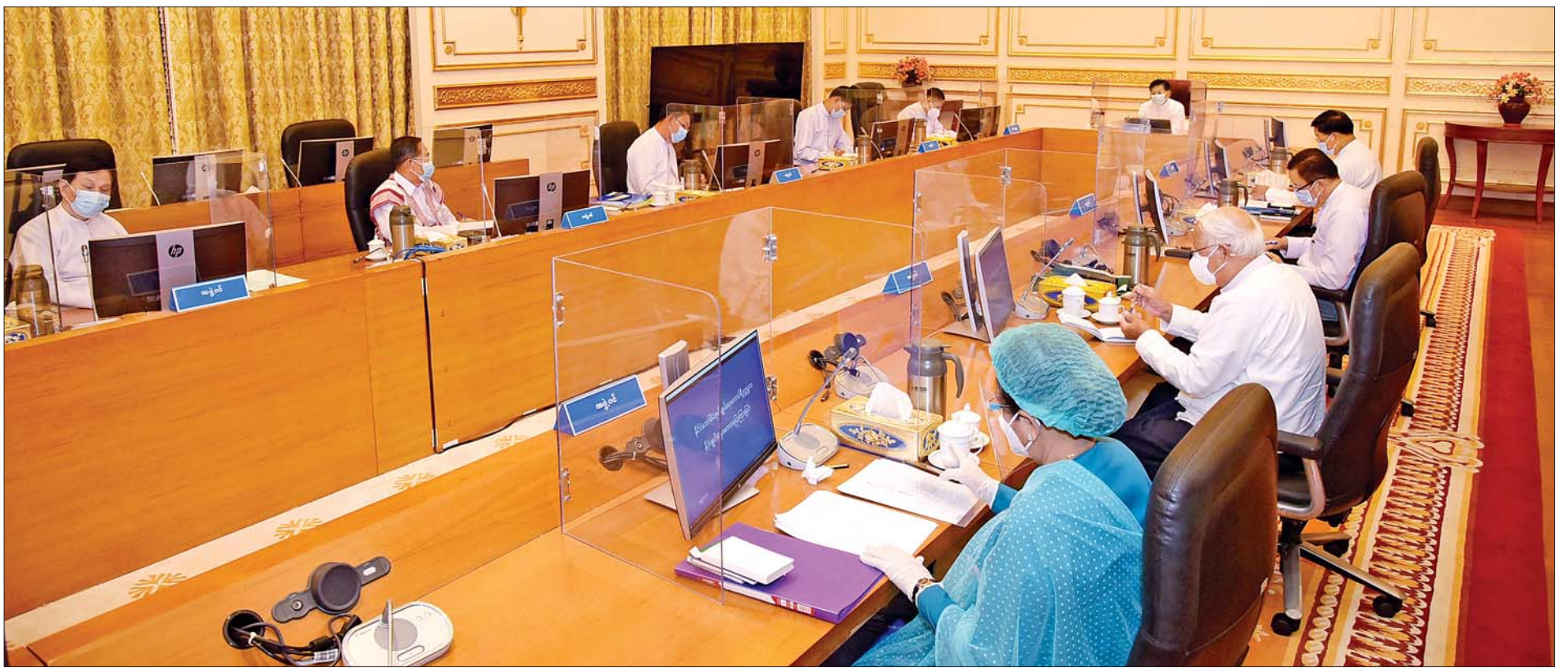
နိုင်ငံတော်စီမံအုပ်ချုပ်ရေးကောင်စီဥက္ကဋ္ဌ၊ နိုင်ငံတော်ဝန်ကြီးချုပ် ဗိုလ်ချုပ်မှူးကြီးမင်းအောင်လှိုင် နိုင်ငံတော်စီမံအုပ်ချုပ်ရေးကောင်စီအစည်းအဝေးတွင် အမှာစကားပြောကြားစဉ်။

ယခုအချိန်သည် အာဆီယံ၏အောင်မြင်မှုများနှင့် ယနေ့မိမိတို့ မြင်တွေ့နေရသည့် အာဆီယံအသင်းကြီးအဖြစ်သို့ ရောက်ရှိအောင် မည်သို့ဖြတ်သန်းခဲ့ရသည်ဆိုသည်ကို မိမိတို့အနေဖြင့် သတိချပ်ရမည့် အချိန်အခါကောင်းဖြစ်ပါသည်။ နိုင်ငံ (၅) နိုင်ငံဖြင့် ဖွဲ့စည်းခဲ့သည့် “အသင်းအဖွဲ့” တစ်ခုအဖြစ်မှ ယနေ့အာဆီယံသည် အဖွဲ့ဝင်(၁၀)နိုင်ငံလုံး အပြည့်အဝပါဝင်သည့် စာမျက်နှာ ၃ ကော်လံ ၁ သို့ *