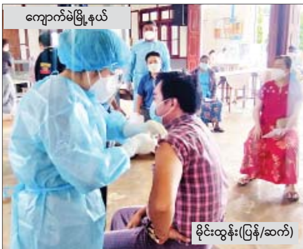
ကျောက်မဲမြို့နယ်