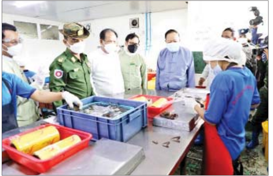
ရခိုင်ပြည်နယ်ဝန်ကြီးချုပ် ဒေါက်တာအောင်ကျော်မင်းနှင့် တာဝန်ရှိသူများ ပုဏ္ဏားကျွန်းမြို့နယ်ရှိ ကဏန်းပျောမွေးမြူရေးလုပ်ငန်းကုမ္ပဏီ၏ လုပ်ငန်းဆောင်ရွက်နေမှုများကို ကြည့်ရှုစစ်ဆေးစဉ်။

လုပ်ငန်း ဆောင်ရွက်နေမှုများကိုလည်းကောင်း၊ ချင်းပြည်နယ်ဝန်ကြီးချုပ် ဦးဌန့်ဆန်းအောင်၊ အနောက်မြောက်တိုင်းစစ်ဌာနချုပ် ဒုတိယတိုင်းမှူး ဗိုလ်မှူးချုပ် မျိုးထွဋ်လှိုင်နှင့် တာဝန်ရှိသူများသည် ဟားခါးမြို့ စိုက်ပျိုးရေးဦးစီးဌာန ကျောဘုတ် ဥယျာဉ်ခြံ (ပြည်ထောင်စုခြံ) သို့လည်းကောင်း၊ မန္တလေးတိုင်းဒေသကြီးဝန်ကြီးချုပ် ဦးမောင်ကို၊ အလယ်ပိုင်းတိုင်းစစ်ဌာနချုပ်တိုင်းမှူး ဗိုလ်ချုပ် ကိုကိုဦးနှင့် တာဝန်ရှိသူများသည် အမရပူရမြို့နယ် တမုတ်စိုးကျေးရွာရှိ စိုက်ပျိုးရေးဦးစီးဌာနမှ မိုးစပါး ဧက ၁၀၀ စံပြစိုက်ကွက်တွင် တစ်ဧက တင်း ၁၀၀ ထွက်ရှိရေး ဆောင်ရွက်နေမှုကိုလည်းကောင်း သွားရောက်ကြည့်ရှု၍ တာဝန်ရှိသူများနှင့်တွေ့ဆုံပြီး ကုန်ထုတ်လုပ်မှုလုပ်ငန်းများ ရာနှုန်းပြည့်ဆောင်ရွက် နိုင်ရေး လိုအပ်သည်များ ပေါင်းစပ်ညှိနှိုင်းဆောင်ရွက် ပေးသည်။ ထို့ပြင်တောင်သူများကို စိုက်ပျိုးရေး အထောက်အကူပြုပစ္စည်းများ ထောက်ပံ့ပေးအပ် ခဲ့ကြောင်း သိရသည်။ သတင်းစဉ်