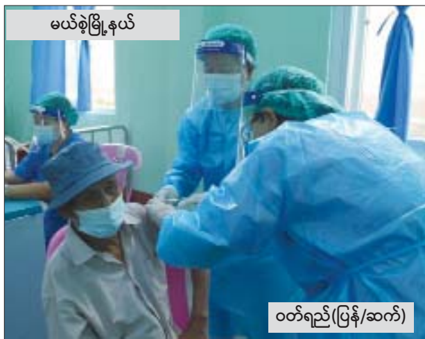
မယ်စွဲမြို့နယ်