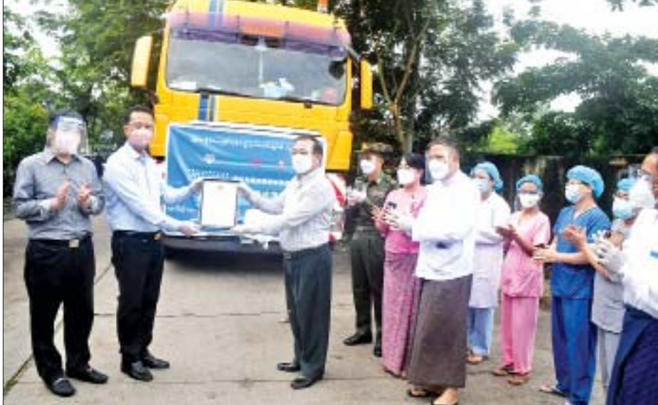
တရုတ်ပြည်သူ့သမ္မတနိုင်ငံ ယူနန်ပြည်နယ် လူမှုကူညီရေးအသင်းနှင့် ယူနန်ပြည်နယ်ပြည်သူများက အောက်ဆီဂျင်အရည်များ ပေးအပ်လှူဒါန်း

လက်ရှိအခြေအနေအရ ကိုဗစ်-၁၉ ရောဂါ ကူးစက်ပြန့်ပွားမှုကို ဆက်လက်ဟန့်တားထိန်းချုပ်ရန် လိုအပ်သည့်အတွက် အခြေခံပညာကျောင်းများ (ပုဂ္ဂလိကကျောင်း၊ ဘုန်းတော်ကြီးသင် ပညာရေး ကျောင်းများအပါအဝင်)အား ၉-၈-၂၀၂၁ ရက်နေ့မှ ၁၅-၈-၂၀၂၁ ရက်နေ့အထိ ရက်သတ္တ(၁)ပတ် ဆက်လက်၍ ယာယီပိတ်ထားမည်ဖြစ်ကြောင်း အသိပေးကြေညာအပ်ပါသည်။