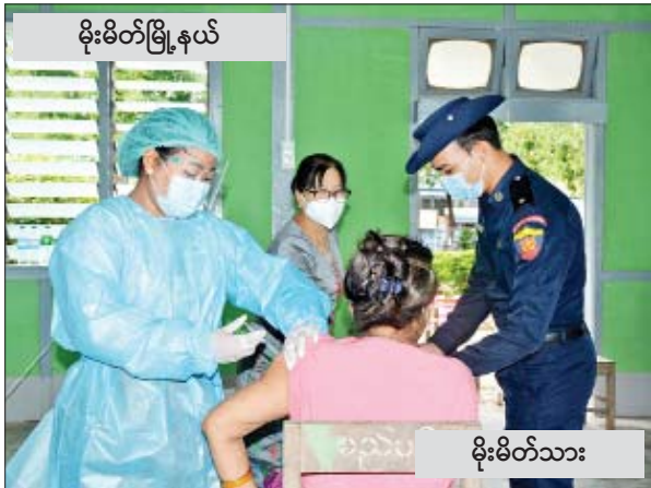
မိုးမိတ်မြို့နယ်