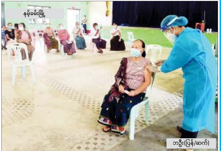
နမ့်ခမ်းမြို့