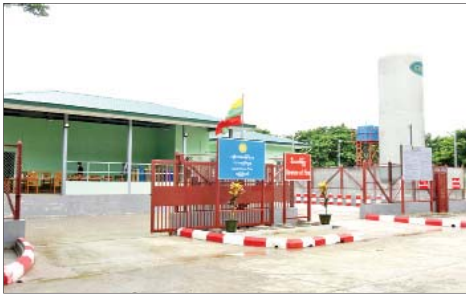
နေပြည်တော်ပြည်သူ့ဆေးရုံကြီး ခုတင်-၃၀၀ ရှိ အောက်ဆီဂျင်ထုတ်လုပ်သည့်စက်ရုံ (Liquid Oxygen Plant) (နေပြည်တော်)ကို တွေ့ရစဉ်။

၂၃-၇-၂၀၂၁ ရက်နေ့တွင် ကိုဗစ်-၁၉ ရောဂါ ကာကွယ်၊ ထိန်းချုပ်၊ ကုသရေးဆိုင်ရာ ညှိနှိုင်းအစည်းအဝေး၌ ပြောကြားသည့် အမှာစကားမှ ကောက်နုတ်ချက်)