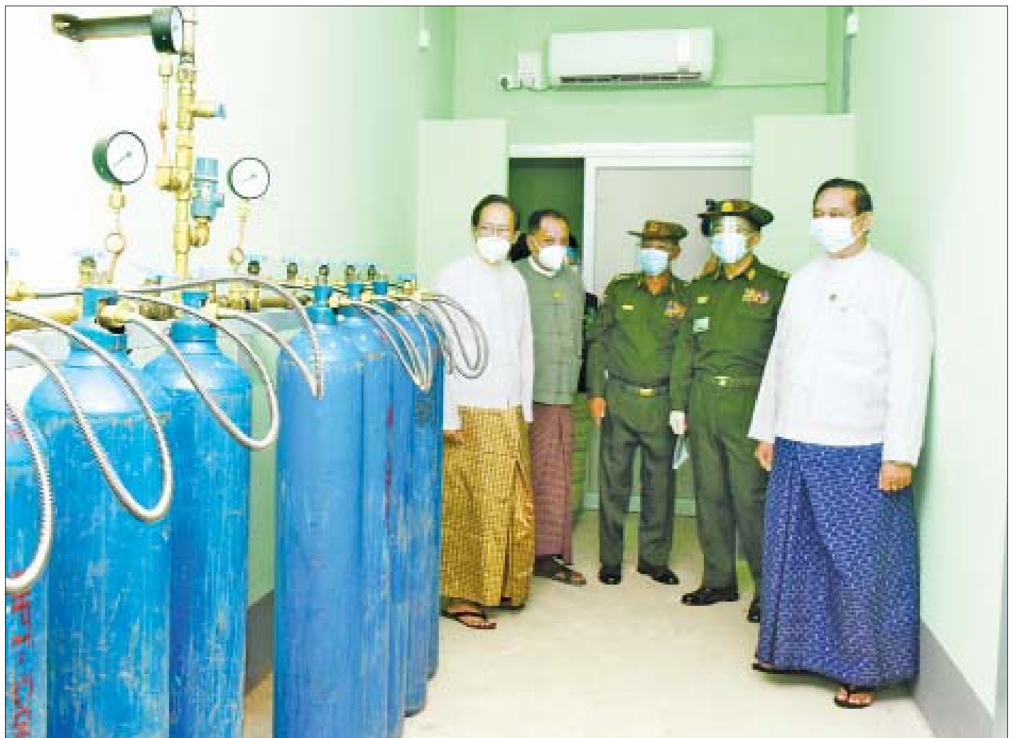
ကျန်းမာရေးဝန်ကြီးဌာန ပြည်ထောင်စုဝန်ကြီး ဒေါက်တာသက်ခိုင်ဝင်း၊ ဆောက်လုပ်ရေးဝန်ကြီးဌာန ပြည်ထောင်စုဝန်ကြီး ဦးရွှေလေး၊ နေပြည်တော် တိုင်းစစ်ဌာနချုပ် တိုင်းမှူး ဗိုလ်ချုပ်ဇော်မျိုးတင်၊ နေပြည်တော်ကောင်စီဝင် ဗိုလ်မှူးကြီးမင်းနောင်နှင့် တာဝန်ရှိသူများ နေပြည်တော် ပြည်သူ့ဆေးရုံကြီး ခုတင်(၃၀၀)ရှိ အောက်ဆီဂျင်ထုတ်လုပ်သည့်စက်ရုံအတွင်း အောက်ဆီဂျင်ထုတ်လုပ်နေမှုကို ကြည့်ရှုစစ်ဆေးစဉ်။