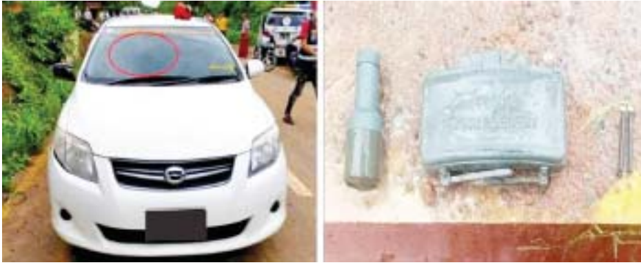
မွန်ပြည်နယ် ကျိုက်ထိုမြို့နယ်၌ ကြီးဆွဲခိုင်းပေါက်ကွဲမှု မှတ်တမ်းဓာတ်ပုံ။

သွားရောက်စစ်ဆေး ထိုသို့ လုပ်ဆောင်လျက်ရှိရာ မွန်းလွဲ ၁၂ နာရီခွဲခန့်တွင် မွန်