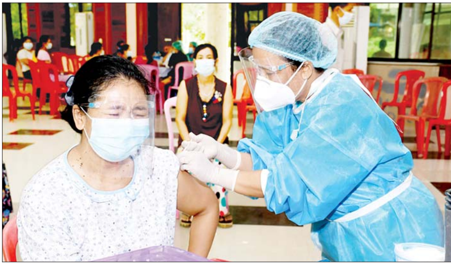
စစ်တွေမြို့၌ ကိုဗစ်-၁၉ ရောဂါ ကာကွယ်ဆေးထိုးနှံပေးစဉ်။