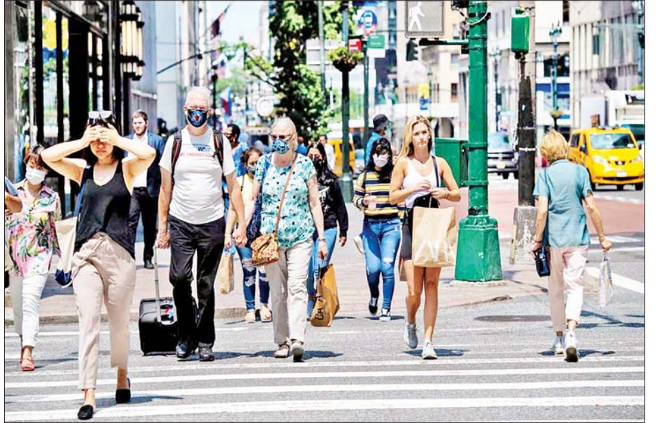
သည့်အတွက် ကာကွယ်ဆေးထိုးနှံပြီးသူများအနေဖြင့် အဆိုပါစင်တာက တိုက်တွန်းထားသည်။ လည်း အများပြည်သူနှင့်သက်ဆိုင်သော နေရာများ၌ ကိုးကား - ဆင်ဟွာ နှာခေါင်းစည်းများ တပ်ဆင်ထားရန် လိုအပ်ကြောင်း ဘာသာပြန် - အောင်ကျော်ကျော်

ဒယ်လီတားဗီယွမ်ပြည်နယ်သည် ယခင် ကိုရိုနာဗိုင်းရပ်စ်ထက် ကူးစက်မှုနှုန်းပိုမြန်ဆန်