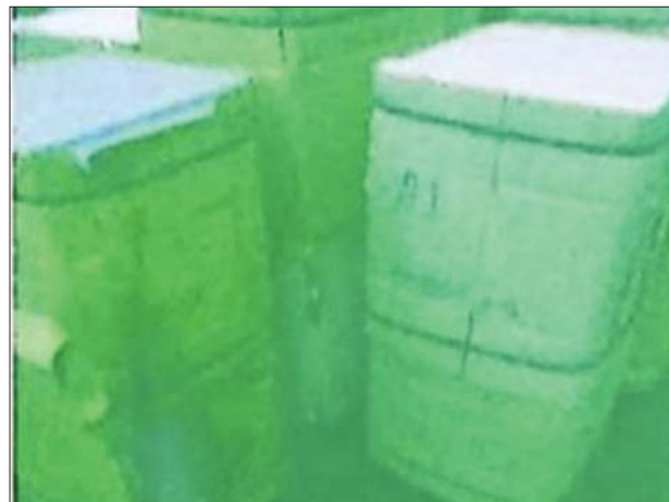
တရားဝင် စာရွက်စာတမ်း တစ်စုံတစ်ရာတင်ပြနိုင်ခြင်းမရှိသော ရေခဲသေတ္တာ (Used)။

နေပြည်တော် ဩဂုတ် ၁ တရားမဝင်ကုန်စည်များ တားဆီးထိန်းချုပ်ရေးအတွက် ရေပူနှင့် မရမ်းချောင်အမြဲစခန်းတို့အား ဌာနဆိုင်ရာပူးပေါင်းအဖွဲ့များဖြင့် ၂၀၁၇ ခုနှစ် မတ် ၁ ရက်တွင် စတင်ဖွင့်လှစ်ခဲ့ပြီး ဇူလိုင် ၃၁ ရက်တွင် မန္တလေး- မူဆယ် ပြည်ထောင်စုလမ်းကြီးတစ်လျှောက် ကုန်သွယ်မှုယာဉ်ပို့ကုန် ၁၀၅ စီး၊ သွင်းကုန် ၂၃ စီး၊ ရန်ကုန်-မြဝတီလမ်းကြီးတစ်လျှောက် ကုန်သွယ်မှုယာဉ် သွင်းကုန် အစီး ၄၀ ကုန်စည်များ သယ်ယူပို့ဆောင် လျက်ရှိသည်။ အဆိုပါစစ်ဆေးရေးစခန်းများက တင်သွင်း/တင်ပို့သော ကုန်ပစ္စည်း များအား စစ်ဆေးမှုများ ပြုလုပ်ဆောင်ရွက်လျက်ရှိရာ ဇူလိုင် ၃၁ ရက်တွင် မရမ်းချောင်အမြဲစခန်းစစ်ဆေးရေးစခန်းမှတားဆီးမှု တစ်စုံ ခန့်မှန်းတန်ဖိုးငွေကျပ် သုည ဒသမ ၄၀၀ သန်းတန်ဖိုးရှိ တရားဝင် စာရွက်စာတမ်း တစ်စုံတစ်ရာ တင်ပြနိုင်ခြင်းမရှိသော ရေခဲသေတ္တာ (Used) (10 U) အား ဖမ်းဆီးရမိခဲ့ကြောင်း သိရသည်။ သတင်းစဉ်