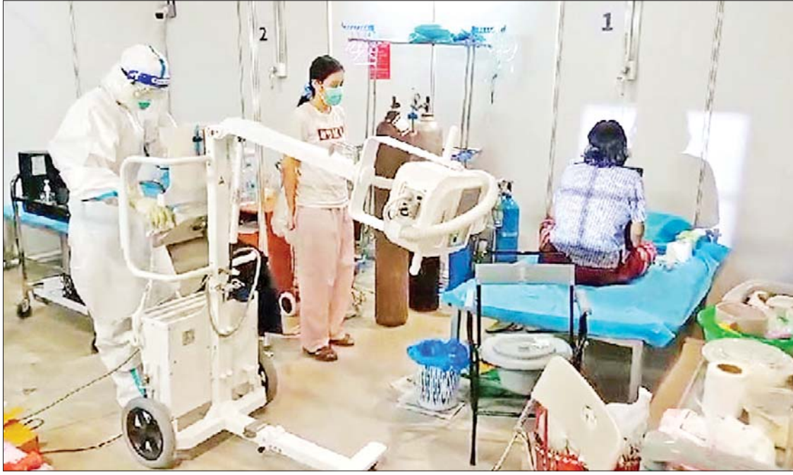
ရန်ကုန်မြို့ အင်းလျားစင်တာ၌ ကိုဗစ်-၁၉ ရောဂါပိုးတွေ့လူနာများအား စစ်ဆေးကုသပေးလျက်ရှိစဉ်။

မြန်မာနိုင်ငံတွင်မူ ကိုဗစ်-၁၉ ဗီဇပြောင်းပိုင်းရပ်စ် ကူးစက်လာသည့် အခါတွင်လည်း ဝိသမလောဘသား တို့သည် ဗီဇပြောင်းလဲပါ။ အားဖြည့် အစားအစာတစ်ခုဖြစ်သော ကြက်ဥ များကို တစ်လုံးလျှင် ငွေကျပ် ၂၅၀