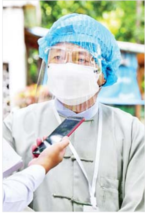
ဦးမြင့်ဆောင်