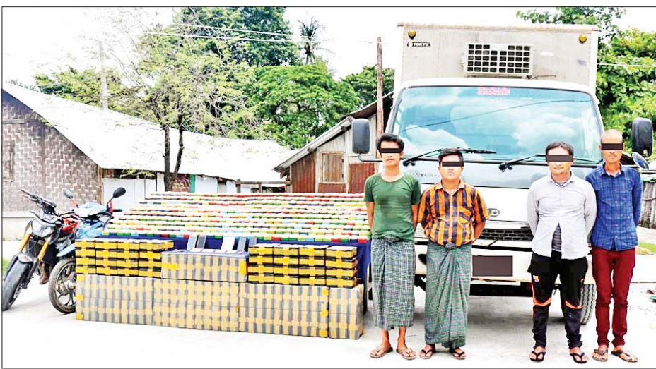
ပြစ်မှုကျူးလွန်သူများအား သိမ်းဆည်းရမိသည့် ဘိန်းဖြူများနှင့်အတူ တွေ့ရစဉ်။

၀၆ ကိုလို သိမ်းဆည်းရမိခဲ့သဖြင့် ကျူးလွန်သူများအား ဆက်လက် ပစ်မှတ်ထားပြီး ကွန်တိန်နာ မှူးယစ်ဆေးဝါးနှင့် စိတ်ကို စစ်ဆေးဖော်ထုတ်လျက် ရှိကြောင်း သိရသည်။ သတင်းစဉ်