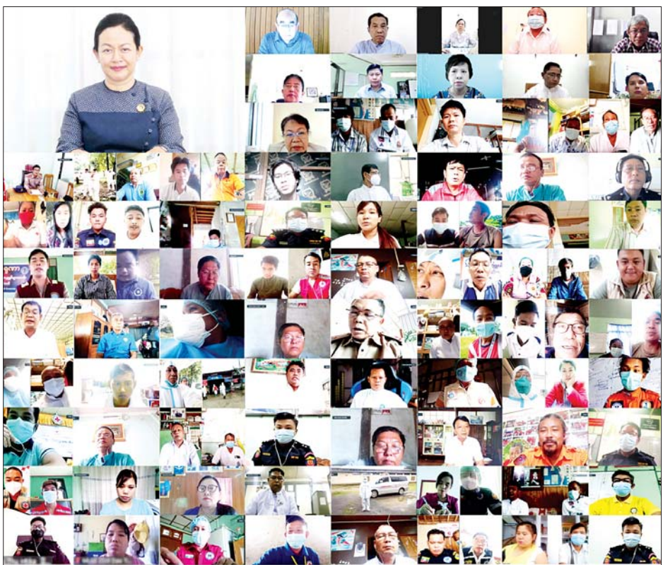
ပေးရန်လိုအပ်ချက်များကို တင်ပြဆွေးနွေးခဲ့ကြပြီး ပြည်ထောင်စုဝန်ကြီးက နိဂုံးချုပ်အမှာစကားပြော ကြားခဲ့ကြောင်း သိရသည်။ သတင်းစဉ်

ပိုမိုကူးစက်မှုမြန်ပြီး ပိုမိုပြင်းထန်သဖြင့် ယခင်က အသက်(၆၀)ကျော်များသာ သေဆုံးမှုများရှိခဲ့ သော်လည်း ယခုအခါ ကျန်းမာသန်စွမ်းသူများပင် သေဆုံးမှုများ ရှိနေပါကြောင်း၊ တတိယလှိုင်းတွင် ထူးခြားချက်အနေဖြင့် ဆရာဝန်၊ သူနာပြုအင်အား မလုံလောက်မှုများလည်း ကြုံတွေ့နေရပါကြောင်း၊ ယခုတတိယလှိုင်း ဖြစ်ပွားသည့်ကာလတွင် အောက်ဆီဂျင်လိုအပ်ချက်ပြဿနာ ထပ်တိုး ရင်ဆိုင် လာရသည့်အတွက် နိုင်ငံတော်မှ ဝယ်ယူပံ့ပိုးပေး လျက်ရှိပါကြောင်း၊ ယခုနိုင်ငံတော်မှ ကာကွယ်ဆေး ကို အရှိန်အဟုန်ဖြင့် ထိုးနှံရေး စီစဉ်ဆောင်ရွက်လျက် ရှိပါကြောင်း၊ ပြည်သူလူထု၏ ကျန်းမာရေးကို ပါဝင်ကူညီရာတွင် သက်ဆိုင်ရာ မြို့နယ်များအလိုက် နိုင်ငံတော်မှ ဖွဲ့စည်းထားသည့် ထိန်းချုပ်တုံ့ပြန်အဖွဲ့ များနှင့် ပူးပေါင်းဆောင်ရွက်သွားကြရန် မှာကြား လိုပါကြောင်း ပြောကြားသည်။ ယင်းနေ့က ဒုတိယဝန်ကြီး ဦးအောင်ထွန်းခိုင် က အမှာစကားပြောကြားသည်။ တင်ပြဆွေးနွေး ဆက်လက်၍ တက်ရောက်လာကြသည့် တိုင်းဒေသကြီး၊ ပြည်နယ်(၈)ခုမှ စေတနာ့ဝန်ထမ်း များနှင့် ပရဟိတအဖွဲ့အစည်း ကိုယ်စားလှယ်များက ဒေသအလိုက် ကြုံတွေ့နေရသည့် အခက်အခဲ၊ ပံ့ပိုး