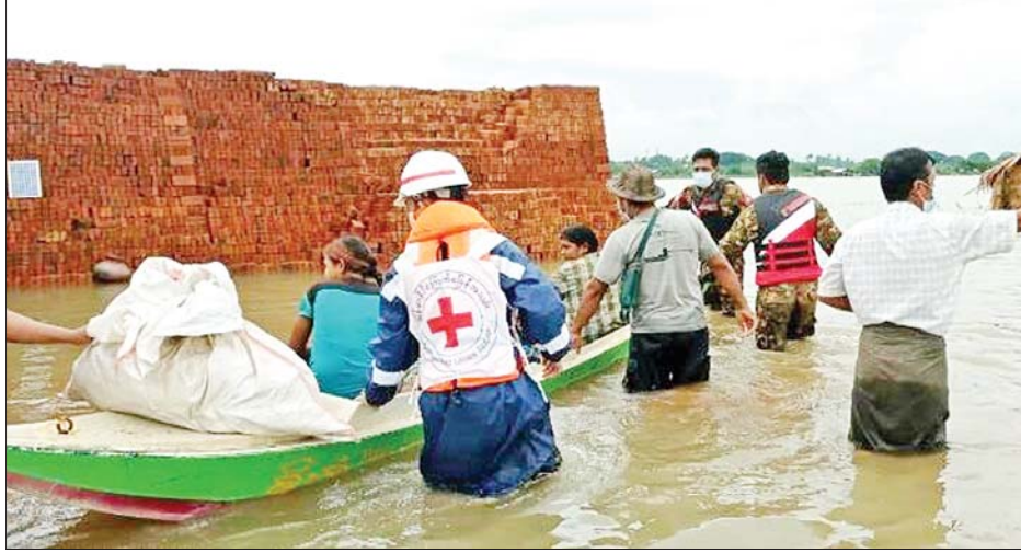
သထုံမြို့နယ် ဒူးရင်းဆိပ်ကျေးရွာမှ ရေဘေးသင့်ပြည်သူများကို ကယ်ဆယ်ရေးလုပ်ငန်းများ ဆောင်ရွက်နေစဉ်။

နေပြည်တော် ဇူလိုင် ၂၈ မုန်ပြည်နယ်နှင့် ကရင်ပြည်နယ်အတွင်း ဇူလိုင် ၂၅ ရက်မှစ၍ မိုးသည်းထန်စွာရွာသွန်းပြီး တောင်ကျ ရေများ ကျဆင်းလာမှုကြောင့် မြို့နယ်အချို့၌ အများပြည်သူ အသုံးပြုသော ကားလမ်းများနှင့် ကျေးရွာအဝင်များတွင် ရေကျော်ဝင်ရောက်မှုများ ဖြစ်ပေါ်လျက်ရှိရာ အရှေ့တောင်တိုင်းစစ်ဌာနချုပ်မှ နယ်မြေခံတပ်မတော်သားများနှင့် ဌာနဆိုင်ရာများက လိုအပ်သည့် ကူညီကယ်ဆယ်ရေးလုပ်ငန်းများ သွားရောက်ဆောင်ရွက်ပေးလျက်ရှိသည်။