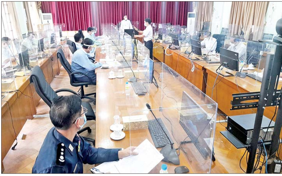
များ အချိန်မီရောက်ရှိရေး ဆောင်ရွက်ပေးကြရန် လိုကြောင်း၊ ဖွဲ့စည်းထားသော ကော်မတီများ အနေဖြင့် အချိတ်အဆက်မိမိ ပေါင်းစပ်လုပ်ကိုင်ရန် လိုကြောင်းနှင့် မိမိတို့ တိုင်းဒေသကြီးစီမံအုပ်ချုပ်ရေး ကောင်စီကလည်း လိုအပ်ချက်များအား အတတ် နိုင်ဆုံး ဖြည့်ဆည်းပေးမည်ဖြစ်ကြောင်း ပြောကြား

တိုင်းဒေသကြီးစီမံအုပ်ချုပ်ရေးကောင်စီဥက္ကဋ္ဌ ဦးရဲမြင့်က သဘာဝဘေး ကိစ္စရပ်များ ရုတ်တရက် ဖြစ်ပေါ်လာပါက ကြိုတင်ကာကွယ်နိုင်ရေး ဆောင်ရွက်နိုင်ကြရန် အစည်းအဝေးကျင်းပခြင်း ဖြစ်ကြောင်း၊ သဘာဝဘေး ဖြစ်ပေါ်လာပါကပြည်သူ များ၏ အသက်အိုးအိမ်စည်းစိမ်များ အတတ်နိုင်ဆုံး ဆုံးရှုံးမှုမရှိစေရေး ကြိုတင်ဆောင်ရွက်ထားကြရန် လိုကြောင်း၊ ပြည်သူများထံသို့ သတင်းအချက် အလက်များ မှန်ကန်မြန်ဆန်စွာ ရောက်ရှိရေး ဆောင်ရွက်ပေးကြရန်လိုကြောင်း၊ ဖြစ်ပေါ်လာပါက ပြည်သူများသို့ စားနပ်ရိက္ခာစသည့် ထောက်ပံ့ပစ္စည်း