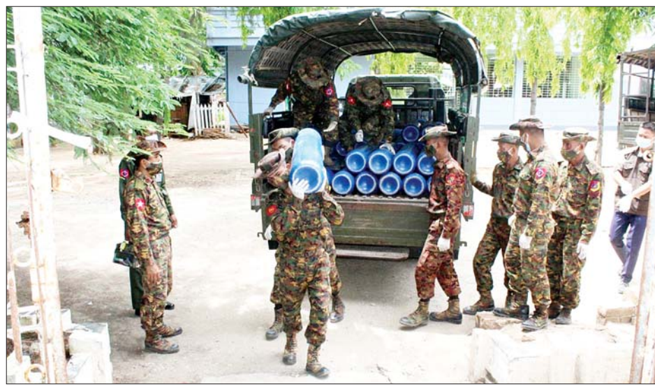
ပြည်သူ့ဆေးရုံများနှင့် ပရဟိတအသင်းများသို့ အောက်ဆီဂျင်အိုး လီတာ ၄၀ ဆဲ့ ၉၉ လုံးတို့ကို အနောက်တောင်တိုင်းစစ်ဌာနချုပ်မှ နယ်မြေခံ

နေပြည်တော် ဇူလိုင် ၂၈ ကိုဗစ်-၁၉ ရောဂါဓာတ်ခွဲအတည်ပြု ပိုးတွေ့လူနာ များနှင့် သီးသန့်စောင့်ကြည့်ရမည့်သူများကို ကုသရေးလုပ်ငန်းများ ဆောင်ရွက်ရာတွင် အောက်ဆီဂျင် လိုအပ်ချက်များကို တစ်ဖက် တစ်လမ်းမှ အထောက်အကူပြုစေရန်အတွက် တပ်မတော်နှင့် အလှူရှင်များက အောက်ဆီဂျင် အိုးများကို တိုင်းဒေသကြီးနှင့် ပြည်နယ်အသီးသီးရှိ ပြည်သူ့ဆေးရုံများ၊ တပ်မတော်ဆေးရုံများ၊ ကျန်းမာ ရေးဌာနများနှင့် ကိုဗစ်စင်တာများသို့ ပေးလှူဒါန်း လျက်ရှိသည်။ ထိုသို့ လှူဒါန်းလျက်ရှိရာ ယနေ့တွင် နေပြည်တော်ကောင်စီနယ်မြေ ဇေယျသီရိမြို့နယ် နေပြည်တော်ပြည်သူ့ဆေးရုံကြီး ခုတင် ၁၀၀၀ သို့ အောက်ဆီဂျင်အိုး အလုံး ၅၀ ကို နေပြည်တော် တိုင်းစစ်ဌာနချုပ်မှ နယ်မြေခံတပ်မတော်သားများက လည်းကောင်း၊ ဧရာဝတီတိုင်းဒေသကြီး ပုသိမ်မြို့၊ သာပေါင်းမြို့၊ မအူဝင်မြို့နှင့် ဓနုမြို့များရှိ