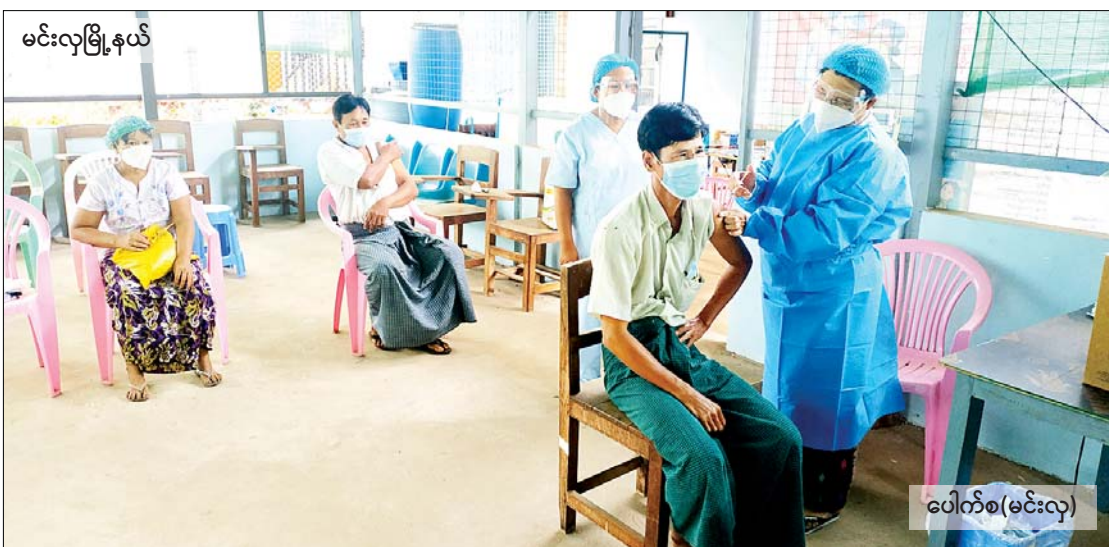
မင်းလှမြို့နယ်