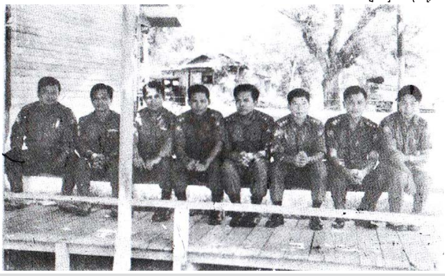
ပဲခူးရိုးမကြီးကို ဦးစီး၍တိုက်ခဲ့ကြသည့် တိုင်းမှူးနှင့်စစ်ဆင်ရေးမှူးကြီး ဗိုလ်မှူးကြီးသန်းတင်၊ တပ်မ(၇၇)တပ်မမှူး/ဒုတိယဆင်ရေးမှူးကြီး ဗိုလ်မှူးကြီး ရန်နောင်စိုး၊ ဒုတိယမှူး ဗိုလ်မှူးကြီး ခင်ကျော်ညို၊ ဒုတိယမှူး ဗိုလ်မှူးကြီး ခင်မောင်တင်၊ ဒုတိယမှူး ဗိုလ်မှူးကြီး ကျော်စိန်ဝင်း၊ (လပခ)ဒုတိုင်းမှူး ဗိုလ်မှူးကြီး စိန်ရ၊ (လပခ)ဗိုလ်မှူးကြီး လှကြည်၊ တပ်မ(၇၇)(XO) ဒုဗိုလ်မှူးကြီး သူရညွန့်တင်တို့အား တွေ့ရစဉ်။