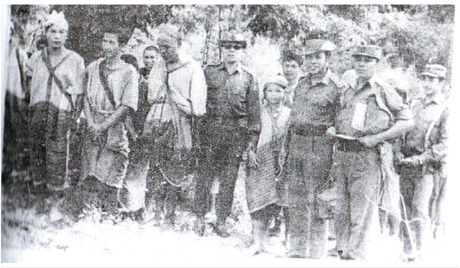
ပဲခူးရိုးမတောင်ပေါ်မှ အလွန်ရိုးသားသည့် ကရင်အမျိုးသားကြီးများက တပ်မတော်၏ “ဖြတ်လေးဖြတ်” နည်းဗျူဟာကို သဘောပေါက်နားလည်ပြီး တပ်မတော်က ပေးထားသည့်တာဝန်များကို လုပ်ဆောင်ပါမည်ဟု သဘောတူစဉ်က မှတ်တမ်းတင်ဓာတ်ပုံရိုက်စဉ်။ (တိုင်းမှူး/စစ်ဆင်ရေးမှူးကြီး ဗိုလ်မှူးကြီး သန်းတင်၊ တပ်မ(၇၇)တပ်မမှူး/ဒုတိယဆင်ရေးမှူးကြီး ဗိုလ်မှူးကြီး ရန်နောင်စိုး၊ ဒုတိယတိုင်းမှူး စစ်ဗျူဟာမှူး ဗိုလ်မှူးကြီး လှကြည်၊ တပ်ရင်းမှူး ဒုတိယဗိုလ်မှူးကြီး ကျော်ငွေ။)