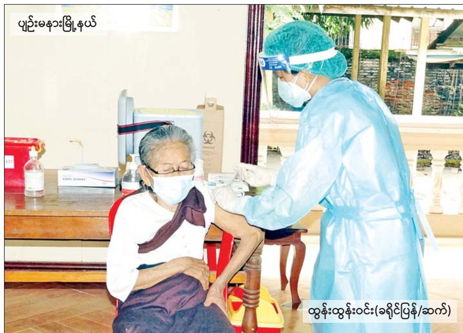
ပျဉ်းမနားမြို့နယ်