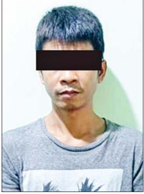
တရားခံ ပြည်သူ