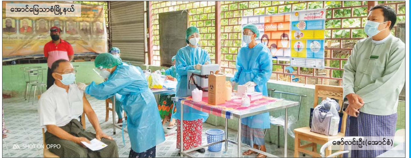
အောင်မြေသာစံမြို့နယ်

နိုင်ငံတစ်ဝန်းနှင့် ဝန်ထမ်းမိသားစုများ၊ အသက် ၆၅ နှစ်နှင့် အထက်ရှိသူများအား ဇူလိုင် ၂၈ ရက်က ကိုဗစ်-၁၉ ရောဂါ ကာကွယ်ဆေး ထိုးနှံပေးလျက်ရှိကြောင်း သိရသည်။ ကာကွယ်ဆေးထိုးခြင်းမပြုမီ လက်သန့်ဆေးရည်ဖြင့် လက်ဆေးစေခြင်း၊ ကိုယ်အပူချိန် တိုင်းတာပေးခြင်း၊ သွေးပေါင်ချိန်တိုင်းတာပေးခြင်း၊ ဆေးမထိုးရအုပ်စု မမှန်/မမှန် စိစစ်ပြီး ကာကွယ်ဆေး ထိုးပြီးလျှင် ဆေးနှင့် ဓာတ်မတည့်ခြင်းနှင့် ဘေးထွက် ဆိုးကျိုးလက္ခဏာများ တစ်စုံတစ်ရာ ဖြစ်ပေါ်လာပါက ချက်ချင်းအရေးပေါ် တုံ့ပြန်နိုင်ရန်အတွက် မိနစ် ၃၀ အကြာ စောင့်ကြပ်ကြည့်ရှုပေးရန် စီစဉ်ဆောင်ရွက် ပေးထားကြောင်း သိရသည်။