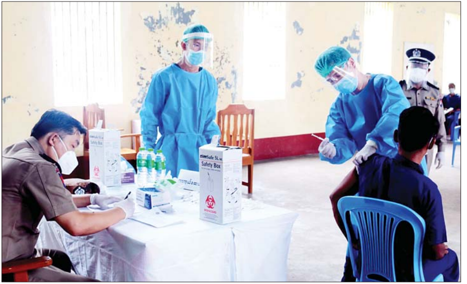
အင်းစိန်ဗဟိုအကျဉ်းထောင်၌ ကိုဗစ်-၁၉ ကာကွယ်ဆေးထိုးနှံပေးနေမှုကို တွေ့ရစဉ်။

ရန်ကုန် ဇူလိုင် ၂၈ လတ်တလော ဖြစ်ပေါ်နေသော ကိုဗစ်-၁၉ ရောဂါ တတိယလှိုင်းကာလတွင် ရောဂါကာကွယ်ထိန်းချုပ် နိုင်ရေးနှင့် ပျံ့နှံ့မှုမရှိစေရေးအတွက် မြန်မာနိုင်ငံ အနေဖြင့် ပြည်ပမှဝယ်ယူရောက်ရှိလာသော ကာကွယ် ဆေးများ စတင်ထိုးနှံမှု ဆောင်ရွက်လျက်ရှိရာ ရန်ကုန်တိုင်းဒေသကြီး အင်းစိန်ဗဟိုအကျဉ်းထောင် အတွင်းရှိ အကျဉ်းသား/အချုပ်သား ၆၁၀ ကို ယနေ့ နံနက်ပိုင်းတွင် စတင်ထိုးနှံပေးခဲ့ကြောင်း အင်းစိန် ဗဟိုအကျဉ်းထောင်မှ သိရသည်။ ကာကွယ်ဆေးထိုးဖို့ ဆန္ဒပြု “ကိုဗစ်-၁၉ ကာကွယ်ဆေးနဲ့ ပတ်သက်လို့ ဒီနေ့ အင်းစိန်ဗဟိုအကျဉ်းထောင်က အကျဉ်းသား တွေကို ပထမဆုံးစတင်ထိုးနှံပေးတာ ဖြစ်ပါတယ်။ အရင်ပထမလှိုင်းနဲ့ ဒုတိယလှိုင်းတုန်းကတော့ မထိုး ဖြစ်ခဲ့ဘူး။ အခုလည်းထောင်အတွင်း အကျဉ်းသား တွေအနေနဲ့ ကိုဗစ်-၁၉ ရောဂါကူးစက်ပြန့်ပွားမှုတော့ မရှိသေးဘူး။ ဒါပေမယ့် ကြိုတင်ကာကွယ်တဲ့အနေနဲ့ ဒီကနေ့ ကနဦးထိုးနှံပေးတာ ဖြစ်ပါတယ်။ အကျဉ်း သား/အချုပ်သား ဆန္ဒပြုတဲ့သူနဲ့ ဆေးထိုးဖို့ အကျိုး ဝင်တဲ့သူအားလုံးကို စာရင်းကောက်ခံပြီး ထိုးနှံပေး သွားမှာပါ။ တချို့ကလည်း ရောဂါအခံ အခြေအနေ တစ်ရပ်ရပ်ကြောင့် မထိုးကြတဲ့ သူတွေလည်းရှိတယ်။ အခုလတ်တလောမှာတော့ ကာကွယ်ဆေးထိုးဖို့ ဆန္ဒပြုထားတဲ့သူ ၂၅၀၀ ကျော်ရှိပါတယ်။ စာရင်းပေး