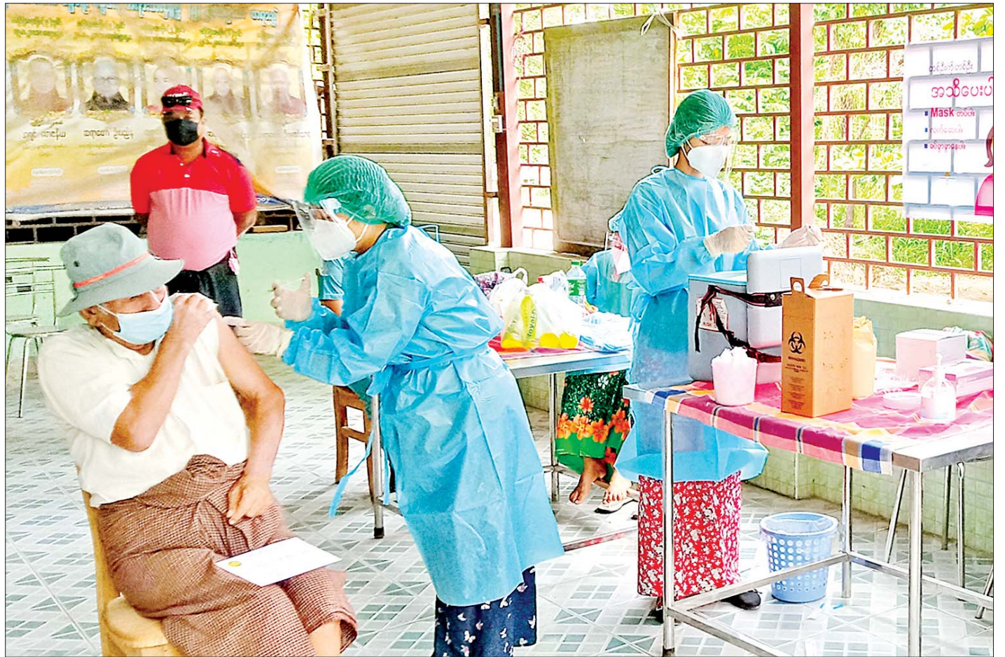
မန္တလေးတိုင်းဒေသကြီး အောင်မြေသာစံမြို့နယ်၌ အသက် ၆၅ နှစ်နှင့်အထက် ပြည်သူများအား ကိုဗစ်-၁၉ ရောဂါကာကွယ်ဆေးထိုးနှံပေးစဉ်။