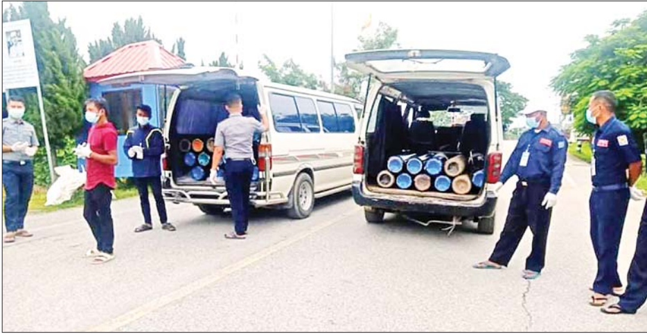
တာချီလိတ်ကုန်သွယ်ရေးစခန်းမှ အောက်ဆီဂျင်အိုးများကို တင်သွင်းလာစဉ်။

နေပြည်တော် ဇူလိုင် ၂၈ စီးပွားရေးနှင့် ကူးသန်းရောင်းဝယ်ရေးဝန်ကြီးဌာနအနေဖြင့် ကိုဗစ်-၁၉ ရောဂါ ကာကွယ်၊ ထိန်းချုပ်၊ ကုသရေးဆိုင်ရာ ဆေးဝါးနှင့် ဆက်စပ်ပစ္စည်းများ ပြည်ပမှ တင်သွင်းခွင့် သွင်းကုန်လိုင်စင် လျှောက်ထားခြင်းကို ယာယီ ကင်းလွတ်ခွင့်ပြုပေးခြင်းနှင့် နယ်စပ်ဒေသများမှ တင်သွင်းရာ တွင် လွယ်ကူအဆင်ပြေစေရေး အတွက် နယ်စပ်ကုန်သွယ်ရေး စခန်းများ ရုံးပိတ်ရက်မရှိ ဖွင့်လှစ်၍ ဆောင်ရွက်ပေးလျက်ရှိသည့် အပြင် ပုံမှန်အွန်လိုင်းစနစ်ဖြင့် ဆောင်ရွက်လျက်ရှိသည့် အခြား ကုန်စည်များအတွက် အများ ပြည်သူ အလုပ်ပိတ်ရက်ရည်ဖြစ် သည့် ဇူလိုင် ၂၆ ရက်မှ ဩဂုတ် ၁ ရက်အထိ ပို့ကုန်သွင်းကုန် လိုင်စင် လျှောက်ထားမှုများကို ကုန်သွယ်ရေးဦးစီးဌာန (ရုံးချုပ်) ပို့ကုန်သွင်းကုန်လုပ်ငန်း ဌာနခွဲနှင့် ပို့ကုန်သွင်းကုန်ရုံး (ရန်ကုန်)တို့မှ အွန်လိုင်းစနစ်ဖြင့် ခွင့်ပြု ဆောင်ရွက်ပေးလျက်ရှိရာ ဇူလိုင် ၂၆ ရက်မှ ၂၈ ရက်အထိ ပို့ကုန် လိုင်စင် အစောင် ၂၀ (တန်ဖိုး အမေရိကန်ဒေါ်လာ ၄၅၆ သန်း) နှင့် ဆေးနှင့်ဆေးပစ္စည်းအတွက် သွင်းကုန်လိုင်စင် ၅၆ စောင် (တန်ဖိုး အမေရိကန်ဒေါ်လာ ခြောက်သန်း) အပါအဝင် သွင်းကုန် လိုင်စင် ၂၇၇ စောင် (တန်ဖိုး အမေရိကန်ဒေါ်လာ ၃၁၈ သန်း) ခွင့်ပြု ထုတ်ပေးထားပြီးဖြစ်