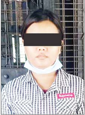
တရားခံ သိန်းသိန်းအိ(ခ)ကုလားမ