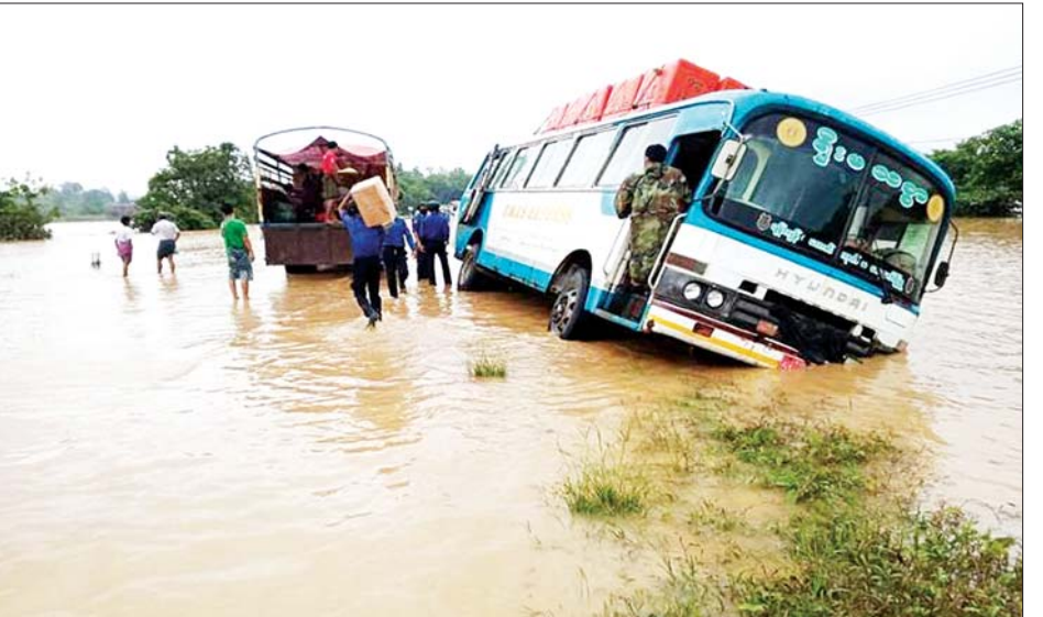
လမ်းချော်မှုဖြစ်ပွားခဲ့သည့် ရိုးမသစ္စာကုန်တင်ယာဉ်မှ ကုန်ပစ္စည်းများ ရွှေ့ပြောင်းပေးနေစဉ်။

နေပြည်တော် ဇူလိုင် ၂၈ ရခိုင်ပြည်နယ်အတွင်း မိုးသည်း ထန်စွာရွာသွန်းမှုကြောင့် သံတွဲ၊ ဘူးသီးတောင်၊ မောင်တောမြို့နယ် များအတွင်း ရေကြီးရေလျှံမှုများ ဖြစ်ပေါ်ခဲ့သဖြင့် အနောက်ပိုင်း တိုင်းစစ်ဌာနချုပ်မှ နယ်မြေခံ တပ်မတော်သားများ၊ မြန်မာနိုင်ငံ ရဲတပ်ဖွဲ့ဝင်များ၊ မီးသတ်တပ်ဖွဲ့ ဝင်များနှင့် ဌာနဆိုင်ရာတာဝန် ရှိသူများက ရေဘေးသင့်ပြည်သူ များကို ကူညီကယ်ဆယ်ရေး လုပ်ငန်းများ စုပေါင်းဆောင်ရွက် ပေးလျက်ရှိသည်။