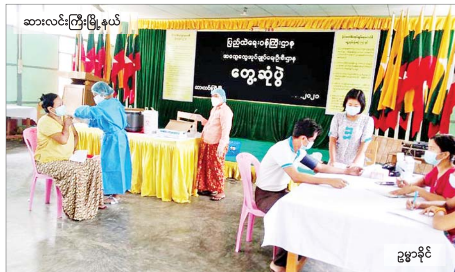
ဆားလင်းကြီးမြို့နယ်