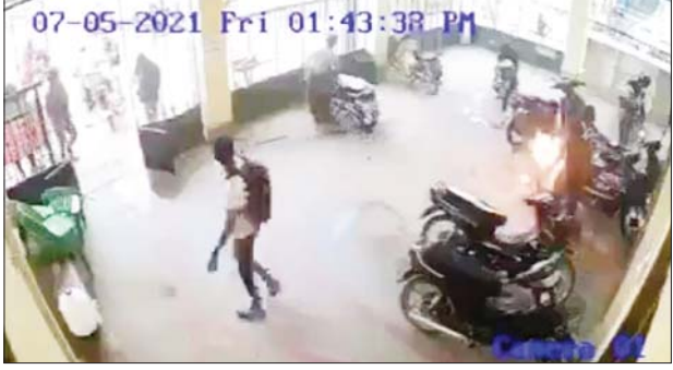
တရားခံအောင်ချစ်ကိုနှင့် အကြမ်းဖက်သူများက မေ ၇ ရက်တွင် မိတ္ထီလာမြို့ သီရိမင်္ဂလာရပ်ကွက် ခရိုင်ပညာရေးမှူးရုံးဝင်းအတွင်း ရပ်ထားသည့် ဆိုင်ကယ်များကို ဓာတ်ဆီလောင်း မီးရှို့ဖျက်ဆီးခဲ့သည့် CCTV မှတ်တမ်းဓာတ်ပုံ။

ထို့ပြင် မိတ္ထီလာမြို့ပေါ်တွင် အဖျက်လုပ်ငန်းနှင့် အပြစ်မဲ့ပြည်သူများအား ပစ်ခတ်လုပ်ကြံမှုများပြုလုပ်နိုင်ရန် ရည်ရွယ်ချက်ဖြင့် တရားခံ