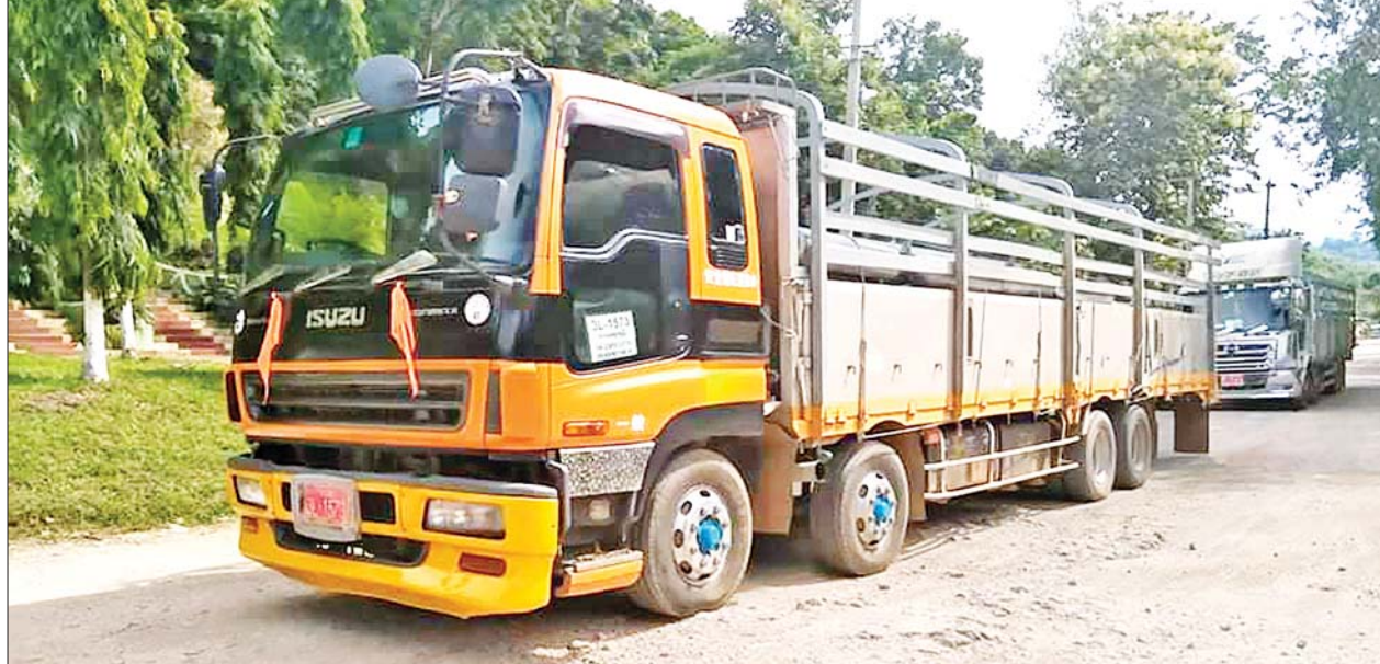
ချင်းရွှေဟော်နယ်စပ်ကုန်သွယ်ရေးစခန်းမှ ကိုဗစ်-၁၉ ရောဂါ ကာကွယ်၊ ထိန်းချုပ်၊ ကုသရေးဆိုင်ရာပစ္စည်းများ တင်သွင်းလာစဉ်။

❖ ONE မစ်ဒယ်ဝိတ်တန်းမှ လင်ဟီကျူ(တရုတ်)၊ ဗစ်တိုးရီးယားလီ (စင်ကာပူ/အမေရိကန်)နှင့် ဝမ်လုပ်င်(တရုတ်)တို့ ယှဉ်ပြိုင်ထိုးသတ်မည်ဖြစ်သည်။ အောင်လအန်ဆန် သည် မစ်ဒယ်ဝိတ်တန်း ကမ္ဘာ့ချန်ပီယံဆုကို ၂၀၂၀ ပြည့်နှစ် အောက်တိုဘာ ၃၀ ရက်က ထိုးသတ်သည့်ပွဲတွင် နယ်သာလန်နိုင်ငံသား ဒီရစ်ဒါကို အရေးနိမ့်ခဲ့သဖြင့် လက်လွှတ်ခဲ့ရသောကြောင့် ချန်ပီယံဆုအား ပြန်လည် စိန်ခေါ်နိုင်ရန် စိန်ခေါ်ပွဲများ ထိုးသတ်ခြင်းဖြစ်သည်။ အောင်လအန်ဆန် သည် လီအန်ဒရိုကို အနိုင်ရပါက မစ်ဒယ်ဝိတ်တန်းချန်ပီယံဆုအား စိန်ခေါ်ခွင့်ရမည်ဖြစ်ပြီး ONE Championship အနေဖြင့် ယခုပွဲမှ အနိုင်ရ