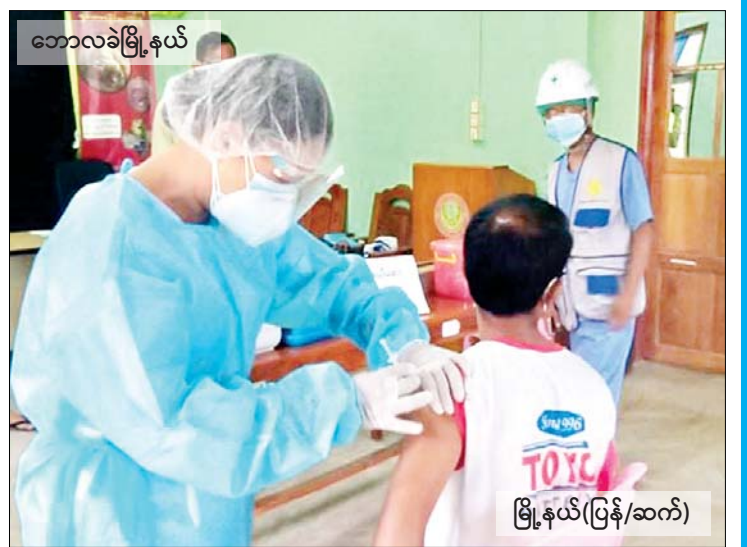
ဘောလခဲမြို့နယ်