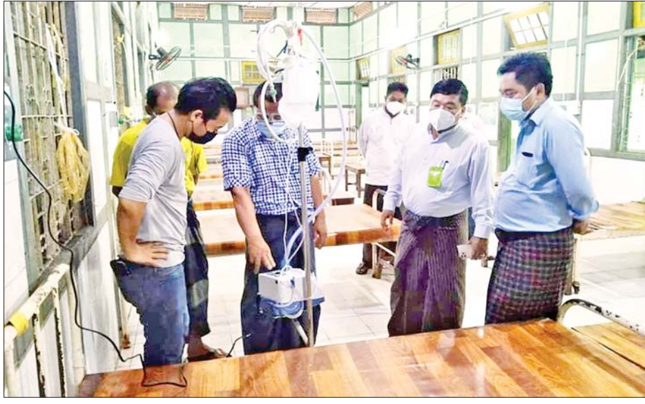
မေ့ဆေးအထူးကုဆရာဝန်၏ ညွှန်ကြားမှုဖြင့် ကုသပေးသွားမည်ဖြစ်သည်။ ဆေးရုံ တက်ရောက်ကုသနေသော လူနာများအား အောက်ဆီဂျင်ထွက်ရှိမှု ပမာဏမှာ ၂၄ နာရီ