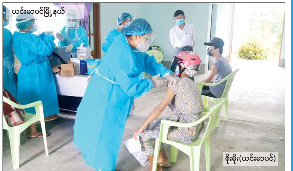
ယင်းမာပင်မြို့နယ်