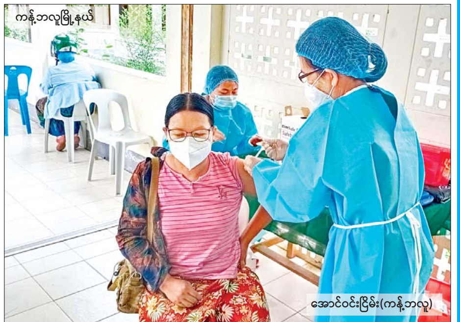
ကန့်ဘလူမြို့နယ်