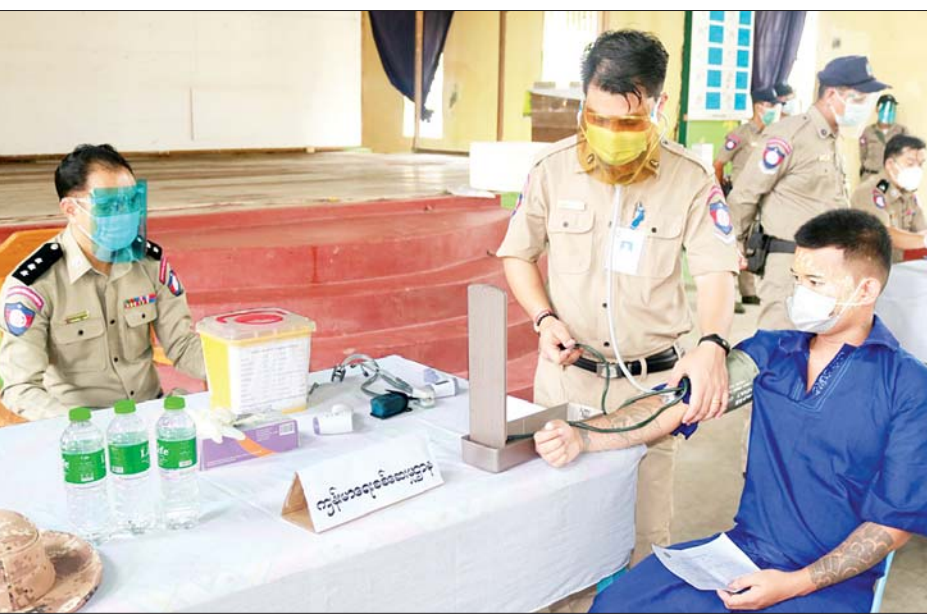
အင်းစိန်ဗဟိုအကျဉ်းထောင်၌ ကိုဗစ်-၁၉ ကာကွယ်ဆေးထိုးနှံရန် ကျန်းမာရေးစစ်ဆေးပေးစဉ်။