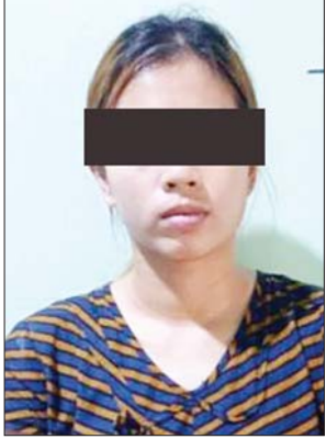
တရားခံ စိုးနိဘယ်