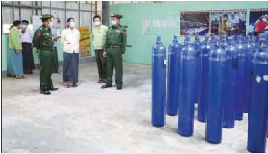
ခုတင် (၅၀၀) အတွင်း နယ်မြေခံတပ်ရင်းများရှိ တပ်မတော်သားများက အောက်ဆီဂျင်အိုးများ နေရာချထားပေးနေမှုကို ကြည့်ရှုစစ်ဆေးကြသည်။ အဆိုပါ ကပစ (၂၄) ပေါက်မြို့မှ ရောက်ရှိ လာသော အောက်ဆီဂျင်အိုး လီတာ ၄၀ ဆုံ အလုံး ၂၀၀ အား မုံရွာမြို့၊ ပြည်သူ့ဆေးရုံကြီး ခုတင် (၅၀၀) သို့ အောက်ဆီဂျင်အိုး ၆၄ လုံး၊ စစ်ကိုင်းမြို့၊ ပြည်သူ့ ဆေးရုံကြီးသို့ အောက်ဆီဂျင်အိုး အလုံး ၅၀ နှင့်

မုံရွာ ဇူလိုင် ၂၄ စစ်ကိုင်းတိုင်းဒေသကြီး စီမံအုပ်ချုပ်ရေးကောင်စီ ဥက္ကဋ္ဌ ဦးမောင်မောင်လင်းသည် အနောက်မြောက် တိုင်းစစ်ဌာနချုပ်မှ ဗိုလ်မှူးချုပ်ကျော်စွာဝင်း၊ တာဝန်ရှိသူများနှင့်အတူ စစ်ကိုင်းတိုင်းဒေသကြီး စီမံအုပ်ချုပ်ရေးကောင်စီနှင့် အနောက်မြောက်တိုင်း စစ်ဌာနချုပ်တို့ ညှိနှိုင်းပေါင်းစပ်၍ အောက်ဆီဂျင် ဖြန့်ဖြူးပေးသည့် အစီအစဉ်အရ ဇူလိုင် ၂၃ ရက် နံနက်ပိုင်းတွင် ကပစ(၂၄) ပေါက်မြို့မှ ရောက်ရှိ လာသော အောက်ဆီဂျင်အိုးများကို မုံရွာမြို့၊ ပြည်သူ့ ဆေးရုံ ခုတင် (၅၀၀) သို့ ရွှေ့ပြောင်းသယ်ယူနေမှုအား ကြည့်ရှုစစ်ဆေးသည်။