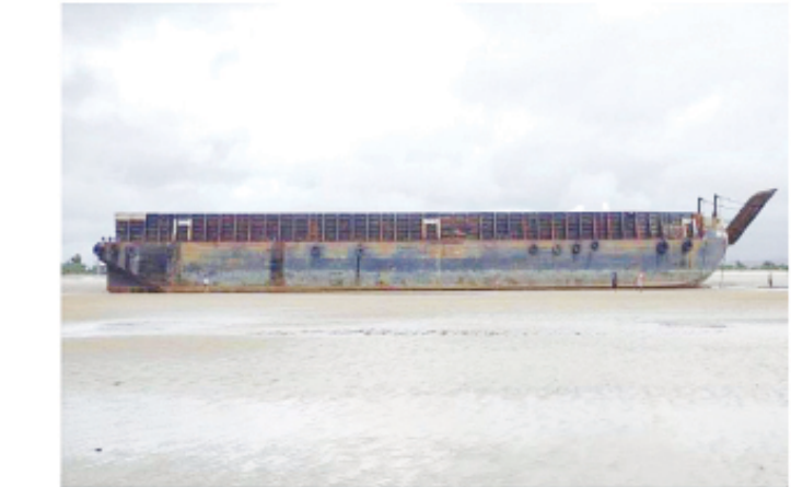
SINGA BESAR 2801 PENANG (Barge)ရေယာဉ်