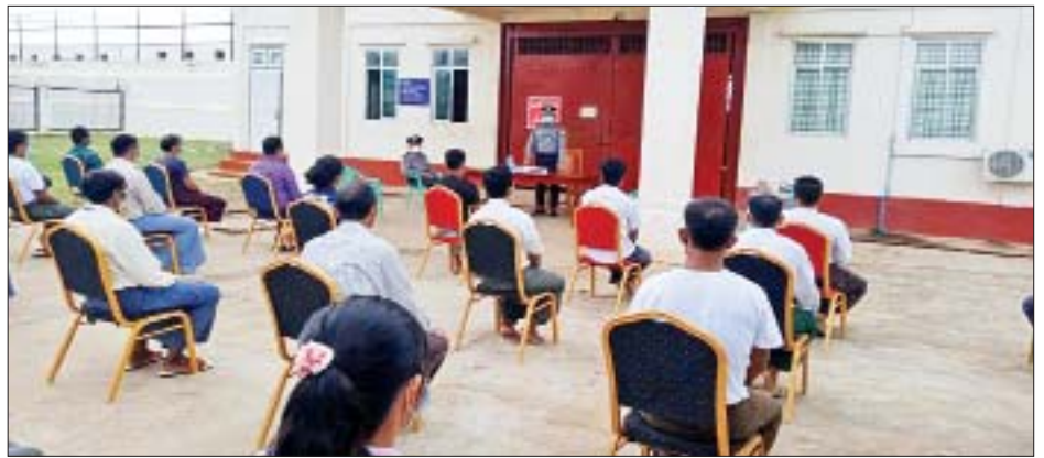
ပြည်ထောင်စုနယ်မြေ နေပြည်တော်အတွင်း ပြန်လည်စေလွှတ်ပေးခဲ့သူများအား တာဝန်ရှိသူများက တွေ့ဆုံအမှာစကားပြောကြားစဉ်။

အမျိုးသမီး ၅၈ ဦး ပေါင်း ၅၅၈ ဦး၊ တနင်္သာရီတိုင်းဒေသကြီးမှ အမျိုးသား ၁၉၁ ဦး၊ အမျိုးသမီး ၂၇ ဦး ပေါင်း ၂၁၈ ဦး၊ ပဲခူးတိုင်းဒေသကြီးမှ အမျိုးသား ၃၀၈ ဦး၊ အမျိုးသမီး ၃၃ ဦး ပေါင်း ၃၄၁ ဦး၊ မကွေးတိုင်းဒေသကြီးမှ အမျိုးသား ၈၃ ဦး၊ အမျိုးသမီး ငါးဦး ပေါင်း ၈၈ ဦး၊ မန္တလေးတိုင်းဒေသကြီးမှ အမျိုးသား ၅၂၈ ဦး၊ အမျိုးသမီး ၅၄ ဦး ပေါင်း ၅၈၂ ဦး၊ ဗွန်ပြည်နယ်မှ အမျိုးသား ၂၅၂ ဦး၊ အမျိုးသမီး ၂၅ ဦး ပေါင်း ၂၇၇ ဦး၊ ရခိုင်ပြည်နယ်မှ အမျိုးသား ၃၃ ဦး၊ အမျိုးသမီး တစ်ဦး ပေါင်း ၃၄ ဦး၊ ရန်ကုန်တိုင်းဒေသကြီးမှ အမျိုးသား ၁၅၀၃ ဦး၊ အမျိုးသမီး ၁၄၈ ဦး ပေါင်း ၁၆၅၁ ဦး၊ ရှမ်းပြည်နယ်မှ အမျိုးသား ၁၁၉ ဦး၊ အမျိုးသမီး ၁၂ ဦး ပေါင်း ၁၃၁ ဦး၊ ဧရာဝတီတိုင်းဒေသကြီးမှ အမျိုးသား ၁၃၇ ဦး၊ အမျိုးသမီး ၂၃ ဦး ပေါင်း ၁၆၀၊ ပြန်လည်စေလွှတ်ပေးခဲ့သူ စုစုပေါင်းအနေဖြင့် အမျိုးသား ၃၈၇၉ ဦး၊ အမျိုးသမီး ၄၀၈ ဦး ပေါင်း ၄၂၈၇ ဦးဖြစ်ပါသည်။ ပြန်လည်စေလွှတ်ပေးခဲ့သူများအား သက်ဆိုင်ရာနယ်မြေအလိုက် တာဝန်ရှိသူများက တွေ့ဆုံအားပေးမှာကြားခဲ့ပြီး လိုအပ်သည့် အုပ်ချုပ်မှုကိစ္စရပ်များအား သက်ဆိုင်ရာဌာနများမှ ညှိနှိုင်းပေါင်းစပ်ဆောင်ရွက်ပေးခဲ့ကြောင်း သိရသည်။