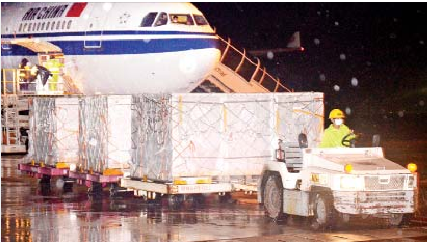
တရုတ်ပြည်သူ့သမ္မတနိုင်ငံမှ လှူဒါန်းသော Sinopharm ကိုဗစ်-၁၉ ကာကွယ်ဆေး နှစ်သန်းအနက်မှ တတိယအသုတ် ရန်ကုန်အပြည်ပြည်ဆိုင်ရာလေဆိပ်သို့ ရောက်ရှိစဉ်။