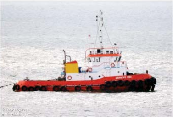
TB BRANTAS 1301 တွဲဆွဲရေယာဉ်

ဆောင်ရွက်သွားမည်ဖြစ်ပါသည်။ ၄။ ရေကြောင်းပို့ဆောင်ရေးညွှန်ကြားမှုဦးစီးဌာနနှင့် မြန်မာ့ဆိပ်ကမ်းအာဏာပိုင်တို့အနေဖြင့်လည်း သောင်တင်တွဲရေယာဉ် အမြန်ဆုံး သောင်မှလွတ်ကင်းစေရန်အတွက် သက်ဆိုင်ရာ ရေယာဉ်ပိုင်ရှင်၊ ရေယာဉ်ကိုယ်စားလှယ်များ၊ သင်္ဘော၏ အလံတင်နိုင်ငံ (Flag State) ရေကြောင်းအာဏာပိုင်တို့နှင့် အချိန်နှင့်တစ်ပြေးညီ ချိတ်ဆက်ညှိနှိုင်းဆောင်ရွက်လျက်ရှိကြောင်း သတင်းရရှိပါသည်။ ပို့ဆောင်ရေးနှင့်ဆက်သွယ်ရေး ဝန်ကြီးဌာန