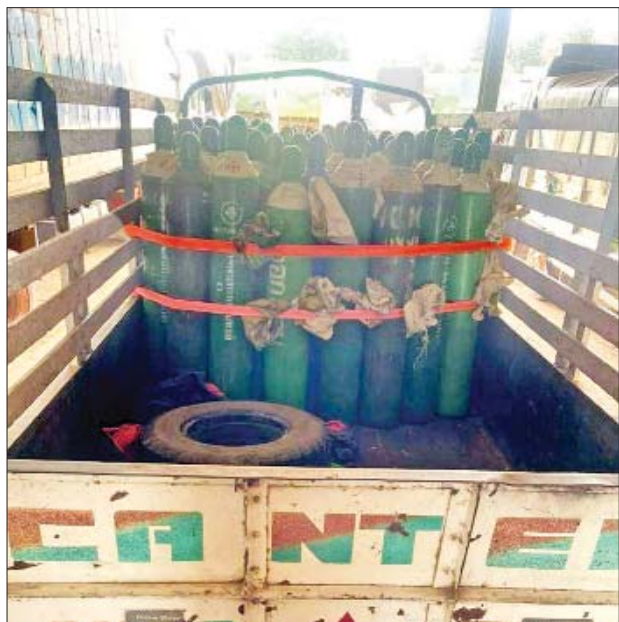
မြန်မာစီးပွားရေးကော်ပိုရေးရှင်း ရှင်းရှိ စက်ရုံမှ ထုတ်လုပ် သည့် အောက်ဆီဂျင်အိုး များအား သက်ဆိုင်ရာနေရာ များသို့ ဖြန့်ဝေပေးစဉ်။

တိုင်းဒေသကြီးနှင့် ပြည်နယ်အသီးသီး၌ အောက်ဆီဂျင် လိုအပ်ချက်များမရှိစေရေးအတွက် ကျန်းမာရေးနှင့် အားကစားဝန်ကြီးဌာနမှ Oxygen Plant များကို တိုးမြှင့်တပ်ဆင်လည်ပတ်လျက်ရှိပြီး တပ်မတော်အနေဖြင့်လည်း တိုင်းစစ်ဌာနချုပ်နယ်မြေ အသီးသီးတွင် Oxygen Plant များကို တပ်ဆင် ထုတ်လုပ်ပေးလျက်ရှိကြောင်းနှင့် အောက်ဆီဂျင် လိုအပ်ချက်များမရှိစေရေး Oxygen Plant အသစ် များကိုလည်း ထပ်မံတိုးချဲ့တပ်ဆင်နိုင်ရေး လုပ်ဆောင် လျက်ရှိကြောင်း သတင်းရရှိသည်။ သတင်းစဉ်