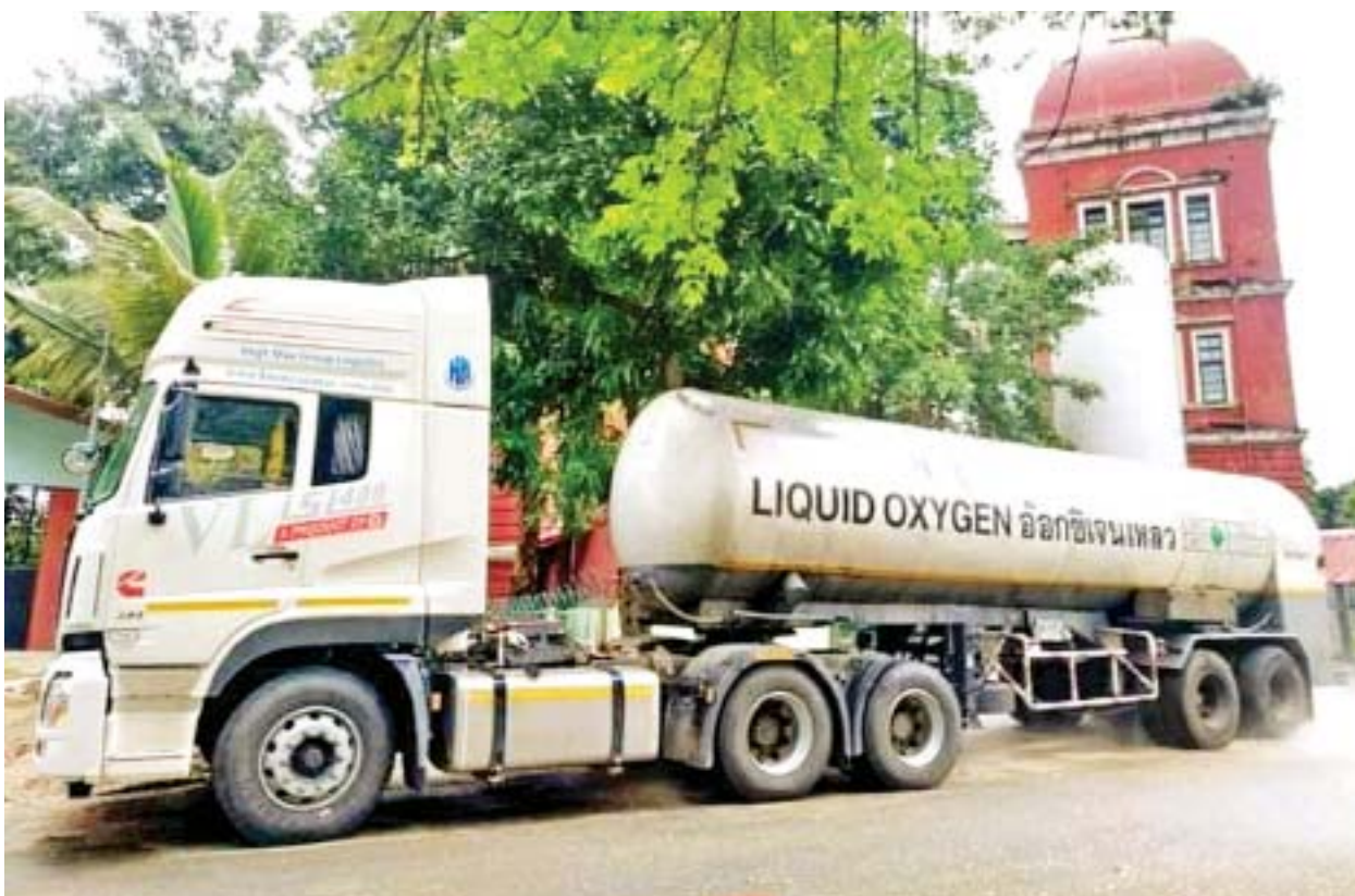
ပြည်ပမှတင်သွင်းသော Liquid Oxygen တင်ဆောင်လာသည့် မော်တော်ယာဉ် ရန်ကုန်ပြည်သူ့ဆေးရုံကြီးသို့ ရောက်ရှိလာစဉ်။