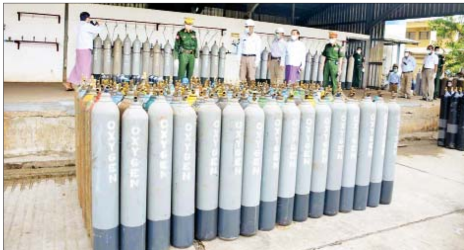
ရန်ကုန်တိုင်းဒေသကြီး အင်းစိန်မြို့နယ်ရှိ ရွာမသံမဏိစက်ရုံ၌ အောက်ဆီဂျင်အိုးအမျိုးမျိုး ထုတ်လုပ်နေမှုကို တွေ့ရစဉ်။

* ရှေးဖုံးမှ လျှင်မြန်စွာပေးမည်ဖြစ်ကြောင်း သိရသည်။ ထို့ပြင် အောက်ဆီဂျင်လိုအပ်မှု မရှိစေရေးအတွက် စေတနာရှင်၊ အလှူရှင်များ၏ စေတနာသဒ္ဓါ ထက်သန်စွာ လှူဒါန်းသောငွေများဖြင့် Liquid Oxygen မက်ထရစ်တန် ၂၀ ဆွဲကား ၂၆ စီးစာ ဝယ်ယူထားပြီးဖြစ်၍ မကြာမီရက်ပိုင်းအတွင်း ရန်ကုန်မြို့သို့ ဆက်လက်ရောက်ရှိလာမည် ဖြစ်ကြောင်း သိရသည်။