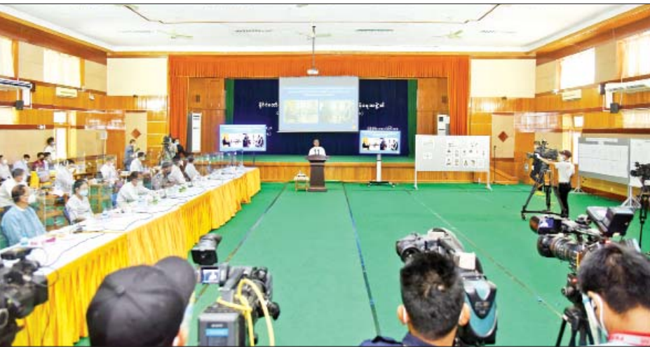
နိုင်ငံတော်စီမံအုပ်ချုပ်ရေးကောင်စီ သတင်းထုတ်ပြန်ရေးအဖွဲ့၏ (၇/၂၀၂၁)ကြိမ်မြောက် သတင်းစာရှင်းလင်းပွဲပြုလုပ်စဉ်။