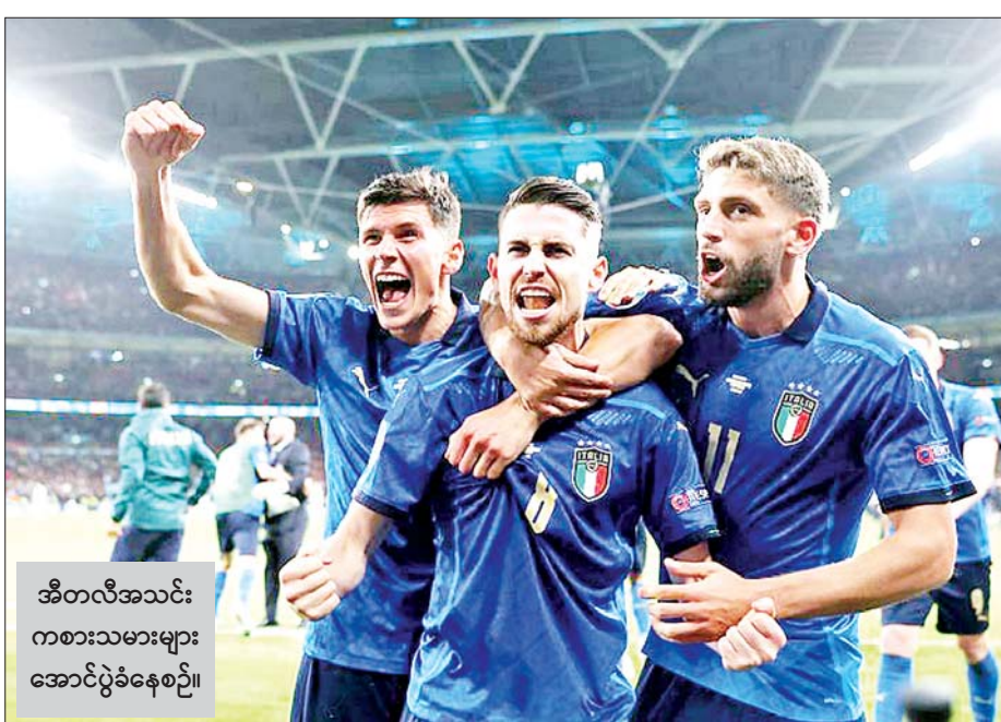
အီတလီအသင်း ကစားသမားများ အောင်ပွဲခံနေစဉ်။

ယူရို ၂၀၂၀ ပြိုင်ပွဲရဲ့ ဆီမီးဖိုင်နယ် ပွဲစဉ်တစ်ပွဲဖြစ်တဲ့ အီတလီအသင်း နဲ့ စပိန်အသင်းတို့ပွဲစဉ်ကို ဇူလိုင် ၇ ရက် နံနက်ပိုင်းက ယှဉ်ပြိုင် ကစားခဲ့ရာ အီတလီအသင်းက စပိန်အသင်းကို ပင်နယ်တီအဆုံး အဖြတ်နဲ့ အနိုင်ရပြီး ယူရိုပြိုင်ပွဲရဲ့ နောက်ဆုံးဗိုလ်လုပွဲကို တက်လှမ်း နိုင်ခဲ့ပြီ ဖြစ်ပါတယ်။ အဲဒီပွဲစဉ်မှာ နှစ်သင်းစလုံးဟာ နောက်ဆုံးဗိုလ်လုပွဲ တက်လှမ်း နိုင်ရေးအတွက် လူစုံထုတ်ကစား ခဲ့ပြီး အကြိတ်အနယ်ရှိခဲ့တဲ့အပြင် ပထမပိုင်းပွဲကစားချိန်အတွင်းမှာ ဘယ်အသင်းကမှ ဂိုးမသွင်းနိုင်ခဲ့ ပေ။ ဒါပေမယ့် အီတလီအသင်းက စာမျက်နှာ ၅ ကော်လံ ၁ သို့ *