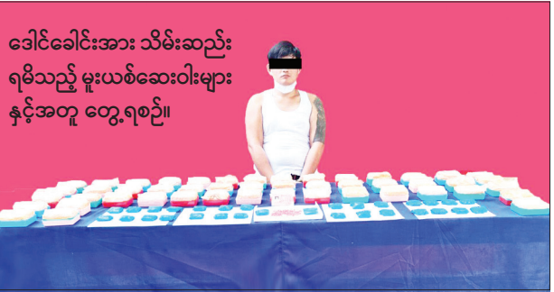
ခေါင်ခေါင်အား သိမ်းဆည်း ရမိသည့် မူးယစ်ဆေးဝါးများ နှင့်အတူ တွေ့ရစဉ်။