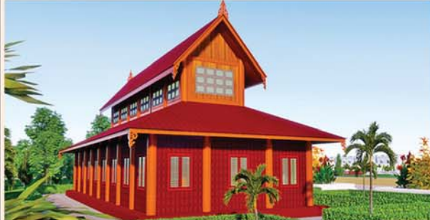
မော်ကွန်းတိုက်(၇၂x၃၀)ပေ ၁ လုံး-၈၈၄ သိန်း (လှူဒါန်းပြီး)