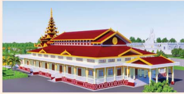
ဗျောရုံ(၂၀၃x၉၀)ပေ ၁ လုံး-၈၇၃၀ သိန်း