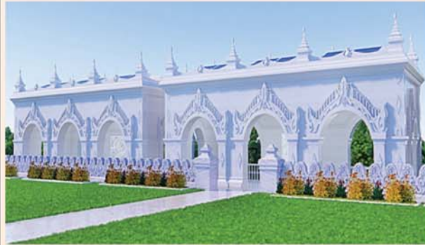
မြန်မာမူစကျင်ကျောက်ဖြင့် တည်ဆောက်ပူဇော်ထားသော ဂန္ဓတုဋ်တိုက် (၅၄x၂၇)ပေ ၂၄ လုံး ၁ လုံးလျှင်- ၁၂၅၀ သိန်း(၁၅ လုံးလှူဒါန်းပြီး)