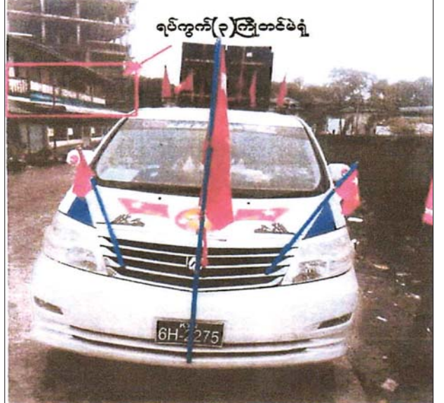
မဲရုံအနီး၌ မဲရုံမှ ကိုက် ၅၀ အတွင်း မဲဆွယ်သီချင်းဖွင့်နေပုံ။