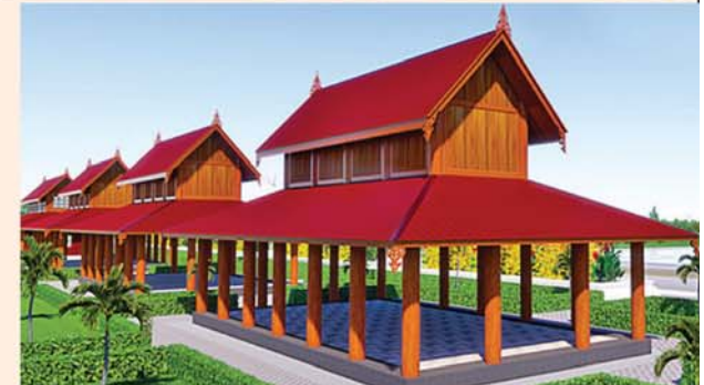
သုဗ္ဗမ္မာဇရပ်(၅၄x၃၀)ပေ ၆ လုံး ၁ လုံးလျှင်-၅၅၇ သိန်း(လှူဒါန်းပြီး)