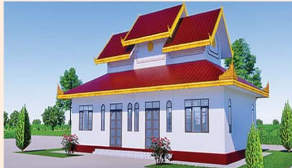
ဂေါပကရုံး (၄၈x၂၄)ပေ ၁ လုံး-၄၂၃ သိန်း(လှူဒါန်းပြီး)