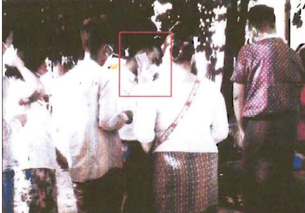
မဲပေးမည့်သူများအား မဲရုံနှင့်ကပ်၍ မဲစလစ်ထုတ်ပေးနေပုံ။