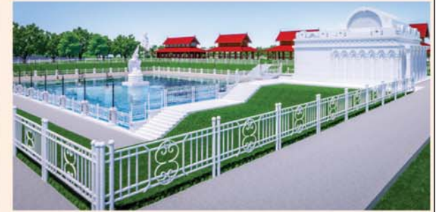
မုစလိန္နုတိုင်

၁။ နိုင်ငံတော်စီမံအုပ်ချုပ်ရေးကောင်စီဥက္ကဋ္ဌ၊ တပ်မတော်ကာကွယ်ရေးဦးစီးချုပ် ဗိုလ်ချုပ်မှူးကြီးမင်းအောင်လှိုင် ဦးဆောင်သည့် (၇)ရက်သား၊ သမီး၊ ဘုရားဒါယကာ၊ ဒါယိကာမတို့က မာရဝိဇယပုဒ္ဒလ်ပွားတော်မြတ်ကြီးအား မြန်မာနိုင်ငံတွင် ထေရဝါဒ ပုဒ္ဓသာသနာတော်ထွန်းလင်းတောက်ပလှူဒါန်းရန်၊ တိုင်းပြည်အေးချမ်းသာယာမှုရှိစေရန်၊ ရုပ်ပွားတော်မြတ်ကြီးအား ပြည်တွင်း၊ ပြည်ပဘုရားဖူးများလာရောက်ခြင်းဖြင့် ဒေသတိုးတက်စည်ကားမှုကို အထောက်အကူဖြစ်စေရန်၊ နိုင်ငံတော် ဖွံ့ဖြိုးတိုးတက်မှု အထောက်အကူဖြစ်စေရန်ရည်သန်လျက် ပြည်ထောင်စုနယ်မြေ နေပြည်တော်၊ ဒက္ခိဏသီရိမြို့နယ်အတွင်း၌ သာသနာတော်ထုံး၊ ရုပ်ပွားဆင်းတုတော်ထုံး၊ မြန်မာ့ရိုးရာတည်ထုံးများနှင့်အညီ တည်ဆောက်ပူဇော်လှူဒါန်းပါသည်။ ၂။ မာရဝိဇယပုဒ္ဓလ်ပွားတော်မြတ်ကြီး တည်ဆောက်ရေးလုပ်ငန်းများအား တပ်မတော်(ကြည်း)၊ ရေ၊ လေ)မိသားစုများ၊ စေတနာရှင်များ၊ တိုင်းရင်းသားပြည်သူတို့၏ စုပေါင်းလှူဒါန်းမှုဖြင့် အောက်ပါအတိုင်းတည်ဆောက်ပူဇော်သွားမည် ဖြစ်ပါသည်-