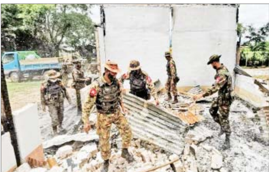
ပျက်စီးမှုများဖြစ်ပေါ်ခဲ့သည့် မြို့နယ်များ၌ နယ်မြေခံ တပ်မတော်သားများ၊ ပြည်သူ့စစ် (ဌာန) အဖွဲ့ဝင်များနှင့် ဌာနဆိုင်ရာတာဝန်ရှိသူများ ပူးပေါင်း၍ အဆောက်အအုံများ ပြန်လည်ပြုပြင်ခြင်းလုပ်ငန်း များ ဆောင်ရွက်စဉ်။

နေပြည်တော် ဇူလိုင် ၃ ရှမ်းပြည်နယ်(တောင်ပိုင်း)နှင့် ကယားပြည်နယ်တို့၌ ဆူပူဆန္ဒပြမှု များနှင့် အကြမ်းဖက်မှုများ၏ တိုက်ခိုက်မှုများကြောင့် ဖယ်ခုံ မြို့နယ်၊ မိုးပြမြို့နယ်နှင့် ဒီးမော့ဆို မြို့နယ်အတွင်းရှိ ဌာနဆိုင်ရာ အဆောက်အအုံများ၊ စာသင် ကျောင်းများ၊ ဘာသာရေး အဆောက်အအုံများနှင့် လူနေအိမ် များတွင် ပျက်စီးဆုံးရှုံးမှုများ ဖြစ်ပေါ်ခဲ့သည်။