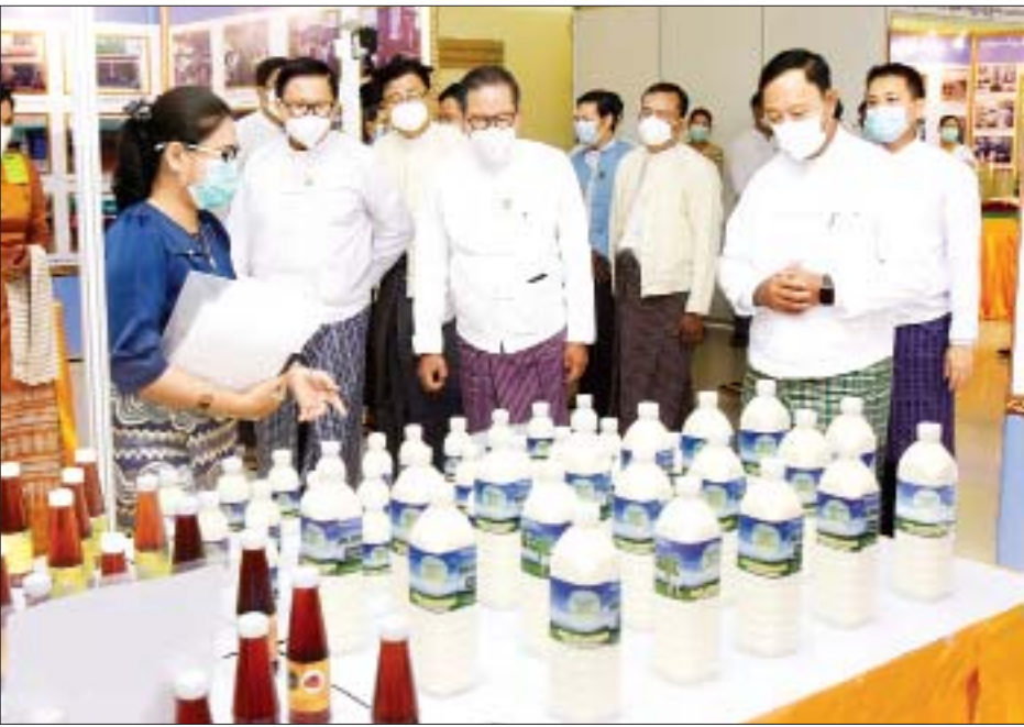
ပိုမိုဖွံ့ဖြိုးတိုးတက်အောင်ဆောင်ရွက်ပြီး အခြားစီးပွားရေးကဏ္ဍများကိုလည်း ဘက်စုံဖွံ့ဖြိုးတိုးတက်အောင် တည်ဆောက်ရေးဆိုသည့် ဦးတည်ချက်နှင့်အညီ သမဝါယမအသင်းများက ကြိုးပမ်းဆောင်ရွက်လျက်ရှိရာ စိုက်ပျိုးရေး၊ မွေးမြူရေး၊ သမဝါယမအသင်းများအနေဖြင့် ထုတ်ကုန်ပစ္စည်းများကို ဈေးကွက်ဝယ်လိုအားတစ်ရပ် ဖြစ်ပေါ်လာစေရန် ကြိုးပမ်းဆောင်ရွက်သွားကြရမည်ဖြစ်ပါ

နေပြည်တော် ဇူလိုင် ၃ ၂၀၂၁ ခုနှစ် (၉၉) ကြိမ်မြောက် အပြည်ပြည်ဆိုင်ရာသမဝါယမနေ့အခမ်းအနားကို ယနေ့နံနက် ၁၀ နာရီတွင် နေပြည်တော်ရှိ သမဝါယမနှင့် ကျေးလက်ဖွံ့ဖြိုးရေးဝန်ကြီးဌာန အစည်းအဝေးခန်းမ၌ ကိုဗစ်-၁၉ ကာကွယ်၊ ထိန်းချုပ်ရေးဆိုင်ရာ ညွှန်ကြားချက်များနှင့်အညီ ကျင်းပသည်။