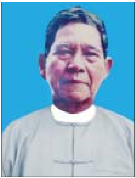
၂၀၀၃ ခုနှစ် အမျိုးသားစာပေတစ်သက်တာဆုရှင် စည်သူ ဦးဌေးမောင် (ဌေးမောင်)

အယ်ဒီတာမှ စာပြင်ဆရာသို့ “ကျွန်တော် စာပြင်ဆရာအလုပ်တစ်ခုတည်းပဲ