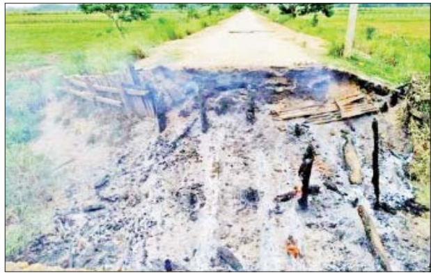
ဟုမ္မလင်းမြို့နယ် နောင်ပိုအောင်ကျေးရွာရှိ သစ်သားတံတား တစ်စင်းအား အကြမ်းဖက်သူများက မီးရှို့ဖျက်ဆီးမှု။