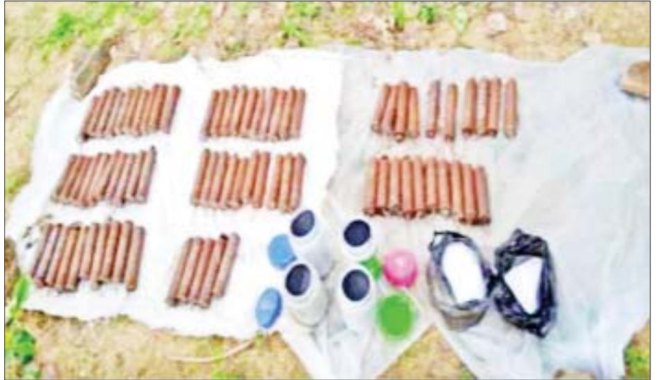
အောင်လံမြို့နယ်မှ လုံခြုံရေးတပ်ဖွဲ့ဝင်များ လှည့်ကင်းဆောင်ရွက်နေစဉ် ပြုလုပ်ကျေးရွာနှင့် ပွဲသာ ကျေးရွာကြားရှိ တောင်စောင်းအနီး မြေကျင်းတစ်ခုအတွင်းမှ လက်လုပ်ဗုံး ၇၅ လုံးနှင့် ဆက်စပ်ပစ္စည်းများ သိမ်းဆည်းရရှိမှု မှတ်တမ်းဓာတ်ပုံ။

အထက်ပါဖြစ်စဉ်များမှ အကြမ်းဖက်ရာတွင် အသုံးပြုမည့် လက်နက်၊ ပစ္စည်း၊ ကိရိယာများအား သိုဝှက်သိမ်းဆည်းထားရှိသူများနှင့် လက်ဝယ်ထားရှိ သူများကို ဥပဒေနှင့်အညီ အရေးယူဆောင်ရွက်သွား မည်ဖြစ်ကြောင်း သိရသည်။ သတင်းစဉ်