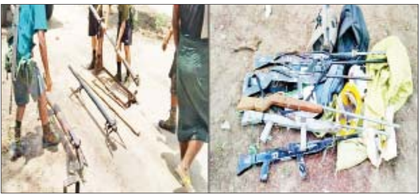
ဒီပဲယင်းမြို့နယ် ဆပ်ပြာကျင်းကျေးရွာအနီး၌ လုံခြုံရေးတပ်ဖွဲ့ဝင်များအား ချောင်းမြောင်းတိုက်ခိုက်ခဲ့သည့် လက်နက်ကိုင်အကြမ်းဖက်သူများထံမှ သိမ်းဆည်းရမိသည့် လက်နက်များ။

အလားတူ နံနက် ၈ နာရီခွဲခန့်တွင် မင်းကင်းမြို့နယ် ပန်းဆက်ကျေးရွာ၌ အခြေပြုလျက်ရှိသော လုံခြုံရေးတပ်ဖွဲ့ဝင်များကို ချောင်းမြောင်းပစ်ခတ်တိုက်ခိုက်ရန်အတွက် လက်နက်ကိုင် အကြမ်းဖက်သောင်းကျန်းသူအင်အား ၅၀ ခန့်သည် မောက္ခတော်ကျေးရွာဘက်မှ ချင်းတွင်းမြစ်အတိုင်း စက်လှေ နှစ်စင်းဖြင့် ထွက်ခွာလာကြောင်း သတင်းအရ လုံခြုံရေးတပ်ဖွဲ့ဝင်များက ကြိုတင်စောင့်ဆိုင်း၍ အဆိုပါ လက်နက်ကိုင်အကြမ်းဖက်သောင်းကျန်းသူများ ပန်းဆက်ကျေးရွာအနောက်ဘက် လေးဖာလုံခန့်အကွာရှိ