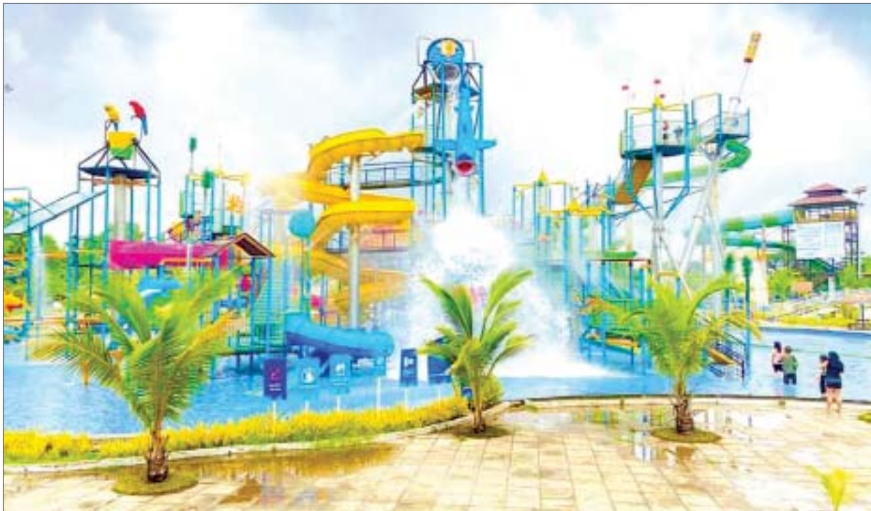
ရန်ကုန်မြို့ ဒေါပုံမြို့နယ်အတွင်းရှိ Yangon Waterboom အပန်းဖြေစခန်းကို တွေ့ရစဉ်။