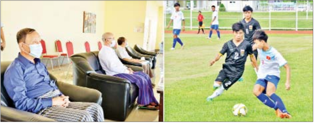
ဒေသကြီးအသင်းက ခုနစ်ဂိုး နှစ်ဂိုးဖြင့်လည်းကောင်း အနိုင်ရရှိကြပြီး ကွာတားဖိုင်နယ်ပွဲစဉ်သို့ မွန်ပြည်နယ်အသင်း၊ မကွေးတိုင်းဒေသကြီးအသင်း၊ မန္တလေးတိုင်းဒေသကြီးအသင်း၊ ပဲခူးတိုင်းဒေသကြီးအသင်းတို့ တက်ရောက်သွားကြောင်း သိရှိရသည်။ ပြိုင်ပွဲပွဲစဉ်များကို ဇူလိုင် ၄ ရက်တွင် ရပ်နားပြီး ကွာတားဖိုင်နယ် ပွဲစဉ်များကို ဇူလိုင် ၅ ရက် နံနက် ရန်ကင်းနှင့် ညနေ ၃ နာရီခွဲတို့တွင် ဝဏ္ဏသိဒ္ဓိအားကစားလေ့ကျင့်ရေး ကွင်း(၁)နှင့် (၂)တို့၌ ယှဉ်ပြိုင်ကစားသွားကြမည်ဖြစ်ပြီး ဘောလုံးအားကစားနည်းကို စိတ်ပါဝင်စားသော မိဘပြည်သူများအနေဖြင့် အခမဲ့လာရောက်ကြည့်ရှုနိုင်ကြောင်း သတင်းရရှိသည်။ သတင်းစဉ်

နေပြည်တော် ဇူလိုင် ၃ ကျန်းမာရေးနှင့်အားကစားဝန်ကြီးဌာန အားကစားနှင့်ကာယပညာဦးစီးဌာနနှင့် မြန်မာနိုင်ငံဘောလုံးအဖွဲ့ချုပ်တို့ ပူးပေါင်းကျင်းပသော ၂၀၂၁ ခုနှစ် တိုင်းဒေသကြီးနှင့် ပြည်နယ် အသက် (၂၁) နှစ်အောက် (အမျိုးသား) ဘောလုံးပြိုင်ပွဲများကို နေပြည်တော်ရှိ ဝဏ္ဏသိဒ္ဓိအားကစားလေ့ကျင့်ရေးကွင်းများ၌ ကျင်းပလျက်ရှိရာ ယနေ့တွင် နိုင်ငံတော်စီမံအုပ်ချုပ်ရေးကောင်စီအဖွဲ့ဝင် ဦးစောဒန်နိယယ်နှင့် ကျန်းမာရေးနှင့်အားကစားဝန်ကြီးဌာန ဒုတိယဝန်ကြီး ဦးမျိုးလှိုင်တို့ တက်ရောက်ကြည့်ရှုအားပေးကြသည်။