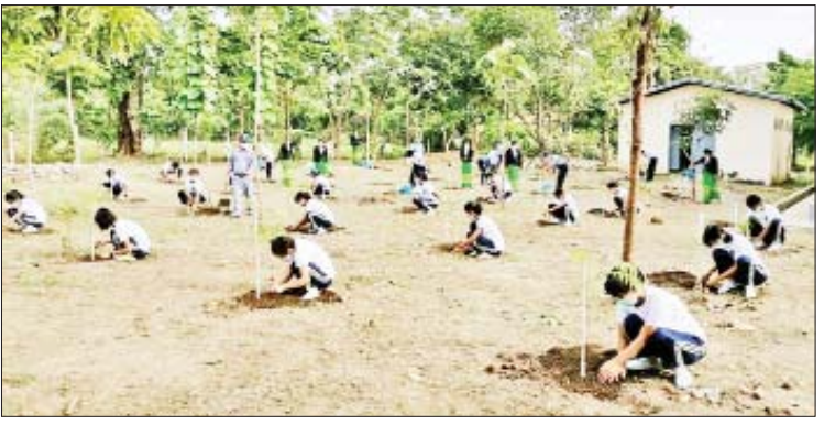
အခမ်းအနားများကို သက်ဆိုင်ရာကျောင်း လေကာပင် ၁၃၀ နှင့် နှစ်ရှည်ပင် ၂၀၅ ပင် အလိုက် ကျင်းပသည်။ စုစုပေါင်းအပင် ၈၇၀ စိုက်ပျိုးခဲ့ကြောင်း သိရသည်။ အဆိုပါ စုပေါင်းသစ်ပင်စိုက်ပျိုးပွဲ တွင် ရတနာတန်းဝင် ၅၃၅ ပင်၊ အရိပ်ရ သတင်းစဉ်

မုံရွာ ဇူလိုင် ၃ နယ်စပ်ရေးရာဝန်ကြီးဌာန ပညာရေးနှင့် လေ့ကျင့်ရေးဦးစီးဌာန စစ်ကိုင်းတိုင်း ဒေသကြီးဦးစီးမှူးရုံး(မုံရွာ) ကွပ်ကဲမှု အောက်ရှိ နယ်စပ်ဒေသတိုင်းရင်းသား လူငယ်များ ဖွံ့ဖြိုးရေးလူငယ်သင်တန်း ကျောင်း(ခန္တီး၊ လေရှီး၊ လဟယ်၊ နန်းယွန်း၊ ကလေး၊ ပင်လည်ဘူး)နှင့် အမျိုးသမီး အိမ်တွင်းမှု သက်မွေးလုပ်ငန်းပညာ သင်တန်းကျောင်း (ယင်းမာပင်၊ ပုလဲ၊ ဆားလင်းကြီး၊ ခန္တီး၊ လေရှီး၊ လဟယ်၊ နန်းယွန်း၊ ကလေး၊ ကသာ) စုစုပေါင်း သင်တန်းကျောင်း ၁၅ ကျောင်း၌ ယနေ့ နံနက်ပိုင်းတွင် မိုးရာသီ သစ်ပင်စိုက်ပျိုးပွဲ