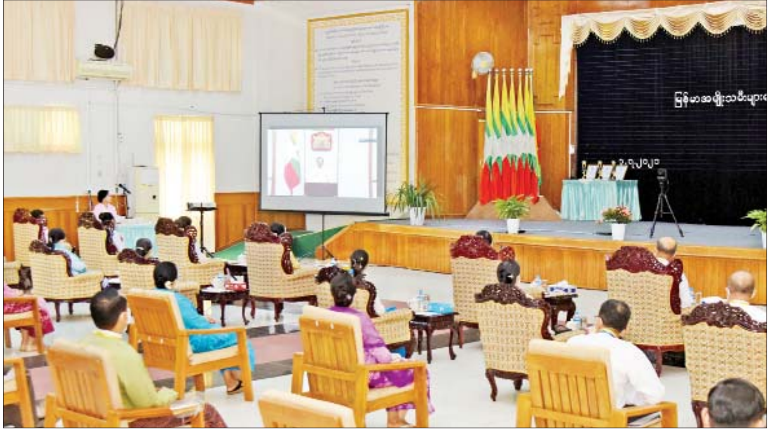
မြန်မာအမျိုးသမီးများနေ့ အထိမ်းအမှတ်အခမ်းအနား ကျင်းပစဉ်။

တက်ရောက် အခမ်းအနားသို့ နိုင်ငံတော်စီမံ အုပ်ချုပ်ရေးကောင်စီ အဖွဲ့ဝင်များဖြစ်ကြ သည့် ဒေါ်အေးနုစိန်၊ Jeng Phang နော်တောင်နှင့် ဦးရွှေကြိမ်း၊ နိုင်ငံတော်စီမံ အုပ်ချုပ်ရေးကောင်စီအဖွဲ့ဝင်များ ဖြစ်ကြ သည့် ဦးမောင်ဟာ၊ စောဒန်နီယယ်နှင့် ဒေါက်တာဗညားအောင်မိုးတို့၏ဇနီးများ၊ ပြည်ထောင်စုဝန်ကြီး ဒေါက်တာ သက်သက်ခိုင်၊ ပြည်ထောင်စုရှေ့နေချုပ် ဒေါက်တာသီတာဦး၊ ပြည်ထောင်စု တရားလွှတ်တော်ချုပ် တရားသူကြီး ဒေါ်ခင်မေရီ၊ နိုင်ငံတော်ဖွဲ့စည်းပုံအခြေခံ ဥပဒေဆိုင်ရာ ခုံရုံးအဖွဲ့ဝင်များဖြစ်ကြ သည့် စာမျက်နှာ ၄ ကော်လံ ၁ သို့ ၁၆