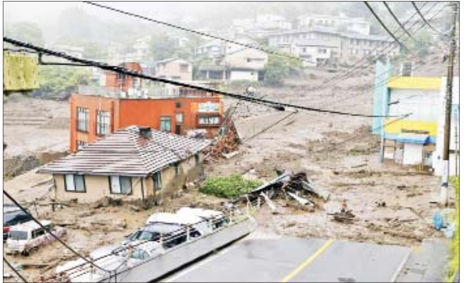
မျက်ခြည်မပြတ်စောင့်ကြည့်ရန် ပြည်သူများအား အာဏာပိုင်များက တိုက်တွန်းပြောကြားသည်။ ကိုးကား- အင်န်အိတ်ချီကေ ဘာသာပြန်- အောင်ကျော်ကျော်

မြေပြိုကျမှုဖြစ်ပွားစဉ် ရွှံ့နန်းမြေများ တစ်ဟုန်ထိုးကျဆင်းလာမှုကို မြင်တွေ့ခဲ့ရကြောင်းနှင့် လူနေအိမ်များအပေါ်သို့ ဖုံးလွှမ်းသွားကြောင်း ဒေသခံပြည်သူတစ်ဦးက ဆိုသည်။ မြေပြိုကျပြီးနောက် ဘေးလွတ်ရာနေရာသို့ ရွှေ့ပြောင်းနေထိုင်လျက်ရှိကြောင်း ၎င်းက ဆက်လက်ပြောသည်။ မိုးသည်းထန်စွာရွာသွန်းမှုကြောင့် မြေပြိုကျခြင်းဖြစ်ကြောင်းနှင့် ယခုရက်ပိုင်းအတွင်း မိုးရွာသွန်းမှု သာမန်ထက်ပိုမိုများပြားကြောင်း အတာမိမြို့ မိုးလေဝသအေဂျင်စီမှ တာဝန်ရှိသူများက ဆိုသည်။ ရှိဇိုကာနှင့် ကာနာဂါဝါခရိုင်တို့တွင် မိုးရွာသွန်းမှုပိုမိုများပြားကြောင်း ၎င်းတို့က ပြောကြားသည်။ ရှိဇိုကာ၊ ကာနာဂါဝါနှင့် ချီဘာခရိုင်များတွင် မြေပြိုမှုသတ်ပေးချက်များ ထုတ်ပြန်ကြေညာထားသည်။ အချို့သောမြေပြိုမှုများအတွင်း မြစ်ရေမြင့်တက်မှုသည် စိုးရိမ်အမှတ်ကို ကျော်လွန်လျက်ရှိသည်။ မိုးလေဝသဆိုင်ရာ နောက်ဆုံးရသတင်းများကို