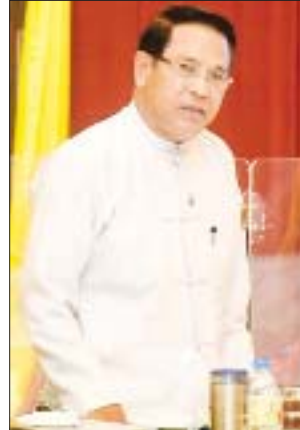
ပြည်ထောင်စုဝန်ကြီး ဦးမောင်မောင်အုန်း

ရာခိုင်နှုန်းခန့် ပြန်လည်စတင်နိုင်မည်ဟု ခန့်မှန်းထားကြောင်း၊ ၂၀၂၁ ခုနှစ်တွင် ကိုဗစ်-၁၉ ကပ်ရောဂါအခြေအနေ အပြည့်အဝ ထိန်းချုပ်နိုင်ပါက ၂၀၂၄ ခုနှစ်မှသာ ခရီးသွားလုပ်ငန်း ပုံမှန်အခြေအနေ ရောက်ရှိနိုင်မည်ဖြစ်သည်ဟု ခန့်မှန်းထားကြောင်း။ ကမ္ဘာ့ခရီးသွားလုပ်ငန်း အဖွဲ့ချုပ်က ခရီးသွားလုပ်ငန်း ပြန်လည်ထူထောင်ရေးအတွက် Global Tourism Crisis Committee ကို ဖွဲ့စည်းခဲ့ကြောင်း။