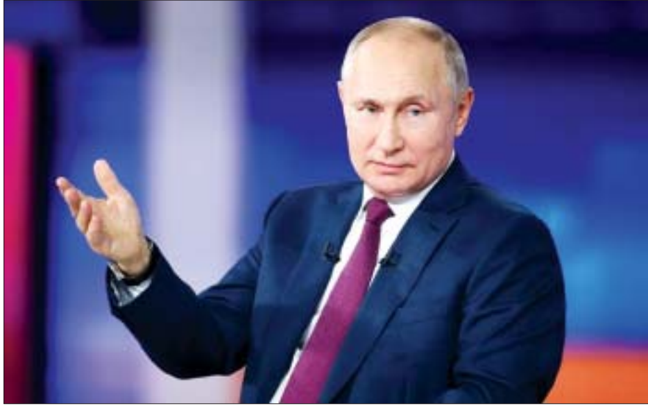
မှသာ သမ္မတပူတင်က ပြည်တွင်းထုတ် Sputnik V ကိုဗစ်-၁၉ ရောဂါကာကွယ်ဆေးကို ထိုးနှံခဲ့ခြင်းဖြစ်ကြောင်း ပြောကြားခဲ့ခြင်းဖြစ်သည်။ ရုရှားနိုင်ငံ၌ လက်ရှိအချိန်အထိ ပြည်တွင်း၌ မည်သည့်ပြည်ပကိုဗစ်-၁၉ ရောဂါကာကွယ်ဆေးကိုမျှ အရေးပေါ်အသုံးပြုရန် အတည်ပြုထားခြင်းမရှိသေးကြောင်း သိရသည်။ ကိုးကား-စီအင်န်အေ ဘာသာပြန်-အလင်းသစ်

မော်စကို ဇွန် ၃၀ ရုရှားနိုင်ငံတာဝန်ရှိသူများက နိုင်ငံအတွင်း ကိုဗစ်-၁၉ ရောဂါကူးစက်မှု မြင့်တက်နေခြင်းကြောင့် ပြည်သူများအား ကိုဗစ်-၁၉ ရောဂါကာကွယ်ဆေး ထိုးနှံရန် တိုက်တွန်းမှုများရှိနေစဉ်တွင် ရုရှားသမ္မတ ဗလာဒီမာပူတင်က ၎င်းသည် ပြည်တွင်းထုတ် Sputnik V ကိုဗစ်-၁၉ ရောဂါကာကွယ်ဆေးကို ထိုးနှံမှုခံယူခဲ့ခြင်းဖြစ်ကြောင်း ဇွန် ၃၀ ရက်တွင် ထုတ်ဖော်ပြောကြားသည်။