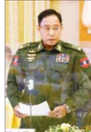
ပြည်ထောင်စုဝန်ကြီး ဒုတိယဗိုလ်ချုပ်ကြီး ရာပြည့်