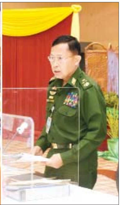
နိုင်ငံတော်စီမံအုပ်ချုပ်ရေးကောင်စီ ဒုတိယဥက္ကဋ္ဌ၊ ဒုတိယတပ်မတော်ကာကွယ်ရေးဦးစီးချုပ် ကာကွယ်ရေးဦးစီးချုပ်(ကြည်း) ဒုတိယဗိုလ်ချုပ်မှူးကြီးစိုးဝင်း အမျိုးသားခရီးသွားလုပ်ငန်း ဖွံ့ဖြိုးတိုးတက်ရေးဗဟိုကော်မတီ ပထမအကြိမ် အစည်းအဝေးတွင် အမှာစကားပြောကြားစဉ်။

တစ်ရပ်ဖြစ်ကြောင်း၊ ခရီးသွားလုပ်ငန်း ဖွံ့ဖြိုးတိုးတက်သော အချို့နိုင်ငံများတွင် ခရီးသွားလုပ်ငန်းမှရရှိသည့် ဝင်ငွေသည် နိုင်ငံစီးပွားရေးအတွက် အဓိကကျသည့် အခန်းကဏ္ဍတစ်ရပ်ဖြစ်ပြီး ကမ္ဘာ့စီးပွားရေး၏ တတိယအကြီးဆုံး ပို့ကုန်ကဏ္ဍဖြစ်ကြောင်း၊ ထို့ပြင် သဘာဝမျိုးစုံမျိုးကွဲများကို ကာကွယ်ထိန်းသိမ်းရေးနှင့် လူသားများအတွက် နေရာသစ်များ၊ ယဉ်ကျေးမှုများနှင့် အတွေ့အကြုံသစ်များကို စူးစမ်း