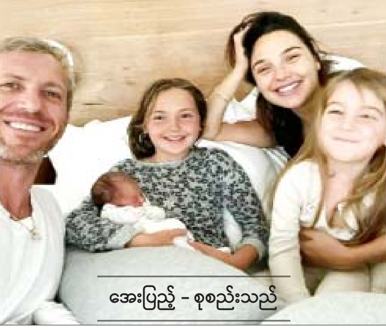
အေးပြည့် - စုစည်းသည်

အမျိုးသမီး လူစွမ်းကောင်းတစ်ဦးဖြစ်တဲ့ Wonder Woman အဖြစ် ပင်တိုင်သရုပ်ဆောင်ခဲ့သူ မင်းသမီး ဂဲလ်ဂတ်ဒေါ့ဟာ လတ်တလောမှာ တတိယမြောက် ရင်သွေးလေး မွေးဖွားခဲ့ပြီဖြစ်ကြောင်း အေးရှားဝမ်းဒေါ့ကွန်းရဲ့ ရေးသားဖော်ပြချက်တွေအရ သိရပါတယ်။