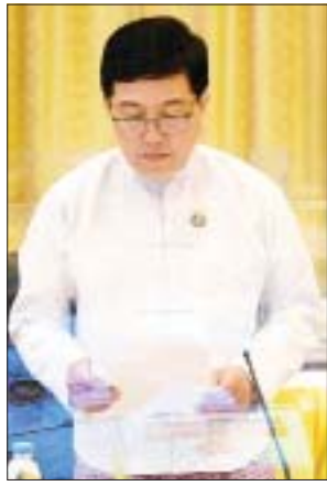
ပြည်ထောင်စုဝန်ကြီး ဒေါက်တာပွင့်ဆန်း