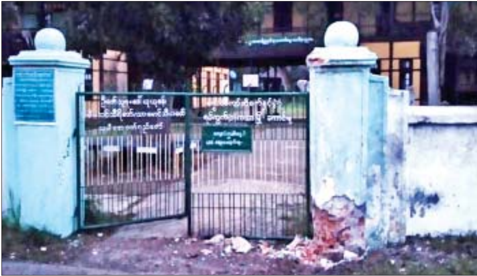
စစ်ကိုင်းတိုင်းဒေသကြီး ကသာမြို့ မြောက်ပိုင်းရပ်ကွက် အမှတ်(၁)အခြေခံပညာအထက်တန်းကျောင်း ရှေ့၌ လက်လုပ်မိုင်းတစ်လုံး ပေါက်ကွဲမှု။

အလားတူ မွန်းလွဲ ၁၂ နာရီ မိနစ် ၂၀ ခန့်တွင် ကျိုက်လတ်မြို့ အမှတ်(၁)ရပ်ကွက် ကျိုက်လတ်-ဖျာပုံကားလမ်းဘေးရှိ ကိုဗစ်-၁၉ ယာယီစစ်ဆေးရေးဂိတ်၌ ပေါက်ကွဲမှုဖြစ်ပွားကြောင်း သတင်းအရ