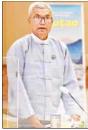
ဒုတိယဝန်ကြီး ဦးရဲတင့်