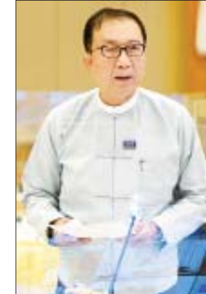
ပြည်ထောင်စုဝန်ကြီး ဦးဝင်းရှိန်