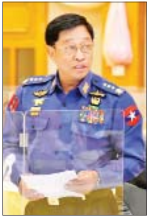
ပြည်ထောင်စုဝန်ကြီး ဗိုလ်ချုပ်ကြီးတင်အောင်စန်း