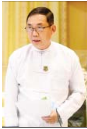
ပြည်ထောင်စုဝန်ကြီး ဦးခင်မောင်ရီ