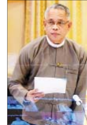
ပြည်ထောင်စုဝန်ကြီး ဦးအောင်နိုင်ဦး