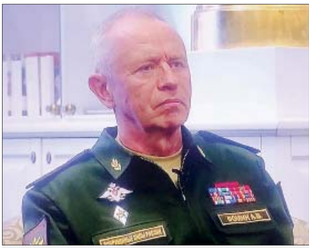
ရုရှားကာကွယ်ရေး ဒုတိယဝန်ကြီး Colonel General Alexander V. Fomin

မြန်မာနိုင်ငံမှာရှိတဲ့ ကျန်းမာရေးဝန်ထမ်းတွေဟာ ကောင်းမွန်စွာ လေ့ကျင့်သင်ကြားထားပြီးတဲ့ လူတွေဖြစ်တယ်။ မိမိ ပရော်ဖက်ရှင်နယ် ကိုလည်း ယုံကြည်ချက် ခံယူချက်မြင့်မားစွာထားတဲ့ လူတွေဖြစ်တာ ရယ်။ တိုင်းသူပြည်သားတွေအတွက်လည်း လိုအပ်တာဖြစ်တဲ့အတွက် နိုင်ငံတော်အပေါ်သစ္စာစောင့်သိစွာဖြင့် ပြန်လည်ပူးပေါင်း ဆောင်ရွက် လာလိမ့်မယ်လို့ ကျွန်တော်ယုံကြည်ပါတယ်။