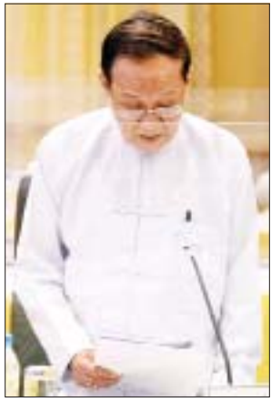
ပြည်ထောင်စုဝန်ကြီး ဦးကိုကို