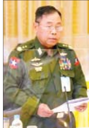
ပြည်ထောင်စုဝန်ကြီး ဒုတိယဗိုလ်ချုပ်ကြီးစိုးထွဋ်