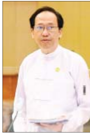
ပြည်ထောင်စုဝန်ကြီး ဒေါက်တာသက်ခိုင်ဝင်း