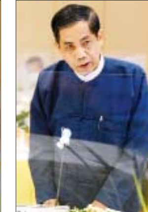
ပြည်ထောင်စုဝန်ကြီး ဦးကိုကိုလှိုင်

ခရီးသွားလုပ်ငန်းနှင့် ဆက်စပ်သည့် အခြား စီးပွားရေးကဏ္ဍများ ပြန်လည်ထူထောင်နိုင်မည့် နည်းလမ်းများကို ဝိုင်းဝန်းဆွေးနွေး အကြံပြုနိုင်ရန် ယနေ့အစည်းအဝေးကိုကျင်းပရခြင်းဖြစ်ကြောင်း။ ခရီးသွားလုပ်ငန်းသည် ကမ္ဘာ့နိုင်ငံများ ဖွံ့ဖြိုးတိုးတက်မှုအတွက် သန်းပေါင်းများစွာသော အလုပ်အကိုင်နှင့် စီးပွားရေးအခွင့်အလမ်းများ ဖန်တီးပေးနိုင်သည့် အပြင် သဘာဝနှင့် ရှေးဟောင်းယဉ်ကျေးမှု အမွေအနှစ်များကို အနာဂတ်မျိုးဆက်သစ်များ လက်ဆင့်ကမ်းခံစားနိုင်ရန်နှင့် ထိန်းသိမ်းကာကွယ်ရေးအတွက် တွန်းအား