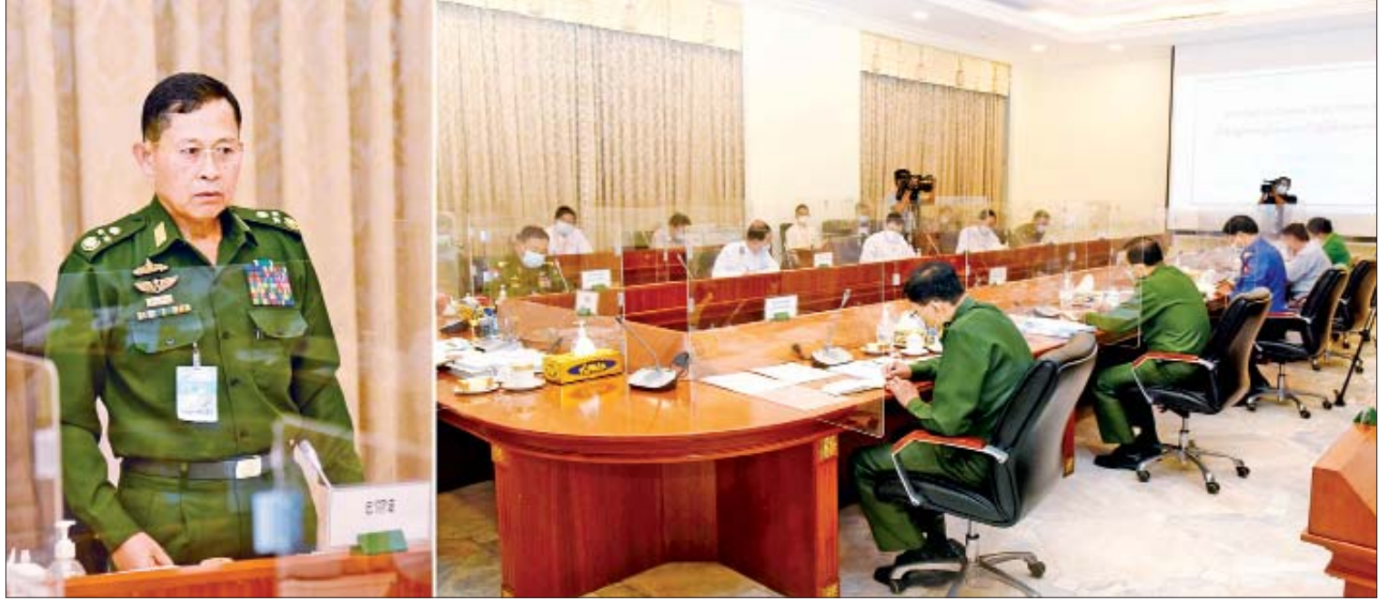
နိုင်ငံတော်စီမံအုပ်ချုပ်ရေးကောင်စီဒုတိယဥက္ကဋ္ဌ၊ ဒုတိယတပ်မတော်ကာကွယ်ရေးဦးစီးချုပ်၊ ကာကွယ်ရေးဦးစီးချုပ်(ကြည်း) ဒုတိယဗိုလ်ချုပ်မှူးကြီး စိုးဝင်း Coronavirus Disease 2019 (COVID-19) ထိန်းချုပ်ရေးနှင့် အရေးပေါ်တုံ့ပြန်ရေးကော်မတီ ပဋိပက္ခအကြိမ်လုပ်ငန်းညှိနှိုင်း အစည်းအဝေးတွင် အမှာစကားပြောကြားစဉ်။

အစည်းအဝေးသို့ ကာကွယ်ရေး ဝန်ကြီးဌာန ပြည်ထောင်စုဝန်ကြီး ဗိုလ်ချုပ်ကြီး မြထွန်းဦး၊ ပြည်ထဲရေး ဝန်ကြီးဌာန ပြည်ထောင်စုဝန်ကြီး ဒုတိယ ဗိုလ်ချုပ်ကြီးစိုးထွဋ်၊ နယ်စပ်ရေးရာ ဝန်ကြီးဌာန ပြည်ထောင်စုဝန်ကြီး ဒုတိယ ဗိုလ်ချုပ်ကြီး ထွန်းထွန်းနောင်၊ သာသနာရေးနှင့် ယဉ်ကျေးမှုဝန်ကြီးဌာန ပြည်ထောင်စုဝန်ကြီး ဦးကိုကို၊ ပို့ဆောင် ရေးနှင့် ဆက်သွယ်ရေးဝန်ကြီးဌာန ပြည်ထောင်စုဝန်ကြီး ဗိုလ်ချုပ်ကြီး တင်အောင်စန်း၊ အလုပ်သမား၊ လူဝင်မှု ကြီးကြပ်ရေးနှင့် ပြည်သူ့အင်အားဝန်ကြီး ဌာန ပြည်ထောင်စုဝန်ကြီး ဦးမြင့်ကြိုင်၊ ပညာရေးဝန်ကြီးဌာန ပြည်ထောင်စု ဝန်ကြီး ဒေါက်တာညွန့်ဖေ၊ ကျန်းမာရေး နှင့်အားကစားဝန်ကြီးဌာန ပြည်ထောင်စု ဝန်ကြီး ဒေါက်တာသက်ခိုင်ဝင်း၊ စာမျက်နှာ ၃ ကော်လံ ၁ သို့ ။