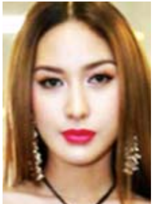
စူးရှနိုင်