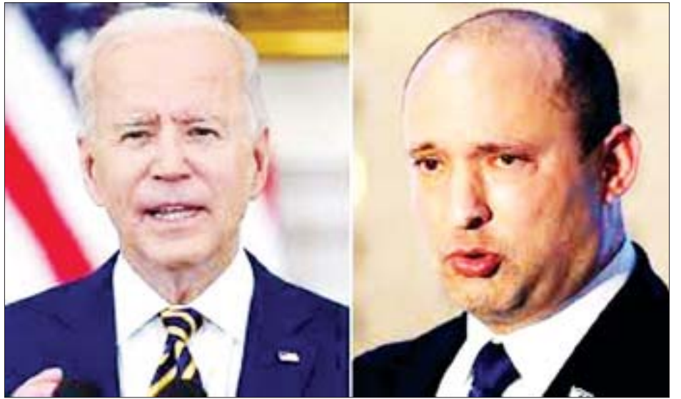
အမေရိကန်သမ္မတ ဂျိုးဘိုင်ဒင်နှင့် အစွရေးဝန်ကြီးချုပ် နက်ဖ်တာလီဘန်နက်

ဂျိုးဘိုင်ဒင်နှင့် နက်ဖ်တာလီဘန်နက်တို့ အကြား တွေ့ဆုံဆွေးနွေးရာတွင် အစွရေးနှင့် ပါလက်