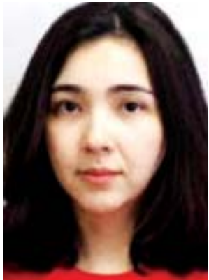
ချစ်သူဝေ