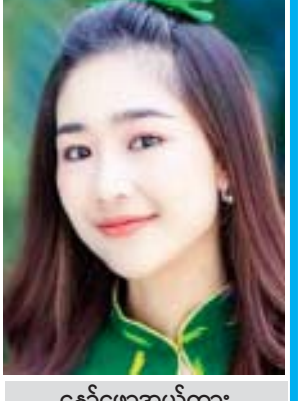
နော်ဖောအယ်ထား