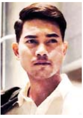
သီဟထွန်း