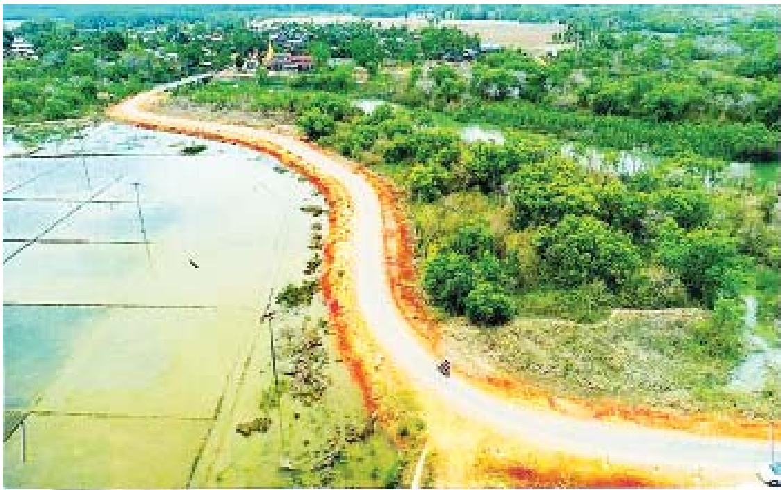
သံဖြူဇရပ်မြို့နယ် ပ-ကရပွဲ - ဝဲကလောင် - အံခဲ - ကော့လေး - ထင်းရှူး - ကျောင်းရွာ - အနင်းကျေးရွာချင်းဆက်လမ်းကို တွေ့ရစဉ်။

Pilot Project လုပ်ငန်းအဖြစ် ဆောင်ရွက် ၂၀၂၀ - ၂၀၂၁ ဘဏ္ဍာရေးနှစ်အတွင်း