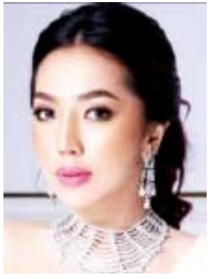
ဝါဆိုမိုးဦး

အထက်ပါ အမှုမှရုပ်သိမ်းပေးခဲ့သည့် အနုပညာရှင်များအနေဖြင့် အလားတူ ကျူးလွန်ချိုးဖောက်မှုများအား ထပ်မံ၍လုပ်ဆောင်မည်ဆို ပါက တည်ဆဲဥပဒေများအရ ထိရောက်စွာ အရေးယူဆောင်ရွက်သွား မည်ဖြစ်သည့်အပြင် ၂၀၂၁ ခုနှစ်၊ ဖေဖော်ဝါရီလ ၁ ရက်မှ ၂၀၂၁ ခုနှစ်၊ ဇွန်လ ၂၀ ရက်အထိ နေပြည်တော်၊ တိုင်းဒေသကြီးနှင့် ပြည်နယ်များ တွင် ဆူပူဆန္ဒပြမှုဖြစ်စဉ်များနှင့်ပတ်သက်၍ ရဲတပ်ဖွဲ့မှ စစ်ဆေးဆဲ တရားခံများနှင့် တရားရုံး၌ စစ်ဆေးဆဲ တရားခံများအနက် ပထမ ဦးစားပေးအဖြစ် ပြန်လည်စေလွှတ်ပေးသင့်သူများကိုလည်း အမှုမှ ရုပ်သိမ်းပေးနိုင်ရေး စိစစ်ဆောင်ရွက်လျက်ရှိကြောင်း ကြိုတင် အသိပေးကြေညာအပ်ပါသည်။