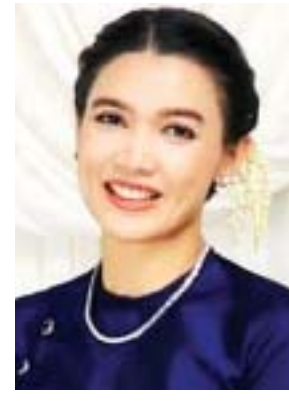
အေးမြတ်သူ