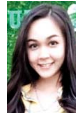
နန်းသူဇာ