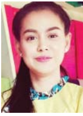
အေးဝတ်ရည်သောင်း