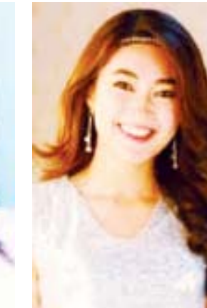
သဇင်နွယ်ဝင်း