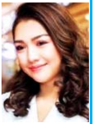
သက်မွန်မြင့်