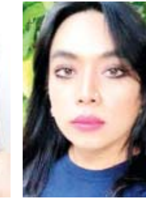
မေဦးမောင်