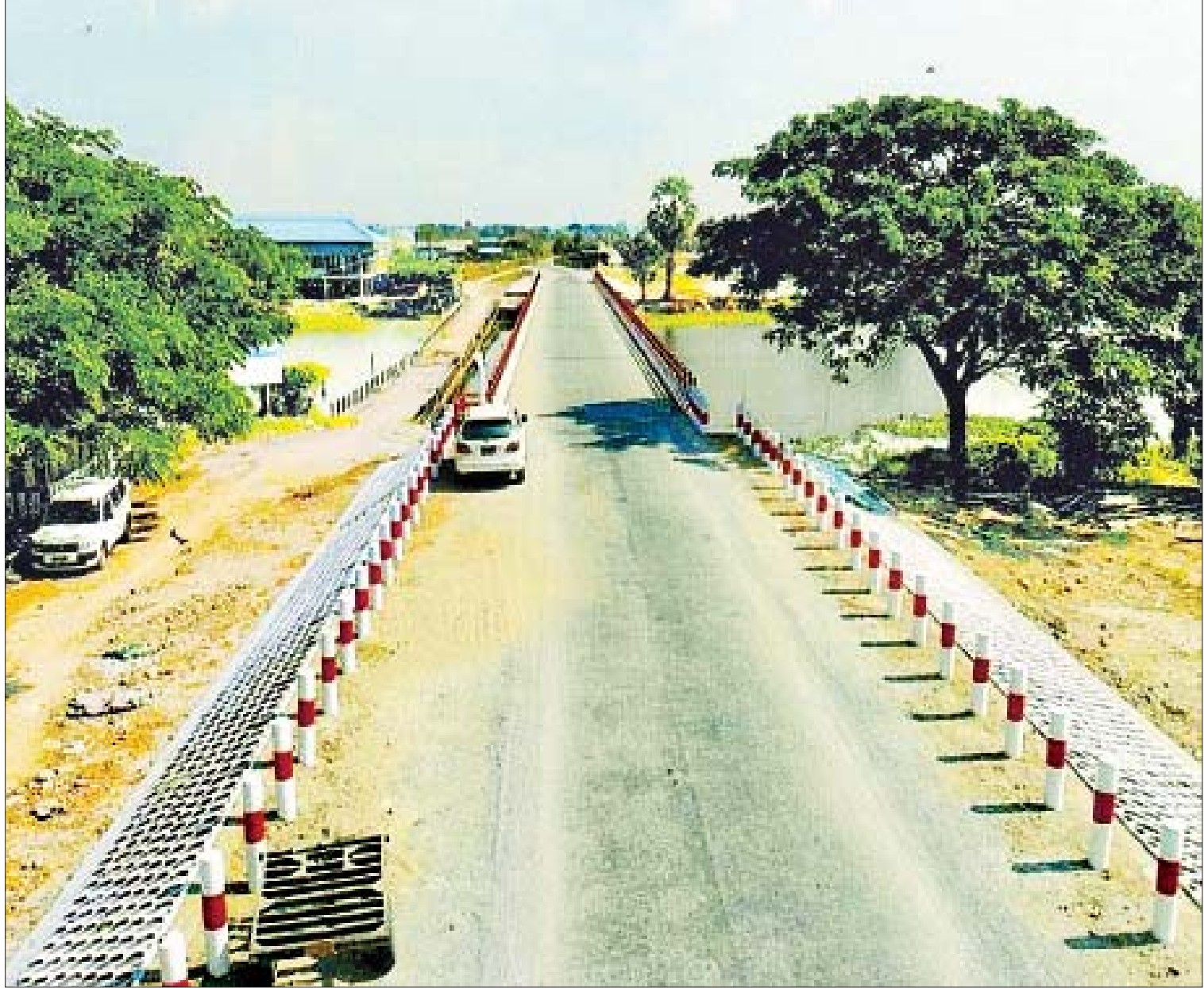
မွန်ပြည်နယ် သထုံခရိုင် ပေါင်မြို့နယ်ရှိ ကျွဲဟော် - ရာမဆိပ်တံတားကို တွေ့ရစဉ်။

၂၀၂၁ ခုနှစ် ဇွန်လ ၃ ရက် သို့မဟုတ် နွေနှောင်းကာလ မိုးဦးကာလ နေ့တစ်နေ့ .....။ ကရင်ပြည်နယ်ကို လက်ပြန်တံဆက်၍ မွန်ပြည်နယ်သို့သွားရန် ကျွန်တော်ကားကို မြို့တော်ဘားအံ၏ သံလွင်မြစ် ကမ်းနားလမ်းအတိုင်း မြောက်မှ တောင်သို့ ဦးတည်မောင်းနှင်လာခဲ့သည်။ ဇွဲကပင်ဟိုတယ်အကျော် ဘားအံတံတား(သံလွင်)၏ ဘားအံဘက် ချဉ်းကပ်လမ်း ပေါ်အရောက်တွင် တံတားကို ကွေ့မတက်ဘဲ လမ်းဆုံ၌ တွေ့ရသည့် မွန်ပြည်နယ် မော်လမြိုင်မြို့သို့ဆိုသည့် ဆိုင်းဘုတ်လမ်းညွှန်အတိုင်း မောင်းလာခဲ့သည်။ ဘားအံ - မော်လမြိုင်ကားလမ်းသည် ပြောငဲ့တန်း