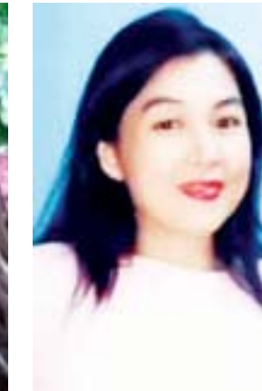
သွင်ပပအောင်