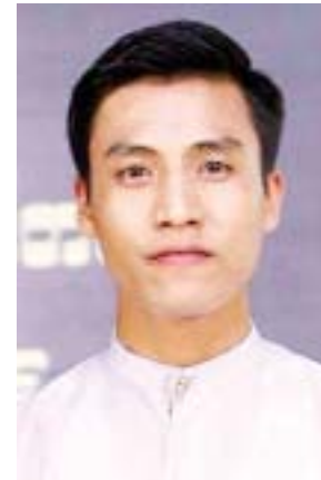
အောင်ထက်