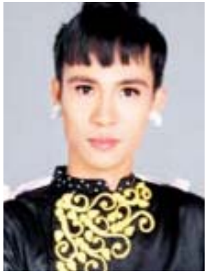
ကျော်ကျော်နန္ဒ