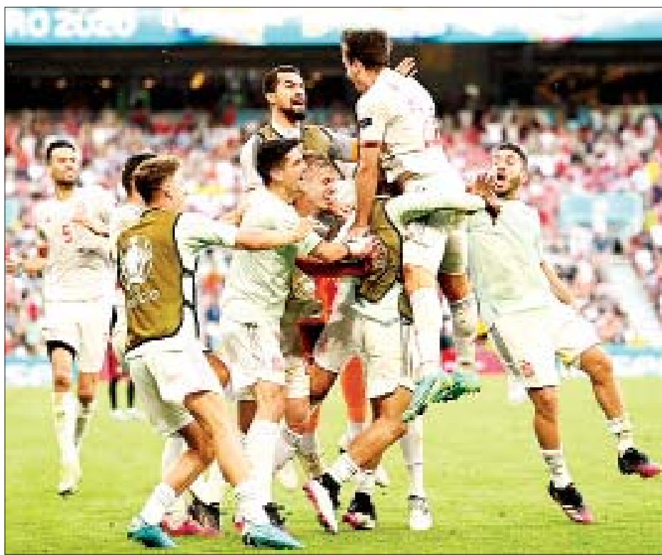
ပြင်သစ်အသင်းကို အနိုင်ရခဲ့သည့် ဆွစ်ဇာလန်အသင်းသားများ အောင်ပွဲခံနေစဉ်။

ယူရို ၂၀၂၀ ပြိုင်ပွဲရဲ့ ၁၆ သင်း အဆင့် ပွဲစဉ်တွေဖြစ်တဲ့ ပြင်သစ် အသင်းနဲ့ ဆွစ်ဇာလန်အသင်း၊ ခရိုအေးရှားအသင်းနဲ့ စပိန် အသင်းတို့ ပွဲစဉ်တွေကို ဇွန် ၂၈ ရက်ညပိုင်းက ယှဉ်ပြိုင်ကစားခဲ့ရာ ပြင်သစ်အသင်းက ဆွစ်ဇာလန် အသင်းကို ရှုံးနိမ့်ခဲ့တာကြောင့် ၁၆ သင်းအဆင့်နဲ့ပဲ ယူရိုပြိုင်ပွဲကို နှုတ်ဆက်ခဲ့ရပြီး စပိန်အသင်းက တော့ ခရိုအေးရှားအသင်းကို အနိုင်ရရှိခဲ့တာကြောင့် ကွာတား ဖိုင်နယ်အဆင့်ကို တက်လှမ်းနိုင် ခဲ့ပါတယ်။