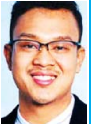
J Fire (ခ) အောင်ကိုငြိမ်း