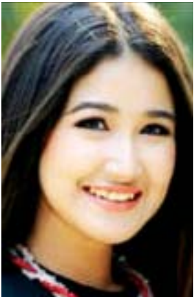
ခြူးပန်းနွယ်