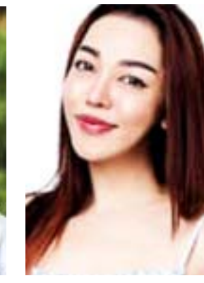
မထက်(ခ) ဥက္ကာထက်