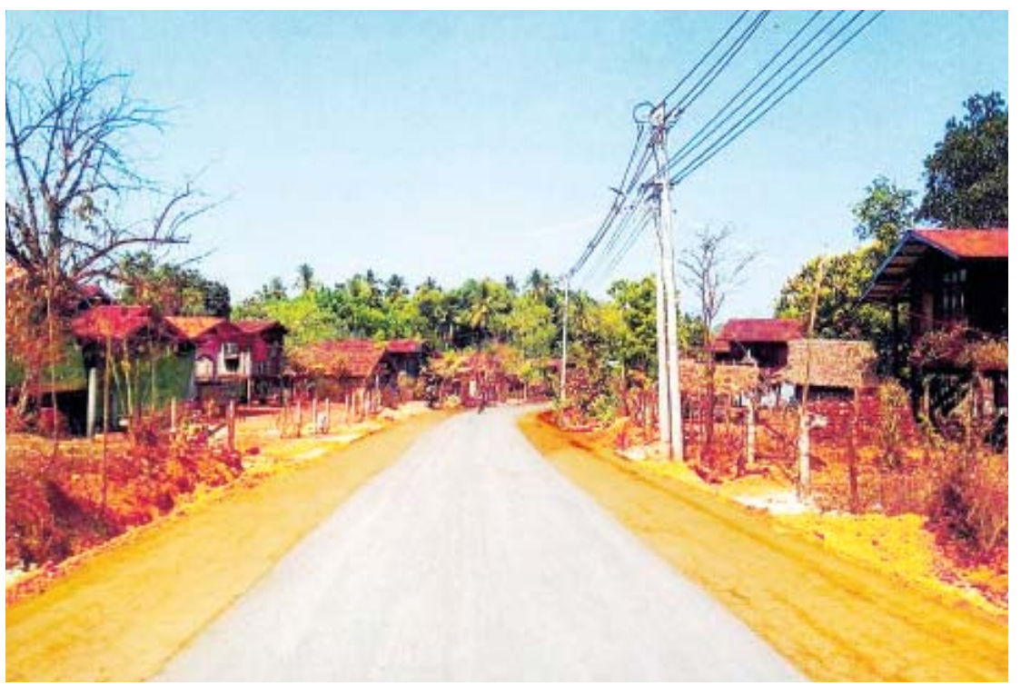
ကျုံဟော်မြို့နယ် ဖန့် - ကျွဲခြံကုန်း ကျေးရွာချင်းဆက် ကတ္တရာလမ်းကို တွေ့ရစဉ်။

မွန်ပြည်နယ် ကျေးလက်လမ်းဖွံ့ဖြိုး ရေးဦးစီးဌာနမှ ကျေးလက်ပြည်သူတို့ အတွက် ဘဏ္ဍာငွေသုံးစွဲမှုမှာ ၂၀၁၇ - ၂၀၁၈ ဘဏ္ဍာနှစ်တွင် ပြည်ထောင်စုနှင့် ပြည်နယ်ရန်ပုံငွေမှ ငွေကျပ် ၃၃၉၅ ဒသမ ၅၅၃ သန်း၊ ၂၀၁၈ - ၂၀၁၉ (၆-လ) ဘဏ္ဍာနှစ်တွင် ပြည်ထောင်စု နှင့် ပြည်နယ်ရန်ပုံငွေမှ ငွေကျပ် ၂၂၅၀ ဒသမ ၀၅၅ သန်း၊ ၂၀၁၈ - ၂၀၁၉ (၁၂-လ) ဘဏ္ဍာနှစ်တွင် ပြည်ထောင်စု နှင့် ပြည်နယ်ရန်ပုံငွေမှ ငွေကျပ် ၁၃၈၅ ဒသမ ၈၃၆ သန်း၊ ၂၀၁၉ - ၂၀၂၀ ဘဏ္ဍာနှစ်တွင် ပြည်ထောင်စု လမ်းရန် ပုံငွေမှ ငွေကျပ် ၁၅၆၅ ဒသမ ၆၂၉ သန်း၊ ၂၀၁၉ - ၂၀၂၀ ဘဏ္ဍာနှစ်တွင် တံတား ရန်ပုံငွေ (ပြည်ထောင်စု) မှ ငွေကျပ် ၁၁၁၈ ဒသမ ၂၀၀ သန်း၊ ၂၀၁၉ - ၂၀၂၀ ဘဏ္ဍာနှစ်တွင် လမ်းရန်ပုံငွေ (ပြည်နယ်) မှ ငွေကျပ် (၁၃၅၆၄ ဒသမ ၁၂၅၅) သန်း၊ ၂၀၁၉ - ၂၀၂၀ ဘဏ္ဍာရေးနှစ်တွင် တံတားရန်ပုံငွေ (ပြည်နယ်) မှ ငွေကျပ် ၂၇၇၇ ဒသမ ၁၇၀ သန်း၊ ၂၀၂၀ - ၂၀၂၁ ဘဏ္ဍာနှစ်တွင် လမ်းရန်ပုံငွေ စာမျက်နှာ ၉ သို့ ☆