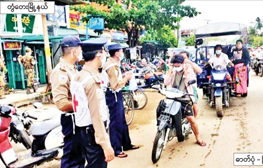
တွံတေးမြို့နယ်