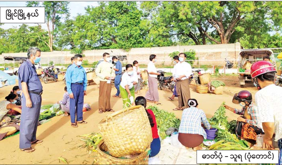
မြိုင်မြိုင်နယ်