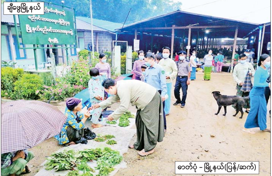
ချီဖွေမြို့နယ်