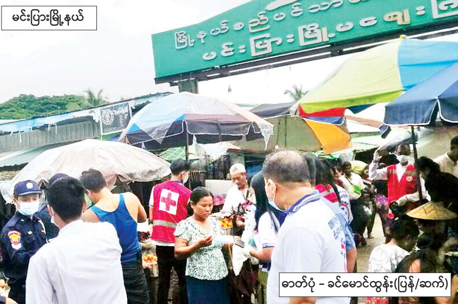
မင်းပြားမြို့နယ်