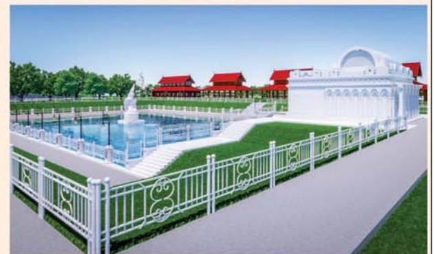
မုစလိန္မတိုက်