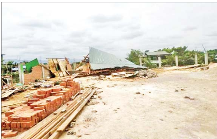
ပြည်ကြီးတံခွန်မြို့နယ်၌ နေအိမ်တစ်လုံးအား အကြမ်းဖက်သူများက “သတင်းပေး”ဟု စွပ်စွဲကာ ဝင်ရောက်ဖျက်ဆီးခဲ့မှု မှတ်တမ်းဓာတ်ပုံ။

နေပြည်တော် ဇွန် ၂၈ တိုင်းဒေသကြီး ပြည်နယ်အချို့ရှိ မြို့နယ် အချို့မှ အကြမ်းဖက်သူအုပ်စုများက ၎င်းတို့၏ လုပ်ဆောင်မှုများအတိုင်း လိုက်လံလုပ်ဆောင်ခြင်းမရှိဘဲ အေးချမ်းစွာနေထိုင်သော ပြည်သူများကို “သတင်းပေး”ဟု စွပ်စွဲပြောဆိုကာ ၎င်းတို့အား ရန်ပြုခြင်း၊ နေအိမ်များကို ဖျက်ဆီးခြင်းများ အုပ်စုဖွဲ့၍ မင်းမဲ့စရိုက်ဆန်ဆန် ပြုလုပ်လျက်ရှိသည်ကို တွေ့ရှိရသည်။