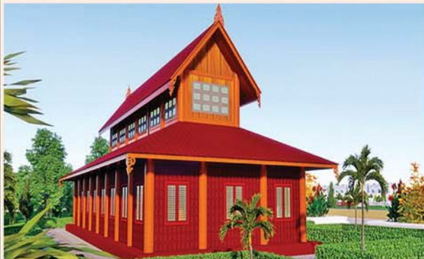
မော်ကွန်းတိုက်(၇၂x၃၀)ပေ ၁ လုံး-၈၈၄ သိန်း