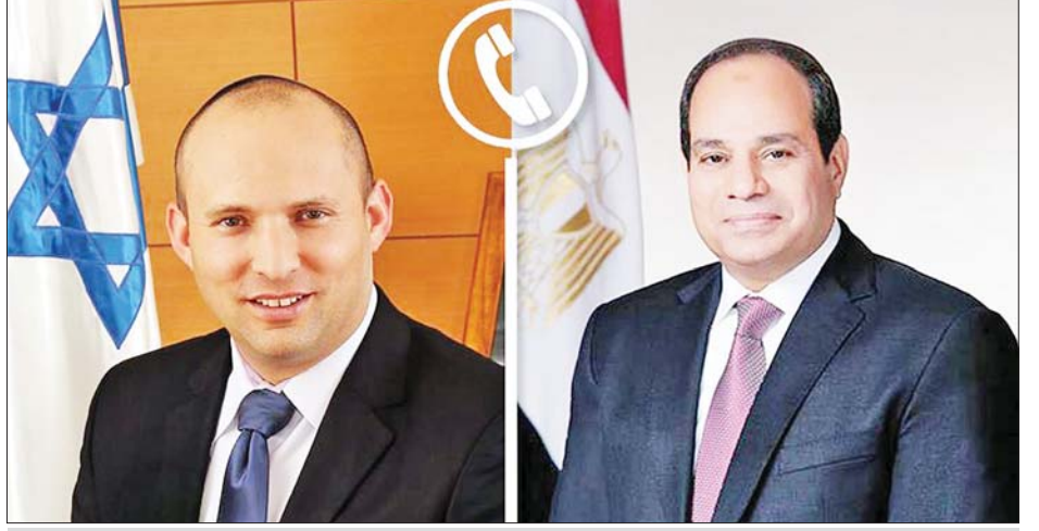
အစ္စရေးဝန်ကြီးချုပ်ဘန်နက်နှင့် အီဂျစ်သမ္မတ အယ်လ်စီစီ

ဆက်လက်၍ အမေရိကန်က ဦးဆောင် ပြုလုပ်သော ငြိမ်းချမ်းရေးသဘောတူစာချုပ်တစ်ရပ်