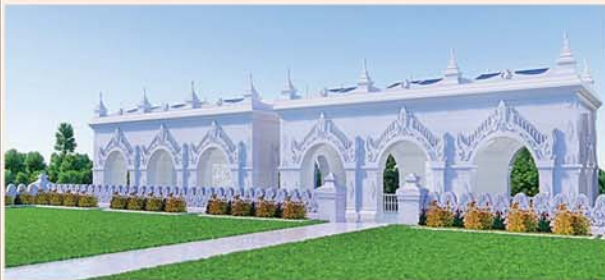
မြန်မာမူစကွေ့ကျောက်ဖြင့် တည်ဆောက်ပူဇော်ထားသော ဂန္ဓကုဋ်တိုက် (၅၄x၂၇)ပေ ၂၄ လုံး ၁ လုံးလျှင်- ၁၂၅၀ သိန်း