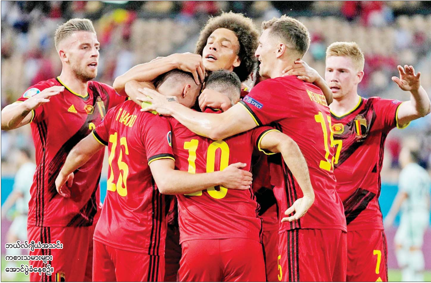
ဘယ်လ်ဂျီယံအသင်းကစားသမားများအောင်ပွဲခံနေစဉ်။