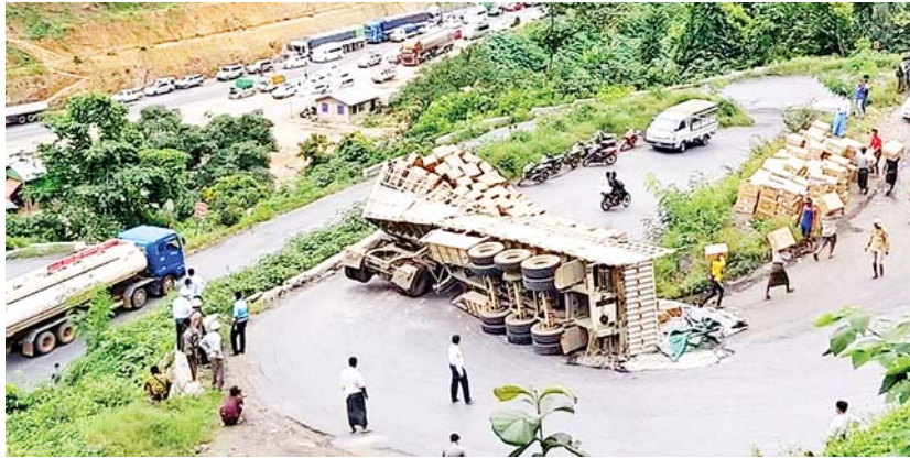
ခွဲကြသည်။ မွန်းလွဲ ၁ နာရီခန့်တွင် ကိုစနစ်တကျ စေလွှတ်ပေးခဲ့ပြီး ပုံမှန်သွားလာလမ်းပြန်ပွင့်သွား၍ အတက်၊ အဆင်းယာဉ်များ နိုင်ငံပြန်ကြောင်း သိရသည်။ ၂၁၀

ဂုတ်တွင်း ဇွန် ၂၈ မန္တလေး-မုဆယ်ပြည်ထောင်စုကားလမ်းမကြီး ပေါ်ရှိ ဂုတ်တွင်းကားလမ်း ခြောက်ထပ်ကျော့တွင် ယနေ့နံနက် ၁၀ နာရီခန့်က အဆင်းကုန်တင်တွဲယာဉ်တစ်စီး တိမ်းမှောက်မှုဖြစ်ပွားပြီး အတက်၊ အဆင်းယာဉ်များ ယာယီလမ်းကြောပိတ်သွားခဲ့ကြောင်း သိရသည်။ အဆိုပါ ကုန်တင်တွဲယာဉ် တိမ်းမှောက်ရာသို့ တာဝန်ရှိသူများရောက်ရှိပြီး တွဲယာဉ်ပေါ်မှ ကုန်ပစ္စည်းများ ရွှေ့ပြောင်းပေးခြင်းနှင့် လမ်းပြန်ပွင့်ရန်အတွက် တိမ်းမှောက်နေသော တွဲယာဉ်အား ကရိုနီးယာဉ်ဖြင့် လမ်းဘေးသို့ ဖယ်ရှားရှင်းလင်းပေးခြင်းများကို ဆောင်ရွက်