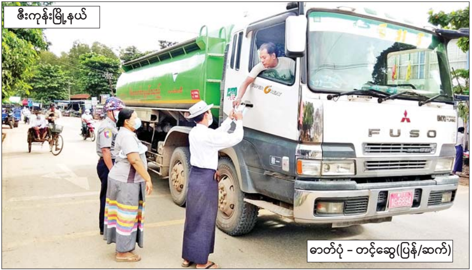
စီးကုန်းမြို့နယ်