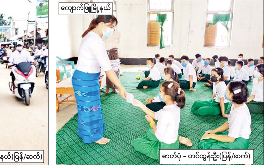
ကျောက်ဖြူမြို့နယ်