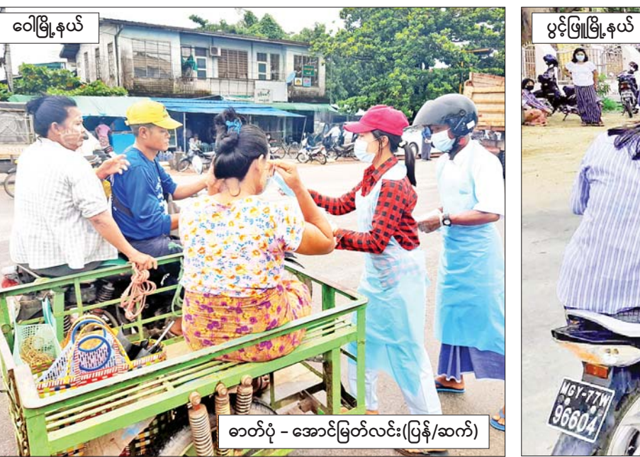
ဝေါမြို့နယ်