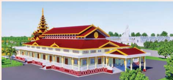
ဓမ္မာရုံ(၂၀၃x၉၀)ပေ ၁ လုံး-၈၇၀၀ သိန်း