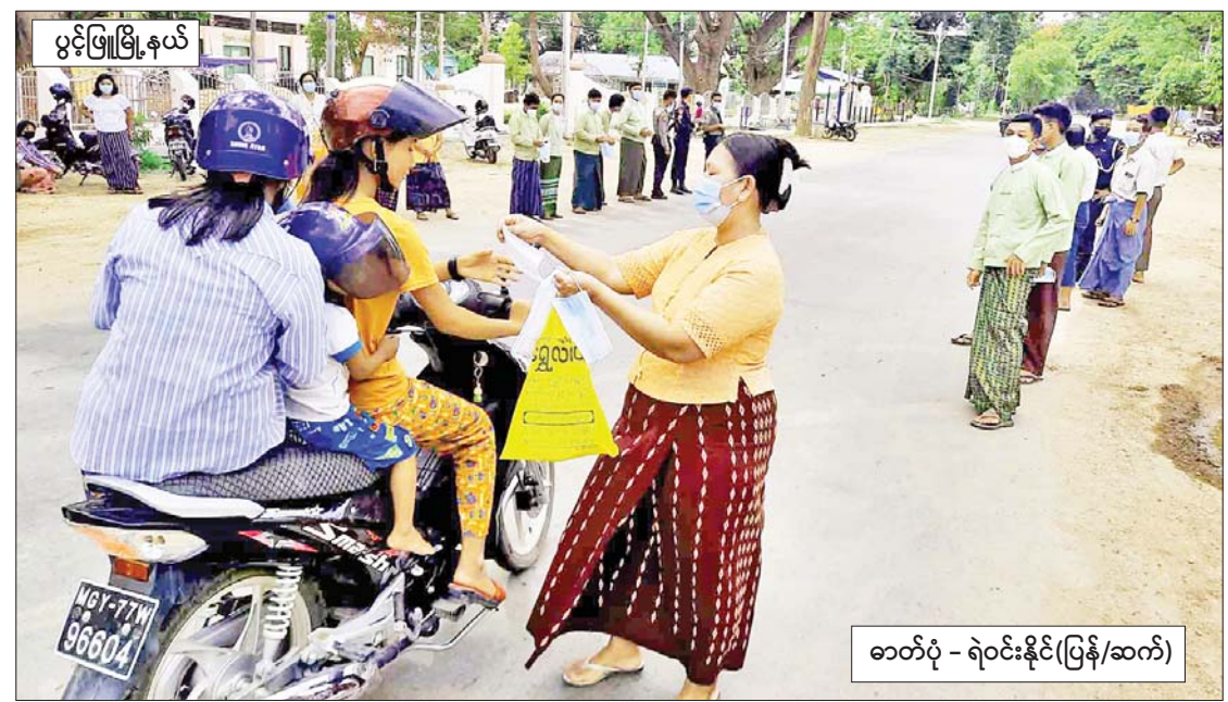
ပွင့်ဖြူမြို့နယ်