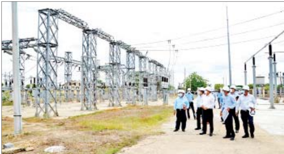
လှည့်လည်ကြည့်ရှုစစ်ဆေးသည်။ သပြေ နေရောင်ခြည်စွမ်းအင်သုံး ဓာတ်အားပေး စက်ရုံစီမံကိန်းသည် မန္တလေးတိုင်းဒေသကြီး သာစည်မြို့နယ် သပြေကျေးရွာအနီးတွင် အကောင် အထည်ဖော်ဆောင်ရွက်လျက်ရှိသည့် မဂ္ဂါဝပ် ၃၀ ဓာတ်အားပေးစက်ရုံ စီမံကိန်းဖြစ်ပြီး ဩဂုတ်လတွင် ပထမအဆင့်အနေဖြင့် ၁၂မဂ္ဂါဝပ် လျှပ်စစ်ဓာတ်အား ထုတ်လုပ်နိုင်ရေး စီမံဆောင်ရွက်လျက်ရှိသည်။

နေပြည်တော် ဇွန် ၁၈ လျှပ်စစ်နှင့် စွမ်းအင်ဝန်ကြီးဌာန ပြည်ထောင်စုဝန်ကြီး ဦးအောင်သန်းဦးသည် ယနေ့ နံနက်ပိုင်းက မန္တလေး တိုင်းဒေသကြီး သာစည်မြို့နယ်၌ အကောင် အထည်ဖော် ဆောင်ရွက်လျက်ရှိသည့် သပြေ နေရောင်ခြည်စွမ်းအင်သုံး ဓာတ်အားပေးစက်ရုံ စီမံကိန်းနှင့် သပြေ ပင်မဓာတ်အားခွဲရုံတို့ကို သွားရောက်ကြည့်ရှုစစ်ဆေးသည်။