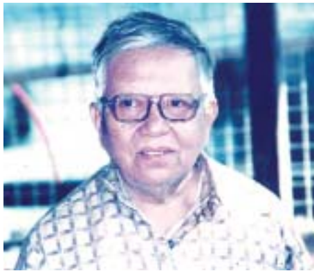
ဆရာကြီး ပါရဂူ

၁၉၇၀ ပြည့်လွန်နှစ်များအတွင်းက ဖြစ်ပါသည်။ ကျွန်တော်သည် အသက် ၂၀ ကျော်ပင် ရှိပါသေးသည်။ သတင်းစာတိုက်များ၊ မဂ္ဂဇင်းတိုက်များသို့ လှည့်လည်၍ စာမူပေး၊ စာမူခထုတ်နှင့် မိမိဘဝကို မိမိကျေနပ်နေသောကာလ ဖြစ်ပါသည်။