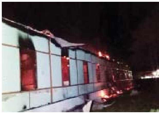
ဟိုပင်မြို့နယ် အင်းလေးကျေးရွာရှိ အခြေခံပညာအလယ်တန်းကျောင်း(ခွဲ)အား ဆူပူအကြမ်းဖက်သူများက မီးရှို့ဖျက်ဆီးထားသည်ကို တွေ့ရစဉ်။