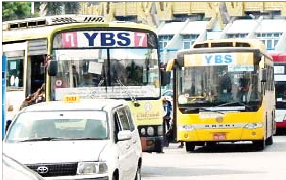
ခရီးသွားပြည်သူများ သွားလာမှုအဆင်ပြေစေရန်အတွက် နေ့စဉ်ပြေးဆွဲပေးနေသော ခရီးသည်တင် YBS ယာဉ်များအား တွေ့ရစဉ်။

ရန်ကုန် ဇွန် ၁၈ ခရီးသွားကဏ္ဍ ပိုမိုစည်ကားလာသော ရန်ကုန်မြို့တွင် YBS ယာဉ်လိုင်းအချို့မှ ခရီးသွားများအပေါ် မချေမငံ ဆက်ဆံမှုနှင့် ယာဉ်စီးခပိုမိုကောက်ခံမှုအပေါ် ပုဂ္ဂလိက သယ်ယူပို့ဆောင်ရေးကြီးကြပ်မှုကော်မတီ မှ ခရီးသည်အသွင်ယူစုံစမ်းမှုနှင့်အတူ အရေးယူ ဆောင်ရွက်လျက်ရှိကြောင်း YRTC မှ သိရသည်။ မေလထက်ခရီးသွားလာမှုနှုန်းဆမြင့်တက် ရန်ကုန်မြို့နေပြည်သူများ ခရီးသွားလာမှု အဆင်ပြေချောမွေ့စေရန် YRTC မှ ဝန်ဆောင်မှု ပေးလျက်ရှိပြီး ဇွန်လအတွင်း ခရီးသွားကဏ္ဍ ပိုမို များပြားခဲ့ရာ ဇွန် ၁၇ ရက်က ယာဉ်လိုင်းပေါင်း ၉၈ လိုင်းတွင် စီးတီးဘတ်စ် ၂၂၃၅ စီး၊ မိနီဘတ်စ် အစီး ၄၂၀၊ ယာဉ်ငယ် ၂၁၅ စီးဖြင့် စုစုပေါင်းအစီးရေ ၂၈၀၀ ပြေးဆွဲ၍ ခရီးသည် ၄၆၅၂၆ ဦးကို ဝန်ဆောင်မှု ပေးနိုင်ခဲ့၍ မေလထက်ခရီးသွားလာမှုနှုန်းဆမြင့်တက် ခဲ့ကြောင်း သိရသည်။ စာမျက်နှာ ၁၁ ကော်လံ ၁ သို့ ၀