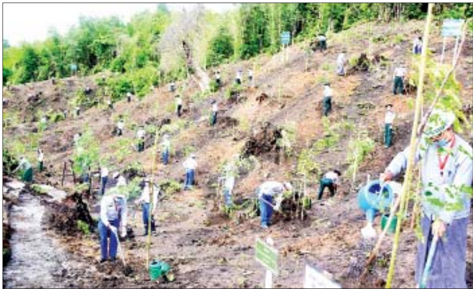
၂၀၂၁ ခုနှစ် ပတ်ဝန်းကျင်စီမံလန်းစိုက်ပျိုးရေးလှုပ်ရှားမှု မိုးရာသီသစ်ပင်စိုက်ပျိုးပွဲသို့ တက်ရောက်လာကြသူများက ပျိုးပင်များ စိုက်ပျိုးပေးကြစဉ်။

ပွဲတွင် ပျိုးပင်ပေါင်း ၆၈ ဒသမ ၈၆ သန်း စိုက်ပျိုးခဲ့ရာ ၅၇ ဒသမ ၈၁ သန်း ရှင်သန်သည့်အတွက် အပင်ရှင်သန်မှုရာခိုင်နှုန်း ၈၃ ဒသမ ၉၆ ရာခိုင်နှုန်းရှိပြီး ယခု ၂၀၂၁ ခုနှစ် ပတ်ဝန်းကျင်စီမံလန်းစိုက်ပျိုးရေးလှုပ်ရှားမှု မိုးရာသီသစ်ပင်စိုက်ပျိုးပွဲတွင် တစ်နိုင်ငံလုံးအတိုင်းအတာအနေဖြင့် ပျိုးပင်ပေါင်း ၃၆ ဒသမ ၂၆ သန်း စိုက်ပျိုးရန် လျာထားကြောင်း သတင်းစဉ်