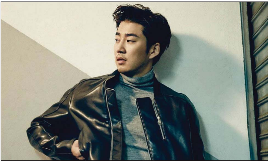
အေးပြည့် - စုစည်းသည်

တောင်ကိုရီးယားရဲ့ ကျော်ကြားတဲ့ မင်းသားတစ်ဦးဖြစ်သူ ယွန်းခိုင်ဆန်းဟာ ချစ်သူရရှိနေပြီဖြစ်ကြောင်း သူ့ရဲ့ အေဂျင်စီက ထုတ်ဖော်ပြောကြားခဲ့ပြီးနောက် မကြာမီမှာ မင်းသားက သူ့ရဲ့ ချစ်သူနဲ့ပတ်သက်ပြီး ကိုယ်တိုင်အသိ ပေးခဲ့ကြောင်း အောကေပေါ့ဒေါ့ကွန်းရဲ့ ရေးသားဖော်ပြ ချက်တွေအရ သိရပါတယ်။