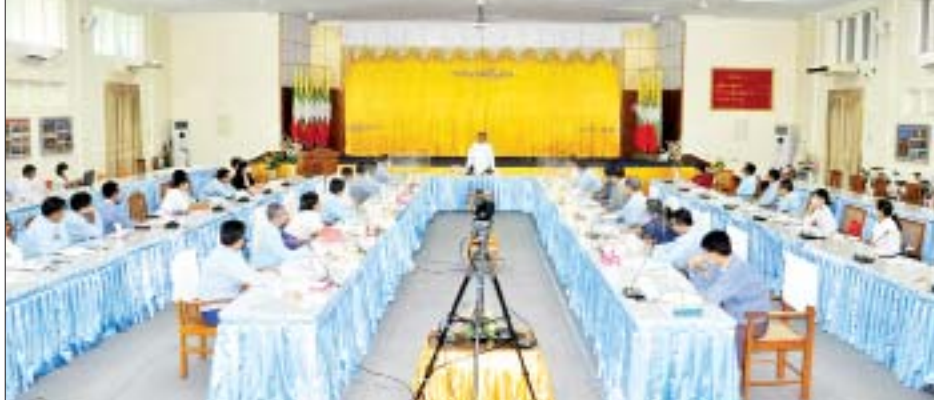
တိုးတက်စေရေးအတွက် စိုက်ပျိုးရေးကို အခြေခံသည့် စက်မှုလုပ်ငန်းများကို ထူထောင်နိုင်ရန် အားပေးရ မည်ဖြစ်ကြောင်း၊ လူ့စွမ်းအားအရင်းအမြစ်စီမံ ခန့်ခွဲရေး လုပ်ငန်းများကိုလည်း အထူးအလေးထား ဆောင်ရွက်သွားရမည်ဖြစ်ကြောင်း၊ မိမိတို့အနေဖြင့် စက်မှုကဏ္ဍနှင့်ပတ်သက်သည့် အခြေခံကောင်းသည့် မူဝါဒများ ချမှတ်နိုင်ရေး ဦးတည်ကြိုးပမ်း ဆောင်ရွက် သွားမည်ဖြစ်ကြောင်း မှာကြားခဲ့သည်။ ပြည်ထောင်စုဝန်ကြီးသည် ယနေ့ နံနက် ၁၀ နာရီတွင် ရုံးအမှတ်(၃၀)ရှိ အစည်းအဝေးခန်းမ၌ ကျင်းပသည့် စက်မှုဝန်ကြီးဌာနရှိ အင်ဂျင်နီယာများ၊ နည်းပညာရှင်များနှင့် နည်းပညာ ကျွမ်းကျင်သူများ မှတ်ပုံတင်နိုင်ရေးအတွက် မြန်မာနိုင်ငံ အင်ဂျင်နီယာ ကောင်စီနှင့် သက်ဆိုင်သော အကြောင်းအရာများ ရှင်းလင်းဆွေးနွေးခြင်းနှင့် စက်မှုလုပ်ငန်းများ ပြန်လည် ထူထောင်နိုင်ရေး အကြံပြုအလုပ်ရုံဆွေးနွေးပွဲသို့ တက်ရောက်သည်။ အခမ်းအနားတွင် ပြည်ထောင်စုဝန်ကြီးက

နေပြည်တော် ဇွန် ၁၈ စက်မှုဝန်ကြီးဌာန၏ လုပ်ငန်းညှိနှိုင်းအစည်းဝေးကို ယမန်နေ့ ညနေပိုင်းတွင် ရုံးအမှတ်(၃၀)အစည်း အဝေးခန်းမ၌ ကျင်းပသည်။