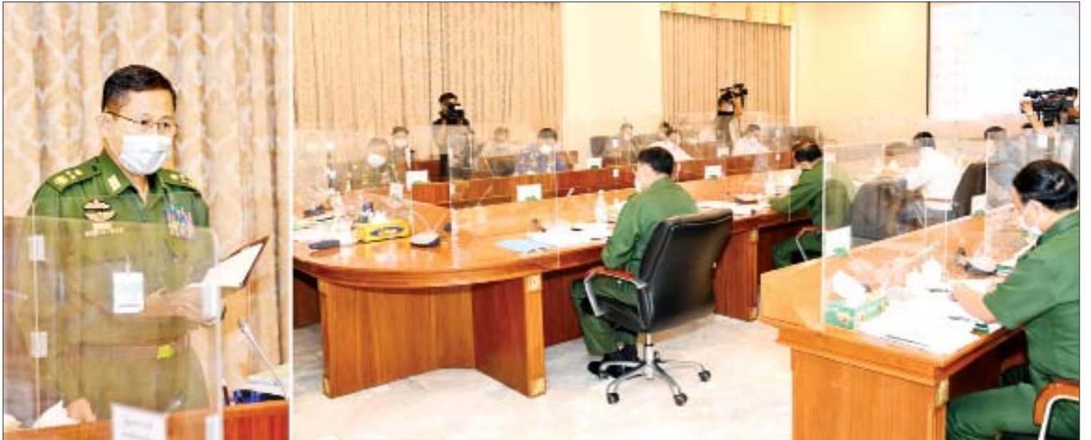
နိုင်ငံတော်စီမံအုပ်ချုပ်ရေးကောင်စီ ဒုတိယဥက္ကဋ္ဌ၊ ဒုတိယတပ်မတော်ကာကွယ်ရေးဦးစီးချုပ် ကာကွယ်ရေးဦးစီးချုပ်(ကြည်း) ဒုတိယဗိုလ်ချုပ်မှူးကြီး စိုးဝင်း Coronavirus Disease 2019 (COVID-19) ထိန်းချုပ်ရေးနှင့် အရေးပေါ်တုံ့ပြန်ရေးကော်မတီ စတုတ္ထအကြိမ်လုပ်ငန်းညှိနှိုင်းအစည်းအဝေးတွင် အမှာစကားပြောကြားစဉ်။

အစည်းအဝေးသို့ ကာကွယ်ရေး ဝန်ကြီးဌာန ပြည်ထောင်စုဝန်ကြီး ဗိုလ်ချုပ်ကြီးမြထွန်းဦး၊ ပြည်ထဲရေး ဝန်ကြီးဌာန ပြည်ထောင်စုဝန်ကြီး ဒုတိယ ဗိုလ်ချုပ်ကြီးစိုးထွန်း၊ နယ်စပ်ရေးရာ ဝန်ကြီးဌာန ပြည်ထောင်စုဝန်ကြီး ဒုတိယ ဗိုလ်ချုပ်ကြီး ထွန်းထွန်းနောင်၊ ပို့ဆောင်ရေးနှင့် ဆက်သွယ်ရေးဝန်ကြီးဌာန ပြည်ထောင်စုဝန်ကြီး ဗိုလ်ချုပ်ကြီး တင်အောင်စန်း၊ အလုပ်သမား၊ လူဝင်မှုကြီးကြပ်ရေးနှင့် ပြည်သူ့အင်အားဝန်ကြီးဌာန ပြည်ထောင်စုဝန်ကြီး ဦးမြင့်ကြိုင်၊ ကျန်းမာရေးနှင့် အားကစားဝန်ကြီးဌာန ပြည်ထောင်စုဝန်ကြီး ဒေါက်တာ သက်ခိုင်ဝင်း၊ လူမှုဝန်ထမ်း၊ ကယ်ဆယ်ရေးနှင့် ပြန်လည်နေရာချထားရေးဝန်ကြီးဌာန ပြည်ထောင်စုဝန်ကြီး ဒေါက်တာ သက်သက်ခိုင်၊ ပြည်ထဲရေးဝန်ကြီးဌာန စာမျက်နှာ ၈ ကော်လံ ၁ သို့ ❖