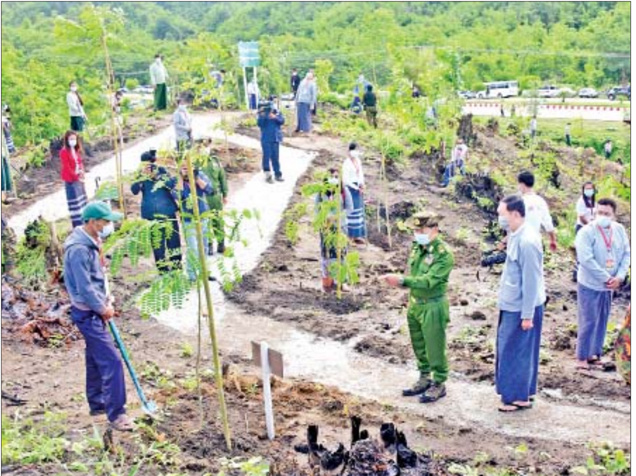
နိုင်ငံတော်စီမံအုပ်ချုပ်ရေးကောင်စီဥက္ကဋ္ဌ၊ တပ်မတော်ကာကွယ်ရေးဦးစီးချုပ် ဗိုလ်ချုပ်မှူးကြီး မင်းအောင်လှိုင် ဖိုးဇောင်တောင် ကြိုးဝိုင်း အကွက်အမှတ်(၁၇)၌ ပျိုးပင်များ စိုက်ပျိုးထားရှိမှုအား ကြည့်ရှုအားပေးစဉ်။

တစ်နိုင်ငံလုံးအတိုင်းအတာဖြင့် ၂၀၁၇ ခုနှစ် ပတ်ဝန်းကျင်စီမံလန်းစိုက်ပျိုးရေးလှုပ်ရှားမှု မိုးရာသီသစ်ပင်စိုက်ပျိုးပွဲတွင် ပျိုးပင်ပေါင်း ၇၂ ဒသမ ၈၈ သန်း စိုက်ပျိုးခဲ့ရာ ၅၉ ဒသမ ၀၂ သန်း ရှင်သန်သည့်အတွက် အပင်ရှင်သန်မှုရာခိုင်နှုန်း ၈၀ ဒသမ ၉ ရာခိုင်နှုန်းရှိကြောင်း၊ ၂၀၁၈ ခုနှစ် ပတ်ဝန်းကျင်စီမံလန်းစိုက်ပျိုးရေးလှုပ်ရှားမှု မိုးရာသီသစ်ပင်စိုက်ပျိုးပွဲတွင် ပျိုးပင်ပေါင်း ၇၃ ဒသမ ၂၂ သန်းစိုက်ပျိုးခဲ့ရာ ၆၂ ဒသမ ၃၂ သန်း ရှင်သန်သည့်အတွက် အပင်ရှင်သန်မှု ရာခိုင်နှုန်း ၈၅ ဒသမ ၁၁ ရာခိုင်နှုန်းရှိကြောင်း၊ ၂၀၁၉ ခုနှစ် ပတ်ဝန်းကျင်စီမံလန်းစိုက်ပျိုးရေးလှုပ်ရှားမှု မိုးရာသီသစ်ပင်စိုက်ပျိုးပွဲတွင် ပျိုးပင်ပေါင်း ၆၈ ဒသမ ၇၉ သန်းစိုက်ပျိုးခဲ့ရာ ၅၈ ဒသမ ၄၈ သန်း ရှင်သန်သည့်အတွက် အပင်ရှင်သန်မှုရာခိုင်နှုန်း ၈၅ ဒသမ ၀၁ ရာခိုင်နှုန်းရှိကြောင်း၊ ၂၀၂၀ ခုနှစ် ပတ်ဝန်းကျင်စီမံလန်းစိုက်ပျိုးရေးလှုပ်ရှားမှု မိုးရာသီသစ်ပင်စိုက်ပျိုး