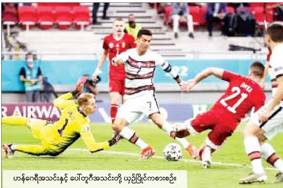
ဟန်ဂေရီအသင်းနှင့် ပေါ်တူဂီအသင်းတို့ ယှဉ်ပြိုင်ကစားစဉ်။

ဟန်ဂေရီအသင်းနဲ့ ပေါ်တူဂီ အသင်းတို့ပွဲစဉ်မှာ ပေါ်တူဂီ အသင်းအတွက် သွင်းဂိုးတွေ ကို ပွဲကစားချိန် ၈၄ မိနစ်မှာ စာမျက်နှာ ၂၀ ကော်လံ ၄ သို့ ❖