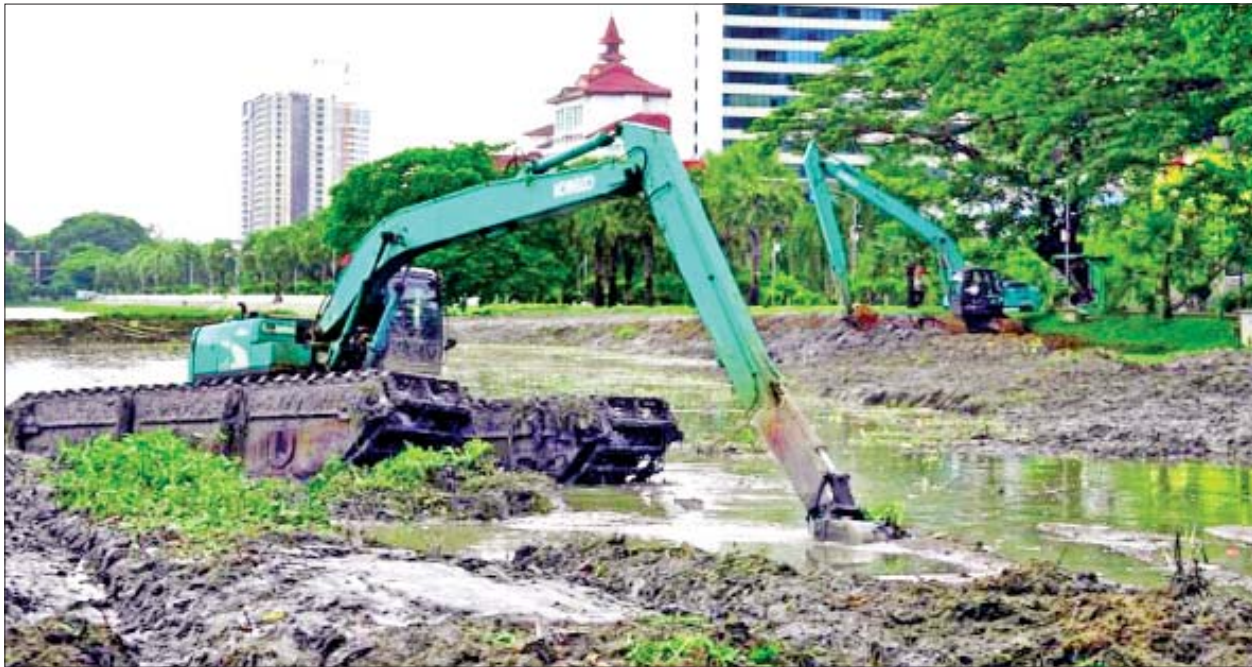
ရန်ကုန်မြို့၊ ကမ္ဘာအေးစေတီလမ်း ကုက္ကိုင်းလမ်းဆုံအနီး အင်းလျားကန် ပြုပြင်ထိန်းသိမ်းစဉ်။

ပြန့်ပွားမှုကို ထိန်းချုပ်နိုင်ပြီဖြစ်သည့်အတွက် ၂၀၂၁-၂၀၂၂ ပညာ သင်နှစ်အတွက် အခြေခံပညာဦးစီးဌာနအောက်ရှိ အခြေခံပညာ အထက်တန်းအဆင့်၊ အလယ်တန်းအဆင့်နှင့် မူလတန်းအဆင့် ကျောင်းများအား ဇွန် ၁ ရက်နေ့မှစ၍ မြန်မာနိုင်ငံတစ်ဝန်း၌ တစ်ပြိုင် တည်း အေးချမ်းတည်ငြိမ်စွာ စတင်ဖွင့်လှစ်သင်ကြားလျက်ရှိ သည်။ စာမျက်နှာ ၅ ကော်လံ ၁ သို့ ❀