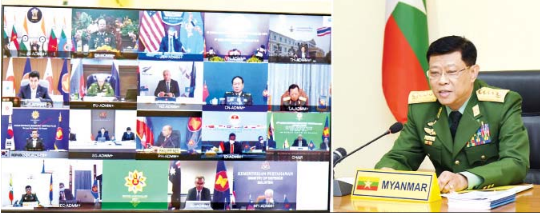
ပြည်ထောင်စုဝန်ကြီး ဗိုလ်ချုပ်ကြီး မြထွန်းဦး (၈)ကြိမ်မြောက် အာဆီယံအပေါင်း ကာကွယ်ရေးဝန်ကြီးများ အစည်းအဝေး တက်ရောက်စဉ်။

လောကကို ရှုကျင့်သူ ရေပြင်ကို ရှုမြင်ရသကဲ့သို့လည်းကောင်း၊ တံလျှပ်ကို ရှုမြင်ရသကဲ့သို့လည်းကောင်း၊ ဤအတူ (ခန္ဓာငါးပါးဟူသော) လောကကို ရှုကျင့်သူကို သေမင်းသည် မမြင်နိုင်။ ဤသို့ ရှုသောသူသည် သေခြင်းကင်းရာ နိဗ္ဗာန်ကို မျက်မှောက်ပြုကြကုန်၏။ ထိုသူတို့အား နောက်တစ်ကြိမ် ပဋိသန္ဓေနေ့၍ သေရခြင်းသည် မရှိတော့ပြီ။ လောကဝဂ် (ဓမ္မပဒ-၁၇၀)