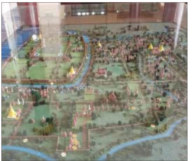
အင်းဝပြတိုက်တွင် ဖွင့်လှစ်ပြသထားသည့် အင်းဝမြို့ဟောင်း ပုံစံငယ်ပြခန်း။

မြို့ဟောင်းဒေသအတွင်းမှာ လည်ပတ်ရမယ့်နေရာတွေကို အဓိကထားပြီး ဖော်ပြထားတဲ့အတွက် အင်းဝဒေသကို လာရောက်လေ့လာမယ်ဆိုရင် ဒီပုံစံငယ်လေးကို အရင်ဆုံးလာရောက်ကြည့်ရှုပြီးမှ အင်းဝဒေသအတွင်းကို လည်ပတ်ရတာ ပိုပြီးအဆင်ပြေမယ်လို့ ထင်ပါတယ်” ဟု ၎င်းက ဆက်လက်ပြောကြားသည်။ အင်းဝပြတိုက်ကို အများပြည်သူကြည့်ရှုလေ့လာနိုင်ရန်အတွက် အပတ်စဉ် တနင်္လာနေ့နှင့် အစိုးရပြန်တမ်းဝင်ရုံးပိတ်ရက်များမှအပ နေ့စဉ် နံနက် ၉ နာရီမှ ညနေ ၄ နာရီခွဲအထိ ဖွင့်လှစ်ထားရှိပြီး လက်ရှိအချိန်တွင် ပြည်တွင်း၊ ပြည်ပခရီးသွားများအတွက် ဝင်ကြေးငွေကောက်ခံခြင်းမရှိကြောင်း သိရသည်။ လက်ရှိတွင် အင်းဝပြတိုက်အား ၂၀၁၉-၂၀၂၀ ဘဏ္ဍာနှစ်တွင် ပြတိုက်အမိုးပိုင်း ပြုပြင်ရေးလုပ်ငန်းများကို ငွေကျပ်သိန်း ၂၀၀ သုံးစွဲ၍ ဆောင်ရွက်ခဲ့သည့်အပြင် ယခု ၂၀၂၀-၂၀၂၁ ဘဏ္ဍာ