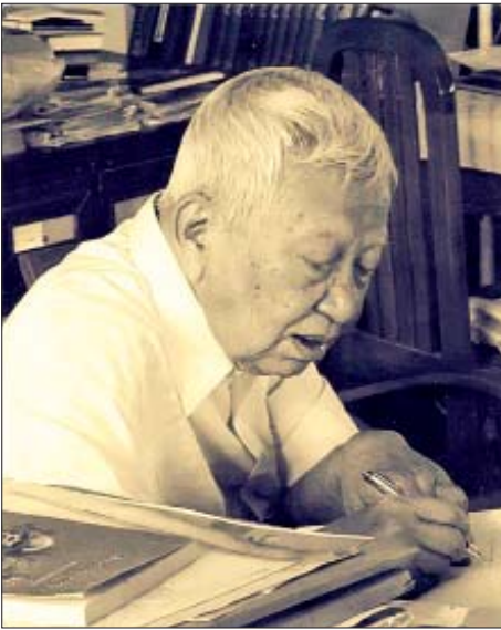
ဆရာကြီး ပါရဂူ

ထိုသို့သော လေးစားသင့်လေးစားထိုက်တဲ့ စာရေးဆရာ၊ ဆရာမကြီးတွေကို နိုင်ငံတော်ကရာ ပြည်သူတွေကပါ ချစ်ခင်ကြပြီး သူတို့ရဲ့စာပေတွေ ကိုလည်း တန်ဖိုးထားတဲ့ အစဉ်အလာရှိပါတယ်။ ပြည်သူ့အတွက် အကျိုးပြုစာပေတွေ ရေးသားတဲ့ စာရေးဆရာကြီးတွေကို နှစ်စဉ်ရွေးချယ်ပြီး အမျိုးသားစာပေဆုတွေ ချီးမြှင့်သလို ဘဝ တစ်သက်တာ စာရေးခြင်းနဲ့ ပညာရပ်ဆိုင်ရာ သုတေသနလုပ်ငန်းတွေကို အလေးထားဆောင်ရွက် ခဲ့တဲ့ လေးစားထိုက်တဲ့ စာပေလက်ရာအများအပြား