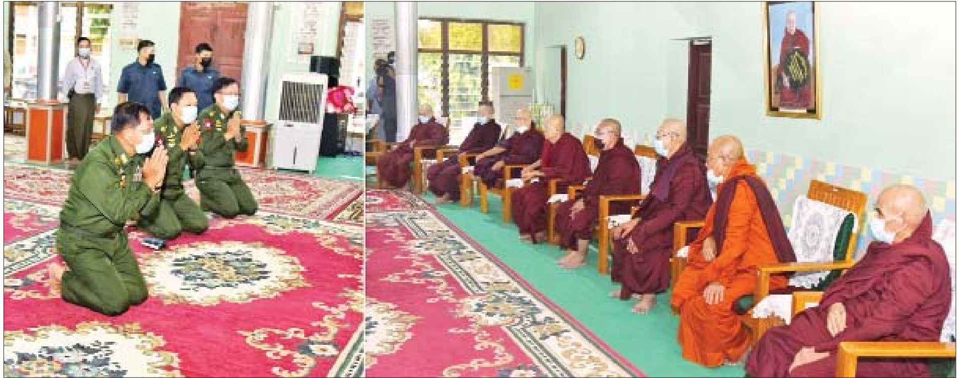
နိုင်ငံတော်စီမံအုပ်ချုပ်ရေးကောင်စီဥက္ကဋ္ဌ တပ်မတော်ကာကွယ်ရေးဦးစီးချုပ် ဗိုလ်ချုပ်မှူးကြီး မင်းအောင်လှိုင် ဩဝါဒါစရိယ ဆရာတော်ကြီးများအား ဖူးမြော်ကြည်ညိုစဉ်။

(နိုင်ငံတော်စီမံအုပ်ချုပ်ရေးကောင်စီဥက္ကဋ္ဌ၊ တပ်မတော်ကာကွယ်ရေးဦးစီးချုပ် ဗိုလ်ချုပ်မှူးကြီး မင်းအောင်လှိုင် ၂၀-၅-၂၀၂၁ ရက်နေ့တွင် နိုင်ငံတော်စီမံအုပ်ချုပ်ရေးကောင်စီ စီမံခန့်ခွဲရေးကော်မတီ အစည်းအဝေး၌ ပြောကြားသည့်အမှာစကားမှ ကောက်နုတ်ချက်)