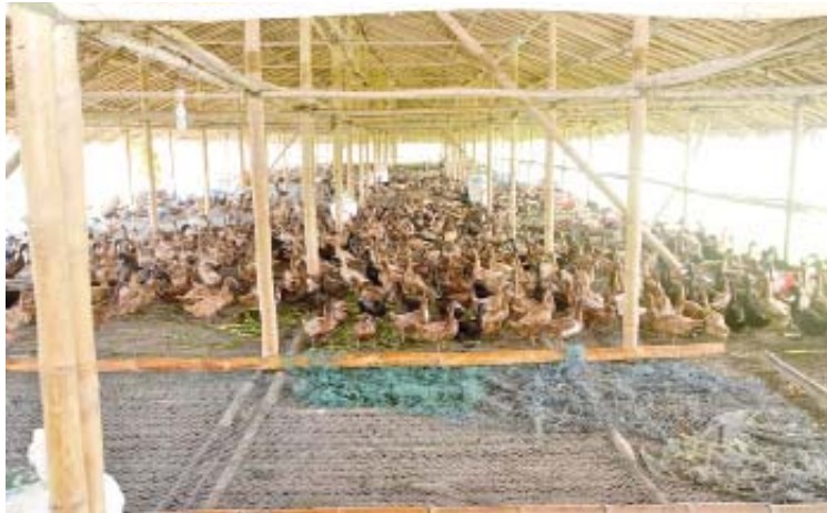
ကဝမြို့နယ်ရှိ ဘဲမွေးမြူရေးခြံအတွင်း ဘဲများမွေးမြူထားရှိသည်ကို တွေ့ရစဉ်။

နေပြည်တော် အပြန်ခရီးတွင်ကား သနပ်ပင်ဘက်မှ လှည့်ပြီးပြန်ဖြစ်သည်။ ဘဲမွေးမြူရေးနှင့် သားဖောက်လုပ်ငန်းကို ကြည့်ရှုစစ်ဆေးပြီး လိုအပ်သည်များကို ဖြည့်ဆည်းဆောင်ရွက်ပေးလို၍ ဖြစ်သည်။ ၂၀၁၉-၂၀၂၀ ဘဏ္ဍာရေးနှစ် မွေးမြူရေးနှင့် ကုသရေးဦးစီးဌာန၏ တိရစ္ဆာန်မွေးမြူကောင်ရေ စာရင်းအရ မြန်မာတစ်ပြည်လုံးတွင် ဘဲကောင်ရေ ၃၅ သိန်းခန့် မွေးမြူထားသည့်အနက် ပဲခူးတိုင်းဒေသကြီးအတွင်း ၁၆၉၁၁၈ ကောင် မွေးမြူထားသည်။ တစ်နိုင်ငံလုံး