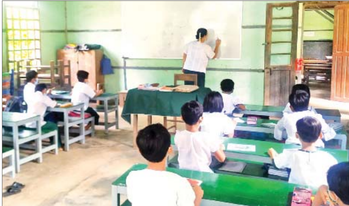
တောင်ငူမြို့ အမှတ်(၅)အခြေခံပညာအထက်တန်းကျောင်း၌ ပညာသင်ကြားနေသည့် ကျောင်းသား ကျောင်းသူများကို တွေ့ရစဉ်။

နေပြည်တော် ဇွန် ၁၁ ၂၀၂၁-၂၀၂၂ ပညာသင်နှစ်အတွက် အခြေခံပညာဦးစီးဌာနအောက်ရှိ အခြေခံပညာအထက်တန်းအဆင့်၊ အလယ်တန်းအဆင့်နှင့် မူလတန်းအဆင့်ကျောင်းများကို ဇွန် ၁ ရက်မှစ၍ မြန်မာနိုင်ငံတစ်ဝန်း၌ တစ်ပြိုင်တည်း အေးချမ်းတည်ငြိမ်စွာ စတင်ဖွင့်လှစ်သင်ကြားလျက်ရှိသည်။ ထိုသို့ စာသင်ကျောင်းများ ပြန်လည်ဖွင့်လှစ်လျက်ရှိရာ ယနေ့တွင် နေပြည်တော်၊ ရန်ကုန်နှင့် မန္တလေးတိုင်းဒေသကြီးအတွင်းရှိ ကျောင်းများအပြင် တိုင်းဒေသကြီးနှင့် ပြည်နယ်အသီးသီးရှိ အခြေခံပညာကျောင်းများ၌ ကျောင်းသားကျောင်းသူများက ကိုဗစ်-၁၉ စည်းမျဉ်းစည်းကမ်းများနှင့်အညီ တက်ရောက်ပညာသင်ကြားလျက်ရှိသည်။ စာမျက်နှာ ၂၃ ကော်လံ ၁ သို့ ❖