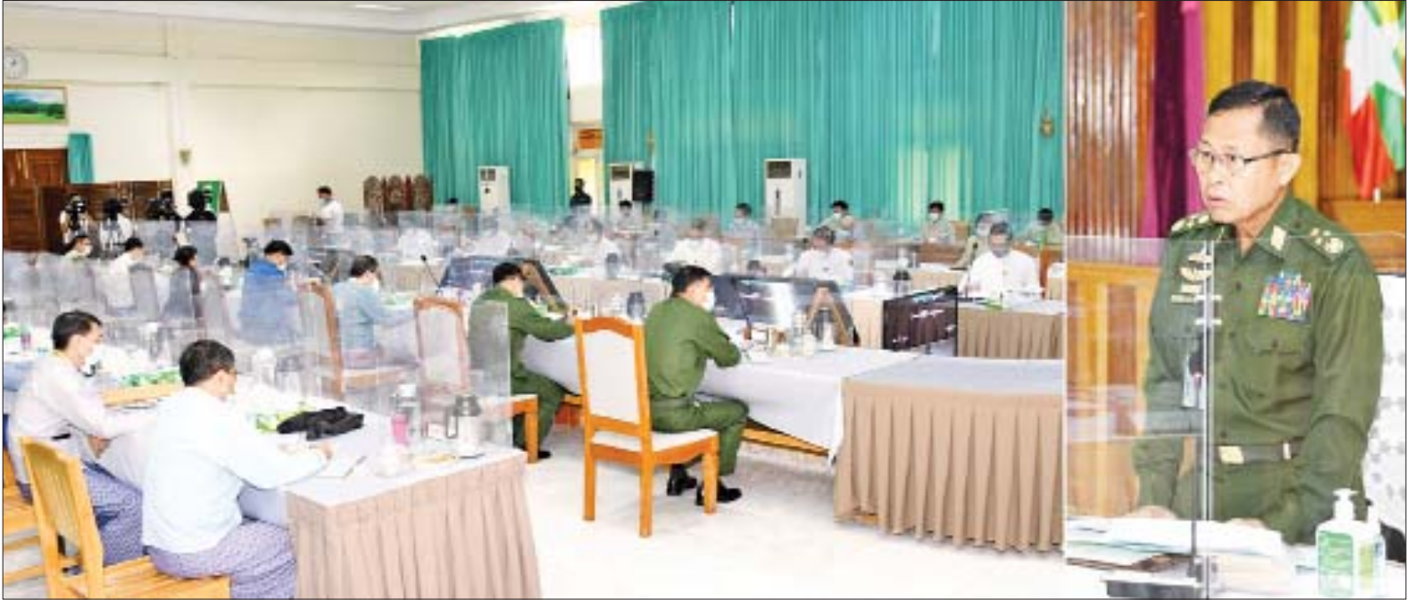
နိုင်ငံတော်စီမံအုပ်ချုပ်ရေးကောင်စီဒုတိယဥက္ကဋ္ဌ၊ ဒုတိယတပ်မတော်ကာကွယ်ရေးဦးစီးချုပ်၊ ကာကွယ်ရေးဦးစီးချုပ်(ကြည်း) ဒုတိယဗိုလ်ချုပ်မှူးကြီးစိုးဝင်း အမျိုးသားမြေအသုံးချမှုကောင်စီ (ပထမအကြိမ်)အစည်းအဝေးတွင် အမှာစကားပြောကြားစဉ်။

နေပြည်တော် ဇွန် ၁၁ အမျိုးသားမြေအသုံးချမှုကောင်စီ (ပထမအကြိမ်) အစည်းအဝေးကို ယနေ့ မွန်းလွဲ ၂ နာရီတွင် နေပြည်တော်ရှိ သယံဇာတနှင့် သဘာဝပတ်ဝန်းကျင်ထိန်းသိမ်းရေးဝန်ကြီးဌာန အင်ကြင်းခန်းမ၌ ကျင်းပရာ အမျိုးသားမြေအသုံးချမှုကောင်စီဥက္ကဋ္ဌ၊ နိုင်ငံတော်စီမံအုပ်ချုပ်ရေးကောင်စီ ဒုတိယဥက္ကဋ္ဌ၊ ဒုတိယတပ်မတော်ကာကွယ်ရေးဦးစီးချုပ်၊ ကာကွယ်ရေးဦးစီးချုပ်(ကြည်း) ဒုတိယဗိုလ်ချုပ်မှူးကြီးစိုးဝင်း တက်ရောက်အမှာစကား ပြောကြားသည်။ အစည်းအဝေးသို့ အမျိုးသားမြေအသုံးချမှု ကောင်စီဝင် ပြည်ထောင်စုဝန်ကြီးများဖြစ်ကြသည့် ဗိုလ်ချုပ်ကြီးမြထွန်းဦး၊ စာမျက်နှာ ၄ ကော်လံ ၁ သို့ ❖