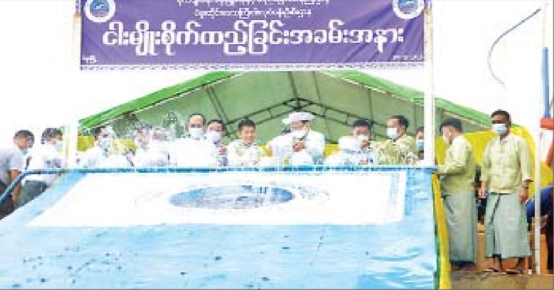
ပဲခူးမြစ်အတွင်း ငါးမျိုးစိုက်ထည့်စဉ်။

ပဲခူးမြစ် မြို့ဦးကင်းတံတားထိပ်တွင် ပဲခူးမြို့စီမံအုပ်ချုပ်ရေးကောင်စီအဖွဲ့ဝင်နှင့် ဌာနဆိုင်ရာအကြီးအကဲများ၊ ငါးလုပ်ငန်းဦးစီးဌာနမှ တာဝန်ရှိသူများ၊ ငါးလွတ်ပွဲ လာရောက်ကြည့်ရှုသူများဖြင့် စည်ကားနေသည်။ နံနက် ၇ နာရီခွဲခန့်ရှိပြီဖြစ်၍ နေပြည်တော်လည်း ရွှေရည်ဝင်းလို့နေသည်။ စိုက်ပျိုးရေး၊ မွေးမြူရေးနှင့် ဆည်မြောင်းဝန်ကြီးဌာန ဒုတိယဝန်ကြီး၏စကားသံကို အားလုံး ငြိမ်နားထောင်နေကြသည်။