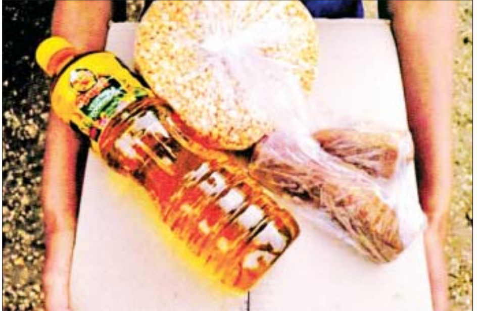
အမျိုးသားဒီမိုကရေစီအဖွဲ့ချုပ်ပါတီ(NLD)မှ မင်းကင်းမြို့ပေါ်ရှိ ရပ်ကွက်များတွင် မဲဆွယ်စည်းရုံးရေးကာလအတွင်း ဆန်၊ ဆီ၊ ပဲ ပေးဝေနေမှုမှတ်တမ်းဓာတ်ပုံများ။