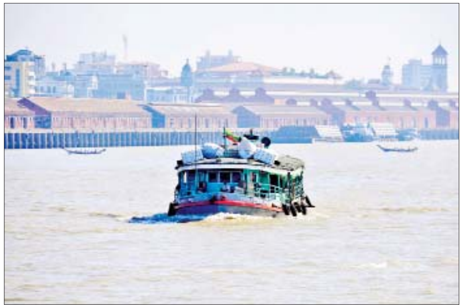
ရန်ကုန်မြို့မှ ဧရာဝတီတိုင်းဒေသကြီးသို့ ကုန်စည်ပို့ဆောင်နေသော ပုဂ္ဂလိကရေယာဉ်တစ်စင်းကို တွေ့ရစဉ်။

ရန်ကုန်မြို့ရှိ ကုန်စည်ခိုင်းနှင့်ပွဲရုံတို့မှ လူသုံးကုန်ပစ္စည်းများစုံနှင့် စားသောက်ကုန်ပစ္စည်းများစုံကို ဧရာဝတီတိုင်းဒေသကြီးသို့ခရီးသွားသောကုန်စည် သင်္ဘောတို့ဖြင့် နေ့စဉ် ပို့ဆောင်သည့်နည်းတူ ဧရာဝတီတိုင်းဒေသကြီးမှ ရန်ကုန်မြို့သို့ ဆန်၊ ဆီနှင့် ရေထွက်ကုန်ပစ္စည်းများစုံ ဝင်ရောက်လျက်ရှိသည်။ ရန်ကုန်-ဧရာဝတီတိုင်းဒေသကြီးသို့ ကုန်စည်နှင့် အတူ ခရီးသည်ပို့ဆောင်ရေးတွင် တစ်ထပ်နှင့် နှစ်ထပ်ရေယာဉ်အစင်း ၆၀ ကျော်ရှိပြီး အစင်း ၄၀ ဖြင့် ရန်ကုန်မြို့မှ ပုသိမ်၊ မြောင်းမြ၊ ဖျာပုံ၊ ဘိုကလေး၊ မော်ကွန်း၊ ကျိုက်လတ်၊ လပွတ္တာမြို့တို့ကို အဓိကထား ပြေးဆွဲလျက်ရှိသည်။ ရေလမ်းကြောင်းတွင် ကုန်စည်နှင့် ခရီးသွားကဏ္ဍ စည်ကားချိန်သည် ဆောင်းရာသီဖြစ်ပြီး ရန်ကုန်မြို့ ကမ်းနားလမ်းမှ ဧရာဝတီတိုင်းဒေသကြီးသို့ နေ့စဉ် ကုန်စည်နှင့် ခရီးသည်ရေယာဉ်များ အဆင်ပြေချောမွေ့စွာ ပြေးဆွဲလျက်ရှိကြောင်း သိရသည်။