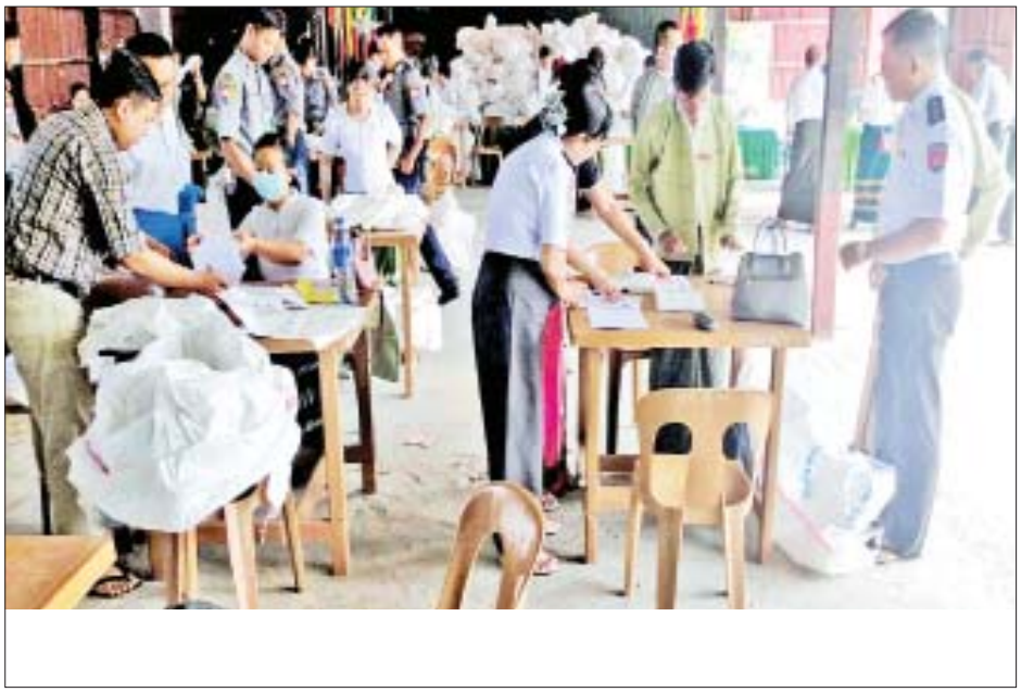
စစ်ကိုင်းတိုင်းဒေသကြီး ဆန္ဒမဲလက်မှတ် မြေပြင်စစ်ဆေးမှု မှတ်တမ်းဓာတ်ပုံများ။