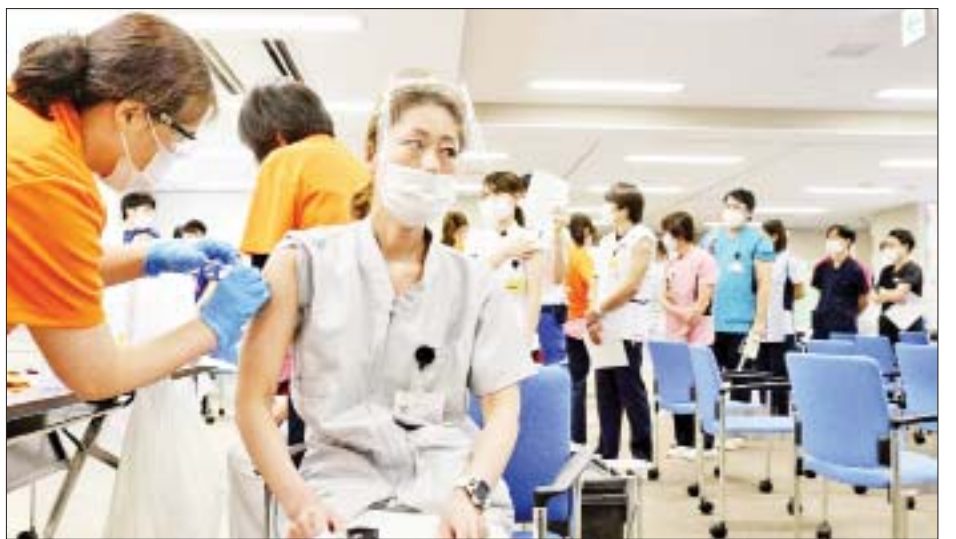
ကိုဇွန် ၇ ရက်မှစတင်ကာ ယာယီပိတ်ထားလျက်ရှိပြီး အထက်တန်းကျောင်းသားများ ခန့်အိမ်မှနေ၍ ဆက်လက်ပညာသင်ကြားနိုင်ရန်အတွက် အွန်လိုင်း သင်တန်းများကို ဖွင့်လှစ်ခွင့်ပြုထားကြောင်း သိရ သည်။ ကိုးကား-အင်န်အိတ်ချီအေ ဘာသာပြန်-အလင်းသစ်

ဂျပန်နိုင်ငံရှိ ခရိုင်အများစုတွင် ကိုဗစ်-၁၉ ရောဂါ ကူးစက်မှုလျော့ကျခြင်းရှိခဲ့သော်လည်း အိုကီနာဝါခရိုင်တွင် ကိုဗစ်-၁၉ ရောဂါကူးစက်မှု မြင့်တက်လျက်ရှိနေဆဲဖြစ်ကြောင်း သိရသည်။ ထို့ကြောင့် အိုကီနာဝါခရိုင်ရှိ စာသင်ကျောင်း အများစု