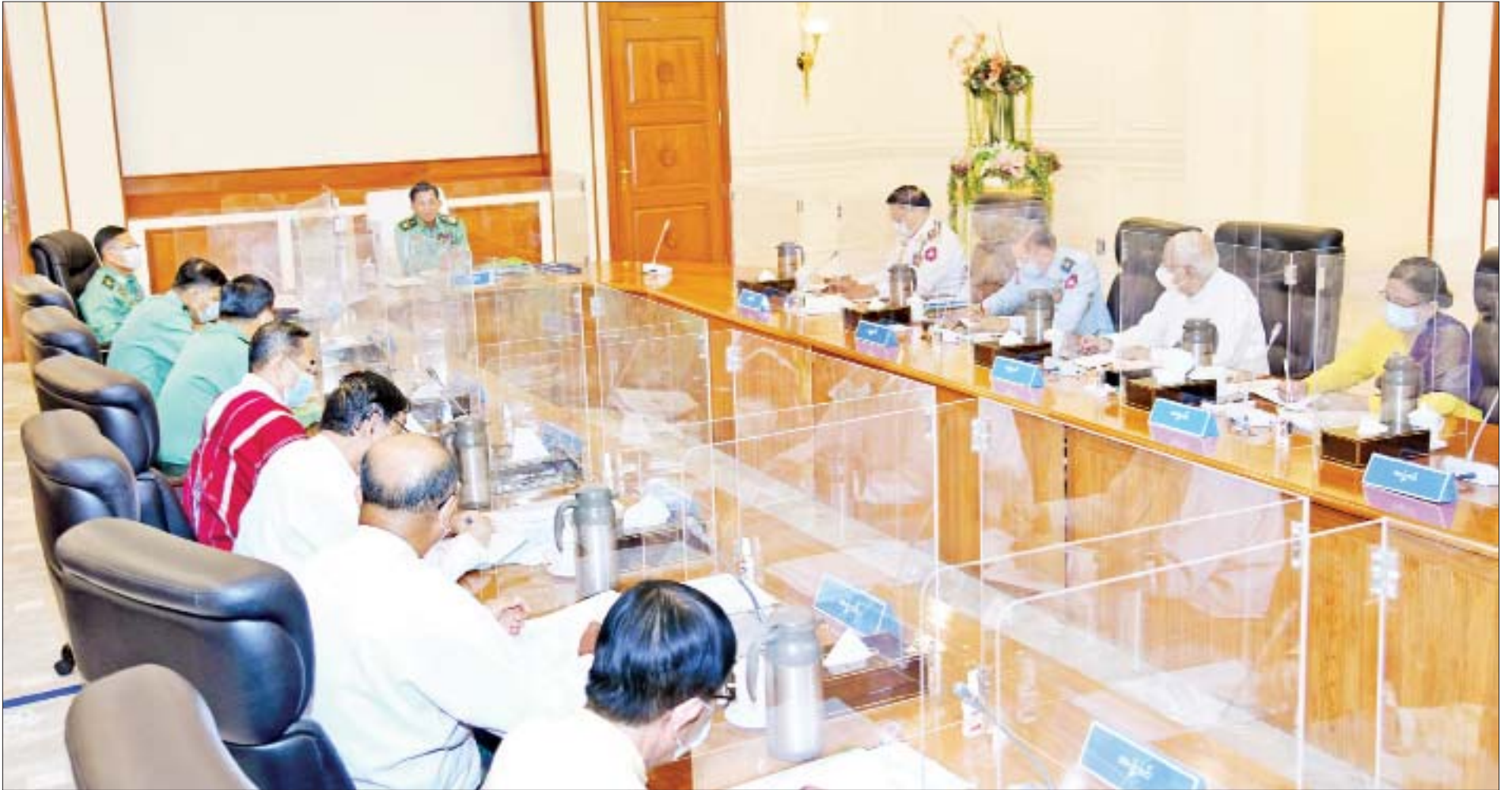
နိုင်ငံတော်စီမံအုပ်ချုပ်ရေးကောင်စီဥက္ကဋ္ဌ၊ တပ်မတော်ကာကွယ်ရေးဦးစီးချုပ် ဗိုလ်ချုပ်မှူးကြီး မင်းအောင်လှိုင် နိုင်ငံတော်စီမံအုပ်ချုပ်ရေးကောင်စီအစည်းအဝေး(၁၂/၂၀၂၁)တွင် အမှာစကားပြောကြားစဉ်။