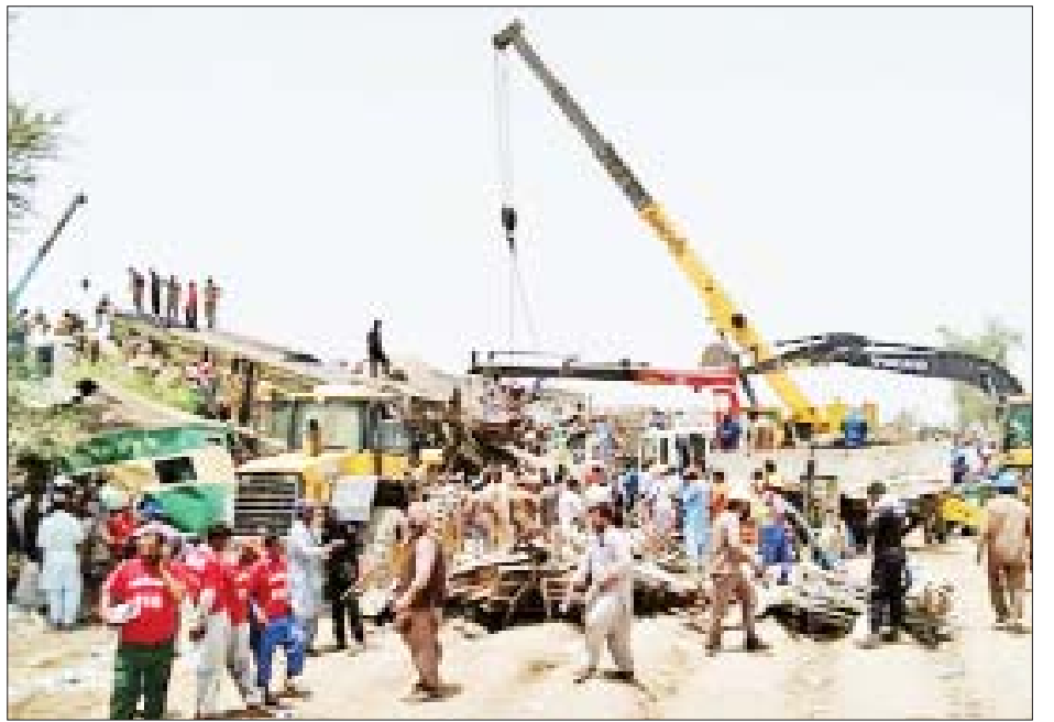
ပတ်သက်၍ ပြည့်ဝစုံလင်သော စုံစမ်းစစ်ဆေးမှုတစ်ခု ပြုလုပ်ရန်လည်း တာဝန်ရှိသူများအား ညွှန်ကြား ထားကြောင်း သိရသည်။ ကိုးကား - ဆင်ဟွာ ဘာသာပြန် - ဂျေတီ

ရထားပေါ်တွင် ခရီးသည် ၅၀၄ ဦး လိုက်ပါစီးနင်း ကြောင်း ပြောခွင့်ရပုဂ္ဂိုလ်က ထပ်မံပြောကြား သည်။ ကူညီကယ်ဆေးရေးအဖွဲ့မှ တာဝန်ရှိသူများ၏ ပြောဆိုချက်အရ ရထားတိုက်မှုဖြစ်ပွားခဲ့ပြီးနောက် ဒဏ်ရာရရှိသူ ၇၀ ကို ဆေးဝါးကုသမှုခံယူရန် ဆေးရုံ များသို့ ပို့ဆောင်ထားပြီး ကျန်ဒဏ်ရာ မပြင်းထန် သော ခရီးသည် ၃၀ ခန့်ကို ကနဦးဆေးဝါးကုသမှု ပေးခဲ့ကြောင်း သိရသည်။ တစ်ချိန်တည်းမှာပင် ပါကစ္စတန်ဝန်ကြီးချုပ် အင်မရန်ခန်က ကြောက်မက်ဖွယ်ရထားတိုက်မှုမှောက် မှုနှင့် ပတ်သက်၍ ထိတ်လန့်မိပါကြောင်း၊ ရထား ပို့ဆောင်ရေးဝန်ကြီးအား အခင်းဖြစ်ပွားသည့်နေရာ သို့သွားပြီး ဒဏ်ရာရရှိသူများကို ဆေးဘက်ဆိုင်ရာ အကူအညီများပေးရန်နှင့် ရထားတိုက်မှု၌ သေဆုံး သွားသည့်မိသားစုဝင်များအား အကူအညီပံ့ပိုးပေးရန် တောင်းဆိုထားကြောင်း စသည်ဖြင့် ၎င်း၏ တွစ်တာ စာမျက်နှာပေါ်တွင် ရေးသားဖော်ပြထားသည်။ ထို့အပြင် ဝန်ကြီးချုပ်သည် ရထားတိုက်မှုနှင့်