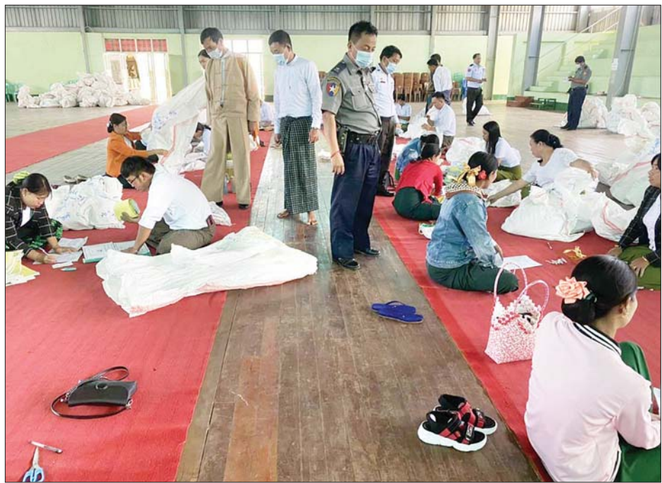
လဲချားမြို့နယ် ဆန္ဒမဲလက်မှတ် မြေပြင်စစ်ဆေးမှု မှတ်တမ်းဓာတ်ပုံ။