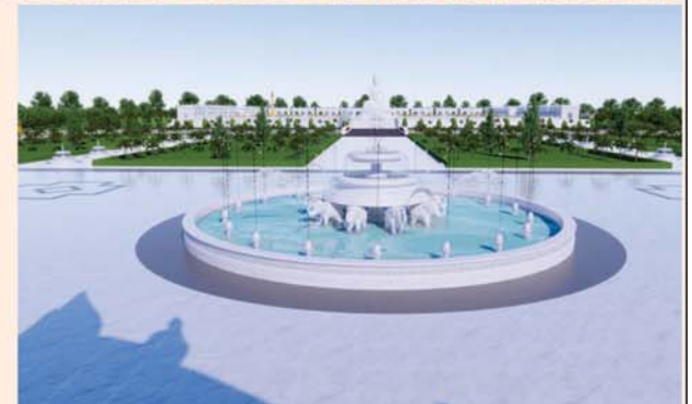
ရေပန်းအကြီး