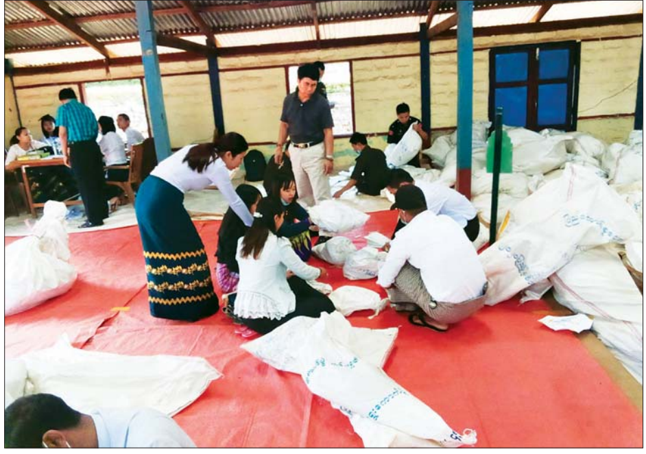
လားရှိုးမြို့နယ် ဆန္ဒမဲလက်မှတ် မြေပြင်စစ်ဆေးမှု မှတ်တမ်းဓာတ်ပုံ။