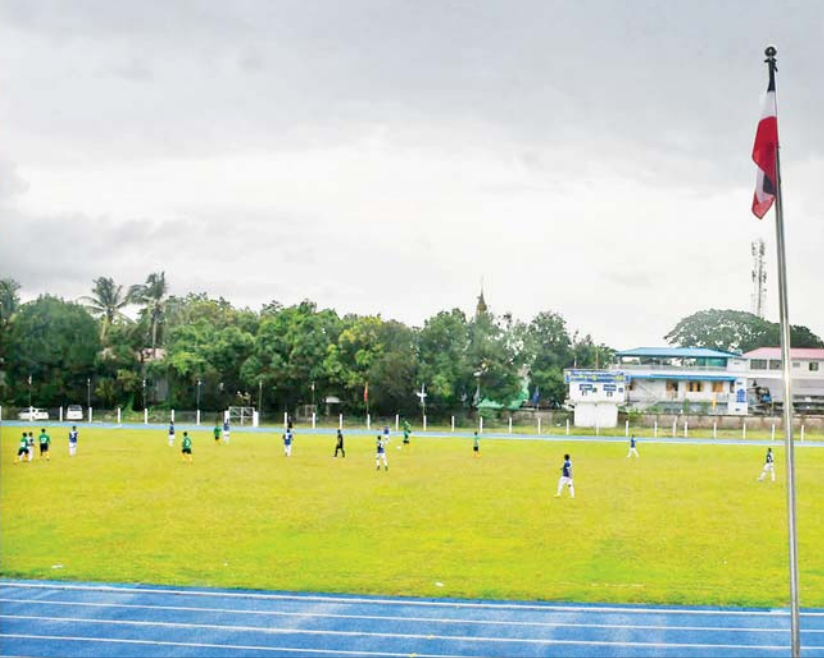
နိုင်ငံတော်စီမံအုပ်ချုပ်ရေးကောင်စီဥက္ကဋ္ဌ တပ်မတော်ကာကွယ်ရေးဦးစီးချုပ် ဗိုလ်ချုပ်မှူးကြီးမင်းအောင်လှိုင် အောင်သံလွင် ပြည်နယ်အားကစားကွင်း၌ ပြည်နယ်စီမံအုပ်ချုပ်ရေးကောင်စီဥက္ကဋ္ဌဖလား ဘောလုံးပွဲစဉ် ယှဉ်ပြိုင်နေမှုကို ကြည့်ရှုအားပေးစဉ်။

ဓာတ်အား အသုံးပြုဆောင်ရွက်ရသည့် စက်ရုံ အလုပ်ရုံများ ပိုမိုတိုးတက်လည်ပတ်ဆောင်ရွက်နိုင် မည့်အပြင် ဒေသခံပြည်သူများ၏ လူနေမှုအဆင့် အတန်းလည်း မြင့်မားလာမည်ဖြစ်ကြောင်း။