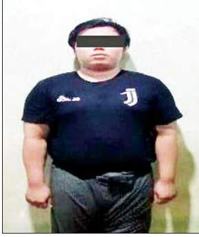
ကျော်သန့်စင်ဦး(ခ)ကျော်ကြီး