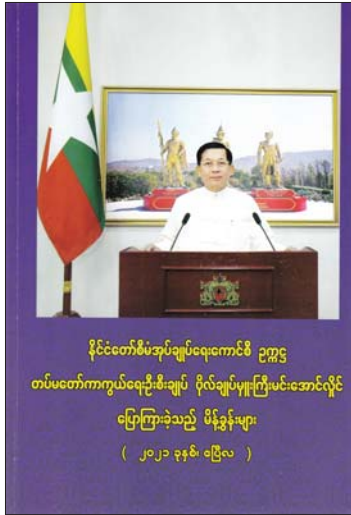
နိုင်ငံတော်စီမံအုပ်ချုပ်ရေးကောင်စီ ဥက္ကဋ္ဌ တပ်မတော်ကာကွယ်ရေးဦးစီးချုပ် ဗိုလ်ချုပ်မှူးကြီးမင်းအောင်လှိုင် ပြောကြားခဲ့သည့် မိန့်ခွန်းများ ( ၂၀၂၁ ခုနှစ်၊ ဧပြီလ )

များနှင့်ပတ်သက်၍ တွေ့ဆုံဆွေးနွေးပွဲ တွင် “ပညာသင်ကြားရေးနှင့် ပတ်သက် ပြီး မိမိတို့နိုင်ငံတွင် ၂၀၁၉ ခုနှစ်အတွင်း ကောက်ခံထားသည့် စာရင်းများအရ လုံးဝကျောင်းမနေဖူးသူ ၃ ဒသမ ၇ သန်း ရှိကြောင်း၊ အဆိုပါကျောင်းမနေဖူးသူများ သည် ပြည်နယ်များမှ အများဆုံးဖြစ် ကြောင်း၊ မိမိတို့တာဝန်ယူဆောင်ရွက်နေရ သည့် တိုင်းဒေသကြီးနှင့် ပြည်နယ်များ၊ ကိုယ်ပိုင်အုပ်ချုပ်ခွင့်ရဒေသများအတွင်း ရှိ ပြည်သူပြည်သားများ ပညာတတ်များ ဖြစ်အောင် ဆောင်ရွက်ပေးရန်လိုကြောင်း၊ ပညာသင်ကြားရေးသည် လူမှုရေးကိစ္စဖြစ် ပြီး ပြည်သူများ စာတတ်မြောက်ရေး အတွက် စာဖတ်ဝိုင်းများ ပြုလုပ်ပေးရန် လိုကြောင်း၊ စီးပွားရေးနှင့်ပတ်သက်၍ One Village One Product ဆိုသည့် အတိုင်း တိုင်းဒေသကြီးနှင့် ပြည်နယ် အလိုက် တန်ဖိုးမြင့်ထုတ်ကုန်ပစ္စည်းများ အား အရည်အသွေးမီစွာဖြင့် ထုတ်လုပ် စေလိုကြောင်း၊ ထိုသို့ထုတ်လုပ်နိုင်ပါက ခရီးသွားလုပ်ငန်းများနှင့်ပြည်ပပို့ကုန်များ တိုးတက်ကောင်းမွန်လာမည်ဖြစ်ကြောင်း၊ ဒေသအလိုက် စီးပွားရေးဖွံ့ဖြိုးရေးရန်နှင့်