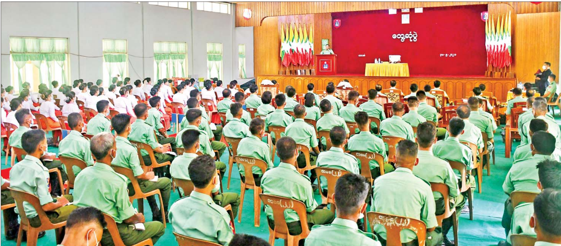
နိုင်ငံတော်စီမံအုပ်ချုပ်ရေးကောင်စီဥက္ကဋ္ဌ၊ တပ်မတော်ကာကွယ်ရေးဦးစီးချုပ် ဗိုလ်ချုပ်မှူးကြီးမင်းအောင်လှိုင် ဘားအံတပ်နယ်မှ အရာရှိ၊ စစ်သည်၊ မိသားစုများအား တွေ့ဆုံအမှာစကားပြောကြားစဉ်။

နေပြည်တော် မေ ၃၁ နိုင်ငံတော်ကာကွယ်ရေးတာဝန်ထမ်းဆောင်သည်ဟုဆိုရာတွင် နိုင်ငံတော်ကာကွယ်ရေးနှင့် တည်ငြိမ်အေးချမ်းရေးလုပ်ငန်းများသာမက နိုင်ငံတော်၏ နိုင်ငံရေးအရ တည်ငြိမ်အေးချမ်းရေးအတွက် ထိန်းသိမ်းဆောင်ရွက်ခြင်းသည်လည်း နိုင်ငံတော်ကာကွယ်ရေးတာဝန်ထမ်းဆောင်ခြင်းပင်ဖြစ်ကြောင်း၊ ထို့ပြင် သဘာဝဘေးအန္တရာယ် ဖြစ်ပေါ်လာမှုများကို ကာကွယ်ပေးခြင်း၊ ကူညီဆောင်ရွက်ပေးခြင်း၊ ကပ်ရောဂါ ကြိုတင်ကာကွယ်မှုများကို တတ်စွမ်းသရွေ့ ကူညီဆောင်ရွက်ပေးခြင်းနှင့် မိမိလုပ်ငန်းတာဝန်များကို ကောင်းမွန်ကျေပွန်စွာ သစ္စာရှိစွာ တာဝန်ထမ်းဆောင်နေခြင်းသည်လည်း နိုင်ငံတော်ကို ကာကွယ်နေခြင်းပင်ဖြစ်ကြောင်း နိုင်ငံတော်စီမံအုပ်ချုပ်ရေးကောင်စီဥက္ကဋ္ဌ၊ တပ်မတော်ကာကွယ်ရေးဦးစီးချုပ် ဗိုလ်ချုပ်မှူးကြီးမင်းအောင်လှိုင်က ယနေ့မွန်းလွဲပိုင်းတွင် ဘားအံတပ်နယ်မှ အရာရှိ၊ စစ်သည်၊ မိသားစုများအား တွေ့ဆုံအမှာစကားပြောကြားစဉ် ထည့်သွင်းပြောကြားသည်။ စာမျက်နှာ ၃ ကော်လံ ၁ သို့ ✪