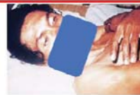
မျက်တွင်းချိုင့်ဝင်ခြင်း

ပြင်းထန်ဝမ်းပျက်ဝမ်းလျှောရောဂါ (ကာလဝမ်းရောဂါ)ဖြစ်ပွားသည်ဟု သံသယရှိလျှင် အချိန်မီကုသမှုမခံယူပါက လျင်မြန်စွာအသက်ဆုံးရှုံးနိုင်သောကြောင့် နီးစပ်ရာကျန်းမာရေး ဌာနများသို့ သတင်းပေးပို့ပြီး ထိရောက်သောကုသမှုခံယူရမည်ဖြစ်ပါသည်။