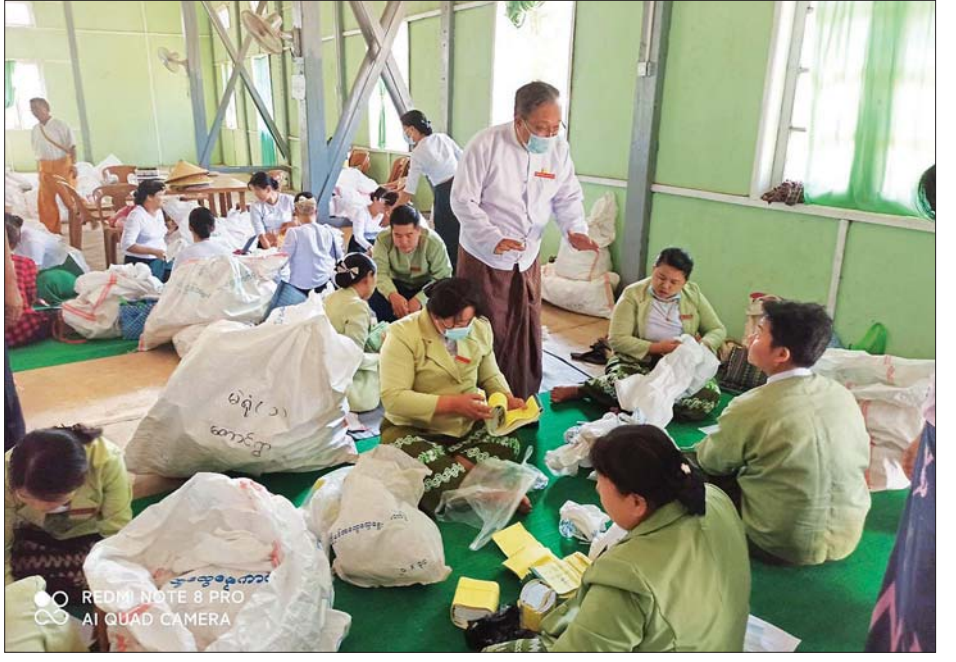
လင်းခေးမြို့နယ် ဆန္ဒမဲလက်မှတ် မြေပြင်စစ်ဆေးမှု မှတ်တမ်းဓာတ်ပုံ။