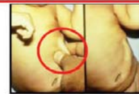
အရေပြား၏ ကြုံနိုင်ဆန့်နိုင်အား လျော့နည်းလာခြင်း

ကိုဗစ်-၁၉ ရောဂါ ကာကွယ်ဖို့ မိမိကစ၍ စည်းကမ်းများကို လိုက်နာဖို့