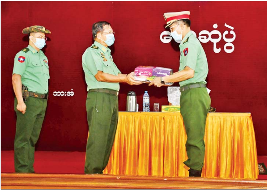
နိုင်ငံတော်စီမံအုပ်ချုပ်ရေးကောင်စီဥက္ကဋ္ဌ၊ တပ်မတော်ကာကွယ်ရေးဦးစီးချုပ် ဗိုလ်ချုပ်မှူးကြီး မင်းအောင်လှိုင်က စားသောက်ဖွယ်ရာပစ္စည်းများ ပေးအပ်ရာ တာဝန်ရှိသူတစ်ဦးက လက်ခံရယူစဉ်။