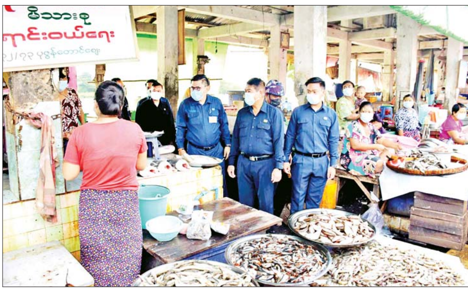
ရောင်းဝယ်ဖောက်ကားနေမှုများကို လိုက်လံကြည့်ရှု စစ်ဆေးပြီး မြို့တော်ဝန်က ဈေးအဝင်အထွက်လမ်းများ ပြန်လည်ပြုပြင်ရေး၊ သား၊ ငါးတန်းနှင့် ကုန်စိမ်း တန်းများ စနစ်တကျရောင်းဝယ်စေရေးနှင့် အမိုးအကာများ ပြန်လည်ပြုပြင်ရေး၊ ဈေးရုံများကြံ့ခိုင်ရေး၊ ဈေးအတွင်း၊ အပြင် သန့်ရှင်းရေးကောင်းမွန်

ရန်ကုန် မေ ၃၁ ရန်ကုန်မြို့တော် စည်ပင်သာယာရေးကော်မတီ ဥက္ကဋ္ဌ (မြို့တော်ဝန်) ဦးဗိုလ်ဌေးသည် ယနေ့နံနက် ပိုင်းတွင် ပုဇွန်တောင်ဈေးအနီး အေးတံတား မြစ်ထွက်ပေါက်တွင် ရေစီးရေလာစီမံခန့်ခွဲမှုဌာနက ရေစီးရေလာကောင်းမွန်စေရန် ဆောင်ရွက်နေသည့် လုပ်ငန်းခွင်ကို ကြည့်ရှုစစ်ဆေးပြီး လိုအပ်သည်များ မှာကြားသည်။