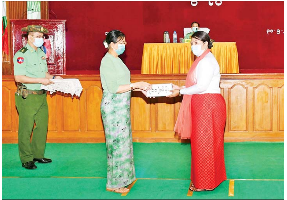
နိုင်ငံတော်စီမံအုပ်ချုပ်ရေးကောင်စီဥက္ကဋ္ဌ၊ တပ်မတော်ကာကွယ်ရေးဦးစီးချုပ် ဗိုလ်ချုပ်မှူးကြီး မင်းအောင်လှိုင်၏ဇနီး ဒေါ်ကြူကြူလှက တပ်နယ်မိခင်နှင့် ကလေးထောက်ပံ့ငွေများ ပေးအပ်ရာ တပ်နယ်မှူး၏ ဇနီးက လက်ခံရယူစဉ်။

★ ရှေးဦးမှ အဆိုပါတွေ့ဆုံပွဲသို့ နိုင်ငံတော်စီမံအုပ်ချုပ်ရေးကောင်စီဥက္ကဋ္ဌ တပ်မတော်ကာကွယ်ရေးဦးစီးချုပ်နှင့်အတူ ဇနီး ဒေါ်ကြူကြူလှ၊ နိုင်ငံတော်စီမံအုပ်ချုပ်ရေးကောင်စီဝင် ဗိုလ်ချုပ်ကြီးတင်အောင်စန်း၊ ဗိုလ်ချုပ်ကြီးမောင်မောင်ကျော်နှင့် ဇနီး၊ ဒုတိယဗိုလ်ချုပ်ကြီးမိုးမြင့်ထွန်း၊ ကာကွယ်ရေးဦးစီးချုပ်(ရေ) ဗိုလ်ချုပ်ကြီးမိုးအောင်နှင့်ဇနီး၊ ကာကွယ်ရေးဦးစီးချုပ်ရုံးမှ တပ်မတော်အရာရှိကြီးများ၊ အရှေ့တောင်တိုင်းစစ်ဌာနချုပ် တိုင်းမှူး ဗိုလ်ချုပ်ကိုကိုမောင်နှင့် ဘားအံတပ်နယ်မှ အရာရှိ၊ စစ်သည်၊ မိသားစုများ တက်ရောက်ကြသည်။ ၄ လတာကာလသို့ ရောက်ရှိခဲ့ပြီ နိုင်ငံတော်စီမံအုပ်ချုပ်ရေးကောင်စီ ဥက္ကဋ္ဌ တပ်မတော်ကာကွယ်ရေးဦးစီးချုပ်က အမှာစကားပြောကြားရာတွင် တပ်မတော်အနေဖြင့် နိုင်ငံတွင်ဖြစ်ပေါ်ခဲ့သည့် အခြေအနေများအရ စစ်မှန်ပြီး စည်းကမ်းပြည့်ဝသည့် ဒီမိုကရေစီဖြစ်စေရေး၊ ခိုင်မာသည့် ဒီမိုကရေစီစနစ်ဖြစ်စေရေးအတွက် နိုင်ငံတော်၏တာဝန်ကို ခေတ္တတာဝန်ယူထိန်းသိမ်း ဆောင်ရွက်ခဲ့သည်မှာ ၄ လတာကာလသို့ ရောက်ရှိခဲ့ပြီဖြစ်ကြောင်း၊ ယာယီသမ္မတက နိုင်ငံတော်၏ ဥပဒေပြုရေး၊ အုပ်ချုပ်ရေးနှင့် တရားစီရင်ရေးအာဏာတို့ကို လွှဲအပ်