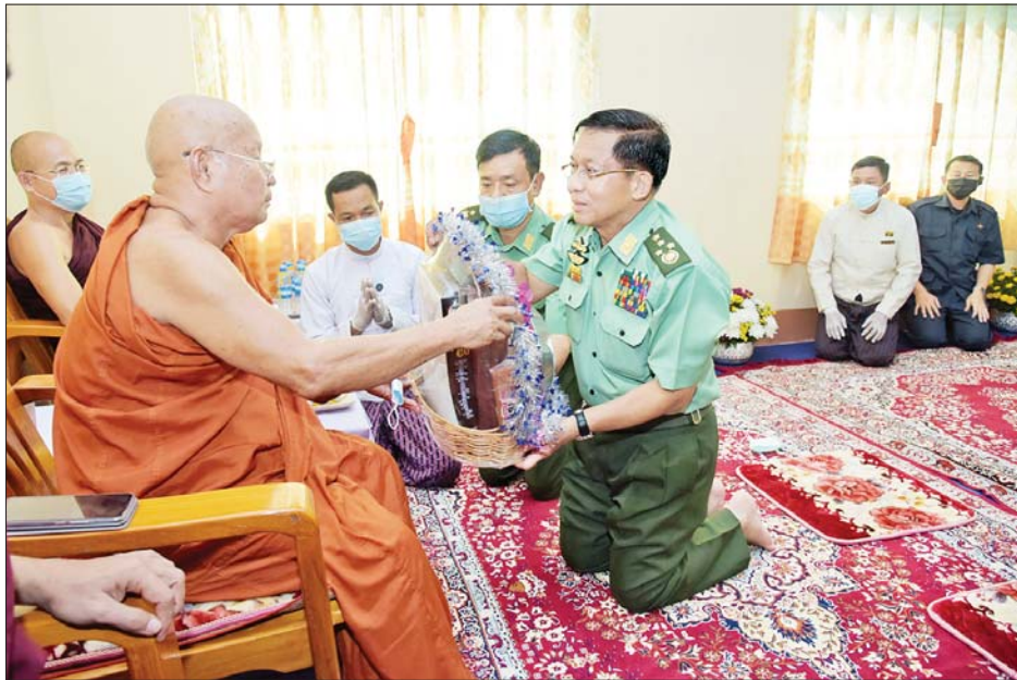
နိုင်ငံတော်စီမံအုပ်ချုပ်ရေးကောင်စီဥက္ကဋ္ဌ တပ်မတော်ကာကွယ်ရေးဦးစီးချုပ် ဗိုလ်ချုပ်မှူးကြီး မင်းအောင်လှိုင် ဇွဲကပင်ကျောင်းဆရာတော် ဘဒ္ဒန္တကဝိဓအေး လှူဖွယ်ပစ္စည်းများ ဆက်ကပ်လှူဒါန်း စဉ်။

နိုင်ငံတစ်ခု ဖွံ့ဖြိုးတိုးတက်ရေးအတွက် လျှပ်စစ် ဓာတ်အားရရှိမှု၊ ပို့ဆောင်ရေးစနစ်ကောင်းမွန်မှု၊ ဆက်သွယ်ရေးစနစ်ကောင်းမွန်မှုနှင့် လူသားအရင်း အမြစ်ပေါကြွယ်ဝမှုများသည် အဓိကအရေးကြီး ကြောင်း၊ လျှပ်စစ်ဓာတ်အားထုတ်လုပ်ရေးနှင့် ပတ်သက်၍ ပြည်နယ်၏ လျှပ်စစ်ဓာတ်အား လိုအပ် ချက်ကို ဖြည့်ဆည်းပေးနိုင်မည့် ပြည်မြို့မြစ်စွမ်းအင် ဖြစ်သည့် ရေအရင်းမြစ်များရှိပြီးဖြစ်ကြောင်း၊ သံလွင် မြစ်ပေါ်တွင် တည်ဆောက်မည့် ဟတ်ကြီးရေအား လျှပ်စစ်စက်ရုံများသည် ကရင်ပြည်နယ်ကို အထောက် အကူပြုမည်ဖြစ်သဖြင့် ဆောင်ရွက်သင့်ကြောင်း၊ အကြောင်းအမျိုးမျိုးပြု၍ ကန့်ကွက်နေသူများကို နားလည်စေလိုကြောင်း၊ အဆိုပါရေအရင်းအမြစ်များ ကို အသုံးချ၍ ပြည်နယ်အတွင်း လျှပ်စစ်ဓာတ်အား ဖူလုံစွာရရှိအောင် ဆောင်ရွက်နိုင်ခြင်းဖြင့် လျှပ်စစ်