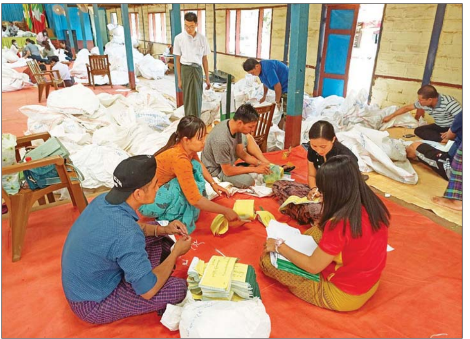
လောက်ကိုင်မြို့နယ် ဆန္ဒမဲလက်မှတ် မြေပြင်စစ်ဆေးမှု မှတ်တမ်းဓာတ်ပုံ။