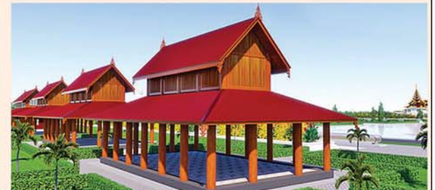
သုဓမ္မာရေရပ်(၅၄x၃၀)ပေ ၆ လုံး ၁ လုံးလျှင်-၅၅၇ သိန်း

၁။ နိုင်ငံတော်စီမံအုပ်ချုပ်ရေးကောင်စီဥက္ကဋ္ဌ၊ တပ်မတော်ကာကွယ်ရေးဦးစီးချုပ် ဗိုလ်ချုပ်မှူးကြီးမင်းအောင်လှိုင် ဦးဆောင်သည့် (၇)ရက်သား၊ သမီး၊ ဘုရားဒါယကာ၊ ဒါယိကာမတို့က မာရဝိဇယပုဒ္ဓရုပ်ပွားတော်မြတ်ကြီးအား မြန်မာနိုင်ငံတွင် ထေရဝါဒ ဗုဒ္ဓသာသနာတော်ထွန်းလင်းတောက်ပလျက်ရှိသည်ကို ကမ္ဘာကိုပြသရန်၊ တိုင်းပြည်အေးချမ်းသာယာမှုရှိစေရန်၊ ရုပ်ပွားတော်မြတ်ကြီးအား ပြည်တွင်း၊ ပြည်ပဘုရားဖူးများလာရောက်ခြင်းဖြင့် ဒေသတိုးတက်စည်ကားမှုကို အထောက်အကူဖြစ်စေရန်၊ နိုင်ငံတော် ဖွံ့ဖြိုးတိုးတက်မှု အထောက်အကူဖြစ်စေရန်ရည်သန်လျက် ပြည်ထောင်စုနယ်မြေ နေပြည်တော်၊ ဒက္ခိဏသီရိမြို့နယ်အတွင်း၌ သာသနာတော်ထုံး၊ ရုပ်ပွားဆင်းတုတော်ထုံး၊ မြန်မာရိုးရာတည်ထုံးများနှင့်အညီ တည်ဆောက်ပူဇော်လျက်ရှိပါသည်။