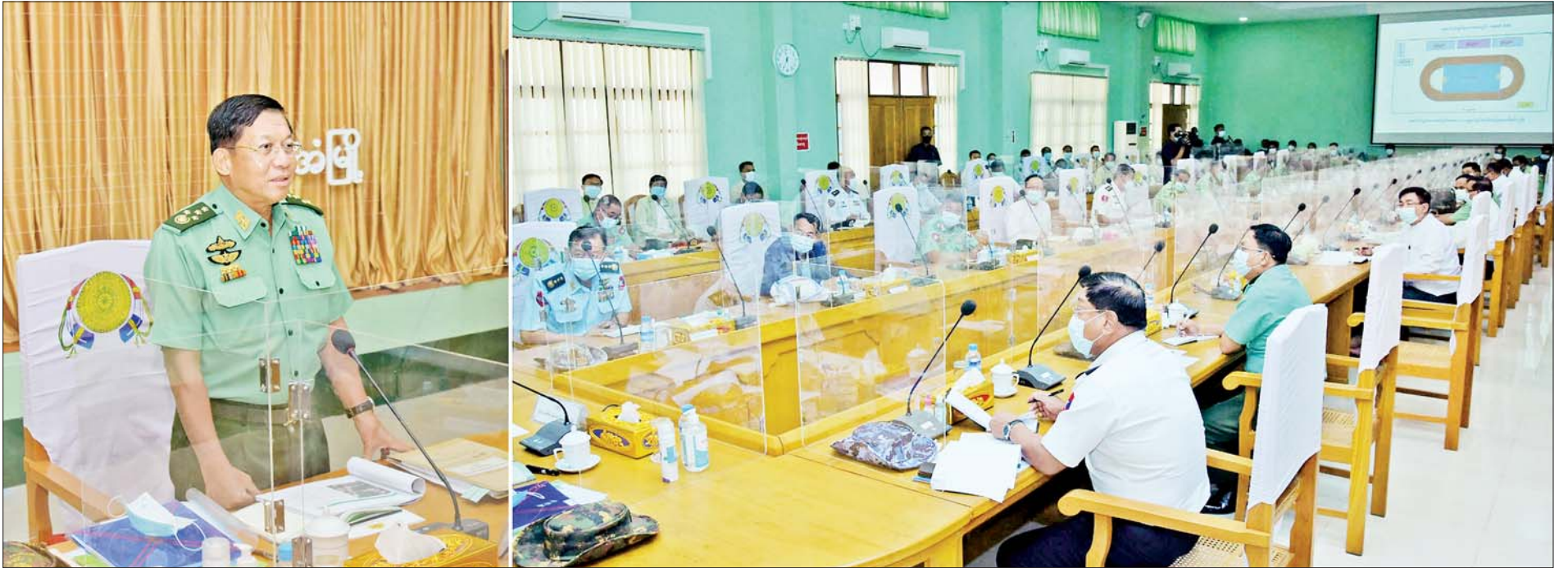
နိုင်ငံတော်စီမံအုပ်ချုပ်ရေးကောင်စီဥက္ကဋ္ဌ၊ တပ်မတော်ကာကွယ်ရေးဦးစီးချုပ် ဗိုလ်ချုပ်မှူးကြီးမင်းအောင်လှိုင် ကရင်ပြည်နယ်စီမံအုပ်ချုပ်ရေးကောင်စီအဖွဲ့ဝင်များနှင့် ဌာနဆိုင်ရာဝန်ထမ်းများအား တွေ့ဆုံအမှာစကား ပြောကြားစဉ်။

နေပြည်တော် မေ ၃၁ နိုင်ငံတော်စီမံအုပ်ချုပ်ရေးကောင်စီဥက္ကဋ္ဌ၊ တပ်မတော်ကာကွယ်ရေးဦးစီးချုပ် ဗိုလ်ချုပ်မှူးကြီးမင်းအောင်လှိုင်သည် ယနေ့နံနက်ပိုင်းတွင် ကရင်ပြည်နယ်စီမံအုပ်ချုပ်ရေးကောင်စီအဖွဲ့ဝင်များနှင့် ဌာနဆိုင်ရာဝန်ထမ်းများအား ဘားအံမြို့ရှိ ပြည်နယ်စီမံအုပ်ချုပ်ရေးကောင်စီရုံး၌ သွားရောက်တွေ့ဆုံ အမှာစကားပြောကြားသည်။