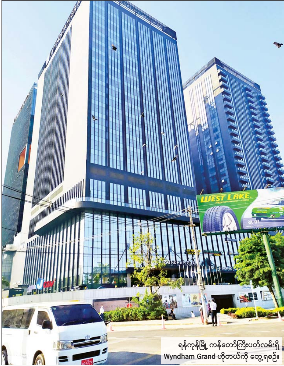
ရန်ကုန်မြို့ ကန်တော်ကြီးပတ်လမ်းရှိ Wyndham Grand ဟိုတယ်ကို တွေ့ရစဉ်။