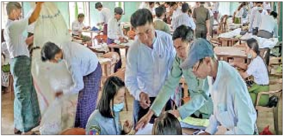
ဟုမ္မလင်းမြို့နယ် ဆန္ဒမဲလက်မှတ် မြေပြင်စစ်ဆေးမှု မှတ်တမ်းဓာတ်ပုံ။