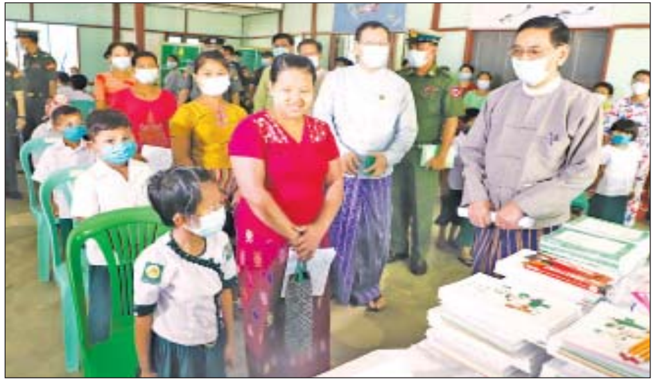
သစ်ပင်စိုက်ပျိုးပွဲနှင့် ကျောင်းအပ်နှံရေးနေ့ အခမ်းအနားကျင်းပ