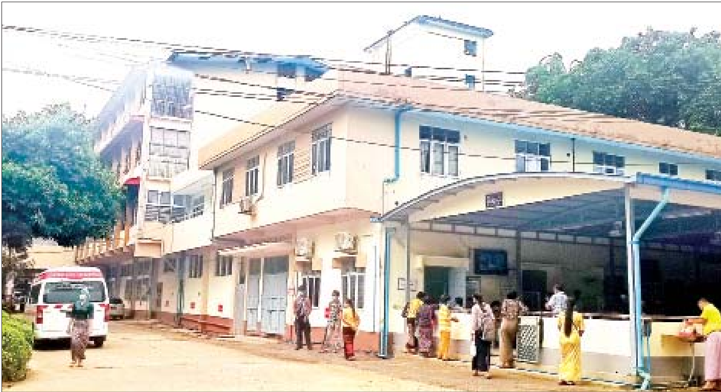
အလုပ်သမားဆေးရုံကြီး(ရန်ကုန်)ကို တွေ့ရစဉ်။