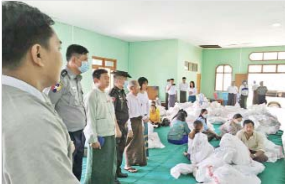
မော်လိုက်မြို့နယ် ဆန္ဒမဲလက်မှတ် မြေပြင်စစ်ဆေးမှု မှတ်တမ်းဓာတ်ပုံ။