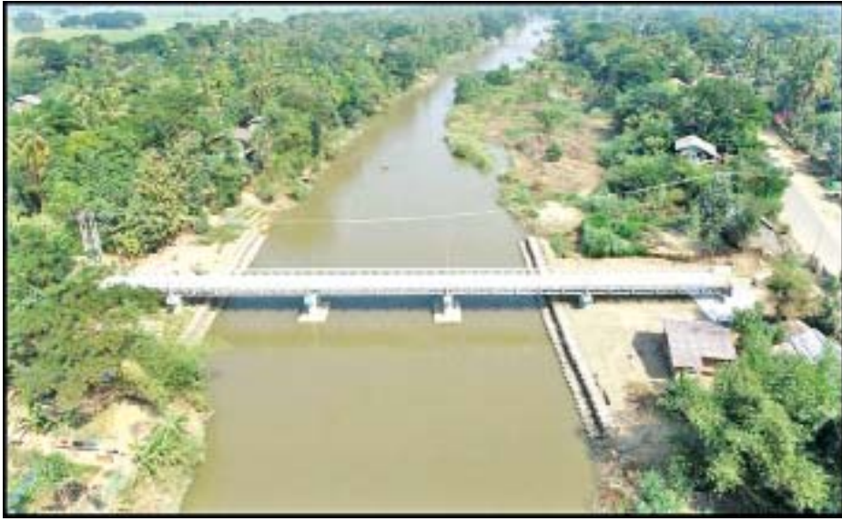
တောင်ငူခရိုင် မြို့မြို့နယ် ကျေးလက်လမ်းဖွံ့ဖြိုးရေးဦးစီးဌာနကဆောင်ရွက်သည့် ဝဲကြီးကြီးတံတား (ဘေလီတံတား)ကို တွေ့ရစဉ်။

ပဲခူးတိုင်းဒေသကြီး ကျေးလက်လမ်းဖွံ့ဖြိုးရေး ဦးစီးဌာနသည် ဌာနစတင်ဖွဲ့စည်းခဲ့သည့် ၂၀၁၇-၂၀၁၈ ဘဏ္ဍာနှစ်မှ ၂၀၁၉-၂၀၂၀ ဘဏ္ဍာနှစ် အထိ ကွန်ကရစ်လမ်း ၁၄၆/၃ ဒသမ ၃ မိုင်၊