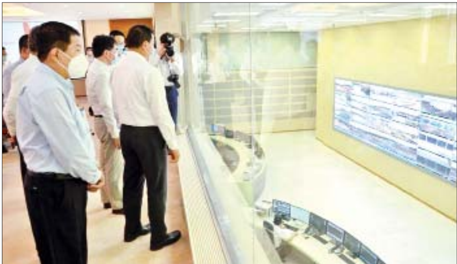
ရန်ကုန် သတိပေးချက်များ ထင်သာမြင်သာရှိသော နေရာများတွင် ချိတ်ဆွဲပြသထားရန် လိုအပ်ကြောင်း၊ ပိုက်လိုင်းတစ်လျှောက်ရှိ လုံခြုံရေးဝန်ထမ်းများနှင့် ပူးပေါင်း၍ လုံခြုံရေးသတိ၊ လုံခြုံရေးအသိရှိရန်နှင့် မီးဘေးအန္တရာယ်ကင်းဝေးစေရေး အထူးဂရုပြု ဆောင်ရွက်သွားကြရန် မှာကြားပြီး ရေနံနှင့်သဘာဝ ဓာတ်ငွေ့ထိန်းချုပ်လွှတ်နေသော Control Centre အတွင်း လုပ်ငန်းဆောင်ရွက်နေမှုကို ကြည့်ရှုစစ်ဆေး ခဲ့ကြောင်း သိရသည်။

ပြည်သူများအတွက် အကျိုးပြုသောစီမံကိန်းတစ်ခု ဖြစ်ကြောင်း၊ ရေနံစီမံကိန်းမှ ရေနံစီမံကိန်း တရုတ်နိုင်ငံသို့ သယ်ယူပို့ဆောင်ပေးနေသကဲ့သို့ သဘာဝ ဓာတ်ငွေ့ပိုက်လိုင်းမှ တရုတ်နိုင်ငံနှင့် ပြည်တွင်းသုံး အတွက် သဘာဝဓာတ်ငွေ့ဖြန့်ဖြူးပေးလျက်ရှိ ကြောင်း၊ ပြည်တွင်းအသုံးပြုရာတွင် လျှပ်စစ် ဓာတ်အားထုတ်လုပ်မှုနှင့် စက်မှုလုပ်ငန်းအတွက် ပံ့ပိုးပေးနေကြောင်း၊ ရေနံနှင့်သဘာဝဓာတ်ငွေ့များ ပုံမှန်ဖြန့်ဖြူးပေးနိုင်ရန်အတွက် ပိုက်လိုင်းများ ကြံ့ခိုင်ကောင်းမွန်စေရေး သတ်မှတ် Standard Operation Procedure (SOP)နှင့်အညီ စဉ်ဆက် မပြတ်စစ်ဆေးဆောင်ရွက်သွားရန် လိုအပ်ကြောင်း၊ ပိုက်လိုင်းတစ်လျှောက်ပြည်သူများ၏ လူမှုစီးပွားဘဝ ဖွံ့ဖြိုးတိုးတက်ရေးနှင့် ယဉ်ကျေးမှုလေ့စရိုက်များ ကို လေးစားလိုက်နာရန်လိုအပ်ကြောင်း၊ ထို့အပြင် လုပ်ငန်းခွင်၌ မြန်မာဝန်ထမ်းများ ပိုမိုခန့်ထားရေး အလေးထား ဆောင်ရွက်ပေးစေလိုကြောင်း၊ ပိုက်လိုင်းပတ်ဝန်းကျင်နေ ဒေသပြည်သူလူထုကို ပိုက်လိုင်းနှင့်ပတ်သက်သည့် ဆောင်ရန်၊ ရှောင်ရန် များအား ကျယ်ကျယ်ပြန့်ပြန့် ပညာပေးဟောပြော