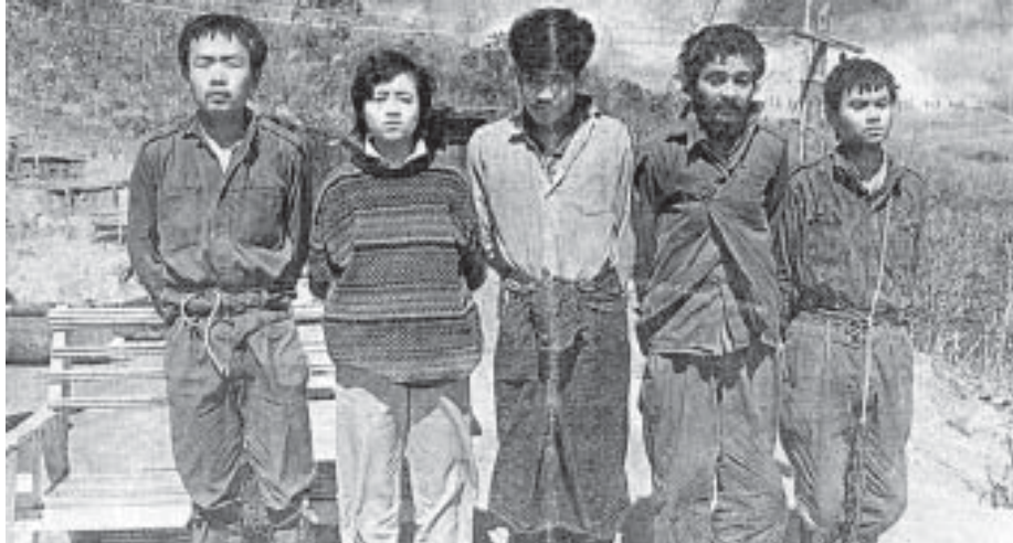
ယုံကြည်ချက်အတွက်တောခိုရင်း ပါဂျောင်စခန်းသို့ ရောက်ရှိသွားသည့် ညီညီအပါအဝင် ကျောင်းသားလူငယ်များကို တွေ့ရစဉ်။

အချို့သော ပုဂ္ဂိုလ်အတော်များများဟာ သူတို့မနှစ်သက်တဲ့လူက ကောင်းတာလုပ်လည်း ကောင်းပါတယ်လို့ ပြောတာမကြိုက်ကြဘူး။ သူတို့ ဘက်တော်သား၊ သူတို့နှစ်သက်တဲ့လူက ဘာလုပ်လုပ် ဘယ်သူကမှ အပြစ်တင်တာ မကြိုက်ကြတတ်ပါဘူး။ သူတို့လည်း ဘာမှမပြောကြပါဘူး။ နောက်ဆုံး သူတို့ဘက်တော်သားတွေ လူတွေသတ်နေရင်တောင် မသိချင်ယောင်ဆောင်နေကြတယ်ဆိုတာ ပါဂျောင်ငရဲခန်းက မျက်ဝါးထင်ထင်ပဲ မဟုတ်ပါလား။ ဒါမျိုးတွေကို လက်ရှိဖြစ်သန်းနေကြတဲ့ လူငယ်တွေ သတိချပ်သင့်ပါတယ်။