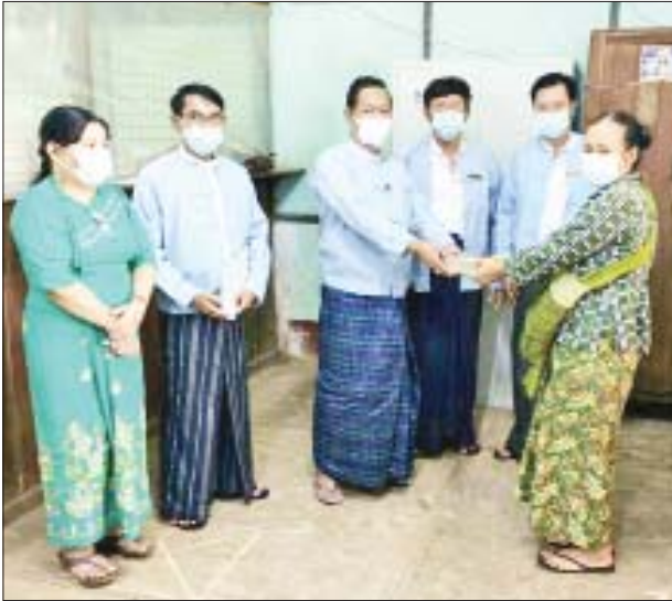
လယ်ယာဖွံ့ဖြိုးရေးဘဏ်သို့ ဆက်သွယ်ဆောင်ရွက်ကြရန် မြန်မာ့ လယ်ယာဖွံ့ဖြိုးရေးဘဏ်မှ သိရသည်။

ယခုနှစ် မိုးရာသီစိုက်ပျိုးစရိတ် ချေးငွေများကို ယခင်နှစ် မိုးရာသီ စိုက်ပျိုးစရိတ်ချေးငွေ ပြေကျေစွာပေးဆပ်ပြီးသူ တောင်သူ ဦးကြီးများအား ထုတ်ချေးပေးလျက်ရှိပြီး ချေးငွေများ ထုတ်ချေးပေးနေ စဉ် လာရောက်ပေးဆပ်သူ တောင်သူဦးကြီးများကိုလည်း ချေးငွေ ပေးဆပ်မှုလက်ခံ၍ စက်တင်ဘာလအထိ ဆက်လက်ထုတ်ချေးပေးသွား မည်ဖြစ်ပြီး ချေးငွေရယူလိုသော တောင်သူဦးကြီးများအနေဖြင့် မြန်မာ့