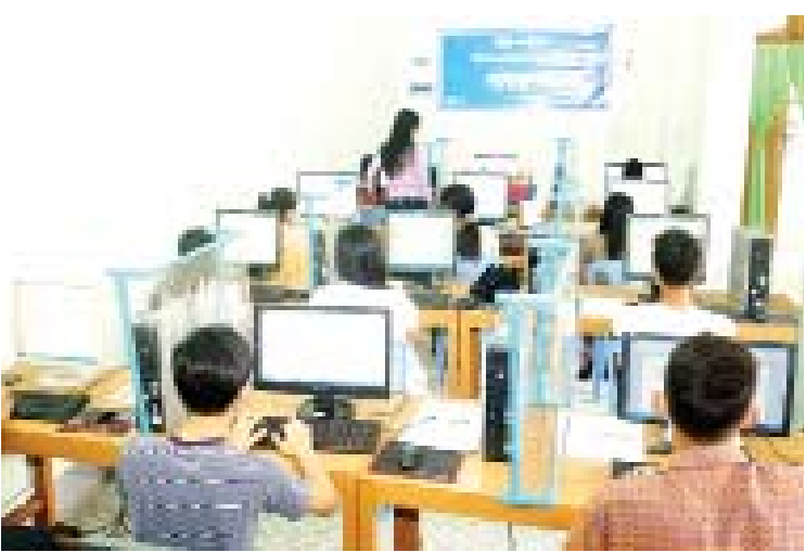
သတင်းစဉ်

က အခုလို အခြေခံကွန်ပျူတာပညာကို သင်ကြားပေးတဲ့အပေါ် ကျေးဇူးတင်ပါတယ်။ ကျွန်တော်တို့အနေနဲ့လည်း အခြေခံကနေတစ်ဆင့် ကွန်ပျူတာပညာကို ဆက်လက်လေ့လာသွားမှာပါ။ ဌာနအတွက် ပြန်လည်အသုံးပြုသွားမှာပါ။ သင်တန်းကိုလည်း ကိုဗစ်-၁၉ ရောဂါ ကာကွယ်ရေးဆိုင်ရာ လမ်းညွှန်ချက်များနဲ့အညီ စီစဉ်ဆောင်ရွက်ပေးထားလို့ စိတ်ချမ်းမြေ့စွာ သင်ယူနိုင်တဲ့အတွက် လည်း ကျေးဇူးတင်ပါတယ်” ဟု သင်တန်းသားတစ်ဦးက ပြောသည်။ အဆိုပါ အခြေခံကွန်ပျူတာသင်တန်း သို့ပြန်ကြားရေးနှင့် ပြည်သူ့ဆက်ဆံရေး ဦးစီးဌာနမှ ယာယီနေ့စားဝန်ထမ်း ၁၄ ဦး တက်ရောက်သည်။ အခြေခံကွန်ပျူတာ သင်တန်းတွင် ကိုဗစ်-၁၉ ရောဂါ ကာကွယ်ရေး လမ်းညွှန်ချက်များနှင့်အညီ သင်တန်းသားများအား ကိုယ်အူချိန် တိုင်းတာပေးခြင်း၊ လက်သန့်ဆေးရည် ဖြင့် လက်သန့်စင်ခြင်း၊ နှာခေါင်းစည်းများ အခမဲ့ဖြန့်ဝေခြင်းတို့ကို ဆောင်ရွက်ပေးကြောင်း သိရသည်။