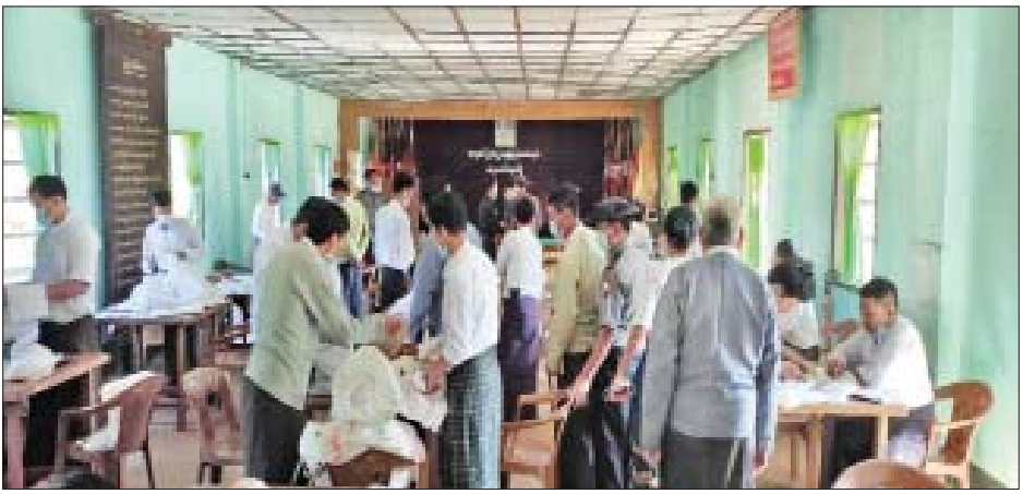
လေရီးမြို့နယ် ဆန္ဒမဲလက်မှတ် မြေပြင်စစ်ဆေးမှု မှတ်တမ်းဓာတ်ပုံ။