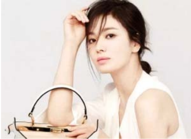
ဆောင်းဟေကိုဟာ အင်စတာဂရမ်ဖော်လိုဝါ ၁၁ ဒသမ ၄ သန်းရှိတဲ့ ပေါ်မှာလည်း ကျော်ကြားသူတစ်ဦးဖြစ်ပြီး အနုပညာရှင် တစ်ဦးဖြစ်ပါတယ်။

တောင်ကိုရီးယားရဲ့ ထိပ်တန်းမင်းသမီး တစ်ဦးဖြစ်သူ ဆောင်းဟေကိုအနေနဲ့ လူမှုကွန်ရက်မီဒီယာပေါ်မှာ ပစ္စည်းကြော်ငြာကနေ ရရှိခဲ့တဲ့ဝင်ငွေကို ဒေသတွင်းမီဒီယာတစ်ခုက ထုတ်ဖော်ခဲ့ကြောင်း အော့ကပေါ့ဒေါ့ကွန်းရဲ့ ရေးသားဖော်ပြချက်တွေအရ သိရပါတယ်။