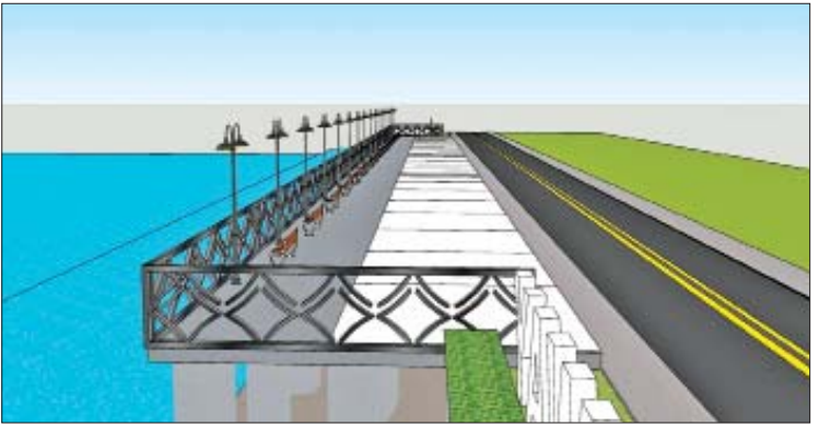
ညဈေးတည်ဆောက်မည့် ပုံစံကို တွေ့ရစဉ်။

ကျောက်သားဥယျာဉ်ဘေး မြေကွက်လပ် မှာလည်း ယာဉ်ရပ်နားဖို့ နေရာတစ်ခုနဲ့ သန့်စင်ခန်းတစ်ခုကို တည်ဆောက်သွား မှာ ဖြစ်ပါတယ်။ ကျွန်တော်တို့အနေနဲ့ ဒီလုပ်ငန်းအားလုံးကို လက်ရှိဘဏ္ဍာနှစ်