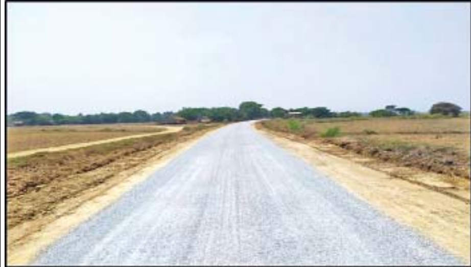
တောင်ငူခရိုင် မြို့မြို့နယ် ကျေးလက်လမ်းဖွံ့ဖြိုးရေးဦးစီးဌာနက ဆောင်ရွက်သည့် ကညွတ်ကွင်း-မိဿလင်ကိုဆက်သွယ်ထားသည့် ကတ္တရာလမ်းကို တွေ့ရစဉ်။

ထိုရည်မှန်းချက်များကို ပါဝင်အကောင် အထည်ဖော်ဆောင်ရွက်ပေးမည့် ကျေးလက်လမ်း ဖွံ့ဖြိုးရေးဦးစီးဌာနကို ၂၀၁၇ ခုနှစ် ဇူလိုင်လ ၂၁ ရက်နေ့တွင် ဆောက်လုပ်ရေးဝန်ကြီးဌာန လက်အောက်တွင် စတင်ဖွဲ့စည်းခဲ့ခြင်း ဖြစ်သည်။ စာမျက်နှာ ၁၉ သို့